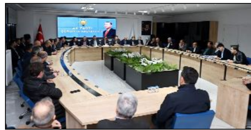
AK Parti Seçim Koordinasyon Merkezi'nde istişare toplantısı düzenlendi.

kan Yardımcılarımız, İl Kadın ve İl Gençlik Kolları Başkanlarımız, Merkez İlçe Başkanımız, İl Belediye Başkanımız, İl Genel Meclis Başkanımız, İlçe Başkanlarımız, İlçe, Belde Belediye Başkanlarımız, İl, İlçe SKM Başkanlarımız ve 28.Dönem Milletvekili Adaylarımızın katılımlarıyla İl Başkanlığımızda seçime yönelik istişare ve değerlendirme toplantımızı gerçekleştirdik. Toplantımızın hayırlara vesile olmasını diliyorum. Türkiye Yüzyılı'nın aydınlık yarınlarını 85 milyon insanımızla inşa edecek ve ülkemizin her alanında öncü bir konuma getireceğiz. Şanlı tarihimizden aldığımız ilham ve inançla Türkiye Yüzyılı'na yürüyoruz. 14 Mayıs'ta, 85 milyon insanımızla her alanda güçlü ve büyük Türkiye ideali için hep birlikte doğrusu AK Parti diyerek destan yazacağız. Erdoğan kazanacak, AK Parti kazanacak" görüşüne yer verdi. (Volkan SINAYUÇ)