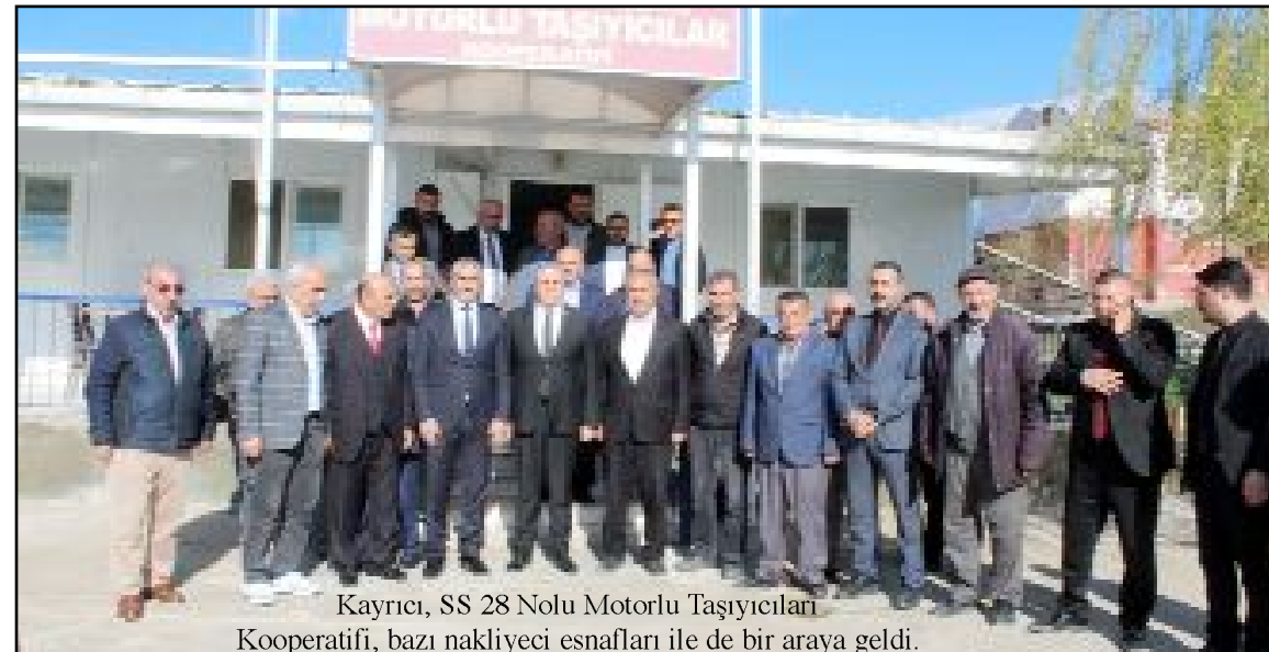
Kayırcı, SS 28 Nolu Motorlu Taşıyıcıları Kooperatifi, bazı nakliyecilerle birlikte de bir araya geldi.