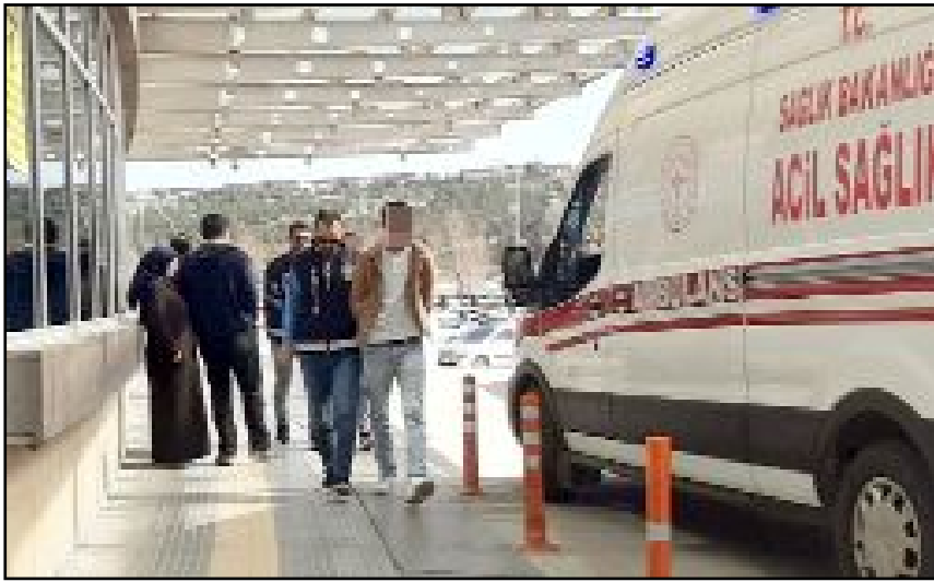
Zanlılar, tutuklanarak cezaevine gönderildi.