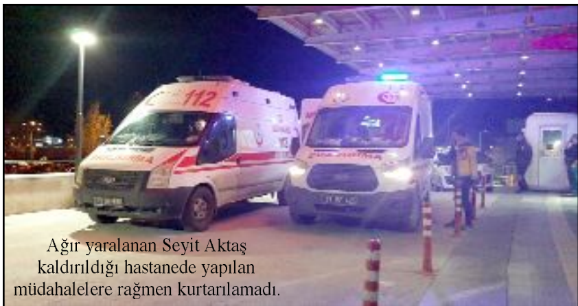
Ağır yaralanan Seyit Aktaş kaldırıldığı hastanede yapılan müdahalelere rağmen kurtarılamadı.