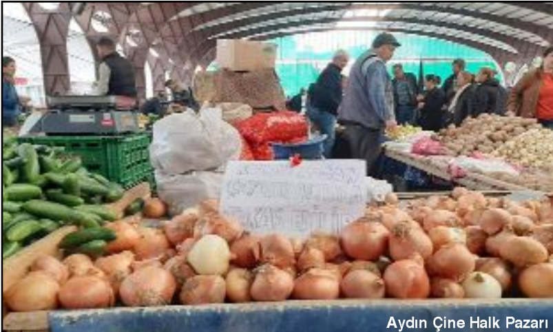
Aydın Çine Halk Pazarı

418 milyar dolar başka bir büyüklikle ifade edersek taşıma kapasitesi 26 ton olan tırlara yükleyseydik bu para tamı tamına 1250 dolar yüküklü tır olacaktı. Bu büyük yükte bir paranın uluslararası hareketi bilinmiyor olamaz. Para her devrimde iz bırakır. Zaten ABD ve Avrupa Birliği ülkeleri