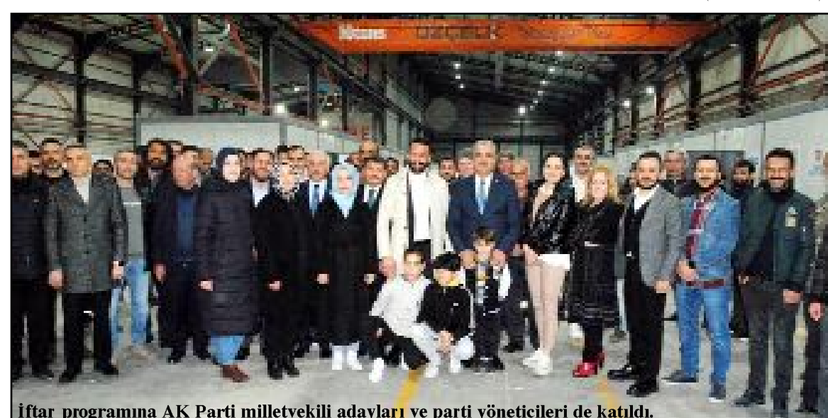
İftar programına AK Parti milletvekili adayları ve parti yöneticileri de katıldı.