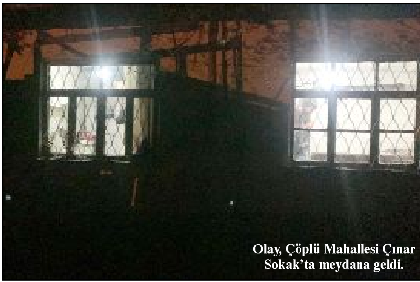
Olay, Çöplü Mahallesi Çınar Sokak'ta meydana geldi.

N.A.'nın, ilk ifadesinde lavabodan döndüğü sırada yüzünü tam olarak göremediği bir kişinin karanlıkta bir anda eline para sıkıştırarak kendisine cinsel saldırıda bulunduğunu, o esnada yerde duran sehpa ile şahsa vurduğunu ve şahsında kendisini darp ederek evden kaçtığını ifade ettiği öğrenildi. Olay Yeri İnceleme ekiplerinin evde yaptığı inceleme sonrası cinsel saldırı olayını gerçekleştiren şahsın yakalanması için çalışma başlatıldı. (Haber Merkezi)