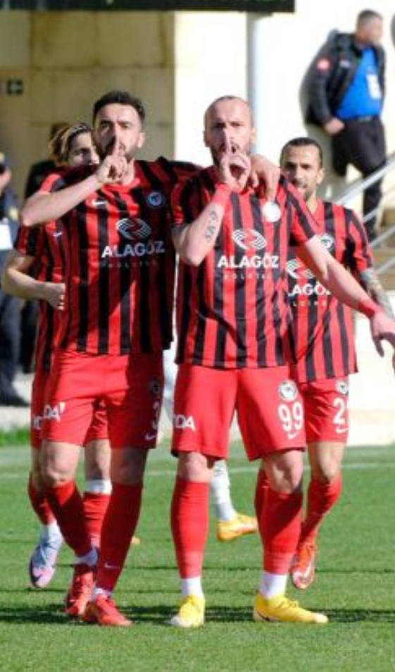
Çorum FK, ligden düşmesi kesinleşen Bayburt Özel İdare'yi ikinci yarıda bulduğu gollere 2-0 yenerek mutlu sona bir adım daha yaklaştı.