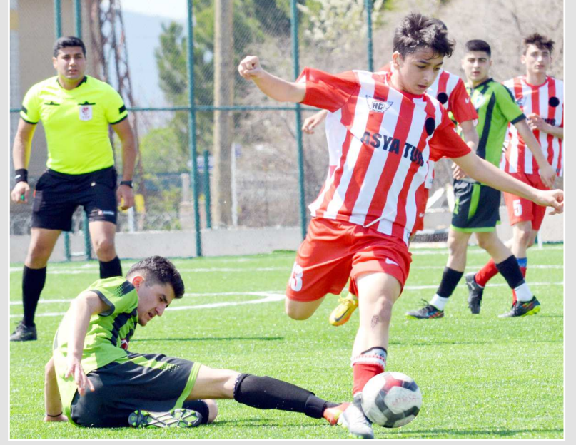
Hattuşa Gençlikspor ile Mimar Sinan arasında oynanan maçtan enstantane.