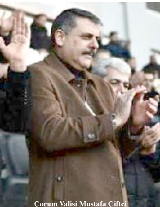
Çorum Valisi Mustafa Çiftçi