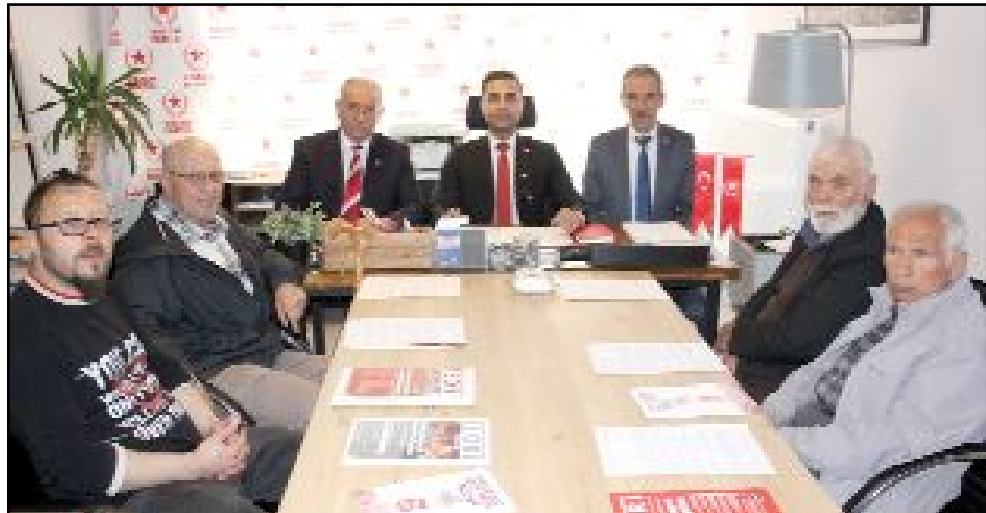
Vatan Partisi Çorum Teşkilatı, 28. dönem milletvekili adaylarını kamuya tanıtmak için bir araya geldi.