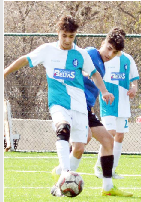
İtfaiye Sahası'nda oynanan maçtan enstantane.

Çorum'da oynanan Gençlerbirliği-İskilipgücü maçında puanlar paylaşıldı. U17 Futbol Ligi 2.hafta maçında Gençlerbirliği ile İskilipgücü Çorum'da karşı karşıya geldi. Cumartesi günü Merkez İtfaiye Sahası'nda oynanan karşılaşmaya ev sahibi Gençlerbirliği etkili başladı. Mücadelenin 18.dakikasında penaltıdan Ufuk'un golüyle 1-0 öne geçen Gençlerbirliği ilk yarıyı da 1-0 önde kapatmayı başardı. İkinci yarıda oyuna ortak olan konuk İskilipgücü, beraberlik golü için Gençlerbirliği kalesine yüklenirken, aradığı golü 75.dakikada Samet ile buldu. Kalan sürede başka gol olmayınca iki takımda puanları paylaştı. (Rifat KARA)