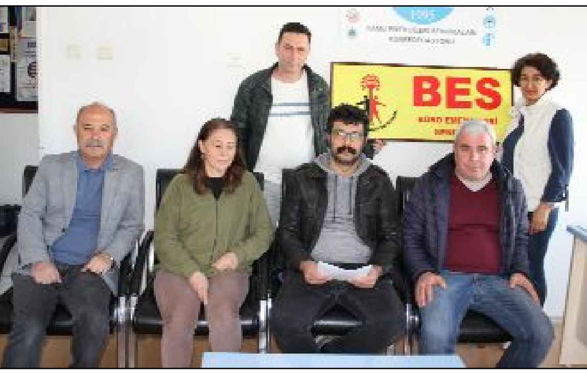
KESK Çorum Şubeler Platformu, 'İnsanca yaşam ücreti, güvenceli çalışma istiyoruz' talebiyle bir basın açıklaması gerçekleştirdi.