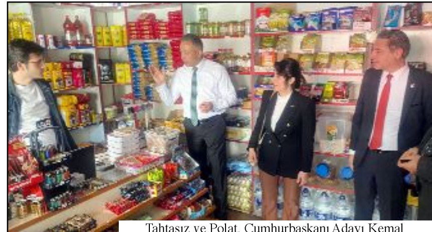
Tahtasız ve Polat, Cumhurbaşkanı Adayı Kemal Kılıçdaroğlu ve Millet İttifakı adayları için destek istedi.