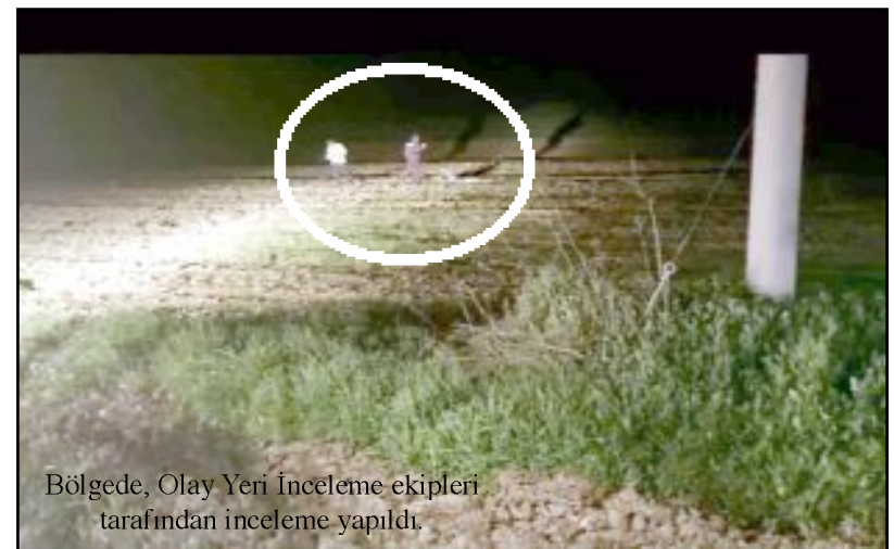
Bölgede, Olay Yeri İnceleme ekipleri tarafından inceleme yapıldı.