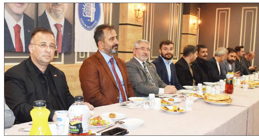
Mimar Sinan Dügün Salonu'nda gerçekleşen yemekten fotoğraflar...