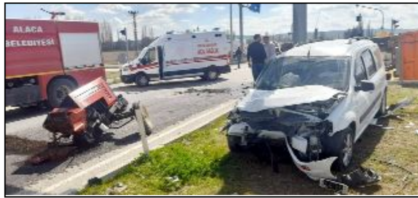
Kaza, Alaca çevreyolunda meydana geldi.