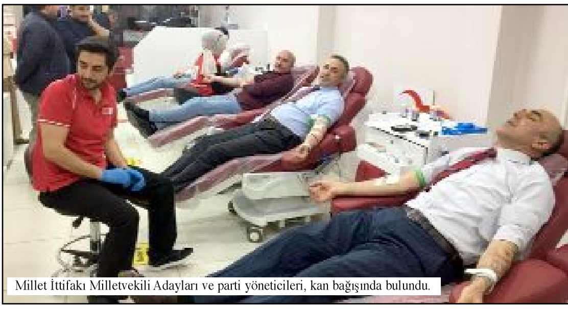
Millet İttifakı Milletvekili Adayları ve parti yöneticileri, kan bağışında bulundu.