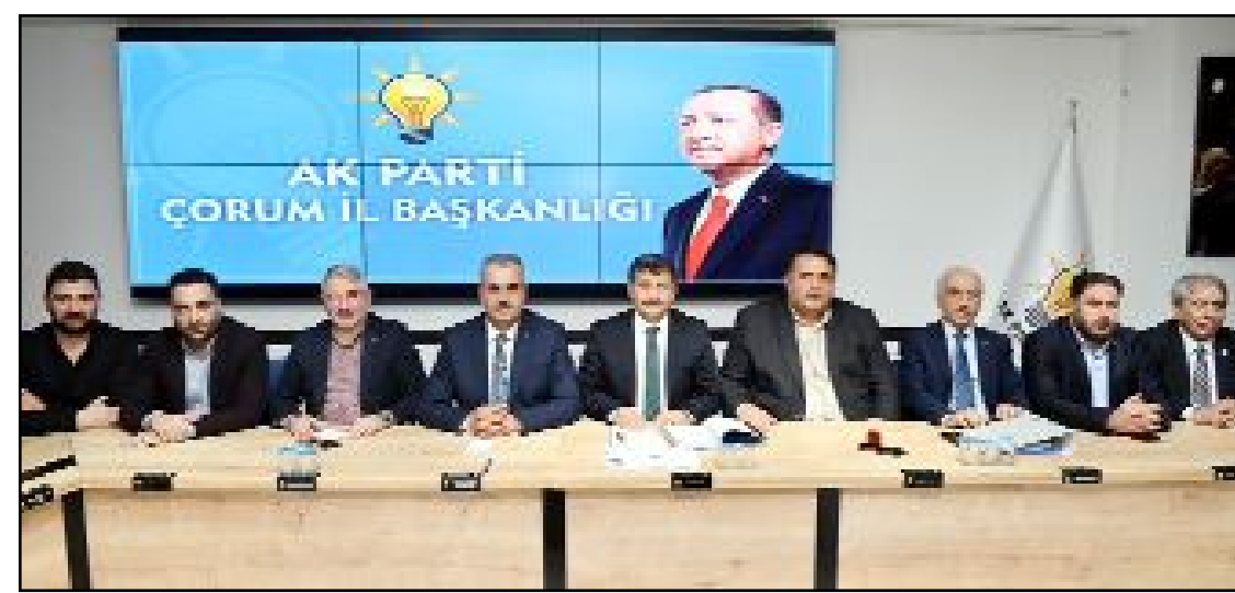
AK Parti'de Seçim Koordinasyon Merkezi sorumlularının katılımı yapılan istişare toplantısında 14 Mayıs seçimleri ele alındı.