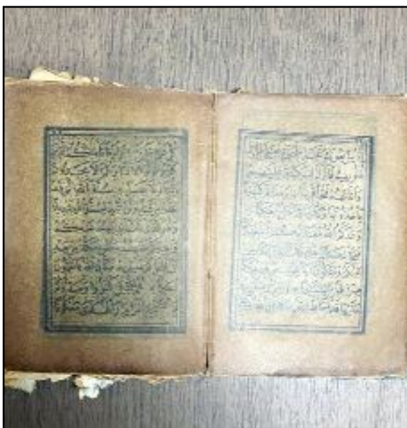
Sungurlu'da tarihi değeri olan 2 Kur'an-ı Kerim ile hançer ele geçirildi.

Hançer ve 2 Kur'an-ı Kerim ise incelen-mek üzere İl Kültür ve Turizm Müdürlü-ğü'ne gönderildi. (AA)