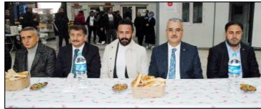
Yakupoğulları Özçelik Metal tarafından Ramazan ayı dolayısıyla çalışanlara yönelik olarak iftar programı düzenlendi.

İftar programı konuşmaların ardından çekilen hatıra fotoğrafı ile sona erdi. (Haber Merkezi)