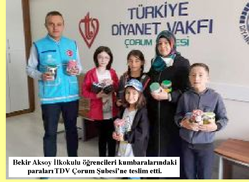
Bekir Aksoy İlkokulu öğrencileri kumbaralarındaki paralarını TDV Çorum Şubesi'ne teslim etti.

Miniklerin bu anlamlı davranışlarından dolayı İl Müftüsü Muharrem Biçer, hayırlarının kabul olmasını Cenabı Haktan niyaz ederken kendilerine ve öğretmenlerine teşekkür etti. (Volkan SINAYUÇ)