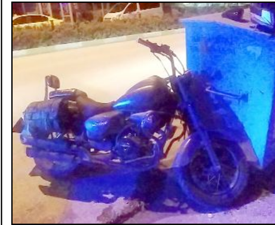
Kaza, Bahabey Caddesi'nde meydana geldi.

plakası alınmayan bir otomobil, Taha M. idaresindeki 06 BDL 510 plakalı motosiklete çarparak uzaklaştı. Kazayı görenlerin ihbarı üzerine olay yerine 112 sağlık ekibi ve polis ekibi sevk edildi. Yaralı motosiklet sürücüsü, sağlık ekiplerinin olay yerinde yaptığı ilk müdahalenin ardından ambulansla Hitit Üniversitesi Erol Olçok Eğitim ve Araştırma Hastanesi'ne kaldırılarak tedavi altına alındı. Öte yandan, polis ekipleri otomobil sürücüsünün yakalanması için çalışma başlattı. (İHA)