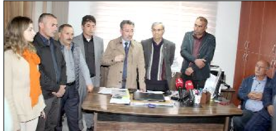
Av. Ahmet Özdel, tutuklu muhtarlarla ilgili yaptığı görüşme hakkında bilgi verdi.

Ayrıntılı olmaya değil birleştirici olmaya, halkın unutan değil her daim halkın sesi olmaya, adaletin herkese eşit olduğu bir ülke kurmaya, Çorum'un bunca yıldır iktidardan alamadığı yatırımları Çorum'a kazandırıp, Anadolu Kaplanı olan şehrimizi şaha kaldırmak için geliyoruz" dedi. (Haber Merkezi)