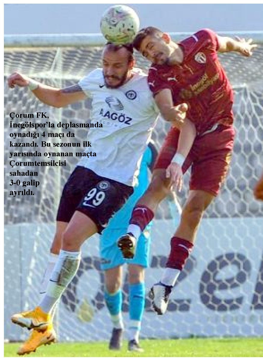
Çorum FK, İnegölspor'la deplasmanda oynadığı 4 maçı da kazandı. Bu sezonun ilk yarısında oynanan maçta Çorum temsilcisi sahadan 3-0 galip ayrıldı.

İki takım arasında, sezonun ilk yarısında, İnegöl'de oynanan maçta Çorum FK 3-0 kazandı. Kırmızı-siyahlılara galibiyet getiren goller 9.dakikada Atakan Akkaynak, 71.dakikada Enes Nalbantoğlu ve 90+2.dakikada da Burak Çalık attı. (Hüseyin AŞKIN)