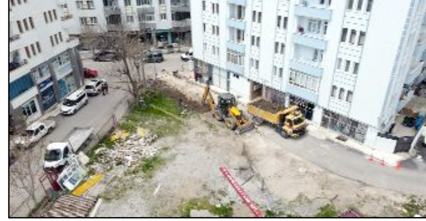
Mahalle sakinlerinin istekleri doğrultusunda, Esnafevler 12. Sokak'ta kamulaştırma gerçekleştirildi ve yol genişletme çalışmaları başladı.

Başkan Aşgın, mahallelere yapılacak çalışmalarla ilgili sürekli olarak muhtarlar ve mahalle sakinleri ile iletişimde olduklarını sözlerine ekledi. (Haber Merkezi)