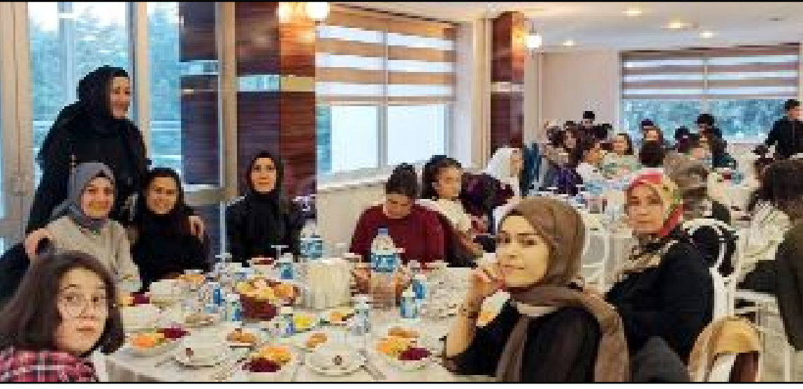
Mustafa Kemal Ortaokulu 6 H Sınıfı'nın iftar yemeğinden...