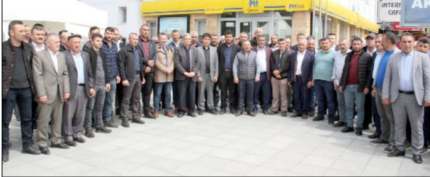
Çorum Merkez Köy Muhtarları Derneği'ne kayıtlı 120 muhtarın katılımı ile AK Parti İl Başkanı Murat Günay'a yapıldığı iddia edilen saldırı sonucu 3 muhtarın tutuklu olarak cezaevinde tutulmalarına itiraz edildi.

Cumhuriyet Başsavcılığımızca olay tüm yönleriyle incelenmiş, toplanması gereken tüm deliller ile birlikte toplanmış ve Çorum 2. Ağır Ceza Mahkemesi'ne yağmaya teşebbüs etmek suçundan cezalandırılmaları amacıyla kamu davası açılmıştır." (Haber Merkezi)