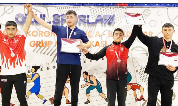
Çorumlu pehlivanlar ödül kürsüsünde görülüyor...