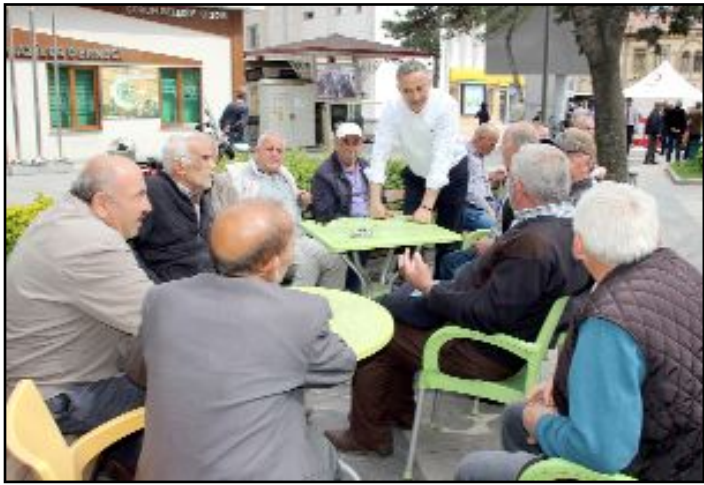
Cumhurbaşkanı Adayı Kemal Kılıçdaroğlu ve Millet İttifakı milletvekili adayları için destek isteyen CHP'ye, yoğun ve sıcak ilgi ile karşılandı.