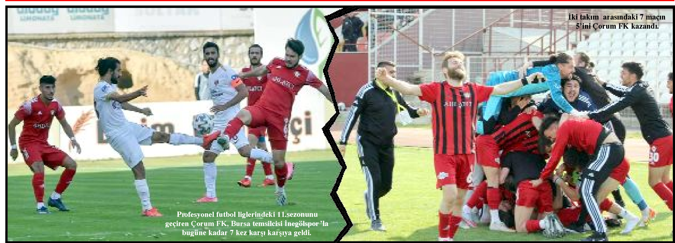
İki takım arasındaki 7 maçın 5'ini Çorum FK kazandı.

Profesyonel futbol liglerindeki 11.sezonunu geçiren Çorum FK, Bursa temsilcisi İnegölspor'la bugüne kadar 7 kez karşı karşıya geldi.