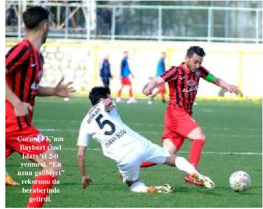
Çorum FK'nın Bayburt Özel İdare'yi 2-0 yenmesi, "En uzun galibiyet" rekorunu da beraberinde getirdi.

2.Lig Beyaz Grup'ta "Birlikte başaracağız" parolasıyla şampiyonluk mücadelesi veren Çorum FK, deplasmanda aldığı 2-0'lık Bayburt Özel İdare galibiyetiyle, kendine ait bir rekoru daha kırdı.