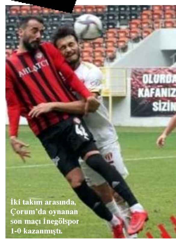
İki takım arasında, Çorum'da oynanan son maç İnegölspor 1-0 kazanmıştı.

Çorum FK, yarın 33.hafta maçında konuk edeceği İnegölspor'la oynadığı 7 maçın 5'ini kazanırken, 2'sini ise kaybetti. Bursa temsilcisi ile evinde oynadığı 3 maçta 1 galibiyet, 2 yenilgi alan kırmızı-siyahlı takım, İnegöl'de çıktığı 4 maçı da kazandı.