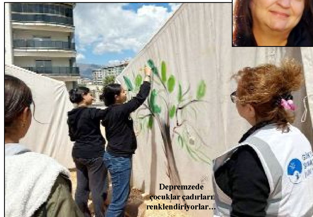
Depremzede çocuklar çadırlarını renklendiriyorlar...