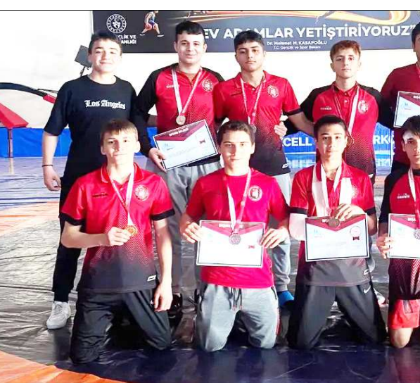
Yarı final gruplarına adını yazdıran Çorumlu güreşçiler toplu halde görülüyor...

Okullararası düzenlenen B Gençler Güreş Grup Birinciliği'nde Çorumlu 9 pehlivan sıklıkta dereceye girerek yarı final grubuna yükselmeyi başardı.