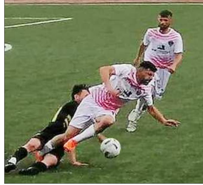
Kargı ilçe sahasında oynanan maçtan bir enstantane...

deki 5.galibiyetini alan Kargı temsilcisi puanını 16'a yükselterek ilk yarıyı yenilgisiz lider tamamladı. Konuk Oğuzlar Belediyespor ise 8 puanda kaldı. (Rifat KARA)