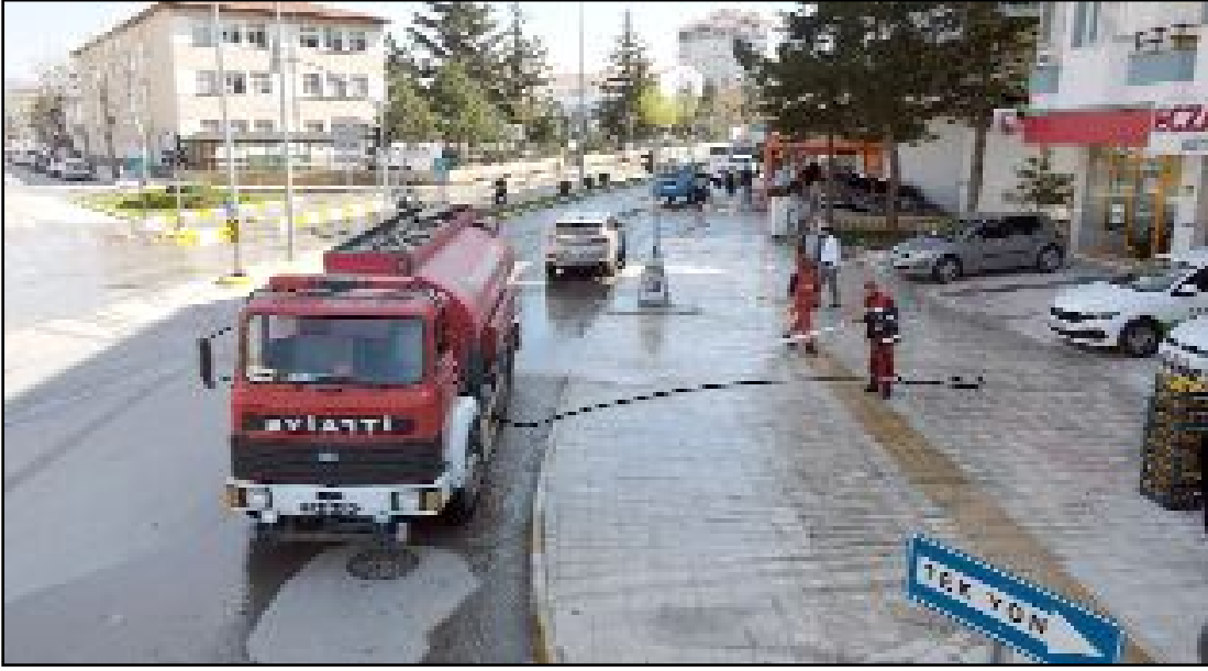
Şehrin işlek caddeleri ve kaldırımları yıkılarak temizleniyor.