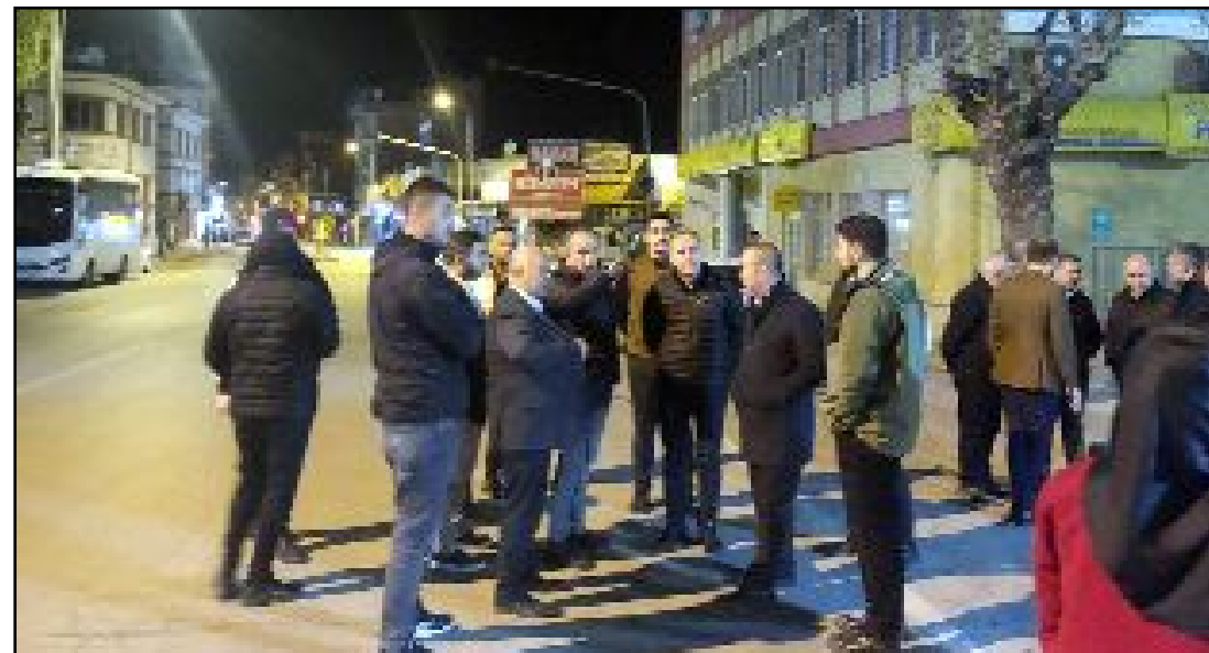
Afyonkarahisar Zafer Meydanı'nda inceleme...