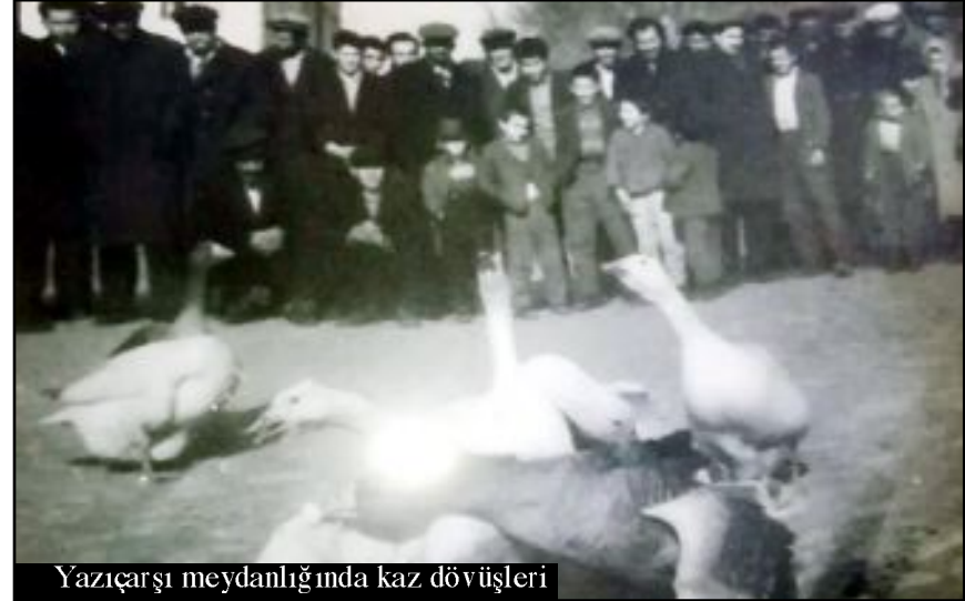
Yazıçarşısı meydanlığında kaz dövüşleri

gruplar halinde gelirdi. Büyük bir halka çevrilir, iddialı konuşmalar yapılırdı. İki ekek kaz dövüşürken, erkek ka-