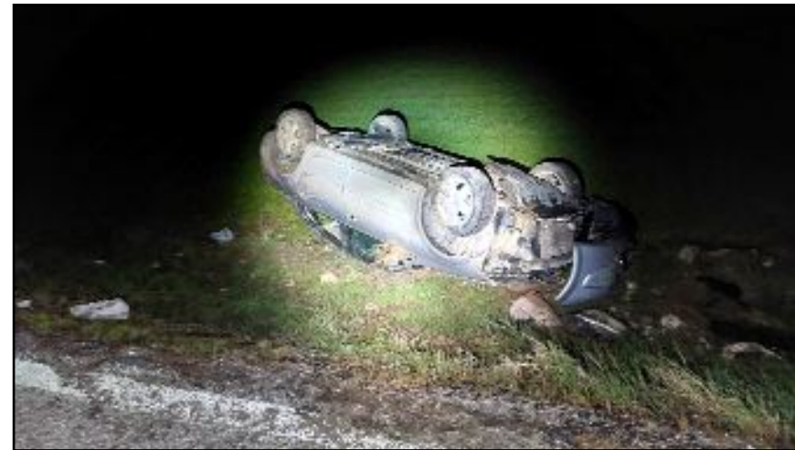
Satılmış S. idaresindeki 06 BH 128 plakalı otomobil, Alaca-Zile kara yolu Çopraşık köyü yakınlarında şarampole devrildi.

Yaralılar, sağlık ekiplerince yapılan ilk müdahalenin ardından ambulanslarla Alaca Devlet Hastanesine kaldırıldı. (AA)