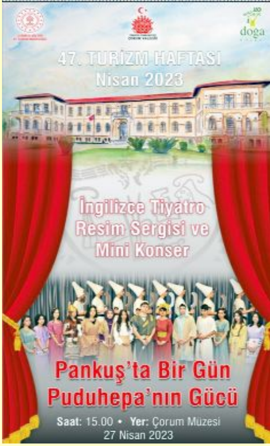
Bilaller Konağı'nda bugün başlayacak Turizm Haftası kutlama afişleri.