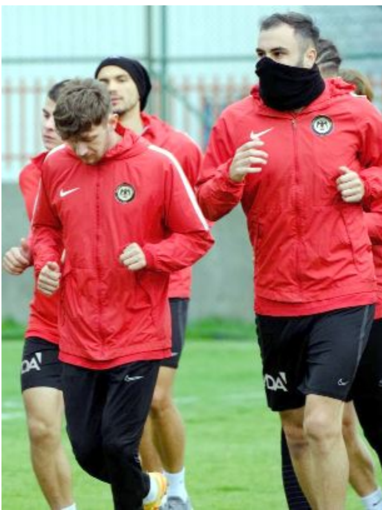
Çorum FK dün yaptığı antrenmanla İnegölspor maçının hazırlıklarını sürdürdü.