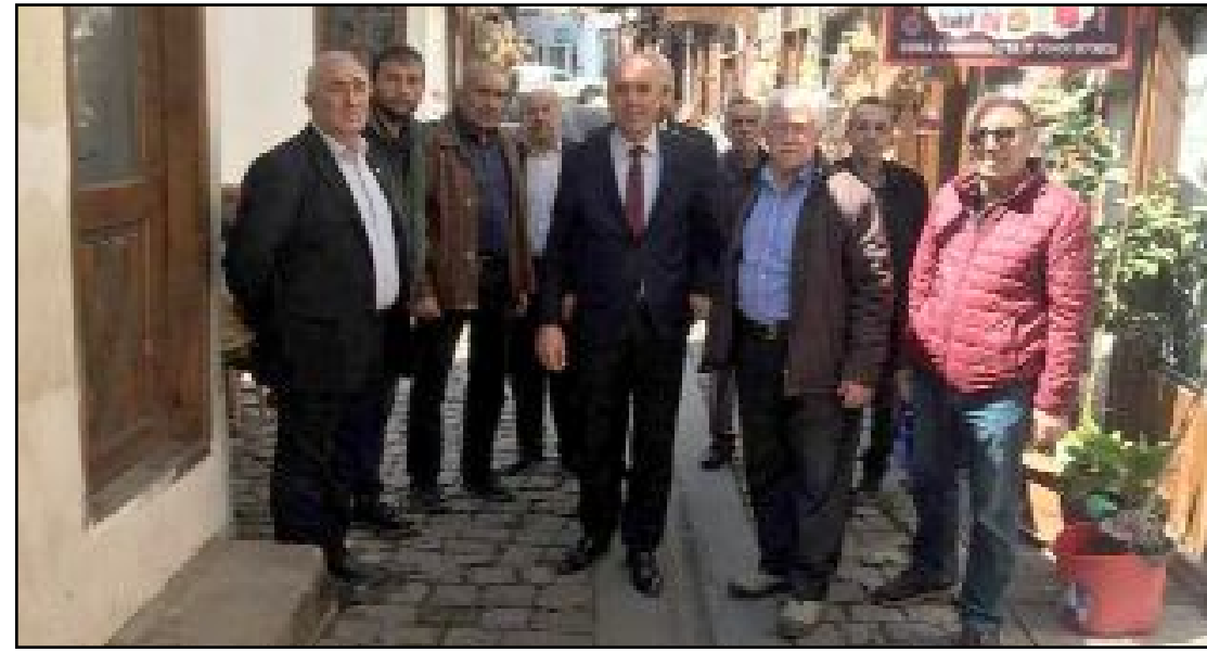
Millet İttifakı Milletvekili Adayları ve parti yöneticileri, İskilip İlçesi'nin Kurusaray Köyü'nde kurulan pazarda, Bayat ve İskilip İlçelerinde esnafı ve halkı dinledi.

Yerinde Kurulum / Kimlik Doğrulama Hizmeti