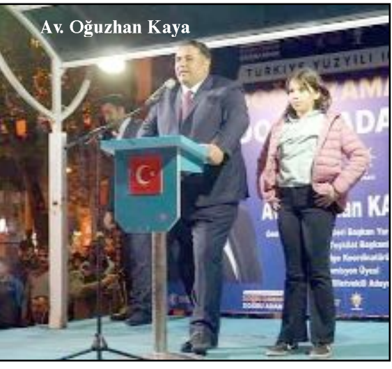
Av. Oğuzhan Kaya

"Memleketimiz Osmancık bizi bağına bastı. Bu coşkulu karşılama ve destek için tüm hemşehrilerimize teşekkür ederim. İnşallah aynı heyecanla 14 Mayıs gecesi de meydanları dolduracağız." (Volkan SINAYUÇ)