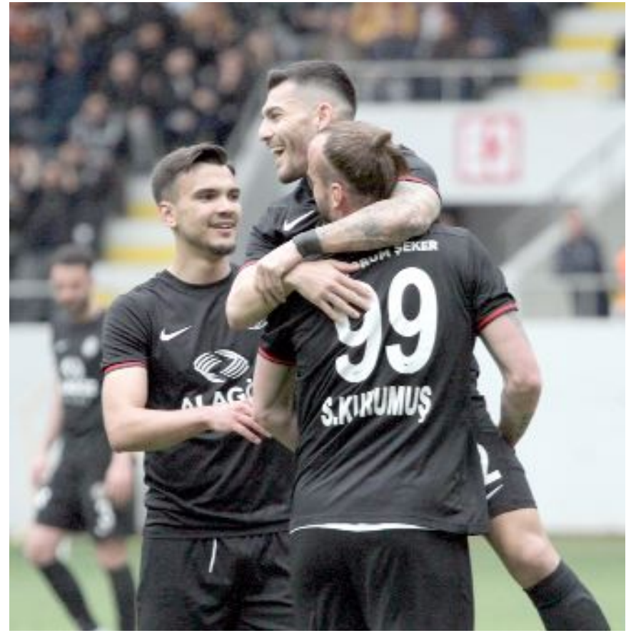
Son 6 maçını kazanan Çorum FK'nın yenilmezlik serisi 14 maça çıktı.

Çorum FK, bu serinin ardından bir daha üst üste beş galibiyet alamazken, bu sezon aynı başarıyı tekrarladı. Kırmızı-siyahlı takım, 27.haftada, sahasında aldığı 3-0'lık Sivas Belediye galibiyetiyle başlayan seride, sırasıyla deplasmanda Diyarbakır temsilcisi Amedspor'u 2-0, evinde İstanbul ekibi Esenler Erokspor'u 1-0, deplasmanda Ankaraspor'u 2-0, sahasında Tarsus İdmanyudu'nu 9-0 mağlup etti. Bu galibiyetlerle 2015-2016 Sezonundaki 5 maçlık galibiyet serisini egale eden Çorum FK, geçti-