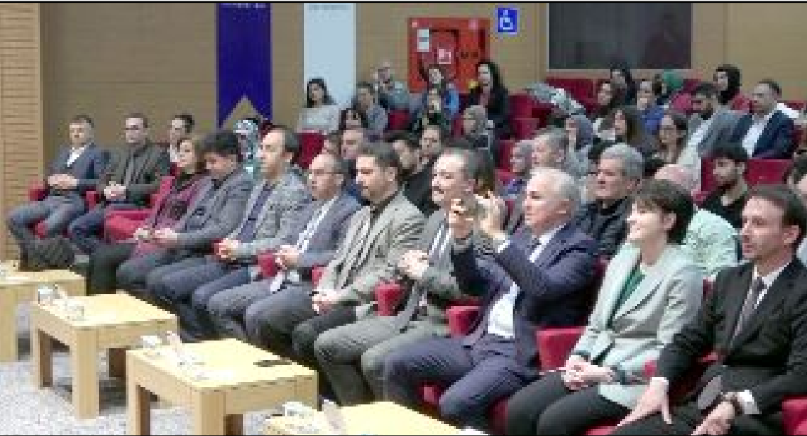
Hitit Üniversitesi 9. Öğrenci Kongresi etkinlikleri çerçevesinde "Dünyanın sürdürülebilirliğinde makineler" konulu konferans düzenlendi.

Türkiye Makine Federasyonu Genel Sekreteri Zühtü Bakır: