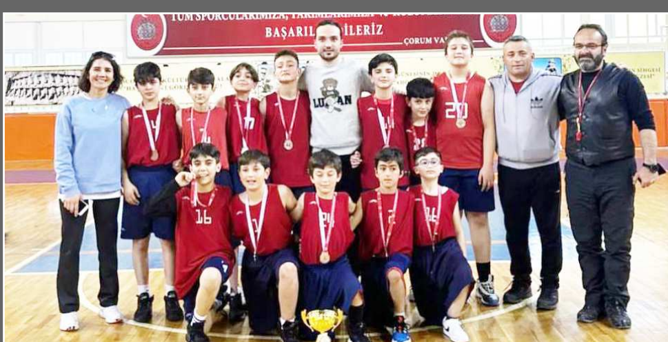
Çorum temsilcisi Mehmet Akif Ersoy Ortaokulu...

Mehmet Akif Ersoy Ortaokulu ikinci maçını bugün aynı salonda saat 11.00'de Kastamonu Merkez Ortaokulu ile oynayacak.