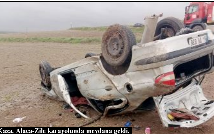
Kaza, Alaca-Zile karayolunda meydana geldi.