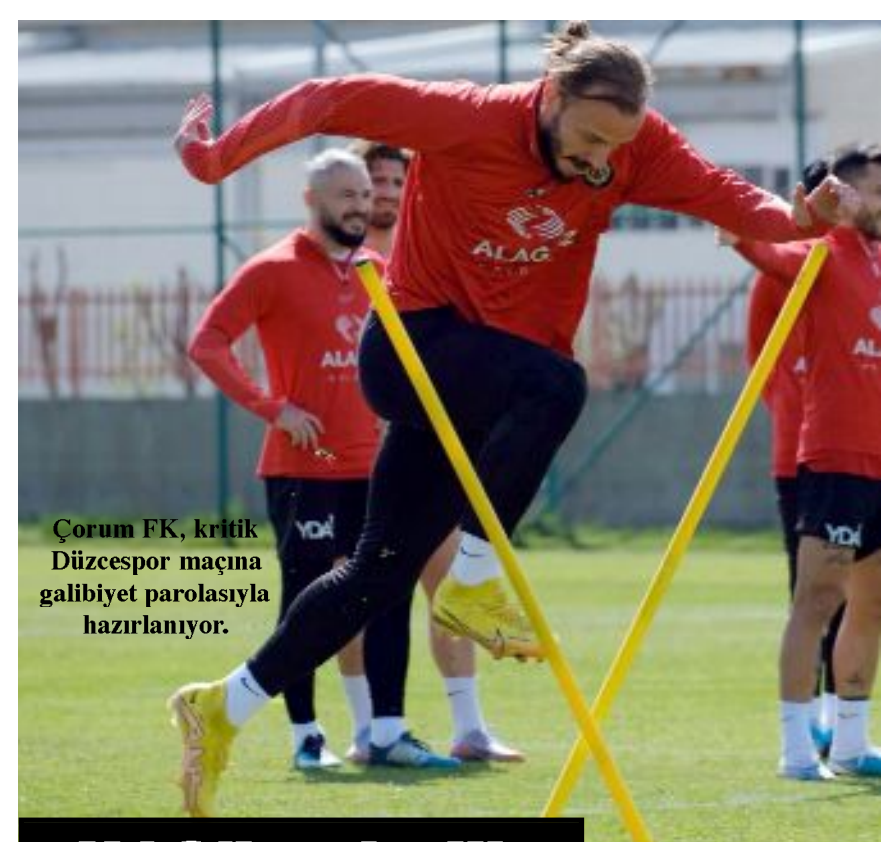
Çorum FK, kritik Düzcespor maçına galibiyet parolasıyla hazırlanıyor.

Lider Çorum FK, Pazar günü, Düzcespor'la sahasında oynayacağı kritik maçın hazırlıklarını dün yaptığı antrenmanla sürdürdü.