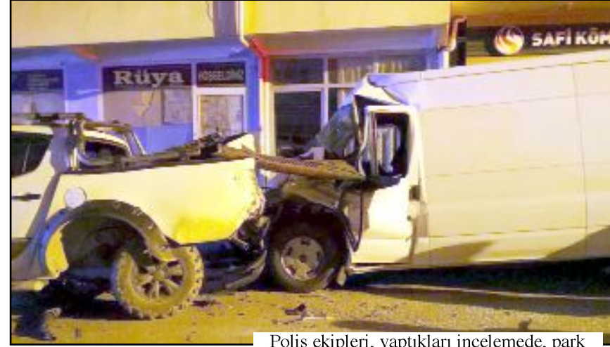
Polis ekipleri, yaptıkları incelemede, park halindeki 6 aracın zarar gördüğünü belirledi.

Kazanın ardından kaçan sürücünün yakalanması için çalışma başlatıldı. (AA)