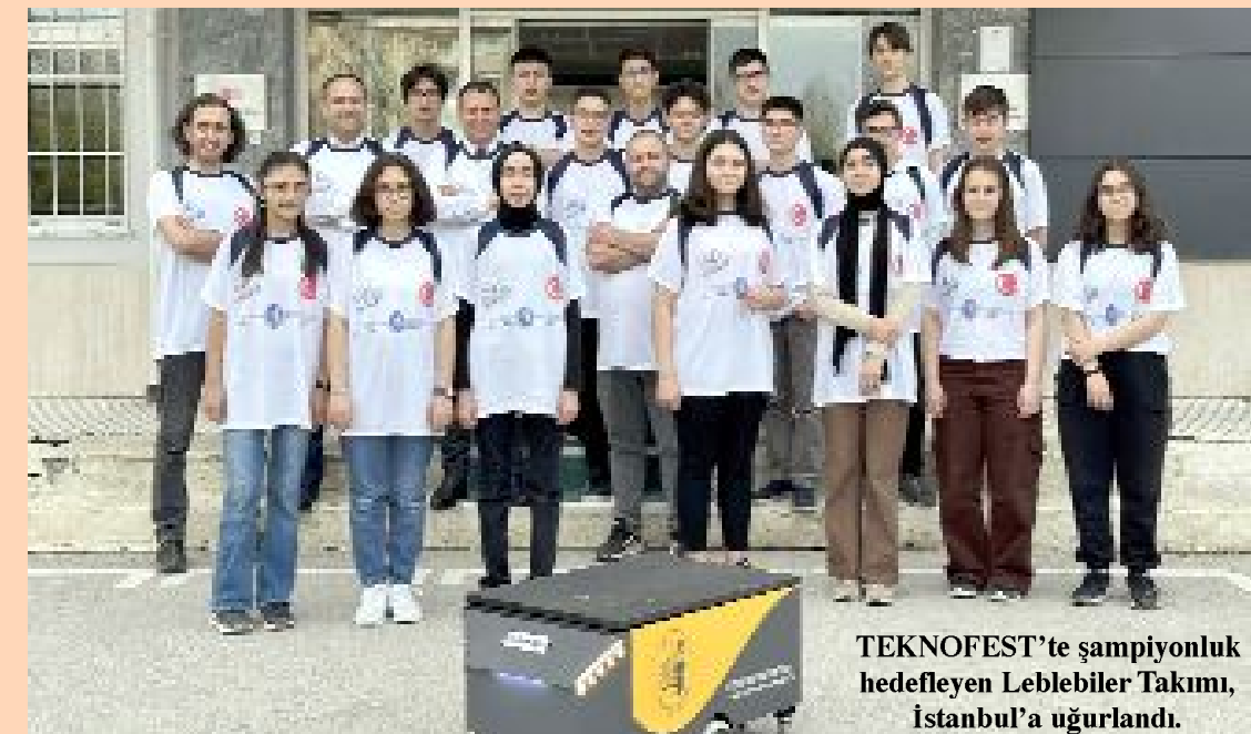
TEKNOFEST'te şampiyonluk hedefleyen Leblebiler Takımı, İstanbul'a uğurlandı.

Belediyeden bilime destek Leblebiler takımı TEKNOFEST'te