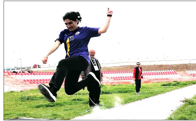
Hitit Üniversitesi Atletizm Sahası'nda yapılan yarışlardan fotoğraf.

Müsabakalar sonunda düzenlenen törenle dereceye giren özel sporculara madalyaları verildi. (Rifat KARA)