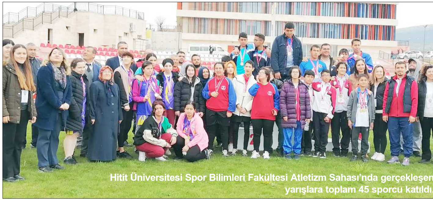
Hitit Üniversitesi Spor Bilimleri Fakültesi Atletizm Sahası'nda gerçekleşen yarışlara toplam 45 sporcu katıldı.

Çorum temsilcisi bugün aynı salonda aynı saatte Bolu temsilcisi Orhan Gazi Ortaokulu ile karşı karşıya gelecek. (Rifat KARA)