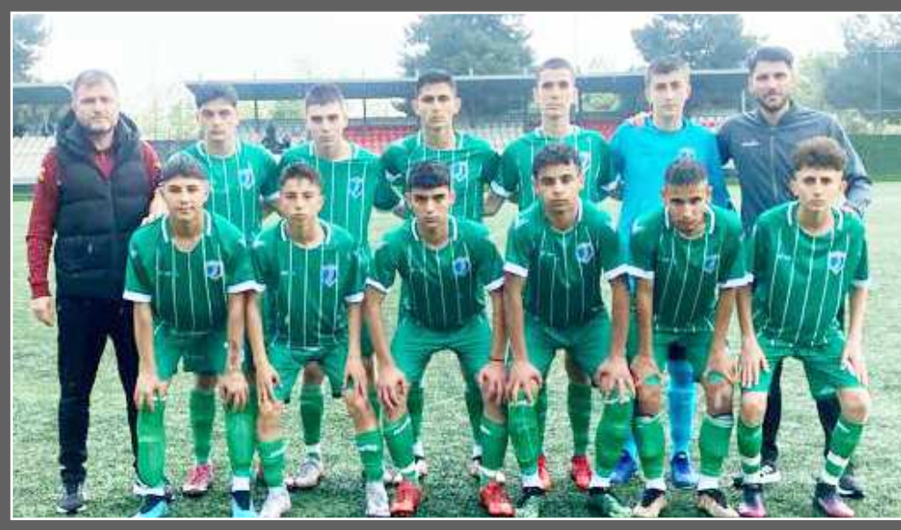
Mimar Sinan Gençlikspor'un Kastamonu karşısında maça başlayan ilk 11'i...