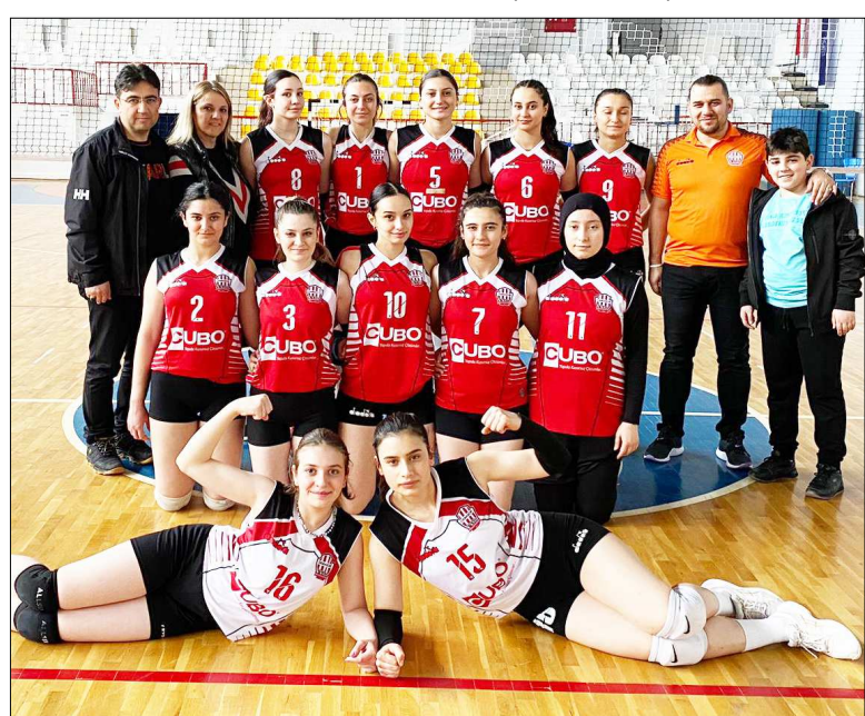
Genç sultanlar Yozgat'ta şampiyon olarak yarı finale yükseldi.

Türkiye Voleybol Federasyonu'nun 2023 yılı faaliyet programında yer alan Kulüplerarası Genç Kızlar Voleybol Grup Birinciliği 25-27 Nisan tarihleri arasında Yozgat'ta yapıldı. Sivas, Yozgat ve Tokat temsilcileri ile birlikte A grubunda mücadele eden Çorum temsilcisi Osmancık Belediyespor grubu oynadığı ilk