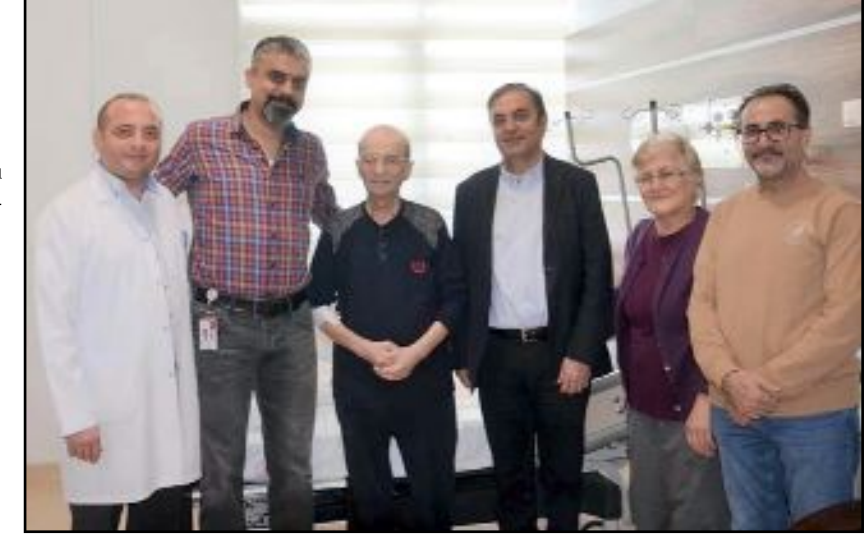
Hitit Üniversitesi Erol Olçok Eğitim ve Araştırma Hastanesi Üroloji Kliniği'nde mesane kanseri ameliyatlarında bir ilk gerçekleştirildi.