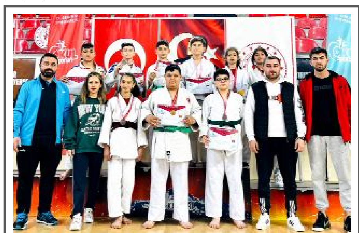
Dereye yapıp, Türkiye şampiyonası finallerine katılmaya hak kazanan Çorumlu judocular, antrenörleri ile görülüyorlar.