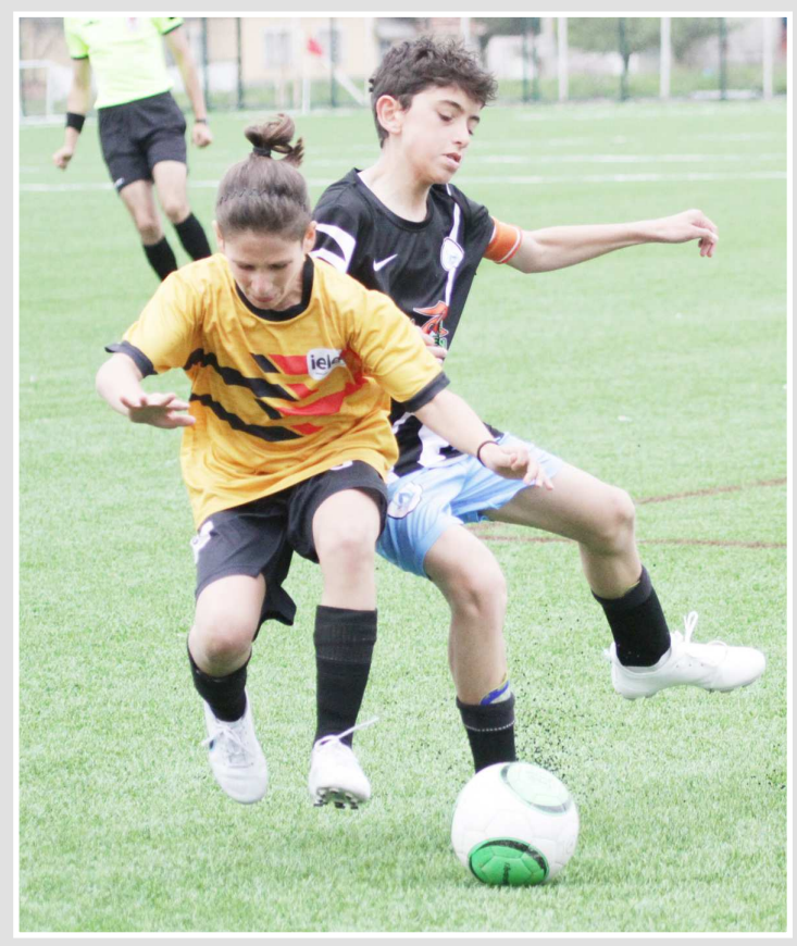
Nazmi Avluca Sahası'nda oynanan maçtan bir enstantane...

Çorum temsilcisi ikinci maçını bugün aynı sahada saat 11.30'da Bolu Gazipaşa Ortaokulu ile oynayacak. (Rifat KARA)