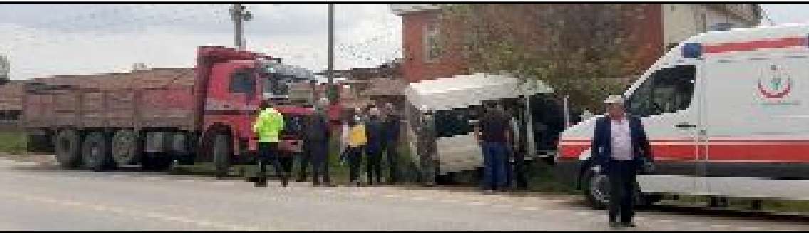
Hakan K. idaresindeki 55 K 8639 plakalı kamyon ile Salih B.'nin kullandığı 19 BM 018 plakalı minibüs Çorum-İskilip yolu 2. kilometresinde çarpıştı.

Çorum'da kamyon ile minibüsün karıştığı kazada 1 kişi yaralandı.