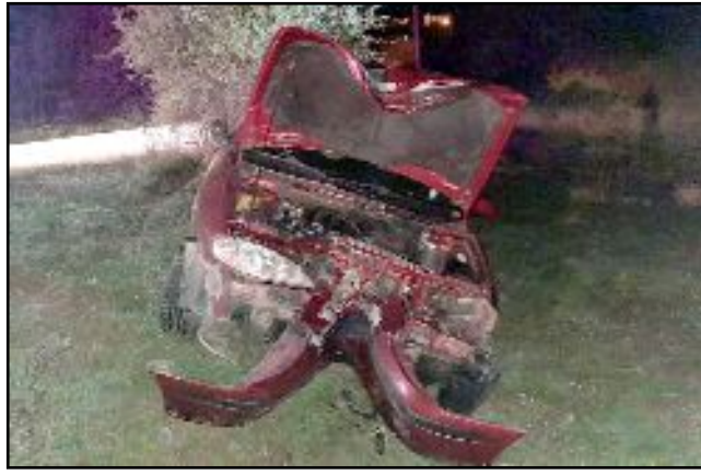
Kaza, A tçalı Köyü yolunda meydana geldi.

Kaza nedeni ile otomobil ve elektrik direğinde hasar meydana geldi. (Tugay GÖKTÜRK)