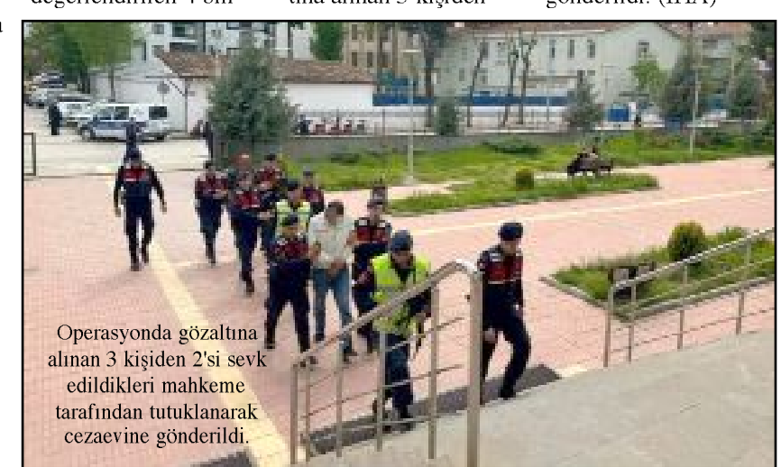
Operasyonda gözaltına alınan 3 kişiden 2'si sevk edildikleri mahkeme tarafından tutuklanarak cezaevine gönderildi.

2'si sevk edildikleri mahkeme tarafından tutuklanarak cezaevine gönderildi. (İHA)