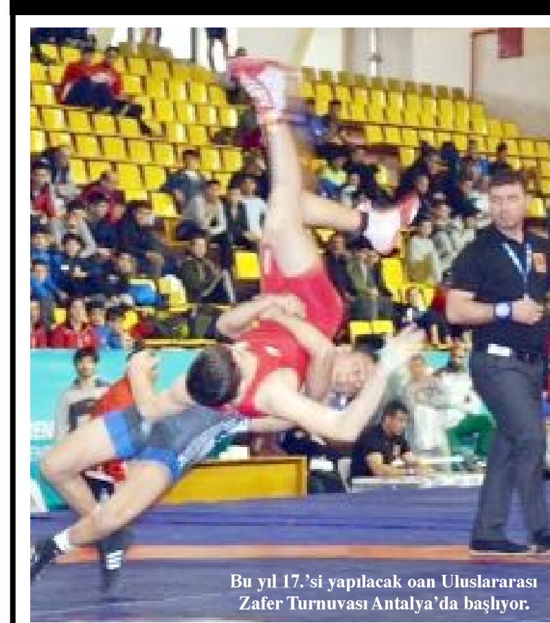
Bu yıl 17.'si yapılacak olan Uluslararası Zafer Turnuvası Antalya'da başlıyor.

Türkiye Güreş Federasyonu tarafından organize edilen 17. Uluslararası Yıldızlar ve Gençler Zafer ve Şampiyonlar Turnuvası bugün Antalya'da başlıyor. Şampiyonada Çorum'dan 10 güreşçi farklı kategorilerde Türkiye adına madalya mücadelesi verecek.