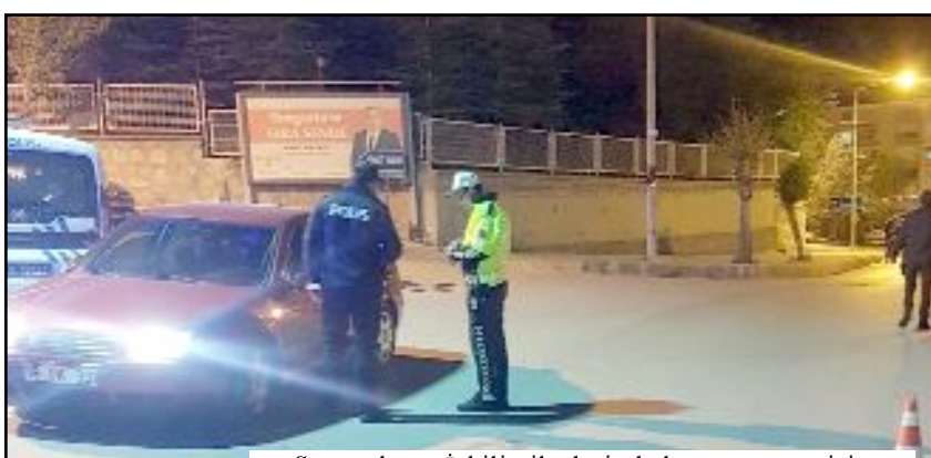
Sungurlu ve İskilip ilçelerinde huzur ve asayişin sağlanması amacıyla polis ekiplerince denetim yapıldı.

Denetimlerin devam ettiği bildirildi. (AA)