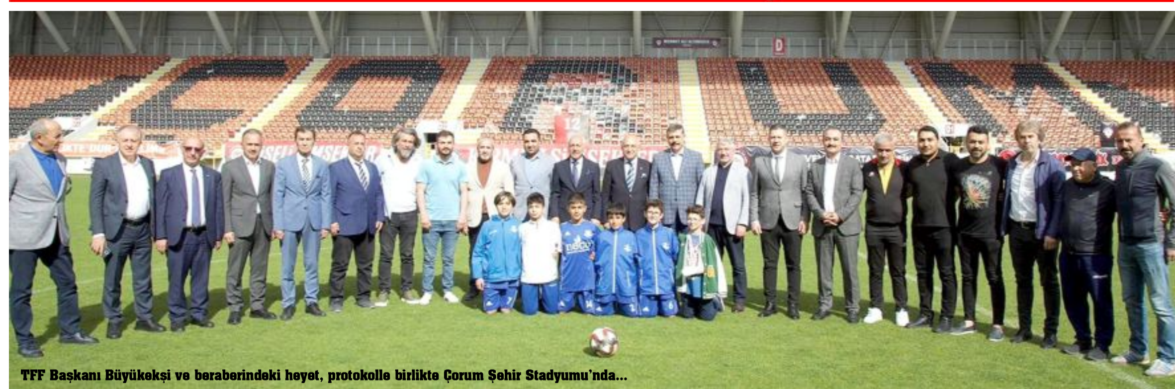
TFF Başkanı Büyükeşçi ve beraberindeki heyet, protokolle birlikte Çorum Şehir Stadyumu'nda...