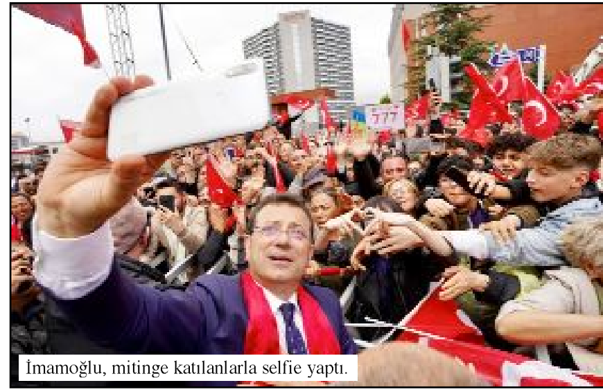
İmamoğlu, mitinge katılanlarla selfie yaptı.

Ömrünü hak, hukuk, adalet mücadelesine adanarak Kemal Kılıçdaroğlu'nun liderliğinde geliyoruz. Çok güçlüyüz, çok kararlıyız. İYİ Parti Genel Başkanı Meral Akşener hanımefendiyle geliyoruz. İttifakımızın tüm liderleriyle geliyoruz. Yakın dostum Mansur Yavaş başkanımızla geliyoruz. Bir şahsın, bir grubun, bir partinin seçimi değil bu seçim. Bu seçim milletin iktidarını kurma seçimidir. Devletin temelini adalet üzerine oturtacağız" dedi. (Taner ŞİMŞEK)