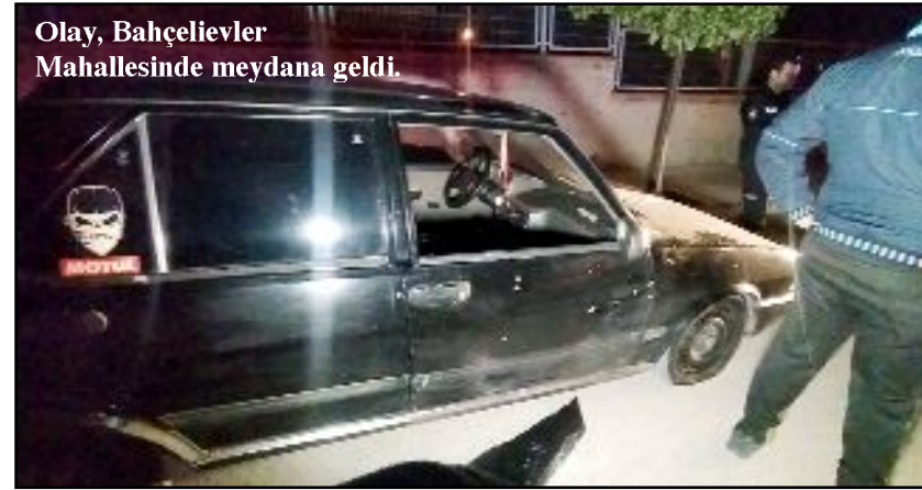
Olay, Bahçelievler Mahallesi'nde meydana geldi.

Çorum'da bir otomobil seyir halindeyken kimliği belirsiz kişi yada kişilerce kurşunlandı.