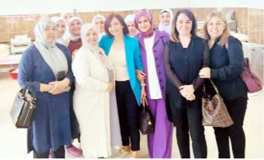
Kılıçdaroğlu Gönüllüleri, Sungurlu'da yeni bir çığır açan kadın girişimcilerle...