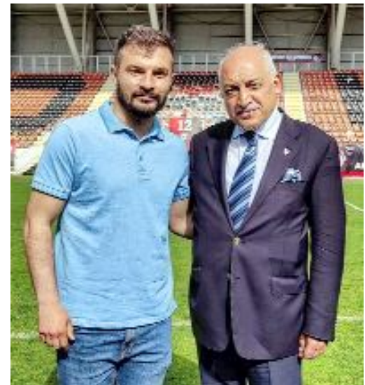
TFF Başkanı Mehmet Büyükeşçi ve Çorum ASKF Başkanı Ferhat Arıcı

Maç saatinin değişmesi ile ilgili olarak AK Parti Çorum Milletvekili Adayı Yusuf Ahlatcı'nın da TFF Başkanı Mehmet Büyükeşçi ile bir görüşme gerçekleştirdiği ve Büyükeşçi'nin öneriyi sıcak baktığı bildirildi. (Hüseyin AŞKIN)