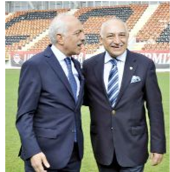
Türkiye Futbol Federasyonu Başkanı Mehmet Büyükeşçi, AK Parti Çorum Milletvekili adayı Zeki Gül'ün daveti üzerine Çorum'a geldi.