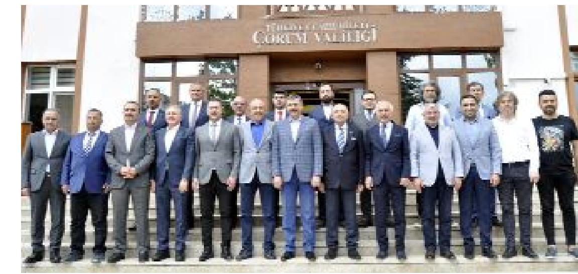
Günün anısına, Valilik önünde çekilen hatıra fotoğrafı...

Altyapı Akademileri Projesi kapsamında Altyapı Akademilerinde Türkiye Modeli oluşturmak ve sürdürülebilmek adına