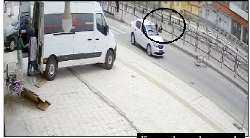
Kaza anı kameralara yansdı.

Yaralı çocuğun durumunun iyi olduğu öğrenildi. (Tuğay GÖKTÜRK)