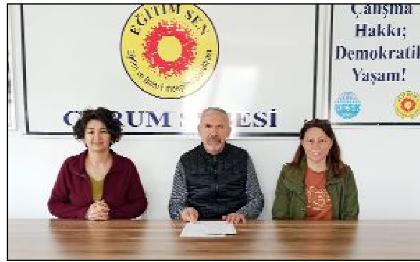
Eğitim Sen, 14 Mayıs seçimlerine ilişkin tutum belgesini kamuoyu ile paylaştı.