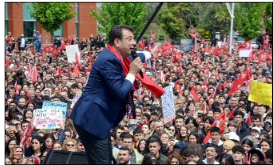
Ekrem İmamoğlu, Sinan Ateş cinayeti ve Hüda Par üzerinden Cumhuriyet İttifakı'na yüklendi.

Bizim milli duygularımızı, inancımızı ölçecek kişi anasının karnından doğmadı. İttifakına böyle bir partiyi katacaksın ve bunlar vatansever, milliyetçi öyle mi?" şeklinde konuştu. (Tugay GÖKTÜRK)