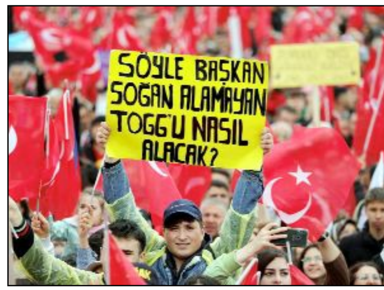
Abide Kavşağı'nı hınca hünç dolduran Çorumlular, Ekrem İmamoğlu'na büyük bir sevgi gösterisinde bulundu.