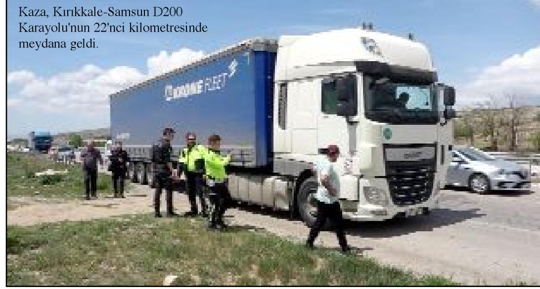
Kaza, Kırıkkale-Samsun D200 Karayolu'nun 22'nci kilometresinde meydana geldi.