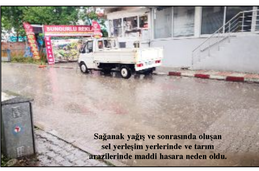
Sağanak yağış ve sonrasında oluşan sel yerleşim yerlerinde ve tarım arazilerinde maddi hasara neden oldu.