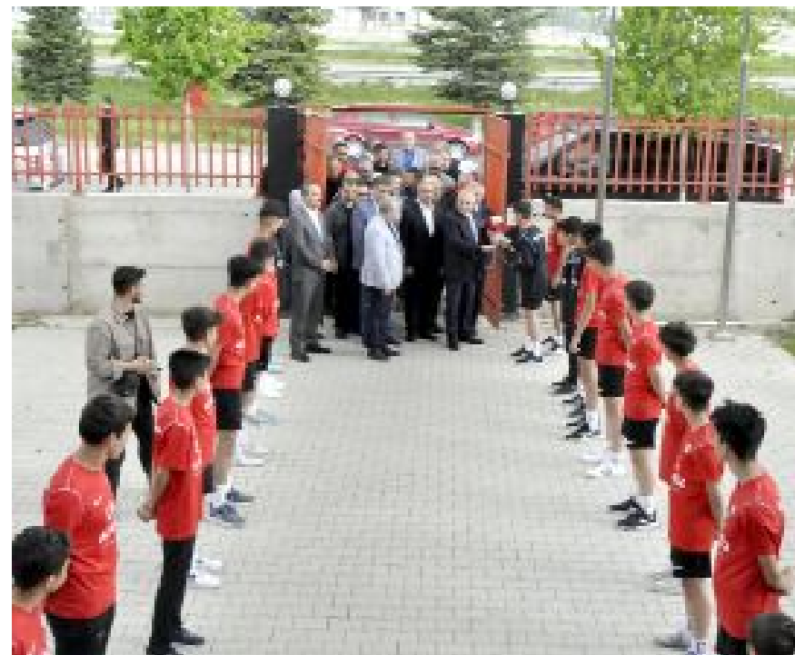
TFF Başkanı Mehmet Büyükekşi ve beraberindeki, Çorum FK Tesislerinde, altyapı oyuncuları tarafından çiçekle karşılandılar.