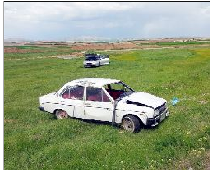
Kazada araçlardaki Türkan Z., Mustafa Z., Umud C., Merve A. ve Gökтуğ A. yaralandı.

Çorum'un Alaca ilçesinde devrilen 2 otomobildeki 5 kişi yaralandı.