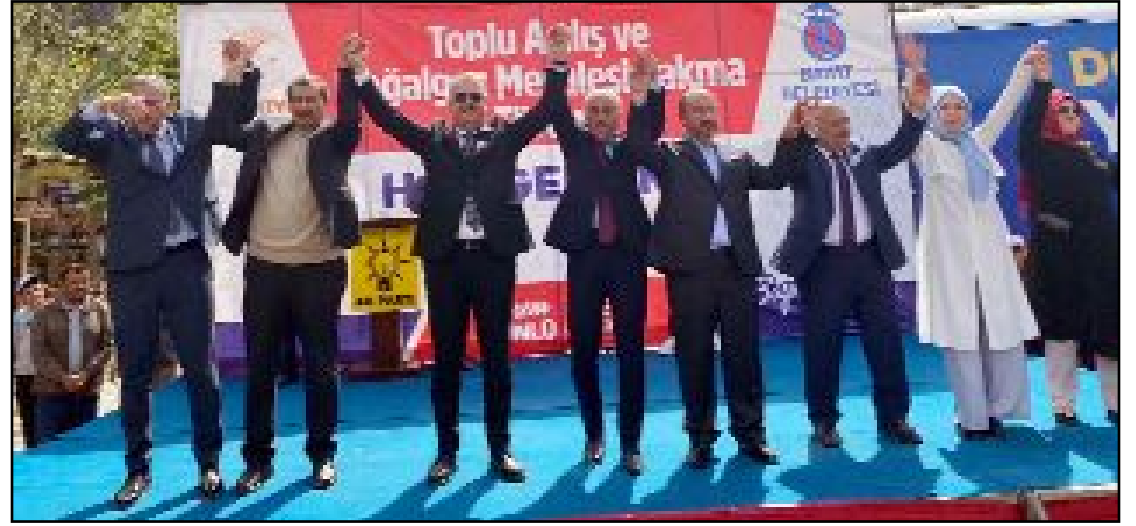
Bayat ve Uğurludağ ilçelerinde doğalgaz meşale yakma töreni düzenlendi.