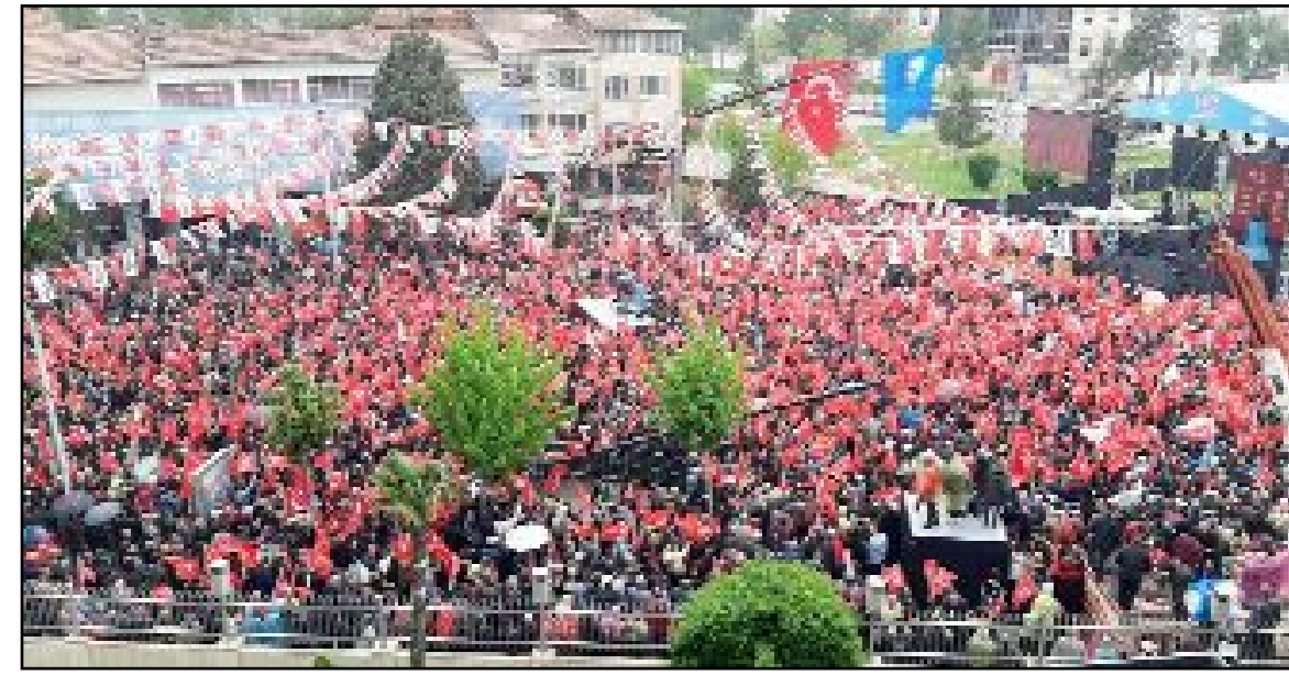
Havanın yağmurlu ve soğuk olmasına rağmen onbinlerce yurttaş Abide Meydanı'na akın etti.