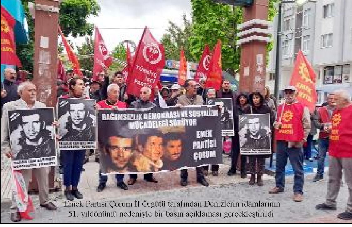
Emek Partisi Çorum İl Örgütü tarafından Denizlerin idamlarının 51. yıldönümü nedeniyle bir basın açıklaması gerçekleştirildi.

"Denizler bugün sağ olsalardı sınıfız sömürsüz bir dünya için mücadele etmeye devam edecekdilerdi" diyen Özünel, Denizlerin başlattığı mücadeleyi sürüyor, sürecektir. 14 Mayıs seçimleri bu çok yönlü ve kapsamlı mücadelenin bir parçasıdır. Tek adam rejimini sora edirecek hamle milyonlarca Denizlerden gelecek. Birleşe birleşe kazanacağız. Biz kazanacağız, emekçiler kazanacak." (Taner ŞİMŞEK)