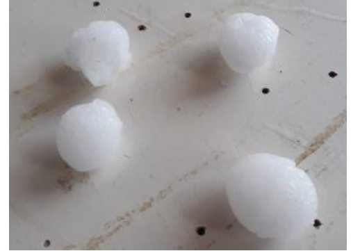
Sungurlu'da sel ve dolu, yerleşim yerlerinde ve tarım arazilerinde maddi hasara neden oldu.

Sungurlu'da sel ve dolu büyük hasara yol açtı