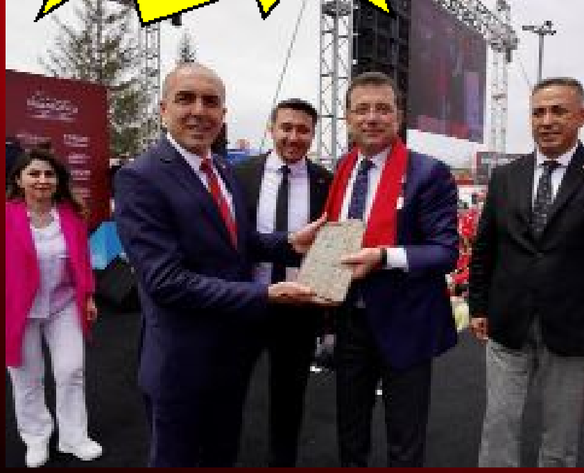
Ekrem İmamoğlu, Millet İttifakı'nın Çorum adayları ile bir arada görülüyor.

● Abide Meydanı'nda Çorumlulara seslenen İstanbul Büyükşehir Belediye Başkanı ve Millet İttifakı Cumhurbaşkanı Yardımcısı Ekrem İmamoğlu, "Yoksullukla mücadele edeceğiz dediler, Türkiye'yi yoksulluğun içine gömdüler. 21 yıl önce Türkiye ekonomik gelişmişlikte 16. sıradaydı. Şu anda 21. sıradayız. Geriye doğru gidiyoruz. Ne huzur kaldı ne de geleceğe güven kaldı" diyerek, AKP iktidarına yüklendi. •8-9'da