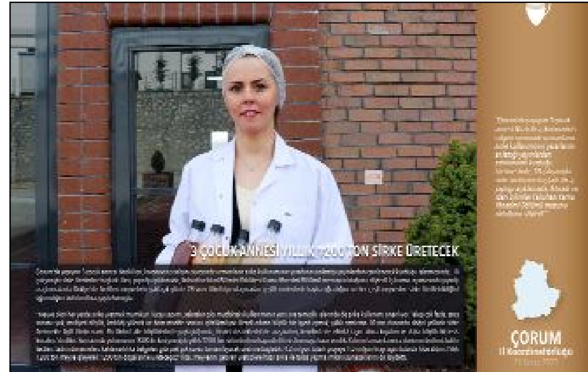
Bültende, Çorum'daki sirke fabrikası projesi bu şekilde tanıtıldı.

letvekili seçilmesi halinde iletilen tüm sorunları olduğu gibi emeklilerin taleplerinin yerine getirilmesi için de çaba göstereceğini söyledi. Emeklilerin ülkede yaşanan ekonomik sıkıntılarda etkilenen kesimlerden biri olduğunu altını çizen Kayırcı, son zamanlarda hükümetin emeklilere yönelik iyileştirmeler yaptığını hatırlatarak, hala da bir takım eksiklikler ve dengesizlikler olduğunu, bunların giderilmesi için de 14 Mayıs seçimlerinden sonra bir takım adımlar atılacağına inandığını vurguladı. (Volkan SINAYUÇ)