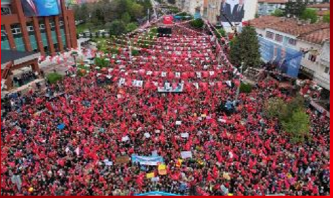
İstanbul Büyükşehir Belediye Başkanı ve Millet İttifakı Cumhurbaşkanı Yardımcısı Ekrem İmamoğlu, Çorum halkı ile kucaklaştı. İmamoğlu, Abide Meydanı'nı hinca hinç dolduran Çorumlulara hitap etti.

● Abide Meydanı'nda Çorumlulara seslenen İstanbul Büyükşehir Belediye Başkanı ve Millet İttifakı Cumhurbaşkanı Yardımcısı Ekrem İmamoğlu, "Yoksullukla mücadele edeceğiz dediler, Türkiye'yi yoksulluğun içine gömdüler. 21 yıl önce Türkiye ekonomik gelişmişlikte 16. sıradaydı. Şu anda 21. sıradayız. Geriye doğru gidiyoruz. Ne huzur kaldı ne de geleceğe güven kaldı" diyerek, AKP iktidarına yüklendi. •8-9'da