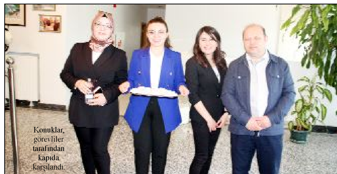
Konuklar, görevliler tarafından kapıda karşılandı.