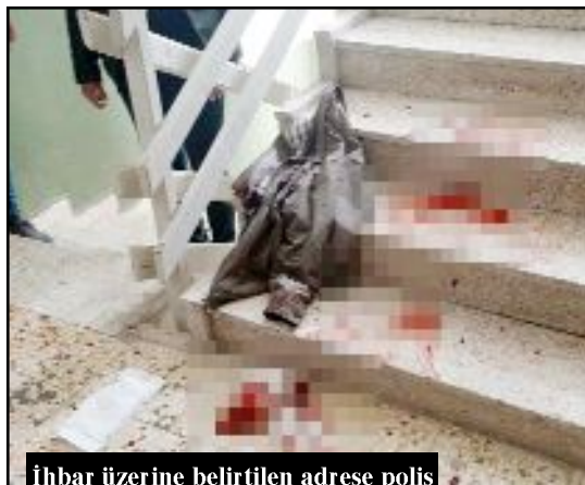
İhbar üzerine belirtilen adrese polis ve sağlık ekipleri sevk edildi.