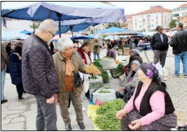
Cumartesi Pazarı'nda satış yapan bir kadın, CHP İl Kadın Kolları Başkanı Kamile Anar'dan Cumhurbaşkanı Adayı Kemal Kılıçdaroğlu için "üzerlik otu" gönderdi.