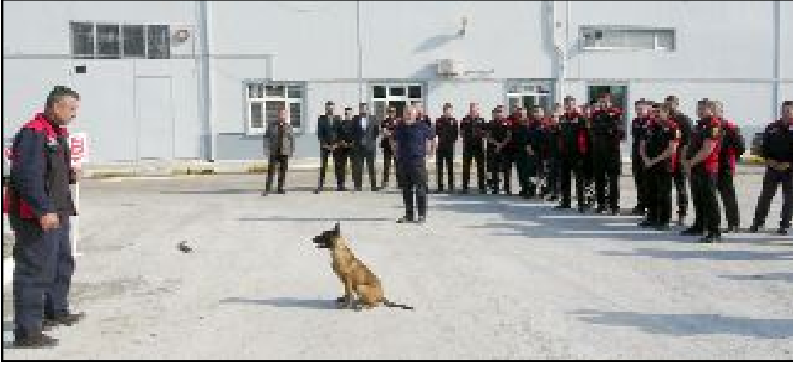
6 Şubat'taki depremlerin ardından afet bölgesinde görev alan ekiplerin arama kurtarma köpeği talep etmesi üzerine İtfaiye Müdürlüğü bünyesinde Köpek Eğitim Merkezi oluşturuldu.

"Çorum Belediyesi olarak olası deprem için hem şehrimizde hem de ülkemizde başkaca hazırlıklar da yapıyoruz. Üç farklı konteyner hazırladık. İtfaiye biramızın da dışında olmak üzere göreve hazır bekliyor. Her türlü ekipman altyapımızı da geliştirdik. Birçok ilave ekipman aldık. Çorum Belediyesi olarak arama kurtarma ekiplelerimiz ve itfaiyemizle görev yapacağız." (AA)