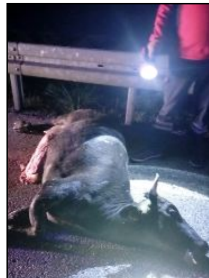
Büyükbaş hayvana önce TIR, sonra otomobilin çarpışması sonucu meydana gelen trafik kazasında 4 kişi yaralandı.