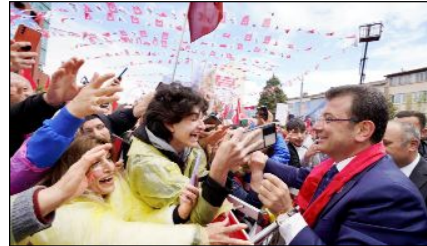
İmamoğlu, iktidar mensuplarının toplumu kutuplaştıran söylemlere son vermesi gerektiğini söyledi.

Kavgacı, bağırıp çağıran, doktorundan mühendisine herkesi azarlayan bu dil, bu millette yakışıyor mu? Düşmanlaştırmadan siyaset yapılmaz mı? Allah aşkına insanları ayırmasın, Sana oy veren-vermeyen ayrımı yapma. Bu insanları inançlarına, menşelerine, etnik kökenle ayırmaya hep birlikte son verelim. Kalbimizde sevgi olsun" dedi.