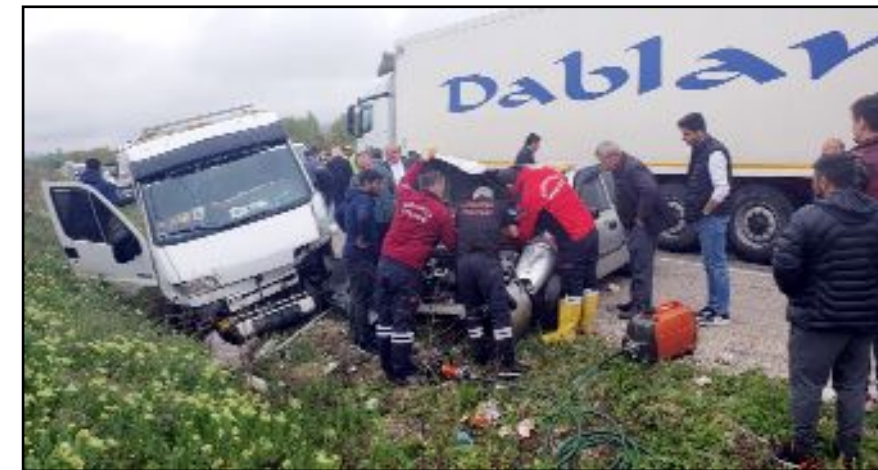
Kısa sürede kaza yerine gelen Sungurlu Belediyesi İtfaiye ekipleri yaralıları sıkıştığı yerden çıkarttı.

nirken, uzun araç kuyruğu oluştu. Araçların kaldırılmasından sonra trafik tekrar açıldı. (İHA)