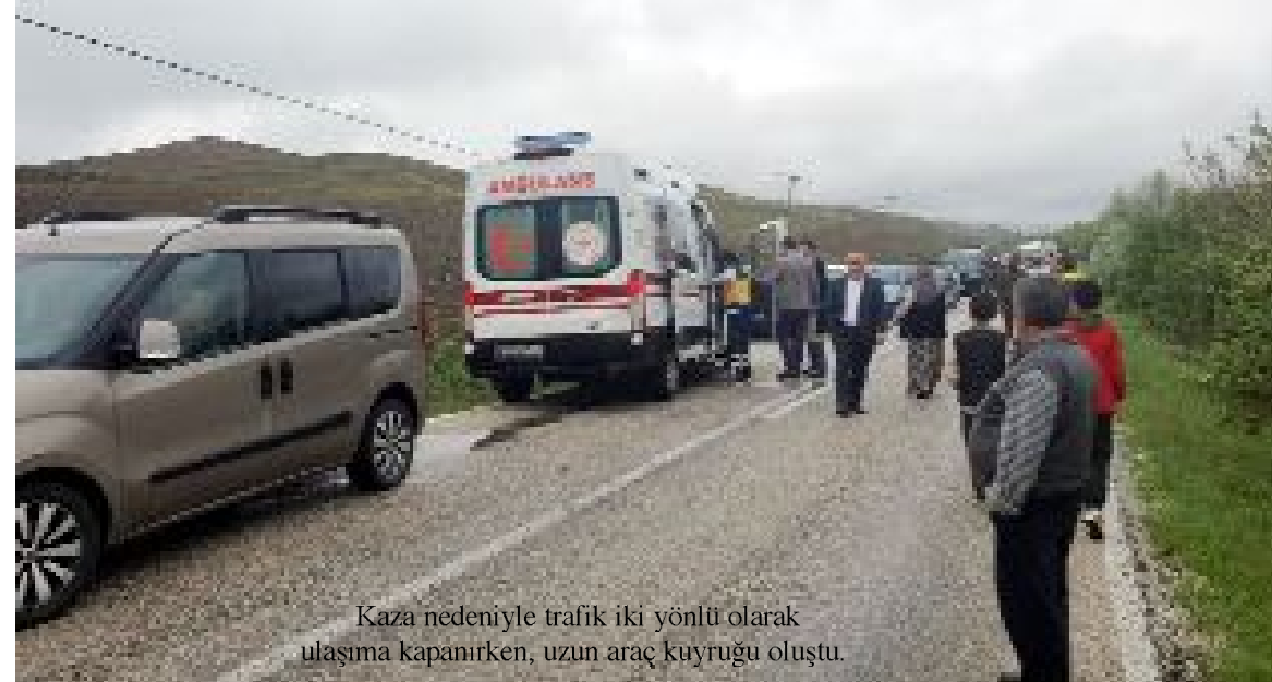
Kaza nedeniyle trafik iki yönlü olarak ulaşıma kapanırken, uzun araç kuyruğu oluştu.