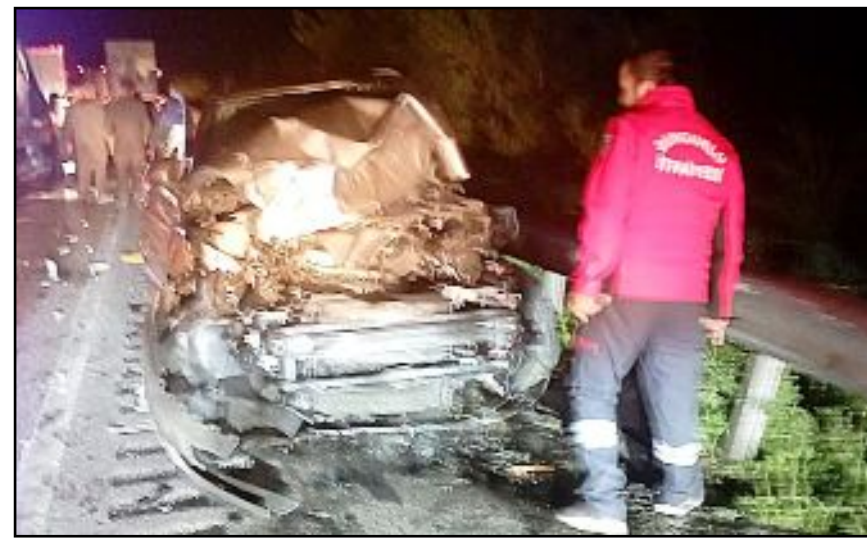
Kaza, Sungurlu-Çorum yolunda meydana geldi.