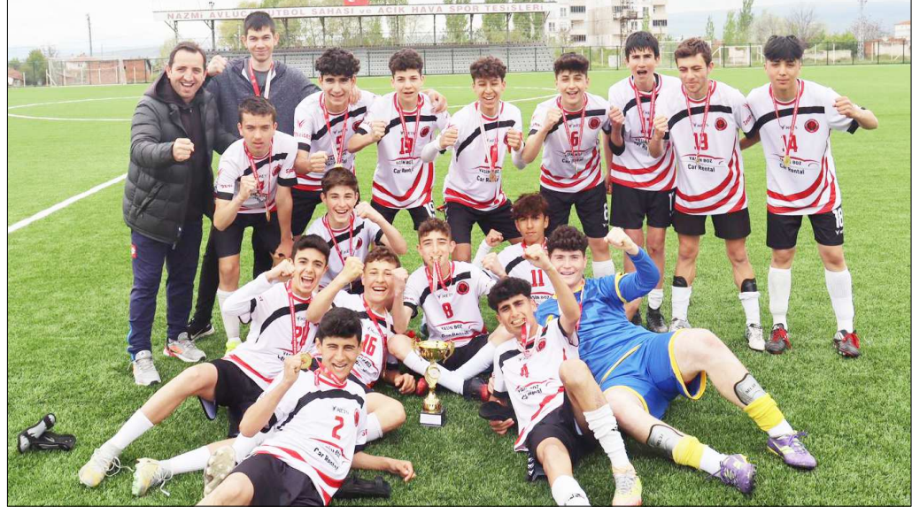
Spor Lisesi şampiyonluğu bu fotoğrafla kutladı.

Son maçların ardından düzenlenen törenle dereceye giren okullara kupaları verildi. (Rifat KARA)