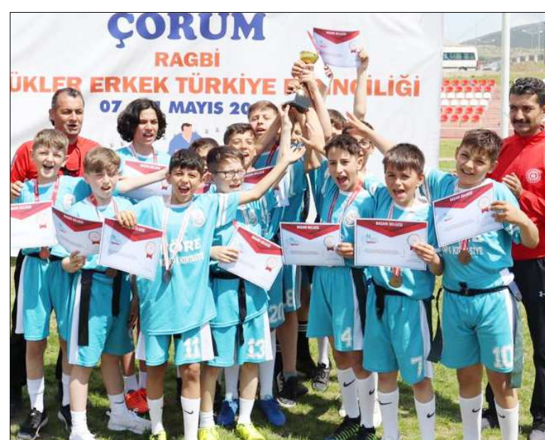
Dereceye giren okullar kupa ile ödüllendirildi.