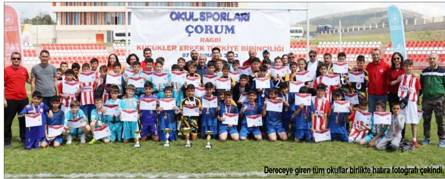
Dereceye giren tüm okullar birlikte hatıra fotoğrafı çekindi.