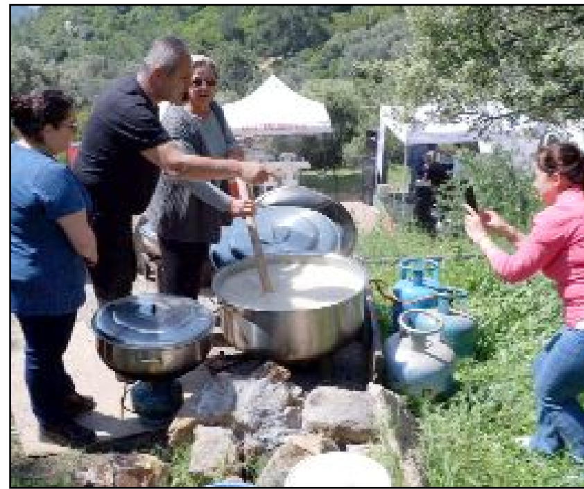
Keşkek kazanı kaynıyor...