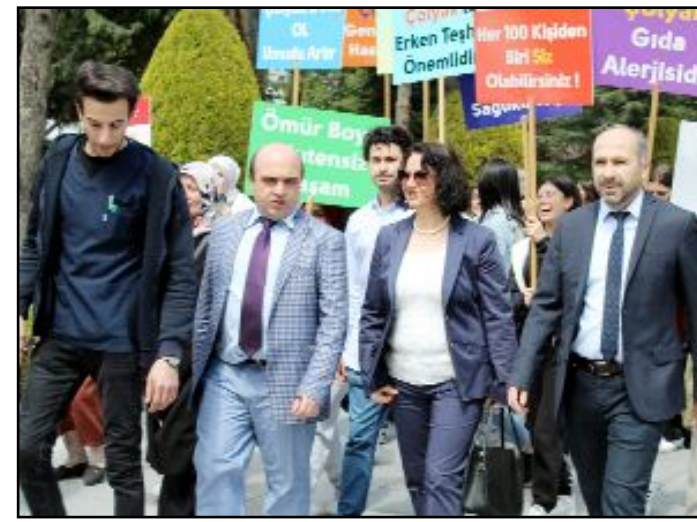
Çorum Çölyak Derneği tarafından 9 Mayıs Dünya Çölyak Günü kapsamında çeşitli etkinlikler düzenlendi. İlk etkinlik Valilik önünden Saat Kulesi'ne kadar yürüyüşle gerçekleştirildi.