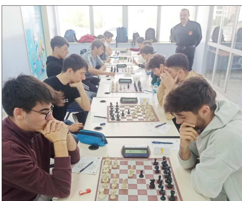
Necip Fazıl Kısakürek Ortaokulu'nda gerçekleşen müsabakalardan fotoğraf...

Çorum şampiyonu Mustafa Kemal Ortaokulu Spor Kulübü önümüzdeki aylarda yapılacak olan gruplarda Çorum'u temsil etmeye hak kazandı. (Bülent USLU)