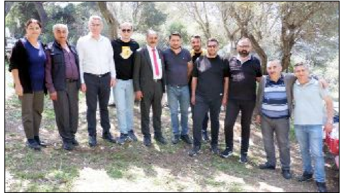
Yamanlar Piknik Alanı'nda Çorumlular keşkek etkinliğine öncülük edenler...