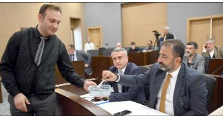
Çorum Belediye Meclisi'nin Mayıs ayı toplantısında 2022 yılı bütçesinin kesin hesabı görüşülerek onaylandı.

toplam 1 milyar 14 milyon liralık gider ve 955 milyon 505 bin lira gelir elde ettiklerini açıkladı. Gelir ve gider kalemleri hakkında Meclis