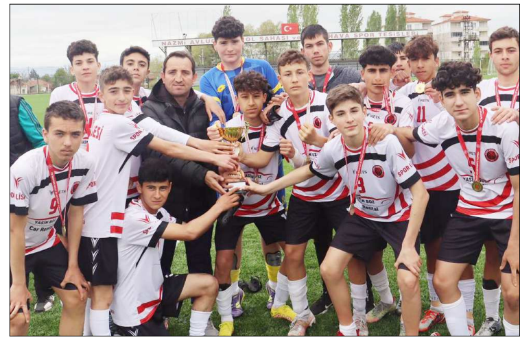
Spor Lisesi şampiyonluk kupasını böyle aldı.