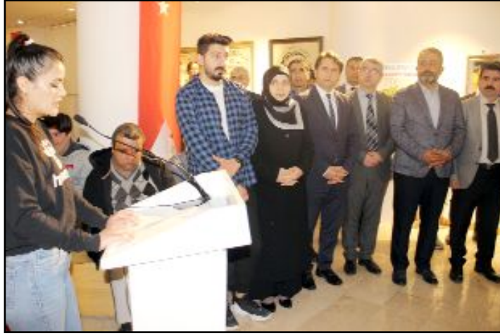
Engelliler Haftası etkinlikleri kapsamında düzenlenen "Geleneksel Keçe Sanatı" sergisi ilgi gördü.