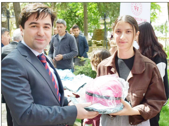
Turu tamamlayan sporcular ödüllendirildi.