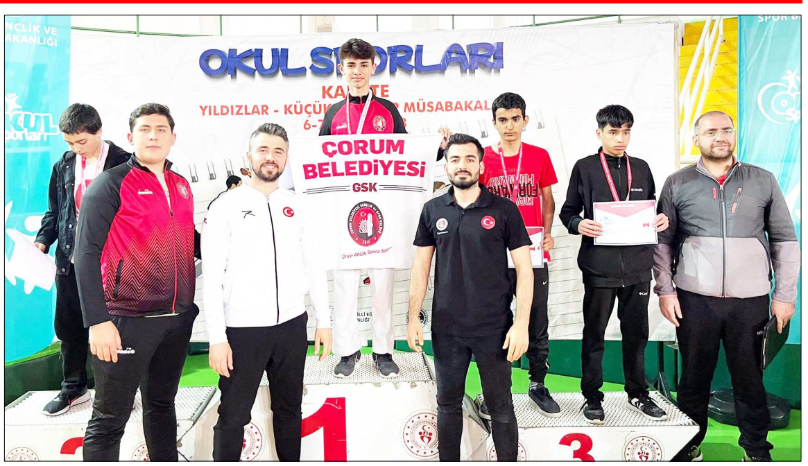
Sikletlerinde dereceye giren sporculara başarı belgesi takdim edildi.