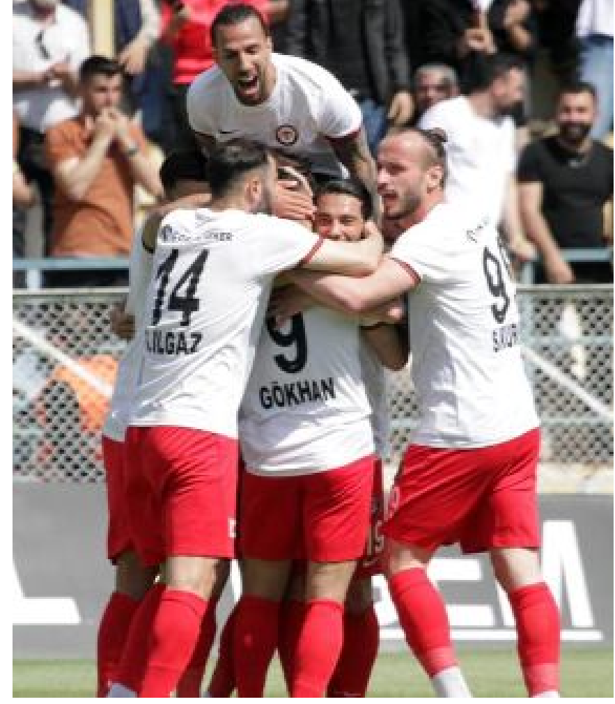
Çorum FK, son 14 lig maçında gol atmaya başardı.

En son deplasmanda Menemen FK ile 1-1 berabere kalan Çorum FK, üst üste 14.maçında da gol atma başarısı gösterdi. Kırmızı-siyahlı takım, bu alanda 22 maçla 2017-2018 Sezonuna ait olan rekorun ardından en uzun ikinci seriyeye imza attı.