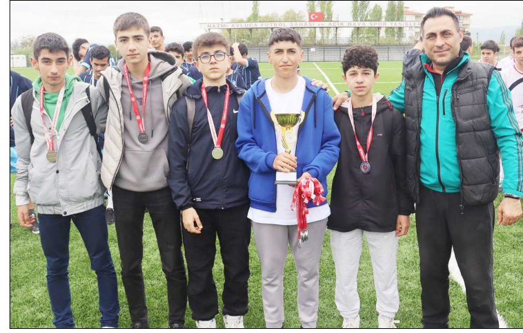
Mehmetçik Anadolu Lisesi 3 puanla il ikincisi oldu.