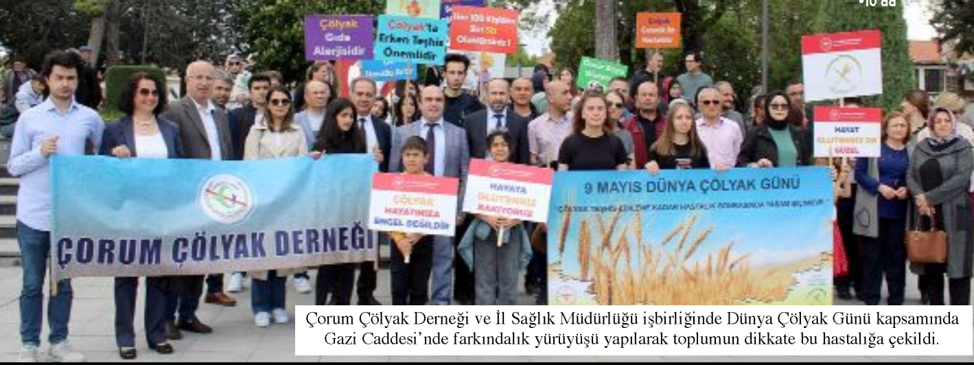
Çorum Çölyak Derneği ve İl Sağlık Müdürlüğü işbirliğinde Dünya Çölyak Günü kapsamında Gazi Caddesi'nde farkındalık yürüyüşü yapılarak toplumun dikkate bu hastalığa çekildi.