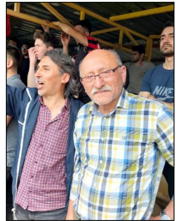
Menemen Stadi'nda Çorumspor taraftarları...