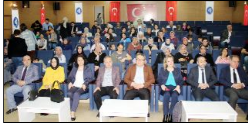
"Depremde çölyaklılarla gönül köprüsü" temalı etkinlikte glutensiz gıdaların normallere göre pahalı olduğu belirtildi.

lerini kullandı. Konuşmaların ardından 6 Şubat Kahramanmaraş merkezli depremlerin ardından bölgedeki çölyaklı depremzedeler için katkı sunan kamu kurumlarına ve kişilere "Teşekkür Belgesi" takdim edildi. (Nurdan AKBAŞ)