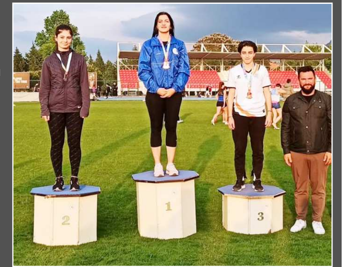
Hitit'li öğrenciler ödül kürsüsünde görülüyor...