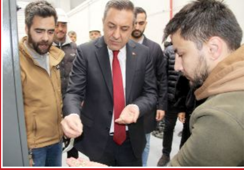
Milli Savunma Bakan Yardımcısı hemşehrimiz Muhsin Dere ve beraberindekiler, test üretimine başlayan kapsül fabrikasında inceleme yaptı.

● Sungurlu OSB'de Makine ve Kimya Endüstrisi (MKE) AŞ koordinatörlüğünde özel şirketler tarafından inşası tamamlanma aşamasına gelen barut, fişek ve kapsül üretim tesislerinde, deneme üretiminin başlaması nedeniyle tören düzenlendi. •3'de