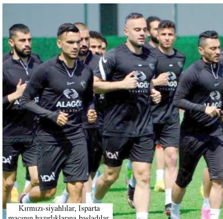
Kırmızı-siyahlılar, Isparta maçının hazırlıklarına başladılar.