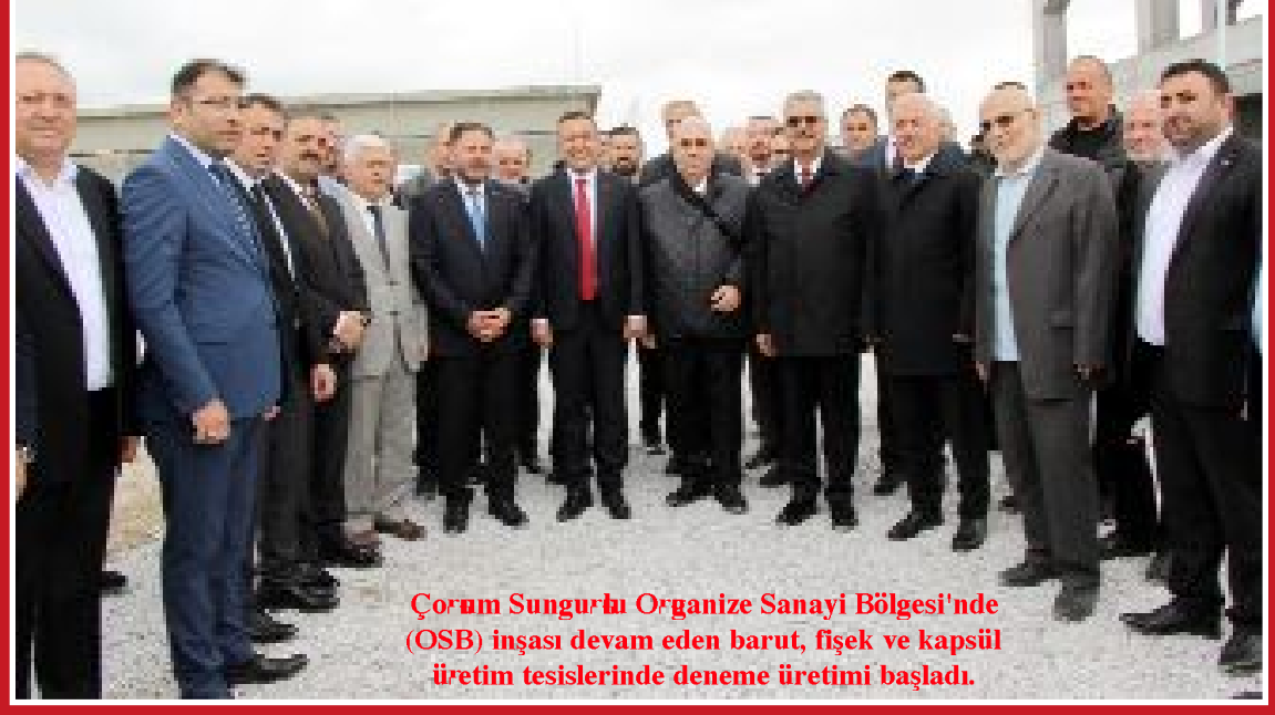
Çorum Sungurlu Organize Sanayi Bölgesi'nde (OSB) inşası devam eden barut, fişek ve kapsül üretim tesislerinde deneme üretimi başladı.

● Sungurlu OSB'de Makine ve Kimya Endüstrisi (MKE) AŞ koordinatörlüğünde özel şirketler tarafından inşası tamamlanma aşamasına gelen barut, fişek ve kapsül üretim tesislerinde, deneme üretiminin başlaması nedeniyle tören düzenlendi. •3'de