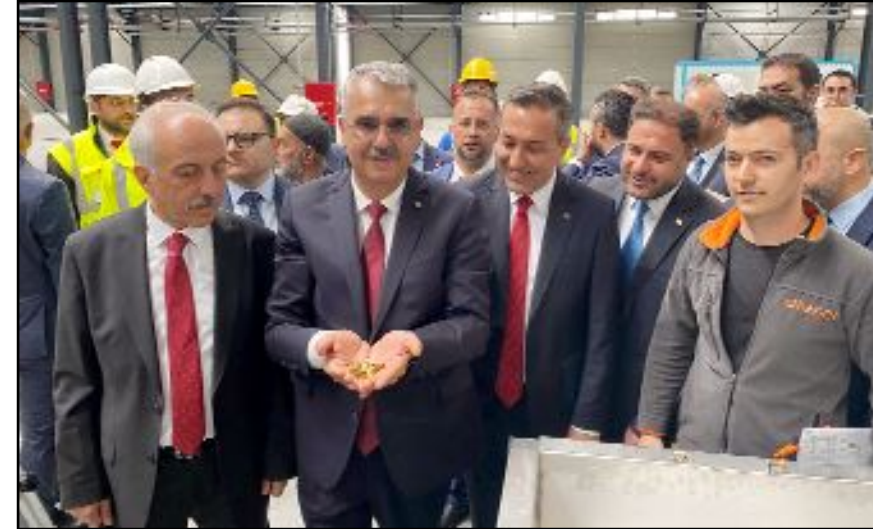
Fabrikaların seri üretime yaz aylarında geçeceği bildirildi.