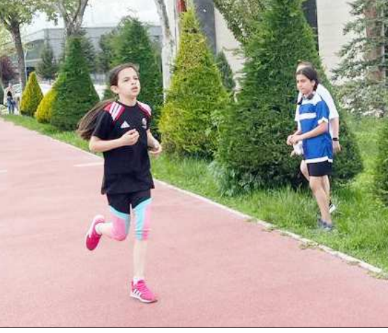
Fuar Alanı Koşu Pisti'nde yapılan yarışlardan fotoğraf...