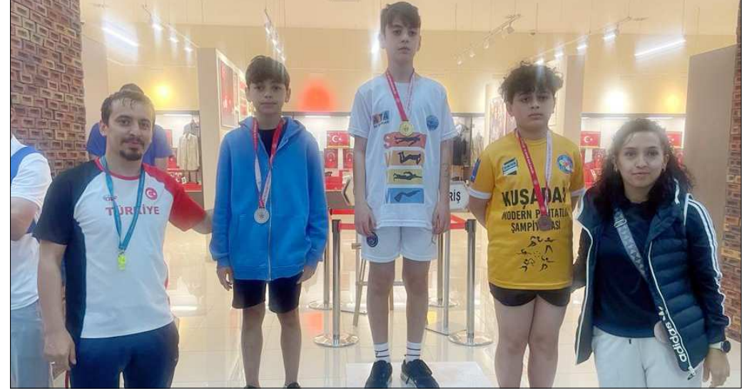
Minikler kategorisi hariç diğer kategorilerde ilk 4'e giren sporcular Nevşehir'de Çorum'u temsil edecekler.

Müsabakalar sonunda dereceye giren sporculara madalyaları verilirken, minikler kategorisi hariç diğer 3 kategoride ilk 4'e giren sporcular 21 Mayıs'ta Nevşehir'de düzenlenecek olan grup birinciliğinde Çorum'u temsil etme hakkı kazandılar. (Rifat KARA)