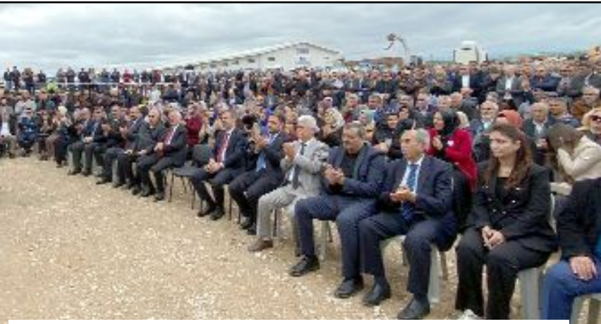
Sungurlu OSB'de tamamlanma aşamasına gelen barut, fişek ve kapsül üretim tesislerinde, deneme üretiminin başlaması nedeniyle tören düzenlendi.