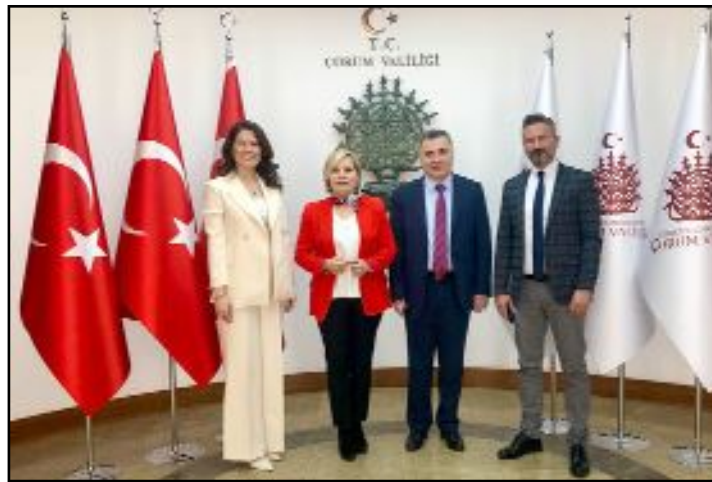
Çorum Eczacı Odası tarafından 14 Mayıs Eczacılık Haftası nedeniyle il protokolüne ziyaretler düzenlendi.

Çorum Valiliği'nce yapılan açıklamaya göre, 1 adet tabanca, 1 adet şarjör, 97 adet MKE menşeli fişek, 18 adet av tüfeği fişegi, 1.45 gr metamfetamin maddesi, 1 adet cam pipet, 4 adet galara sentetik ecza, 4 adet Extacsy sentetik ecza maddesi ele geçirilirken, olayla ilgili 2 şüpheli şahıs gözaltına alınarak, yapılan işlemleri neticesi adli birimlere sevk edildi. (Haber Merkezi)