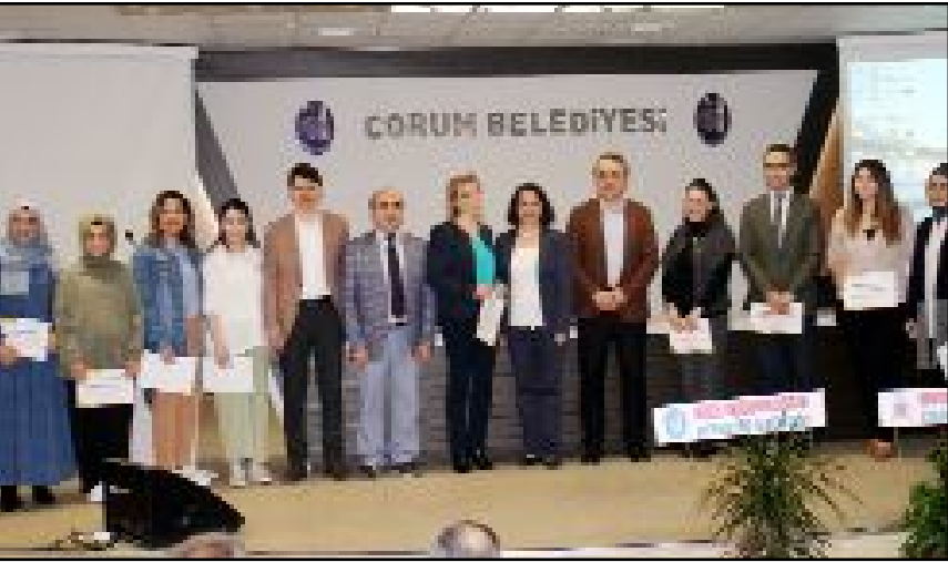
Turgut Özal İş Merkezi'ndeki etkinlikte hastaara özel gıda ulaştırılmasını sağlayan gönüllülere teşekkür edildi.