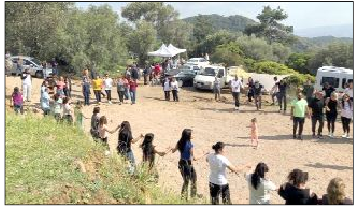
Çorumlular coşkuyla halay çektiler...