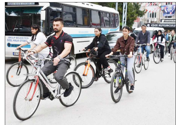
Bisiklet turu etkinliğinden fotoğraf...