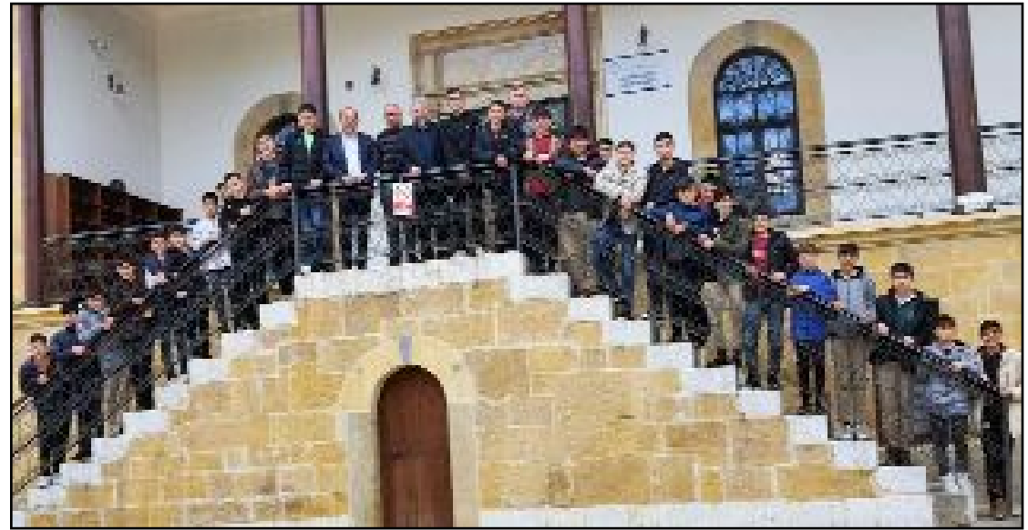
Öğrenciler Ramazan ayı etkinlikleri kapsamında Hıdırlık'a giderek buradaki sahabe kabirlerini ziyaret edip dua etti.