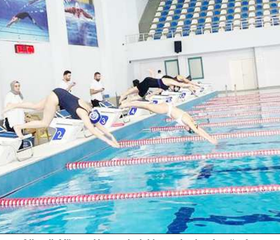
Olimpiyat Yüzme Havuzu'ndaki yarışlardan fotoğraf...