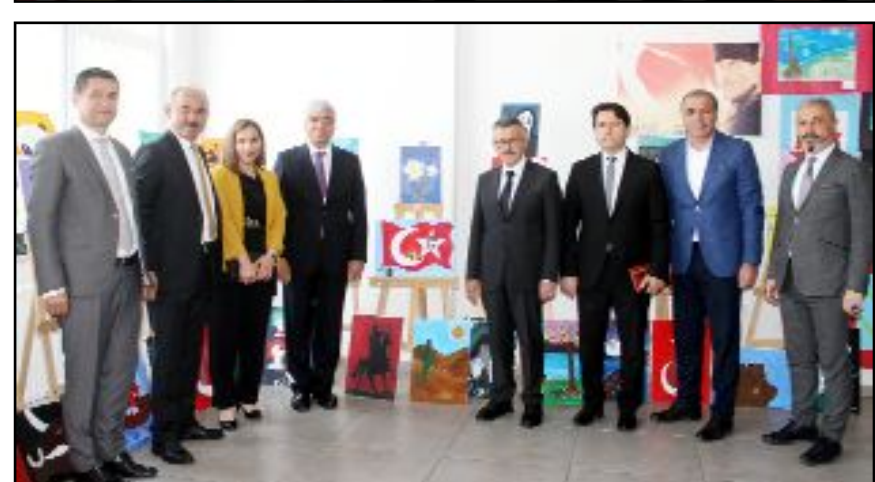
Hacı Bektaş Veli Ortaokulu öğrencilerinin teknoloji tasarım ve görsel sanatlar eserleri büyük beğeni topladı.