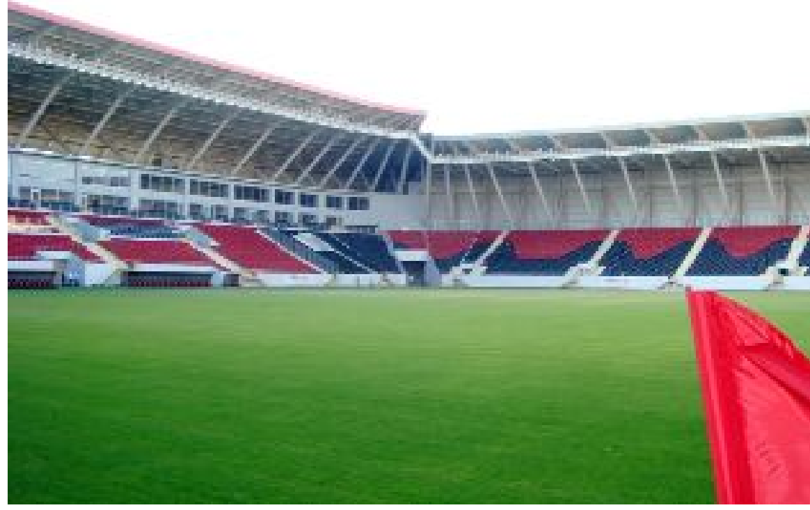
2020 yılında hizmete açılan 15 bin seyirci kapasiteli Çorum Şehir Stadyumu'nun 1.Lig maçlarına hazırlanması lazım.