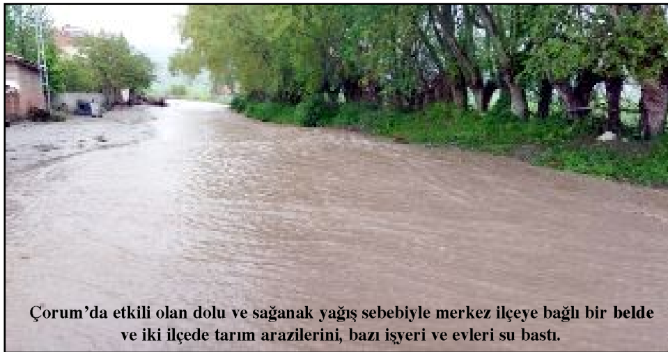
Çorum'da etkili olan dolu ve sağanak yağış sebebiyle merkez ilçeye bağlı bir belde ve iki ilçede tarım arazilerini, bazı işyeri ve evleri su bastı.

Sungurlu ilçesine bağlı Kula köyünde etkili olan sağanak yağış, ev, depo ve tarım arazilerine zarar verdi. İlçenin en uzak yerleşim yeri olan Kula köyünde Kızırmak taştı. Bir ev ile iki ahır, üç depo tahıl ve ekili arazilerini su bastı. Bazı yollar da tahribatla kapandı. Sungurlu Belediyesi ekipleri zararın giderilmesi için çalışma başlattı.