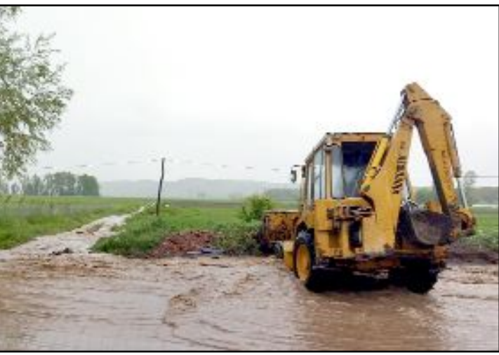
Düvenci'de Belediye ekipleri yağışın ardından çalışma başlattı.