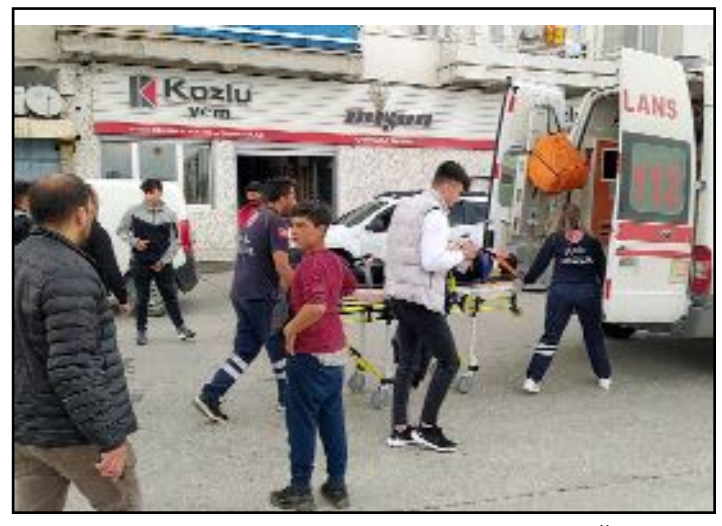
Yaralı motosiklet sürücüsü tedavi edilmek üzere Hitit Üniversitesi Erol Olçok Eğitim ve Araştırma Hastanesi'ne kaldırıldı.