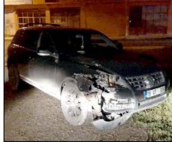
Kaza, Cengiztopel Caddesi'nde meydana geldi.

yerinden kaçan ve aracı Kale Mahallesi Milönü 2. Çıkamaz Sokak'ta terk eden sürücünün bulunması için çalışma başlatıldı. (Tugay GÖKTÜRK)