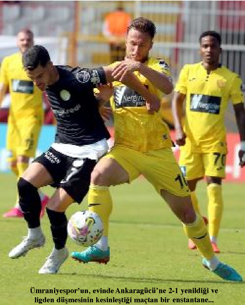
Ümraniyespor'un, evinde Ankaragücü'ne 2-1 yenildiği ve ligden düşmesinin kesinleştiği maçtan bir anstantane...