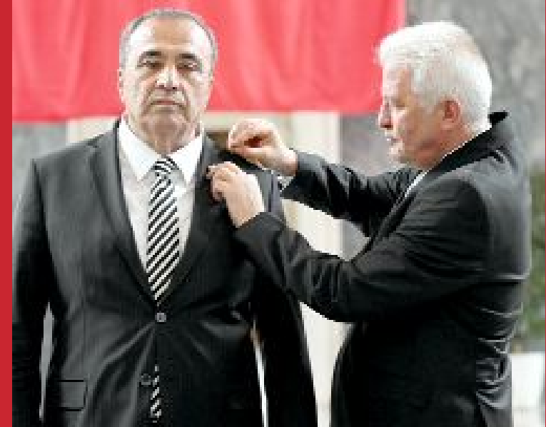
MHP Çorum Milletvekili Vahit Kayırcı, TBMM'de kaydını yaptırdı.