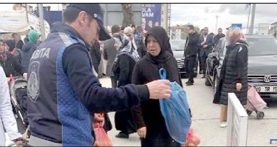
Semt pazarlarında gerçekleştirilen denetimlerde, vatandaşların satın aldığı ürünlerin eksik tartılıp tartılmadığı titizlikle kontrol ediliyor.

Yağbat, bu tür denetimlerin devam edeceğinin altını çizdi. (Haber Merkezi)