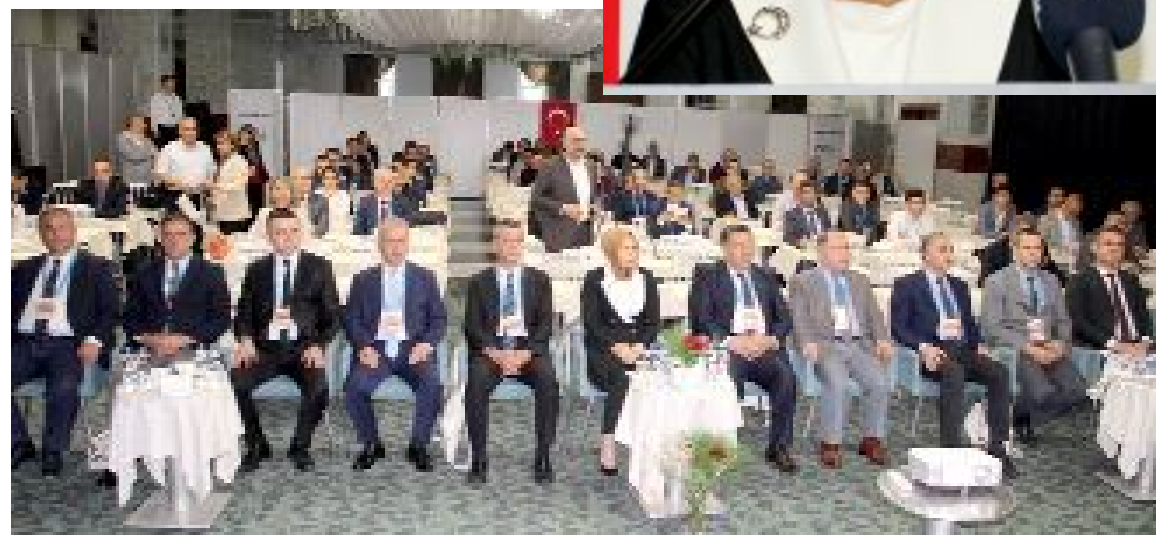
Tarım ve Orman Bakanlığı Su Yönetimi Genel Müdürlüğü tarafından hazırlanan "Yeşilirmak ve Batı Karadeniz Havzaları Kuraklık Yönetim Planı"nın kapanış toplantısı Çorum'da gerçekleştirildi.