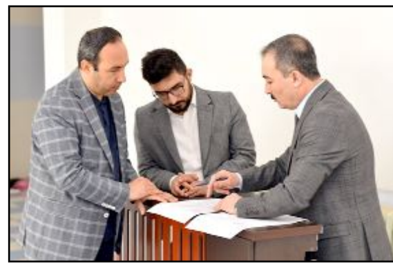
Eğitim yerleşkesinin eğitim öğretim yılında faaliyete geçirileceği öğrenildi.