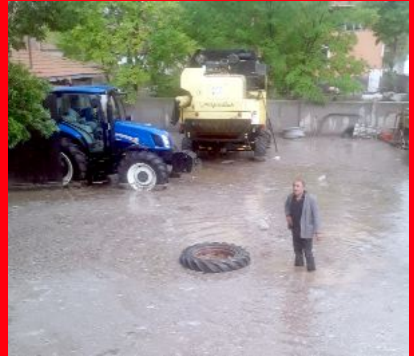
Çorum'da etkili olan dolu ve sağanak yağış sebebiyle merkez ilçeye bağlı bir belde ve iki ilçede tarım arazilerini, bazı işyeri ve evleri su bastı.