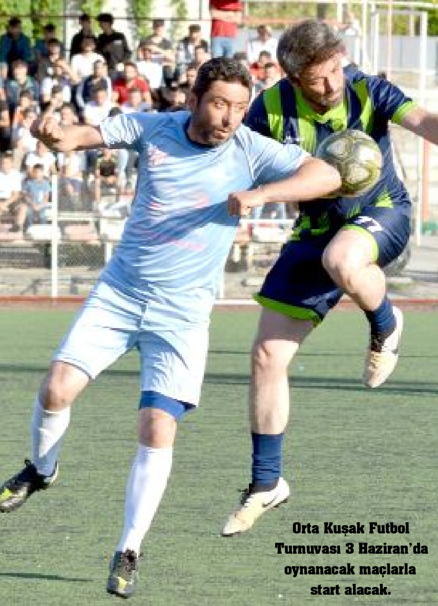
Orta Kuşak Futbol Turnuvası 3 Haziran'da oynanacak maçlarla start alacak.

Öte yandan, 3 grupta 20 takımın mücadele edeceği U12 Futbol Ligi'nde ilk hafta maçları 28 Mayıs Pazar günü oynanacak. (Bülent USLU)