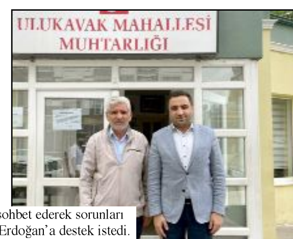
ULUKAVAK MAHALLESİ MUHTARLIĞI