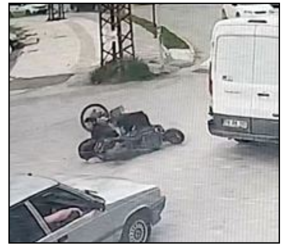
Kaza anı güvenlik kameralarına saniye saniye böyle yansdı.