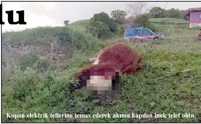
Kopan elektrik tellerine temas ederek akıma kapılan inek telef oldu.

Durumun ihbarı üzerine köye sevk edilen jandarma ekipleri olay ile ilgili inceleme başlattı. (Tugay GÖKTÜRK)