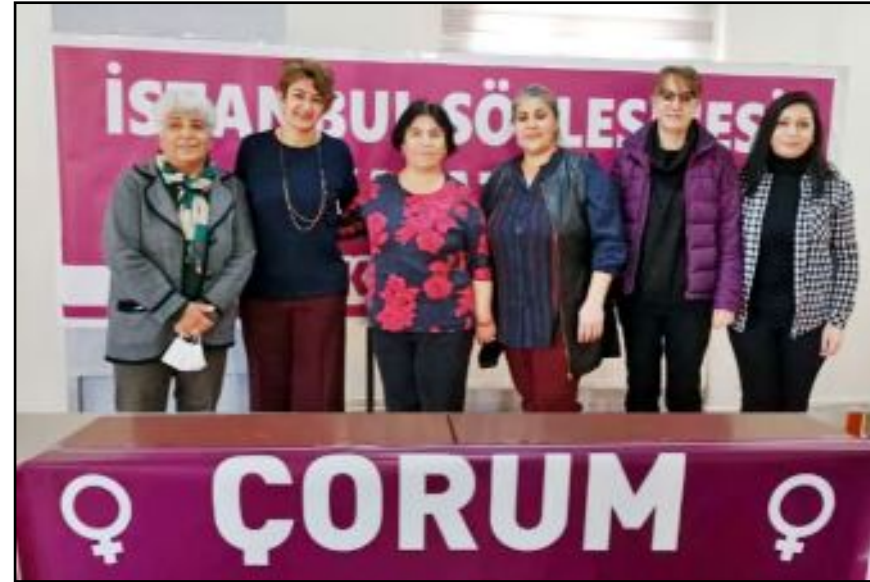
Çorum Kadın Platformu, Zonguldak'ın Çaycuma ilçesinde yaşanan iğrenç olaya tepki gösterdi.

şiddete, şiddeti her gün yeniden üreten dilimize, cezasızlığa, erkek adaletin iyi hal indirimlerine yeter demek için hayatlarımız, haklarımız ve çocuklarımız için tüm kadınlar olarak dimdik ayakta. Karanlığa boyun eğmeyeceğiz." (Haber Merkezi)