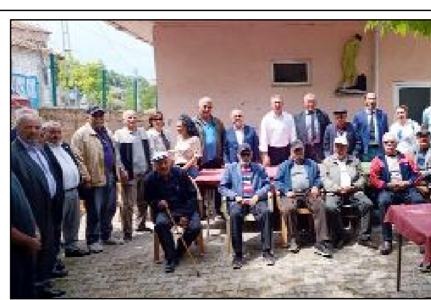
Cumhuriyet Halk Partisi Çorum Milletvekili Mehmet Tahtasız, Osmancık'ın Öbektaş, Çampınar ve Sütlüce köylerini ziyaret etti.