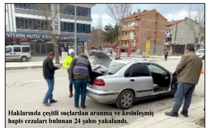
Haklarında çeşitli suçlardan aranma ve kesinleşmiş hapis cezaları bulunan 24 şahıs yakalandı.

Asayiş Şube Müdürlüğü'ne bağlı Aranan Şahıslar Büro Amirliği ekipleri tarafından 15-22 Mayıs tarihleri arasında yapılan çok uygulamalar ile şüpheli ve ihbar üzerine yapılan çalışmalar sonucunda haklarında çeşitli suçlardan aranma ve kesinleşmiş hapis cezaları bulunan 24 şahıs yakalanarak, haklarında adli işlem başlatıldı. Haklarında kayıp olduklarına dair müracaatta bulunulan 9 şahıstan 5'i kadın, 2'si erkek 7 kişi de ekipler tarafından bulundu. (İHA)