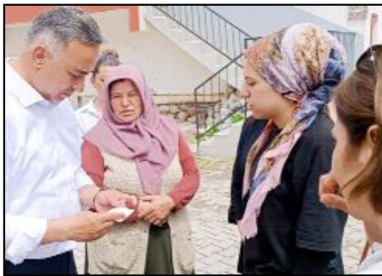
Cumhurbaşkanlığı 2. Tur seçimlerinde Cumhurbaşkanı Adayı Kemal Kılıçdaroğlu'na destek isteyen Tahtasız, aydınlık bir Türkiye'yi birlikte inşa edebileceklerini vurguladı.