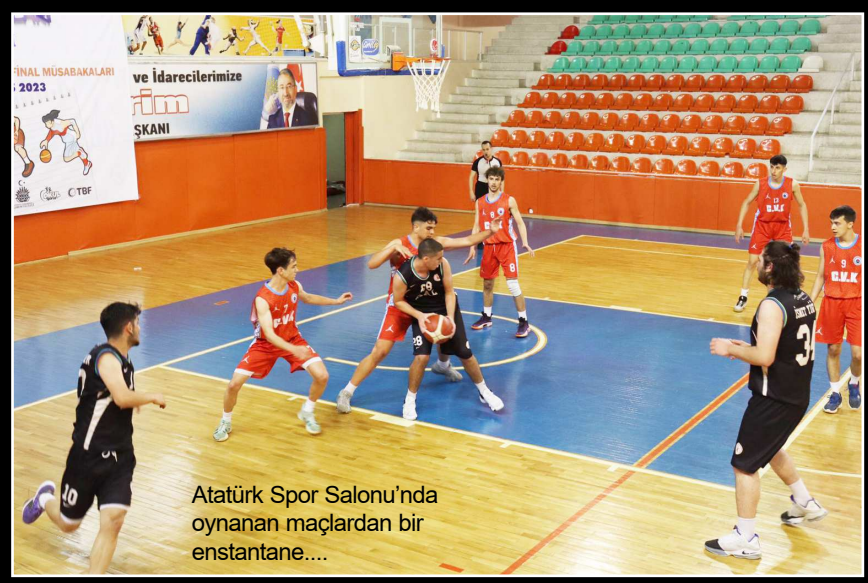
Atatürk Spor Salonu'nda oynanan maçlardan bir enstantane...