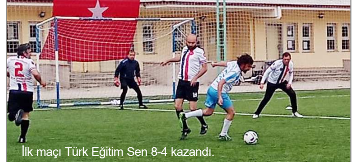
İlk maçı Türk Eğitim Sen 8-4 kazandı.