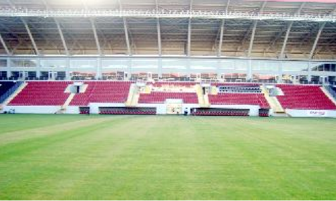
Protokol tribününde de köklü yenilik yapılması gerekiyor.

Mülkiyeti Gençlik ve Spor Bakanlığı'nda olan, Çorum FK tarafından maçlık kiralanmış Çorum Şehir Stadyumu'ndaki bakım, onarım ve yenileme çalışmalarına Gençlik ve Spor İl Müdürlüğü tarafından bir an evvel başlanması gerekiyor. (Hüseyin AŞKIN)