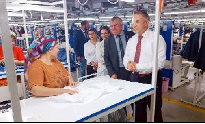
Milletvekili Tahtasız, 28 Mayıs Pazar günü yapılacak Cumhurbaşkanlığı seçimlerinde, işçileri sandığa davet ederek Cumhurbaşkanı Adayı Kemal Kılıçdaroğlu için destek istedi.