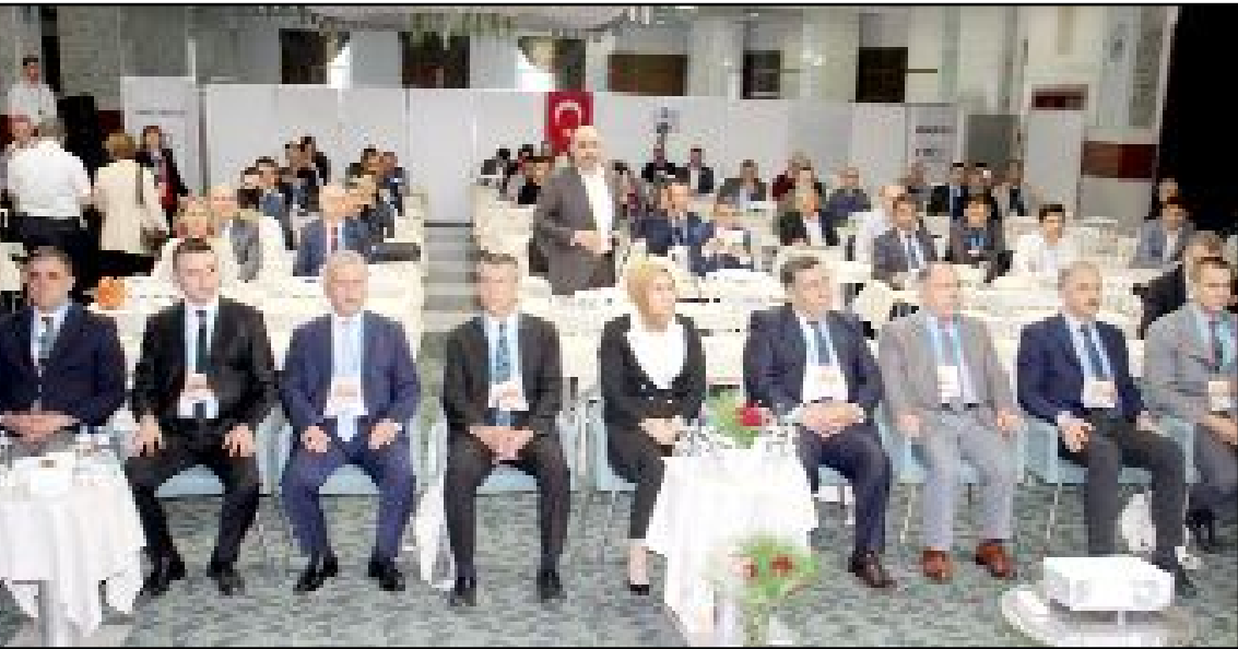
Tarım ve Orman Bakanlığı Su Yönetimi Genel Müdürlüğü tarafından hazırlanan “Yeşilirmak ve Batı Karadeniz Havzaları Kuraklık Yönetim Planı”nın kapanış toplantısı Çorum'da gerçekleştirildi.