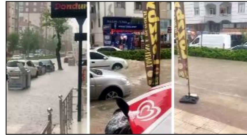
Sular altında kalan Bahabey Caddesi'nde araçlar ilerlemekte güçlük çekti.

Çorum'da önceki gün akşam saatlerinden itibaren etkisini gösteren sağanakte Baahabey Caddesi suyla doldu.