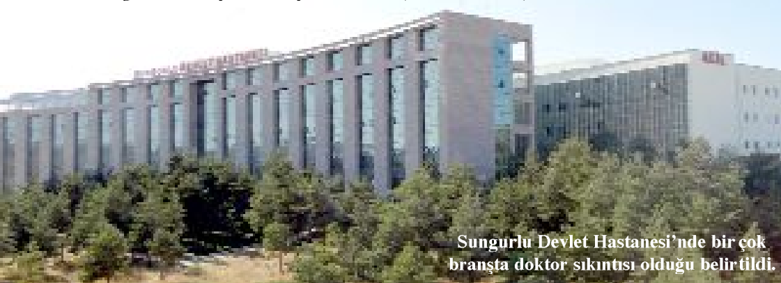
Sungurlu Devlet Hastanesi'nde bir çok branşta doktor sıkıntısı olduğu belirtildi.

sından dolayı yoğun ihtiyaca cevap veremiyor. Sağlık Bakanlığı'nın MHRS sisteminden randevu almak isteyen hastalar ise Sungurlu Devlet Hastanesi'nden ancak 2 hafta sonrasına gün alabildiklerini ifade ediyor. Hastanede Kulak Burun Boğaz ve Fizik tedavi uzmanının ise kısa sürede ilçeden ayrılacağı dile getiren vatandaşlar, yaşadıkları mağduriyetin sona erdirilmesi için Sungurlu ilçe yöneticilerinin ve milletvekillerinin bir an önce konuya el atmalarını istediler. (Haber Merkezi)