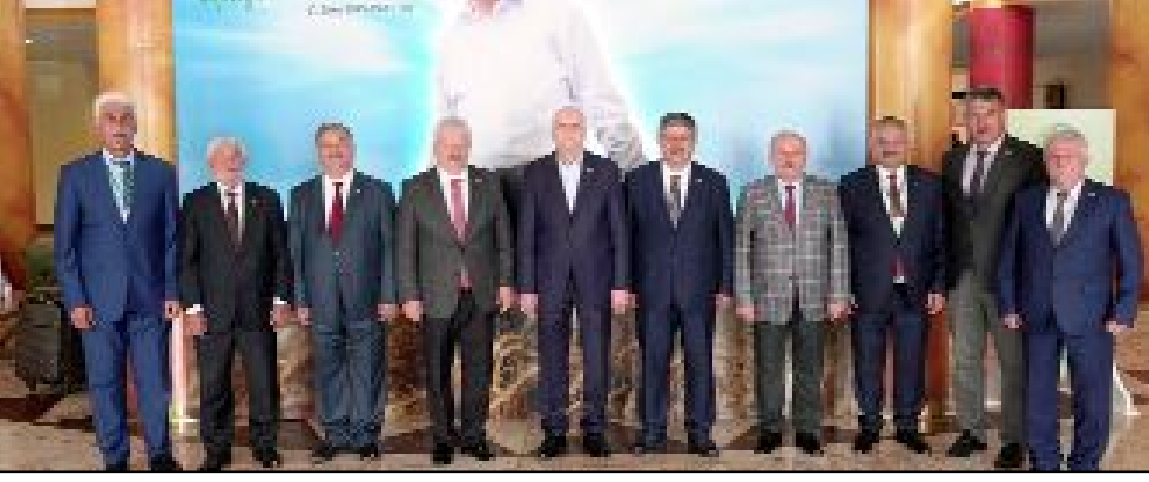
Türkiye Ziraat Odaları Birliği'nin 28.'nci olağan genel kurulu Ankara'da gerçekleştirildi.