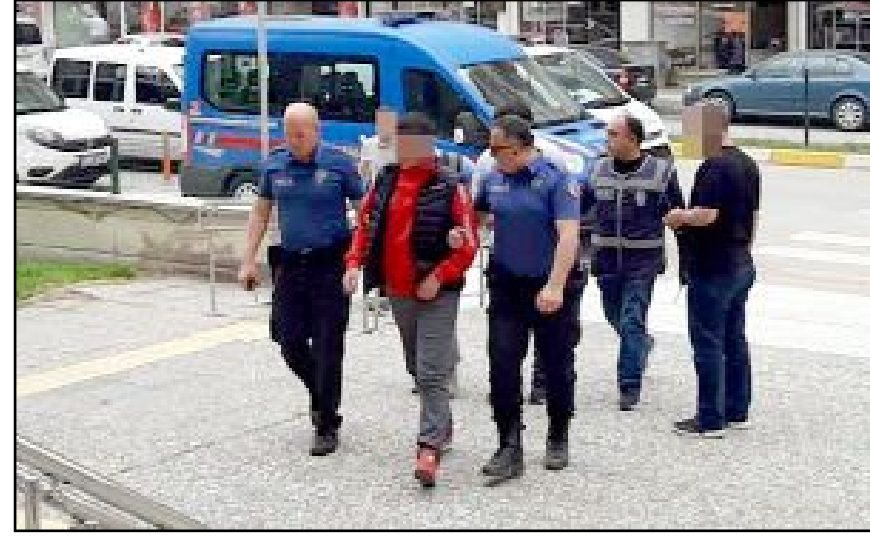
Saldırganı gerçekleştirdikleri iddiasıyla gözaltına alınan B.Ç. (17) ile E.S. (17), sevk edildikleri mahkemeye tutuklanarak cezaevine gönderildi.

Sağlık ekiplerince yapılan müdahalenin ardından Hitit Üniversitesi Erol Olçok Eğitim ve Araştırma Hastanesi'ne kaldırılarak ameliyata alınan S.S.'nin tedavisi yoğun bakımda devam ediyor. (Tugay GÖKTÜRK)