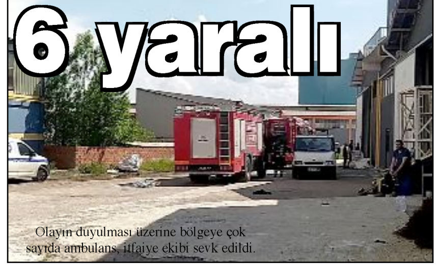
Olayın duyulması üzerine bölgeye çok sayıda ambulans, itfaiye ekibi sevk edildi.

Olayla ilgili başlatılan soruşturma sürüyor. (İHA)