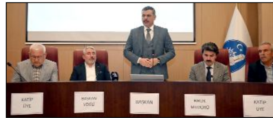
Çorum Sahipsiz Hayvanları Koruma Birliği Meclis Toplantısı, Vali Mustafa Çiftçi'nin başkanlığında, Çorum Belediyesi Meclis Salonunda yapıldı.

Şehri imar, inşa ve ihya etmek için aşkla çalıştıklarını dile getiren Başkan Aşgın, "Gücümüzü zorlayarak yetiştirdiğimiz her yere hizmet götürmeye çalışıyoruz. Tarihin ayağa kaldırılması noktasında başta tarihi ayakbaşılar arastası olmak üzere muazzam çalışmalarımız devam ediyor. Yakında 1100 yıllık mirasımız olan Çorum Kalemizin restorasyonu ile ilgili ihale sürecini de başlatıyoruz. Şehrimizi adım adım, santim santim güzelleştiriyoruz." diye konuştu. (Haber Merkezi)