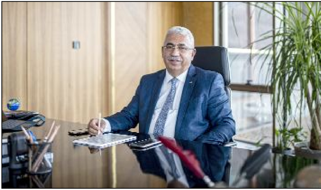
Ahlatcı Holding Yönetim Kurulu Başkanı

Ahlatcı Holding'in ADABANK'ı satın alarak bankacılık sektörüne adım atmış olması nedeniyle, Çorum'umuz adına büyük gurur ve mutluluk duyuyoruz.