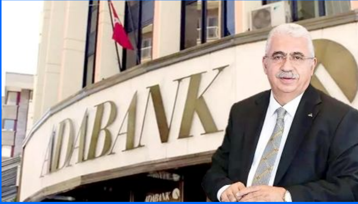
Ahlatcı Holding Yönetim Kurulu Başkanı

Ahlatcı Holding'in ADABANK'ı satın alarak bankacılık sektörüne adım atmış olması nedeniyle, Çorum'unuz adına büyük gurur ve mutluluk duyuyoruz.