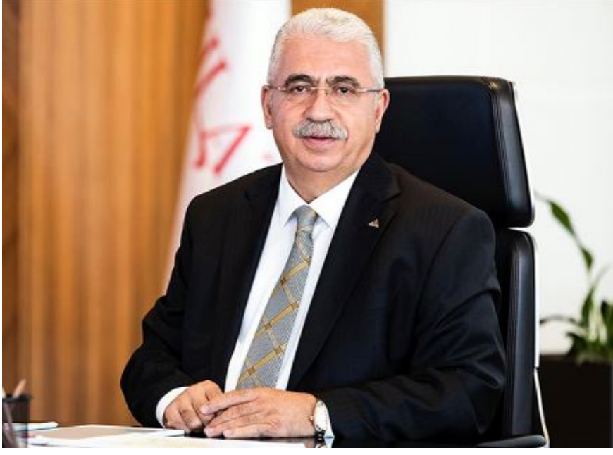
Ahlatcı Holding Yönetim Kurulu Başkanı

Ahlatcı Holding'in ADABANK'ı satın alarak bankacılık sektörüne adım atmış olması nedeniyle, Çorum'unuz adına büyük gurur ve mutluluk duyuyoruz.