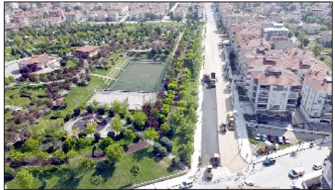
Çorum Belediyesi Fen İşleri Müdürlüğü'ne bağlı ekipler, dolgu ve mekanik serimi yapılan Kale Mahallesi içerisinde yer alan Hüyük Caddesi'nin asfaltına başladı.