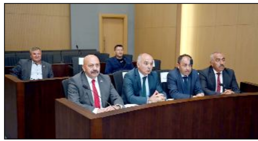
Birliğin ilk meclis toplantısında, Çorum Sahipsiz Hayvanları Koruma Birliği'nin çalışma şekli, işleyişi, logosu ve bütçesi görüşüldü.

2021 yılında başlatılan Birliğin Cumhurbaşkanı Recep Tayyip Erdoğan'ın imzasıyla hayata geçirildiğini hatırlatan Çiftçi, "Bugüne kadar birliğimizin örgütlenmesini tamamladık. Bu süreç içerisinde encümen toplantısı yaptık. Aldığımız kararlardan biri de bütçe ile ilgiliydi. Merkez ilçe ve ilçelerimizde 4 yer belirledik. Hayvanların bakımlarının yapılacağı, kısırlaştırılacağı doğal yaşam alanlarını tespit ettik. Meclis toplantısı ile birlikte bütçemiz teşekkül ettikten sonra hizmet alanı suretiyle Sahipsiz Sokak Hayvanlarının toplanıp, kısırlaştırılıp bakımının yapılması ve doğal yaşam alanları oluşturuluncaya kadar aldığımız yere bırakma şeklinde faaliyetlerimiz devam edecek." ifadelerini kullandı.