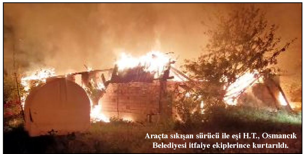
Araçta sıkışan sürücü ile eşi H.T., Osmancık Belediyesi itfaiye ekiplerince kurtarıldı.

Araçta sıkışan sürücü ile eşi H.T., Osmancık Belediyesi itfaiye ekiplerince kurtarıldı. Sağlık ekiplerince olay yerinde ilk müdahalesi yapılan yaralılar, ambulansla Dodurga Devlet Hastanesi'ne kaldırıldı. (AA)