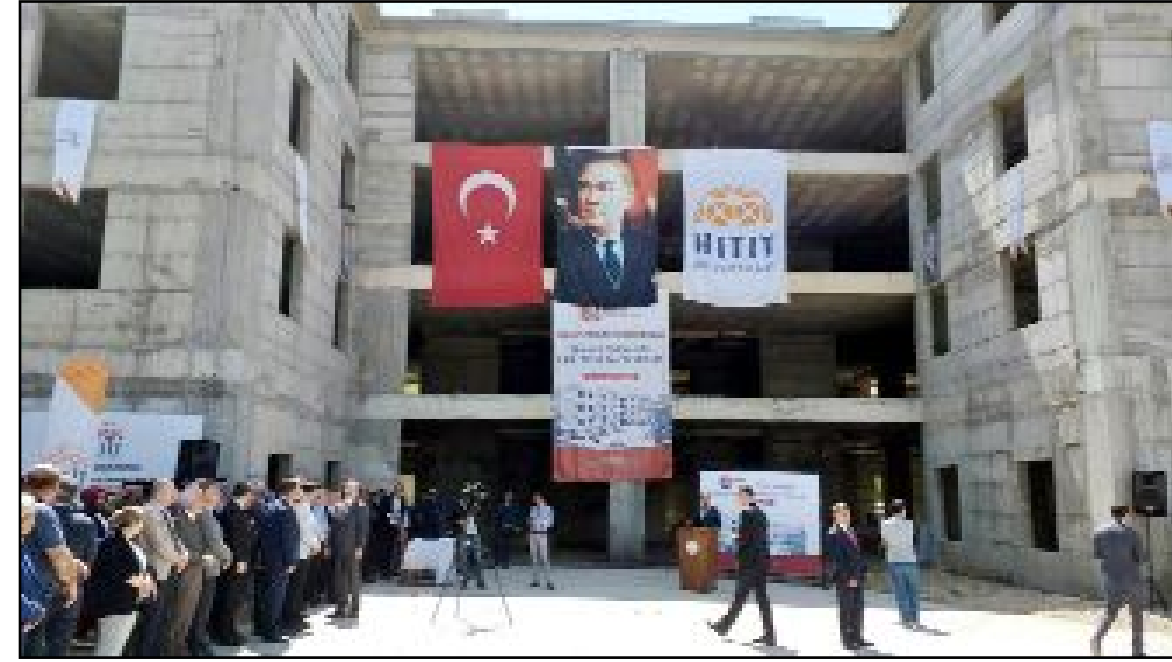
Protokol kapsamında işin 360 günde bitirileceği bildirildi.