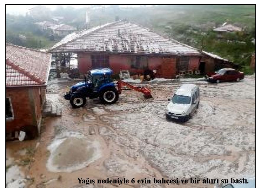
Yağış nedeniyle 6 evin bahçesi ve bir ahır su bastı.

Karaoğlu ayrıca köydeki bazı yollarla birlikte ayçiçeği, pancar, arpa ve buğday ekili tarım arazilerinin de yağıştan etkilendiğini bildirdi. (AA)