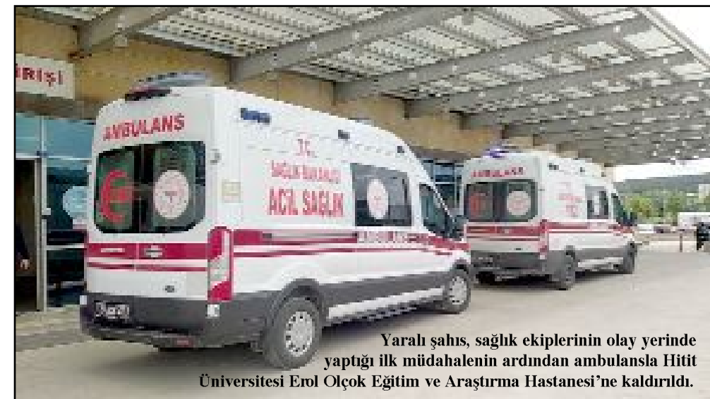
Yaralı şahıs, sağlık ekiplerinin olay yerinde yaptığı ilk müdahalenin ardından ambulansla Hitit Üniversitesi Erol Olçok Eğitim ve Araştırma Hastanesi'ne kaldırıldı.

Çorum'da büyükbaş hayvan kesmek isterken kazayla kendisini yaralayan şahıs ağır yaralandı.