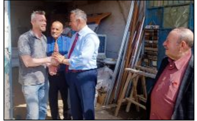
Tahtasız, 28 Mayıs'ta ya tek adam rejiminin devam etmesi ya da refah ve huzur dolu bir ülkenin oylanacağını söyledi.

28 Mayıs'ta yapılacak Cumhurbaşkanlığı seçimlerinin ülkemizin geleceği açısından tarihi bir öneme sahip olduğunu anlatan Tahtasız, Cumhurbaşkanlığı Adayı Kemal Kılıçdaroğlu'nun göreve seçilmesinin büyük bir önem arz ettiğini dile getirerek, "vatanımı seven ayağa kalksın, vatanımı seven sandık başına gitsin" diye konuştu. (Haber Merkezi)