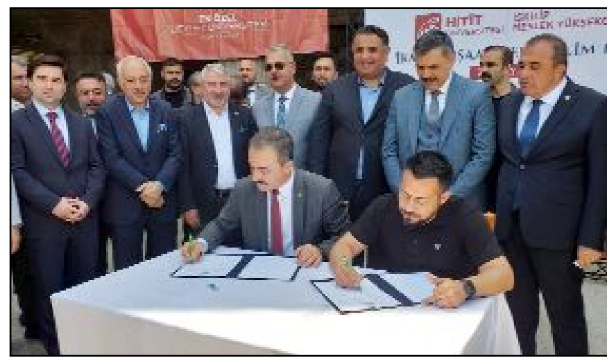
Hitit Üniversitesi İskilip Meslek Yüksekokulu ikmal inşaatı için yer teslimi yapmak üzere protokol imzalandı.