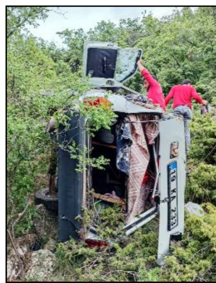
Olay, gece saatlerinde Osmancık'ın Şenyurt Mahallesi'nde meydana geldi.

Olay, gece saatlerinde Osmancık'ın Şenyurt Mahallesi'nde meydana geldi. Edinilen bilgiye göre, malzeme deposunda bilinmeyen bir sebeple yangın çıktı. Aşşap ve plastik malzemelerin bulunduğu depoda kısa sürede büyüyen yangını gören vatandaşların ihbarı üzerine olay yerine çok sayıda itfaiye ve polis ekibi sevk edildi. Olay yerine gelen itfaiye ekiplerinin uzun uğraşları neticesinde yangın çevreye sıçramadan kontrol altına alınarak söndürüldü. Herhangi bir can kaybı ve yaralanmanın olmadığı yangında, depoda büyük çapta maddi hasar meydana geldi. (İHA)