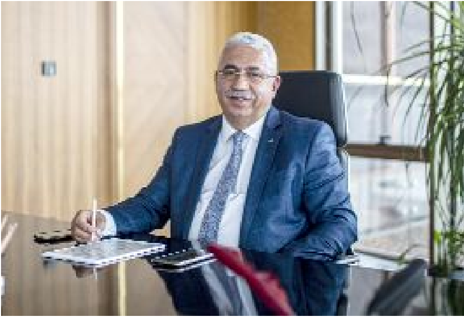
Ahlatcı Holding Yönetim Kurulu Başkanı

Ahlatcı Holding'in ADABANK'ı satın alarak bankacılık sektörüne adım atmış olması nedeniyle, Çorum'unuz adına büyük gurur ve mutluluk duyuyoruz.