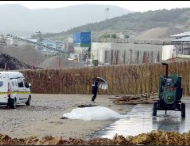
Sağlık ekiplerince müdahale edilen Akgül, kaldırıldığı özel hastanede doktorların tüm müdahalelerine rağmen kurtarılamadı.