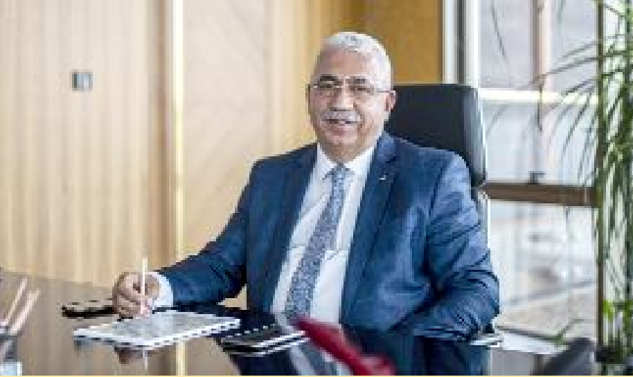
Ahlatcı Holding Yönetim Kurulu Başkanı

Ahlatcı Holding'in ADABANK'ı satın alarak bankacılık sektörüne adım atmış olması nedeniyle, Çorum'unuz adına büyük gurur ve mutluluk duyuyoruz.