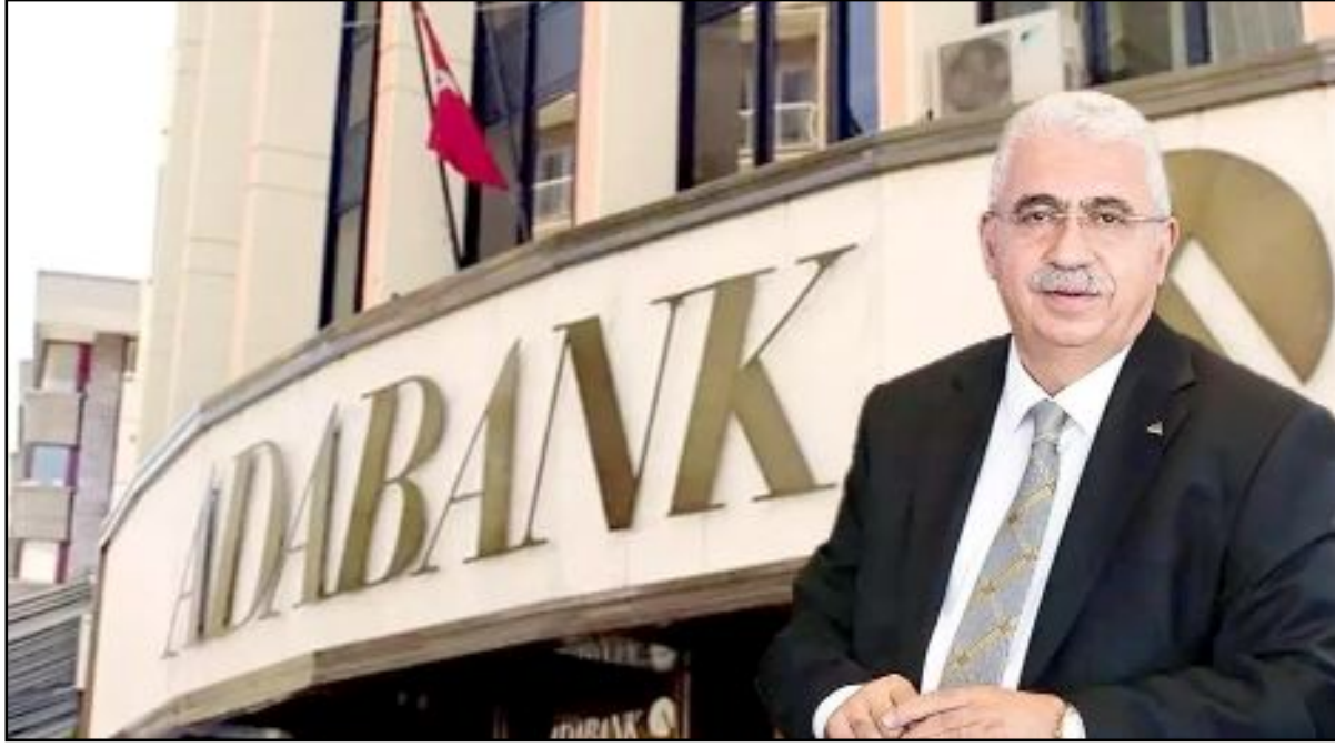
Ahlatcı Holding Yönetim Kurulu Başkanı

Ahlatcı Holding'in ADABANK'ı satın alarak bankacılık sektörüne adım atmış olması nedeniyle, Çorum'umuz adına büyük gurur ve mutluluk duyuyoruz.