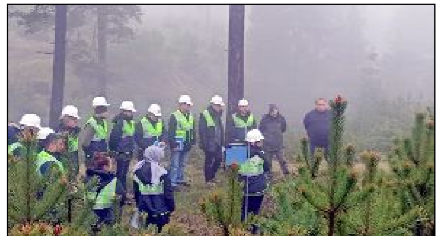
Kargı'da orman zenginliğinin korunması amacıyla Amasya Orman Bölge Müdürlüğüne "Kargı Ormanlarında Silvikültürel (planlı ormancılık) Müdahale Esasları Eğitimi" yapıldı.

Ormanlarımızın sürekliliğini sağlamak ve gelecek kuşakların yararlanabileceği çok fonksiyonel ormanlar kurmak için, ağaçların ihtiyaçlarına, biyolojik özelliklerine, yetişme şartlarına göre, genç meşçere bakımını yapıyor, ormanlarını gençleştirme ve güzelleştirmeye devam ediyor." ifadelerine yer verildi. (AA)