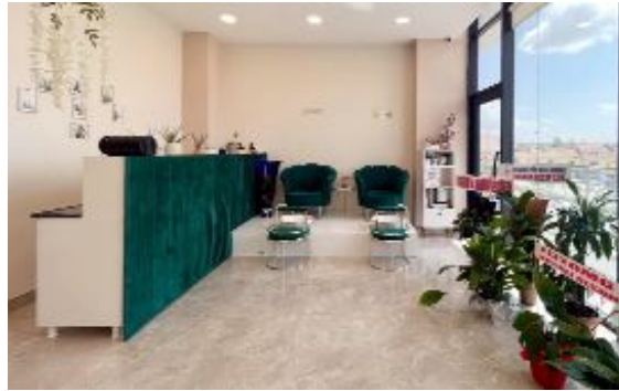
Güzellik salonundan iki görünüm.