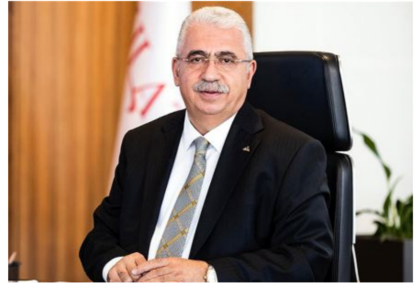
Ahlatcı Holding Yönetim Kurulu Başkanı

Ahlatcı Holding'in ADABANK'ı satın alarak bankacılık sektörüne adım atmış olması nedeniyle, Çorum'unuz adına büyük gurur ve mutluluk duyuyoruz.