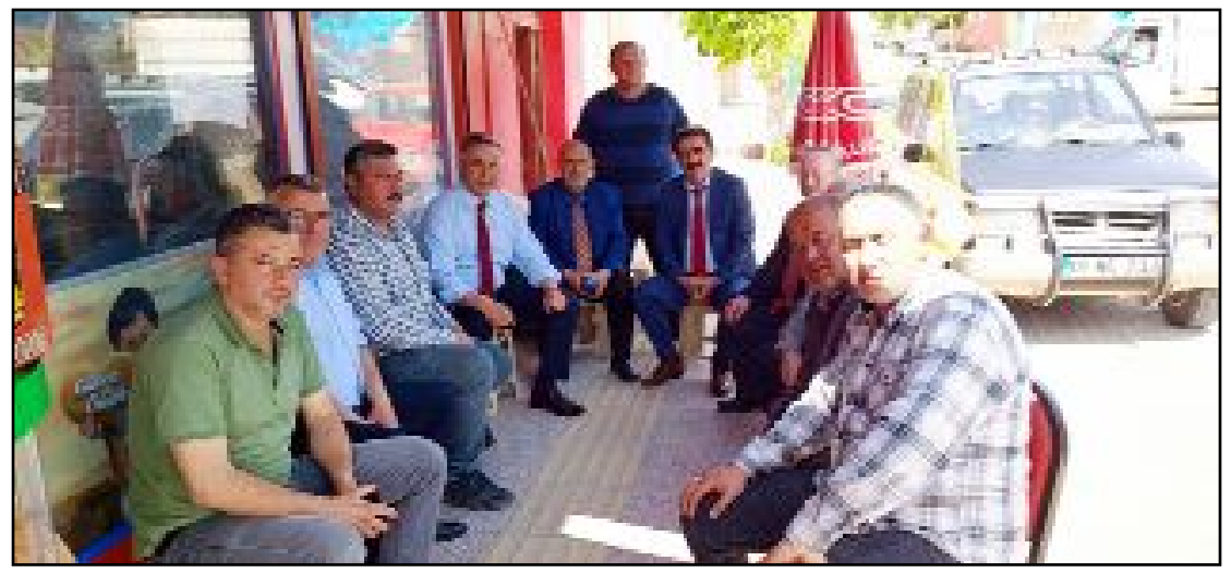
CHP Milletvekili Tahtasız, Mecitözü İlçesi'nde esnafı ve vatandaşları dinledi.