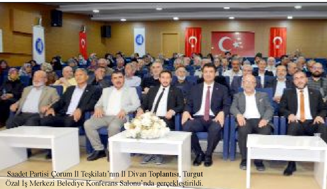
Saadet Partisi Çorum İl Teşkilatı'nın 11. Divan Toplantısı, Turgut Özal İş Merkezi Belediye Konferans Salonu'nda gerçekleştirildi.