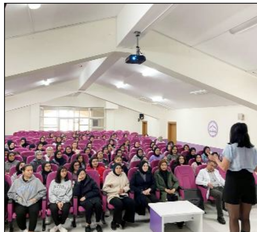
Doğu Akdeniz Üniversitesi'ni tanıtım seminerlerinden...