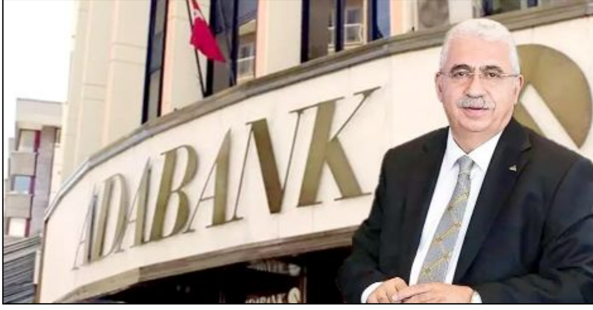
Ahlatcı Holding Yönetim Kurulu Başkanı

Ahlatcı Holding'in ADABANK'ı satın alarak bankacılık sektörüne adım atmış olması nedeniyle, Çorum'unuz adına büyük gurur ve mutluluk duyuyoruz.