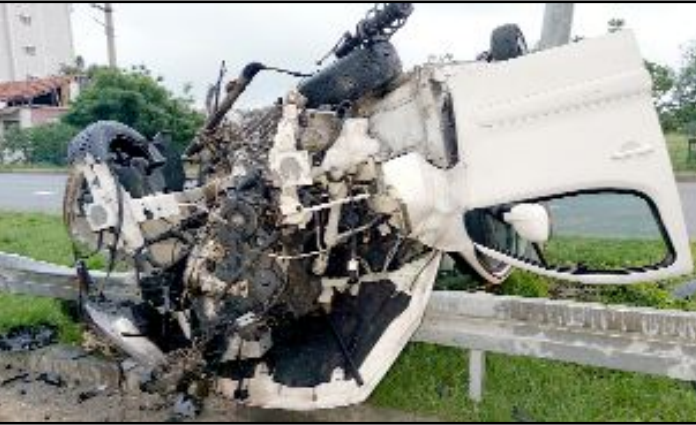
Kaza, Samsun'un Atakum ilçesi Taflan mevki, Samsun- Sinop kara yolu üzerinde meydana geldi.