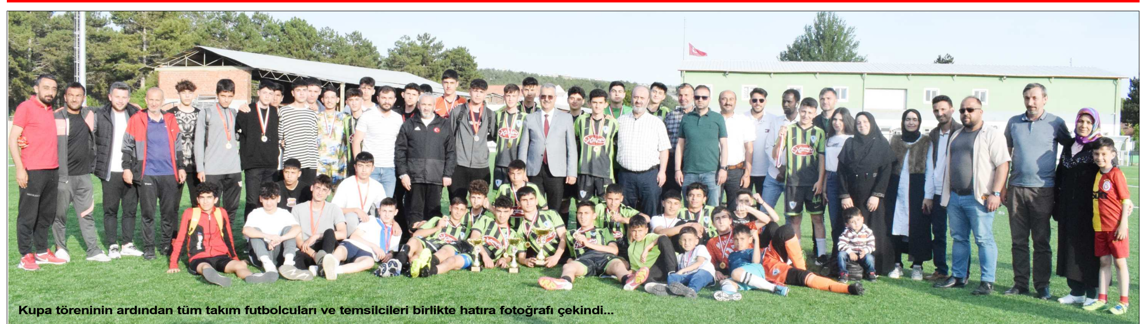
Kupa töreninin ardından tüm takım futbolcuları ve temsilcileri birlikte hatıra fotoğrafı çekindi...