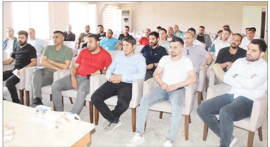
Gençlik ve Spor İl Müdürlüğü Toplantı Salonu'nda gerçekleşen kura çekimine takım temsilcileri katıldı.