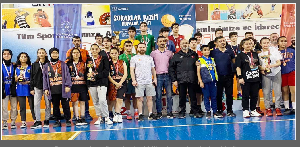
Dereceye giren tüm takımlar birlikte hatıra fotoğrafı çekildi...

Çağlar, turnuvaya katılan tüm takımlara teşekkür ederken, sokakların spor ile şenlenmesi gerektiğine vurgu yaptı. (Rifat KARA)