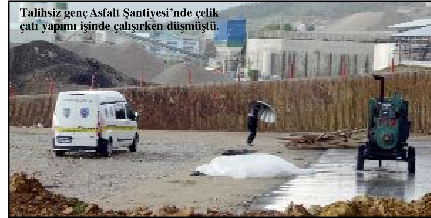
Talihsiz genç Asfalt Şantiyesi'nde çelik çatı yapımı işinde çalışırken düşmüştü.