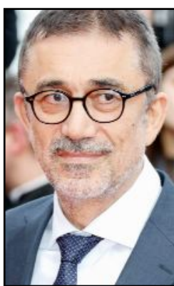
Nuri Bilge Ceylan