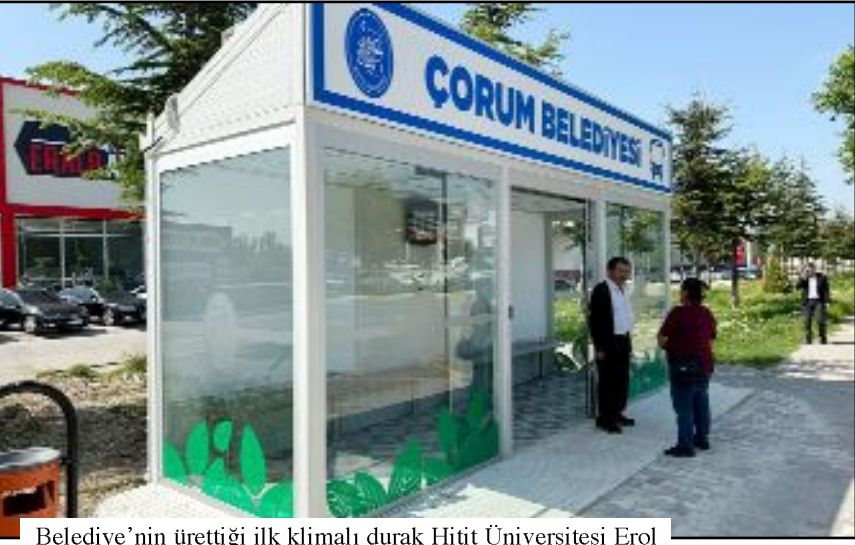
Belediye'nin ürettiği ilk klimalı durak Hitit Üniversitesi Erol Olçok Eğitim ve Araştırma Hastanesi karşısına konuldu.

Yaptıkları üretimle belediye bütçesine de önemli katkı sağladıklarını ifade eden Başkan Aşgın, önümüzdeki süreçte yeni klimalı otobüs duraklarının imal ederek ihtiyaç duyulan bölgelere konulacağını sözlerine ekledi. (Volkan SINAYUÇ)