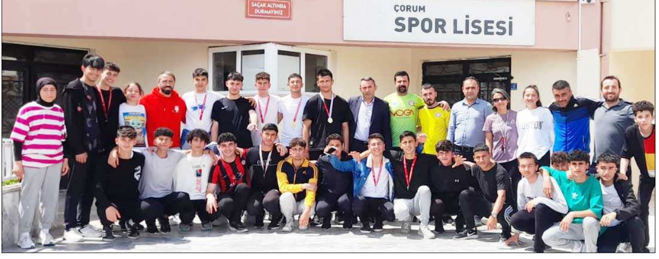
Turnuvaya katılan tüm takımlar ödül töreni sonrası birlikte hatıra fotoğrafı çekildiler...