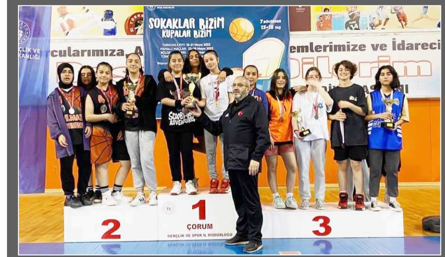
Kızlarda dereceye giren takımlara kupa ve madalyaları verildi.