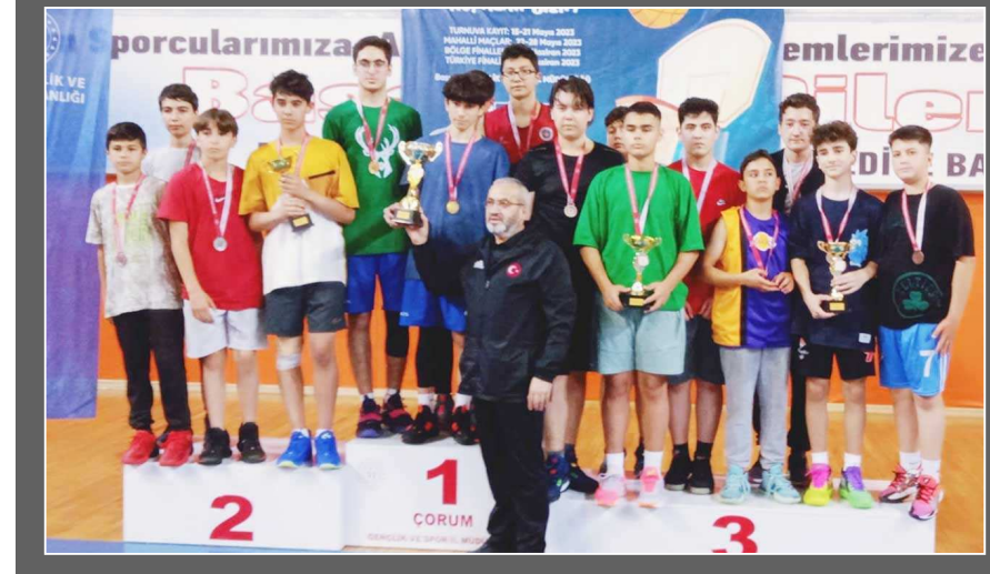
Erkeklerde dereceye giren takımlar...