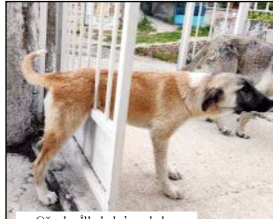
Oğuzlar İlkokulu'nun bahçe kapısına sıkışan köpek kurtarıldı.