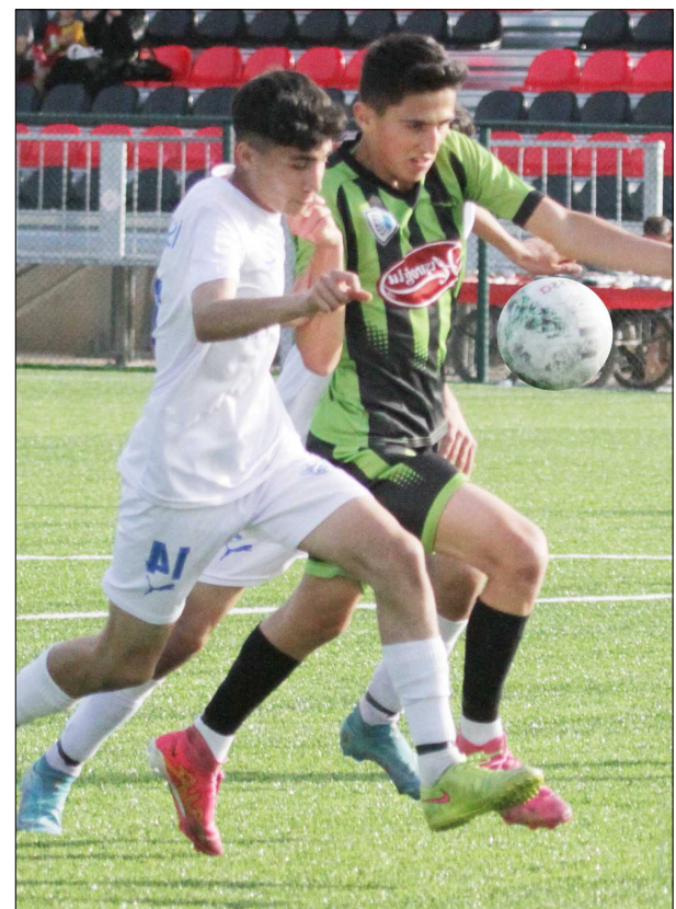
Mimar Sinan-İskilipgücü maçından bir enstantane...