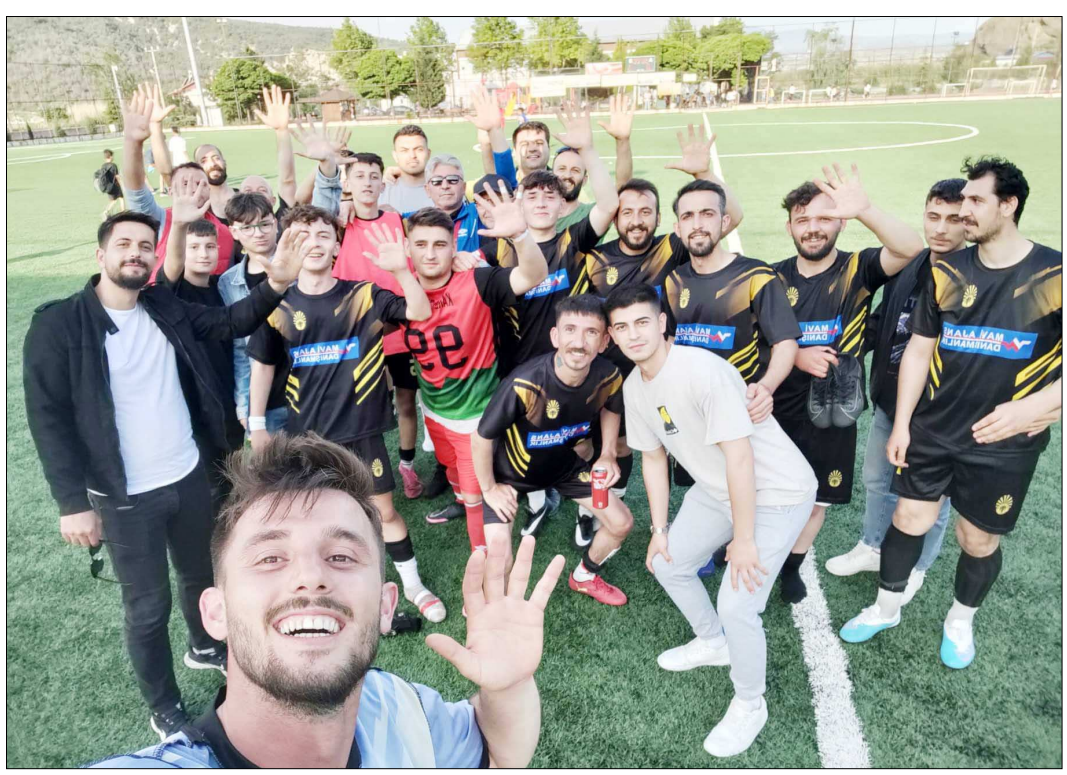
Lider Kargiserispor maçın ardından galibiyeti böyle kutladı.

lediyespor haftayı 3-0 hükmen galip kapattı. Bu sonuçların ardından yenilmezlik serisini devam ettiren lider Kargiserispor puanını 28'e, ikinci sıradaki H.E.Kültürspor ise 26'a yükseltti. (Rifat KARA)