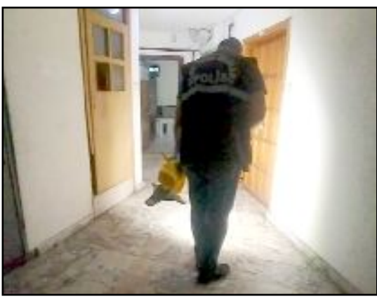
Cengiz Topel Caddesi üzerinde faaliyet gösteren dernek lokaline tüfekte ateş açıldı.

leşiren E.Ü. polis ekipleri tarafından yakalanarak gözaltına alındı. Olayla ilgili başlatılan soruşturma sürüyor. (İHA)