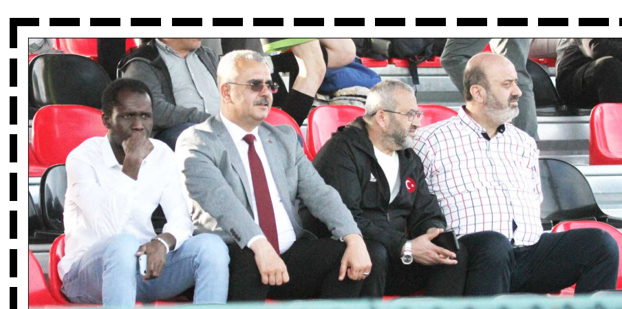
Ahlatcı maçı tribünden böyle takip etti.