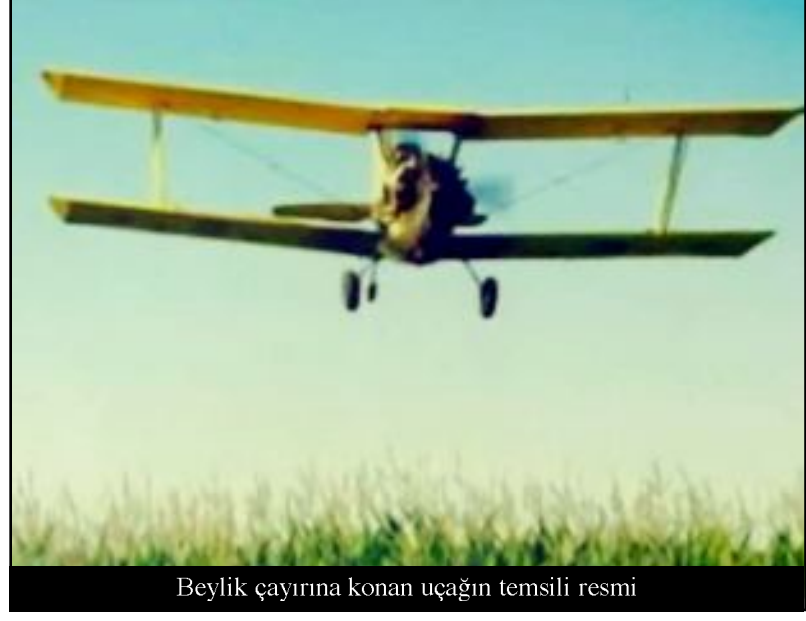
Beylik çayıra konan uçağın temsili resmi