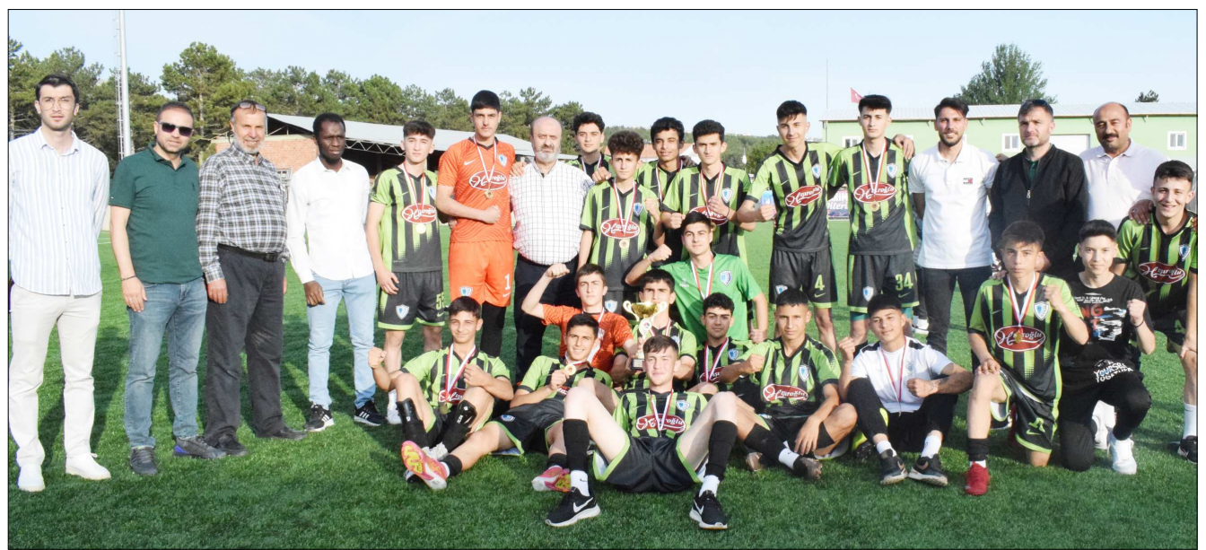
Dördüncü kategoride de şampiyon olan Mimar Sinan Gençlikspor önemli bir başarıya imza attı.