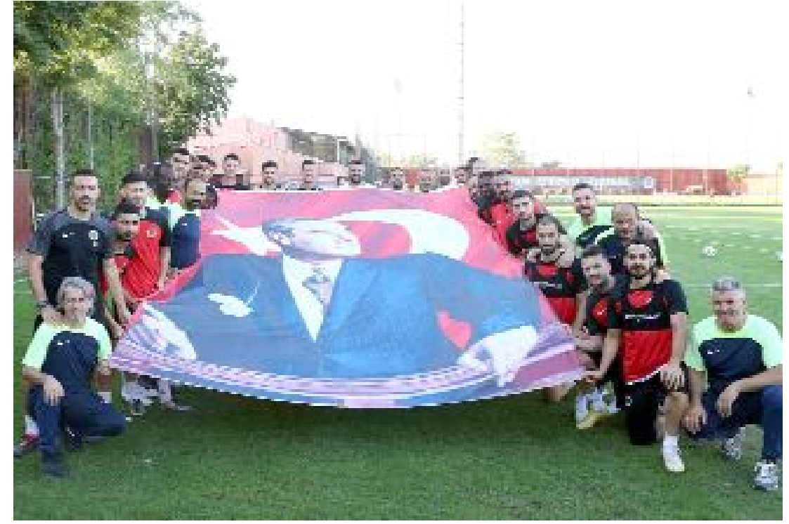
Teknik heyet ve futbolcular, antrenman öncesinde, 30 Ağustos Zafer Bayramı münasebetiyle Türk Bayraklı Atatürk posteri açtı.

Öte yandan, Çorum FK dün yaptığı antrenmanla Gençlerbirliği maçının hazırlıklarını sürdürdü. (Hüseyin AŞKIN)