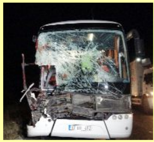
İzmir'in Çeşme ilçesinden kalkan ve Çorum'a gelen yolcu otobüsü Uşak'ın Banaz ilçesinde TIR'a arkadan çarptı.

İzmir'den Çorum'a gelen otobüs kaza yaptı: