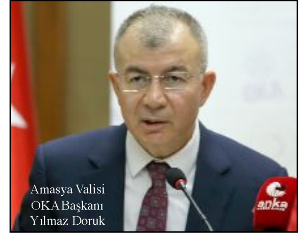
Amasya Valisi OKA Başkanı Yılmaz Doruk