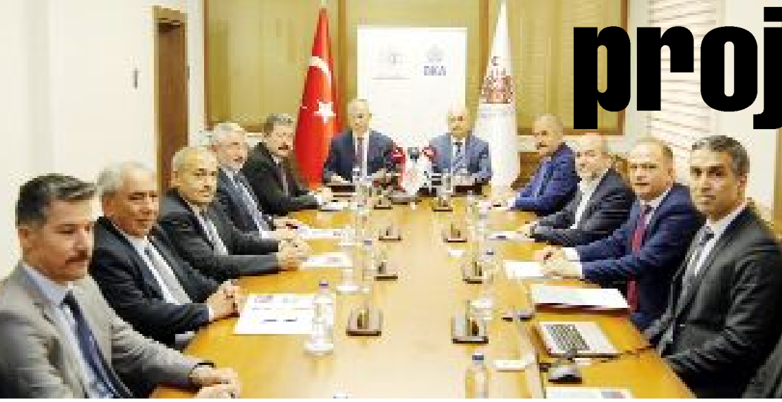
OKA Toplantısı Çorum Valiliği evsahipliğinde Amasya Valisi Yılmaz Doruk yönetiminde gerçekleştirildi.

● Orta Karadeniz Kalkınma Ajansı 2023 yılı 3. Yönetim Kurulu Toplantısı Amasya Valisi Yılmaz Doruk başkanlığında Çorum, Tokat ve Samsun Valilerinin de katılımı ile yapıldı. 2023 yılı çalışmalarının değerlendirilerek 2024 yılı çalışma programı ile ilgili görüş alışverişinde bulunulan toplantıda konuşan Vali Doruk, bölgesel kalkınmaya proje destekleri ile önemli katkılar sağladıklarını söyledi. •3'de