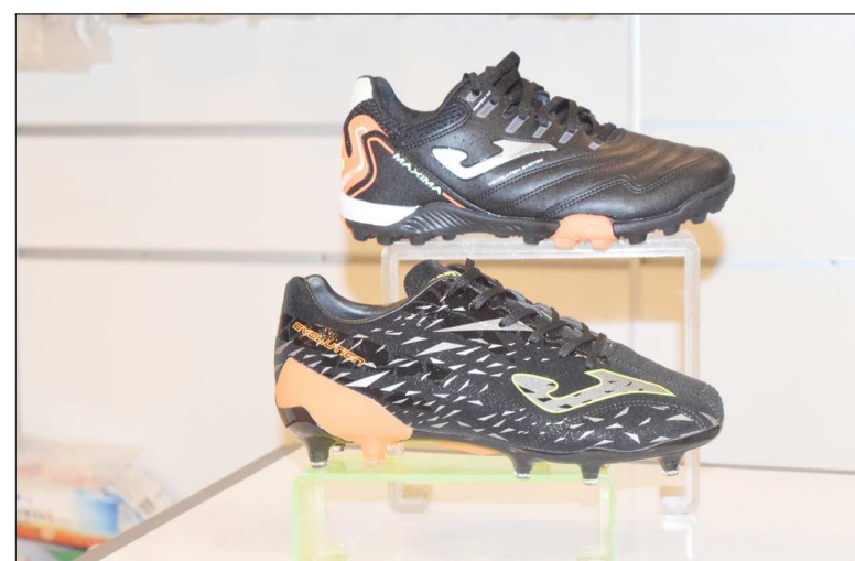
Türkiye'de 51 kulübün kullandığı Joma marka kramponlar...