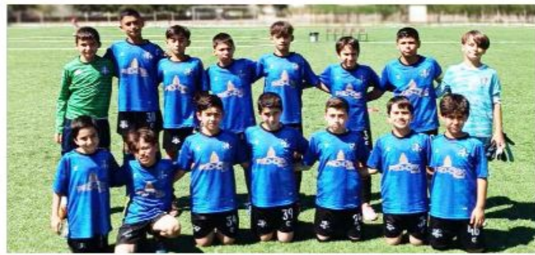
Vefaspor kritik maçta Çorum FK'yı 1-0 yenerek çeyrek finale adını yazdırdı.

Merkez İtfaiye Sahası'nda oynanan maçlarda Vefaspor, Çorum FK'yı 1-0, Mimar Si-