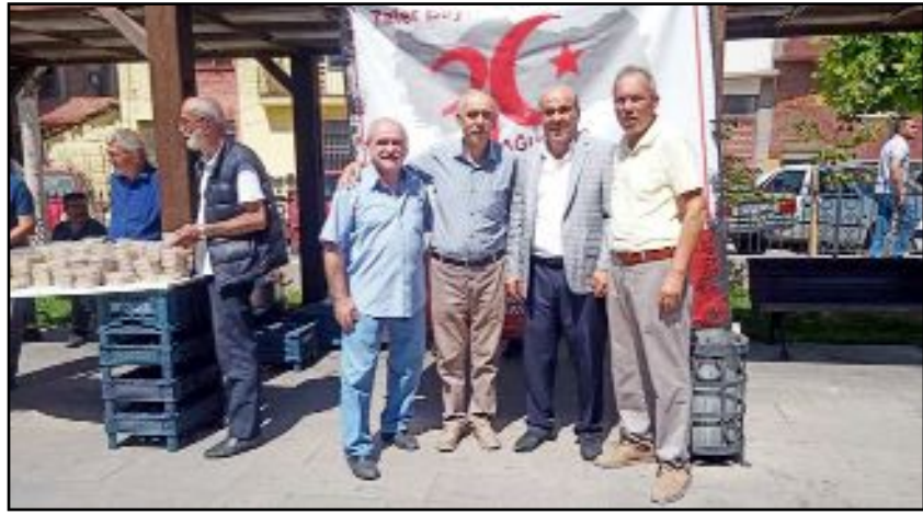
Demek yöneticileri cami çıkışı vatandaşlara helva dağıttı.

30 Ağustos Zafer Bayramı dolayısıyla başta Gazi Mustafa Kemal Atatürk ve silah arkadaşları ile vatan uğruna can alıp can vermiş vatan evlatlarının ruhları için, önceki yıllarda olduğu gibi bu yıl da mevlid okutuklarını belirten Demek Başkanı Kılıç, "Şehitlerimizi hiçbir zaman unutmuyacağız. İlelebet onları gönüllerimizde yaşatacağız. Mekanlarını cennet olsun, ruhları şad olsun. Ne Mutlu Türktüm Diyene" görüşüne yer verdi. (Volkan SINAYUÇ)