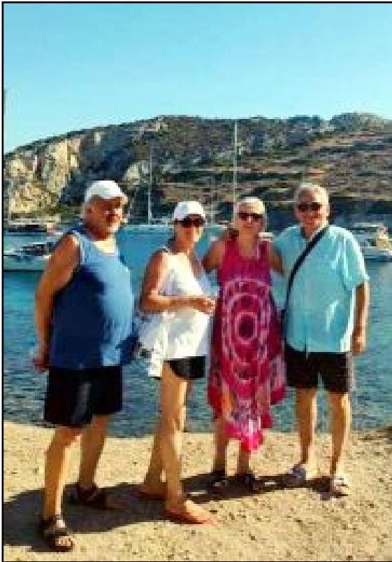
Knidos örenyeri ve tarihte büyük önemi olmuş antik limanın bugünkü hali...