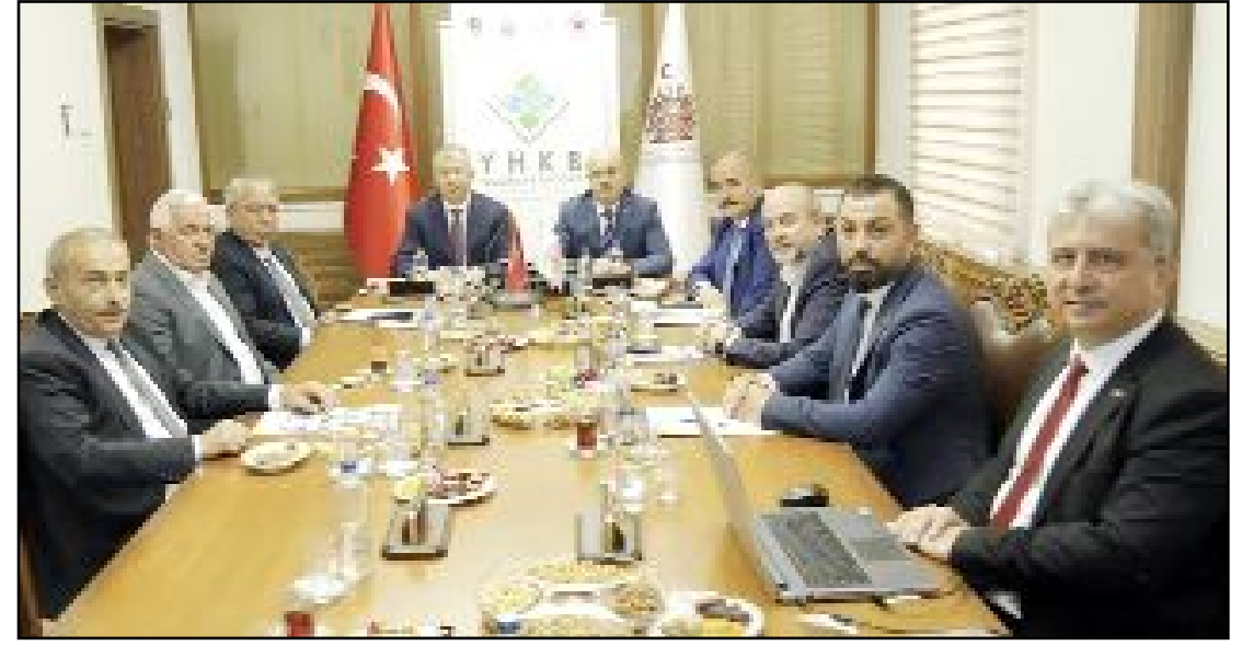
YHKB Encümen ve Meclis Toplantısı, Çorum Valiliği Toplantı Salonu'nda yapıldı.