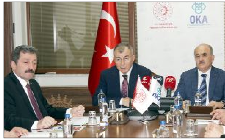
Toplantıda OKA'nın çalışmaları ele alınarak 2024 yılı programı ile ilgili görüş alışverişinde bulunuldu.

Toplantı konuşmanın ardından gündeme ilişkin sunumlar, yapılan değerlendirmeler ve görüş alışverişi ile son buldu. (Volkan SINAYUÇ)