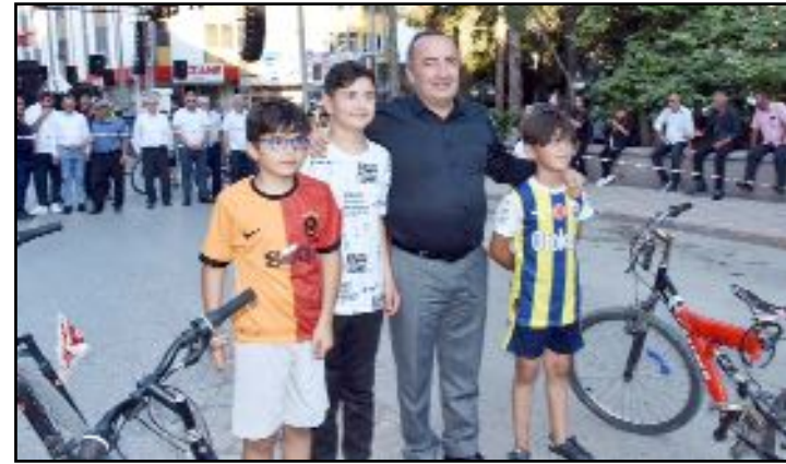
İskilip'te festival Yöresel ürün pazarı açılışı ve Yavaş Bisiklet Sürme Yarışması ile başladı.