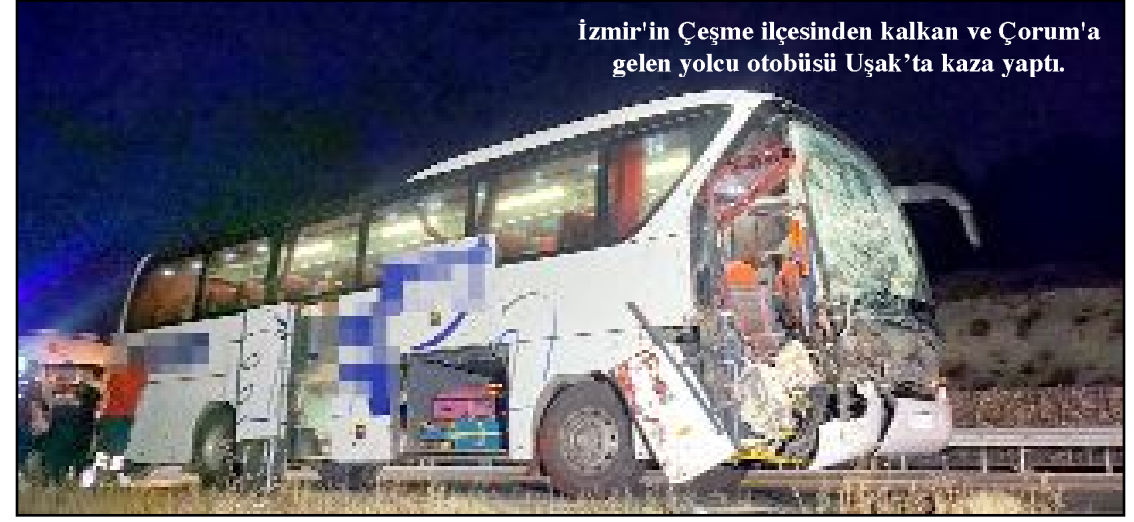
İzmir'in Çeşme ilçesinden kalkan ve Çorum'a gelen yolcu otobüsü Uşak'ta kaza yaptı.

Polis ekipleri olaya karşın G.G.'nin yakalanması için çalışma başlattı. (İHA)