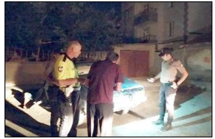
Muhtarlıkta hasar meydana gelirken, otomobil bir sokakta terk edilmiş şekilde bulundu.