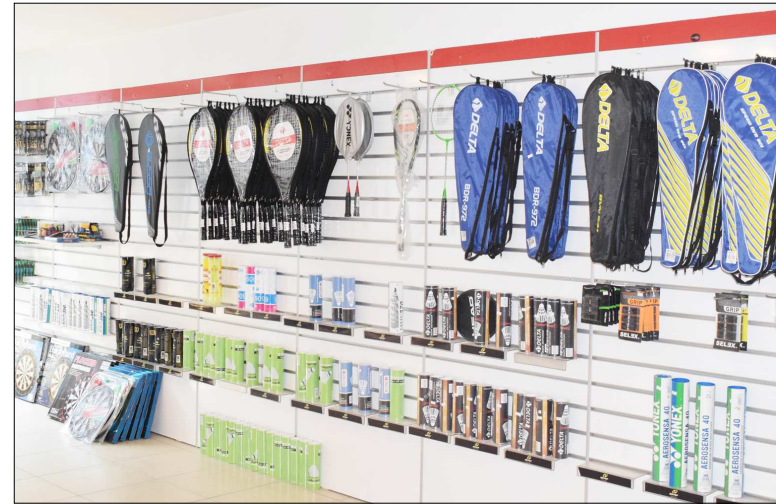
Tüm spor branşlarının malzemelerini Hitit Spor Dünyası'nda bulabilirsiniz.