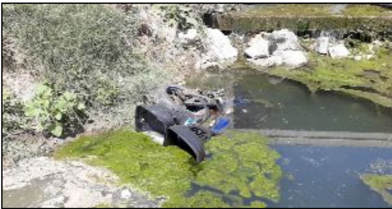
Dereye düşen motosiklet kurtarıcı marifeti ile çıkartıldı.

Dereye düşen motosiklet kurtarıcı marifeti ile çıkartıldı. (Tugay GÖKTÜRK)