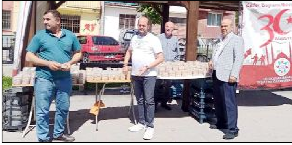
Ulukavak Mahallesi Yardımlaşma ve Dayanışma Derneği bu yıl da şehitler için mevlid okuttu.