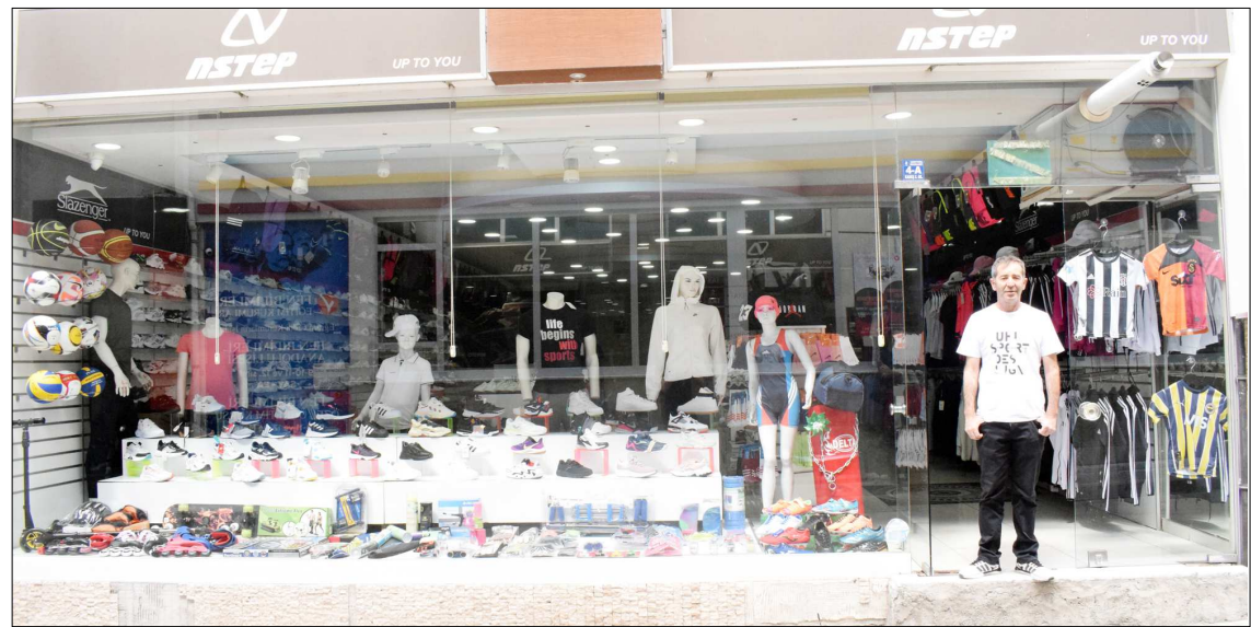
Hitit Spor Dünyası Yavruturna Mahallesi Kadeş 2.Sokak No: 4/A adresinde hizmet veriyor.

Türkiye Süper Ligi, 1.Lig, 2 ve 3.Lig'de mücadele eden 51 kulübün kullandığı Joma marka kramponları, eşofman ve tişört yeni dönemde Hitit Spor