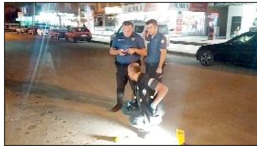
Polis ekipleri olaya karşın E.S.'nin yakalanması için çalışma başlattı.

Polis ekipleri olaya karşın E.S.'nin yakalanması için çalışma başlattı. (İHA)