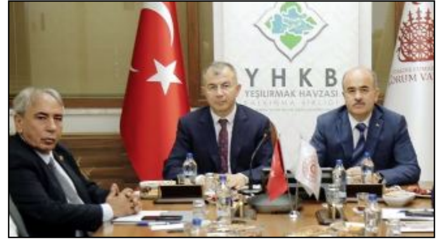
Toplantıyı Amasya Valisi Birlik Başkanı Yılmaz Doruk yönetti.

Encümen toplantısının ardından YHKB Meclis toplantısı da gerçekleştirildi. Toplantıda 2024 yılı Birlik Çalışma Programı, 2024 yılı Birlik Bütçesi ve 2024 yılı Birlik Üye Katılım Payları görüşülerek karara bağlandı. (Volkan SINAYUÇ)