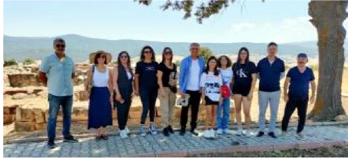
Henüz "kazı alanı" vasfını taşıyan Hattuşa örenyerinden...