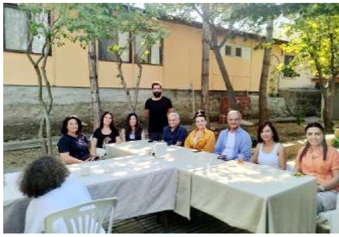
Ortaköy ilçe merkezindeki kazievinde öğle yemeği sonrası...