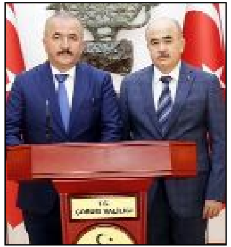
Vali Dağlı, Samsun Valisi Orhan Tavlı, Amasya Valisi Yılmaz Doruk ve Tokat Valisi Numan Hatipoğlu'nu ağırladı.