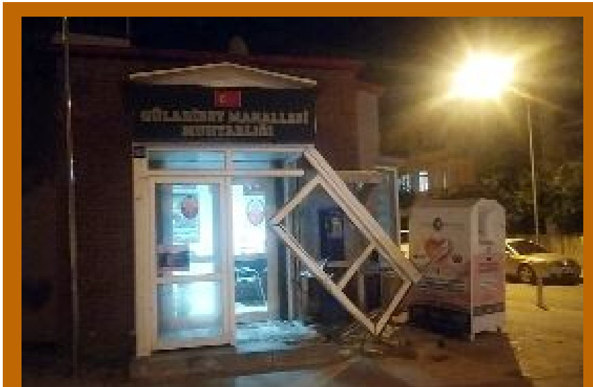
Sürücüsü tespit edilemeyen 19 EK 679 plakalı otomobil, Güllübahçe Mahallesi muhtarlık binasına çarparak olay yerinden kaçtı.

Çorum Bal Üreticileri Birliği Erdal Odabaş, girdi maliyetleri nedeniyle bal fiyatlarının yüzde 150 arttığını bildirdi.