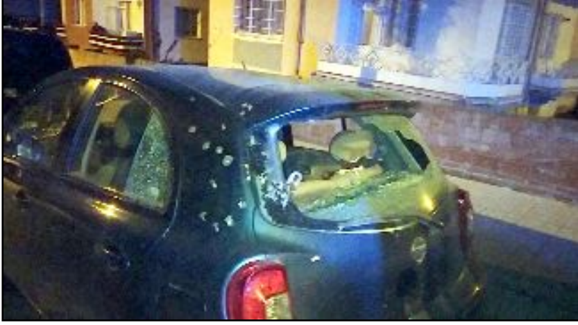
Kaza, İnönü Caddesi'nde meydana geldi.