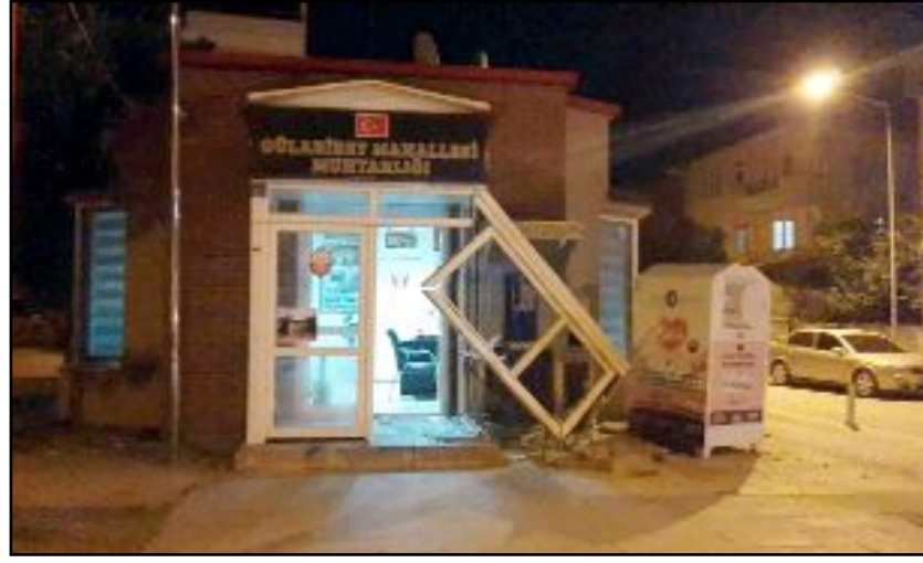
Sürücüsü tespit edilemeyen 19 EK 679 plakalı otomobil, Gülabibey Mahallesi muhtarlık binasına çarparak olay yerinden kaçtı.

Çorum'da bir otomobil muhtarlık binasına çarparak olay yerinden kaçtı.