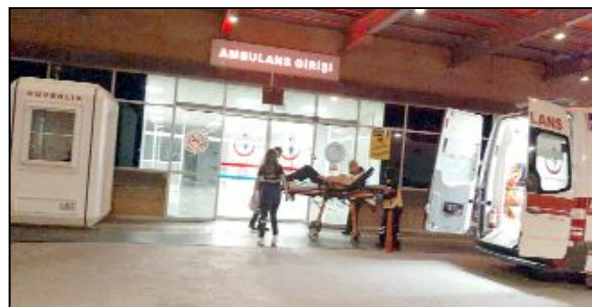
Boyun kısmında mermi çekirdeği tespit edilen H. K., Hitit Üniversitesi Erol Olçok Eğitim ve Araştırma Hastanesi'ne kaldırıldı.

Hastanede yapılan kontrollerde boyun kısmında mermi çekirdeği tespit edilen H. K., Hitit Üniversitesi Erol Olçok Eğitim ve Araştırma Hastanesi'ne sevk edildi. (Tugay GÖKTÜRK)