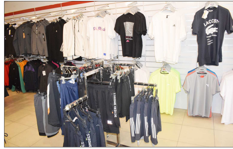
Özel sipariş ile hazırlanan tişörtler...