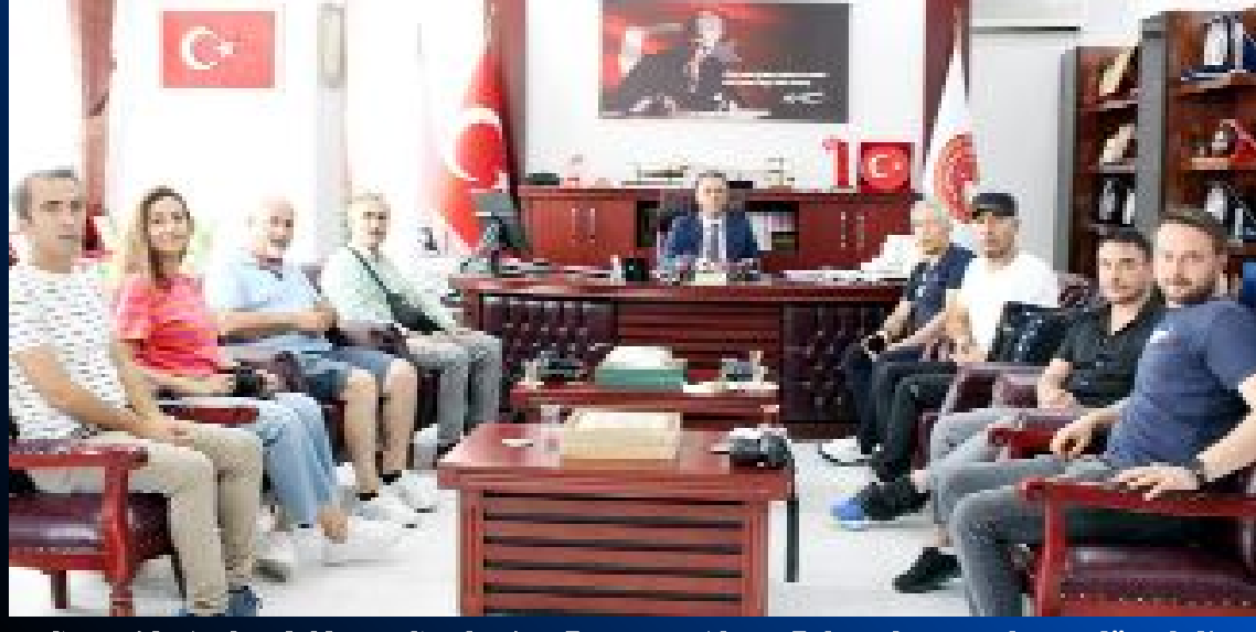
Çorum'da 1 yılını dolduran Cumhuriyet Başsavcısı Ahmet Bektaş, basın toplantısı düzenledi.

● Çorum Cumhuriyet Başsavcısı Ahmet Bektaş, makamında düzenlediği basın toplantısında, son bir yılda Türkiye genelinde olduğu gibi Çorum'da da suç oranlarında yüzde 20 artış olduğunu kaydetti.