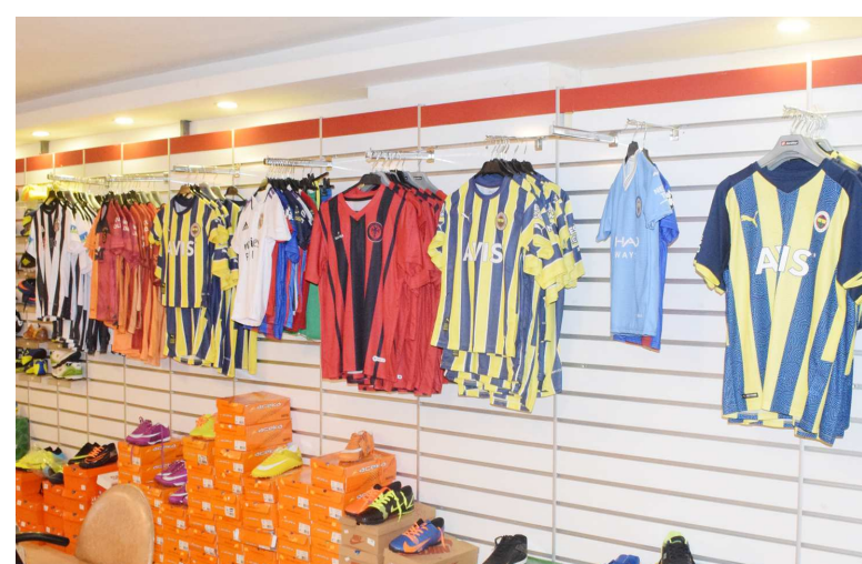
Tüm takımların formaları özel siparişle hazırlanıyor...