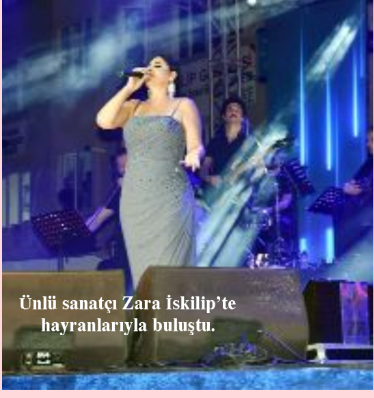
Ünlü sanatçı Zara İskilip'te hayranlarıyla buluştu.

İskilip Belediyesi tarafından bu yıl dördüncüsü düzenlenen Geleneksel İskilip Dolma, Turşu ve Çilek Festivali etkinlikleri kapsamında ünlü sanatçı Zara konser verdi.