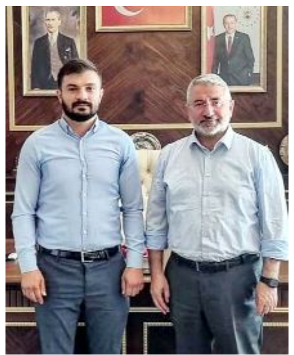
Sahalarımızdaki tuvalet ve mescit inşaatının en kısa sürede baş-