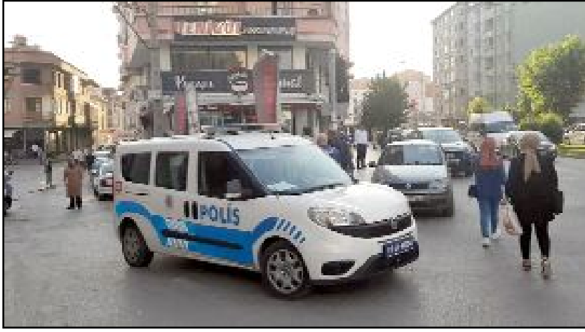
İhbar üzerine olay yerine resmi ve sivil polis ekipleri sevk edildi.

Kaçan şahısların yakalanmasına yönelik resmi, sivil ve motorize ekiplerce çalışma başlatıldı. (Tuğay GÖKTÜRK)