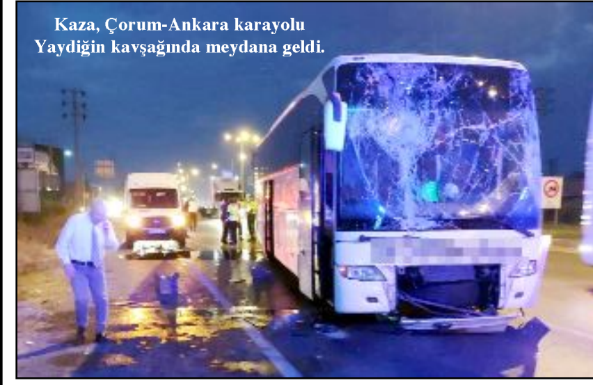
Kaza, Çorum-Ankara karayolu Yaydığın kavşağında meydana geldi.

Çorum'da içerisinde çok sayıda yolcunun bulunduğu şehirlerarası otobüs kaza yaptı. 2 kişinin yaralandığı kazada faciadan dönüldü. Alınan bilgiye göre Hatay-Rize seferini yapan A.H. idaresindeki 38 YY 636 plakalı yolcu otobüsü, Çorum-Ankara karayolu Yaydığın kavşağında bir nedenle kontrolden çıktı. Trafik lambaları, trafik levhaları ve orta refüje çarpan otobüsün sürücüsü ile birlikte otobüste yolcu olarak bulunan M.K., yaralandı. Yaralıları olay yerine sevk edilen sağlık ekipleri ve yapılan müdahalenin ardından Hitit Üniversitesi Erol Ölçek Eğitim ve Araştırma Hastanesi'ne kaldırılarak tedavi altına alındı. (Tuğay GÖKTÜRK)