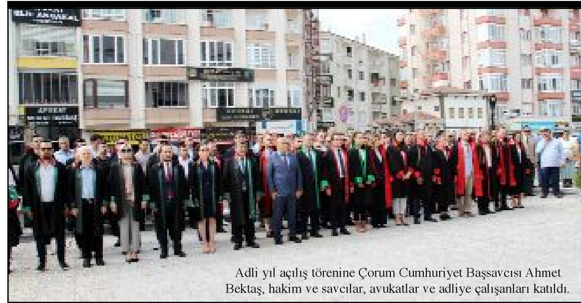
Adli yıl açılış törenine Çorum Cumhuriyet Başsavcısı Ahmet Bektaş, hakim ve savcılar, avukatlar ve adliye çalışanları katıldı.