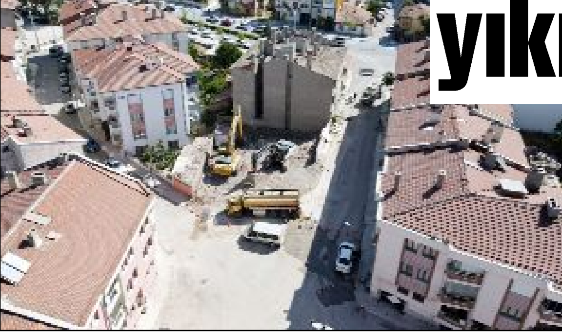
Belediye Recep Tayyip Erdoğan Caddesi ile Okul 1. Sokak'ın buluştuğu noktayı genişletiyor.

"Çorum'un huzuru için yapılacak bütün çalışmaları destekliyoruz"