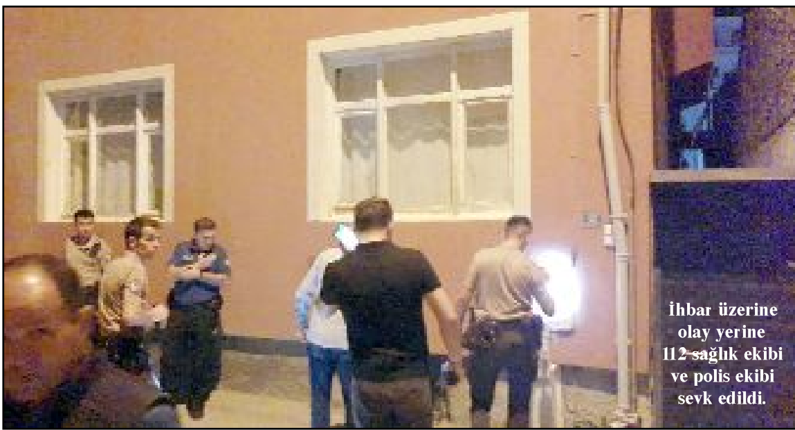
İhbar üzerine olay yerine 112 sağlık ekibi ve polis ekibi sevk edildi.

Çorum'da meydana gelen silahlı kavgada bir kişi vurularak yaralandı. Alınan bilgiye göre E.B. ile B.Ö. arasında Ulukavak Mahallesi Selimiye 2. Sokak üzerinde bir nedenle tartışma çıktı. Tartışmanın uzaması üzerine E.B., olay yerinde bulunan M.A.'nin tüm engellemelerine rağmen yanında getirdiği pompalı tüfekle B.Ö.'yü vurdu. Çevredeki vatandaşların ihbarı üzerine olay yerine polis ve sağlık ekipleri sevk edildi.