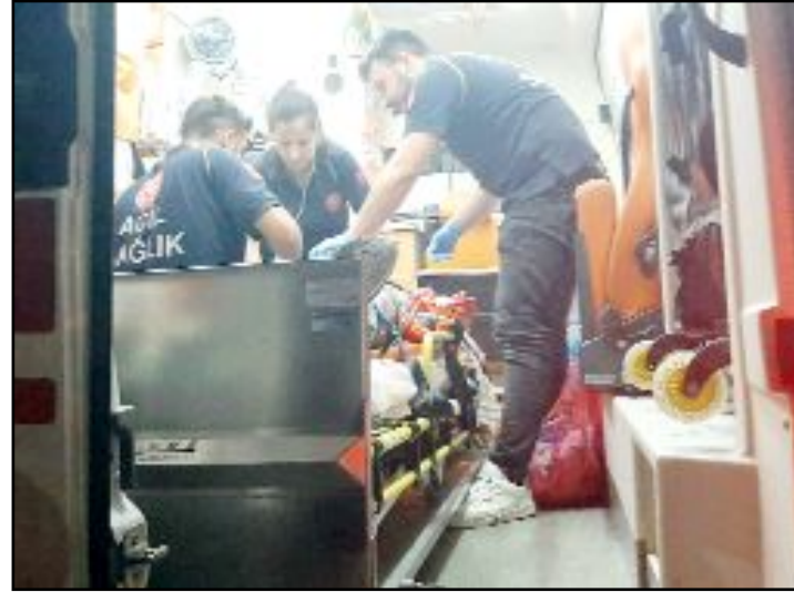
Kolundan yaralanan B.Ö.'ye ilk müdahale olay yerinde yapıldı.