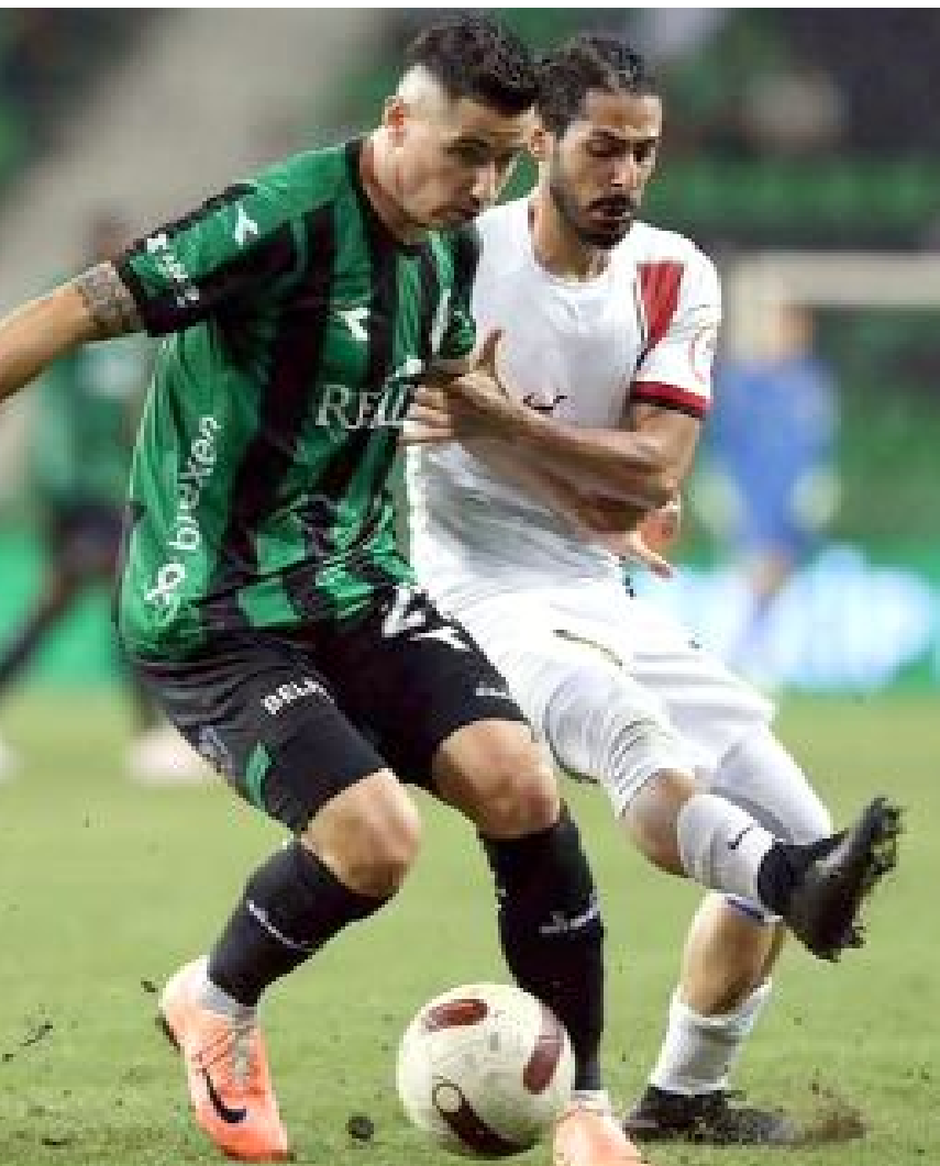
Bu ezon sahasındaki maçlarda Ümraniyespor'u 2-1, Bodrumspor'u ise 1-0 yenen Gençlerbirliği, deplasmanda ise Sakaryaspor'la 0-0 berabere kaldı.