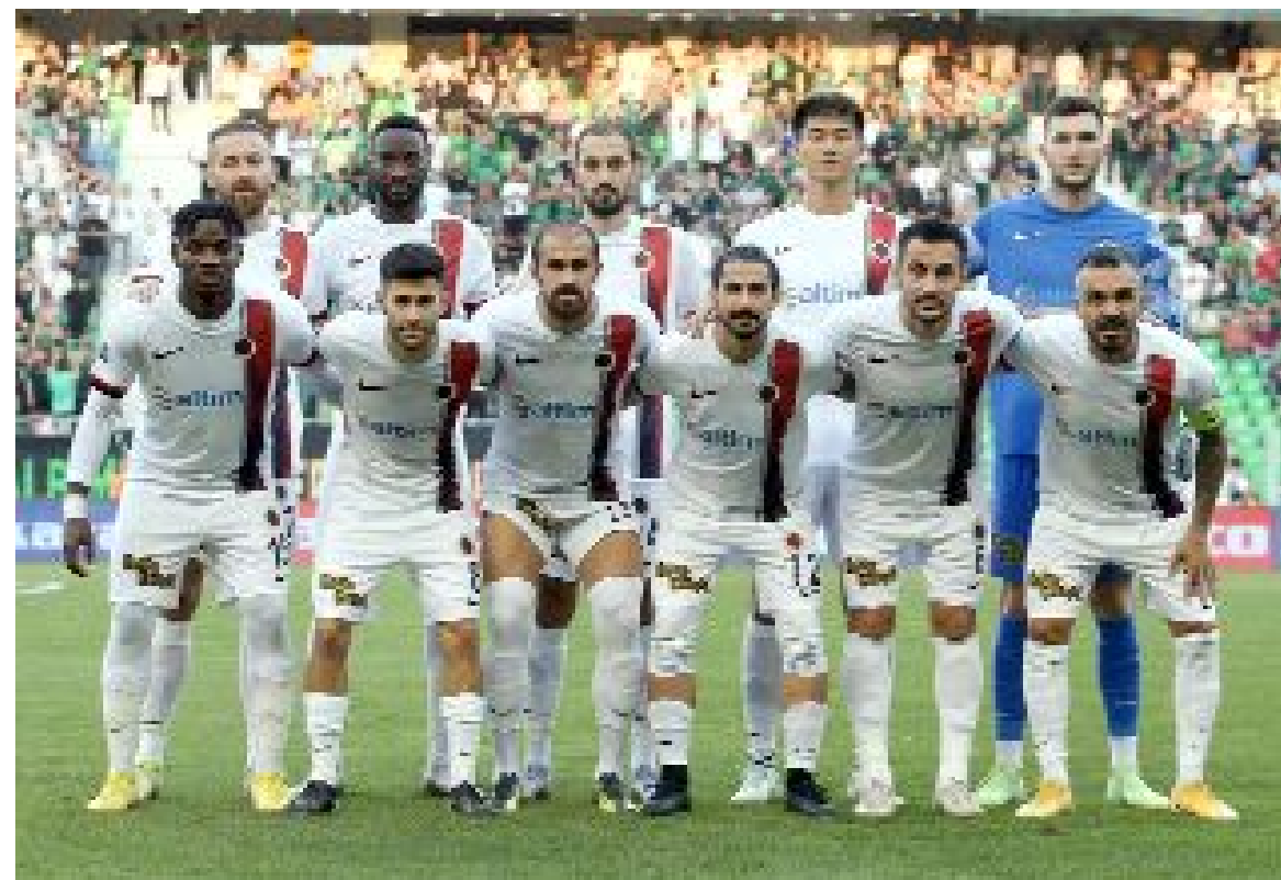
Başkent ekibi Gençlerbirliği, ilk 3 haftada 2 galibiyet, 1 beraberlik alırken, 7 puanla 4.sırada yer alıyor.

Tekirdağ bölgesinden Mehmet Ali Özer de maçta dördüncü hakem olarak görev alacak. (Hüseyin AŞKIN)