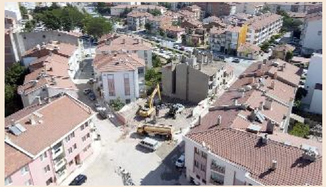
Çorum Belediyesi, yolları genişleterek ulaşımı rahatlatmak için kamulaştırma çalışmalarını sürdürüyor. Buna göre Recep Tayyip Erdoğan Caddesi ile Okul 1. Sokak'ın buluştuğu noktadaki üç yapının yıkım çalışmalarına başlandı.