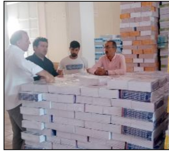
Kodek okullarda öğrencilere dağıtılacak kitapları da inceledi.

de okutulacak ders kitaplarının çoğunluğu de pozmuza ulaştı. Okullarımız açılmadan önce tüm ders araç ve gereçlerimiz ile bakım ve onarım işlerimizi tamamlamış olarak okullarımızda öğrencilerimize bekliyor olacağız" dedi. (Volkan SINAYUÇ)