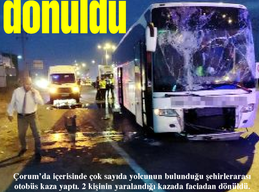
Çorum'da içerisinde çok sayıda yolcunun bulunduğu şehirlerarası otobüs kaza yaptı. 2 kişinin yaralandığı kazada faciadan dönüldü.

Yolcu dolu otobüs kontrolden çıktı faciannın eşiğinden dönüldü