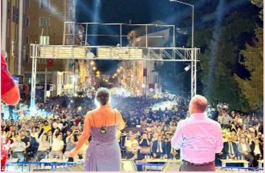
İskilip'te konser veren ünlü sanatçı Zara'ya Belediye Başkanı Sülük tarafından çiçek verildi.