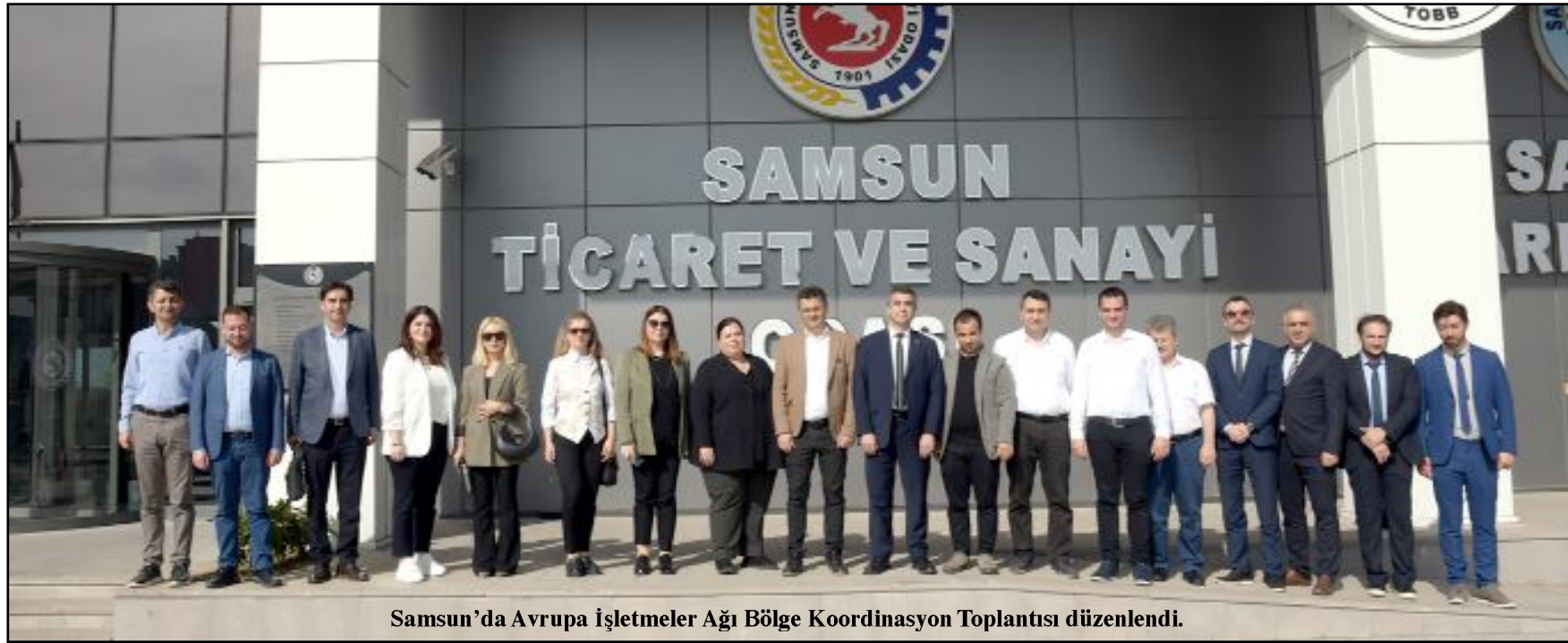
Samsun'da Avrupa İşletmeler Ağı Bölge Koordinasyon Toplantısı düzenlendi.

Yerinde Kurulum / Kilitli Doğrulama Hizmeti