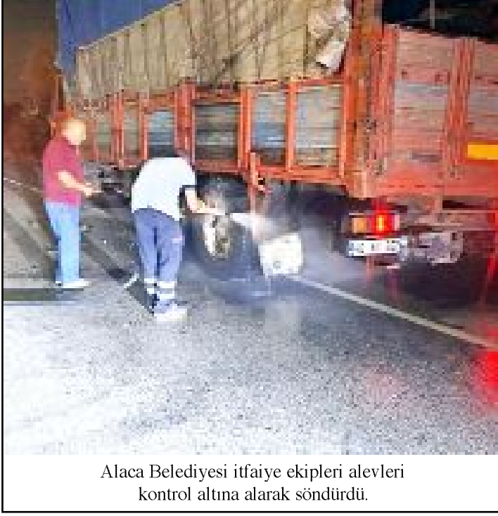
Alaca Belediyesi itfaiye ekipleri alevleri kontrol altına alarak söndürdü.

Çorum'un Alaca ilçesinde seyir halindeki kamyonun lastikleri alev aldı. Yangın itfaiye ekiplerinin müdahalesiyle büyümeden söndürüldü. Edinilen bilgilere göre, Çorum'dan Kahramanmaraş'a giden N.A. idaresindeki 46 AU 367 plakalı döküm malzemesi yüklü kamyonun Küre Köyü yakınlarında balatalarının sınıması sonucu arka lastiklerinden alevler yükselmeye başladı. Durumu fark eden sürücü itfaiyeyi arayarak yardım istedi. İhbar üzerine kısa sürede olay yerine intikal eden Alaca Belediyesi itfaiye ekipleri alevleri kontrol altına alarak söndürdü. (İHA)