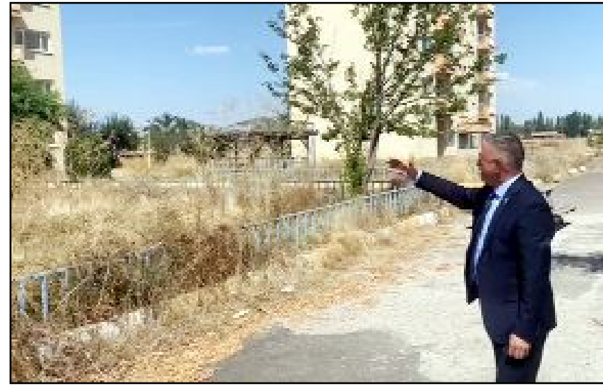
Acemi Birliği yapılacağı ifade edilen Çeşmeören Köyü okulunun önüne giden Milletvekili Mehmet Tahtasız, AKP ve MHP milletvekillerine yanıt verdi.

yıllarda vermiş olduğunuz bütün sözleri sizlere tekrar tekrar hatırlatacağım" diye konuştu. (Haber Merkezi)