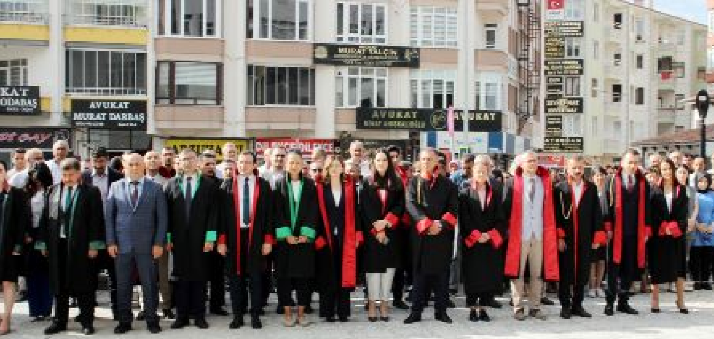
Çorum'da yeni adli yıl açılışı nedeniyle Adliye önünde bulunan Atatürk Anıtı'nda tören düzenlendi.