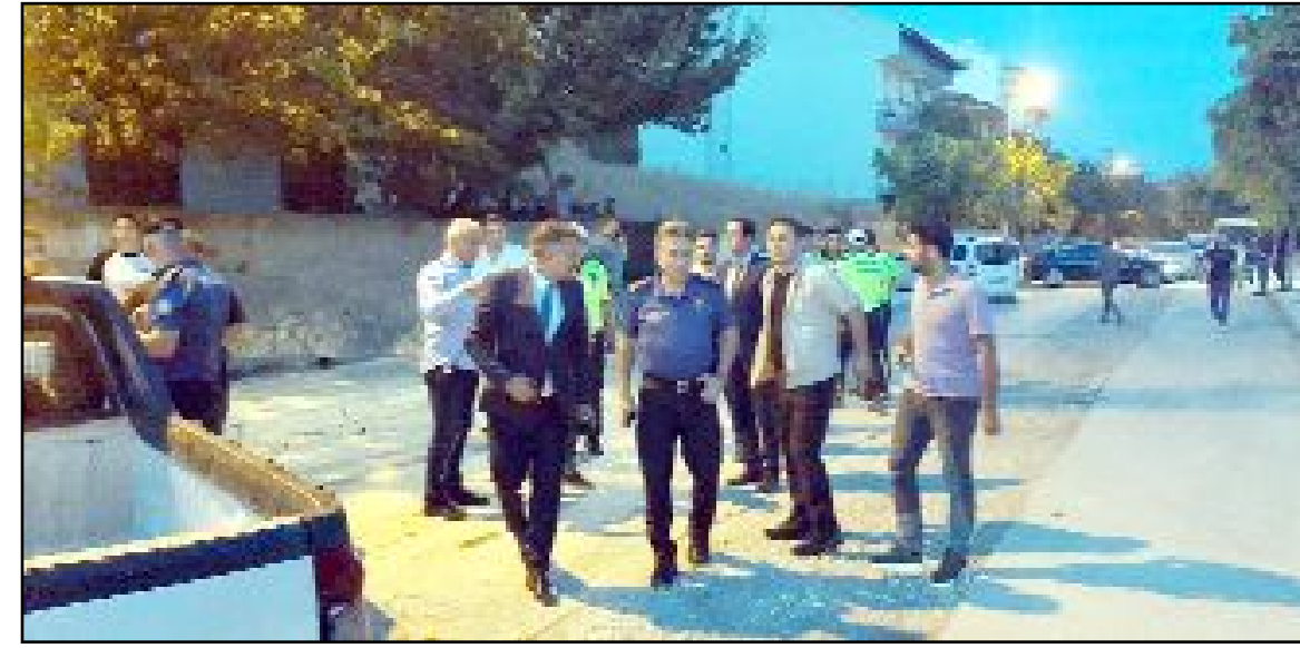
Yaralılar, Hitit Üniversitesi Erol Olçok Eğitim ve Araştırma Hastanesi'ne kaldırıldı.