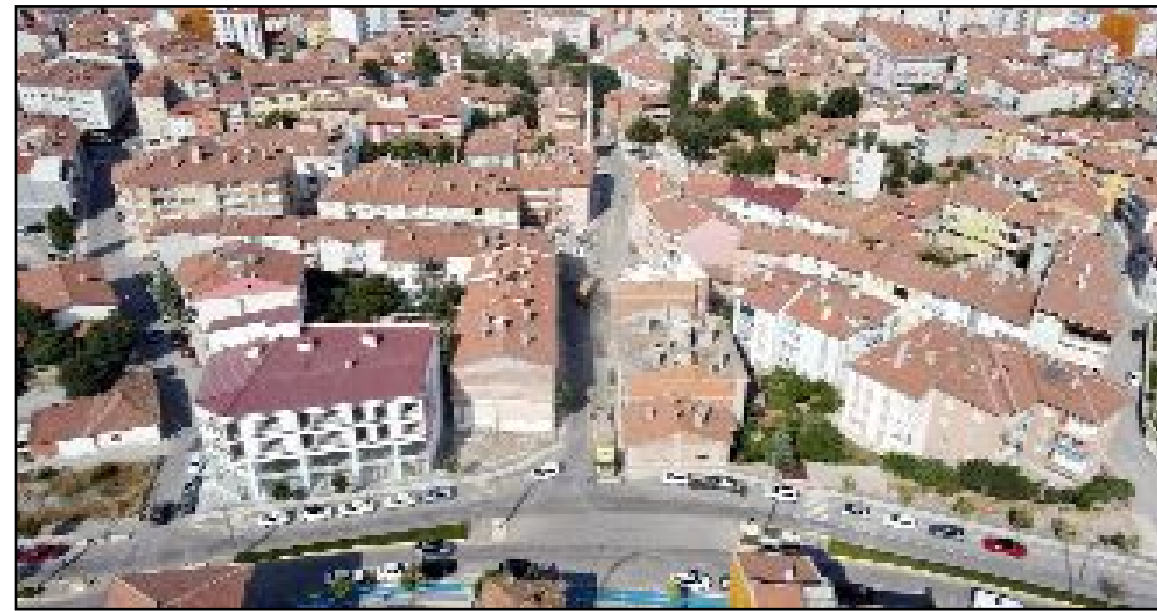
Belediye tarafından yapılan kamulaştırmaların kamu yararı gözetilerek yapıldığı bildirildi.