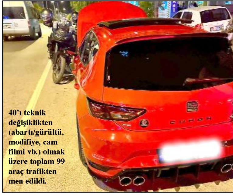
40'ı teknik değişiklikten (abartı/gürültü, modifiye, cam filmi vb.) olmak üzere toplam 99 araç trafikten men edildi.

301 bin 513 TL ceza işlem uygulandı. 40 araç teknik değişiklikten (abartı/gürültü, modifiye, cam filmi vb.) olmak üzere toplam 99 araç trafikten men edildi. Ayrıca 42 sürücüye alkolü araç kullanmak veya alkol cihazını üfleme ret etmekten işlem yapıldı. Çorum Valisi Doç. Dr. Zülkif Dağlı, halkın huzur ve sükunu için Emniyet Müdürlüğü tarafından yapılan bu tür uygulama ve denetimlerin kararlılıkla sürdürüleceğini söyledi. (Haber Merkezi)