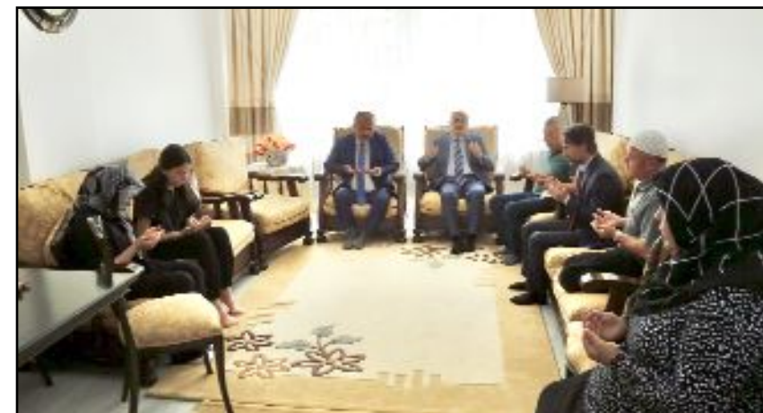
Tokat Valisi Numan Hatipoğlu, Çorum Valisi Zülkif Dağlı ile birlikte şehidin Çorum'da yaşayan ailesini ziyaret etti.

Açıklamada, Tokat nüfusuna kayıtlı şehit Çalgay'ın 29 Ağustos 2023 Salı günü, Peñçe Kilit Operasyonu bölgesinde askeri aracın devrilmesi sonucu şehit olduğu, ailenin isteği üzerine tören ve defin işlemlerinin 30 Ağustos 2023 Çarşamba günü Çorum'da gerçekleştirildiği aktarıldı. (AA)