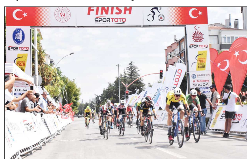
100'e yakın bisikletçi Amasya'dan Çorum'a 3 saatte geldi.