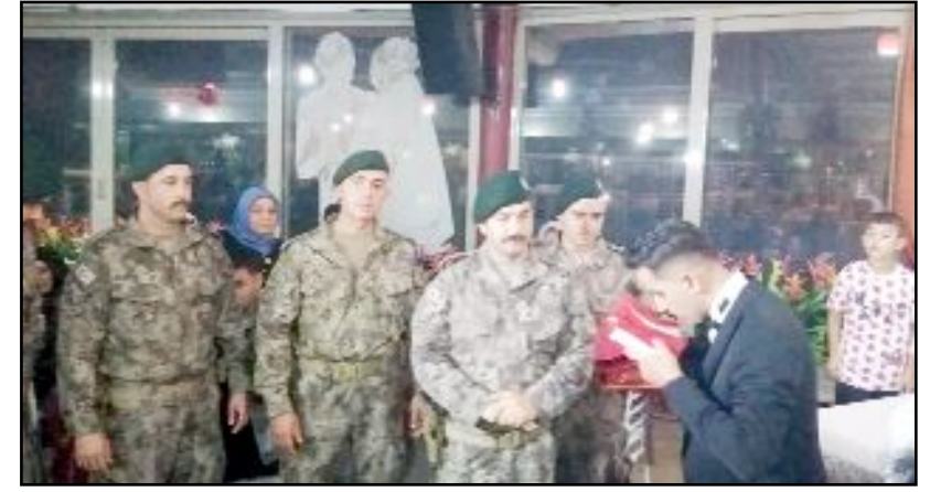
Silah arkadaşları öğretmen olan şehit kızını yalnız bırakmadı.