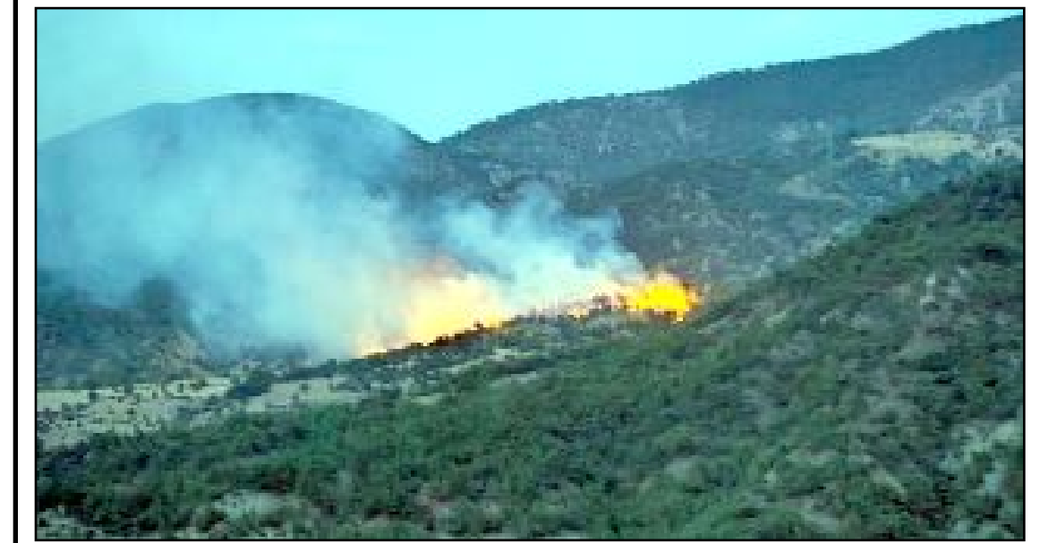
Sarp kayalıklardan oluşan bölgeye güçlükle ulaşan itfaiye ekipleri yangına müdahale etti.