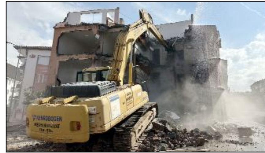
Belediye Başkanı Aşgın, yolları genişleterek daha ulaşılabilir bir şehir hedefini hayata geçirdiklerini söyledi.

mak için kamulaştırma çalışmalarımız devam ediyoruz. Bölgede başlattığımız yıkım çalışmalarının ardından yol genişletme çalışmalarımızı da en kısa sürede tamamlamaya geçeceğiz." diye konuştu. (Haber Merkezi)