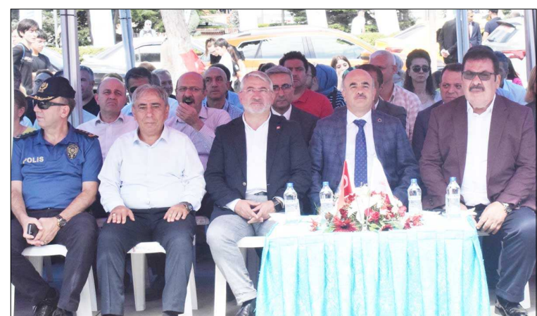
Ödül törenine protokol üyeleri yoğun ilgi gösterdi.