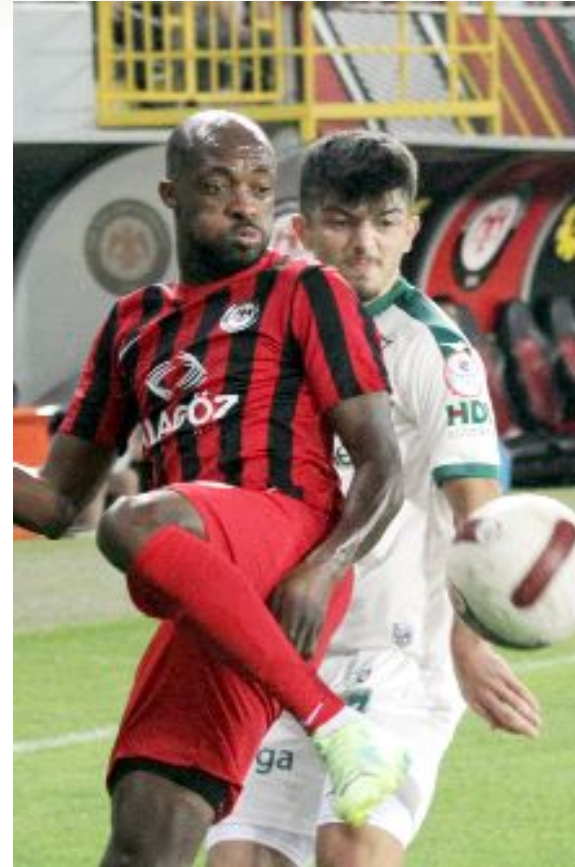
Ahlatçı Çorum FK, bu sezon evinde oynadığı ilk maçta Giresunspor'a 2-0 yenildi.

7 puanlı 4.sıradaki Gençlerbirliği ile 6 puanlı 5.sıradaki Ahlatçı Çorum FK arasında, yarın Çorum Şehir Stadyumu'nda oynanacak maç