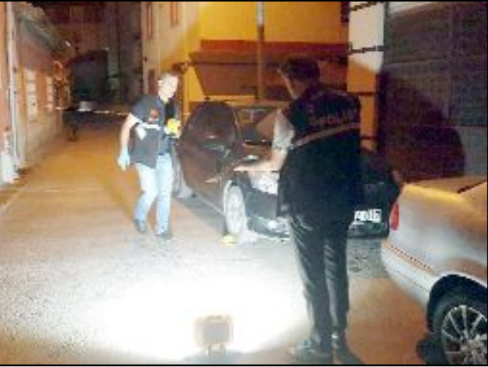
Olay, Ulukavak Mahallesi Selimiye 2. Sokak üzerinde meydana geldi.

Çorum'da içerisinde çok sayıda yolcunun bulunduğu şehirlerarası otobüs kaza yaptı. 2 kişinin yaralandığı kazada faciadan dönüldü. Alınan bilgiye göre Hatay-Rize seferini yapan A.H. idaresindeki 38 YY 636 plakalı yolcu otobüsü, Çorum-Ankara karayolu Yaydığın kavşağında bir nedenle kontrolden çıktı. Trafik lambaları, trafik levhaları ve orta refüje çarpan otobüsün sürücüsü ile birlikte otobüste yolcu olarak bulunan M.K., yaralandı. Yaralıları olay yerine sevk edilen sağlık ekipleri ve yapılan müdahalenin ardından Hitit Üniversitesi Erol Ölçek Eğitim ve Araştırma Hastanesi'ne kaldırılarak tedavi altına alındı. (Tuğay GÖKTÜRK)