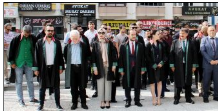
Yeni adli yıl açılış nedeniyle tören düzenlendi.