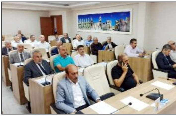
İl Genel Meclisi'nde Eylül ayı toplantıları üyelerin katılımı ile başladı.

Elin elimde değil Mazzer belimde değil Yıkırım seni Dersim Ferman elimde değil