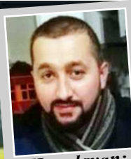
Hazırlayan: Rifat KARA