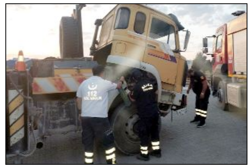
Alaca Şoförler ve Nakliyeciler Odasına ait vincin motor bölümüne hastane bahçesinde kedi girdi.