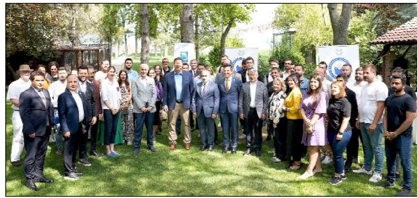
Alapala Akademi ve İnovasyon Merkezi'nde değirmencilik eğitiminin açılışına katılanlar toplu halde...