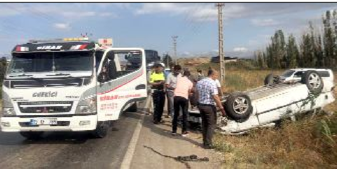
Yaralıları sağlık ekiplerince yapılan müdahalenin ardından Hitit Üniversitesi Erol Oğçok Eğitim ve Araştırma Hastanesi'ne kaldırıldı.