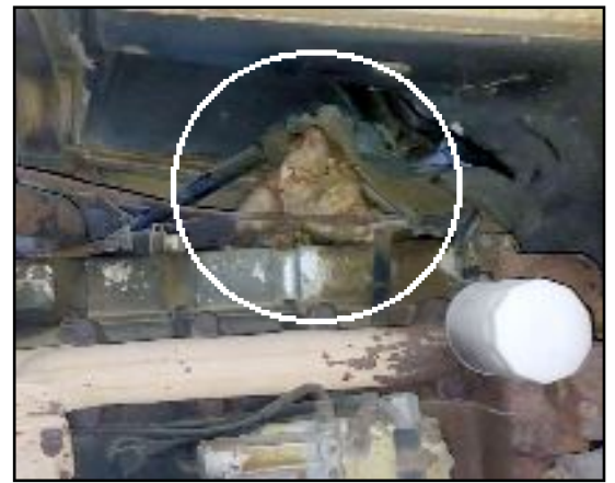
Alaca Belediyesine bağlı itfaiye ekipleri, uzun uğraşlar sonucu kediyi çıkardı.

kediyi çıkardı. Bir anda vinçten atlayan kedi, hızla uzaklaştı. (AA)