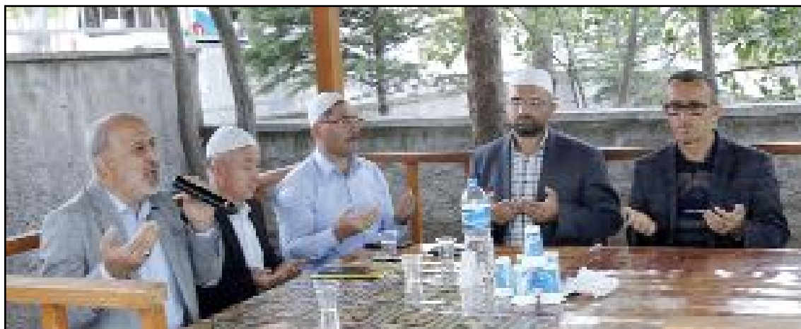
Buharaevler Mahallesi'ndeki evin önünde düzenlenen Mevlid'de din görevlilerince dua okundu.