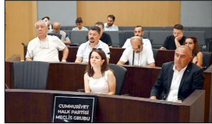
Belediye Meclis Salonu'nda yapılan toplantıda 10 gündem maddesi görüşülerek karara bağlandı.