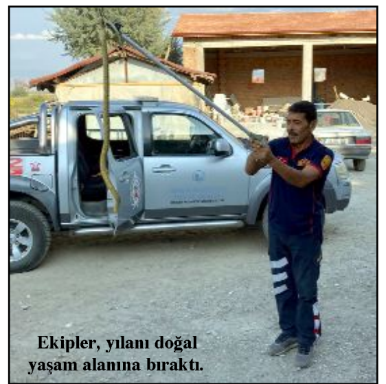
Ekipler, yılanı doğal yaşam alanına bıraktı.

Ekipler, yılanı doğal yaşam alanına bıraktı.