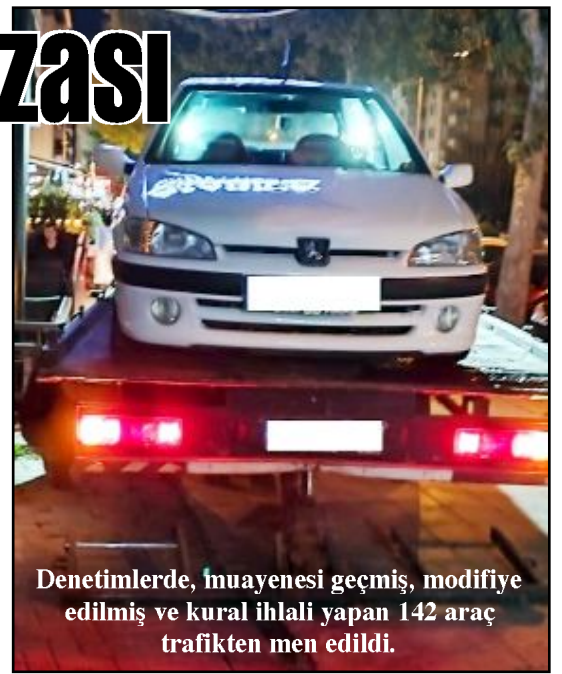
Denetimlerde, muayenesi geçmiş, modifiye edilmiş ve kural ihlali yapan 142 araç trafikten men edildi.