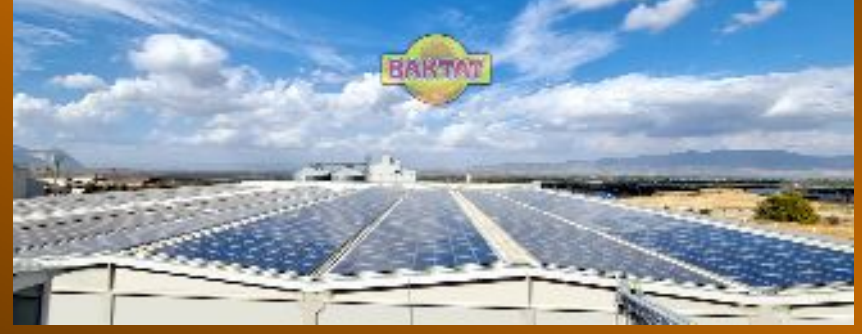
BAKTAT'ın Turgutlu'daki GES panelleri...

● Öte yandan, Baktat ve Suntat markaları, İstanbul TÜYAP'ta bugün başlayacak gıda fuarı WorldFood İstanbul'daki yerini alıyor. 9 Eylül'e kadar devam edecek fuarda, Çorum'un bu ünlü markaları 4 numaralı salonda stant açacak.