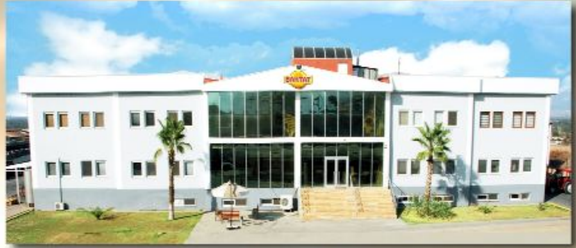
Turgutlu'daki eski ve yeni binalarımız.

Ayrıca yatırımı devam eden 2023 yılı projemiz olan yeni üretim tesisi ve idari binamızı yıl sonuna kadar tamamlayıp üretim kapasitemizi artırma hedefimize ulaşacağız .