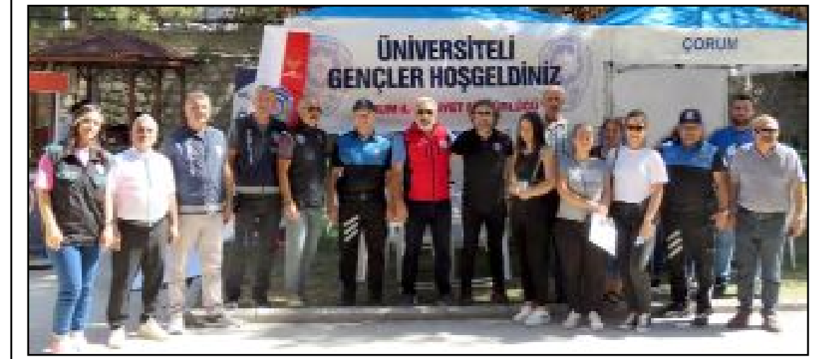
Emniyet Müdürlüğü'nce Hitit Üniversitesi'ne bağlı fakülte ve meslek yüksekokullarını kazanan öğrencilerin güvenli ortamda eğitim hayatlarını sürdürebilmeleri için stant açıldı.