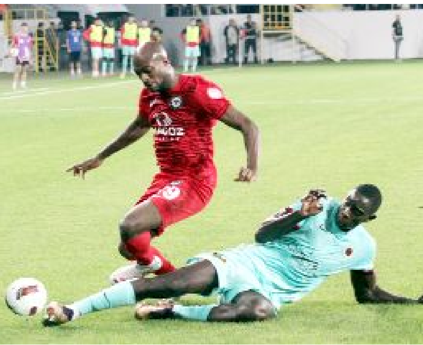
Ahlatçı Çorum FK, sezonun ikinci iç saha maçında, Başkent ekibi Gençlerbirliği'ne 1-0 yenildi.