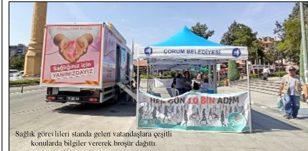
Sağlık görevlileri standa gelen vatandaşlara çeşitli konularda bilgiler vererek broşür dağıttı.