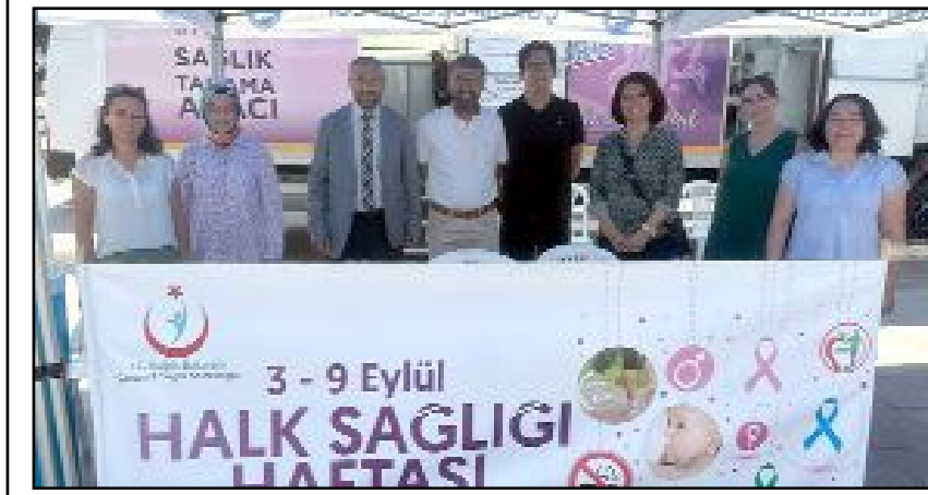
İl Sağlık Müdürlüğü tarafından Halk Sağlığı Haftası etkinlikleri kapsamında Saat Kulesi önüne stant açıldı.

Toplum farkındalığını artırma ve bilinçlendirme amacıyla 10.00-16.00 saatleri arasında faaliyetlerini sürdüren Sağlık Müdürlüğü standında mamografi ve karbonmonoksit testleri yapılarak vatandaşlara çeşitli konularla ilgili bilgiler verilirken sağlıklı yaşam olgusuna dikkat çekildi. Vatandaşlara çeşitli konularda broşürler de dağıtılan etkinlikte hareketli yaşam, fiziksel aktivite ve doğru beslenmenin önemine de değinildi. (Volkan SINAYUÇ)