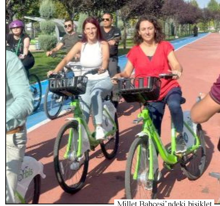
Millet Bahçesi'ndeki bisiklet turundan görüntüler...

Bu kapsamda, Süslü Kadınlar Ekibi ve Halk Sağlığı Başkanlığı'nın organizasyonu ile Millet Bahçesi'nde bir "bisiklet turu" gerçekleştirildi. (Haber Merkezi)