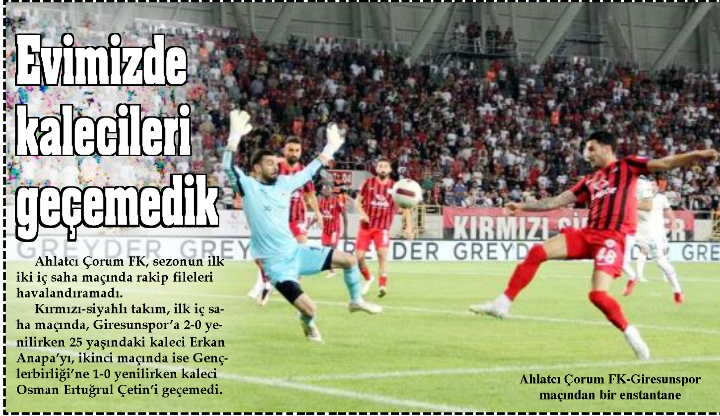
Ahlatçı Çorum FK-Giresunspor maçından bir enstantane