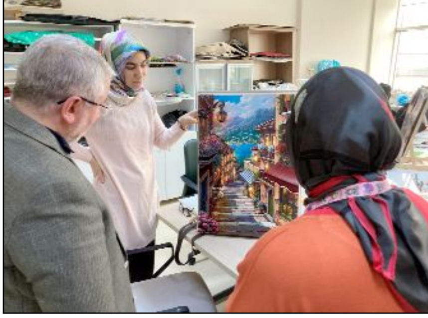
Belediye Başkanı Aşkın da zaman zaman kursları ziyaret ediyor.