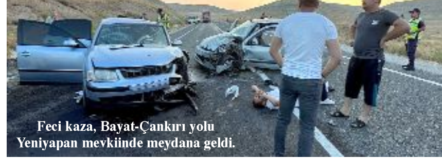
Feci kaza, Bayat-Çankırı yolu Yeniyanan mevkiinde meydana geldi.