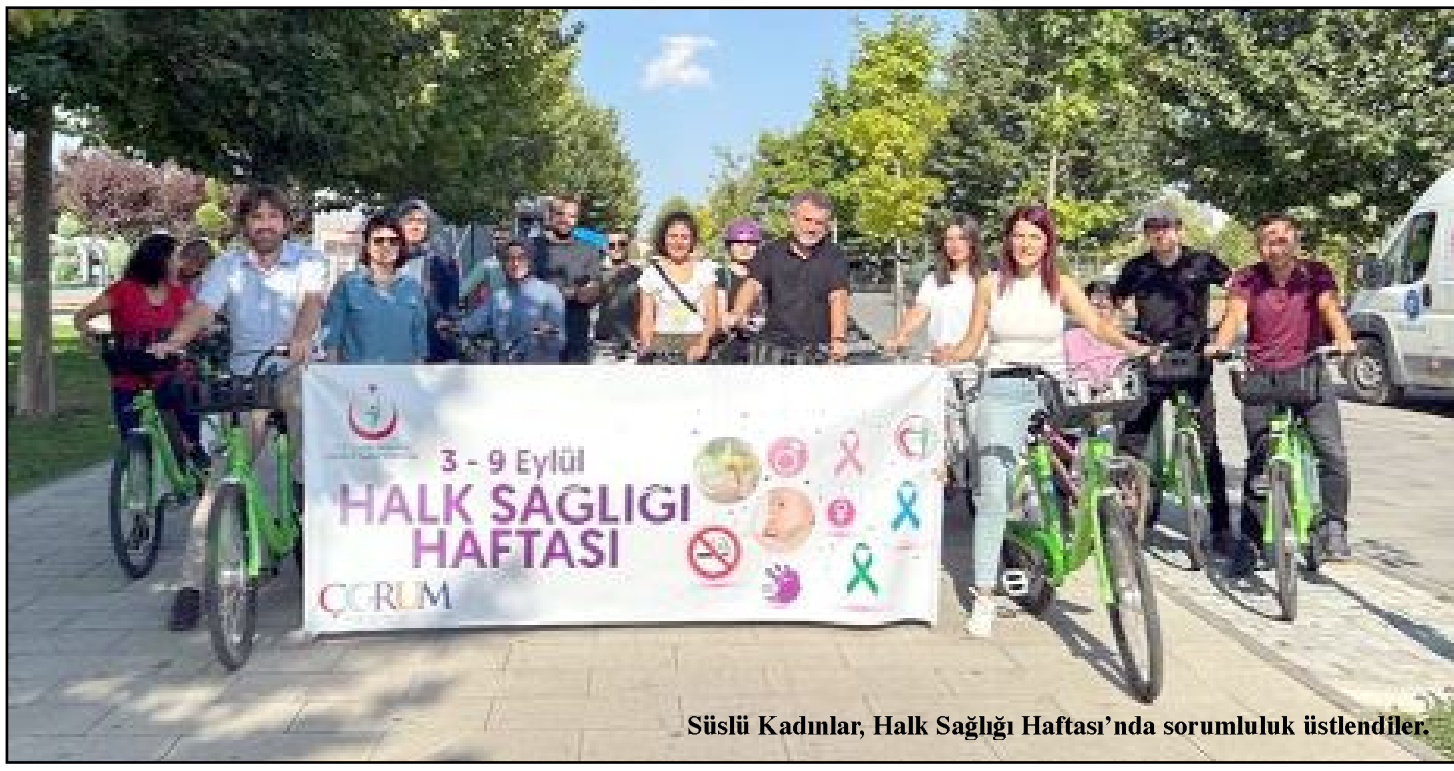
Süslü Kadınlar, Halk Sağlığı Haftası'nda sorumluluk üstlendiler.

SAĞLIKLI BESLENME VE FİZİKSEL AKTİVİTE KONUSUNDA DAHA AYRINTILI BİLGİ ALMAK, DİYETİSYEN VE FİZİKSEL AKTİVİTE DANIŞMANLARIMIZDAN ÜCRETSİZ OLARAK HİZMET ALMAK İÇİN SAĞLIKLI YAŞAM MERKEZLERİMİZİ ZİYARET EDEBİLİRSİNİZ.