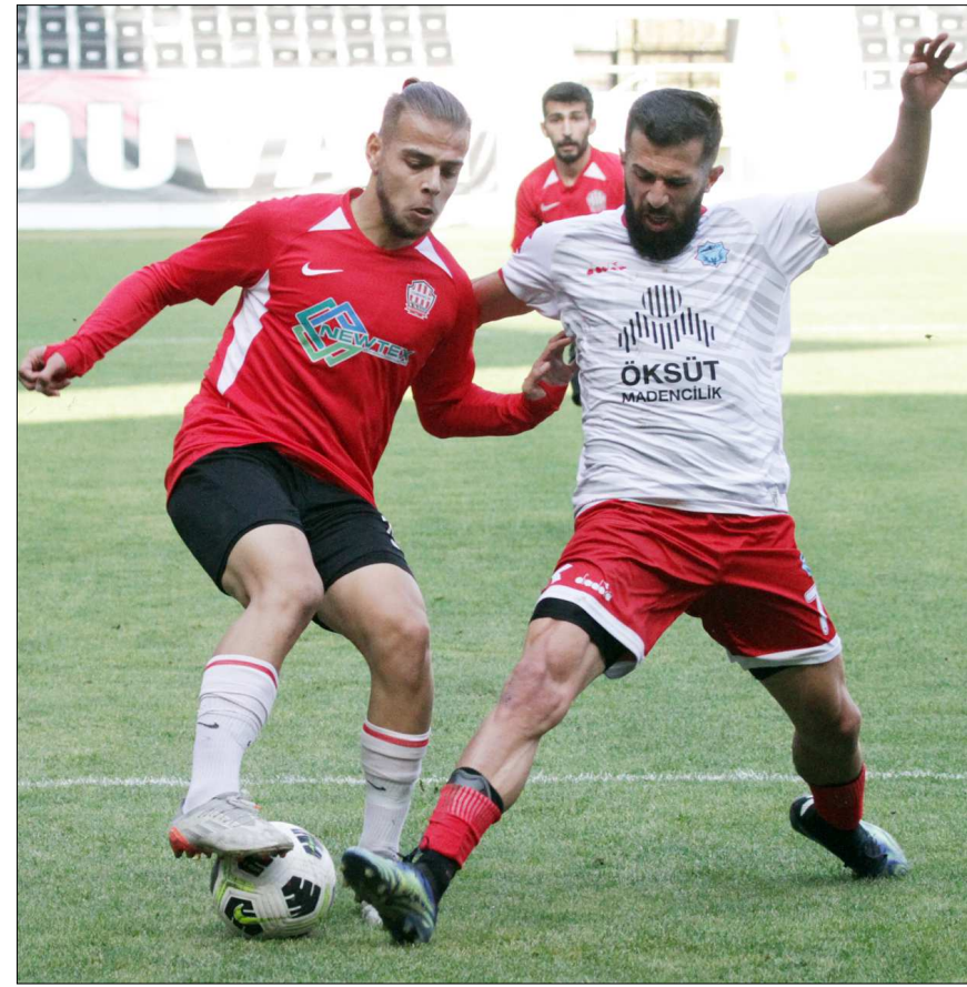
Osmancık Belediyespor'un geçtiğimiz sezon oynadığı maçtan bir enstantane...

ilçesi olarak Çorum sporuna uzun yıllar önemli katkı sağladıklarını belirten Kent, "Sadece kendi ilçe taraftarımızdan değil merkez ve diğer ilçe taraftarlarından da destek görmek istiyoruz. Nihayetinde bu takımımız dışında Çorum takımı olarak mücadele ediyor. Bu kapsamda bu sene yalnız bırakılmamayı istiyoruz" dedi. (Rifat KARA)