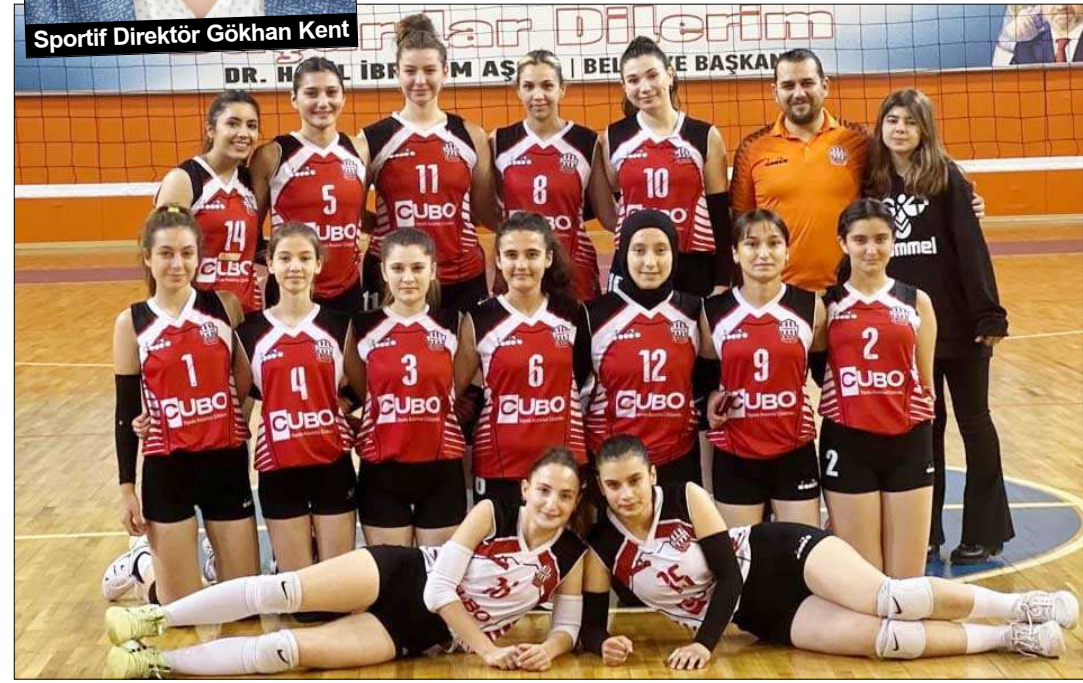
2022-2023 sezonunda 2.Lig'de mücadele eden Osmancık Belediyespor kadın voleybol takımı...