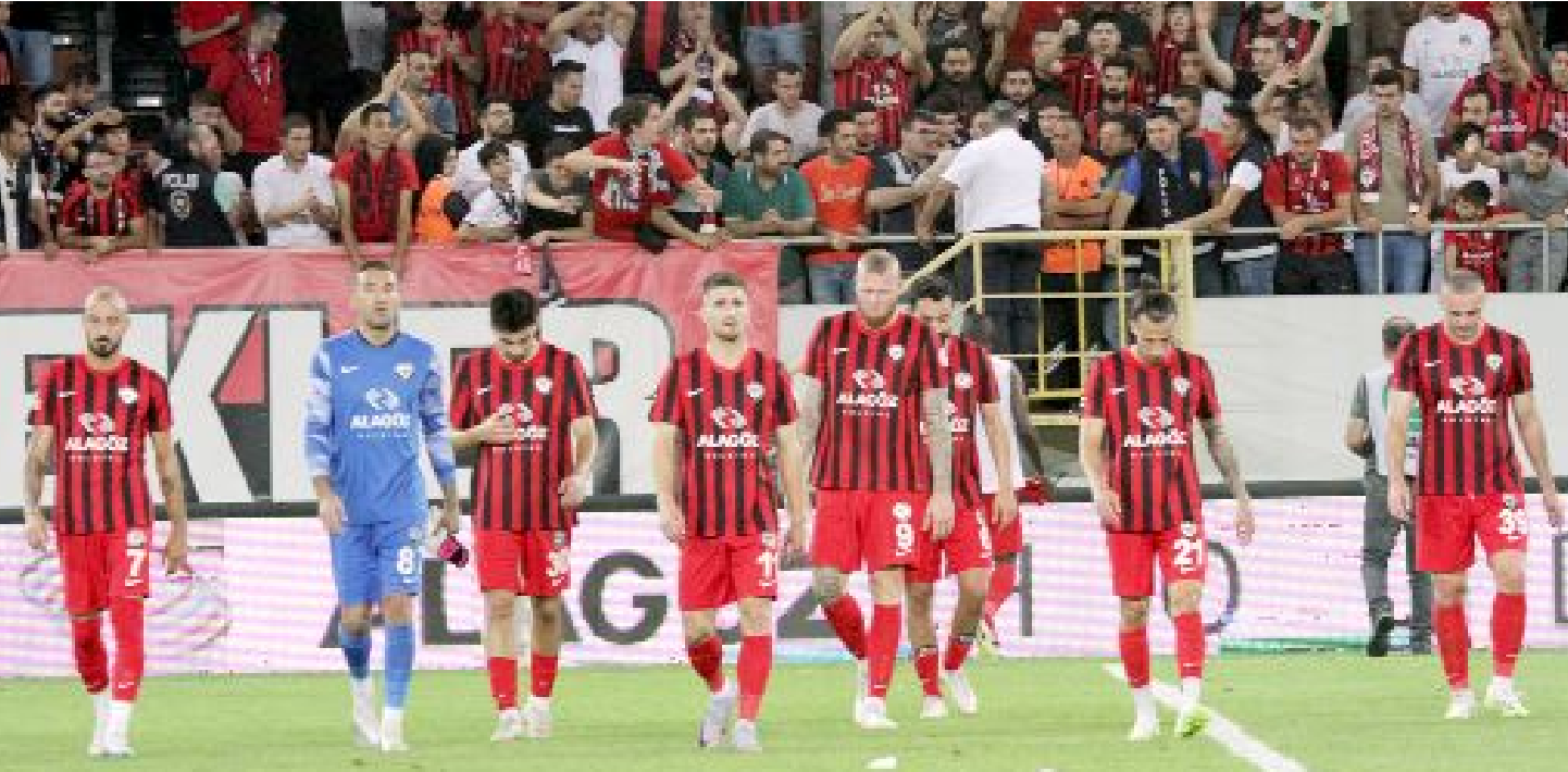
Kırmızı-siyahlılar, ilk iki iç saha maçını gol atamadan kapatırken, sahadan puansız ayrılmanın üzüntüsünü yaşadılar.

● Deplasmanda-ki iki maçını da kazanan Ahlatçı Çorum FK'nın iç sahada aldığı Giresunspor ve Gençlerbirliği yenilgileri kulüp tarihine geçti. Profesyonel futbol liglerindeki 12.sezonunu geçiren kırmızı-siyahlı takım, tarihinde ilk kez, sahasında oynadığı ilk iki maçı, hem de gol atamadan kaybetti.