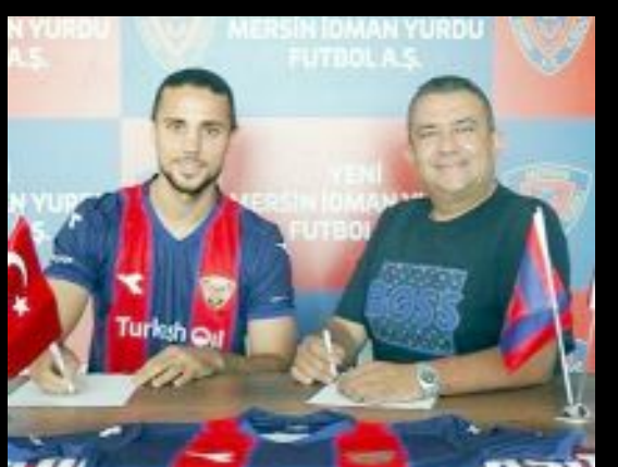
Deneyimli stoper, Yeni Mersin İdmanyurdu Futbol A.Ş. ile 1 sezonluk sözleşme imzaladı.

33 yaşındaki savunma oyuncusu, geçen sezona 2.Lig ekibi Fethiyespor'da başlarken, Muğla ekibinde 7 karşılaşmaya çıktı ve 630 dakika süre aldı. Devre arasında, Başkent'in 2.Lig temsilcilerinden Etimesgut Belediyespor'a transfer olan deneyimli stoper, 4 maçta sahada 321 dakika kaldı. (Hüseyin AŞKIN)