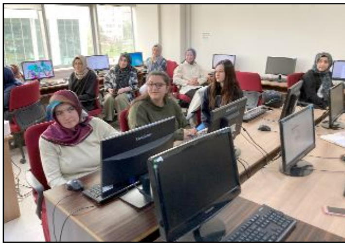
İlimizdeki 8 adet Kadın Kültür ve Sanat Merkezi'nde yeni dönemde verilecek kurslara kayıtlar başladı.