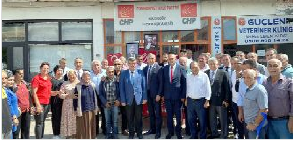
CHP'nin ilçe kongreleri tüm hızıyla devam ediyor.