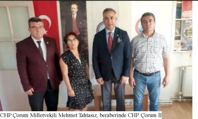
CHP Çorum Milletvekili Mehmet Tahtasız, beraberinde CHP Çorum İl Başkanı Ümit Er ve Merkez İlçe Başkanı Ulaş Tokgöz'le birlikte eğitimle ilgili sendikaları ziyaret ederek, sorun ve taleplerini dinledi.

Cumhuriyet Halk Partisi (CHP) Çorum Milletvekili Mehmet Tahtasız, beraberinde CHP Çorum İl Başkanı Ümit Er ve Merkez İlçe Başkanı Ulaş Tokgöz'le birlikte eğitimle ilgili sendikaları ziyaret ederek, sorun ve taleplerini dinledi.