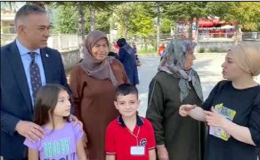
CHP Çorum Milletvekili Mehmet Tahtasız, uyum eğitimine katılan öğrenciler ve velilerle bir araya geldi.