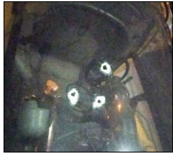
Olay, Ulukavak Mahallesi Adnan Özejder Caddesi'nde meydana geldi.

Edinilen bilgiye göre, cadde üzerine gelen kimliği belirsiz kişi ya da kişiler N.T.'ye ait park halindeki biçerdöveri pompalı tüfek ile kurşunlayarak olay yerinden uzaklaştı. Silah seslerini duyan N.T.'nin ihbarı üzerine olay yerine polis ekibi sevk edildi. Olayda ölen ya da yaralanan olmazken polis ekipleri olay yerinde incelemelerde bulundu. Polis ekipleri saldırıyı gerçekleştiren zanlıların yakalanması için çalışma başlattı. (İHA)