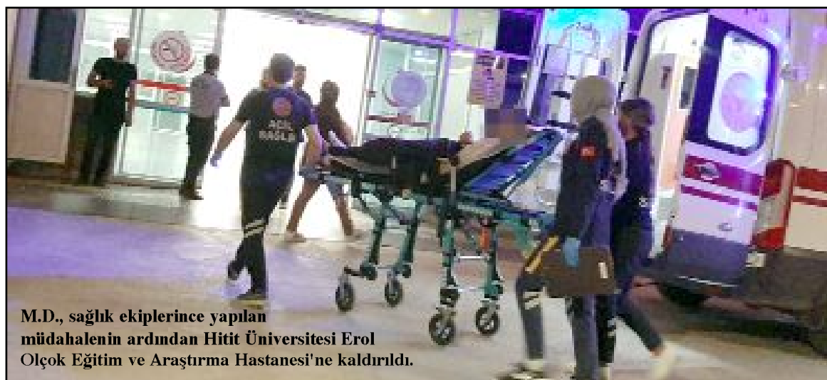
M.D., sağlık ekiplerince yapılan müdahalenin ardından Hitit Üniversitesi Erol Olçok Eğitim ve Araştırma Hastanesi'ne kaldırıldı.