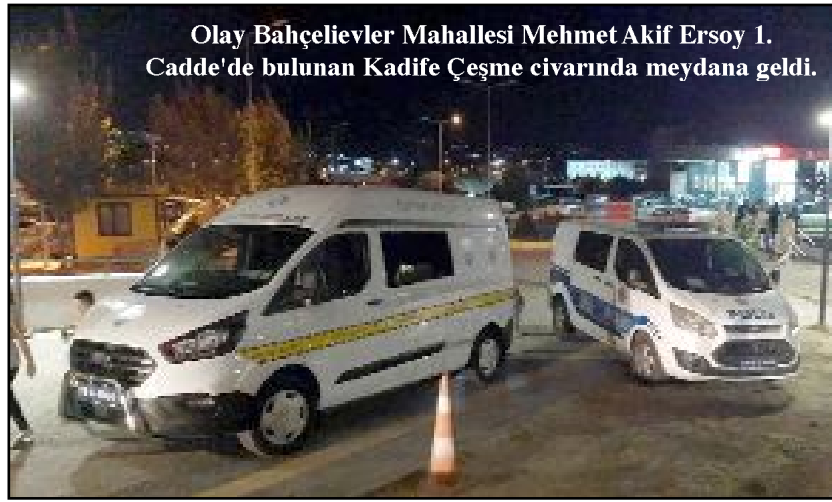
Olay Bahçelievler Mahallesi Mehmet Akif Ersoy 1. Caddede bulunan Kadife Çeşme civarında meydana geldi.

Arkadaşları tarafından otomobil ile ambulansın bulunduğu yere getirilerek sağlık ekiplerine teslim edilen E.I., Hitit Üniversitesi Erol Olçok Eğitim ve Araştırma Hastanesi'ne kaldırılarak tedavi altına alındı. Polis olayla ilgili inceleme başlattı. (Tugay GÖKTÜRK)