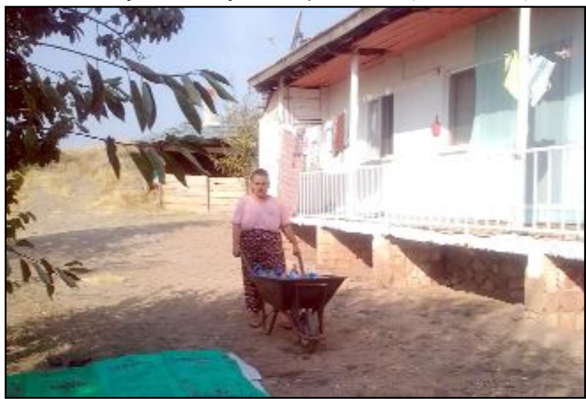
Laçın'e bağlı Gözübüyük köyünde yüksekte oturan köylüler evlerinde su akmadığı için taşıma suyla hayatlarını sürdürüyor.

suyunu paralı yapısın. Yetkililerden köye gelen suyun denetlenmesini talep ediyoruz. Bizimle kimse ilgilenmiyor." diye konuştu. (Haber Merkezi)