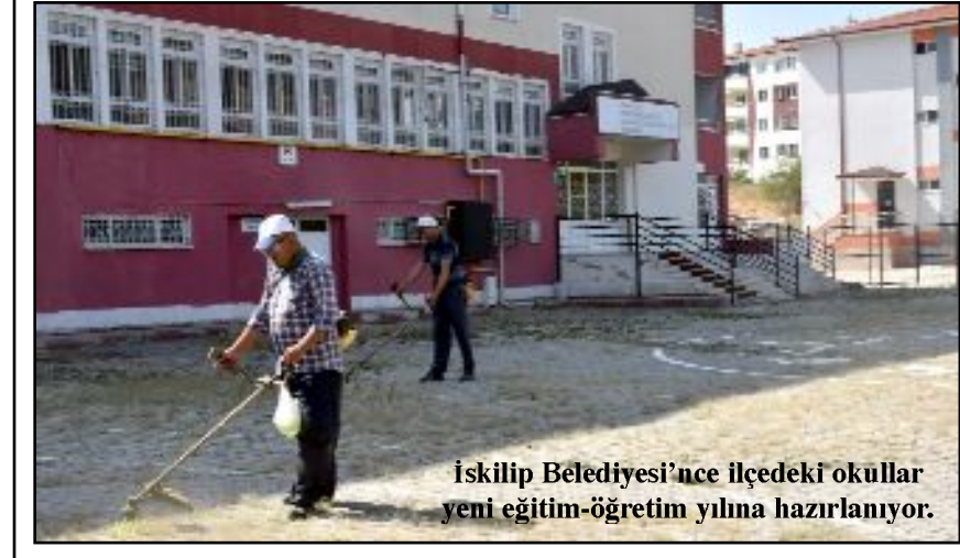
İskilip Belediyesi'nce ilçedeki okullar yeni eğitim-öğretim yılına hazırlanıyor.