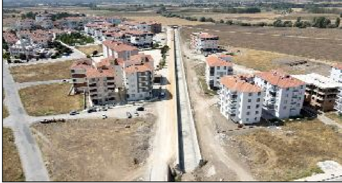
Yaklaşık 5 kilometrelik bir alanda gerçekleşen çalışmalarda öncelikli olarak olası su taşkınlarına karşı önlem alınması amaçlanıyor.