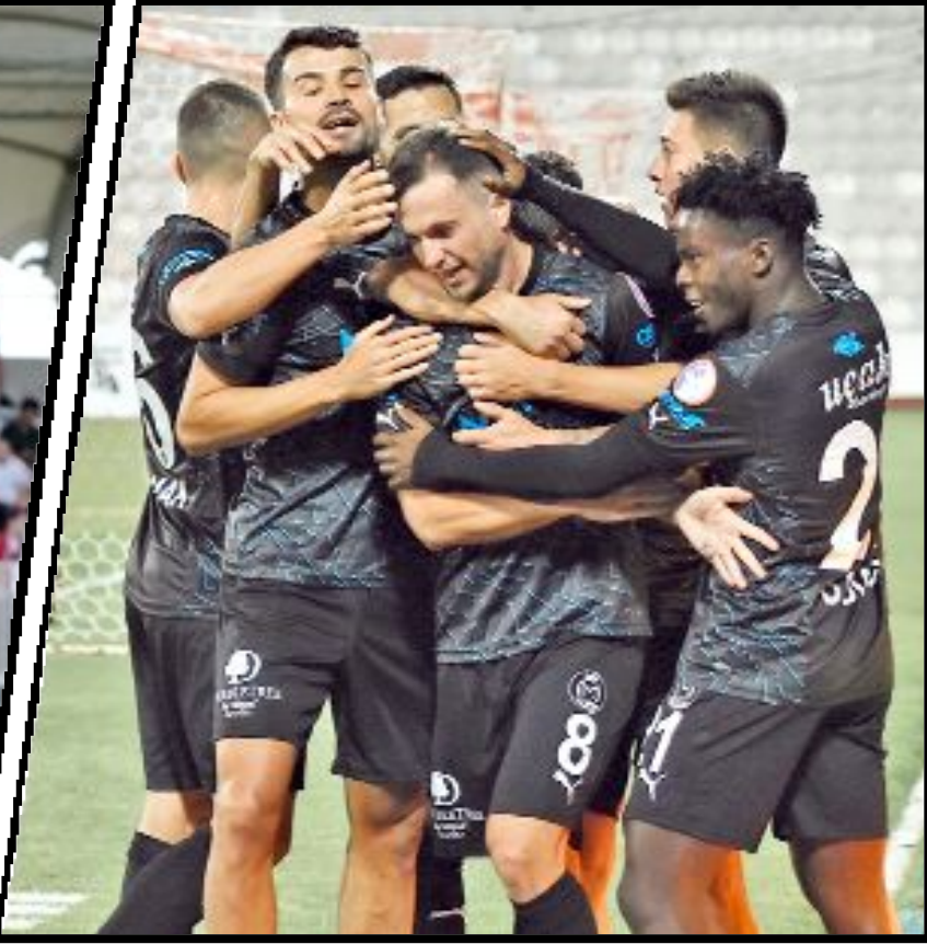
Manisa FK, deplasman galibiyetlerini Kocaelispor'a karşı 2-0, Erzurumspor'a karşı da 2-1'lik skorla aldı.