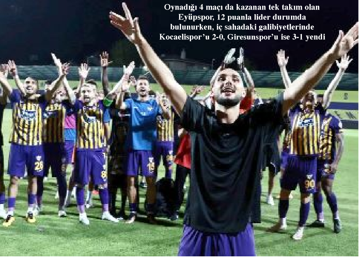
Oynadığı 4 maçı da kazanan tek takım olan Eyüpspor, 12 puanla lider durumda bulunurken, iç sahadaki galibiyetlerinde Kocaelispor'u 2-0, Giresunspor'u ise 3-1 yendi

Ankara Keçiörengücü, Erzurumspor, Boluspor, Ümraniyespor, Altay ve Tuzlaspor'un henüz deplasman galibiyeti bulunmazken, Altay ve Tuzlaspor aynı zamanda ligin deplasman- da puan alamayan iki takımı olarak kaldılar. (Hüseyin AŞKIN)