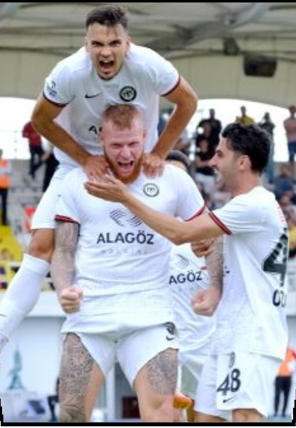
Ligdeki iki galibiyetini de deplasmanda alan Ahlatçı Çorum FK, Tuzlaspor'u 3-0, Göztepe'yi ise 2-1 mağlup etti.