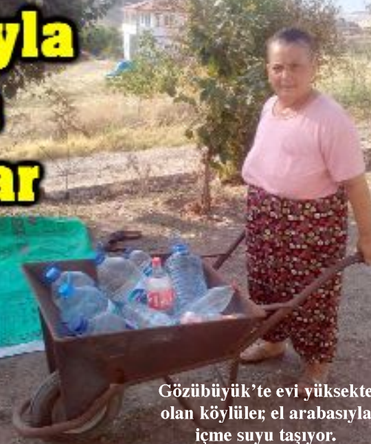
Gözübüyük’te evi yüksekte olan köylüler, el arabasıyla içme suyu taşıyor.

Çorum’un Lâçın İlesine bağlı Gözübüyük köyünde yüksekte oturan köylüler, evlerinde su akmadığı için taşıma suyuyla hayatlarını sürdürüyor. •5’de