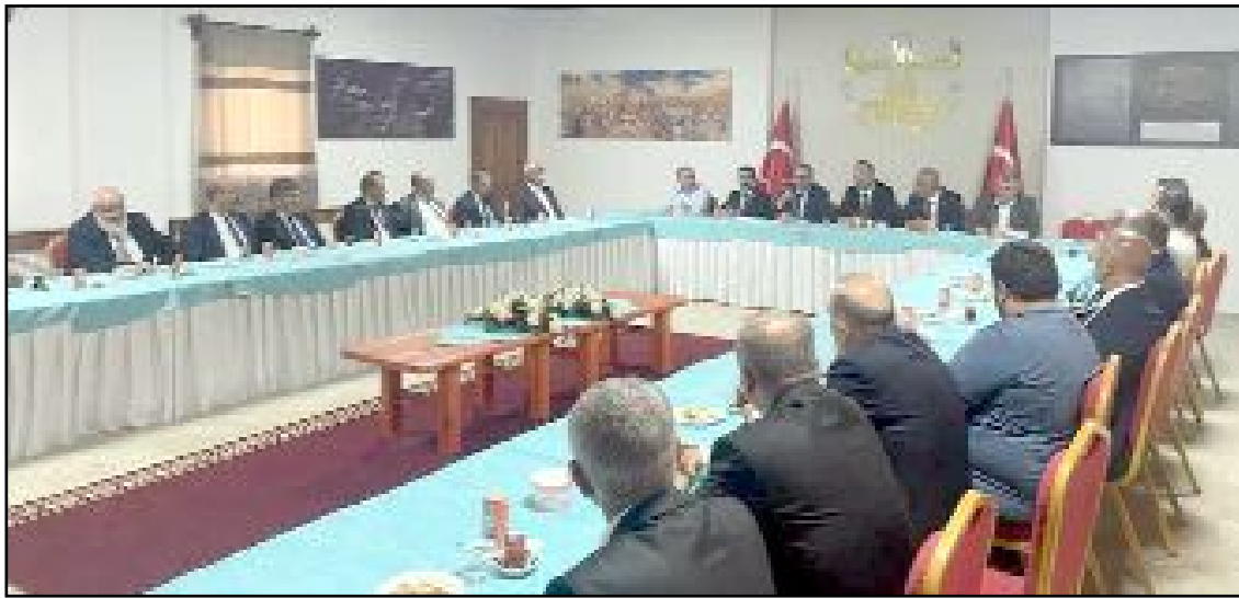
MHP'nin Çorum'daki son kongresi Boğazkale'de yapıldı. Milletvekili Kayıncı, İl Başkanı Çıplak ve İlçe Belediye Başkanları'nın da katıldığı kongre sonrasında istişare toplantısı da düzenlendi.

MHP'de ilçe kongrelerinin tamamlandığını hatırlatan Kayıncı bundan sonra önümüzdeki Mart ayında yapılacak olan seçimlere odaklanacaklarını ve tüm ilçe belediyelerine talip olduklarını bildirdi. (Volkan SINAYUÇ)