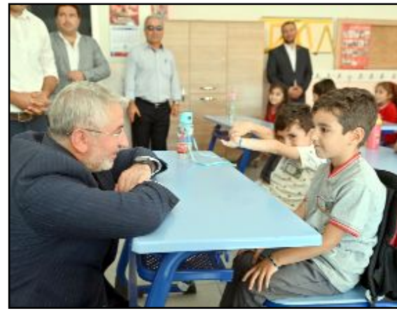
Ziyarete miniklere Belediye'nin hazırladığı kirtasiye malzemeleri dağıtıldı.

Çorum il merkezindeki eğitim kurumlarında bu yıl okula başlayan miniklere kirtasiye dağıtımını yaptıklarını söyleyen Belediye Başkanı Halil İbrahim Aşgın, "Mutlu şehrin mutlu çocukları. İlkokula başlayan miniklerimizi