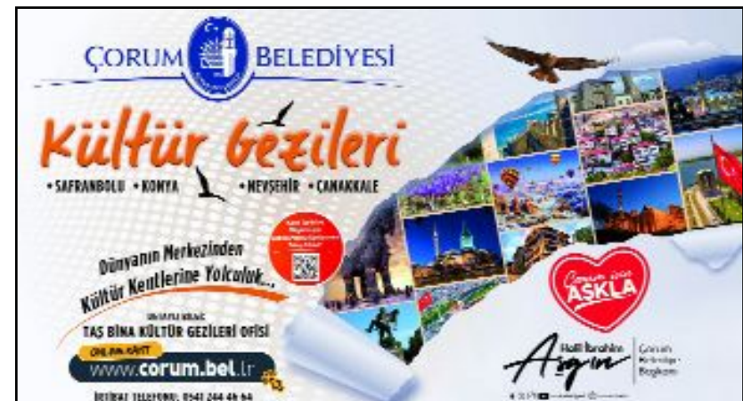
Belediye tarafından yayınlanan kültür gezisi afişi.

Gezilere katılmak isteyen vatandaşların Taş Bina Kültür Gezileri Ofisi'nden detaylı bilgi alabileceği ve başvuruların 11 Eylül 2023 gününden itibaren alınmaya başlanacağını duyuruldu. (Volkan SINAYUÇ)