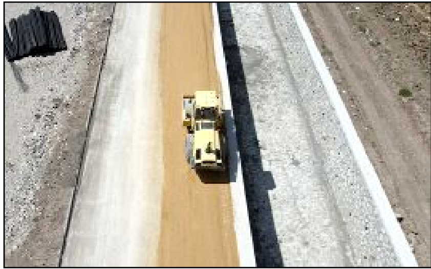
Bayat Gedigi, Garantievler, Özgürevler ve Ahçılar bölgelerini kapsayan dere ıslah çalışmaları devam ediyor.