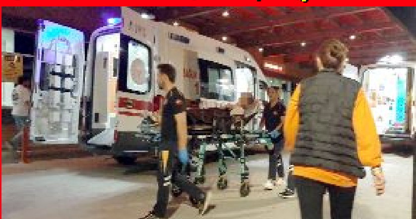
Gülalibey Mahallesi Kapaklı 4. Caddede bulunan bir çocuk parkında tüfekle yaralanan 17 yaşındaki M.D., sağlık ekiplerince hastaneye kaldırıldı.

● Çorum’da gençler arasındaki tartışmada 1 genç silahla vuruldu. •4’de