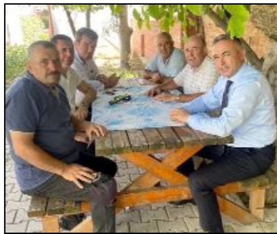
CHP Çorum Milletvekili Tahtasız, Büyükdivan Köyü sakinleri ile bir araya geldi.