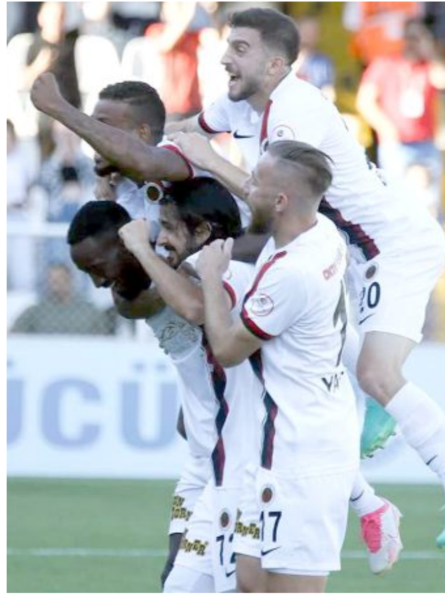
Geçtiğimiz hafta Ahlatçı Çorum FK'yı 1-0 yenerek ilk deplasman galibiyetini alan Gençlerbirliği, Eyüpspor'dan sonra evinde ikide iki yapan tek takım. Başkent ekibi, sahasında oynadığı maçlarda Ümraniyespor'u 2-1, Bodrumspor'u ise 1-0 yendi.

Ankara Keçiörengücü, Erzurumspor, Boluspor, Ümraniyespor, Altay ve Tuzlaspor'un henüz deplasman galibiyeti bulunmazken, Altay ve Tuzlaspor aynı zamanda ligin deplasman- da puan alamayan iki takımı olarak kaldılar. (Hüseyin AŞKIN)