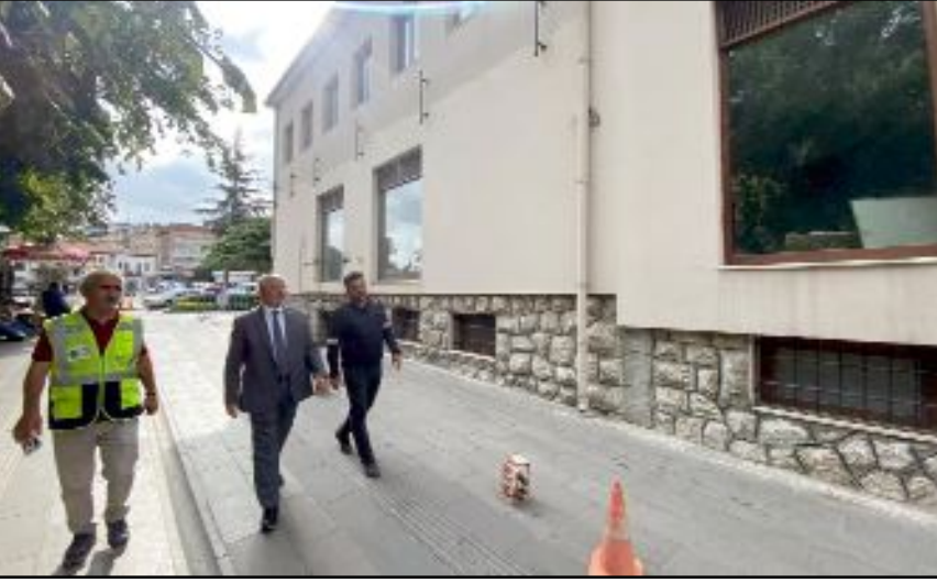
Başkan Aşgın; "Ziraat Bankası binasının yıkımı ile projemizin önündeki bir büyük engeli daha kaldırmış oluyoruz" dedi.