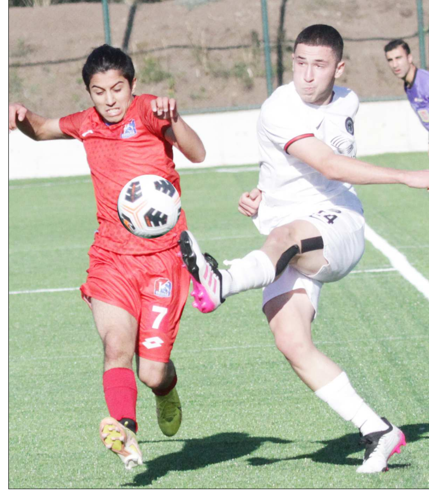
Geçtiğimiz sezon oynanan Çorum FK-Kırıkkale U17 maçından enstantane...