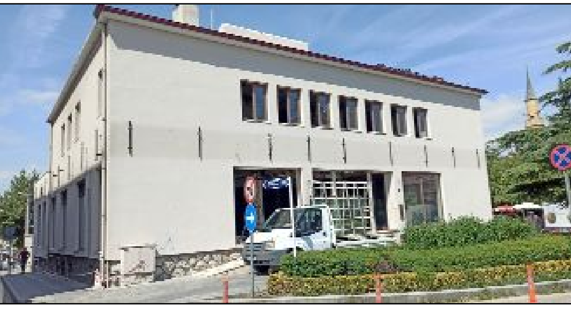
Tarihi Çorum Meydanı projesi kapsamında Ziraat Bankası binasının yıkımına başlanacak.