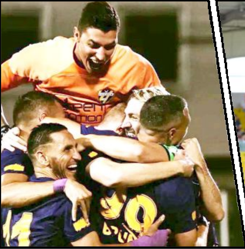
Keçiörengücü'nü 1-0, Tuzlaspor'u da 5-0 yenen Eyüpspor, Ahlatçı Çorum FK ve Manisa FK'nin önünde, averajla en başarılı deplasman takımı durumunda.