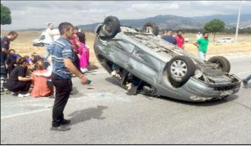
Kaza, Çorum-Merzifon yolunda meydana geldi.