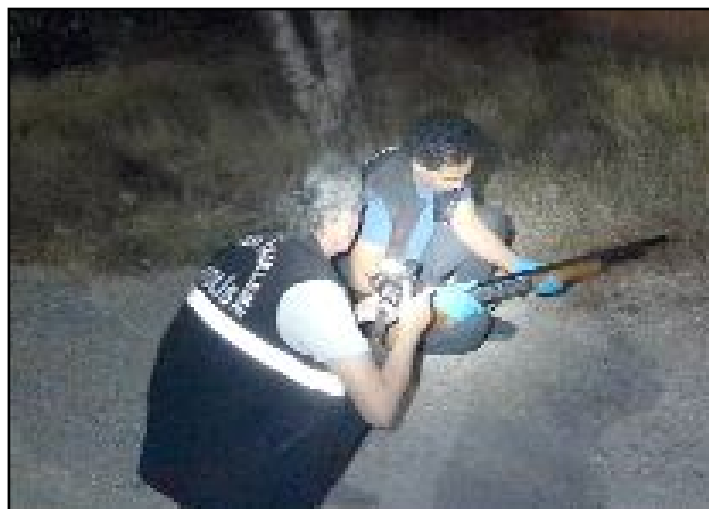
Olay Gülabibey Mahallesi Kapaklı 4. Caddede bulunan bir çocuk parkında meydana geldi.