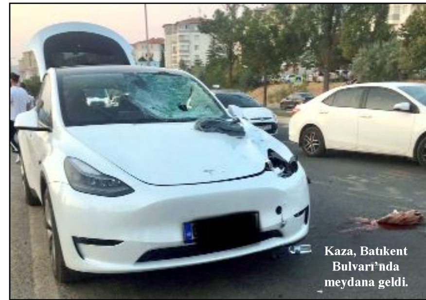
Kaza, Batıkent Bulvarı'nda meydana geldi.