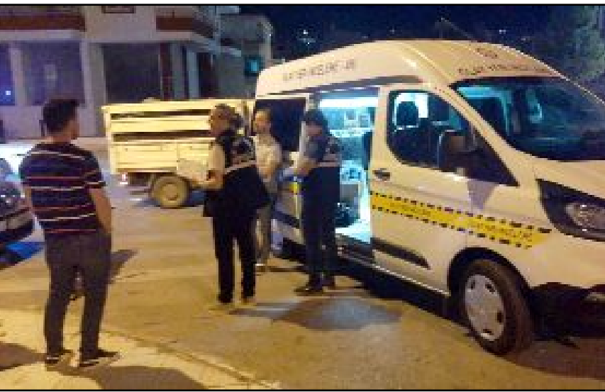
Olayın ihbar üzerine adrese polis ve sağlık ekipleri sevk edildi.