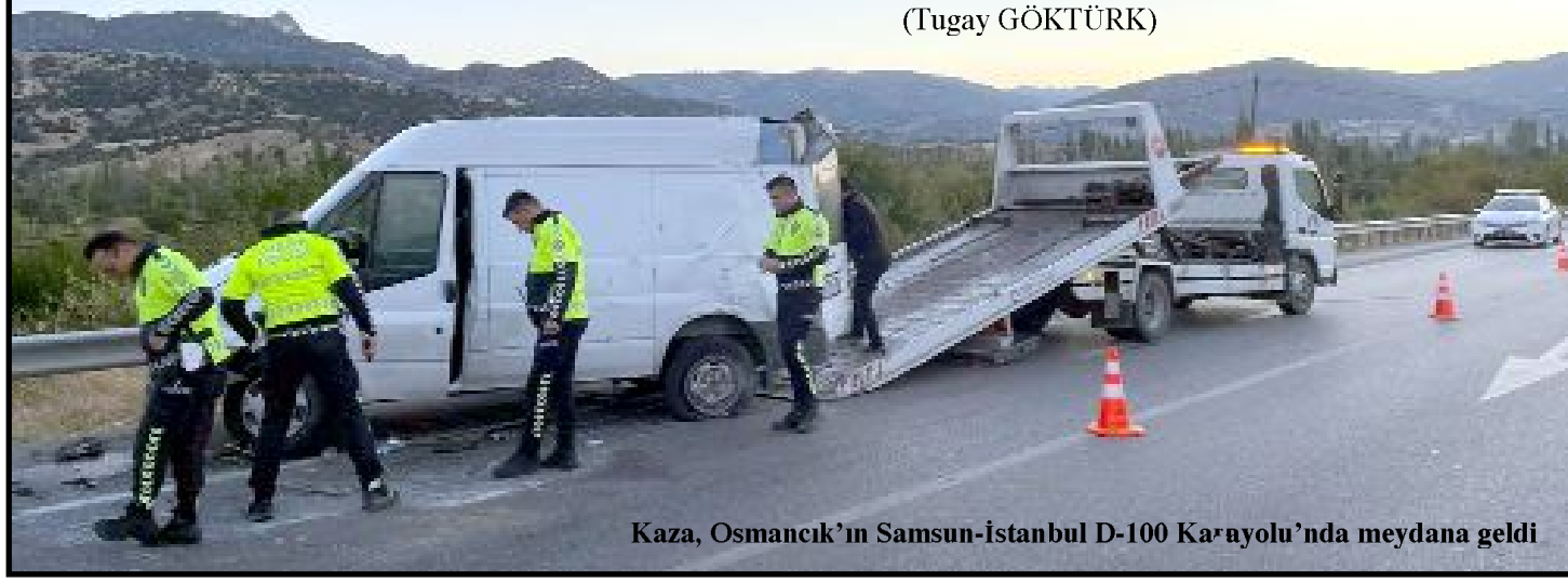
Kaza, Osmaniye'nin Samsun-İstanbul D-100 Karayolu'nda meydana geldi

Çorum'da devrilerek bariyerlere çarpan minibüste bulunan 1'i çocuk 10 kişi yaralandı. Kaza Osmaniye ilçesi Samsun-İstanbul D-100 Karayolu'nda meydana geldi.