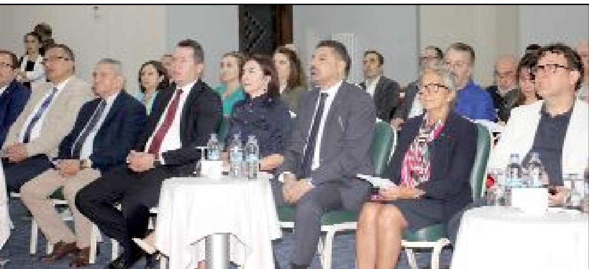
Her dönem farklı konuların ele alındığı "İş Dünyası İçin Yerel Kalkınma" projesinin 5. yıl teması Tedarik Zinciri Güvenliği ve Çevre Dostu Büyüme olarak belirlendi.