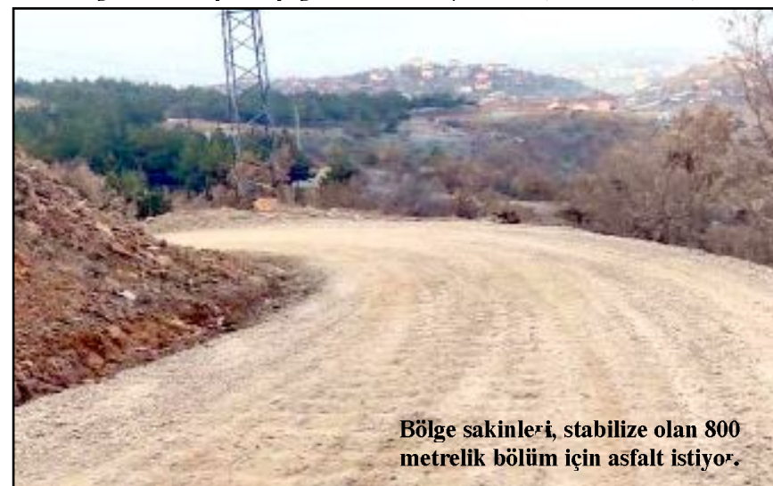
Bölge sakinleri, stabilize olan 800 metrelik bölüm için asfalt istiyor.

dan normal günlerde ise tozdan sıkıntı çektiklerini kaydettiler. (Haber Merkezi)