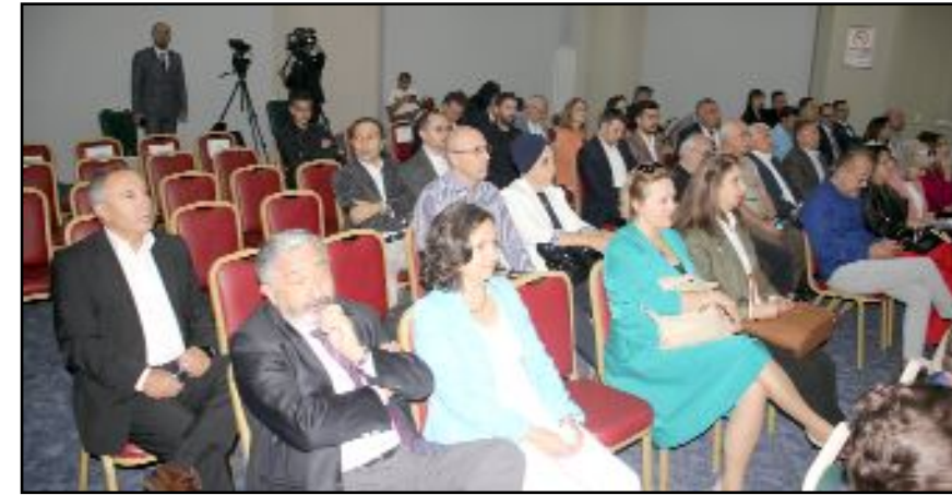
Proje tanıtım toplantısında iş dünyası ve sivil toplum kuruluşlarının temsilcileri ile çok sayıda davetli de hazır bulundu.

Bölgemizin geçmişteki başarılarına baktığımızda, tarım, hayvancılık, ormanlık ve turizm gibi sektörlerde önemli gelişmeler kaydedilmiştir. Ancak bu gelişmelerin daha ileri seviyelere taşınması ve sürdürülebilir bir kalkınma sağlamak için daha fazla çalışmamız gerekmektedir. Altyapıyı geliştirerek potansiyeli daha iyi değerlendirebiliriz. Bu illerin kalkınması için el birliği ile çalışmalıyız. Bu toplantı, bu bölgemiz için potansiyelini değerlendirmek ve daha iyi bir gelecek inşa etmek için atılacak önemli bir adımdır. Hep birlikte çalışarak, bu illerimizi daha da ileriye taşıyabiliriz" şeklinde konuştu. (Volkan SINAYUÇ)