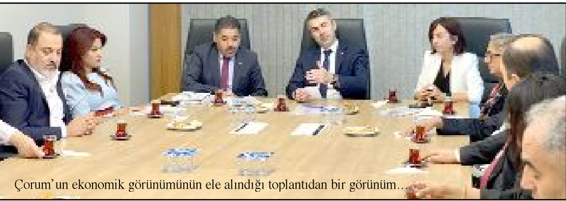
Çorum'un ekonomik görünümünün ele alındığı toplantıdan bir görüntü...