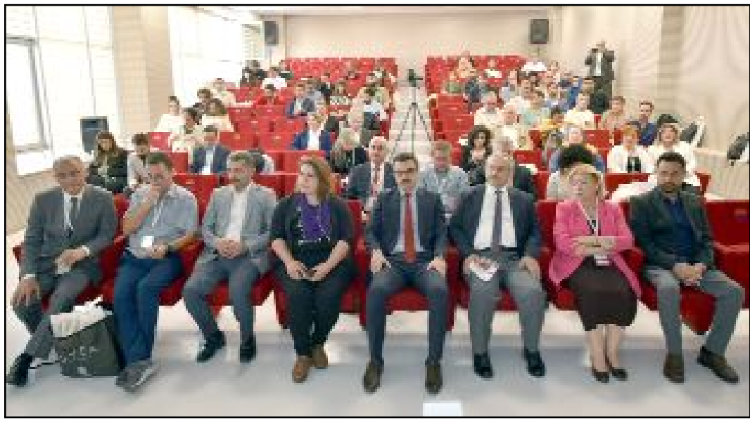
Hitit Üniversitesi'nin ev sahipliğinde düzenlenen Uluslararası Ortaköy-Şapinuva Çalıştayı'nda 53 bildiri sunuldu.

TBMM'de SP ve Gelecek Partisi ile ortak grup kurduklarını anımsatan Atmaca, sayıların az olmasına rağmen TBMM'de milletin sesi olacaklarını dile getirdi. (Taner ŞİMŞEK)