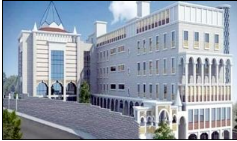
Kocaeli Meryem Hatun İkbal Kız Kuran Kursu

* Furkan Eğitim ve Hizmet Vakfının Manevî Lideri Al-