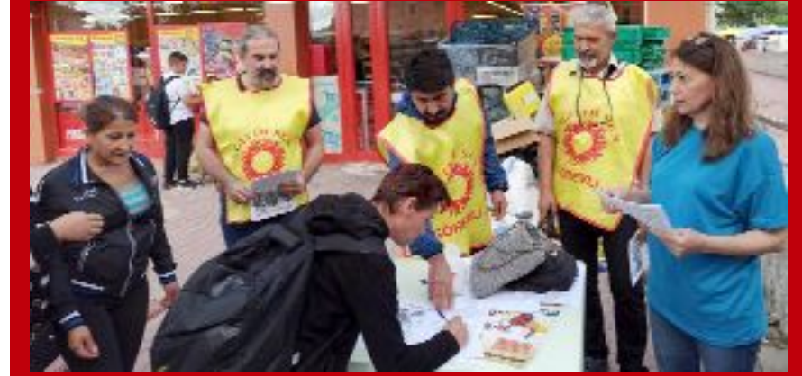
Eğitim-Sen üyeleri, yaklaşık bir hafta boyunca kentin farklı bölgelerinde stant açarak imza toplarken, ÇEDES'in iptal edilmesi talebiyle yarım kitlesel bir basın açıklaması düzenlenecek.

● Eğitim-Sen Çorum Şubesi tarafından okullarda "değerler eğitimi" adı altında imam, hatip ve vaiz görevlendirilmesini öngören ÇEDES projesinin iptal edilmesi için imza kampanyası başlatıldı. •5'de