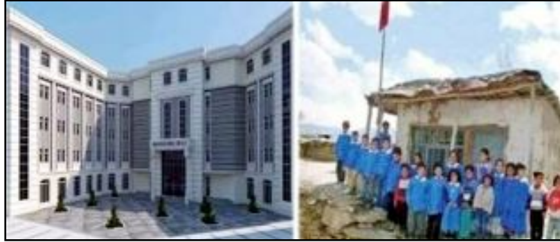
Akçakale Kız Kuran Kursu

nedenle Kur'anın tercümesi olmaz. Türkçe ibadet caiz değildir. Türkçe Kur'an olmaz..."