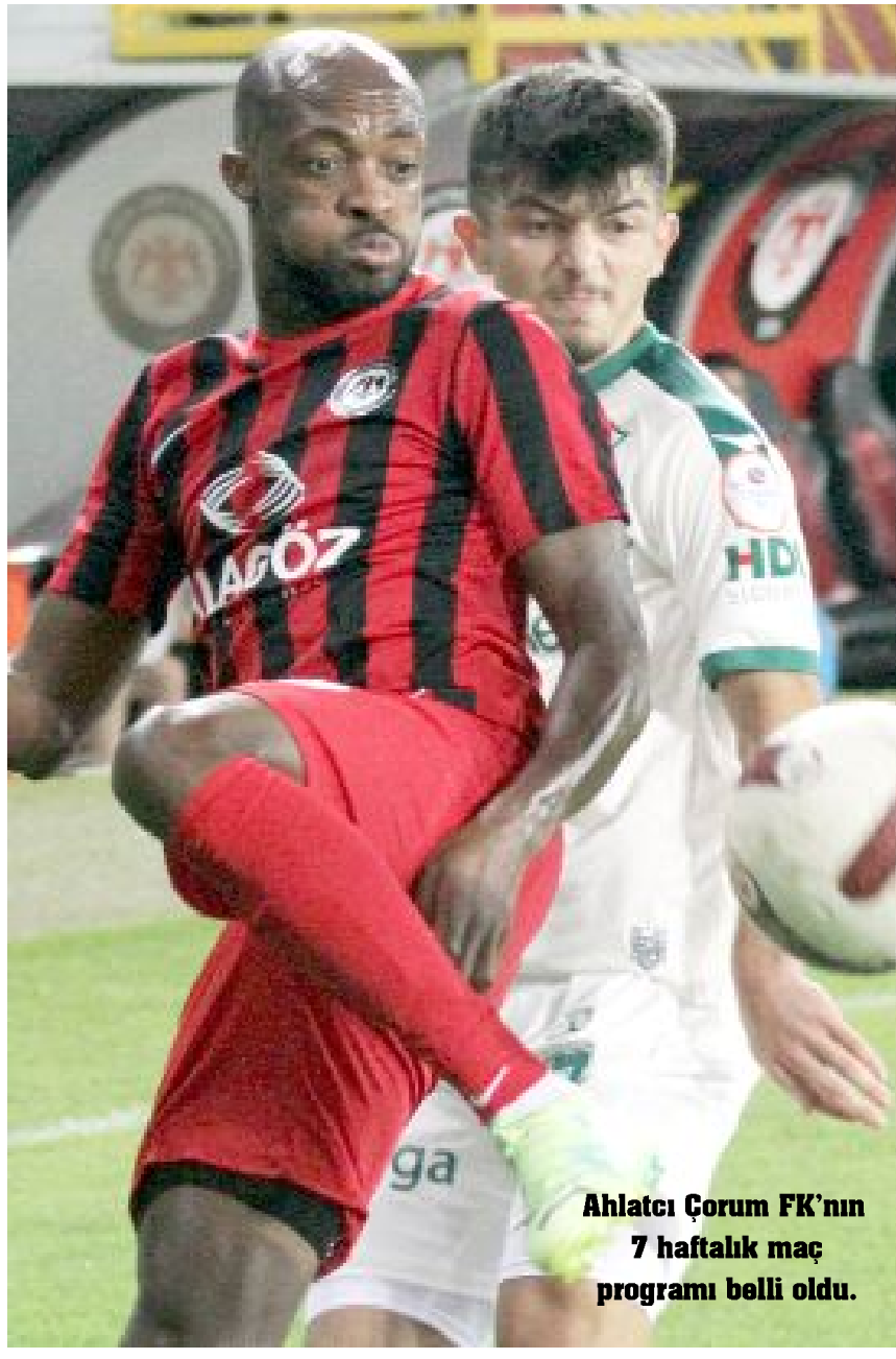
Ahlatcı Çorum FK'nin 7 haftalık maç programı belli oldu.

saat 19.00'da başlayacak. 10.hafta maçları 27-29 Ekim tarihlerinde oy-