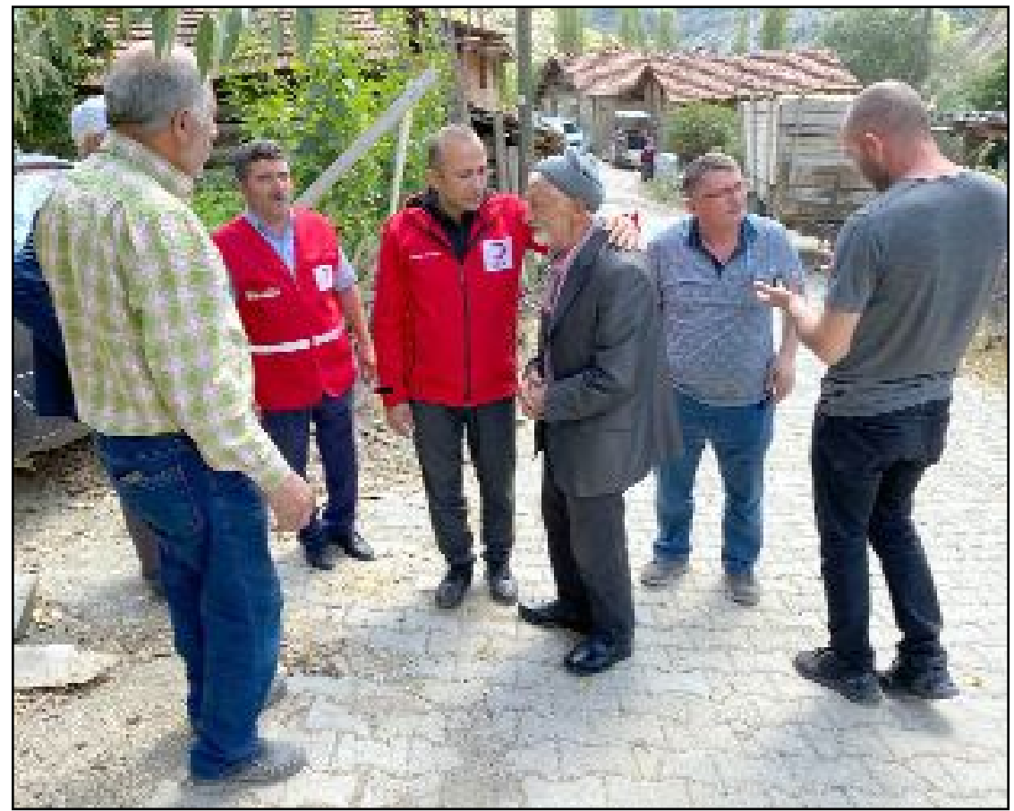
Bayat'ta 2 ev, 3 samanlık ve 2 ahırda meydana gelen yangın nedeniyle mağdur durumda olan vatandaşlara Çorum Kızılay Şubesi el uzattı.

Balı arıcıdan almak ihtimal dâhilindeki birçok riski ortadan kaldırır. Halkımız 'ucuz etin yahşısının olmayacağını' bilir. Balda bu gerçek-ği iki kere hatırlamalıdır" dedi. (Haber Merkezi)