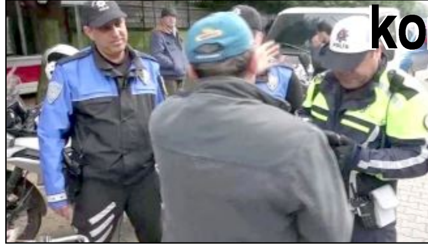
Çorum'da 1 hafta içerisinde 1.502 şahsın GBT kontrolü yapıldı.

Çorum'da asayiş ve güvenliğin sağlanması amacıyla İl Emniyet Müdürlüğü Asayiş Şube Müdürlüğü'ne bağlı birimlerce yürütülen şok uygulamalar ve şüpheli üzerine yapılan araştırmalar ve çalışmalar neticesinde 1 hafta içerisinde 1.502 şahsın GBT kontrolü yapıldı.