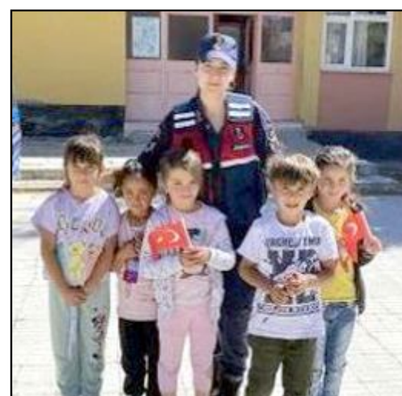
Çorum İl Jandarma Komutanlığı ekipleri, Merkez İlçe Jandarma Komutanlığı sorumluluk bölgesinde bulunan Eskice İlkokulu'nu ziyaret etti.

Öğrencilere "Jandarma Çocuk Dergisi, Jandarma Trafik Boyama Kitabı ve Türk Bayrağı" dağıtımı yapıldı. (Haber Merkezi)