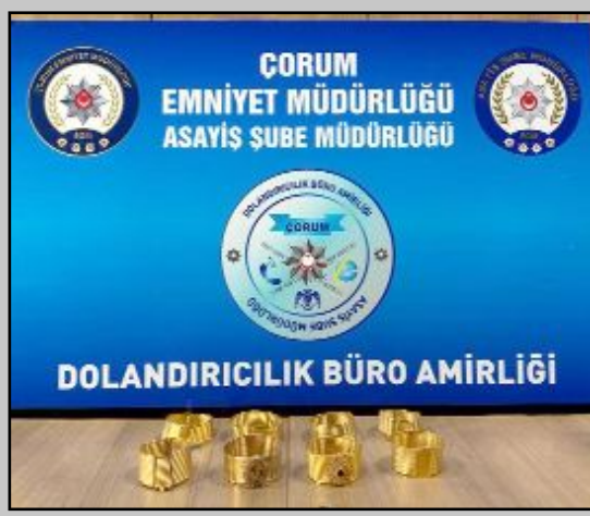
Şüphelilerin araçlarında bulunan sahte altın kelepçeler...