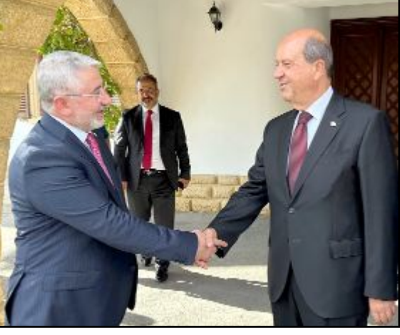
KKTC Cumhurbaşkanı Ersin Tatar, Çorum Belediye Başkanı Halil İbrahim Aşgın ve beraberindeki heyeti ağırladı.

Çorum heyeti ayrıca Gime - Karaoğlanoğlu Şehitliği'ni de ziyaret ederek aziz şehitlerimize duada bulundu. Yavuz Çıkartma Gemisi, Açık Araç Müzesi, Barış ve Özgürlük Müzesi'ni de ziyaret ederek Türkiye'ye döndü. (Volkan SINAYUÇ)