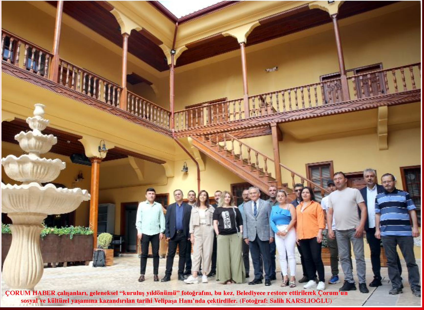
ÇORUM HABER çalışanları, geleneksel "kuruluş yıldönümü" fotoğrafını, bu kez, Belediye restore ettirilerek Çorum'un sosyal ve kültürel yaşamına kazandırılan tarihi Velipaşa Hanı'nda çektiler.