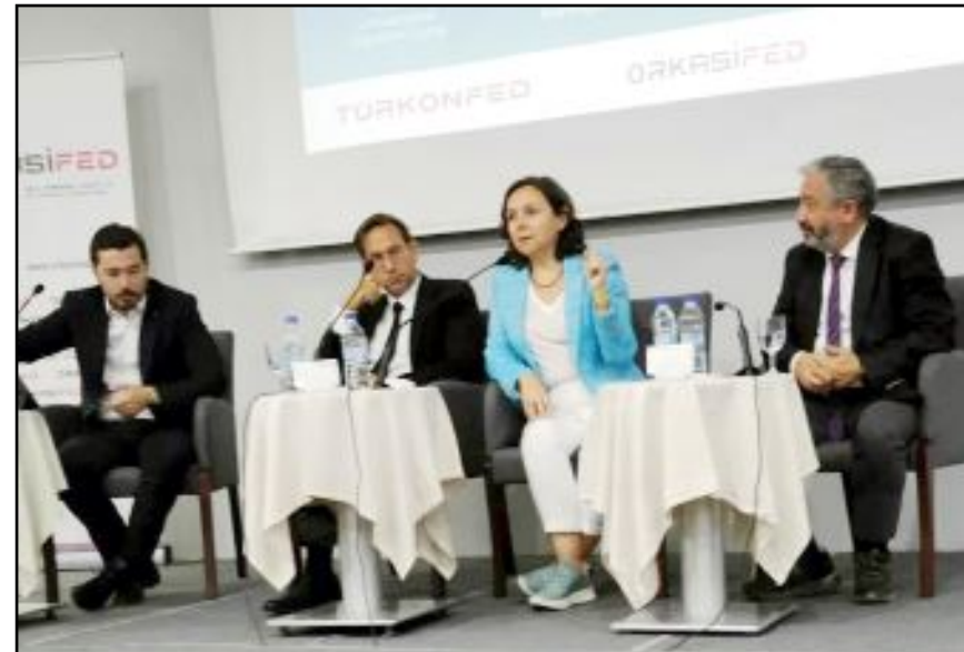
TÜRKONFED'in Çorum'daki 100. Yıl Buluşması'nda panelistler...