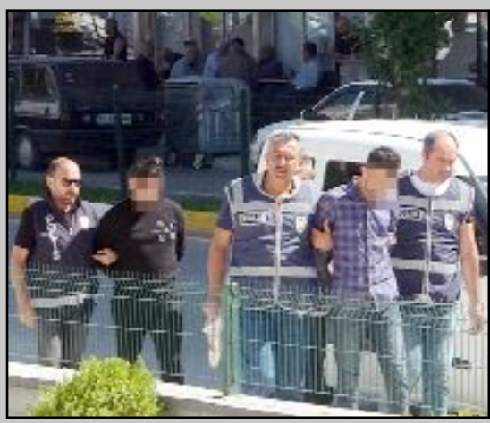
Şüpheliler Çorum Adliyesi'ne getirilirlerken...