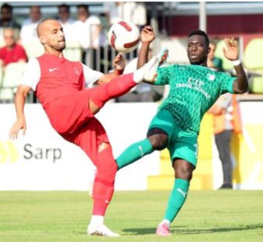
Ümraniyespor, ligin ilk 4 haftasında 2 beraberlik, 2 yenilgi aldı.