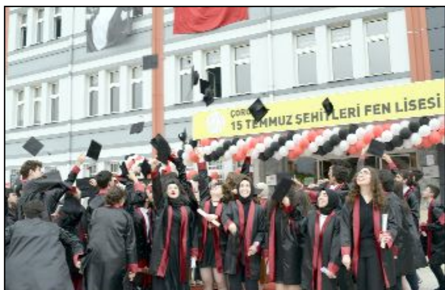
Fen Lisesi, başarılarıyla adından söz ettiriyor.