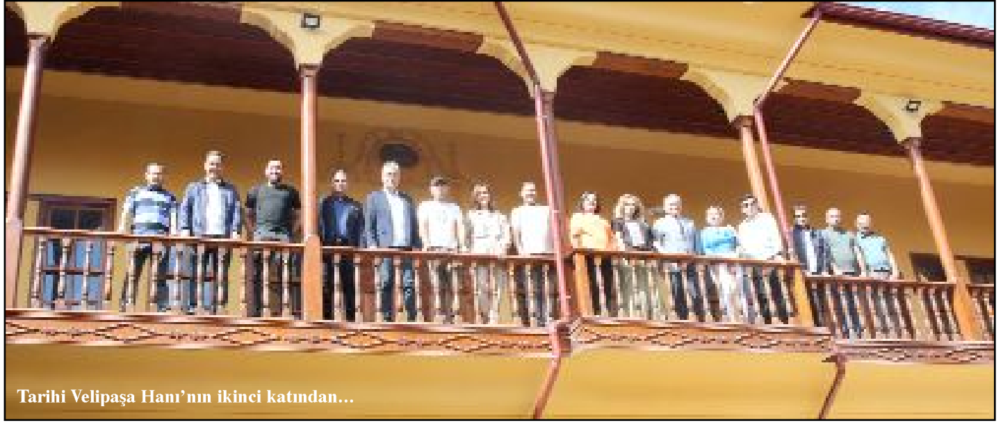
Tarihi Velipaşa Hanı'nın ikinci katından...