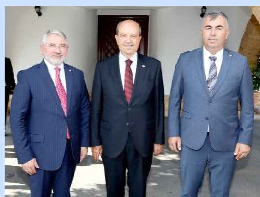
KKTC Cumhurbaşkanı Ersin Tatar, Çorum Belediye Başkanı Halil İbrahim Aşgın ile beraberindeki heyeti ağırladı.

Çorum heyeti Ersin Tatar tarafından ağırlandı •2'de