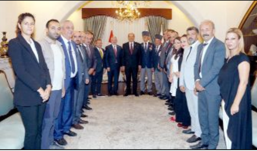
Çorum heyeti yurda dönmeye önce Gime - Karaoğlanoğlu Şehitliği ile Yavuz Çıkartma Gemisi, Açık Araç Müzesi, Barış ve Özgürlük Müzesi'ni de ziyaret etti.