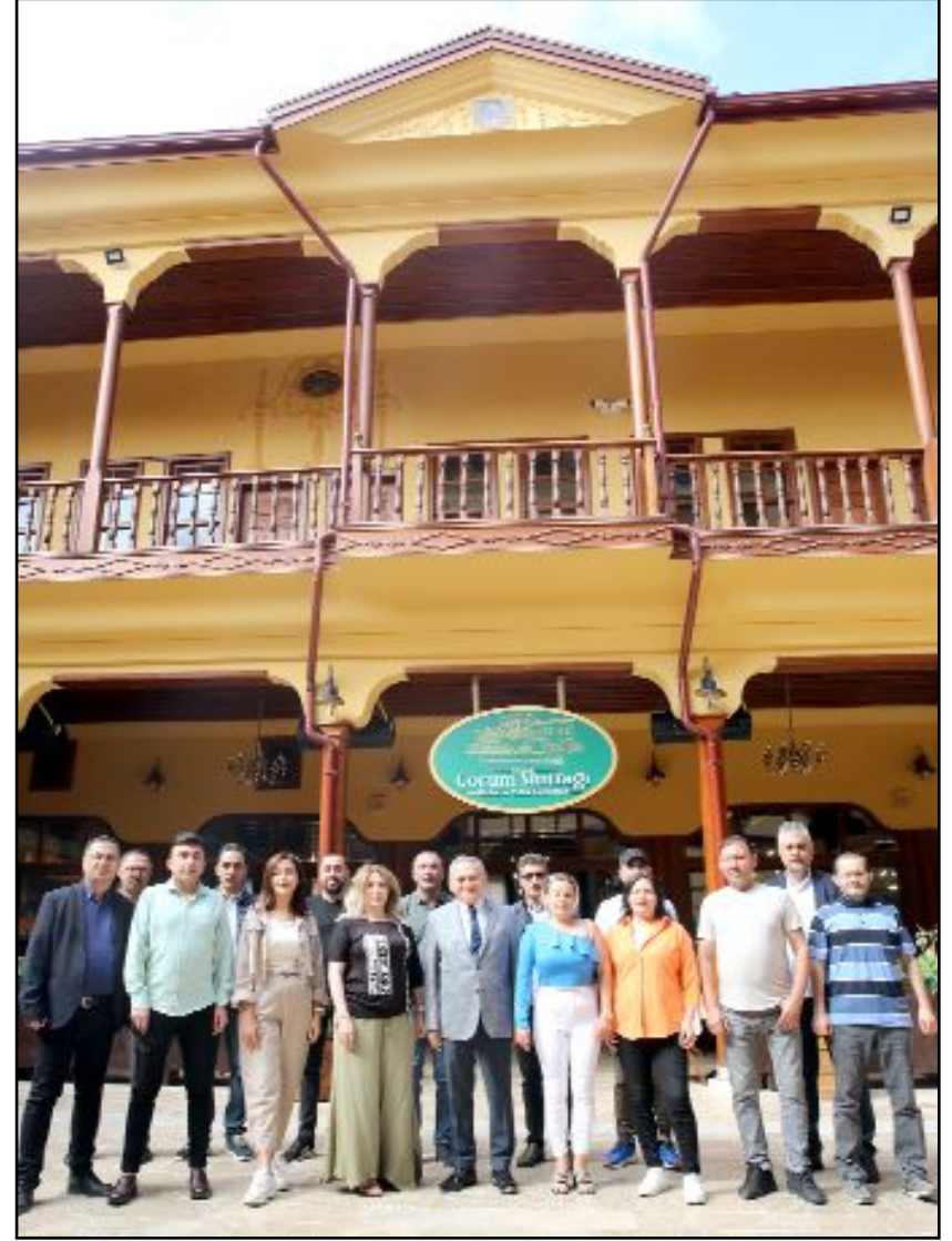
Çorum'a özgü yemeklerin sunulduğu lokantanın önünde...