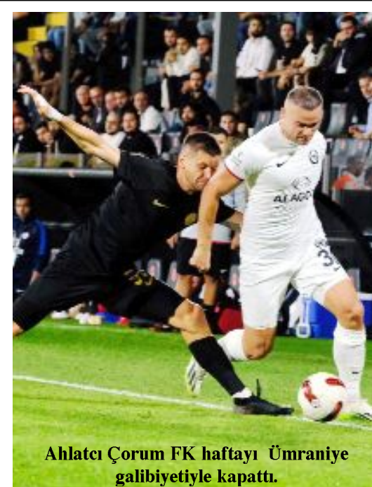
Ahlatçı Çorum FK haftayı Ümraniye galibiyetiyle kapattı.