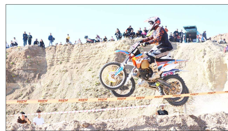
Dün eski Çimento Fabrikası alanında kurulan özel parkurda yarışlar yapıldı.