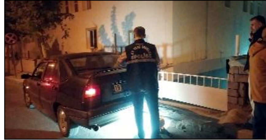
Bahçelievler Mahallesi Karşıyaka 1. Sokak üzerinde seyir halindeki otomobile mermi isabet etti. Polis ekipleri olay yerine gelerek inceleme yaptı.