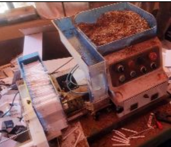
Jandarma ve Emniyet ekiplerinin operasyonunda çok sayıda kaçak sigara ve tütün ele geçirildi.