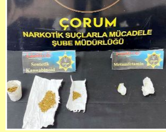
Gözetlne alınan kişilerde bulunan uyuşturucu maddeler ile birlikte 7 adet tabanca, 3 tüfek ve 76 fişek ile 16 bin 405TL ve 112 dolara da el konuldu.

● Çorum'da uyuşturucu madde satıcılarına yönelik düzenlenen kapsamlı operasyonlarda çok miktarda uyuşturucu madde ele geçirilirken, 94 kişi de gözaltına alındı. Operasyonda 561,23 gram esrar, 94 kök Hint keneviri, 3 kilogram kanabinoid, 10 adet ekstazi hap, 122 adet sentetik ecza maddesi, bin 80 gram skunk maddesi, 19,68 gram metamfetamin maddesi de ele geçti. •4'de