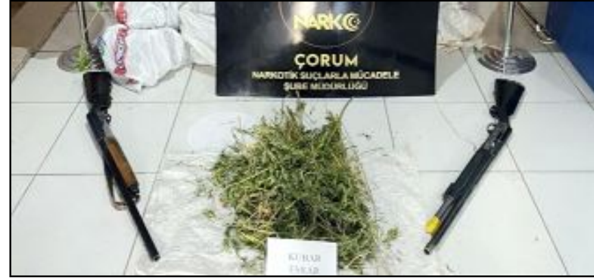
İl Emniyet Müdürlüğü'ne bağlı ekipler bir aylık süreçte yaptıkları operasyonda çok sayıda uyuşturucu madde ele geçirdi.

Konuyla ilgili yapılan açıklamada "Ülkemizin geleceği, yarınlarımızın teminatı gençlerimizi zehirleme niyetindeki şahıslar ve örgütlerle mücadele edeceğiz. Kamuoyuna saygı ile duyurulur" görüşüne yer verildi. (Haber Merkezi)