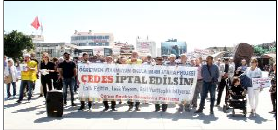
ÇEDES projesi kapsamında düzenlenen eylemde basın açıklaması yapılarak çeşitli sloganlar atıldı.