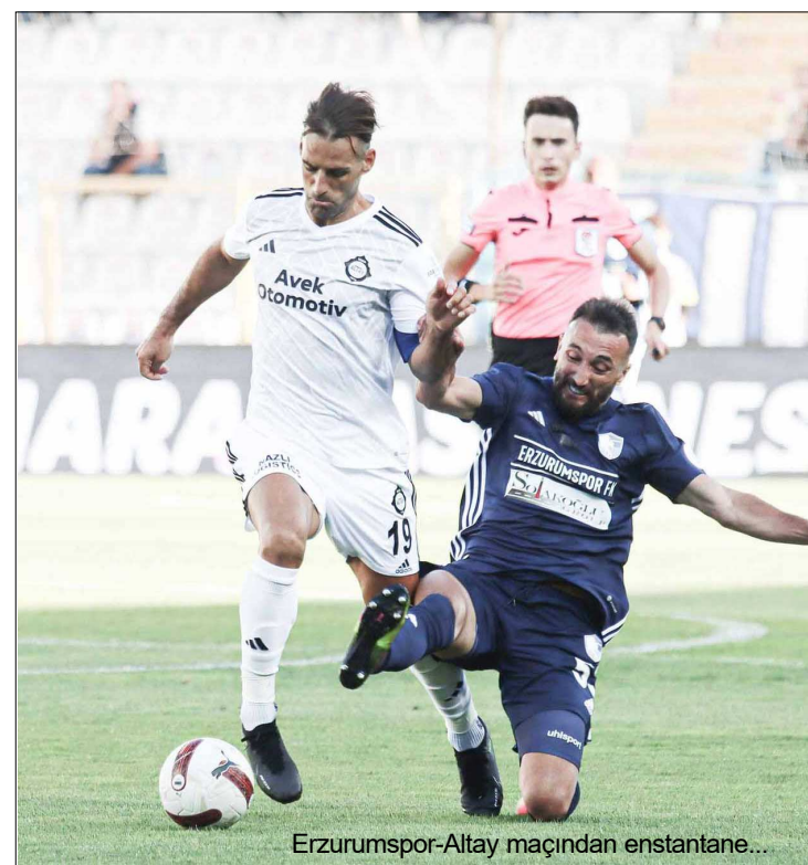
Erzurumspor-Altay maçından enstantane...

Bu sonucun ardından Kocaelispor puanını 9'a çıkartırken, yine galibiyet sevinci yaşamayan Boluspor 3 puanda kaldı. (Hüseyin AŞKIN)