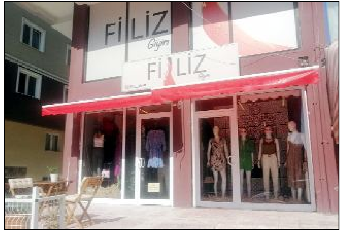
Filiz Giyim Bahçelievler Mahallesi Bahabey Caddesi'nde...