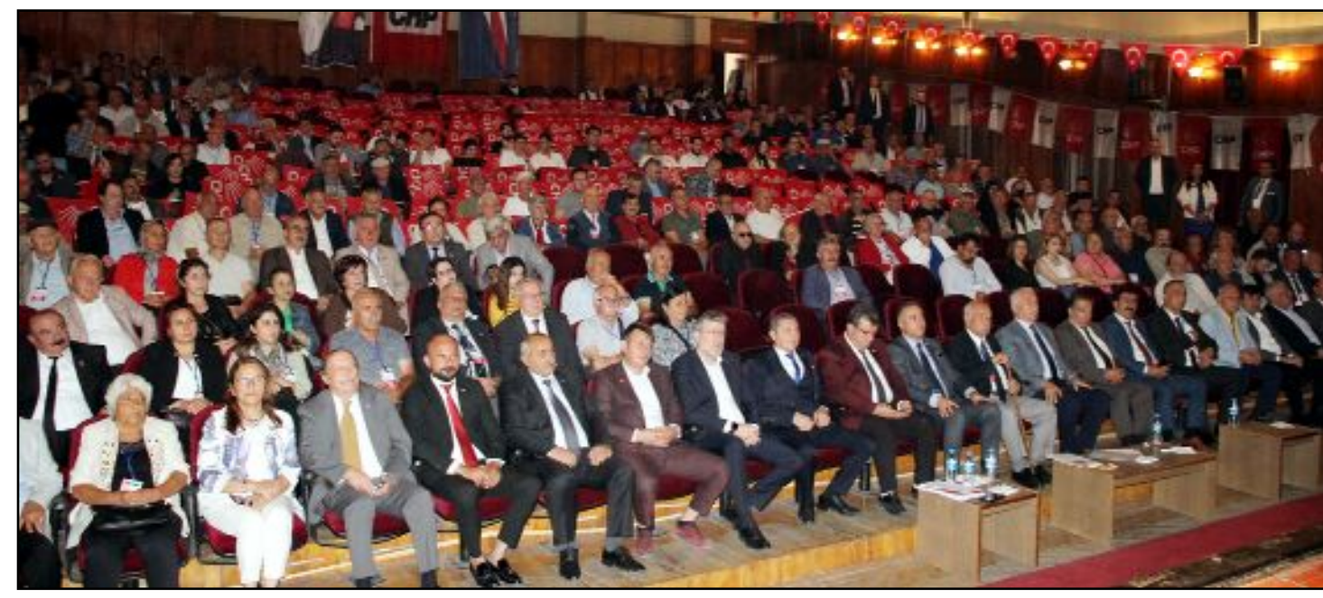
CHP Merkez İlçe Başkanlığı'nın 38. olağan genel kurulu Devlet Tiyatro Salonu'nda büyük bir katılımı yapıldı.