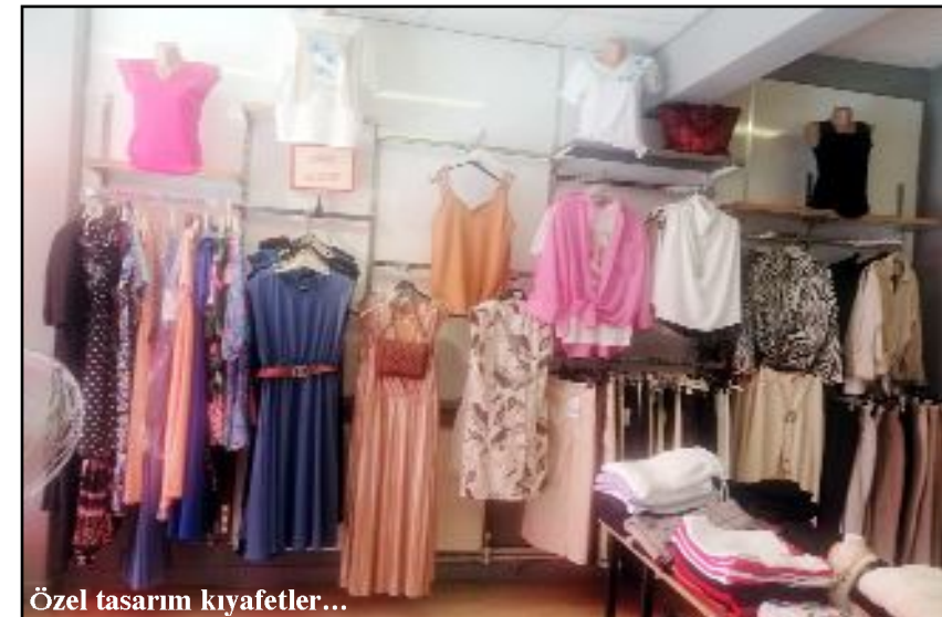
Özel tasarım kıyafetler...

sonu indirimlerinin de sürdüğü bildirildi.