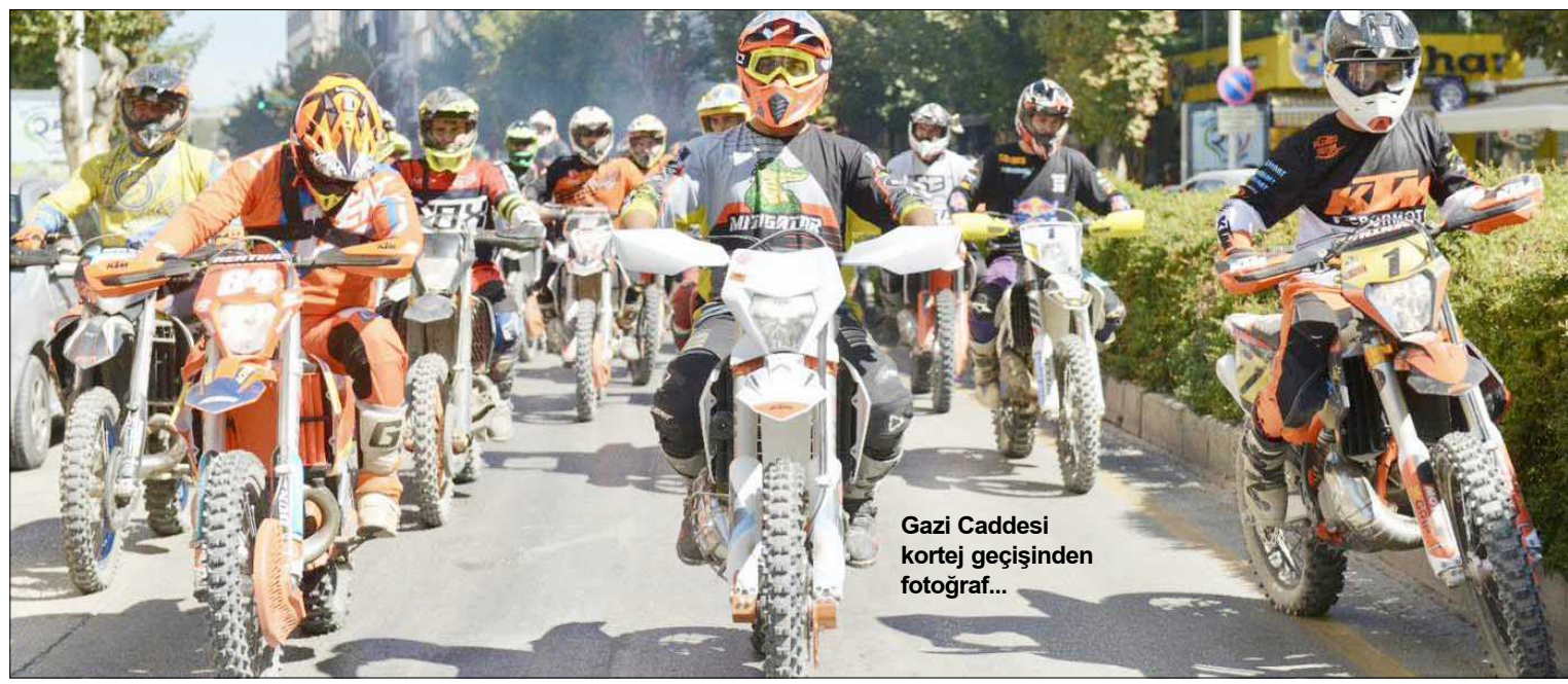
Gazi Caddesi kortej geçişinden fotoğraf...

Bu sonucun ardından ilk galibiyetini alan Erzurumspor puanını 6'ya yükseltirken, 4.yenilgisini alan Altay 3 puanda kaldı. (Hüseyin AŞKIN)