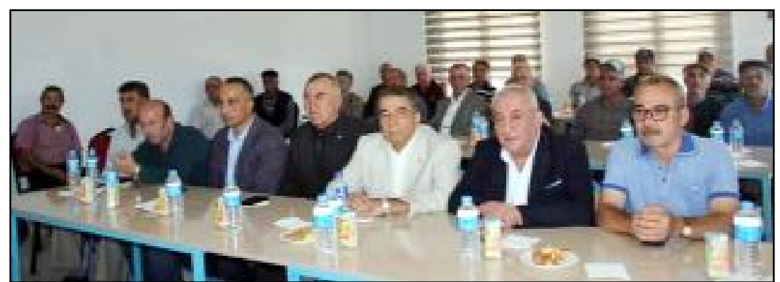
Cumhuriyet Halk Partisi'nin Çorum'da son ilçe kongresi Laçın'da gerçekleştirildi