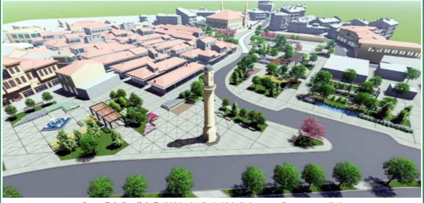
Çorum Belediyesi'nin Tarihi Meydan Projesi için ihale sonrası firmaya yer teslimi yapıldı. Proje tamamlandığında meydanın hali bu şekilde gözükecek.

● Çorum Belediyesi, Tarihi Meydan Projesi için çalışmalara başlıyor. Ziraat Bankası binasının da yıkılmasının ardından yapım ihalesi gerçekleşen projede geçtiğimiz Cuma günü yer teslimi yapıldı. Proje çalışmaları nedeniyle yarından itibaren Kunduzhan ve Osmancık Caddesi'nin bir bölümünün trafiğe geçici olarak kapatılacağı açıklandı. Ayrıca Binevler ve Ulukavak otoyollarının güzergahı da değiştirildi. •2'de