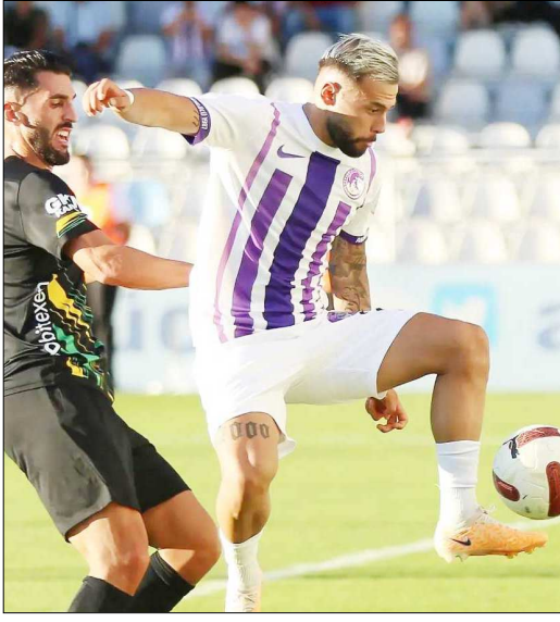
Keçiören-Şanlıurfa maçından bir enstantane...