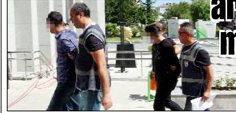
Geçtiğimiz Cuma günü mahkemeye sevk edilen iki şüpheli tutuklandı.