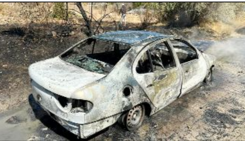
Dodurga Berk Köyü'nde seyir halinde bulunan otomobilin motor kısmında yangın çıktı. Olay yerine gelen itfaiye ekipleri otomobili söndürmeyi başardı.