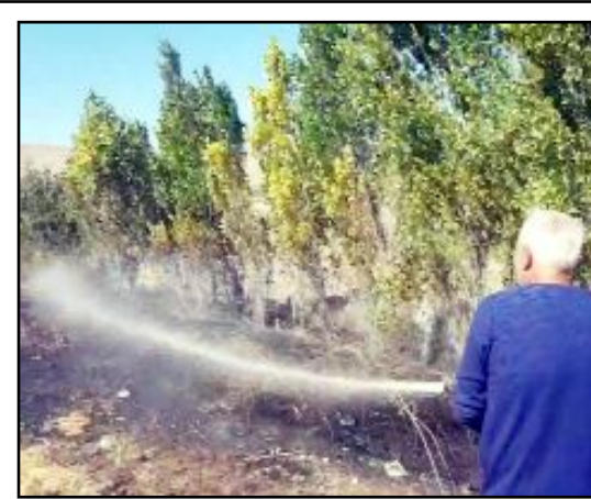
Alaca İbrahim Köyü'nde yaşanan yangın Belediye ekiplerinin müdahalesi ile söndürüldü.

Yangın söndürülürken, soğutma çalışmaları devam ediyor. Jandarma ekipleri yangınla ilgili inceleme başlattı. (İHA)