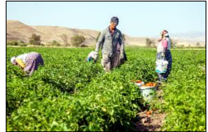
Çorum'da 18 bin 136 dönüm alanda domates üretimi yapıldığı belirtildi.

Masaloğlu, hasat döneminde ortalama 10 kadına iş imkanı sağladığını sözlerine ekledi. (AA)