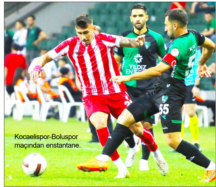
Kocaelispor-Boluspor maçından enstantane.

Bu sonucun ardından ligdeki ikinci galibiyetini alan Keçiöregücü puanını 8'e yükseltirken, Şanlıurfaşpor ise 8 puanda kaldı. (Hüseyin AŞKIN)