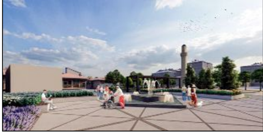
Tarihi Meydan projesinin ihalesinin yapıldığı ve firmaya yer tesliminin gerçekleştiği öğrenilirken, yarın bazı yolların araç trafiğine kapatılacağı da açıklandı.

Osmancık Caddesi'nin geçici olarak trafiğe kapatılması nedeniyle toplu ulaşımda iki hattın güzergahı da değişecek. Binevler ve Ulukavak otobüsleri merkez otobüs durağından hareket ettikten sonra Recep Tayyip Erdoğan Caddesi'nden Fatih Caddesi istikametine doğru hareket edecek. Osmancık Caddesi'nde yer alan otobüs durağından meydan çalışmaları tamamlanana kadar yolcu indirme-bindirme işlemi yapılamayacak. (Haber Merkezi)