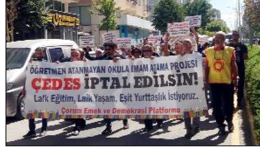
Emek Platformu üyeleri Bahabey Caddesi üzerinden yürüyerek Kadeş Barış Meydanı'na ulaştı.