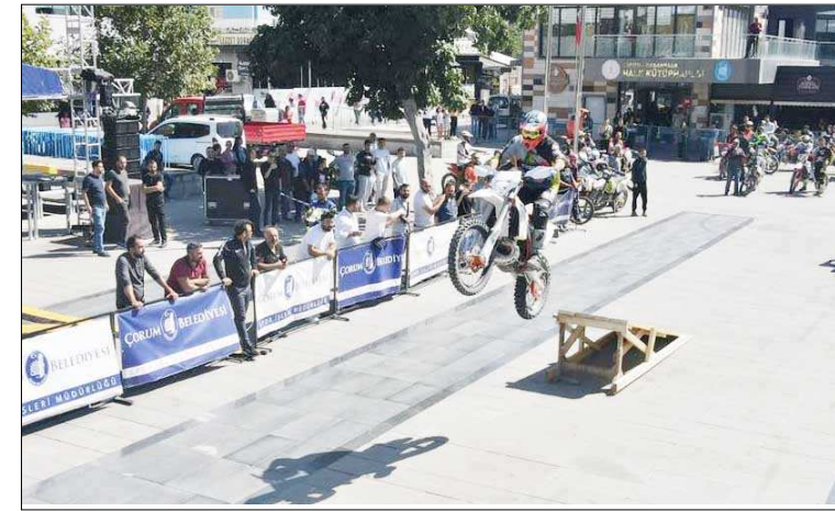
Cumartesi günü Kadeş Meydanı'nda gösteri yapıldı.

Enduro Festivali'nin ikinci gününde ise eski Çimento Fabrikası alanına kurulan özel parkurda Moto Cross sporcular nefes kesen yarışlar sergiledi. Yarışlara Çorumlu motor tutkunları büyük ilgi gösterdi. (Rifat KARA)