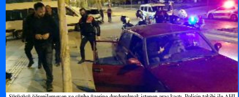
Sürücüsü öğrenilemeyen ve şüphe üzerine durdurulmak istenen araç kaçtı. Polisin takibi ile AHL Park AVM önünde durdurulan araçtan sentetik hap çıktı. Olayla ilgili 5 kişi gözaltına alındı.

● Çorum'da uyuşturucu madde satıcılarına yönelik düzenlenen kapsamlı operasyonlarda çok miktarda uyuşturucu madde ele geçirilirken, 94 kişi de gözaltına alındı. Operasyonda 561,23 gram esrar, 94 kök Hint keneviri, 3 kilogram kanabinoid, 10 adet ekstazi hap, 122 adet sentetik ecza maddesi, bin 80 gram skunk maddesi, 19,68 gram metamfetamin maddesi de ele geçti. •4'de