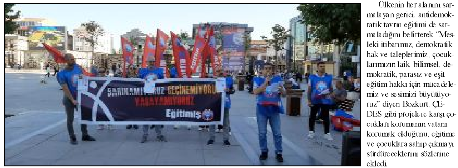
Eğitim-İş Sendikası üyeleri Kadeş Barış Meydanı'nda biraraya gelerek eğitimcilerin sorunlarını anlattı.

Ülkenin her alanını sarı-malayana gericilik, antidemokratik tavrın eğitimde de sarı-malayana gericiliğe dönüştürdüğüne değinerek "Mesleki itibarımız, demokratik hak ve taleplerimiz, çocuklarımızın laik, bilimsel, demokratik, parasız ve eşit eğitimi hakkı için mücadelemiz ve sesimizi büyütüyoruz" diyen Bozkurt, ÇEDES gibi projelere karşı çocukların korunmasını vatani korumak olduğunu, eğitime ve çocuklara sahip çıkmayı sürdürdüklerini sözlerine ekledi. (Tugay GÖKTÜRK)