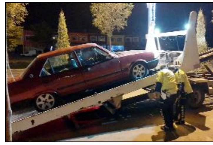
Polisin ihtarına uymayarak kaçan otomobil AHL Park AVM yakınında yakalandı.