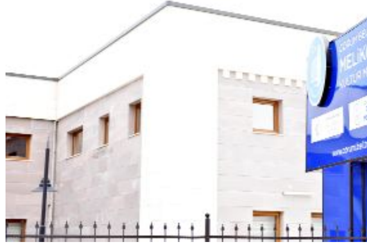
Çorum Belediyesi Melikgazi Kadın Kültür Merkezi'nde ihtisas atölyesi açacak.

Çorum Belediyesi, moda tasarımı ve el sanatları ihtisas atölyesi kuruyor. Burada eğitimi başarıyla tamamlayan kursiyerler usta öğretici olmaya hak kazanacak.