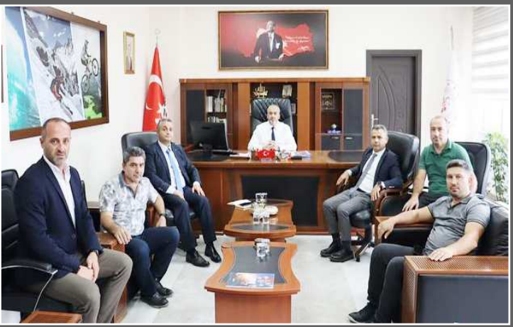
Heyetin, Gençlik ve Spor İl Müdürlüğü ziyaretinden bir fotoğraf...