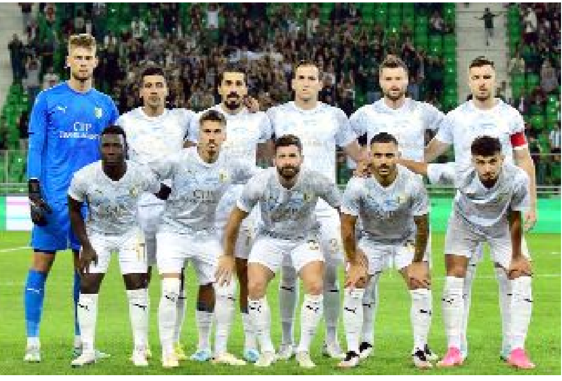
Muğla temsilcisi Bodrum FK, bu sezon oynadığı 6 maçta 3 galibiyet, 2 beraberlik, 1 yenilgi aldı.

Bodrumspor, bu sezon iç sahada oynadığı 2 maçta 1 galibiyet, 1 berabere aldı. (Hüseyin AŞKIN)