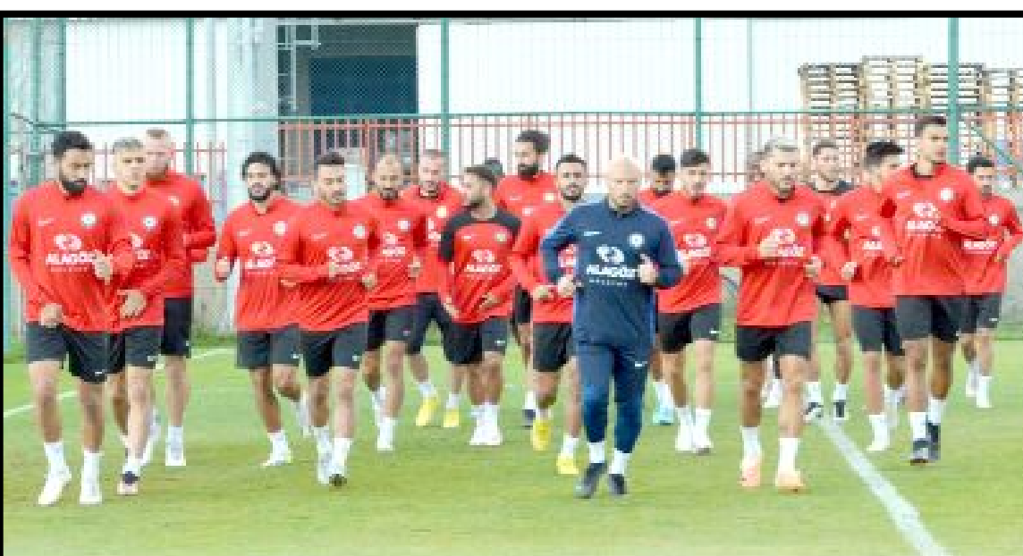
Ahlatcı Çorum FK, maç öncesi Çorum'daki son antrenmanını dün yaptı.

Manisa Futbol Kulübü'nün geçen sezonun ara transfer döneminde Almanya 3.Lig takımlarından Dynamo Dresden'den kadrosuna kattığı 33 yaşındaki orta saha oyuncusu, siyah-beyazlı formayla 19 resmi maçta 1.120 dakika süre alırken, 1 kırmızı kart gördü. (Hüseyin AŞKIN)