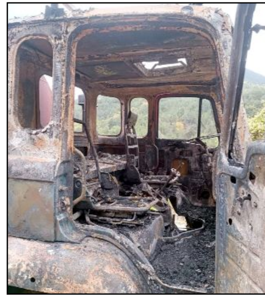
İskilip Elmalı Köyü'ndeki yangına müdahale için yola çıkan İtfaiye aracı yolda arızalanarak yandı.

Motor kısmında meydana gelen elektrik şasesi sonucunda çıktığı belirlenen yangınla ilgili olarak başlatılan incelemenin devam ettiği bildirildi. (İHA)