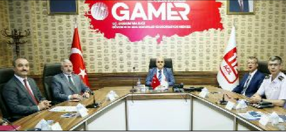
Türkiye Cumhuriyeti'nin kuruluşunun 100. Yılı nedeni ile ilimizde yapılacak etkinlikler Vali Zülkif Dağlı yönetimindeki toplantıda ele alındı.