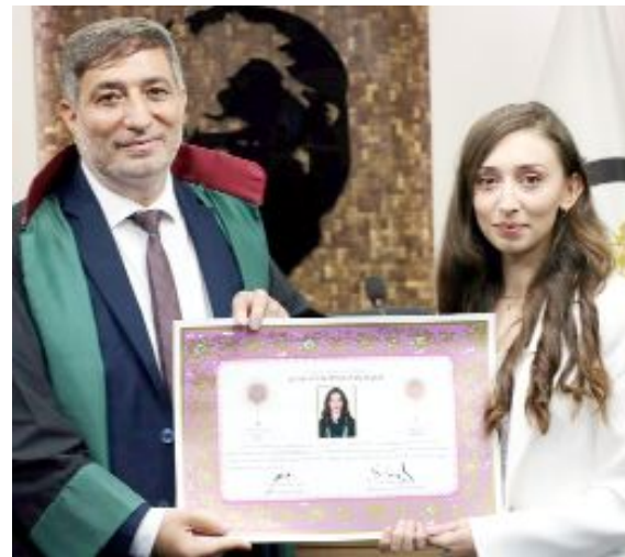
Törende genç avukatların ruhsatları verilerek cübbeleri giydirdi.

Baro Başkanı Turan Kalıpcı genç avukatları kutlayarak görevlerinde başarı dileklerini ilettiler. (Volkan SINAYUÇ)