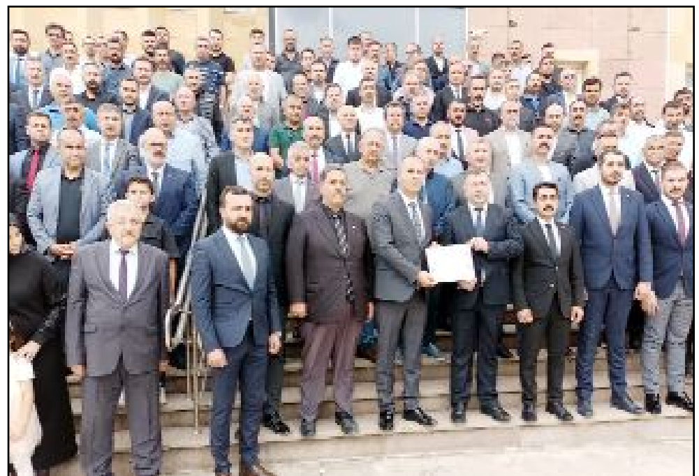
Mazbata töreninde MHP'nin yeni il yönetimi ile birlikte çok sayıda partili de hazır bulundu.

MHP İl Başkanı Çıplak ve yönetimi dün Seçim Kurulu'na giderek mazbata aldı ve yeni döneme başladı. Çıplak önümüzdeki aylarda yapılacak olan yerel seçimler için çalışmalarla başlayacaklarını kaydetti. (Volkan SINAYUÇ)