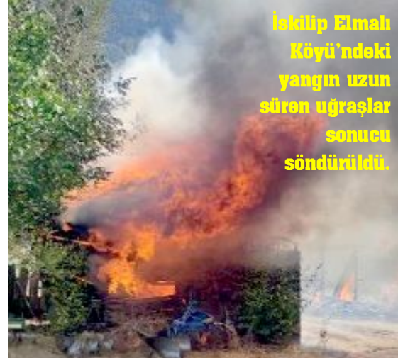
İskilip Elmalı Köyü'ndeki yangın uzun süren uğraşlar sonucu söndürüldü.

Elmalı Köyü'ndeki yangın için İskilip'ten hareket eden itfaiye aracı bölgeye ulaşamadan yolda arızalanarak yandı. •6'da