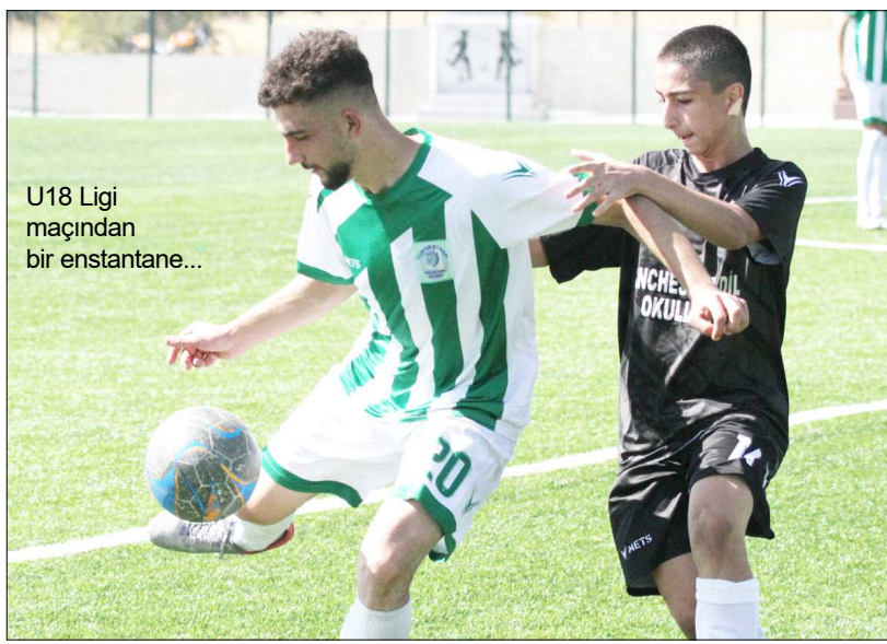
U18 Ligi maçından bir enstantane...