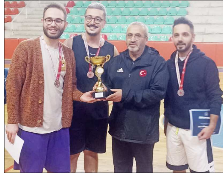
Erkeklerde ikincilik kupası Şehit Erol Olçok 4 M takımının oldu.