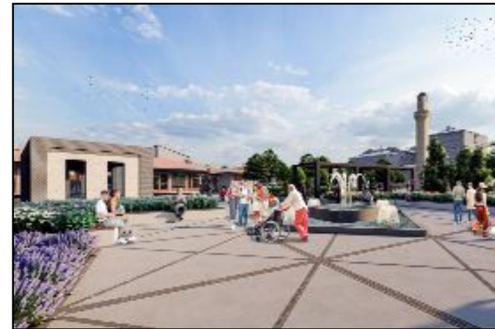
Çorum Belediyesi tarafından tarihi Kent Meydanı olarak planlanan bölgede ilk etap çalışması başladı.