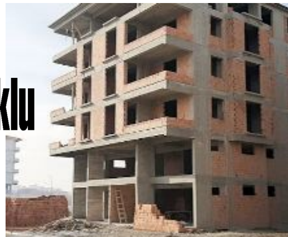
Olay Ulukavak Mahallesi Adnan Özejder Caddesi üzerinde bulunan bir inşaatta yaşandı.

Durumu ağır olan şahsın tedavisinin yoğun bakımda devam ettiği ve hayatı tehlikesinin bulunduğu öğrenildi. (Tugay GÖKTÜRK)