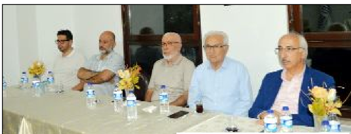
Kaleli Vakfı'nda düzenlenen programı izleyenler...