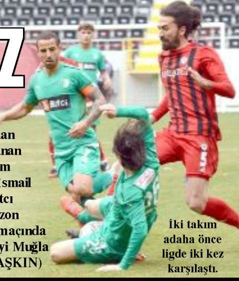
İki takım adaha önce ligde iki kez karşılaşmıştı.