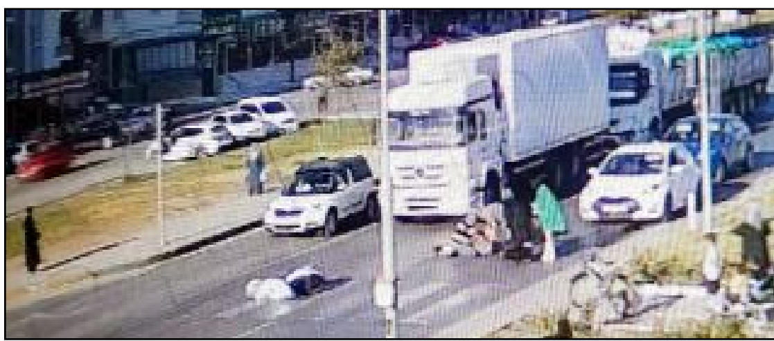
Çevreyolu Bulvarı'nda yaklaşık iki hafta önce yaşanan kazada yaralanan 2 kişiden biri kurtarılamadı.