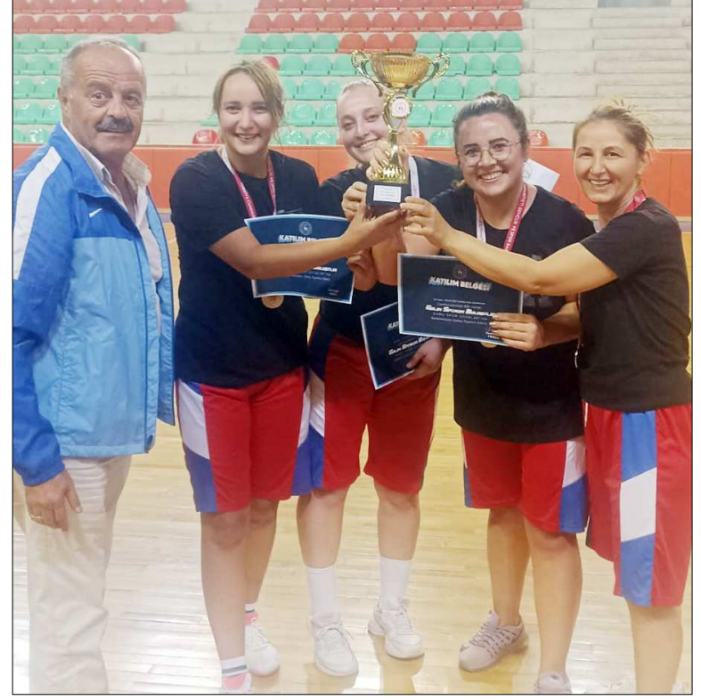
Kadınlarda şampiyon Bahçeşehir Koleji oldu.