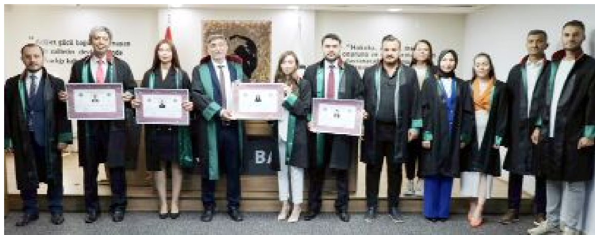
Genç avukatlar için Çorum Barosu'nda ruhsat ve yemin töreni düzenlendi.