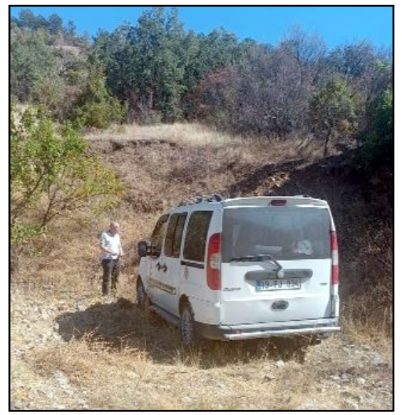
İskilip'te bir araç evin önünde park halindeyken çalındı. Araç 4 gün sonra ormanlık alanda bulundu.