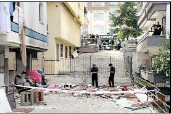
Ankara Mamak'ta bir binada doğalgaz kaçağı nedeniyle yaşanan patlamada bir kişi hayatını kaybetti.