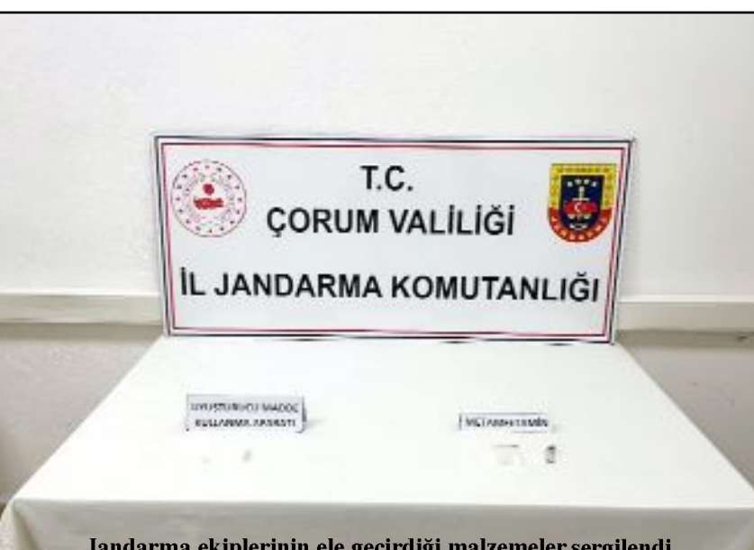
Jandarma ekiplerinin ele geçirdiği malzemeler sergilendi.

Olay ile ilgili bir şüpheli şahıs hakkında adli soruşturma başlatılırken yapılan açıklamada toplum için tehdit oluşturan uyuşturucu ile mücadelenin aralıksız süreceği açıklandı. (Haber Merkezi)