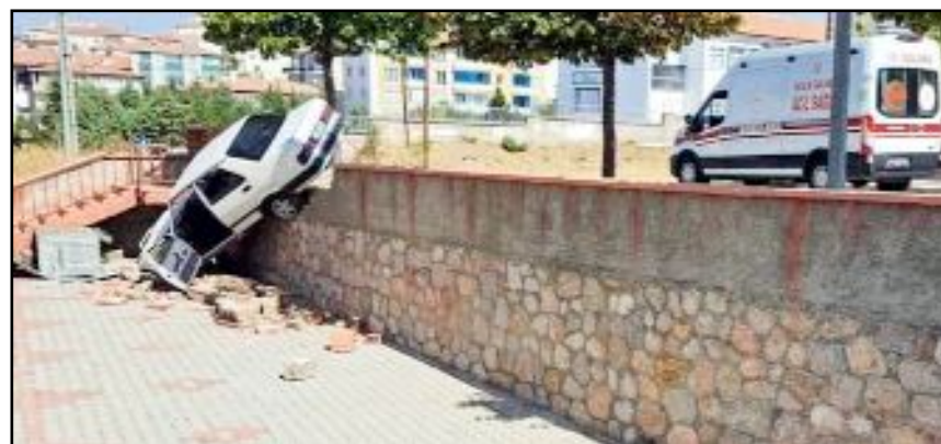
Bahçelievler Mahallesi Mehmet Akif Ersoy Caddesi'nde yaşanan olayda bir otomobil binanın duvarını yıkarak bahçeye girdi.

Öncü olmak, insanlar ve toplum gel geç şeylerin peşinde koşarken, koşutururken hatta gelecekte gelecek söylemek ve onu hayata geçirmektir.