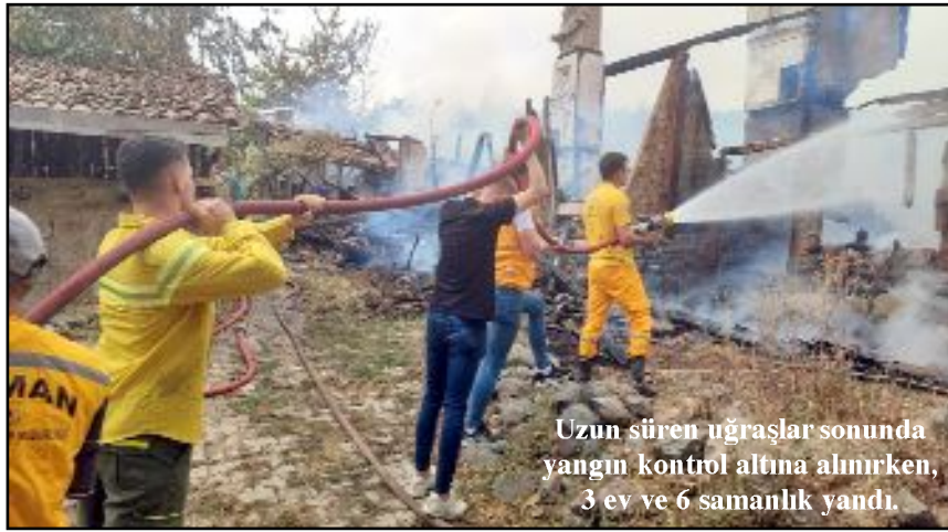
Uzun süren uğraşlar sonunda yangın kontrol altına alınırken, 3 ev ve 6 samanlık yandı.

Çorum'un İskilip ilçesinde çıkan yangında 3 ev ve 6 samanlık kullanılmaz hale geldi.