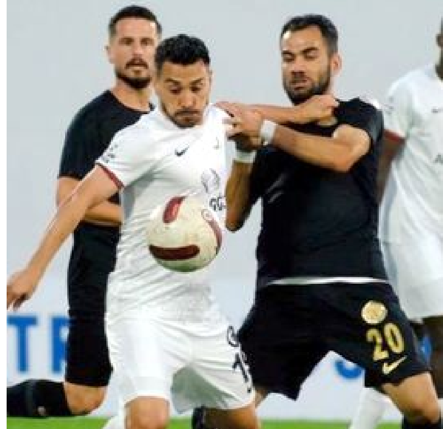
Ahlatıcı Çorum FK, bu sezon deplasmanda oynadığı 3 maçta da kazandı. Kırmızı-siyahlı ekip en son Ümraniyespor'u 3-0 mağlup etti.

Bodrumspor ise 1 Ekim'de 3 maç oynadı. Yeşil-beyazlı takım 1995'te, Konya deplasmanında Mobellaspor'a 2-1 yenilirken, 2017'de deplasmanda Kastamonuspor'a 3-1, geçen yıl da yine deplasmanda Çaykur Rizespor'a 2-0 yenildi. (Hüseyin AŞKIN)