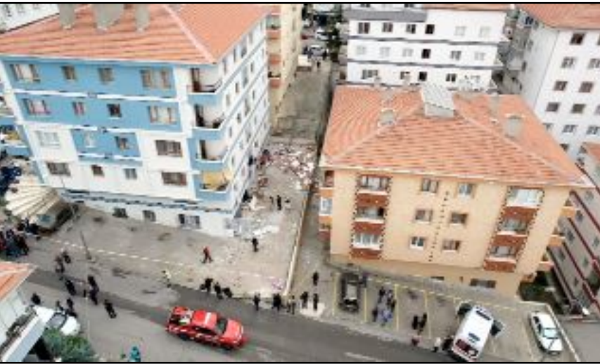
Patlama çevredeki binalarda da hasara neden olurken, ortalık savaş alanına döndü.