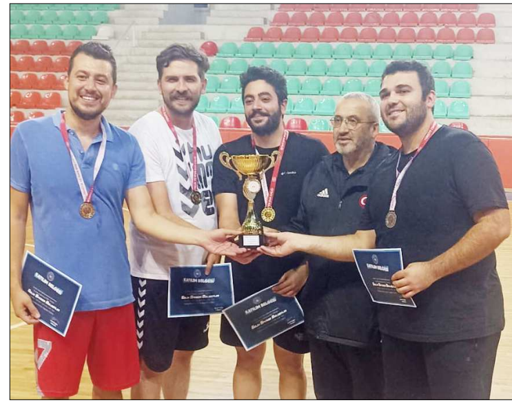
Mecitözü Devlet Hastanesi erkeklerde şampiyonluk ipini göğüsledi.