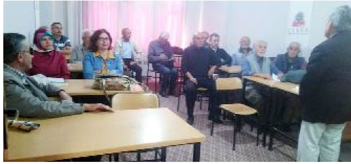
ÇEKVA çatısı altında gerçekleştirilen Sanat Dostları buluşmasından...