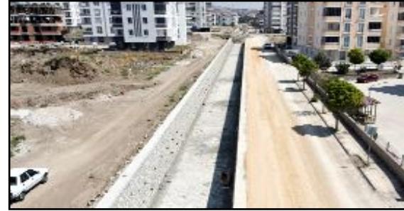
Başkan Aşgın, Mayıs ayında başlayan ve yaklaşık 5 kilometrelik bir alanı kapsayan çalışma ile su taşkınlarına karşı önlem alınmasının amaçlandığını söyledi.

Çorum Belediyesi ve Devlet Su İşleri (DSİ) arasında imzalanan sözleşme doğrultusunda, Çorum'un Bayat Gedigi, Garantievler, Özgürevler ve Ahçılar bölgelerini kapsayan dere ıslah çalışmaları devam ediyor.