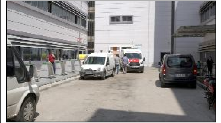
Boğazkale'de intihar eden gencin cenazesi otopsi için hastaneye kaldırıldı.