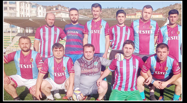
Trabzonspor, Beşiktaş'ı 6-3 mağlup etti.

Turnuvanın organizatörü Nihat Armutcu, 2.hafta maçlarının 15 Ekim Pazar günü oynanacağını açıkladı. (Hüseyin AŞKIN)