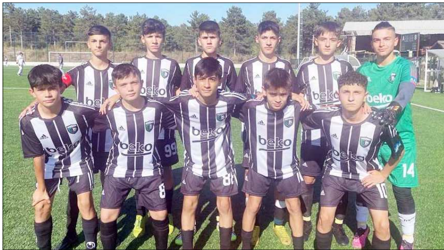
Çorum Anadolu FK A grubunda yenilgisiz zirvede yer alıyor...

Bu sonuçların ardından A grubunda Çorum Anadolu FK 9 puanla yenilgisiz liderlik koltuğuna otururken, B grubunda ise 9 puanlı iki takımdan Hattuşa Gençlikspor averajla birinci, Mimar Sinan Gençlikspor ise ikinci sırada yer aldı. (Rifat KARA)