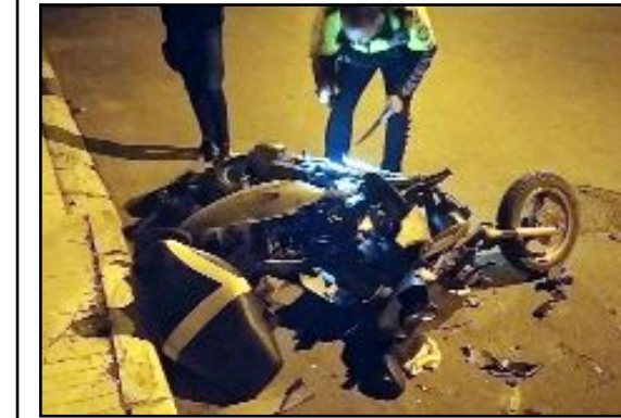
Kale Mahallesi'nde bir otomobil ile plakasız motosiklet çarpıştı. Kazada motosiklet sürücüsü ve motorda bulunan kişi yaralandı.

Kaza ile ilgili başlatılan soruşturma sürüyor. (İHA)