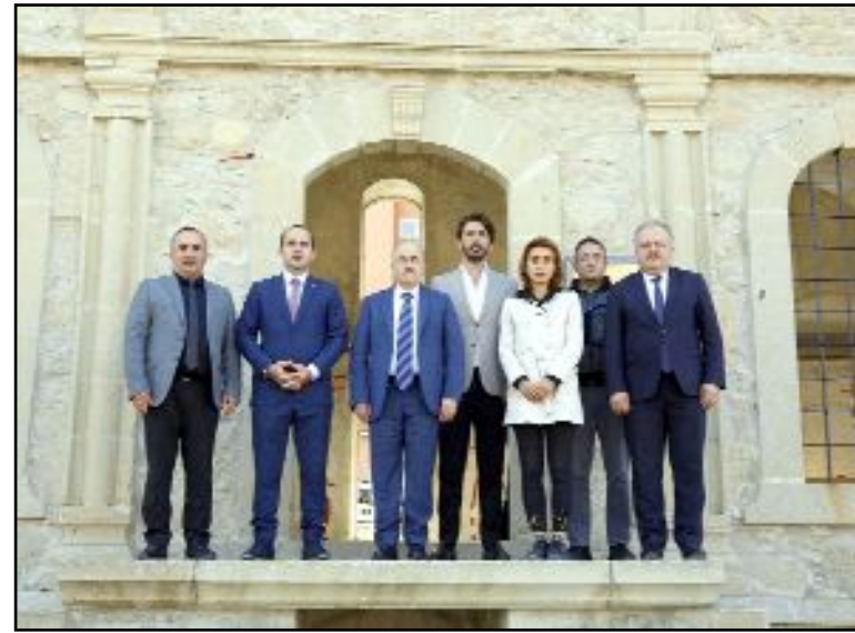
Vali Zülkif Dağlı ve beraberindeki heyet İskilip ziyareti kapsamında tarihi kışlayı da ziyaret etti. Vali Dağlı restorasyon çalışmalarını ile ilgili bilgi aldı.