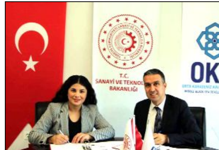
Hitit Köyü'nün restorasyonu için OKA ve Boğazkale Kaymakamlığı arasında protokol imzalandı.

Boğazkale Kaymakamlığı ile Orta Karadeniz Kalkınma Ajansı Başkanlığı arasında 'Hitit Köyü Binası Restore Çalışması' projesi kapsamında işbirliği protokolü imzalandı.