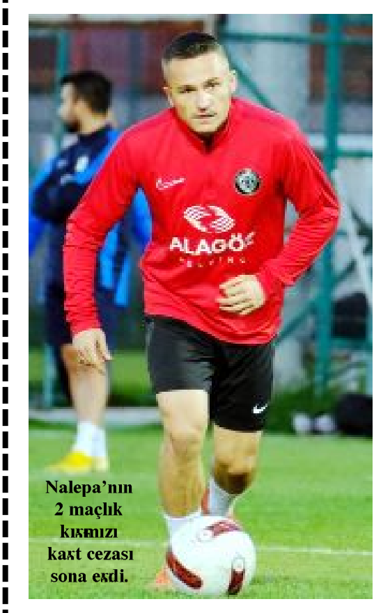
Nalepa'nın 2 maçlık kırmızı kart cezası sona erdi.

Öte yandan, Erzurumspor, Keçiörengücü, Boluspor ve Altay ligde henüz deplasman galibiyeti alamayan takımlar olarak dikkat çekiyorlar. (Hüseyin AŞKIN)