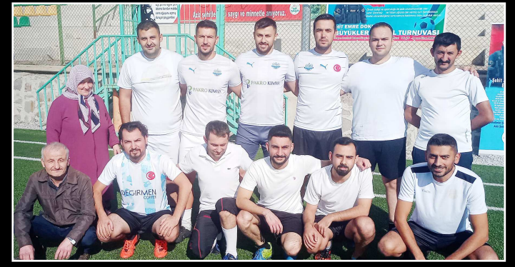
Galatasaray, Fenerbahçe'yi 7-4'le geçti.