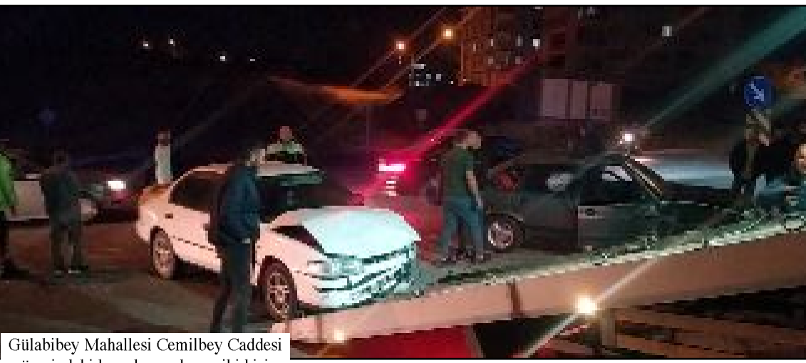
Gülalibey Mahallesi Cemilbey Caddesi üzerindeki kazada yaralanan iki kişi hastanede tedavi altına alındı.