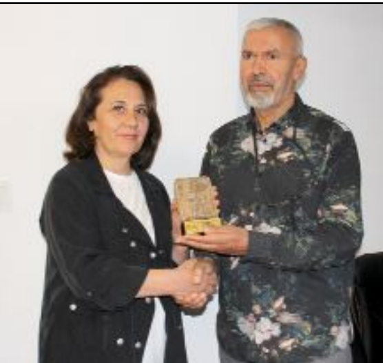
Eğitim-Sen Başkanı Beyaz ve yönetimi bu yıl emekliye ayrılan 16 kişiye plaket verdi.