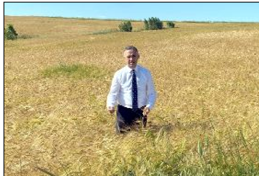
CHP Çorum Milletvekili Mehmet Tahtasız sık sık köyleri ziyaret ederek çiftçi ile biraraya geliyor.