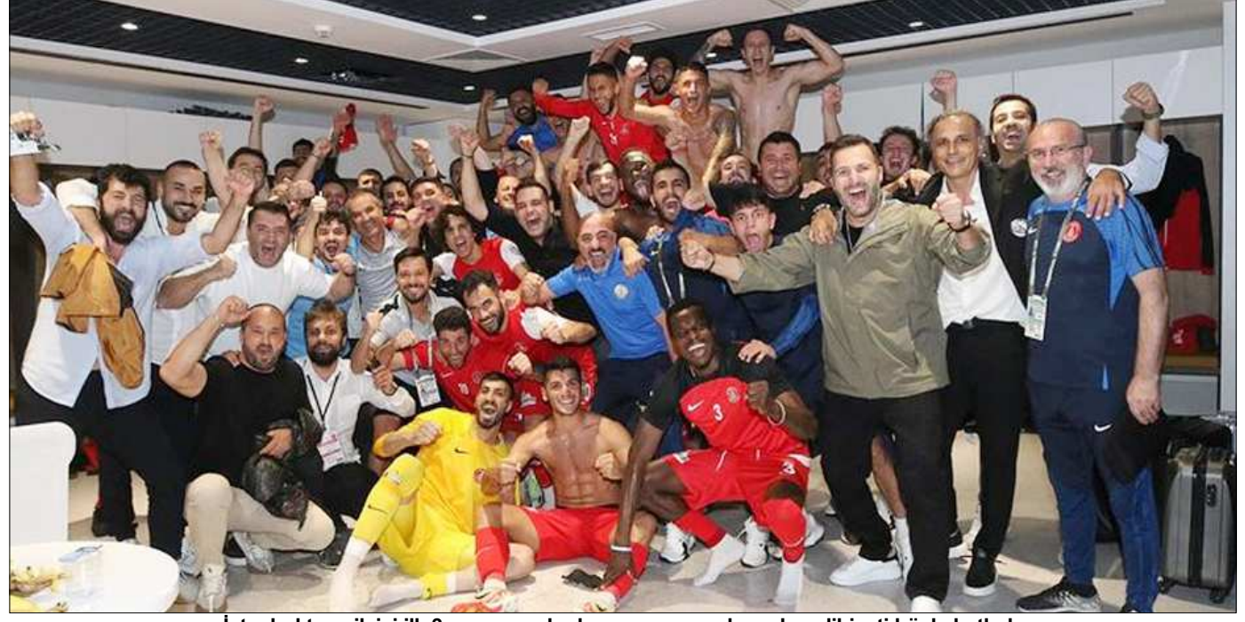
Istanbul temsilcisi ilk 3 puanın ardından soyunma odasında galibiyeti böyle kutladı.

İlk 7 hafta galibiyet yüzü görmeyen Ümraniyespor, 8.hafta maçında deplasmanda Altay'ı farklı mağlup ederek ilk galibiyetini almayı başardı.