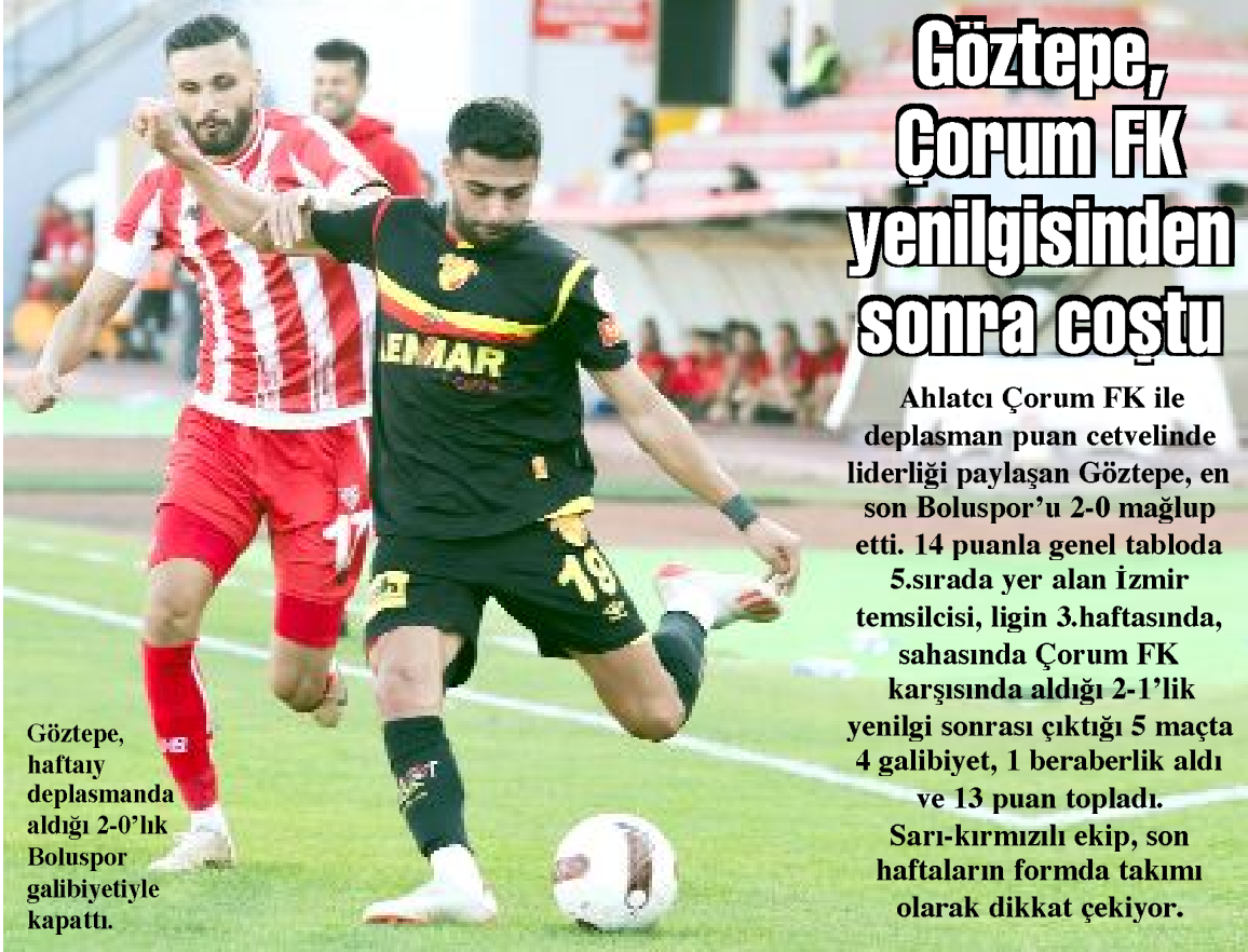
Göztepe, haftayı deplasmanda aldığı 2-0'lık Boluspor galibiyetiyle kapattı.

Trendyol Türkiye 1.Futbol Ligi'nin 8.hafta maçında, deplasmanında Bandırmaspor'la 0-0 berabere kalan Ahlatcı Çorum FK, aldığı 1 puanla, averajla da olsa ligin "en başarılı deplasman takımı" unvanını ele geçirdi. Önceki hafta, Bodrum FK yenilgisine rağmen, ligin deplasman puan cetvelinde, Eyüpspor'la birlikte aynı puan ve averaja sahip olarak zirveyi paylaşan Ahlatcı Çorum FK, Bandırmaspor beraberliği ile bu sezon deplasmanda 10 puana ulaştı. Ligin geride kalan 8 haftalık periyodunda 4 galibiyet, 1 beraberlik, 3 yenilgi alan Çorum FK, topladığı 13 puanla 8.sırada yer alırken, 13 puanın 10'unu deplasmanda aldı. Kırmızı-siyahlı takım, ligin deplasman puan cetvelinde, 10 puan ve +6 averajla lider-