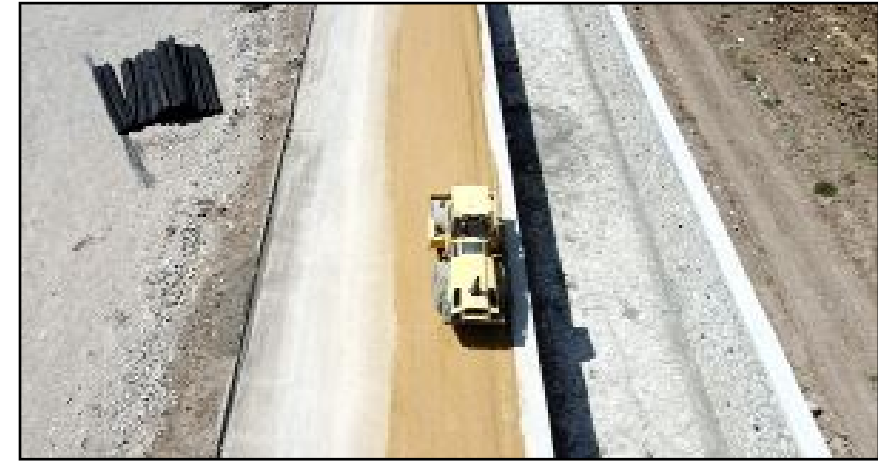
Belediye ekiplerinin DSİ ile yapılan protokol gereği Bayat Gedigi, Garantievler, Özgürevler ve Ahçılar bölgesinde dere ıslah çalışması sürüyor.

Aşgın "Bu çalışmaların tamamlanmasıyla, su taşkınlarına karşı dirençli bir altyapı oluşturmuş olacağız." diye konuştu. (Haber Merkezi)