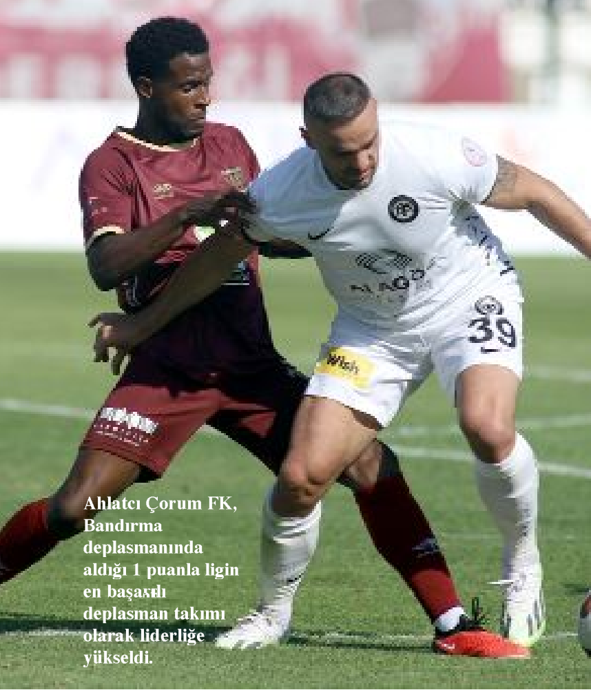
Ahlatcı Çorum FK, Bandırma deplasmanında aldığı 1 puanla ligin en başarılı deplasman takımı olarak liderliğe yükseldi.

Bandırma deplasmanında sezonun ilk beraberliğini alan Ahlatcı Çorum FK, altın değerindeki 1 puanla ligin deplasman puan cetvelinde averajla da olsa liderliğe yükseldi. 10 puanlı Göztepe, Çorum FK'nin 2 averaj gerisinde 2.sıraya yerleşirken, Altay ve Boluspor ise 1'er puanla son sırayı paylaşıyor.