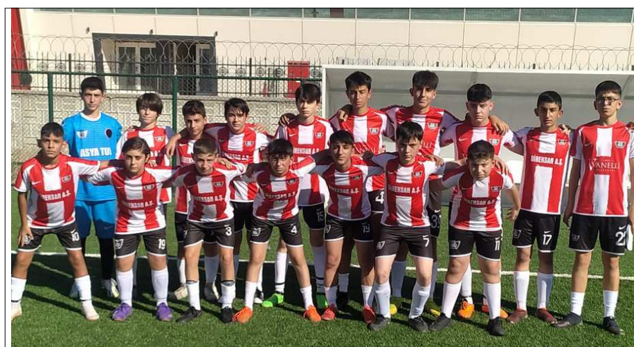
Hattuşa Gençlikspor B grubunda averajla lider durumda...