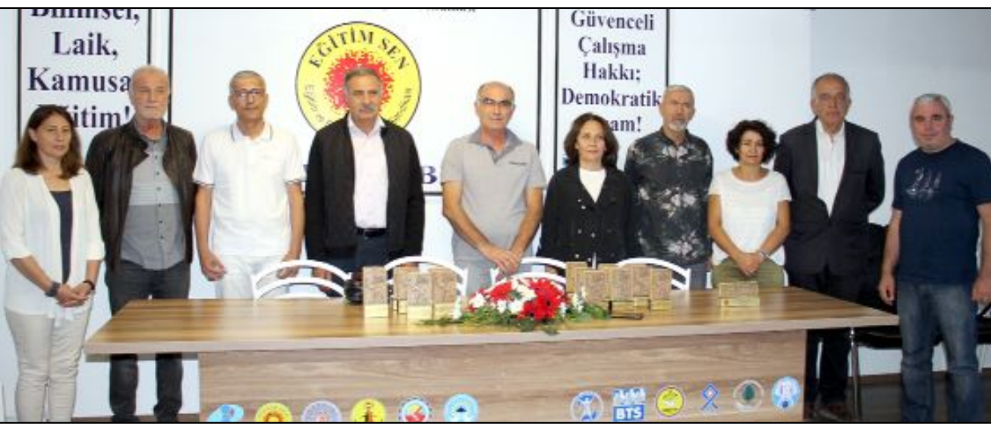
Eğitim-Sen Çorum Şubesi'nde Dünya Öğretmenler Günü nedeni ile düzenlenen kutlama programına çok sayıda sendika üyesi eğitimci katıldı.