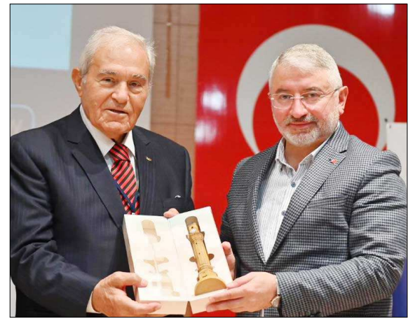
Başkan Aşgın, konuklara hediye verdi.