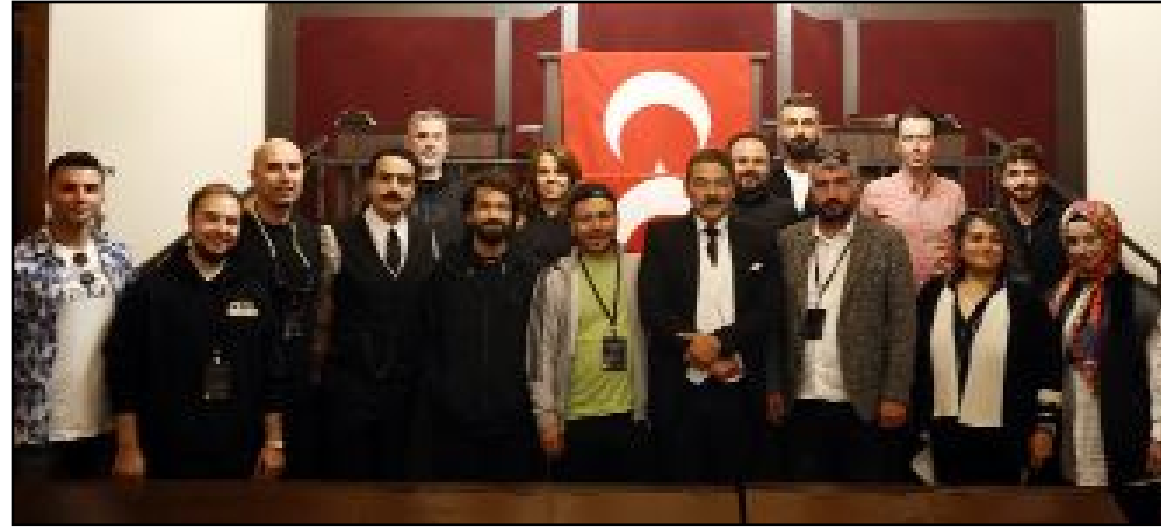
Çorum Kültür ve Turizm Derneği'nin organizasyonunda Çorum Valiliği, Çorum Belediyesi, Çorum İl Özel İdaresi, İl Kültür ve Turizm Müdürlüğü, Çorum Ticaret ve Sanayi Odası'nın iş birliğinde hazırlanan projeye Halk Bankası Genel Müdürlüğü de büyük katkı sundu.