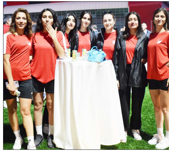
Açılış sonrası hakemlere ve protokol üyelerine kokteyl verildi.

Saygı duruşu ve İstiklal Marşı'nın okunması ile başlayan tören protokol konuşmaları ile devam etti. Konuşmaların ardından düzenlenen kokteyl ile hakemlere ve protokol üyelerine ikramda bulunulurken, hakemler, gözlemciler ve protokol üyeleri arasında Çorum futbolu üzerine konuşulan sohbet gerçekleşti.