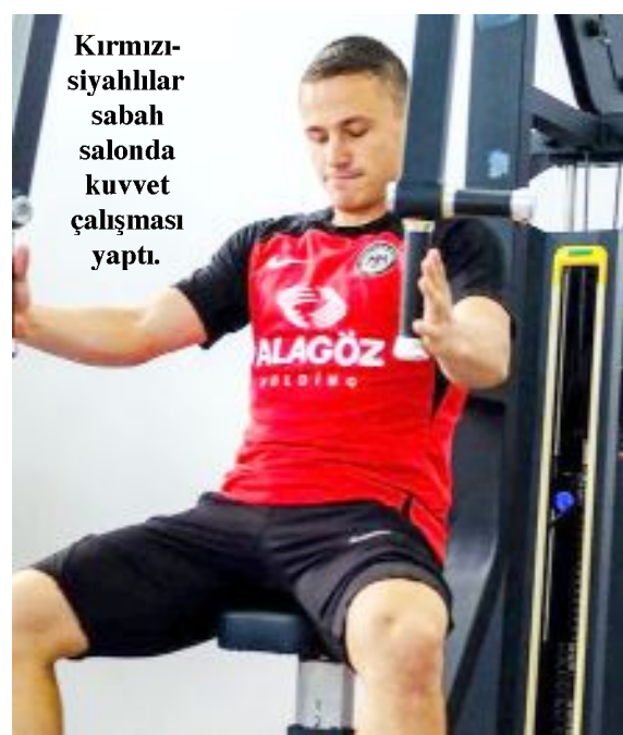
Kırmızı-siyahlılar sabah salonda kuvvet çalışması yaptı.