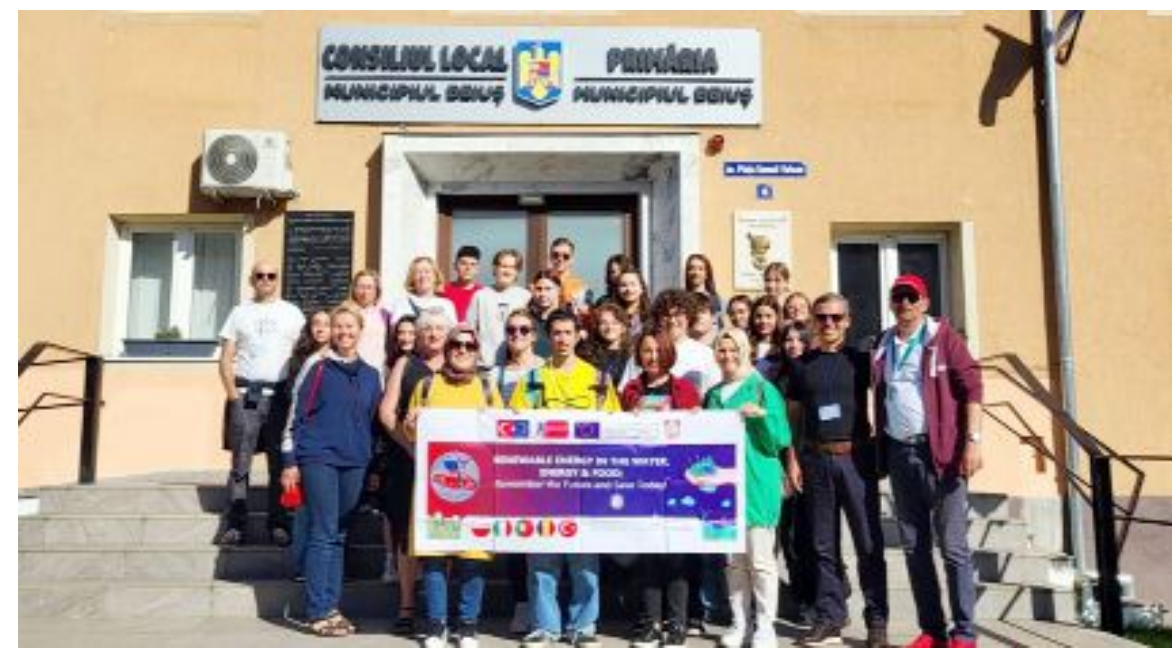
Mehmetçik Anadolu Lisesi Erasmus+ projesi kapsamında Romanya'da düzenlenen proje toplantısına katıldı.