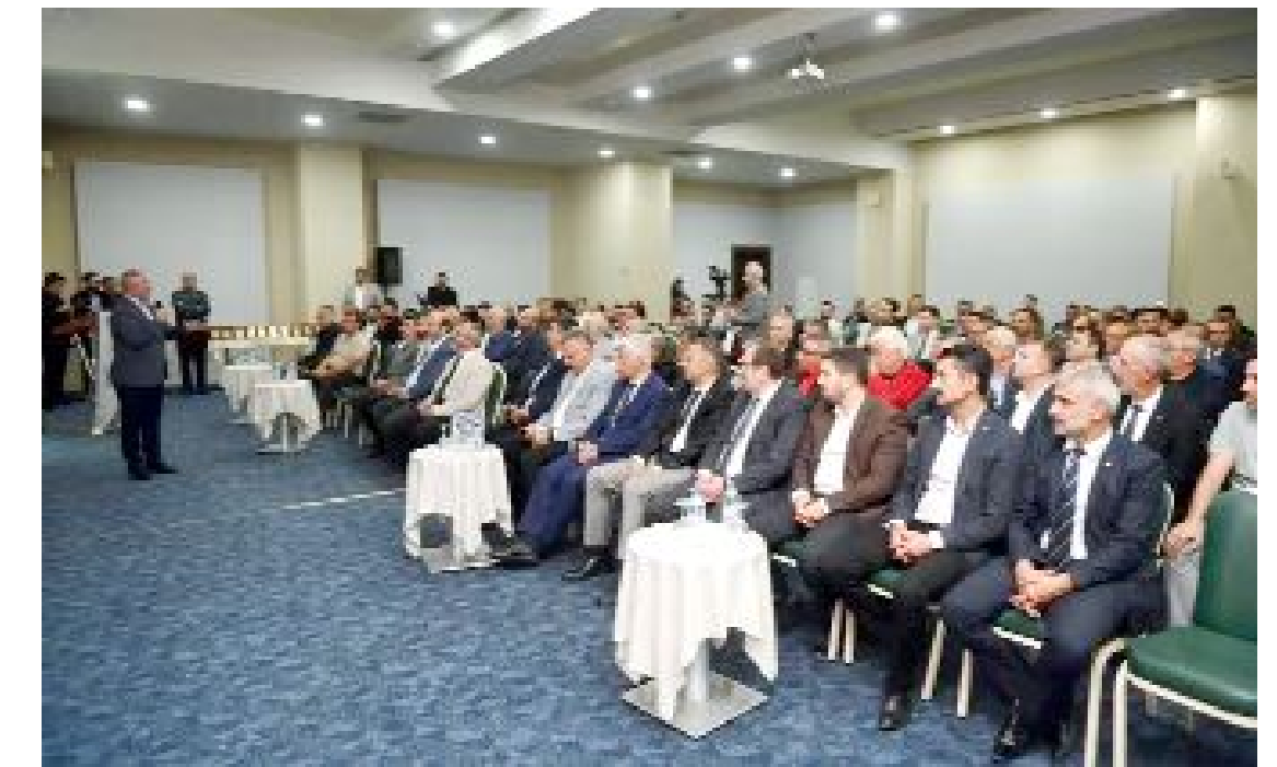
Geçen yıl Anitta Otel'de düzenlenen Sporun enleri Ödül törenine katılanlardan genel bir görüntü.