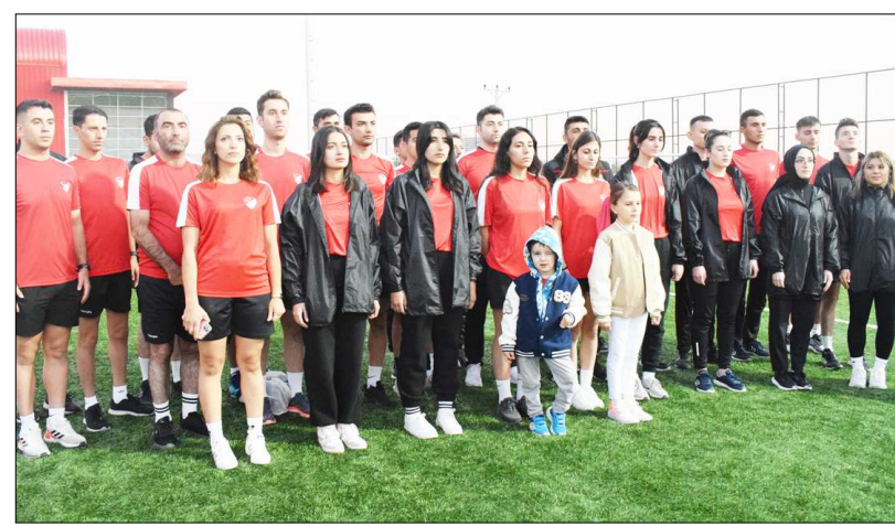
Yeni sezonda 33 hakem görev yapacak.

Çorum futbolunun en önemli temel taşlarından biri olan hakemler önceki gün düzenlenen törenle yeni sezonun açılışını gerçekleştirdi.