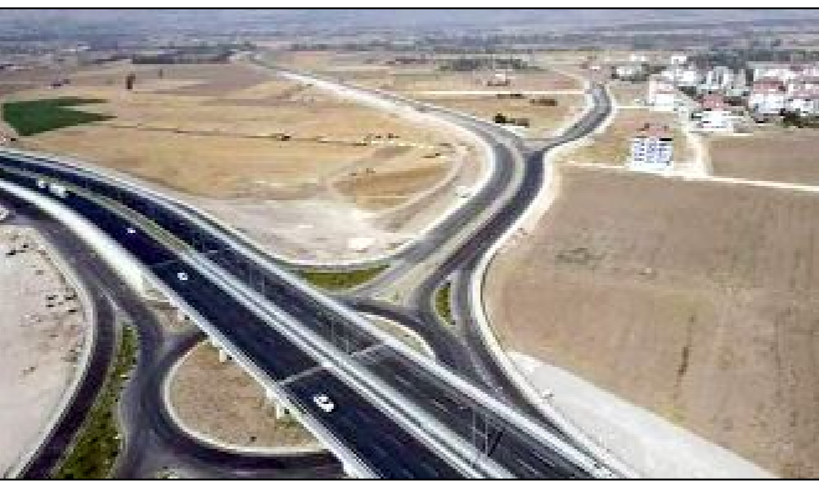
Akşemseddin Kavşağı'nın İskilip yolu bağlantısındaki çalışmaların sona geldiği belirtildi.