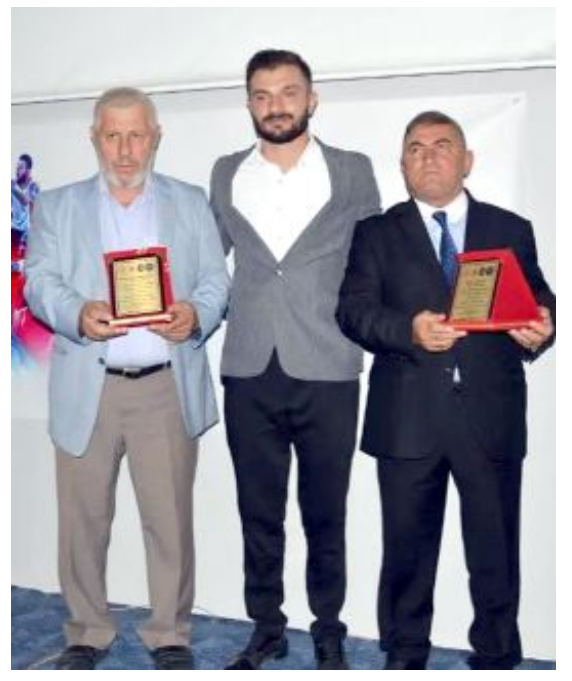
Sporun Enleri Ödül töreninin ilki geçen yıl yapılmıştı.