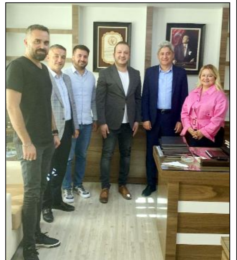
Alliance Healthcare yöneticileri başarı diledi.