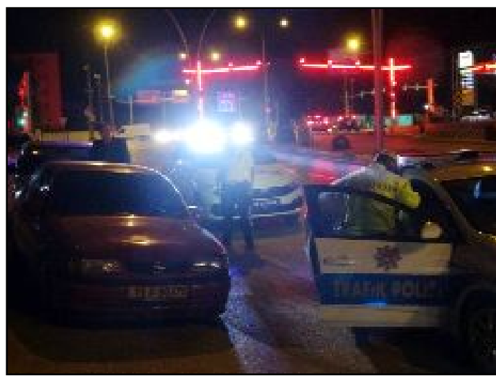
Halkın huzur ve güvenliği için kent genelinde 1404 şahıs ve 656 aracı kontrol eden ekipler 288 bin lira ceza kesti.