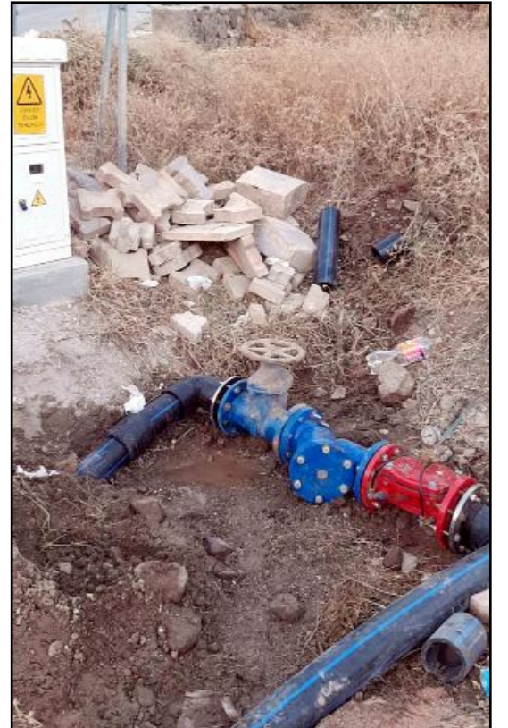
Belediye ekipleri içmesuyu kalitesini artırmak amacıyla basınç kırıcı çalışması yaptı.

rekette ilçemize eserler bırakmak için her karış toprağını ilmek ilmek işliyoruz. Gönül Belediyeciliği ile yarımlara eserler bırakmanın gayreti ile ilçemize hizmet sunmaya devam ediyoruz" dedi. (Haber Merkezi)