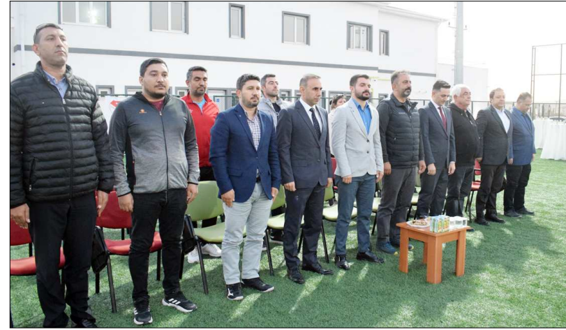
Yeni sezon açılışı Devane Sahası'nda gerçekleşti.