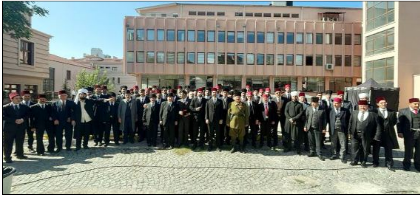
Filmde 120'ye yakın figüran rol alırken dönemin şartlarına uygun kıyafet ve materyaller özenle seçildi.

(Fikretin ÇIPLAK) (1) İsyân eden (2) Allah (3) Şeref, onur