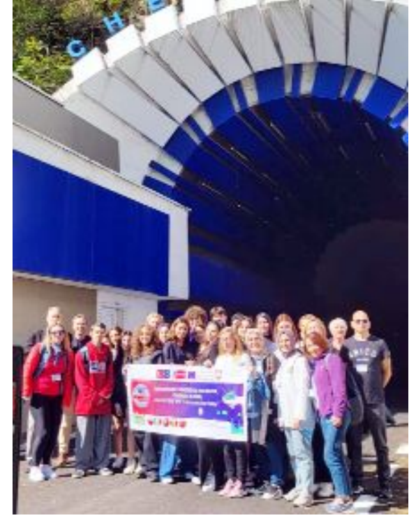
Öğrenciler ülkelerindeki "Yenilenebilir Enerji Kaynakları" konulu projede geziler de yaptı.