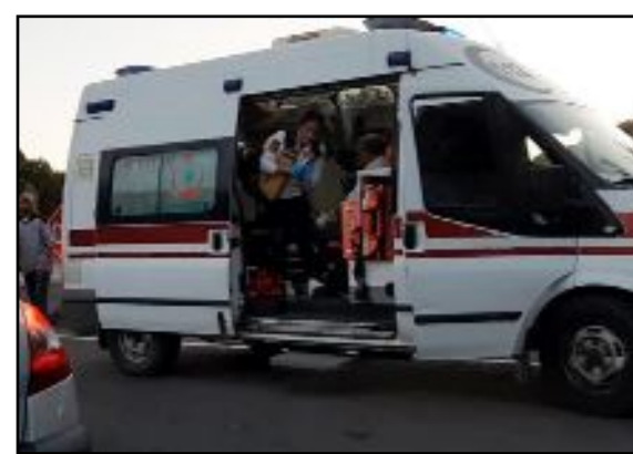
Çorum-İskilip yolunda iki aracın çarpıştığı kazada yaralılar hastaneye kaldırıldı.