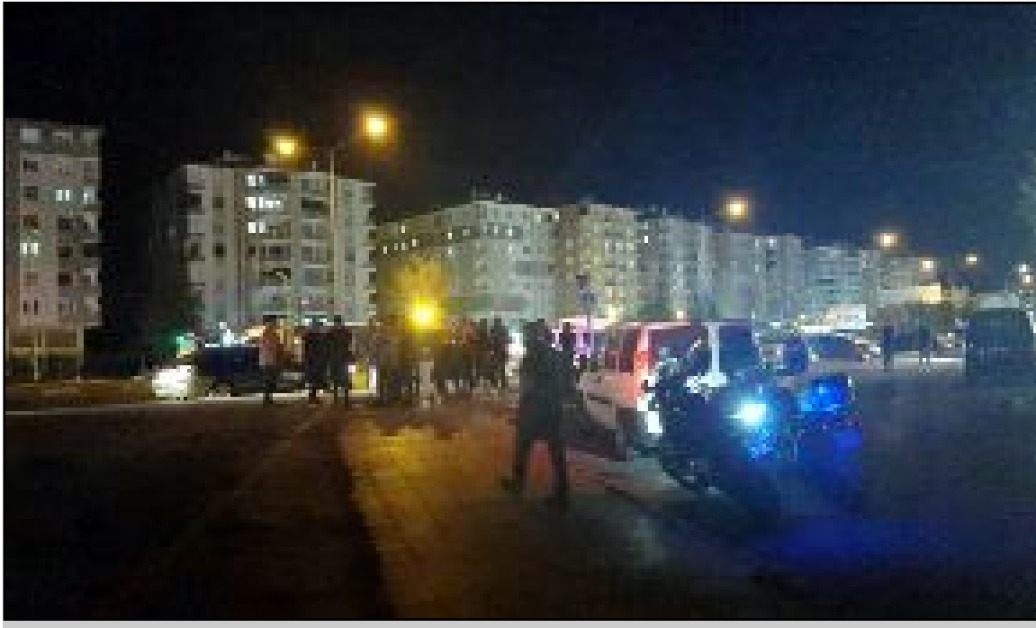
Emniyet Müdürlüğü ekipleri sok uygulamalarda yaptıkları aramalarda çok sayıda silah ve uyuşturucu ele geçirdi.

Çorum İl Emniyet Müdürlüğünden yapılan açıklamada, vatandaşların huzur ve güvenliği için suç ve suç unsurlarına yönelik yürütülen çalışmaların kararlılıkla devam edeceği belirtildi. (Tugay GÖKTÜRK)