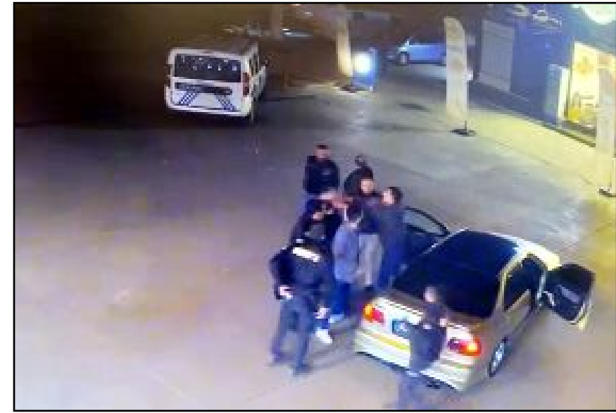
Geçtiğimiz günlerde Buharaevler'de bir benzin istasyonunda yaşanan olay kameralara yansdı.

Öte yandan olayın güvenlik kamerası görüntüleri ortaya çıktı.