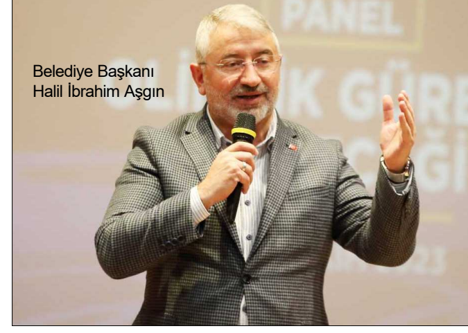
Belediye Başkanı Halil İbrahim Aşgın