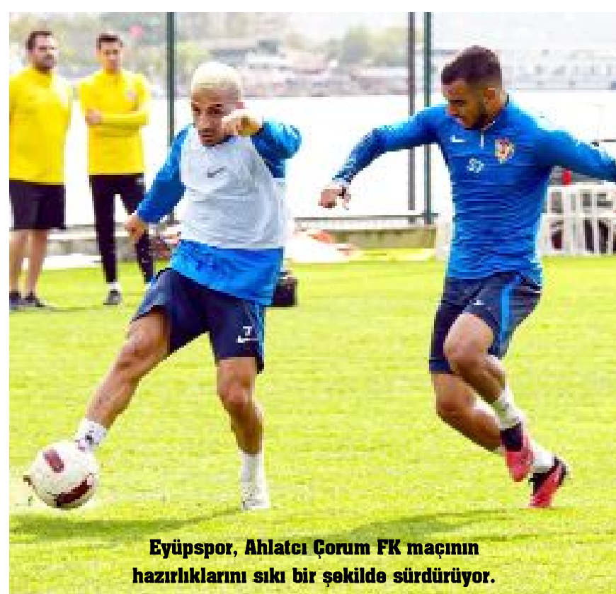
Eyüpspor, Ahlatçı Çorum FK maçının hazırlıklarını sıkı bir şekilde sürdürüyor.