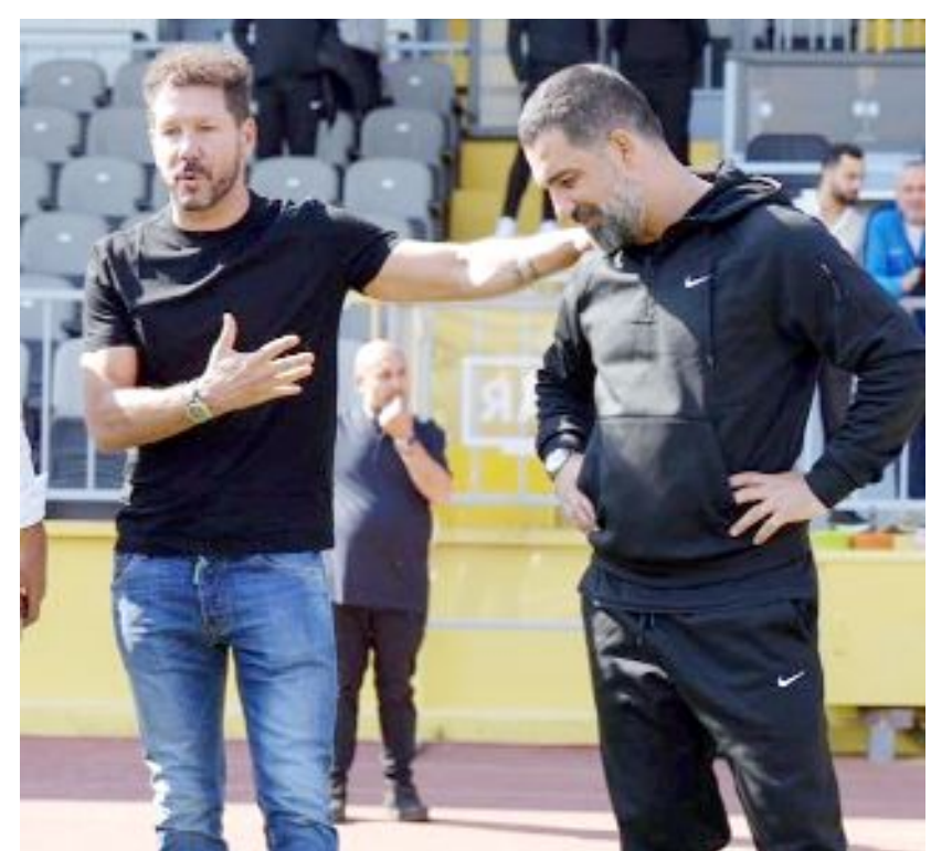
Dünyaca ünlü teknik direktör Diego Simeone, Atletico Madrid'den öğrencisi Arda Turan'ı antrenmanda ziyaret etti.