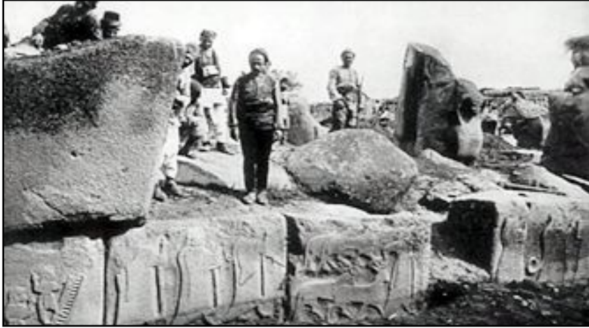
Yapı Kredi Müzesi'nde açılacak "Bir İdealin Peşinde: Atatürk ve Alaca Höyük Sergisi" 10 Mart 2024'e kadar görülebilecek.

Kültür ve Turizm Bakanlığı ile Yapı Kredi Kültür Sanat Yayıncılık'ın işbirliğiyle hazırlanan "Bir İdealin Peşinde: Atatürk ve Alaca Höyük" sergisi, 10 Mart 2024'e kadar Yapı Kredi Müzesi'nde ücretsiz ziyaret edilebilecek. (AA)