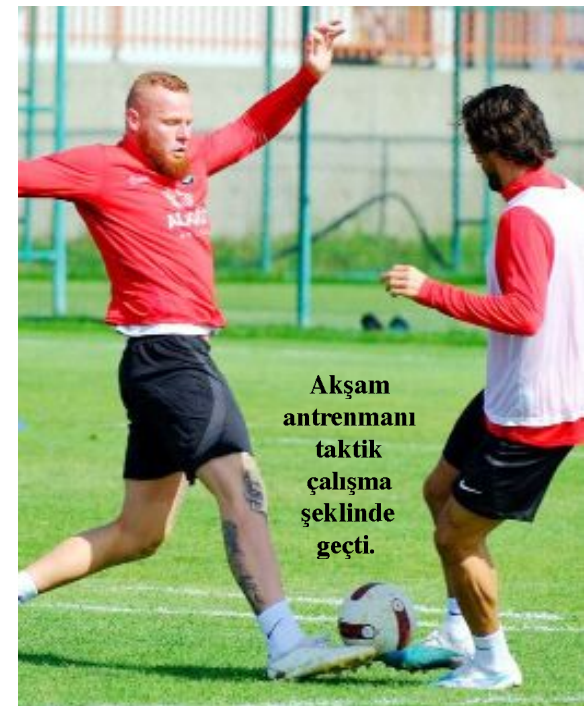
Akşam antrenmanı taktik çalışma şeklinde geçti.

Trendyol Türkiye 1. Futbol Ligi'nin 9. haftasında, 22 Ekim Pazar günü Eyüpspor'la karşılaşacak olan Ahlatçı Çorum FK, bu maçın hazırlıklarını dün yaptığı çift idmanla sürdürdü.