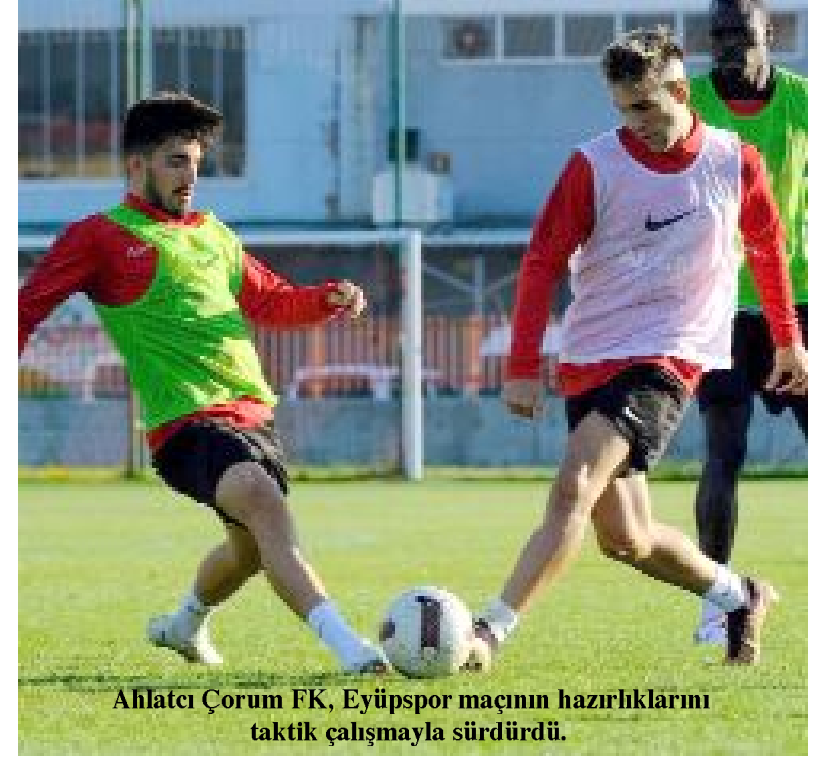
Ahlatıcı Çorum FK, Eyüpspor maçının hazırlıklarını taktik çalışmayla sürdürdü.

Kırmızı-siyahlı takım bugün yapacağı idmanla Eyüpspor maçının hazırlıklarını sürdürecektir. (Hüseyin AŞKIN)