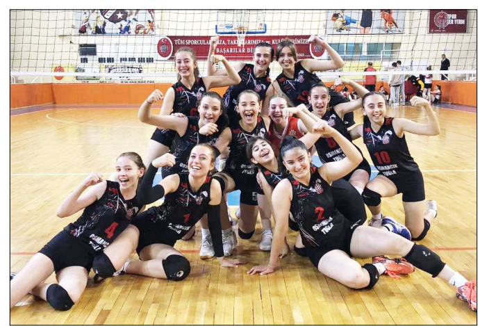
Osmancık Belediyespor grubu yenilgisiz tamamladı.

Yarı final maçlarında A grubu birincisi Osmancık Belediyespor ile B grubu ikincisi Çorum Voleybol B takımı, B grubu birincisi Özel Bilgi Koleji ile A grubu ikincisi Sungurlu Belediyespor karşı karşıya gelecek. (Rifat KARA)