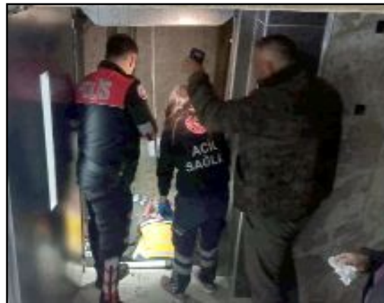
Yaralı vatandaş, bulunduğu yerden kurtarılarak yapılan müdahalenin ardından Hitit Üniversitesi Erol Olçok Eğitim ve Araştırma Hastanesi'ne kaldırıldı.

si Erol Olçok Eğitim ve Araştırma Hastanesi'ne kaldırıldı. (Tugay GÖKTÜRK)