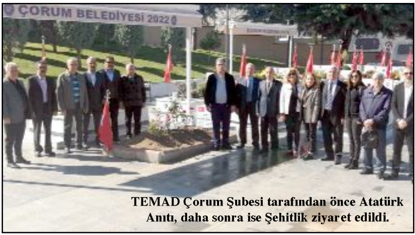
TEMAD Çorum Şubesi tarafından önce Atatürk Anıtı, daha sonra ise Şehitlik ziyaret edildi.

milli bir güçtür. Emekli ve muvazzaf olmak üzere astsubaylarımızın gününü kutlu olsun. Ülkemiz sağlık, huzur ve barış içinde yaşasın" dedi. (Volkan SINAYUÇ)