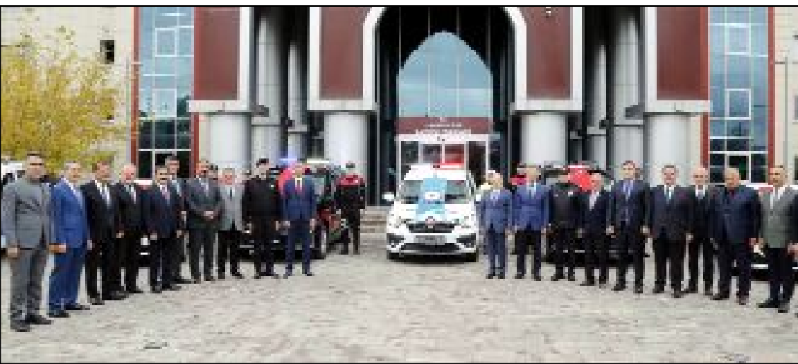
Emniyet Genel Müdürlüğü, Toplum Destekli Polis Hizmetleri Geliştirme ve Dayanışma Derneği ile Ticaret ve Sanayi Odasının katkılarıyla Çorum İl Emniyet Müdürlüğü'ne kazandırılan 7 hizmet aracı için tören düzenlendi.

Konuşmaların ardından kurban kesildi. (AA)