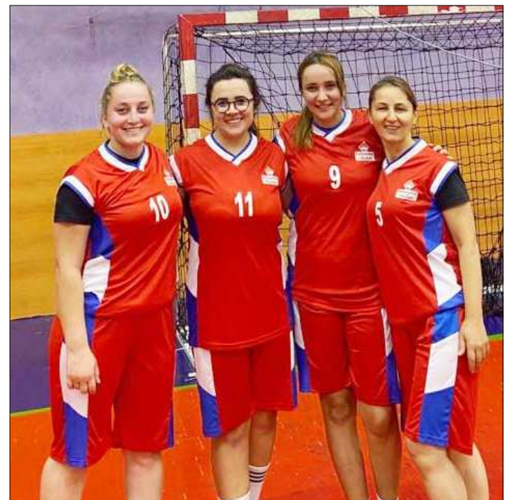
Milli Eğitim Müdürlüğü takımı maçtan sonra böyle poz verdi.

Çorum Milli Eğitim Müdürlüğü bugünü BAY geçerken, yarın Bolu Milli Eğitim Müdürlüğü ile karşı karşıya gelecek. (Rifat KARA)