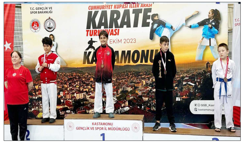
Çorumlu sporcular 8 sıklıkta birinci olmayı başardılar.

Özeker kata kategorisinde de üçüncü olarak bronz madalya kazanan sporcular oldular. Müsabakalar sonunda düzenlenen törenle dereceye giren Çorumlu sporculara madalyaları takdim edildi. (Rifat KARA)