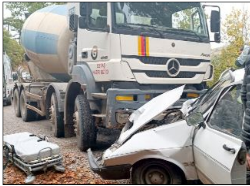
Kaza, Osmancık'ın Fındık köyü yolunda meydana geldi.