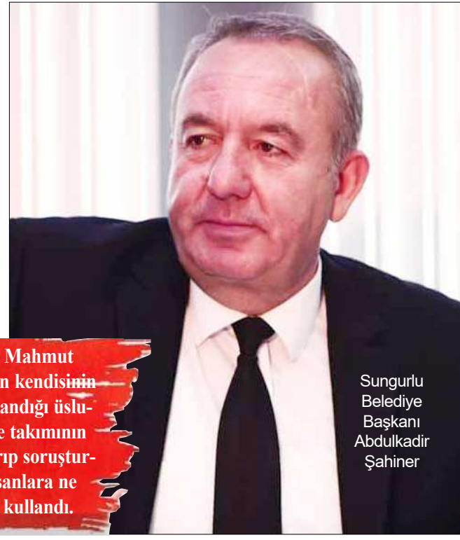
Sungurlu Belediye Başkanı Abdülkadir Şahiner

Sungurlu Belediye Başkanı Abdülkadir Şahiner, Osmancık Belediyespor'a 3-2 yenildikleri Cumhuriyet Kupası maçından sonra yaptığı açıklamada, "Belediyemizi siyasette ötekileştirdikleri gibi sporda da ötekileştirmeye çalışan bu şerefsizce yönetimi lanetliyorum. Buradan takımlarımıza hakem tayin eden mercileri uyarıyorum, bir daha kızlarımızın hakkını yer, onları üzerseniz, karşınızda beni bulursunuz" ifadelerini kullandı.