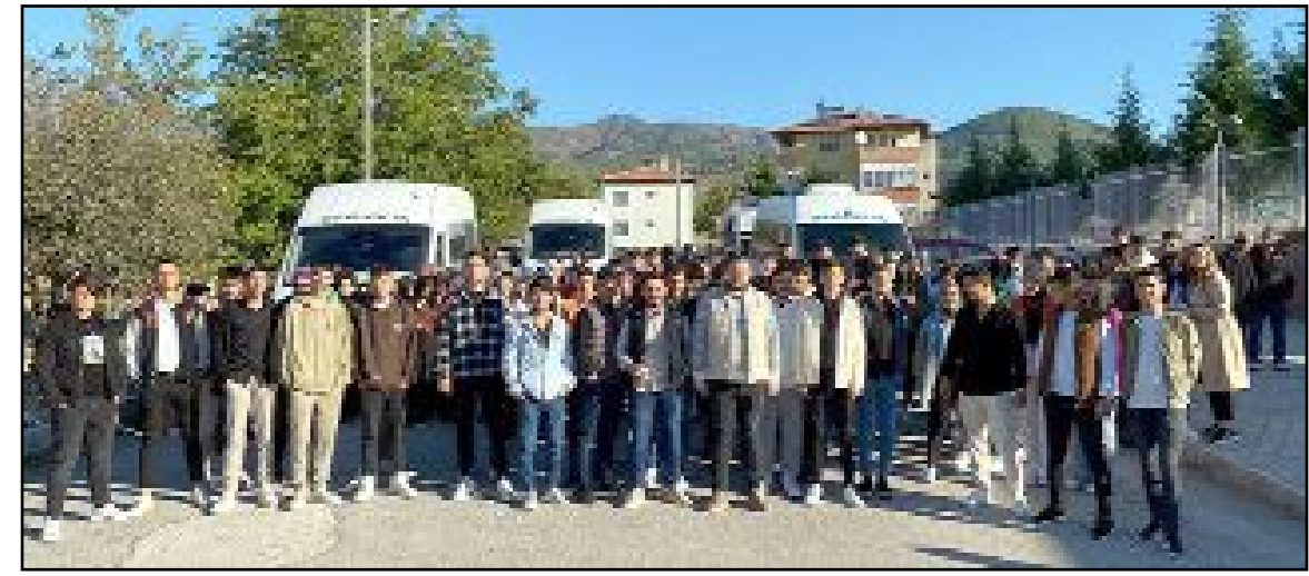
AK Parti Osmancık Gençlik Kolları üyeleri ve Osmancık Üniak üyeleri Çorum'daki etkinliğe geniş şekilde katıldı.

Gençlerin mutluluğu bizleri de mutlu etti bu tarz etkinliklerimizi Osmancık'ta da yapacağız gençlerimizi gurubette gibi değil kendi mekreklerinde hissetmelerini büyük ve güçlü AK Parti teşkilatımız ile birlikte sağlayacağız sizlerin huzurunda bu programa katılmamızda desteklerini esirgemeyen Çorum Milletvekili sayın Av. Oğuzhan Kaya'ya ve ilçe başkanımız şerif Okudan ve ilçe teşkilatımıza aynı zamanda bu programı yapan Çorum Gençlik Kolları il başkanımız Muhammed Fatih Temur ve Çorum belediye başkanımız Halil İbrahim Ağın'a genç kardeşlerimiz adına teşekkür ediyorum" dedi. (Haber Merkezi)