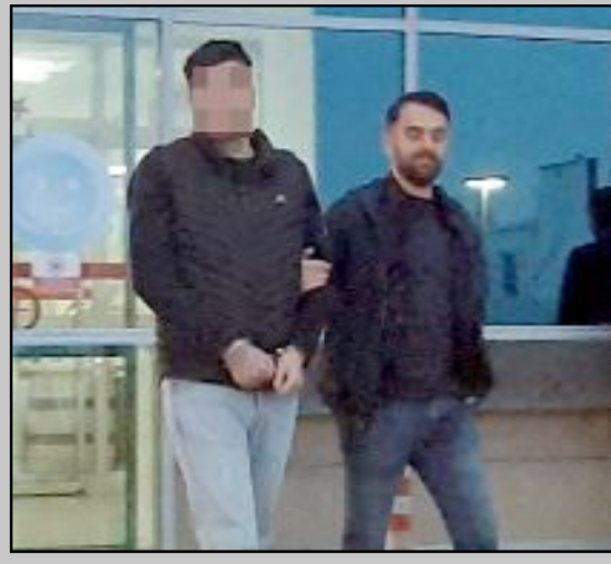
M.E.S. tutuklanarak cezaevine gönderildi.

M.E.S. emniyetteki işlemlerinin ardından çıkarıldığı mahkemeye tutuklanarak cezaevine gönderildi.