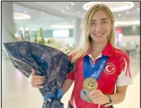
Milli sporcu Şahika Ercümen Hatay'da yeni bir dünya rekoruna daha imza attı.