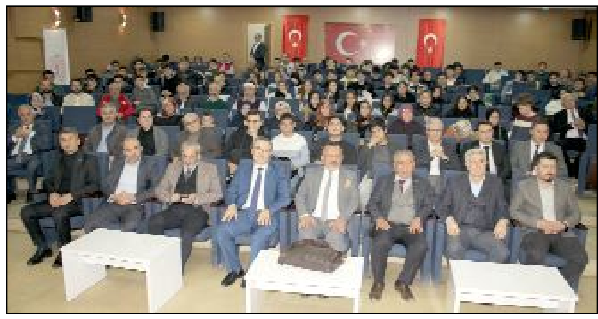
Mevlana'nın vefatının 750. yıldönümü nedeniyle "Mevlana'da Ahlak Eğitimi" konulu bir konferans düzenlendi.