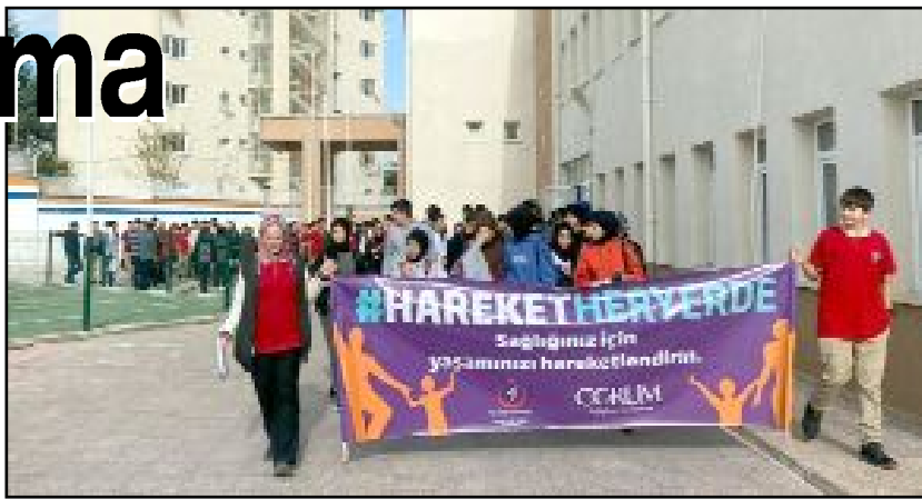
Dodurga Toplum Sağlığı Merkezi'nin organize ettiği etkinliklere öğrenciler destek verdi. İlçe halkına da pazarda bilgilendirici broşür dağıtıldı.

Dodurga Toplum Sağlığı Merkezi görevlileri, ayrıca Dodurga Halk Pazarı'nda stant kurarak vatandaşları kalp sağlığı konusunda bilgilendirdi. (AA)