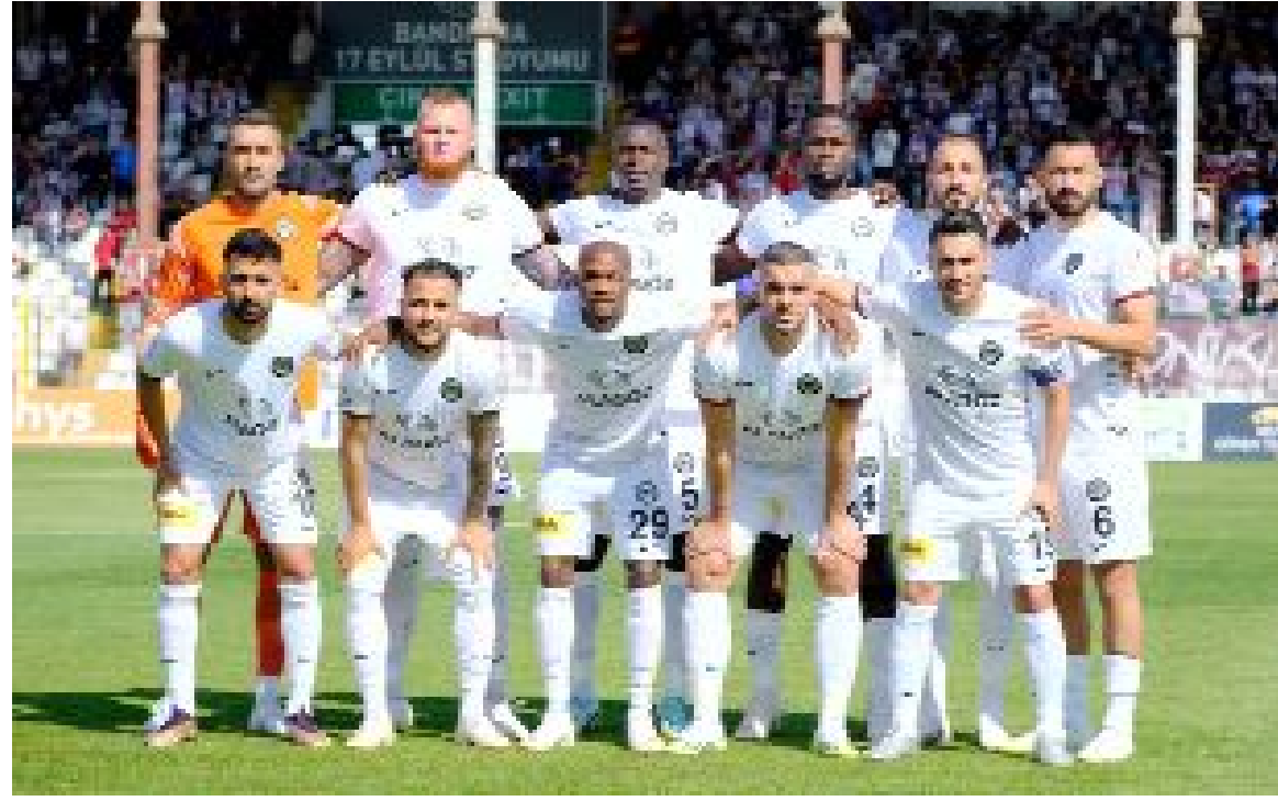
Ahlatçı Çorum FK, 1.Lig'de ilk kez mücadele etmesine rağmen beklentilerin üzerinde bir performans sergiliyor.

Lider Eyüpspor'la 8.sıradaki Ahlatçı Çorum FK arasında, yarın akşam Çorum Şehir Stadı'nda oynanacak maçı Ankara bölgesi A klasman hakemlerinden Alper Akarsu düdüklecek. Saat 19.00'da başlayacak maçta Alper Akarsu'nun yardımcılıklarını ise İzmir bölgesinden Hüsnü Emre Çelimli ve Bitlis bölgesinden Barış Çiçeksoy yapacak. Eskişehir'den Semih Kurt da maçta dördüncü hakem olarak görev alacak. (Hüseyin AŞKIN)