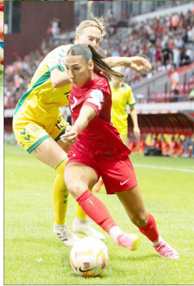
Uluslar C Ligi 2.Grup'ta mücadele eden Kadın A Milli Futbol Takımımız ilk maçında Gürcistan'ı deplasmanda 3-0, ikinci maçında Elazığ'da Litvanya'yı 2-0 yendi.

semburg'daki maçtan sonra 28 Ekim'de Çorum'a gelerek kampa girip 31 Ekim'deki maçın hazırlıklarına başlayacaklar. (Hüseyin AŞKIN)