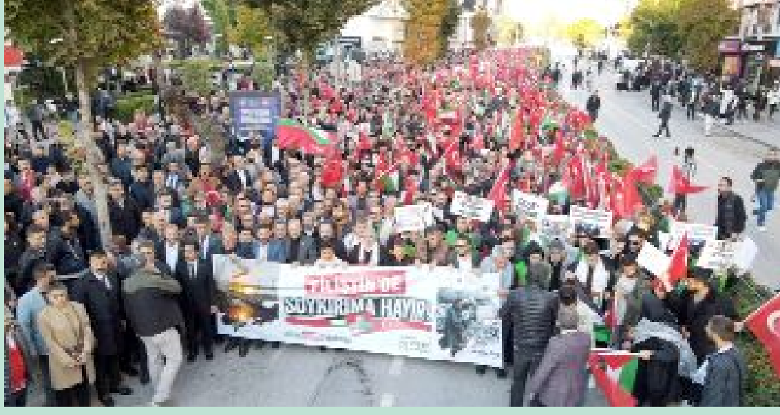
Çorum'da düzenlenen "Büyük Filistin Yürüyüşü"nde kent sakinleri, Filistin'e saldırılarından dolayı İsrail'e tepki gösterdi.