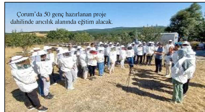
Çorum’da 50 genç hazırlanan proje dahilinde arıcılık alanında eğitim alacak.