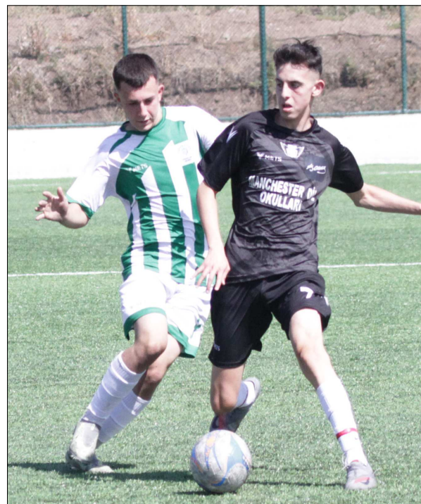
U18 Ligi maçından bir enstantane...

Osmancık'gücü, saat 15.00'de ise Mimar Sinan Gençlikspor ile Alaca Belediyespor karşılaşacak. Saat 14.00'de oynanacak olan günün diğer 2 maçında ise Mecitözü İlçe Sahası'nda Mecitözü Gençlerbirliği ile Gençlerbirliği, İskilip İlçe Sahası'nda ise İskilipspor ile H.E.Kültürspor takımları karşı karşıya gelecek. (Rifat KARA)