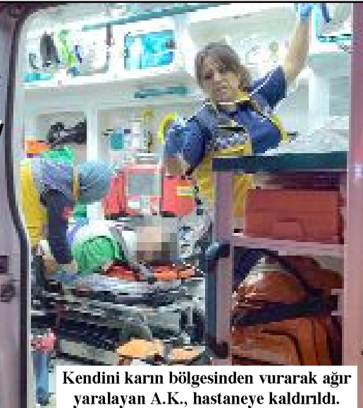
Kendini karın bölgesinden vurarak ağır yaralayan A.K., hastaneye kaldırıldı.