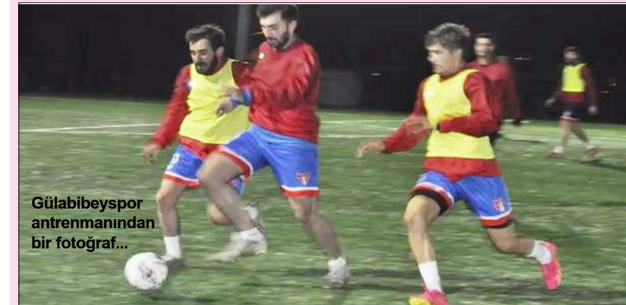
Gülabibey Gençlikspor antrenmanından bir fotoğraf...

por: Muammer Tekmen, Sefa Kabak, Atahan Demir. U15 Ligi Mimar Sinan Gençlikspor-Hattuşa Gençlikspor: Ömür Soytemiz, Ömer Bingöl, Nezirgider Abukan. Çorum Anadolu FK-İskilipgücü: Özkan Dağ, Ömür Soytemiz, Emrehan Arslan. Osmancık Kandiberspor-Gençlerbirliği: A.Enes Gök-güney, Hatice Yıldırım, Sefa Kabak. Alaca Belediyespor-Mavi Ay Gençlikspor: Uğur Koçak, Fatih Koçak, Atahan Demir. Sungurlu Belediyespor-H.E.Kültürspor: Mertcan Öğreten, Batuhan Gelgeç, Mer-ve Esen. Çorumspor-Osmancık Belediyespor: İsmail Sırma, Emrehan Arslan, Edanur Dölkeleş. GELİŞİM Ligi Ahlacı Çorum FK U17-Kırşehir FK U17: E.Ramazan Boyraz, Özkan Dağ, Batuhan Gelgeç. (Rifat KARA)