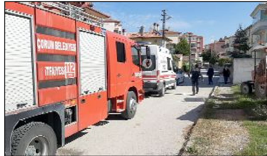
Polis ekiplerinin defalarca zile basmasına rağmen kapının açılmaması üzerine, itfaiye ekiplerince demir korkuluklar kırılarak camdan eve girildi.