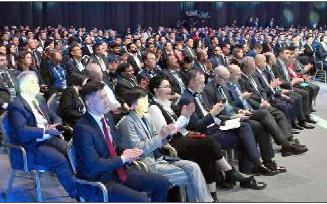
Uluslararası etkinlikten bir görüntü...

oldu. Yapay zekâ teknolojilerinin etkisi, elektriğin ve internetin keşfi kadar devrim niteliğindedir" dedi. ● Cumhurbaşkanı Tokayev, ayrıca, yapay zekânın insanların yaşam tarzını kökten değiştirebilme, iş süreçlerini otomatikleştirme ve büyük ekonomik değer yaratma kapasitesine sahip olduğuna dikkat çekti. (Aliye ÖNCEL)