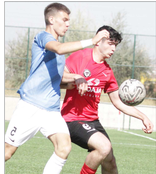
U19 Gelişim Ligi maçından bir enstantane...

Ahlatcı Çorum FK, bugün U17 Ligi'nde sahasında Kırşehir FK'yı konuk ederken, U19 Ligi'nde ise deplasmanda Tarsus İdman Yurdu ile karşı karşıya gelecek.