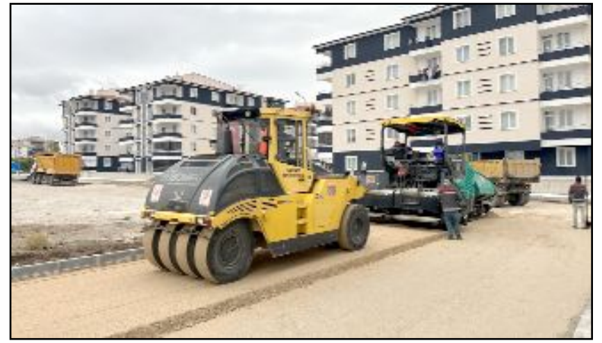
Ulukavak Mahallesi'nde Özgürevler ve Söğütülevler'de altyapı çalışmalarının ardından 1500 ton sıcak asfalt serimi yapılıyor.

faltını dökeceğiz. Böylece Ulukavak Mahallesi'ne toplamda 1500 ton sıcak asfalt çalışması yapılmış olacaktır." dedi. (Haber Merkezi)