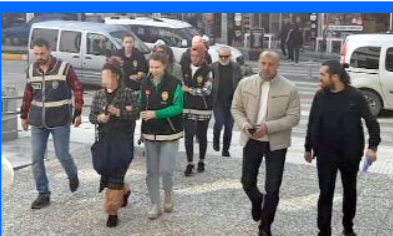
Çorum'da girdikleri evlerden hırsızlık yaptıkları tespit edilen 3 kadın, polis ekiplerince yakalandı.