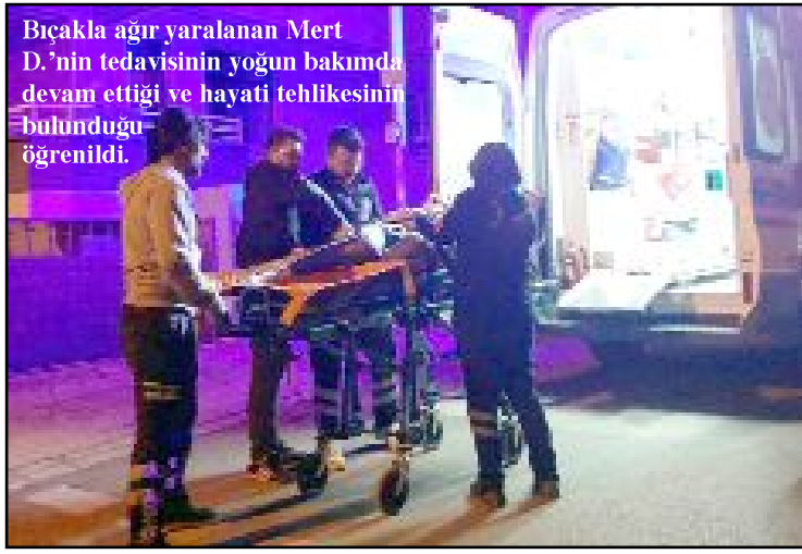
Bıçakla ağır yaralanan Mert D.'nin tedavisinin yoğun bakımında devam ettiği ve hayati tehlikesinin bulunduğu öğrenildi.

hayati tehlikesinin bulunduğu öğrenildi. (Tugay GÖKTÜRK)