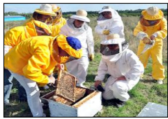
Hem eğitim hem de istihdamdan uzak kalan gençlerin meslek sahibi olması hedefleniyor.