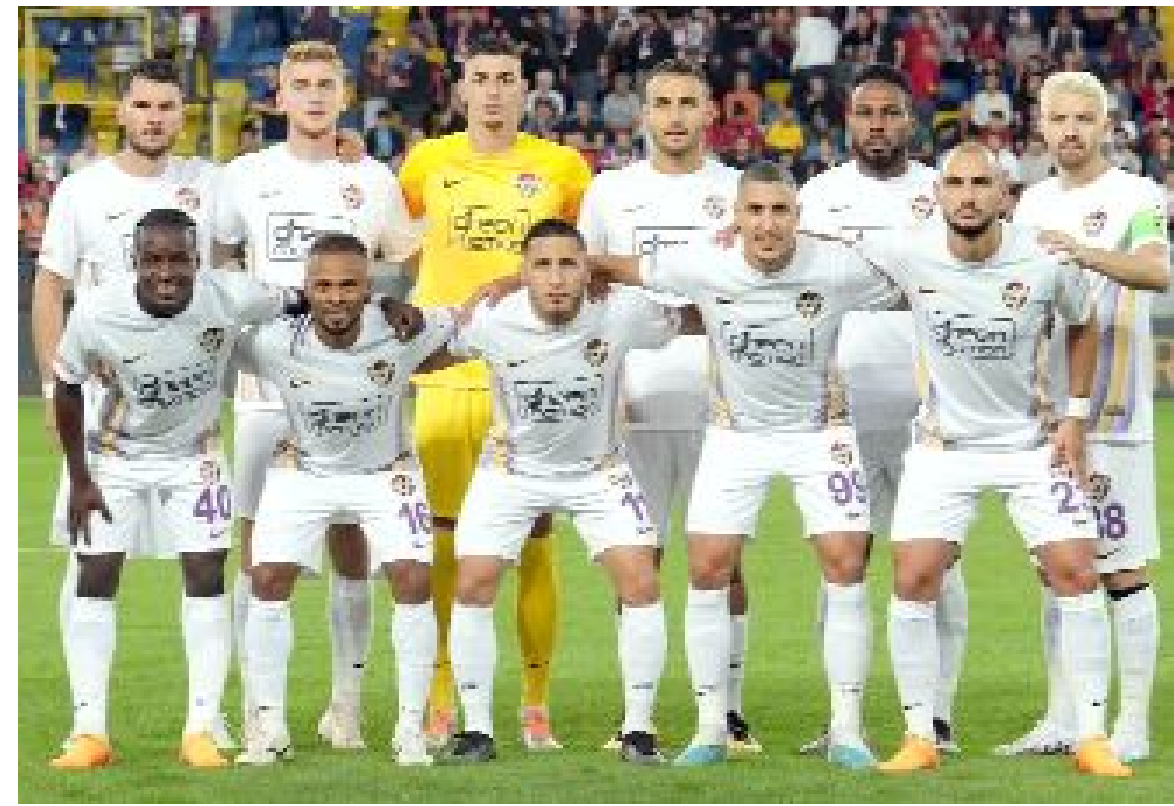
Eyüpspor, oynadığı 8 maçın 7'sini kazanırken, tek yenilgisini deplasmanda Sakaryaspor'a karşı aldı

20.00 Gençlerbirliği-Altay.....İlker Yasin Avcı (İstanbul)