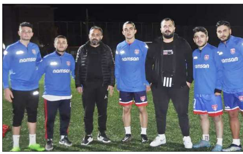
Gülabibey Gençlikspor'un yeni transferleri...