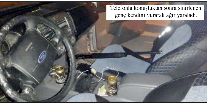
Telefonla konuştuktan sonra sinirlenen genç kendini vurarak ağır yaralandı.