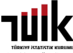
TÜRKİYE İSTATİSTİK KURUMU

Yıllık değerlendirilmede, Yİ-ÜFE ile; yatırım araçlarında külçe altın yüzde 13,96 ve euro yüzde 7,83 oranlarında yatırımcısına reel getiri sağlarken; dolar yüzde 0,01, mevduat faizi (brüt) yüzde 21,57 ve DİBS yüzde 43,30 oranlarında yatırımcısına kaybettirdi. TÜFE ile külçe altın yüzde 4,02 oranında yatırımcısına reel getiri sağlarken; euro yüzde 1,57, doları yüzde 8,73, mevduat faizi (brüt) yüzde 28,42 ve DİBS yüzde 48,24 oranlarında yatırımcısına kaybettirdi. (Haber Merkezi)