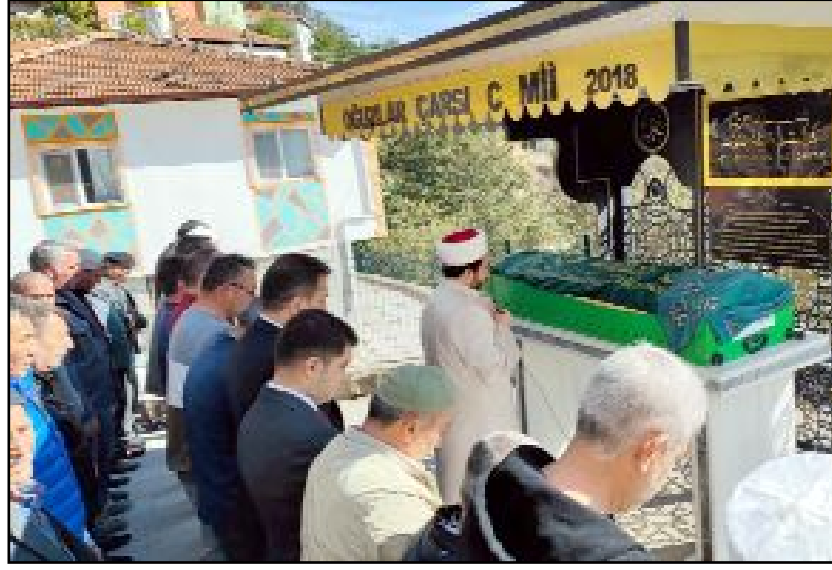
Cinayete kurban giden talihsiz kadın memleketi Oğuzlar'da son yolculuğuna uğurlandı.