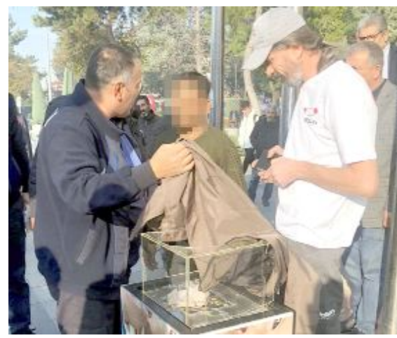
K.A. isimli şahıs, yardım paralarını almak isterken PTT güvenlik görevlisi tarafından engellendi.

● Çorum'da SMA hastası bir çocuğun yardım kumbarasında biriken paraları çalmaya çalışan şahsı, PTT güvenlik görevlisi suçüstü yakaladı. ● Yardım kutusunun camlarını kıran ve suçüstü yakalanan K.A. olay yerine çağrılan emniyet güçleri tarafından gözaltına alındı. •4’de