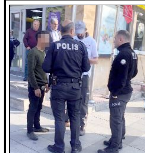
Yardım kutusunun camlarını kıran ve suçüstü yakalanan K.A. olay yerine çağrılan emniyet güçleri tarafından gözaltına alındı.

Yoğun sis nedeniyle Çorum-Ankara kara yolunun bazı bölgeleri ile şehir içinde özellikle Hitit Üniversitesi Erol Olçok Eğitim ve Araştırma Hastanesi yönünde sürücüler trafikte zor anlar yaşadı.