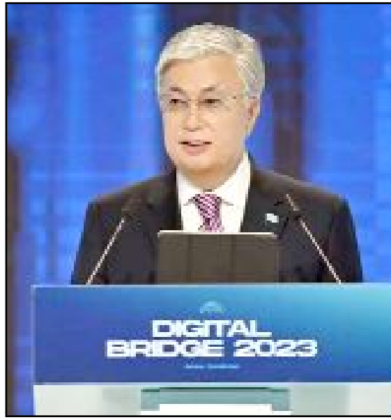
Kazakistan Cumhurbaşkanı Kasım Cömert Tokayev.

oldu. Yapay zekâ teknolojilerinin etkisi, elektriğin ve internetin keşfi kadar devrim niteliğindedir" dedi. ● Cumhurbaşkanı Tokayev, ayrıca, yapay zekânın insanların yaşam tarzını kökten değiştirebilme, iş süreçlerini otomatikleştirme ve büyük ekonomik değer yaratma kapasitesine sahip olduğuna dikkat çekti. (Aliye ÖNCEL)