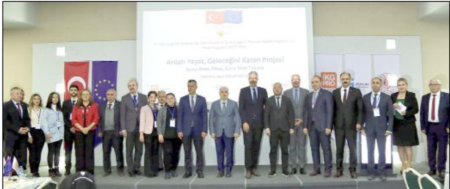
“Arıları Yaşat Geleceğini Kazan” Projesi Anitta Otel’de düzenlenen tanıtım ile başladı. 1 yıl sürecek proje kapsamında 50 gencin arıcılık alanında meslek sahibi olması hedefleniyor.