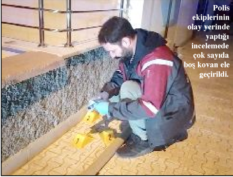
Polis ekiplerinin olay yerinde yaptığı incelemede çok sayıda boş kovan ele geçirildi.

Olayla ilgili başlatılan soruşturma sürüyor. (İHA)