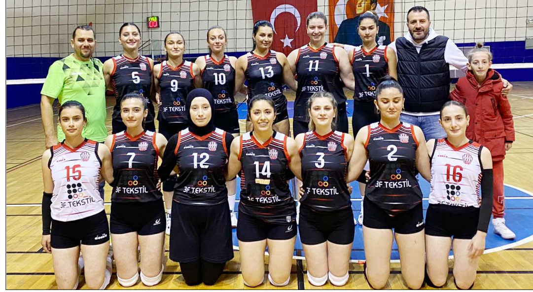
Osmancık'ın sultanları Trabzon'dan galibiyetle dönmeyi hedefliyor...

Grup'ta oynanacak diğer maçlarda ise Bordo-Mavi 61 ile Ayancık Belediyespor, 52 Çamlıkspor ile Çarşamba Gençlikspor, Ulalerspor ile