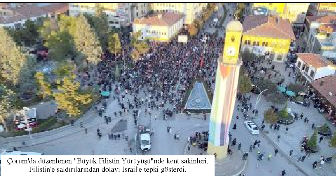
Çorum'da düzenlenen "Büyük Filistin Yürüyüşü"nde kent sakinleri, Filistin'e saldırılarından dolayı İsrail'e tepki gösterdi.