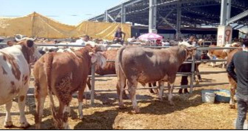
İl genelindeki tüm hayvan pazarlarının 23 Ekim'de tekrar açılacağı bildirildi.