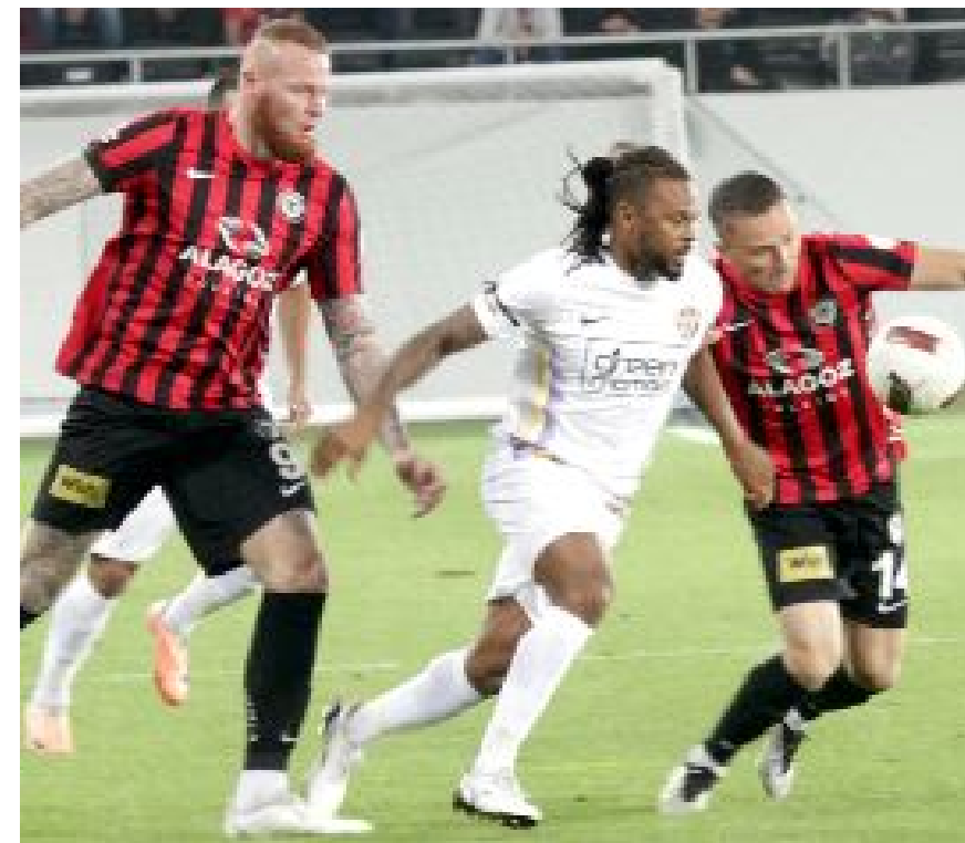
Ahlatcı Çorum FK, milli aranın ardından lider Eyüpspor'u konuk etti.

27 EKİM CUMA 20.00 Şanlıurfaspor-Giresunspor 28 EKİM CUMARTESİ 13.30 A.Keçiörengücü-Göztepe 13.30 Tuzlaspor-Erzurumspor FK 16.00 Boluspor-Bodrum FK 19.00 Kocaelispor-Gençlerbirliği 29 EKİM PAZAR 13.30 Manisa FK-A.Çorum FK 16.00 Adanaspor-Ümraniyespor 16.00 Altay-Sakaryaspor 19.00 Eyüpspor-Bandırmaspor