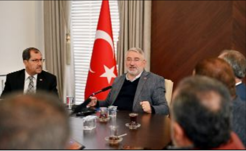
Mahalle muhtarları ile birlikte 4 yılı aşkın süredir gece-gündüz Çorum için çalıştıklarını belirten Aşgın, kendisine yol arkadaşı olan mahalle muhtarlarına teşekkür etti.