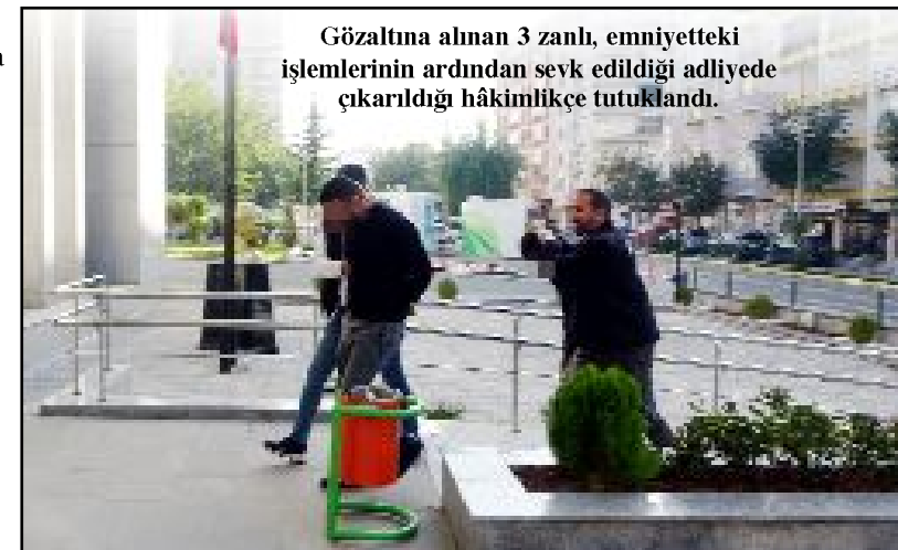
Gözaltına alınan 3 zanlı, emniyetteki işlemlerinin ardından sevk edildiği adliyeye çıkarıldığı hâkimlikçe tutuklandı.

Gözaltına alınan 3 zanlı, emniyetteki işlemlerinin ardından sevk edildiği adliyeye çıkarıldığı hâkimlikçe tutuklandı.