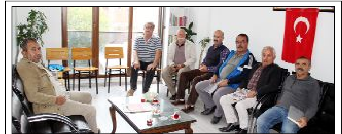
Emek Partisi Merkez İlçe Örgütü'nün genel kurulu parti binasında yapıldı.