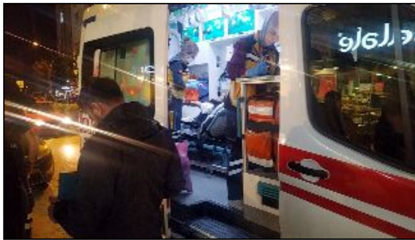
Yaralı kız çocuğu, ambulansla Hitit Üniversitesi Erol Olçok Eğitim ve Araştırma Hastanesi'ne kaldırılarak tedavi altına alındı.

lamak için çalışma başlattı. Olayla ilgili başlatılan soruşturma sürüyor. (İHA)