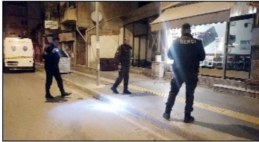
Polis ekiplerinin olay yerinde yaptığı incelemelerde boş kovanlar ele geçirildi.

Çorum'da gece saatlerinde 2 işyeri ve 1 otomobil, pompalı tüfikle kurşunlandı. Olayın ardından kaçan zanlı, polis ekipleri tarafından kısa sürede yakalandı. Olay, Osmancık Caddesi'nde meydana geldi. Edinilen bilgiye göre, cadde üzerine gelen C.K., 2 işyeri ve park halinde bulunan otomobili pompalı tüfek ile kurşunladı. İhbar üzerine olay yerine çok sayıda çarşı mahalle bekçisi ve polis ekipleri sevk edildi. Olayda ölen ya da yaralanan olmazken, otomobilde ve iş yerlerinde maddi hasar meydana geldi. Polis ekiplerinin olay yerinde yaptığı incelemelerde boş kovanlar ele geçirildi. Olayın ardından kaçan C.K., polis ekiplerinin yaptığı çalışmalarını sonucu kısa sürede yakalanarak gözaltına alındı. Zanlı emniyetteki ifadesinin ardından adli makamlara sevk edildi.(İHA)