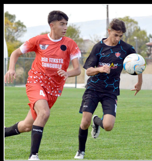
Hattuşa Gençlikspor-Osmancıkücü maçı...