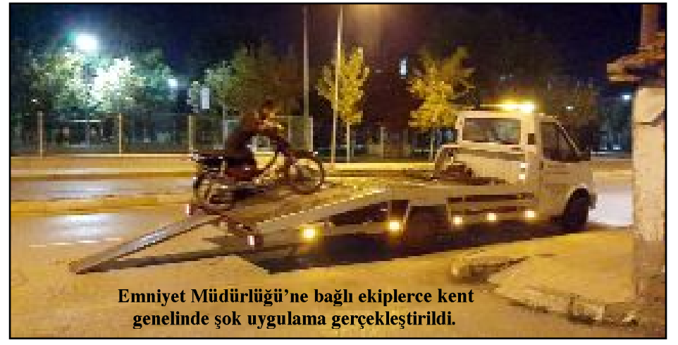
Emniyet Müdürlüğü'ne bağlı ekiplerce kent genelinde şok uygulama gerçekleştirildi.

Çorum'da İl Emniyet Müdürlüğü'ne bağlı ekiplerce kent genelinde şok uygulama gerçekleştirildi. İl Emniyet Müdürlüğü Trafik Denetleme Şube Müdürlüğü ekiplerince mahalle ve ara sokaklarda yapılan şok uygulamaları kapsamında 74 araç kontrol edildi. Ehliyetsiz ve alkolü araç kullanarak trafik güvenliğini tehlikeye düşüren 34 araca 117.372 lira ceza yazıldı. Ulukavak Mahallesi Ölçek 3. Sokak'ta plakasız, şase ve motor numarası silinmiş halde terk edilmiş bir motosiklet ile 1 araç trafikten men edilerek otoparka çekildi. (Tugay GÖKTÜRK)