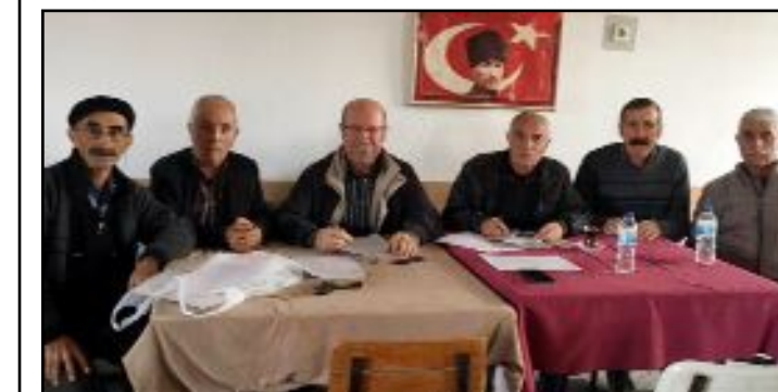
Emek Partisi, ilçelerde de kongrelerini tamamladı.