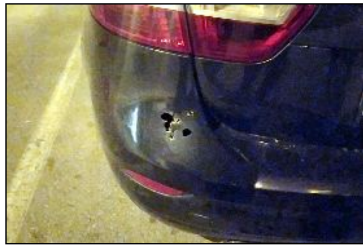
Gece saatlerinde 2 işyeri ve 1 otomobil, pompalı tüfikle kurşunlandı