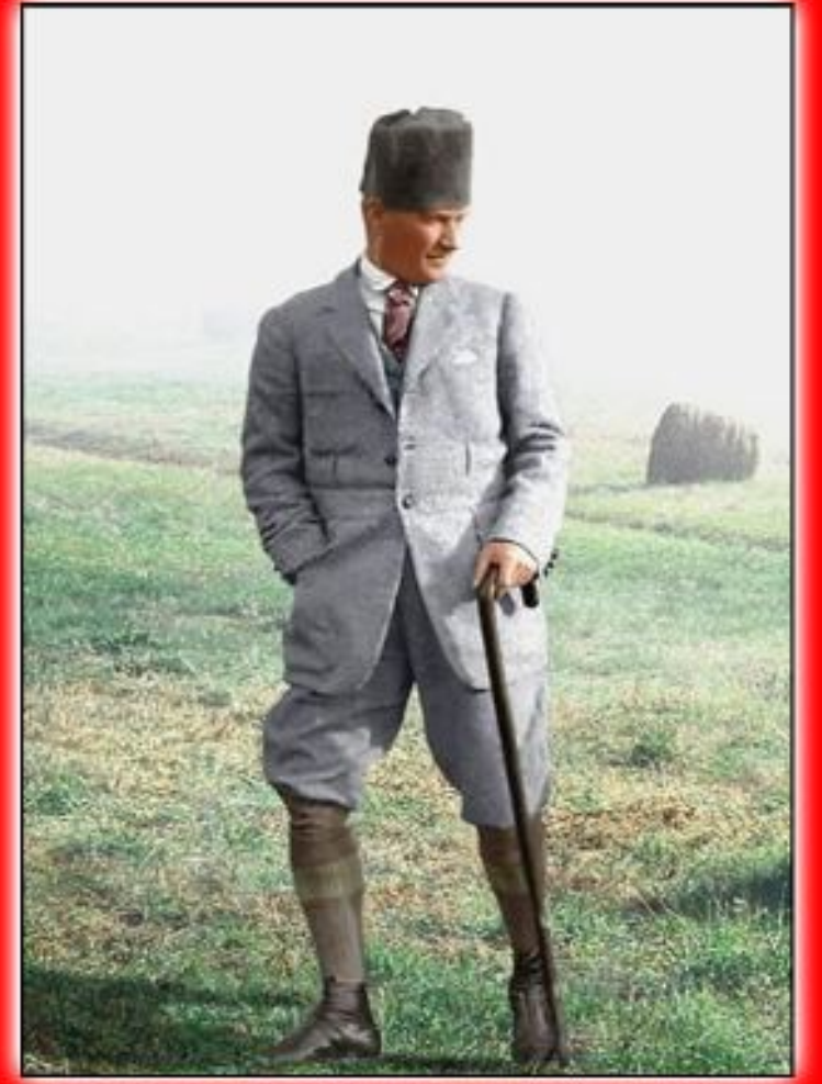
Gazi Mustafa Kemal Atatürk