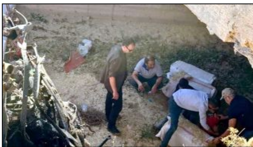
Alaca 2 kişinin yaralandığı trafik kazasına, Ankara'dan Tokat'a gezi için giden Bilkent Şehir Hastanesi doktorları ilk müdahalede bulundu.

rın hızlı ve profesyonel müdahalesinin olası daha kötü sonuçları engellediğini ve yaralıların durumlarını stabil hale getirdiklerini ekledi. (Haber Merkezi)