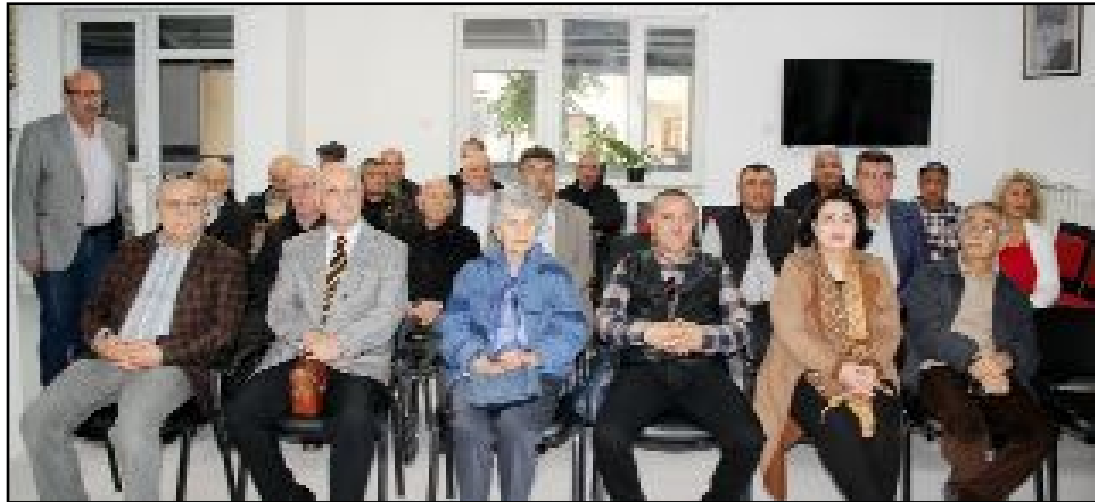
Türkiye Cumhuriyeti'nin kuruluşunun 100. yılı etkinlikleri kapsamında ADD Çorum Şubesi'nde "Cumhuriyetimiz 100 Yaşında" adlı bir konferans gerçekleştirildi.

AKP iktidarı ile birlikte cumhuriyet kazanımlarının hızlı bir şekilde elden çıktığını dikkat çeken Karaman, 2017 referandumu ile birlikte Türkiye'de bir rejim değişikliğine gildiğini kaydederek, "Bugün ne yazık ki her alanda 1938'in gerisinde olan bir ülkeyiz" dedi. (Taner ŞİMŞEK)