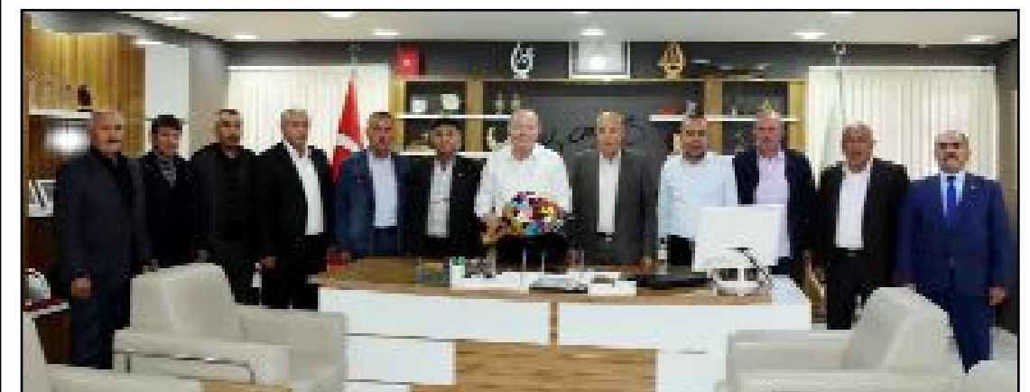
Sungurlu'da mahalle muhtarları Belediye Başkanı Abdulkadir Şahiner'i ziyaret etti.

larımıza nazik ziyaretlerinden dolayı teşekkür ediyorum. İlçemizin tüm sorunlarını el ele vererek çözmeye devam edeceğiz" ifadelerini kullandı. (Haber Merkezi)