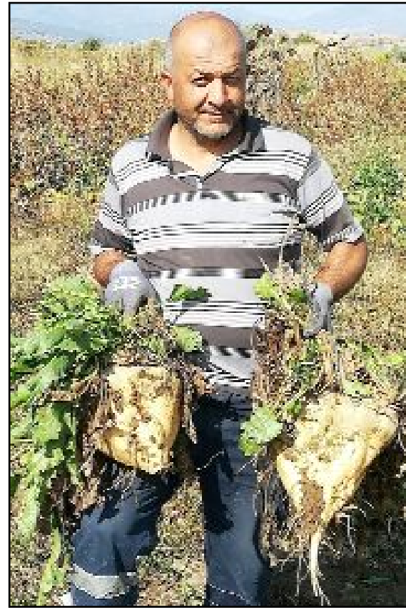
Osmancık'a bağlı Kargı köyünde bir çiftçi, her biri yaklaşık 30'ar kilo ağırlığında dev pancarlar yetiştirdi.