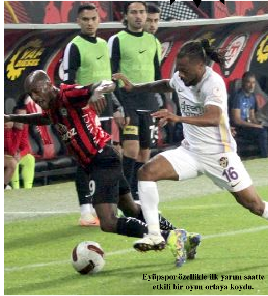
Eyüpspor özellikle ilk yarım saatte etkili bir oyun ortaya koydu.

Ahlatcı Çorum FK, farkı artırmaya çalışırken, Eyüpspor ise skorun verdiği rahatlıkta mücadele etti. Çorum FK'nın tempo yapmasına izin vermeyen İstanbul ekibi, ani ataklarla farkı artırmaya çalıştı.