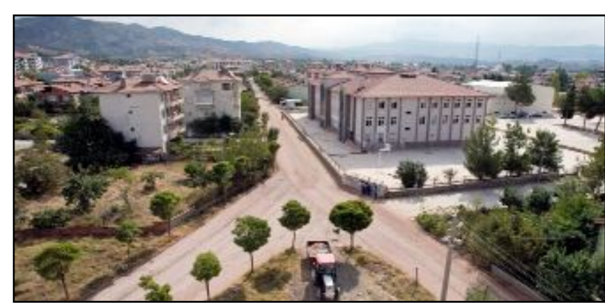
ÇORUM HABER ihbar hattına ulaşan bazı vatandaşlar su kesintisi nedeniyle mağduriyet yaşadıklarını dile getirdi.

Çorum'da 3 gündür suları kesik olan vatandaşlar, mağdur olduklarını dile getirdi. Osmancık ilçesinin Şenyurt, Esentepe ve Koyunbaba mahallelerinde 3 gündür sular kesik. Arıza nedeniyle 3 gündür mahallelere su verilemediği öğrenildi.