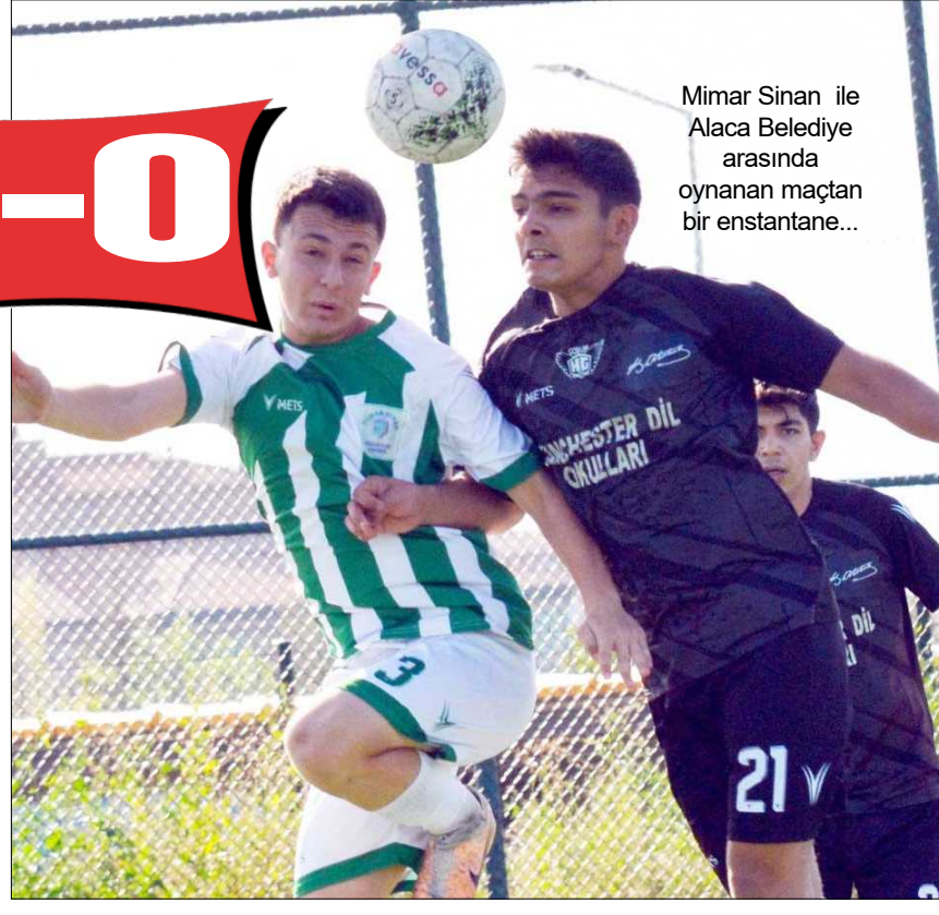
Mimar Sinan ile Alaca Belediye arasında oynanan maçın bir enstantane...

de başka gol olmayınca karşılaşma 7-0 Mimar Sinan Gençlikspor'un üstünlüğü ile sona erdi. Bu sonucun ardından Mimar Sinan Gençlikspor 5'de 5 yaparak puanını 15'e yükseltirken, Alaca temsilcisi ise henüz puanla tanışamadı. (Rifat KARA)