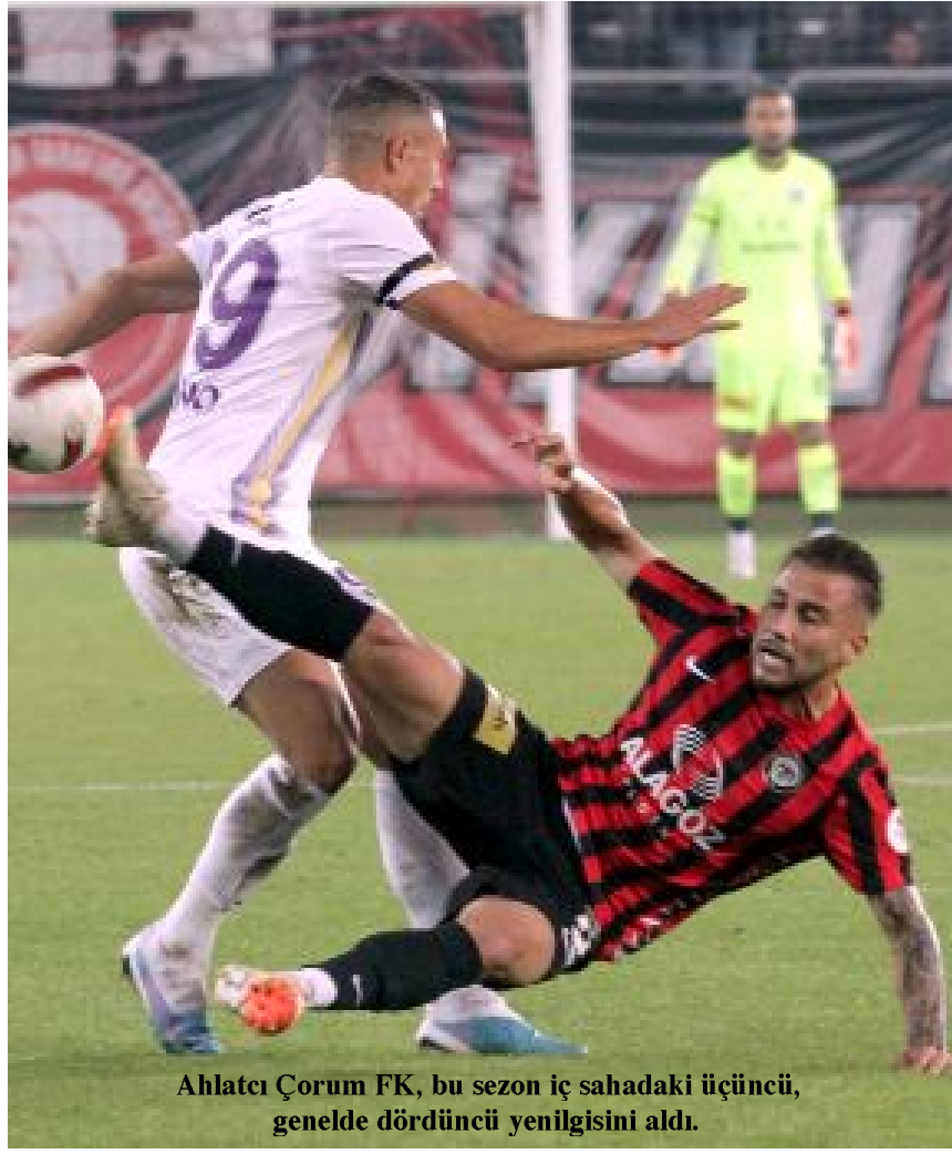
Ahlatcı Çorum FK, bu sezon iç sahadaki üçüncü, genelde dördüncü yenilgisini aldı.

90+4: GOL! Ahlatcı Çorum FK atağında, Ahmet Sağat yayın içerisinden vurdu, savunmaya çarpan top kornere çıktı. Atış paslaşarak kullanılırken, sağdan Kerem ortladı, ceza sahası içerisinde Ologo topu kafayla ağlara gönderdi: 2-3.