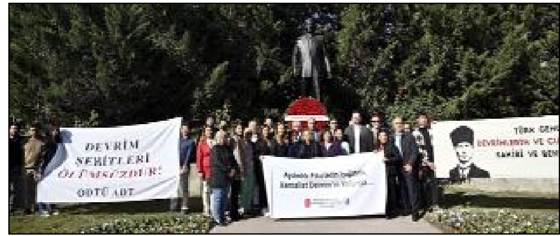
Kışlalı'nın hayatını kaybettiği yerde anma programı gerçekleştirildi.

Özel ilan-reklam: (Siltun/Cm) 10TL + KDV Vefat, teşekkür, kutlama vb. mesajlar (4 sütun/10 cm. maktu) 150TL Toplantı ilanları (maktu): 300TL Satılık, yitlik, eleman arama vb. ilanları (2 sütun/5 cm. maktu): 60 TL Tam sayfa ilan-reklam: 1.600TL (Yanm sayfa 800, çeyrek 400, çeyrek yansı 200TL)