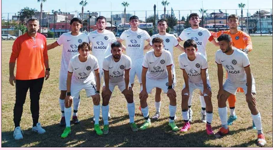
Çorum FK U19 takımının Tarsus karşısında maça başlayan ilk 11'i..