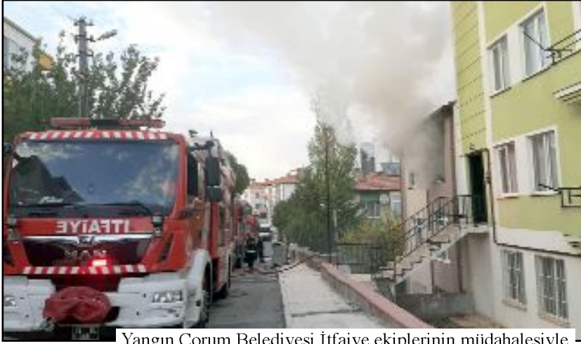
Yangın Çorum Belediyesi İtfaiye ekiplerinin müdahalesiyle söndürülürken, apartman dairesi tamamen yandı.

● Her hangi bir yaralanma yada can kaybının olmadığı yangında kundaklama şüphesi üzerinde duruluyor. (Tugay GÖKTÜRK)