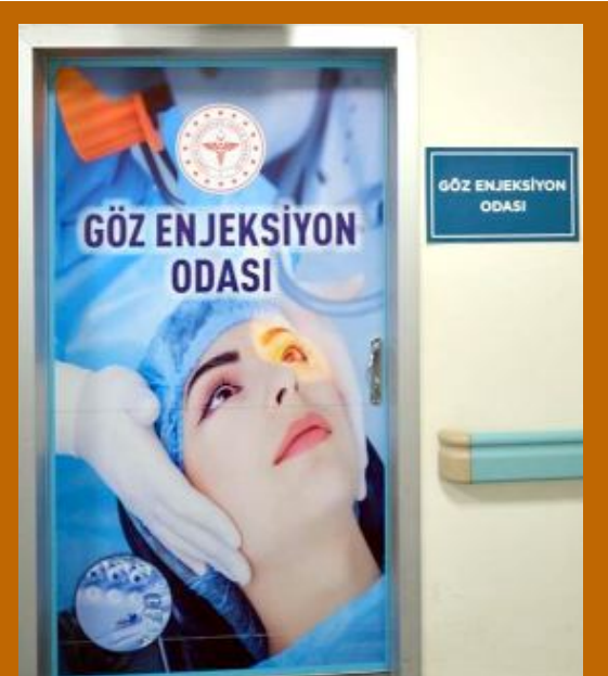
Hitit Üniversitesi Erol Olçok Eğitim ve Araştırma Hastanesi'nde göz enjeksiyon ünitesi açıldı.