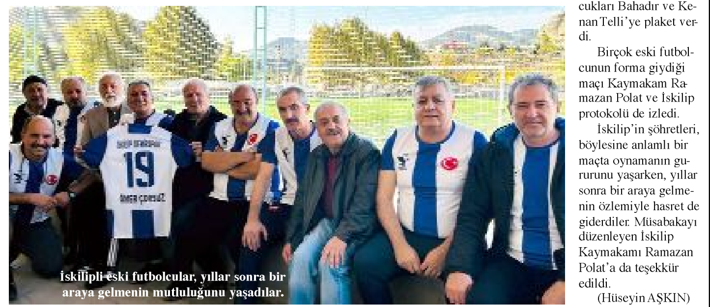
İskilipli eski futbolcular, yıllar sonra bir araya gelmenin mutluluğunu yaşadılar.