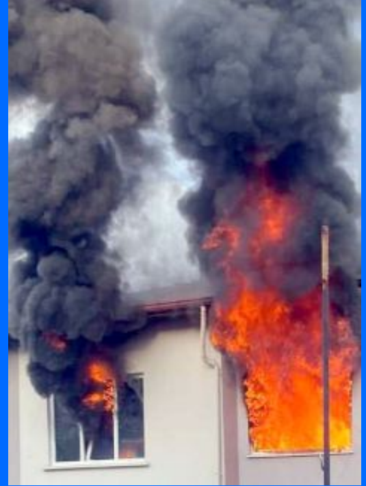
Yangın Çorum Belediyesi İtfaiye ekiplerinin müdahalesiyle söndürülürken, apartman dairesi tamamen yandı.

● Gülabibey Mahallesi Beytepe 2. Sokak'ta bir apartman dairesinde çıkan yangın itfaiyenin müdahalesi ile söndürüldü. •4'de