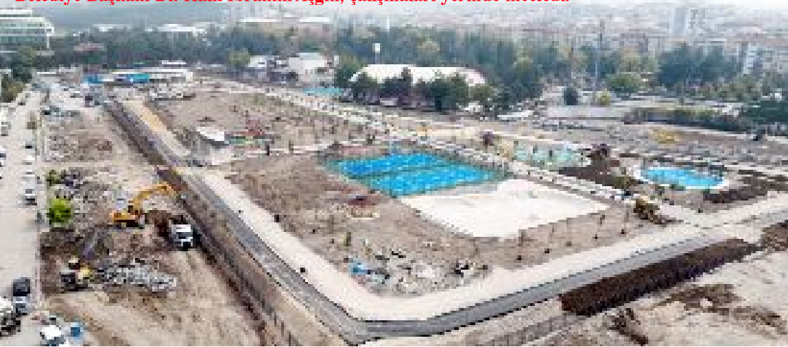
Çorum Belediyesi'nin Çevre, Şehircilik ve İklim Deđişikliği Bakanlığı ile yapımını sürdürdüđü yeni Millet Bahçesi projesi büyük bir hızla ilerlerken, yol ve otopark düzenlemesi için de çalışmalara başlandı.

● Çorum Belediyesi, yeni Millet Bahçesi projesinin çevresinde yol genişletme ve otopark çalışmalarına başladı. Hamit Kaplan Caddesi ve Bayındır 1. Sokak, 15 metre yol, 20 metre açık otopark alanı olarak düzenleniyor. •5'de