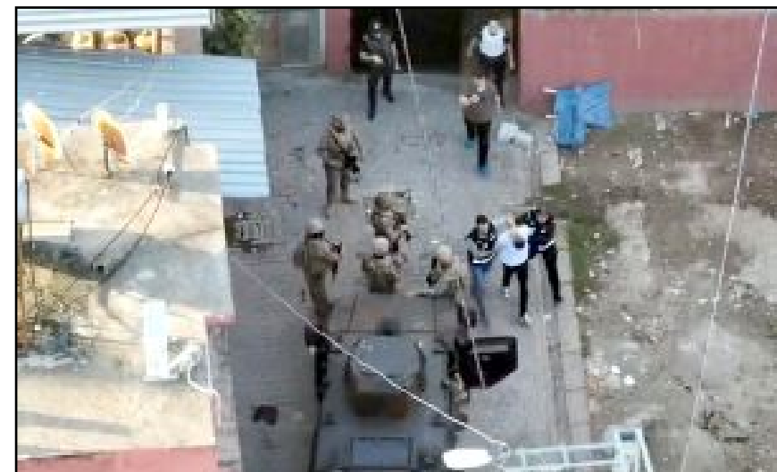
81 ildeki “Çember” operasyonları kapsamında aranma kaydı bulunan 4.133 kişi yakalandı.

larımızı tebrik ediyorum. Arananları yakalayıp adalete teslim etmeye kararlıyız.” (AA)