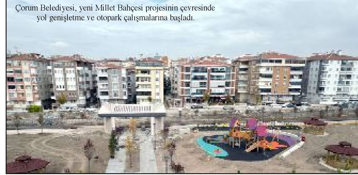
Çorum Belediyesi, yeni Millet Bahçesi projesinin çevresinde yol genişletme ve otopark çalışmalarına başladı.