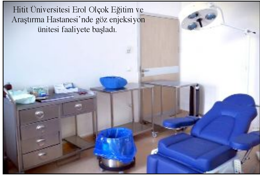
Hitit Üniversitesi Erol Olçok Eğitim ve Araştırma Hastanesi'nde göz enjeksiyon ünitesi faaliyete başladı.

niği de olan Göz Hastalıkları Kliniği bünyesinde sağlıklı ve ergonomik koşullarda hizmet sunumu sağlayacağı değerlendirilmiştir" dedi. (Haber Merkezi)