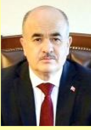
Vali Doç.Dr. Zülkif Dađlı

● Çorum Valisi Doç.Dr. Zülkif Dađlı, resmi ilanlarla ilgili bir genelge yayınlarak, kamu kurum ve kuruluşlarının, yerel yönetimlerin ve sermayesinin yarından fazlası kamuya ait teşekküllerin, mal veya hizmet alımları ile yapım-onarım ihaleleri konusunda uymaları gereken resmi ilan yayınlama zorunluluđunu hatırlattı.