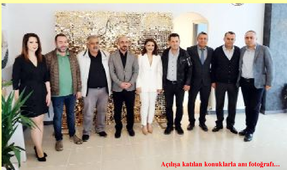
Açılışa katılan konuklarla anı fotoğrafı...