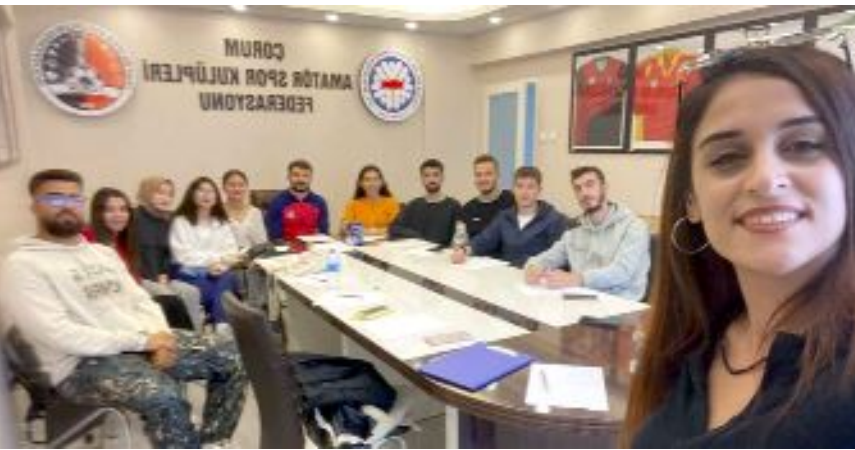
ASKF Başkanı Ferhat Arıcı, üniversite öğrencilerini kabul etti.