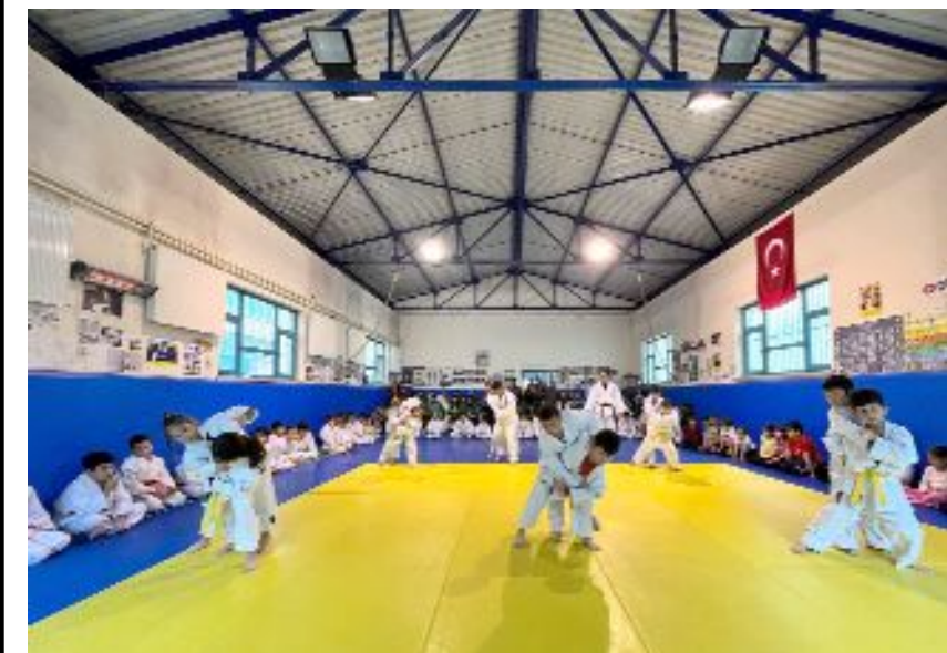
Kuşak sınavı, Mahmut Atalay Gençlik Merkezi Judo Salonu'nda yapıldı.

Sınava katılan tüm sporcuların başarılı olup bir üst kuşağa terfi ettiği belirtildi. (Hüseyin AŞKIN)