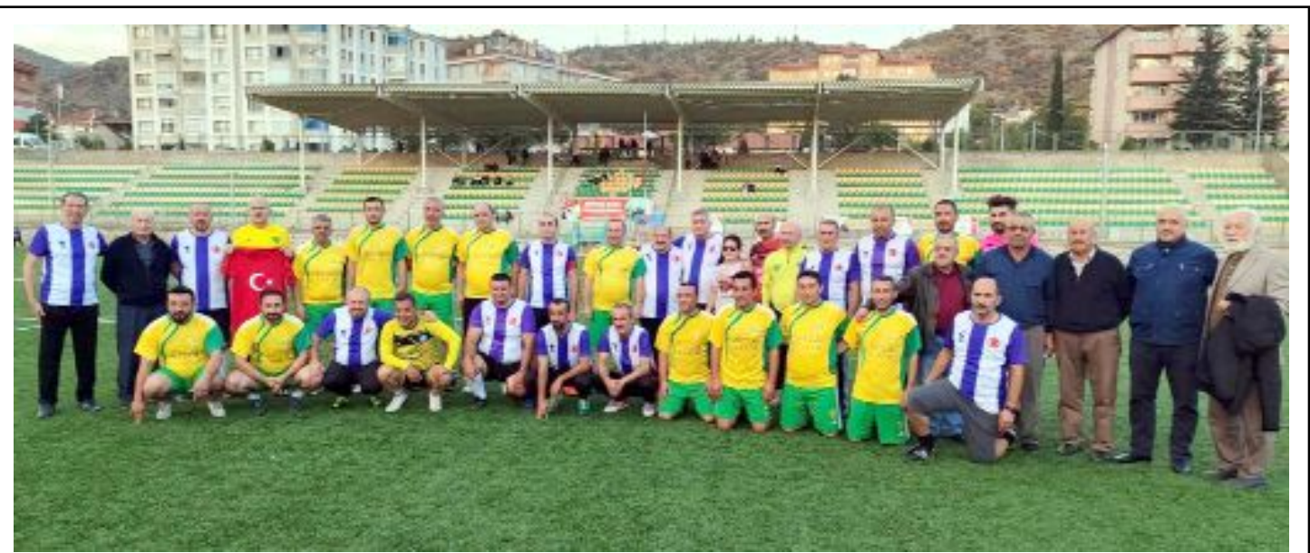
İskilipli şöhretler, maç öncesinde çekilen hatıra fotoğrafında görülüyorlar.

1.Amatör Küme'de diğer haftaların maç programı ise fikstür ve statünün Türkiye Futbol Federasyonu tarafından onaylanmasından sonra açıklanacak. (Hüseyin AŞKIN)