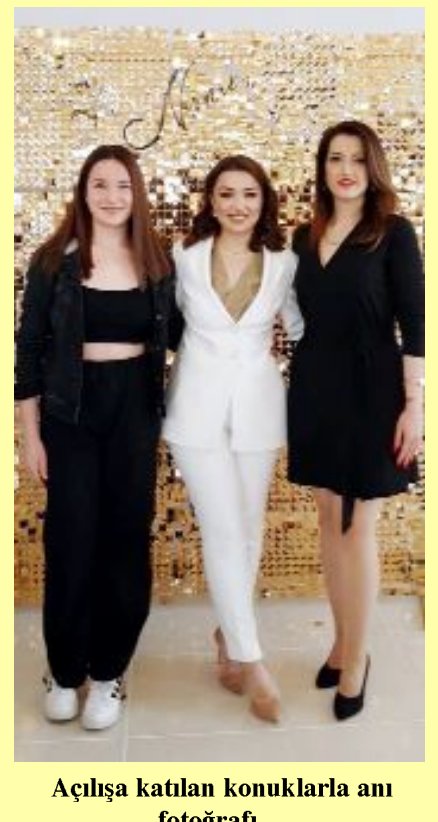
Açılışa katılan konuklarla anı fotoğrafı...