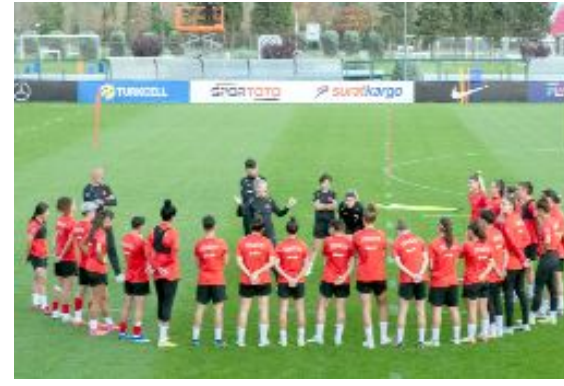
Milliler, Lüksemburg maçları için İstanbul'da toplandı.

31 Ekim Salı günü, saat 19.00'da Çorum Şehir Stadyumu'nda oynanacak maç için geri sayım başlarken, karşılaşma ile ilgili hazırlanan görseller de