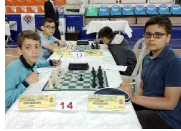
Satrançta, küçükler, yıldızlar ve gençler grup birinciliği 2-6 Nisan tarihlerinde Çorum'da yapılacak.

Tekvandonun dışında, 6 branştaki spor faaliyetlerinin tamamı grup birinciliği. Çorum'un ev sahipliği yapacağı grup birincilikleri ve tarihleri şöyle: Yüzme: Gençler (kız-erkek)12-14 Ocak. Judo: Yıldızlar