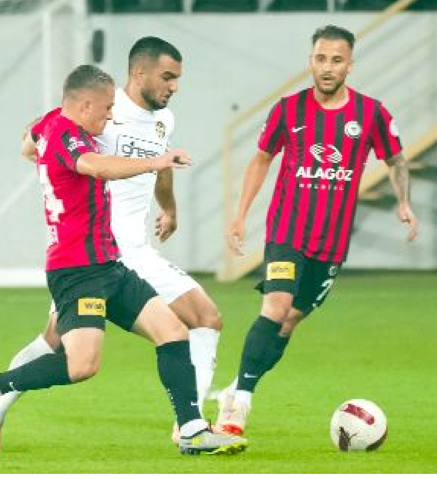
Ahlatcı Çorum FK ile Eyüpspor arasında oynanan ve İstanbul ekibinin 3-2 kazandığı 9.hafta maçından sonra deplasman puan cetvelinin liderliği el değiştirdi.

Milli ara öncesinde, Trendyol Türkiye 1.Futbol Ligi'nin en başarılı deplasman takımı olan Ahlatcı Çorum FK, zirveyi evinde 3-2 yenildiği Eyüpspor'a kapırdı.