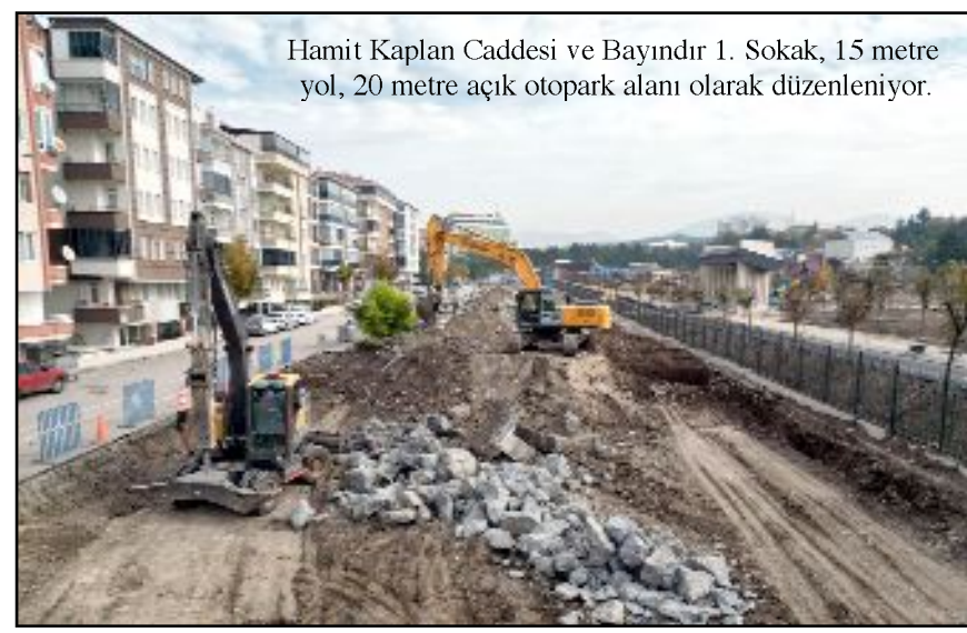
Hamit Kaplan Caddesi ve Bayındır 1. Sokak, 15 metre yol, 20 metre açık otopark alanı olarak düzenleniyor.

Yavaş yavaş gün yüzüne çıkan millet bahçesi projesi Çorum'un yeni cazibe merkezi olacak" ifadelerini kullandı. (Haber Merkezi)