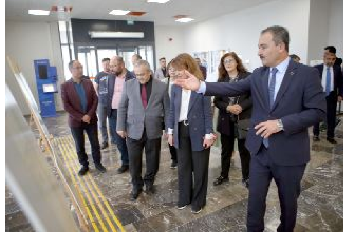
Cumhuriyet'in kuruluş ve gelişim aşamasında alınan önemli kararların belgelerinin yer aldığı, Hitit Üniversitesi Kuzey Kampüsü Sosyal Tesisleri'nde düzenlenen sergi için açılış töreni düzenlendi.

Sergi bir hafta bo- yunca gezilebilecek. (AA)