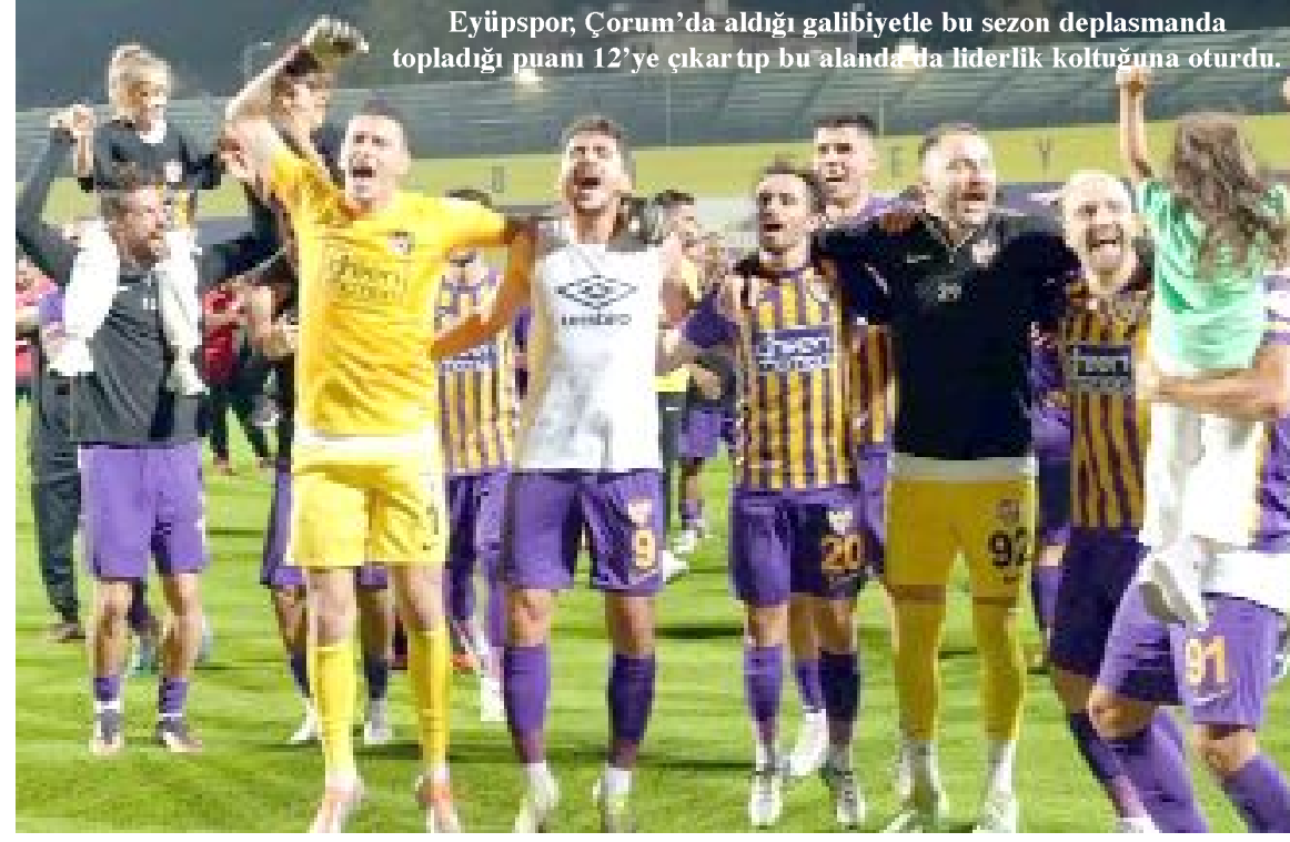
Eyüpspor, Çorum'da aldığı galibiyetle bu sezon deplasmanda topladığı puanı 12'ye çıkarıp bu alanda da liderlik koltuğuna oturdu.