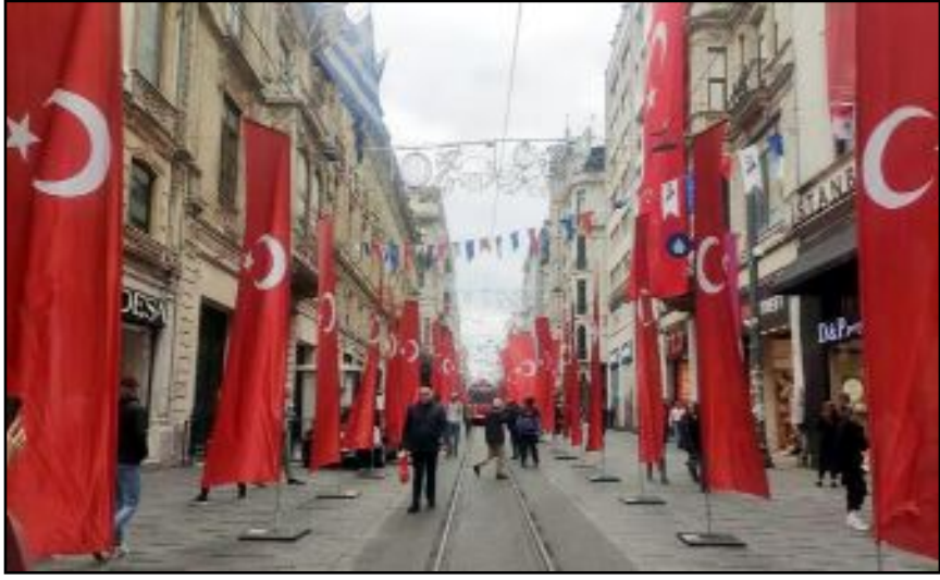
Bedii Onan, Çorum'un tüm cadde ve sokaklarının Türk Bayrakları ile donatılması gerektiğini söyledi.

riyet Bayramı'nın Çorum'da da tüm coşkusıyla kutlanması için tüm cadde ve sokakların bayraklarla donatılması gerektiğini belirten Zafer Partisi İl Başkanı Onan; "Cumhuriyetimizin 100. yılında evimize, işyerimize ve arabamıza Türk Bayrağı asalım. Bayrak bağımsızlığımızın en önemli simgesidir. Cumhuriyet Bayramımızın heyecanına ortak olmak için tüm hemşehrilerimizi balkon ve pencereleri ile araçlarına ay yıldızlı al bayrağımızı asmaya davet ediyoruz. Büyük Önder Atatürk'ü ve de silah arkadaşlarımızı, canından aziz bildiği vatan için kanlarını bu toprağa dökmüş şehitlerimizi rahmet ve minnetle bir kez daha yad ediyor Cumhuriyet Bayramımızı yürekten en kalbi sevgilerimle kutluyorum" diye konuştu. (Volkan SINAYUÇ)