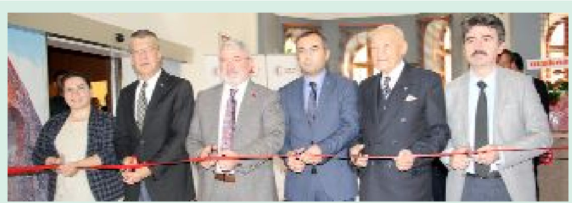
Çorum Müzesi'nde "Çorum Kazılarında Yansımalar" konulu Fotoğraf Sergisi ile Hasan Tuluk'a ait eserlerin yer aldığı "Metallerin Dili İle Anadolu" Metal Sanatları Sergisi görücüye çıktı.