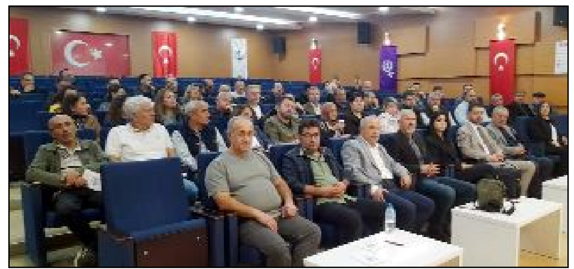
SES Çorum Şubesi Genel Kurulu...