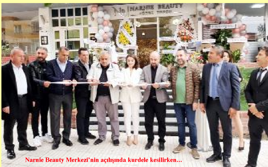
Narnie Beauty Merkezi'nin açılışında kurdele kesilirken...