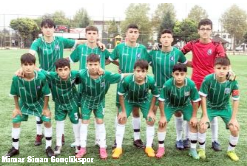
Mimar Sinan Gençlikspor