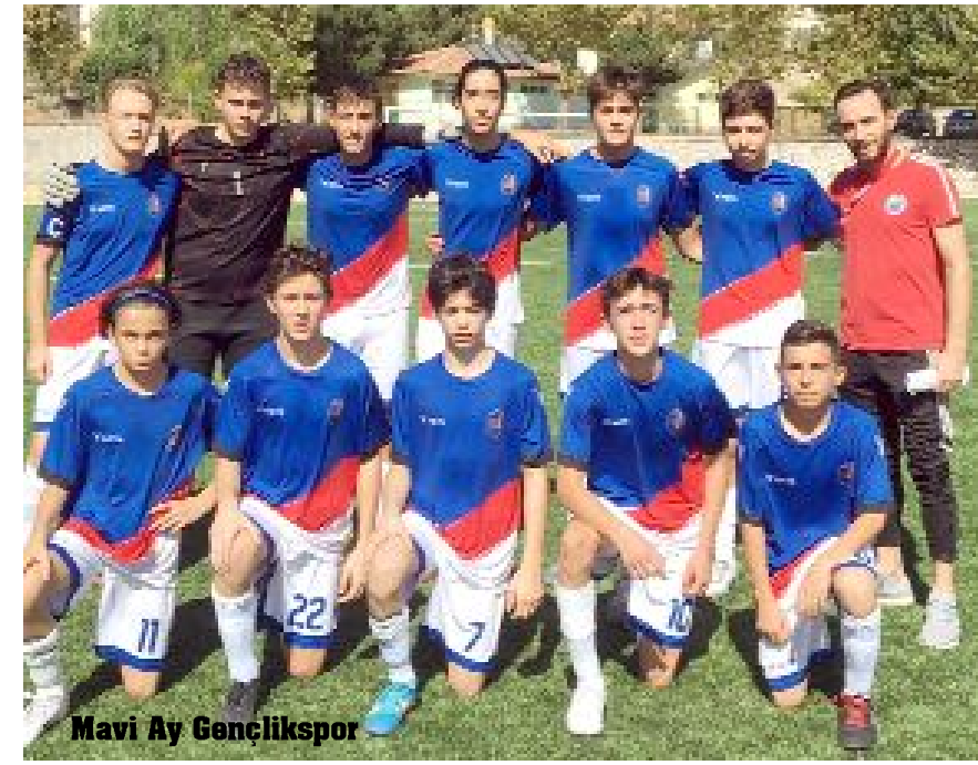
Mavi Ay Gençlikspor

Grup maçlarının tamamlanmasından sonra gözler şampiyonu belirleyecek Play-Off Grubu'na çevrildi. 4 takımın