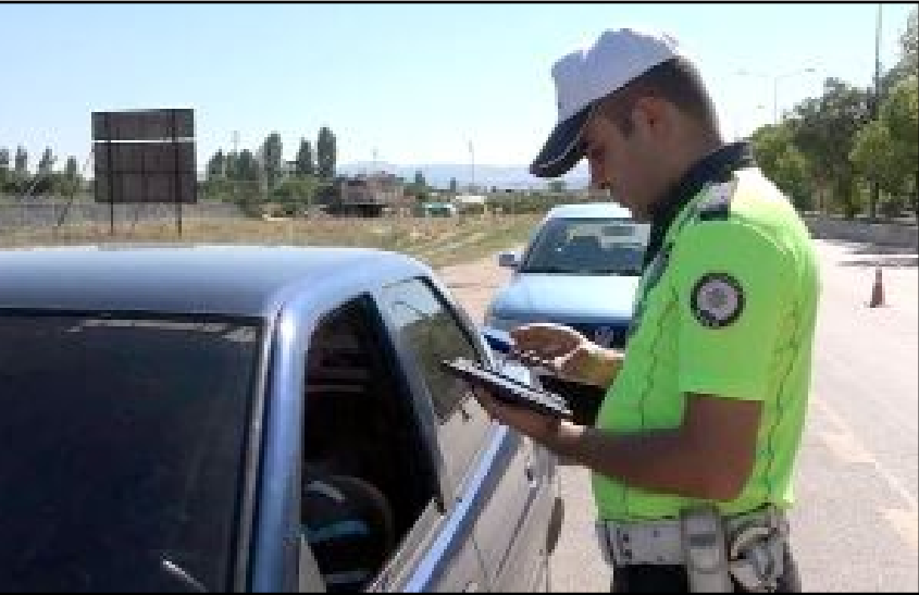
Son bir hafta içerisinde kayıp olduklarına dair müracaatta bulunulan 4 kişi polis ekipleri tarafından bulundu.

Çorum'da çeşitli mahkemelerce yakalama kararı bulunan 31 kişi yakalandı.