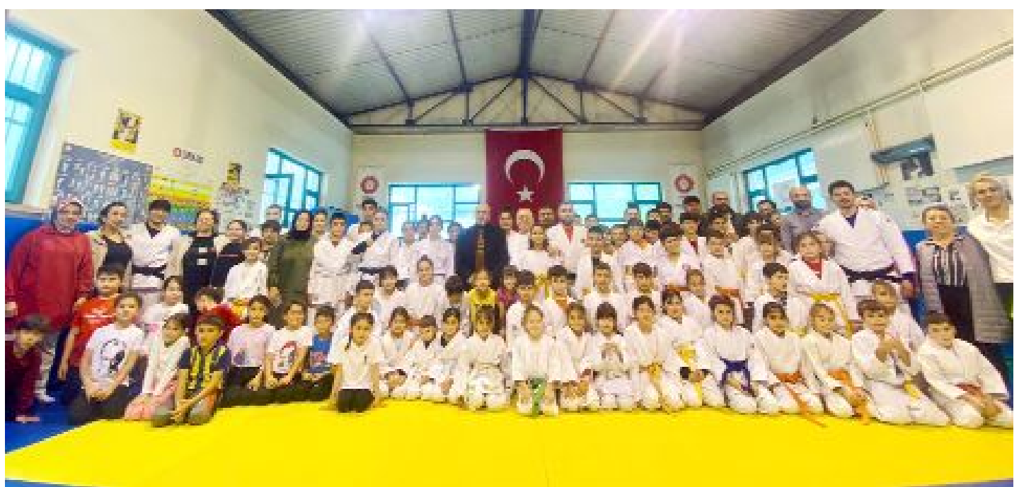
Judo Kuşak Sınavına 100 civarında sporcu katıldı.

Gençlik ve Spor İl Müdürlüğü bünyesinde açılan judo kurslarında eğitim alan 100 kadar sporcu, kuşak terfi sınavından geçti. İl Temsilcisi Hüseyin Üstündağ nezaretinde yapılan sınava katılan tüm judocuların başarılı olup bir üst kuşağa terfi ettikleri belirtildi.