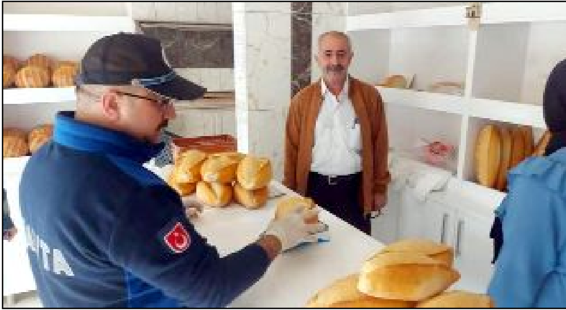
Zabıta ekipleri halkın sağlığını korumak adına hijyen denetimlerine ara vermeden devam ediyor.