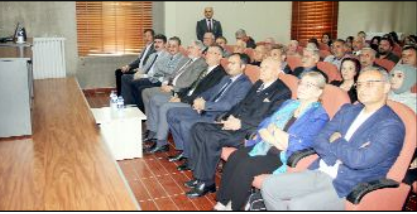
Çorum Müzesi'nde düzenlenen iki ayrı serginin açılışı yapıldı. Cumhuriyetin 100. Yılı kutlama etkinlikleri kapsamında düzenlenen sergiler büyük ilgi gördü.