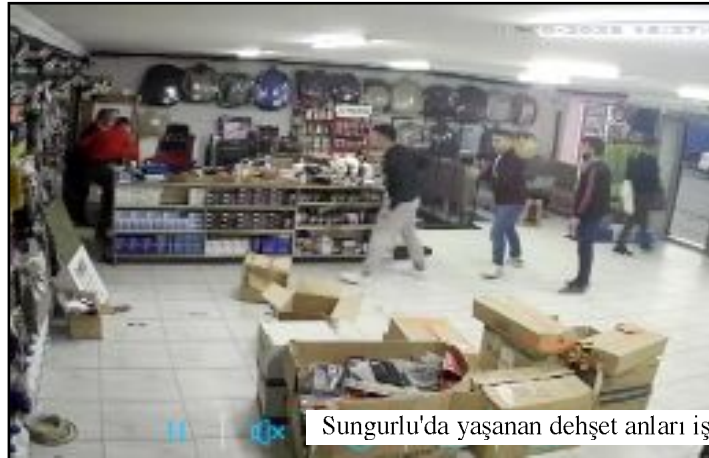
Sungurlu'da yaşanan dehşet anları iş yerinin güvenlik kamerasına da yansdı.

Bu kez de bilimi uzaklaştırıyoruz. Hacı Bektaş Veli'nin: "Bilimden gidilmeyen yolun sonu karanlıktır." uyarısını unutacak mıyız?