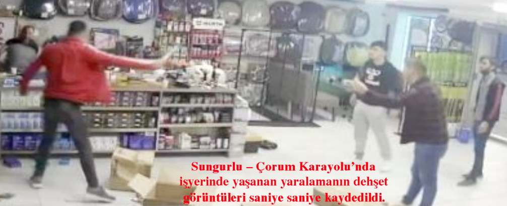
Sungurlu - Çorum Karayolu'nda işyerinde yaşanan yaralamanın dehşet görüntüleri saniye saniye kaydedildi.