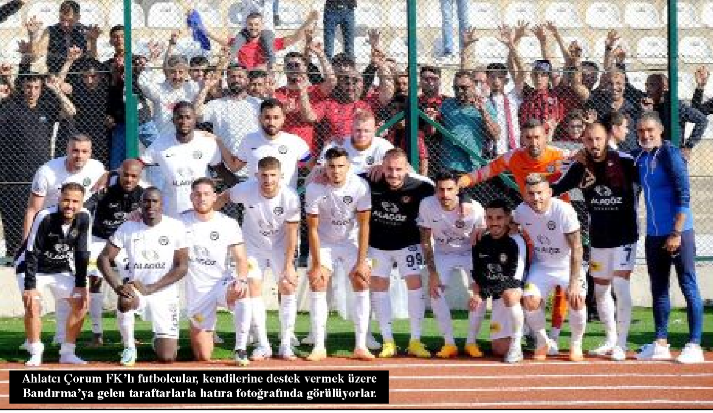
Ahlatcı Çorum FK'lı futbolcular, kendilerine destek vermek üzere Bandırma'ya gelen taraftarlarla hatıra fotoğrafında görülüyorlar.