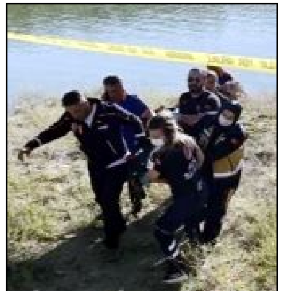
Yaşlı adamın cesedi Evciyeni-akışla'deki göletten çıkarıldı.

Yaşlı adamın cansız bedeni göletten çıkartılarak otopsi işlemleri için morğa kaldırıldı. Olayla ilgili soruşturma başlatıldı. (Tuğay GÖKTÜRK)