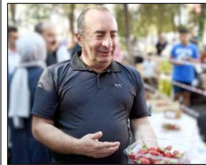
İskilip Belediye Başkanı Sülük, ilçede coğrafi işaret alan ürün sayısının 5'e çıktığını duyurdu.