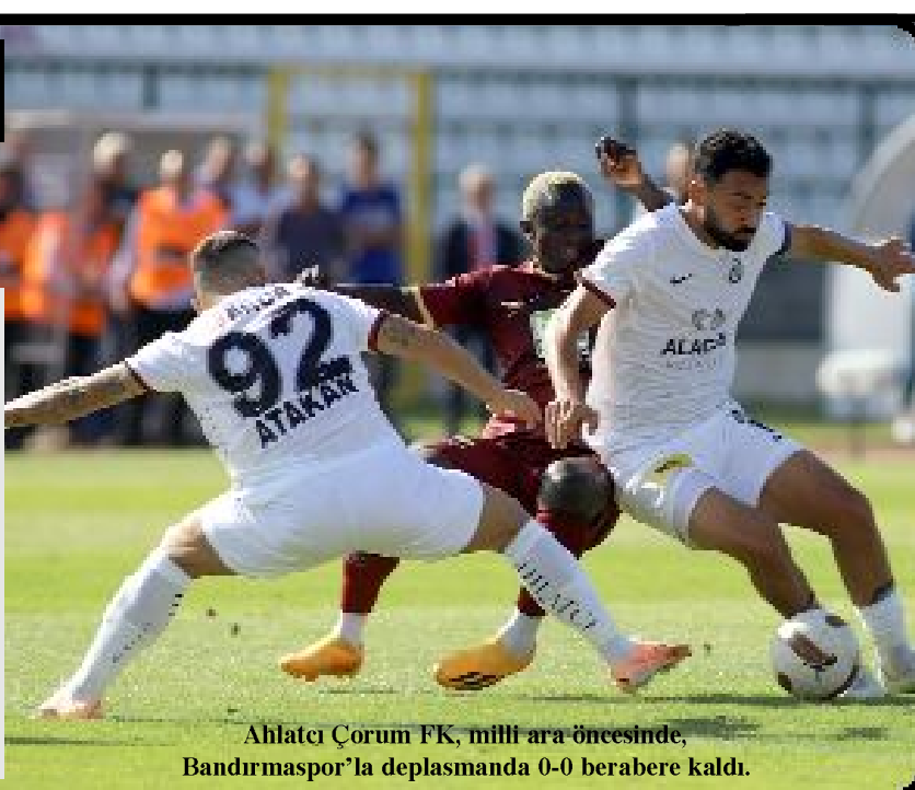
Ahlatcı Çorum FK, milli ara öncesinde, Bandırmaspor'la deplasmanda 0-0 berabere kaldı.

Trendyol Türkiye 1.Futbol Ligi'nde mücadele eden Ahlatcı Çorum FK, milli ara öncesinde, Cumartesi günü Bandırmaspor'la deplasmanda 0-0 berabere kalarak bu sezon ilk deplasman puanını alırken, 1 haftalık milli aranın ardından, 22 Ekim Pazar günü. Lider Eyüpspor'u konuk edecek. (Hüseyin AŞKIN)