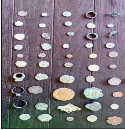
Bayat'ta geç Roma dönemine ait 60 adet sikke ve 1 yüzük ele geçirildi.

Tarihi eserlere el koyan jandarma ekiplerinin şüpheli şahıs hakkında adli işlem başlattığı öğrenildi. (Haber Merkezi)