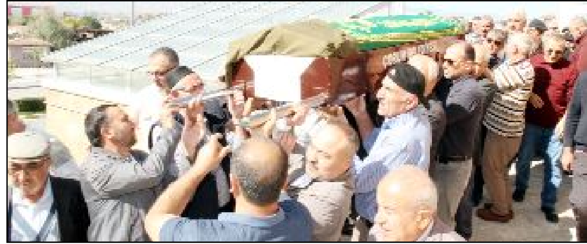
Cenaze, omuzlar üzerinde cenaze arabasına taşınırken...