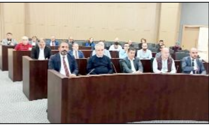
Çorum Belediyesi'nin Ekim Ayı olağan Meclis toplantısı önceki gün gerçekleştirildi.