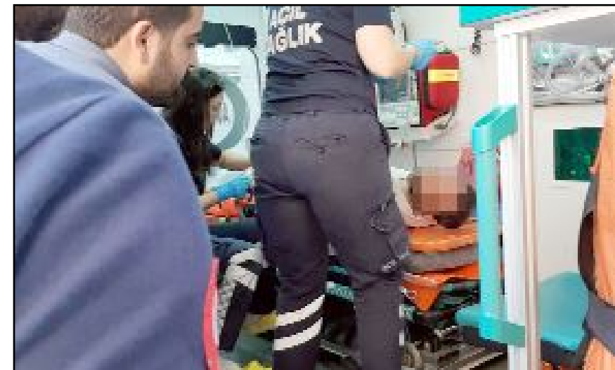
Taliksiz berber hastanede tedavi altına alındı.

Polis silahlı saklı sonrası kaçan şahsın yakalanması için çalışma başlattı. (Tugay GÖKTÜRK)