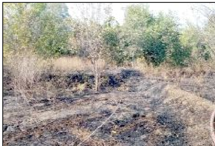
Dodurga Kurbagalık mevkiindeki ceviz bahçesinde çıkan yangın uzun süren uğraşlar sonucu söndürüldü.

Çorum'da çıkan yangında 2 dekar ceviz bahçesi zarar gördü.