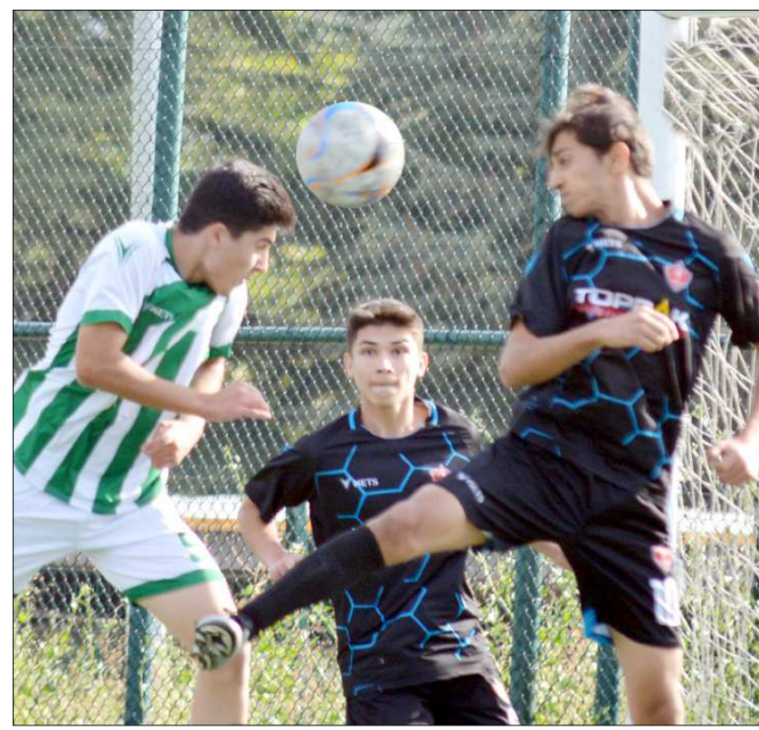
Mimar Sinan Gençlikspor-Osmancıkgücü maçından bir enstantane...