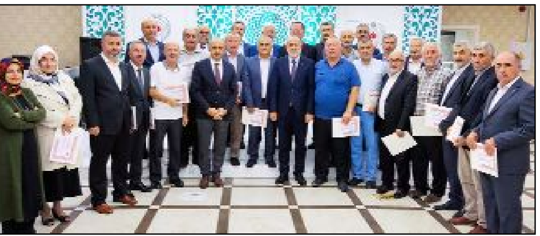
Yemek sonunda emekli olan personel ve hatimle teravih namazı kıldırılan cami görevlilerine belge verildi.