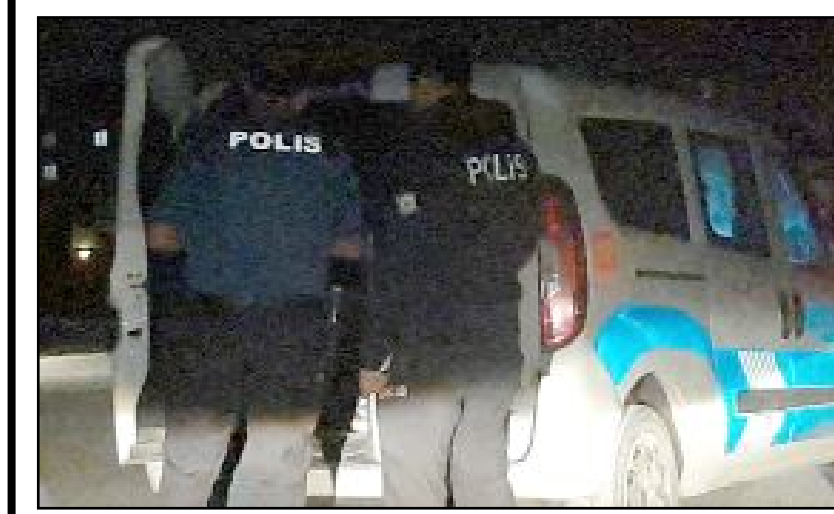
Gece bekçilerinden kaçmaya çalışan kişinin üzerinden ekstazi hap çıktı.