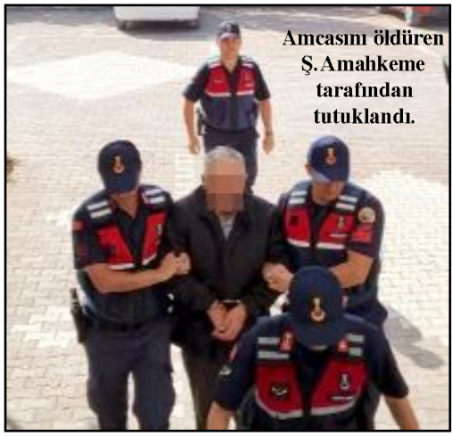
Amcasını öldüren Ş.A. mahkemeden tutuklandı.