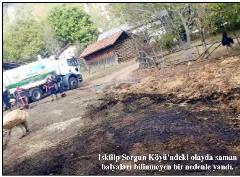
İskilip Sorgun Köyü'ndeki olayda saman balyaları bilinmeyen bir nedenle yandı.