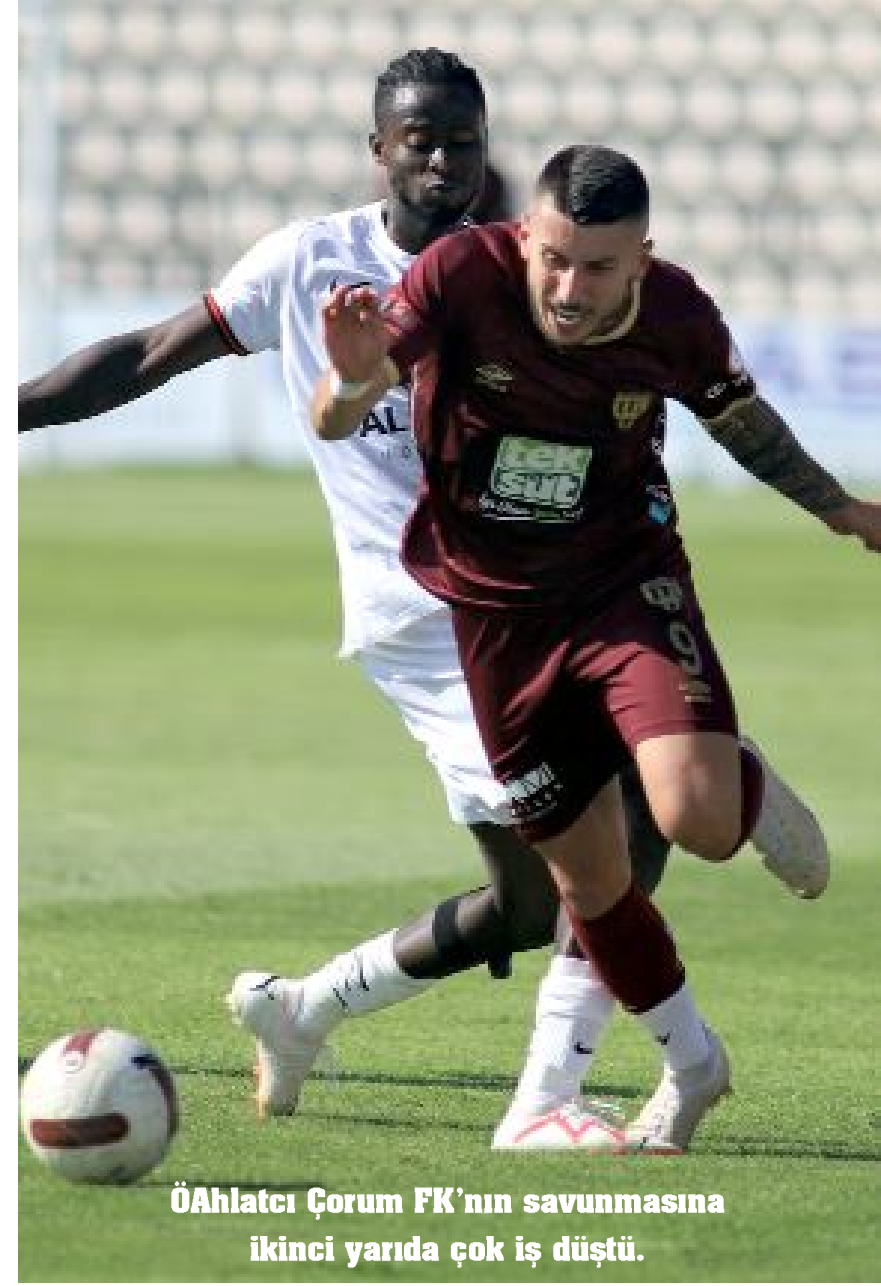
ÖAhlatcı Çorum FK'nın savunmasına ikinci yarıda çok iş düştü.

Balikesir temsilcisi Bandırmaspor'la 0-0 berabere kalan Ahlatcı Çorum FK, bu sezon ilk deplasman puanını aldı.