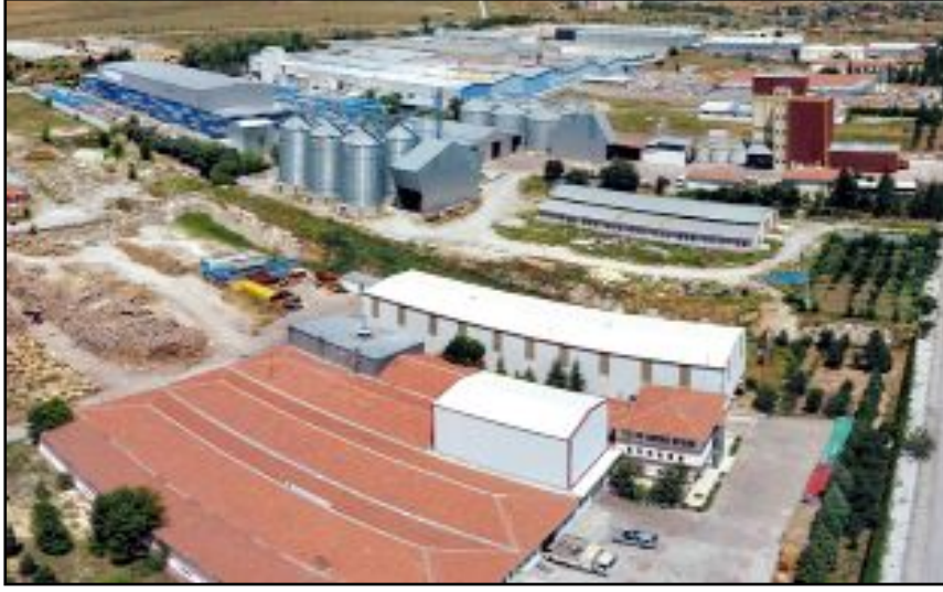
Alaca'ya kurulması planlanan Tarım Dayalı İhtisas Organize Sanayi Bölgesi için girişimler 6 yıldır sürüyor.

Alaca'ya Tarım Dayalı İhtisas Organize Sanayi Bölgesi kurulması için çalışmalar devam ediyor.