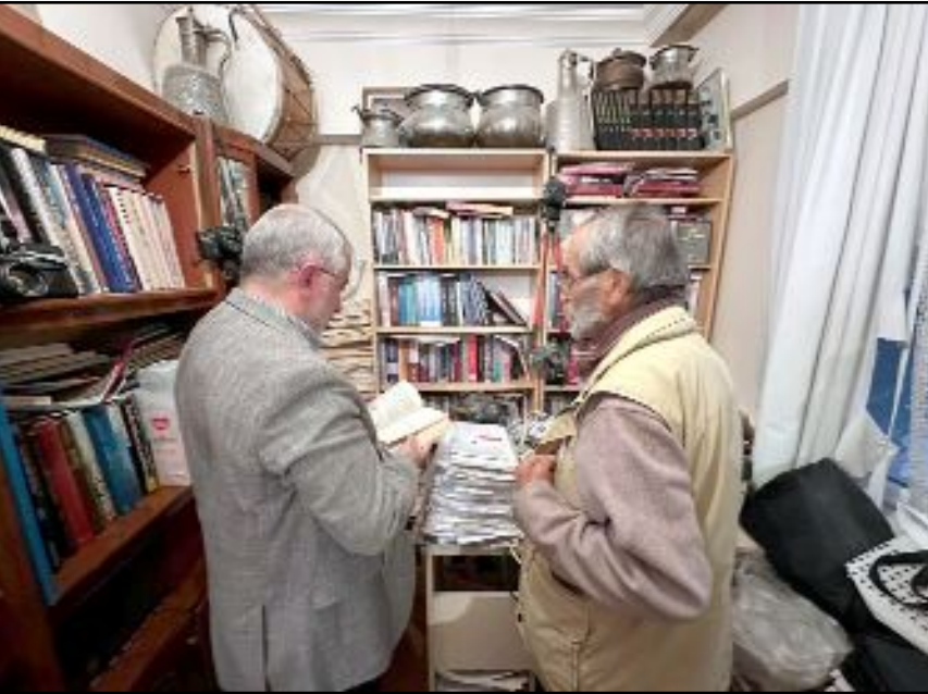
Bakır kaplar ve davul dikkat çekici...