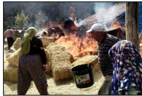
Yangına müdahale edilse de 150 balya saman küle döndü.

mak'a ait 150 balya saman yanarak kül oldu.