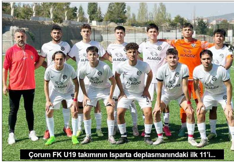
Çorum FK U19 takımının Isparta deplasmanındaki ilk 11'i...

oynanacak olan ilk maçta saat 19.00'da İskilipgücü ile H.E.Kültürspor, saat 21.00'de ise Kargiserispor ile Alaca Belediyespor kozlarını paylaşacak. A grubunda Mimar Sinan Gençlikspor, B grubunda ise Gülabbey Gençlikspor'un ilk haftayı BAY geçecek. (Rifat KARA)