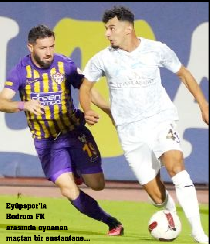
Eyüpspor'la Bodrum FK arasında oynanan maçtan bir enstantane...