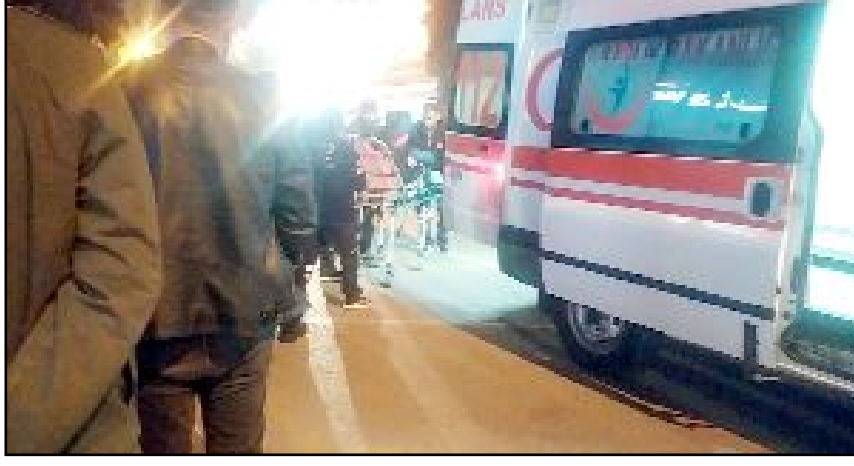
İnönü Caddesi üzerinde iki gencin tartışmasında bir genç bıçaklandı.

Polis ekipleri bıçaklama olayını gerçekleştiren E.B.'nin yakalanması için çalışma başlattı. (İHA)