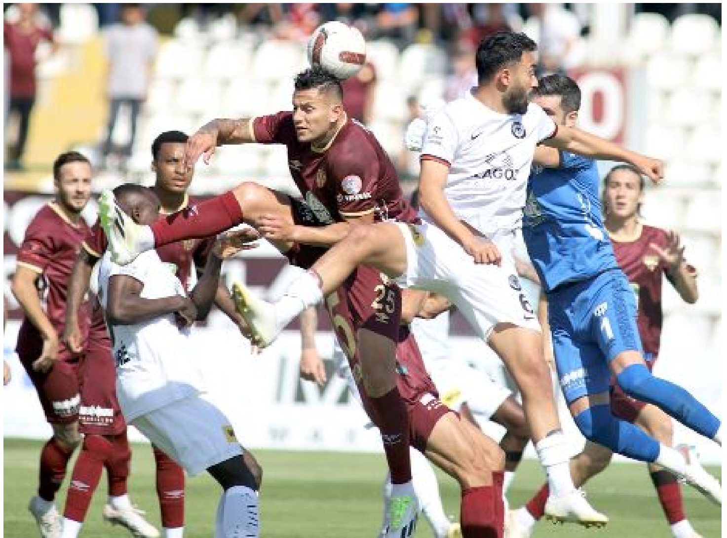
Ahlatcı Çorum FK, zorlu Bandırma deplasmanında altın değerinde 1 puanla dönerken, özellikle ilk yarıda sergilediği futbola göz doldurdu.