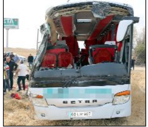
Kaza geçtiğimiz günlerde Merzifon OSB yakınlarında yaşanmıştı.

talık (22) ve Hilal Çelebi (18) ile Durmuş Uysal (45) ve Uğur Karadayı (51) yaşamını yitirmiş, 35 kişi yaralanmıştı. (AA)