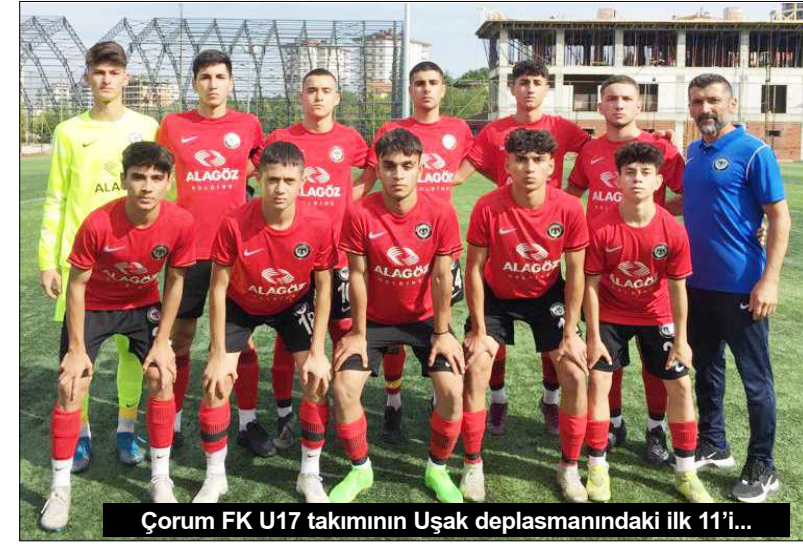
Çorum FK U17 takımının Uşak deplasmanındaki ilk 11'i...