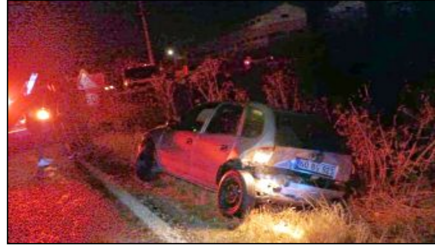
İki aracın çarpıştığı kazada yaralanan 4 kişi hastaneye kaldırılarak tedavi altına alındı.