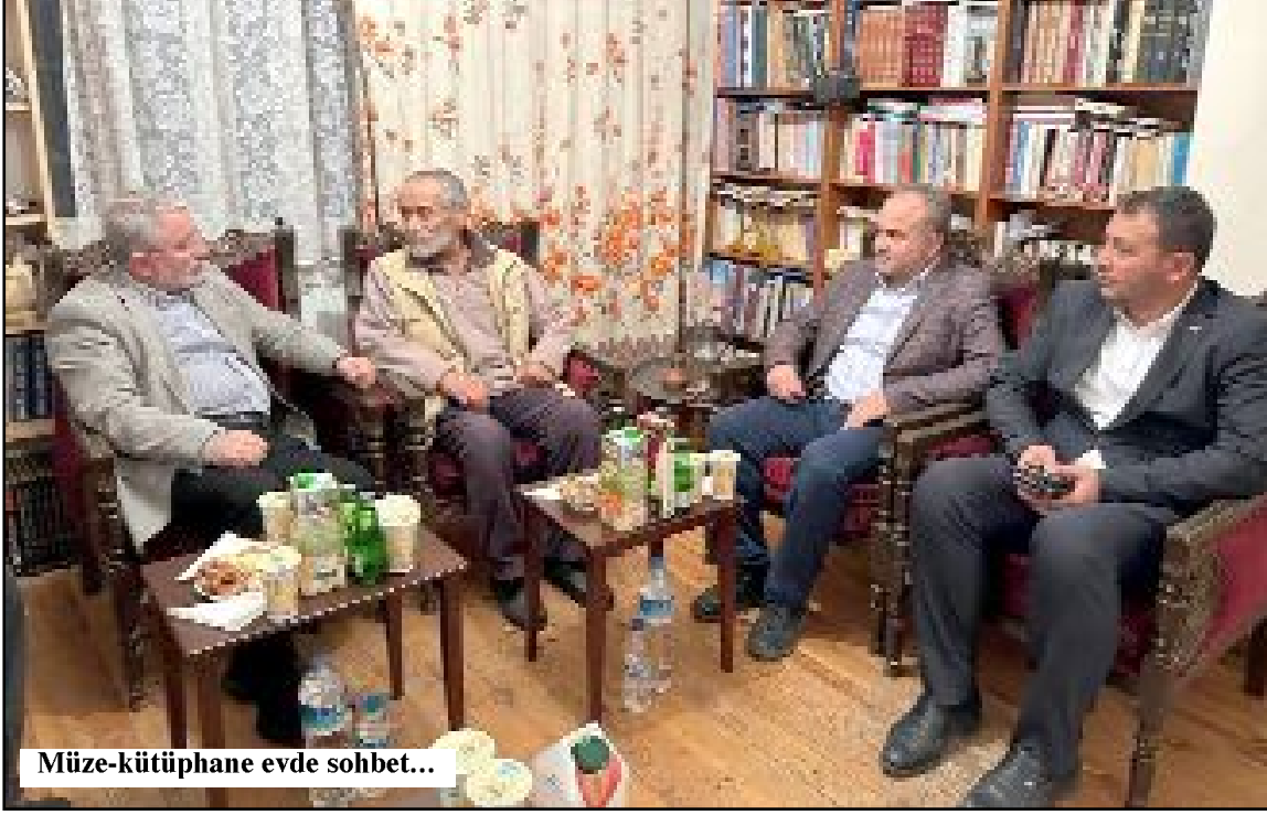
Müze-kütüphane evde sohbet...