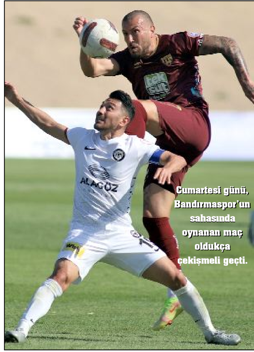
Cumartesi günü, Bandırmaspor'un sahasında oynanan maç oldukça çekişmeli geçti.

Ahlatcı Çorum FK, 7 Mayıs 2023'te, Menemen FK ile deplasmanda 1-1 berabere kaldığı geçen sezonun 36. hafta maçından sonra ilk beraberliğini önceki gün Bandırmaspor'a karşı aldı. (Hüseyin AŞKIN)