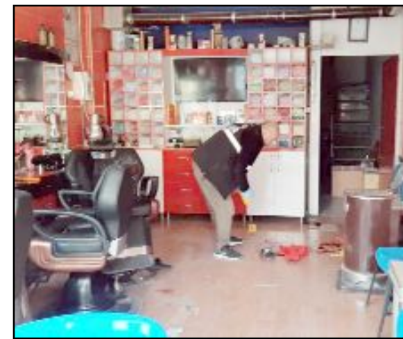
Kubbeli 2. Sokak'da yaşanan olayda bir berber Bilal A. tabanca ile vuruldu.

Alaca ilçesine bağlı Tutaş köyü Taş Köprü mevkinde dün Ş.A. arazi konusunda anlaşmazlık yaşadığı amcası A.A.'yı tabancayla öldürdükten sonra 112 Acil Çağrı Merkezine ihbarda bulunmuş, gelen jandarma ekibine teslim olmuştu. (AA)