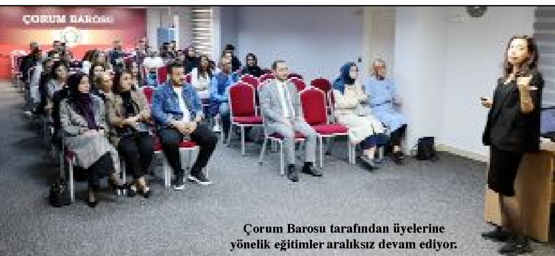
Çorum Barosu tarafından üyelerine yönelik eğitimler aralıksız devam ediyor.