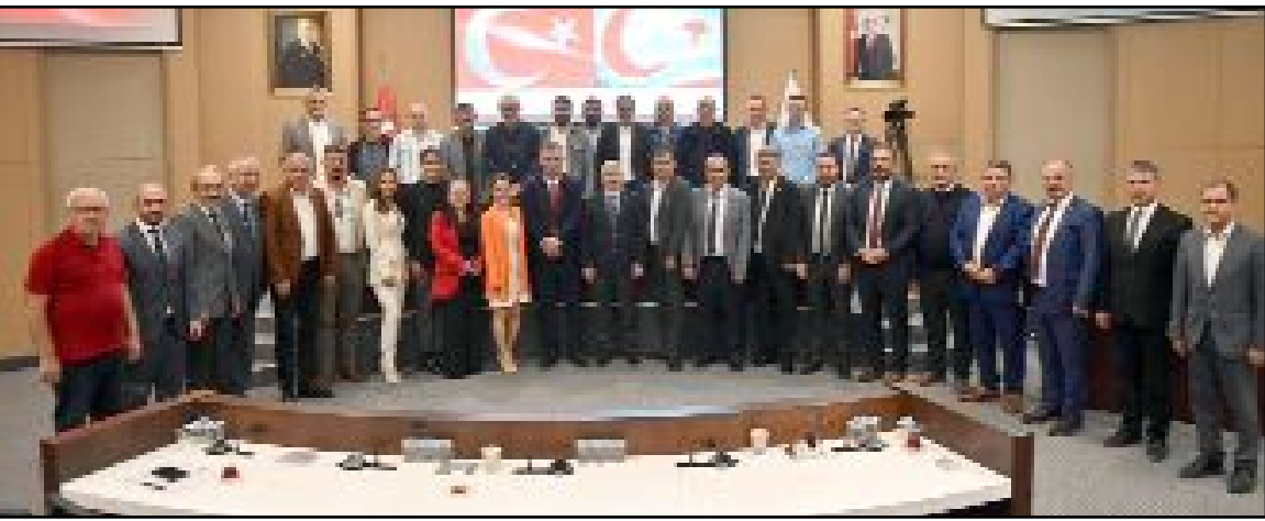
Belediye Meclis üyeleri ile KKTC heyeti toplu halde hatıra fotoğrafı çekindi.

Belediye Meclisi toplantısında da bazı imar maddelerinin dışında trampa yapılması, boş kadro ihdası, Dodurga Belediyesi ile Ortak Hizmet Projesi de karara bağlandı. (Nurdan AKBAŞ)