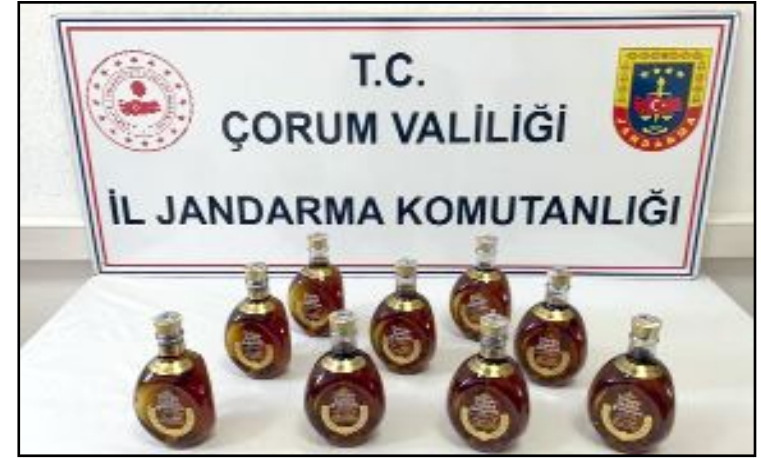
Emniyet Müdürlüğü ekipleri 85 şişe gümrük kaçağı içkiye el koydu.

yeri sahibi hakkında Türk Ceza Kanununun 6136, 5607 ve 241 maddeleri çerçevesinde adli işlem başlatıldı. Ayrıca halkın huzur ve güvenliği için kaçak/sahte içki ile mücadelenin aralıksız devam edeceği belirtildi. (Haber Merkezi)