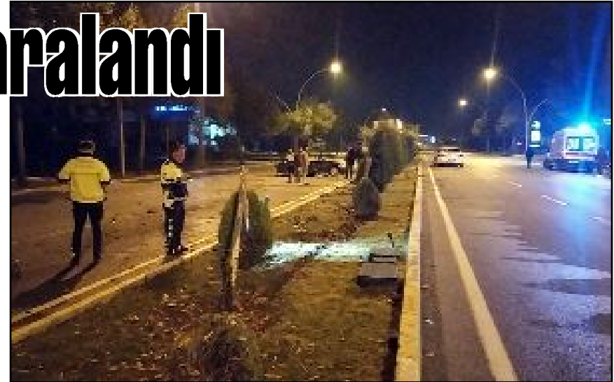
İnönü Caddesi üzerindeki tek taraflı kazada yaralanan 3 kişi hastaneye kaldırılarak tedavi altına alındı.