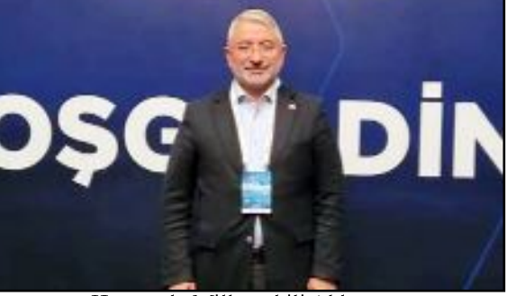
Kongrede Milletvekili Ahlatcı ve Belediye Başkanı Aşgın da hazır bulundu.

Cumhurbaşkanı ve AK Parti Genel Başkanı Recep Tayyip Erdoğan'ın katılımıyla yapılan Adalet ve Kalkınma Partisi'nin 4. Olağanüstü Büyük Kongresi sürüyor.