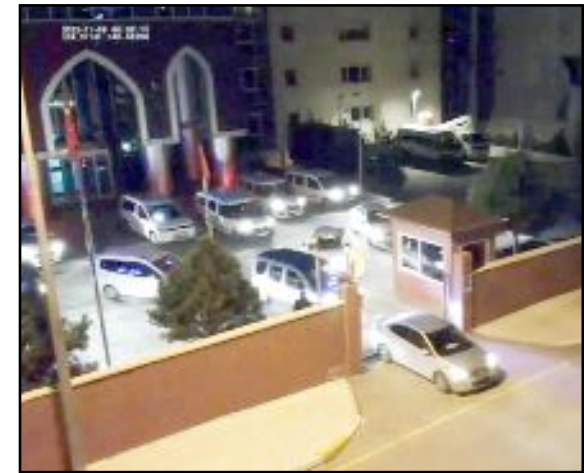
Emniyet Müdürlüğü ekipleri operasyonun başlangıcından itibaren çekim yaptı.

Çorum'da polis ekipleri tarafından terör örgütü DEAŞ'a yönelik düzenlenen operasyonda 6 kişi gözaltına alındı.