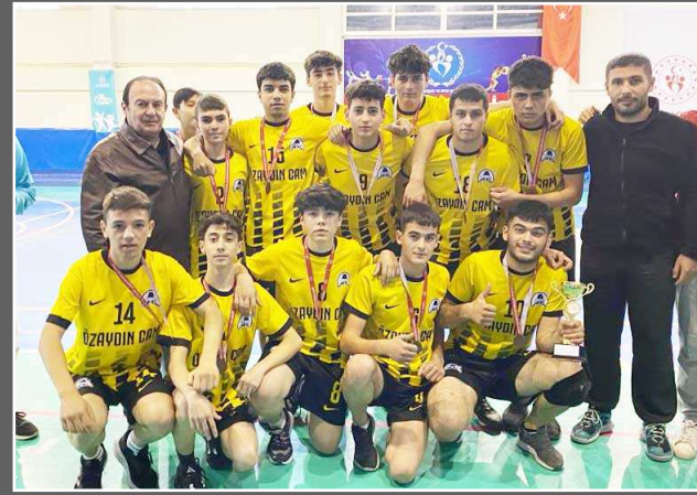
Bahçelievler Anadolu Lisesi üçüncülük kupasını kazandı.

Okullararası Genç Erkekler Hentbol İl Birinciliği'nde üçüncülük kupası Bahçelievler Anadolu Lisesi'nin oldu. Şehit Emin Güner MTAL ile Şehit Mustafa Solak AIHL arasında oynanan final maçı öncesi Bahçelievler Anadolu Lisesi ile Özel TED Koleji üçüncülük maçında kozlarını paylaştı. Tefvik Kış Spor Salonu'nda oynanan karşılaşmanın ilk yarısı berabere tamamlandı. İkinci yarının sonlarına doğru Arda ile üst üste goller bulan Bahçelievler Anadolu Lisesi maçı 30-26 kazanarak üçüncülük kupasının sahibi oldu. Özel TED Koleji ise il birinciliğini dördüncü sırada tamamladı. (Rifat KARA)