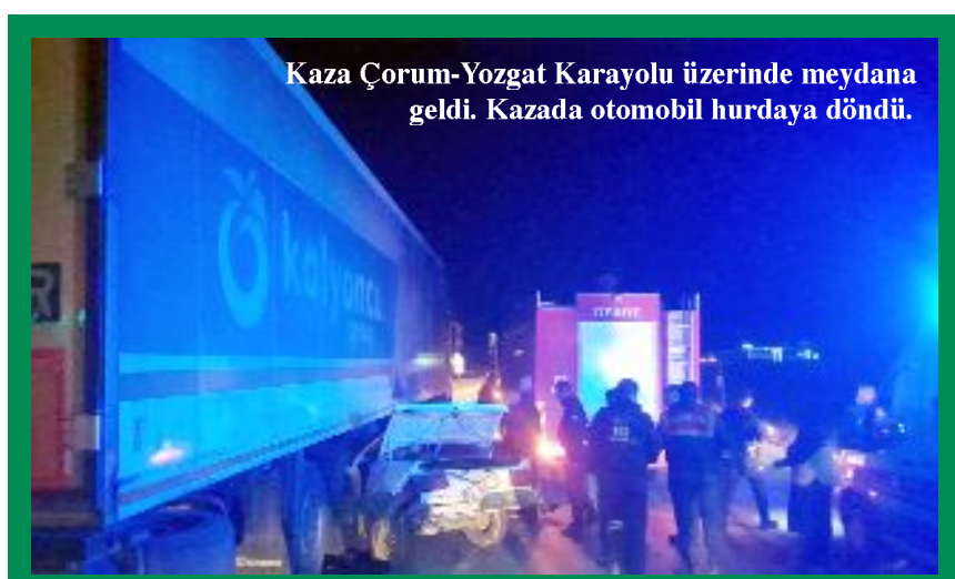
Kaza Çorum-Yozgat Karayolu üzerinde meydana geldi. Kazada otomobil hurdaya döndü.