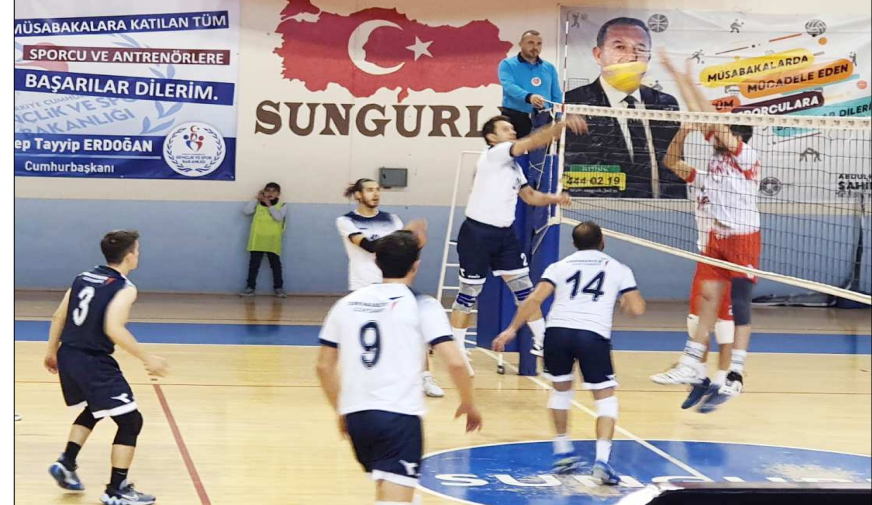
Mahmut Atalay Spor Salonu'nda oynanan maçıtan bir enstantane...

dan yeniden 3 puanı hanesine yazdırdı. Bu sonucun ardından Sungurlu temsilcisi puanını 8'e yükseltirken, konuk TUSAŞ ise 6 puanda kaldı. (Rifat KARA)