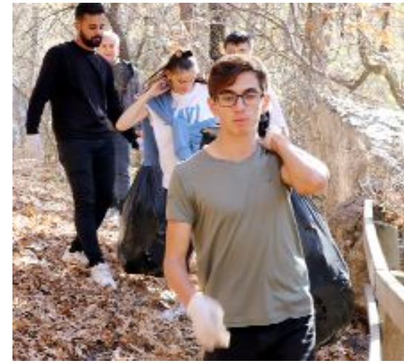
Üniversiteli gençler Hitit Yolu'ndaki doğa yürüyüşünün ardından topladıkları çöpleri Boğazkale Belediyesi'ne teslim etti.

Hitit Üniversitesi Sosyal Bilimler Meslek Yüksekokulu Turizm ve Otel İşletmeciliği Bölümü öğrencileri, Hitit Yolu'nda yürüyüş ve çevre temizliği yaptı.