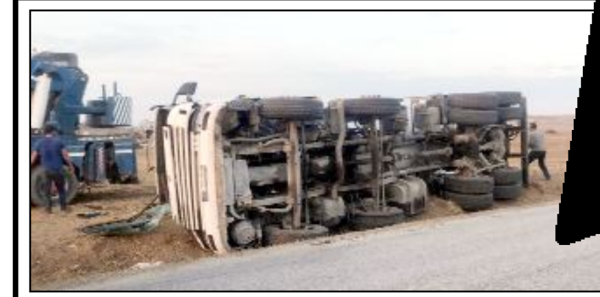
Çorum-Ortaköy yolundaki kazada bir kişi yaralanarak hastaneye kaldırıldı.