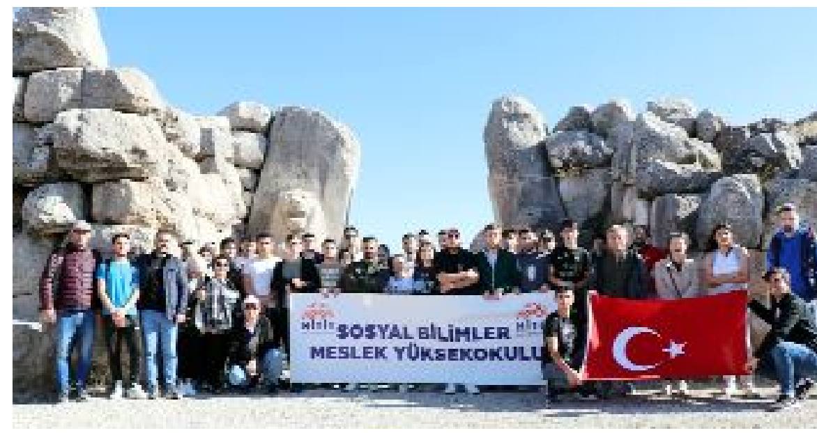
Turizm ve Otel İşletmeciliği Bölümü öğrencileri hem tarihi yerleri gezdi hem de temizlik yaptı.