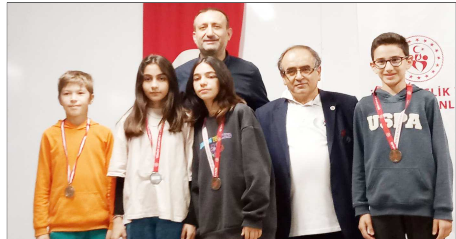
Dereceye giren sporcular madalya ile ödüllendirildi.

Dereceye giren sporcular madalya ile ödüllendirildi. (Hüseyin AŞKIN)