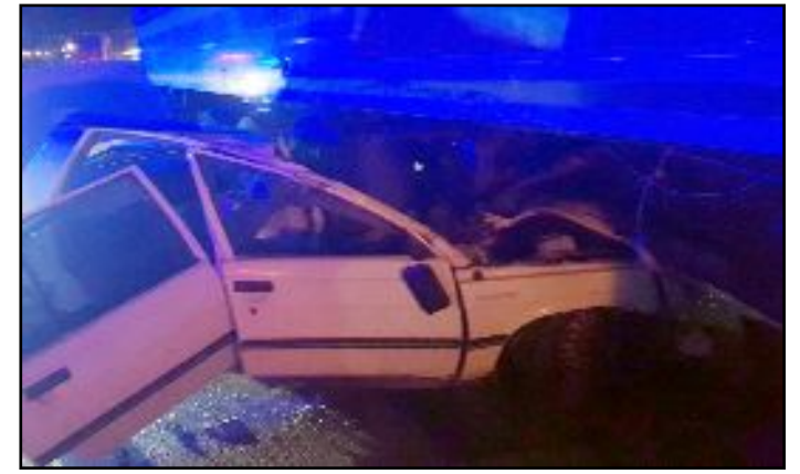
Alaca Yozgat Karayolu üzerinde yaşanan kazada bir kişi hayatını kaybetti. Yol bir süre araç trafiğine kapandı.