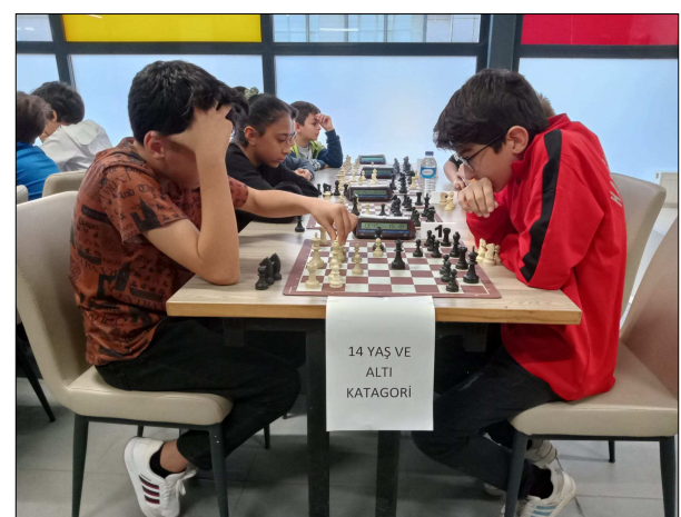
14 YAŞ VE ALTI KATEGORİ