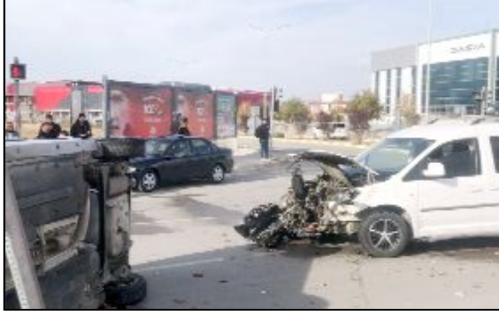
İnönü Caddesi üzerinde bir otomobil ile hafif ticari araç çarpıştı. Kazada yaralanan iki kişi hastaneye kaldırıldı.