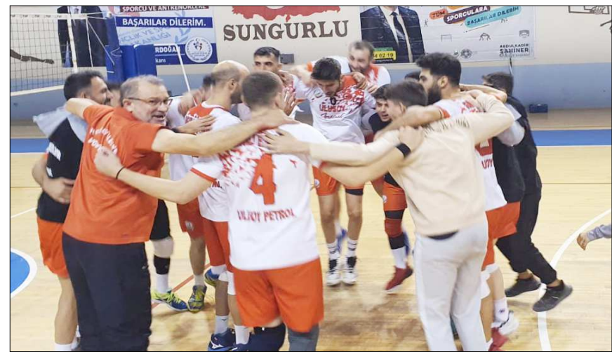
Efeler maçın ardından büyük sevinç yaşadı.