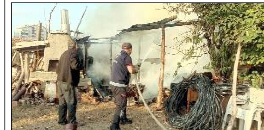
Sungurlu Hacettepe Mahallesi'ndeki ev yangını sonucu kullanılmaz hale geldi.