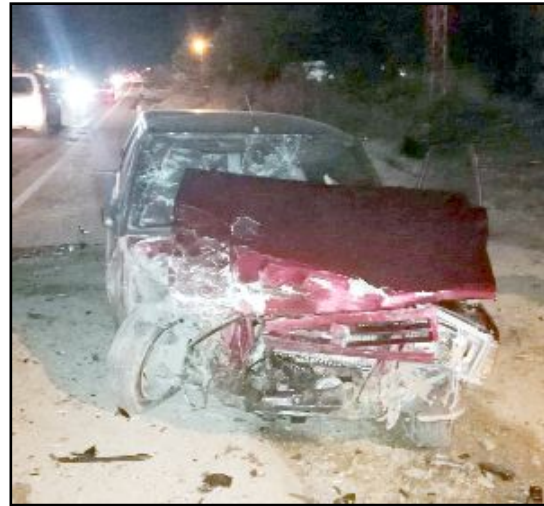
Çorum yolunda iki otomobilin çarpıştığı kazada yaralanan 5 kişi hastaneye kaldırılırken, araçlarda hasar oluştu.