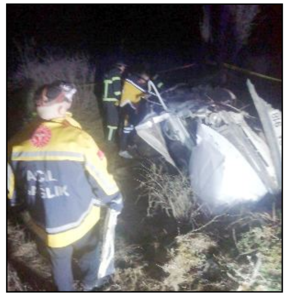
Kaza Cuma gecesi Burdur Gölhisar'da yaşandı.

nur KUM'dim bir kaza nedeni ile hayatını kaybetmiştir. Aramızdan erken ayrılışının derin üzüntüsünü yaşadığımız değerli öğrencimizle Allah'tan rahmet, ailesi ve yakınlarına başsağlığı dileriz" görüşünü dile getirdi. (İHA)