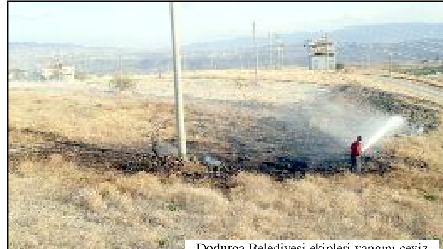
Dodurga Belediyesi ekipleri yangını ceviz bahçelerine sıçramadan söndürmeyi başardı.