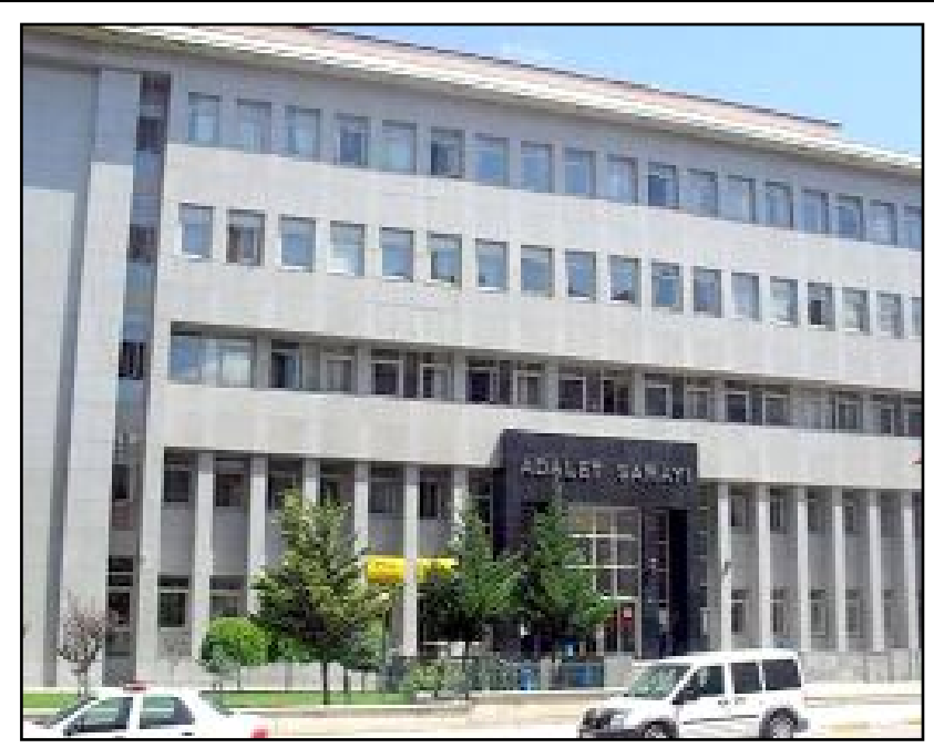
Çorum Adalet Sarayı yanına ek bina yapılması için harekete geçildi.