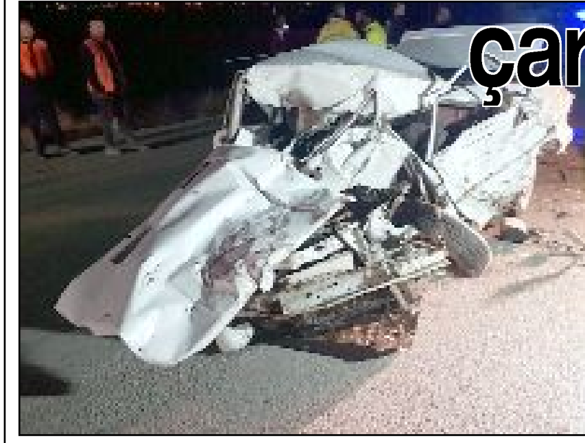
Kaza sonucu TIR'ın altına giren otomobil hurdaya döndü.

Çorum'un Alaca ilçesinde tır ile otomobilin çarpışması sonucu meydana gelen trafik kazasında 1 kişi hayatını kaybetti.