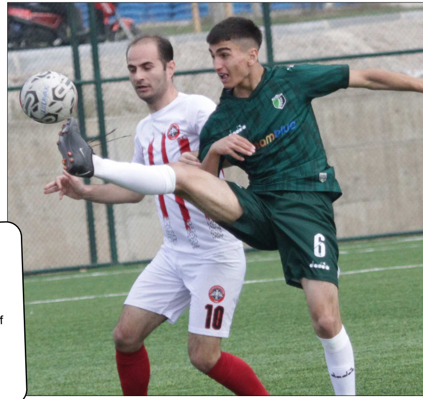
Ulukavakspor-Mimar Sinan maçından bir enstantane...

Şampiyonluğun iki güçlü adayının karşı karşıya geldiği maçta gülen taraf 1-0'lık skorla Mimar Sinan Gençlikspor oldu.