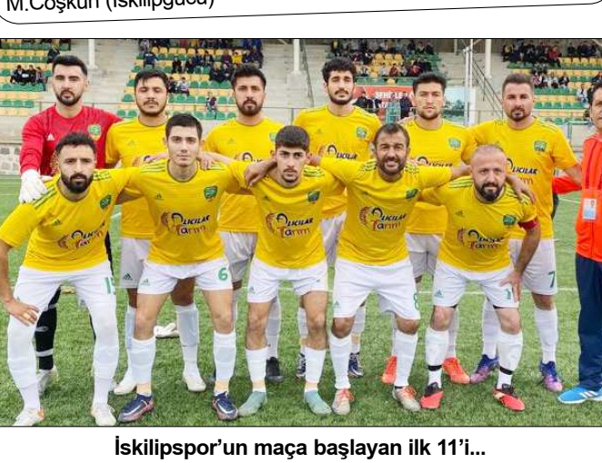
İskilipspor'un maça başlayan ilk 11'i...