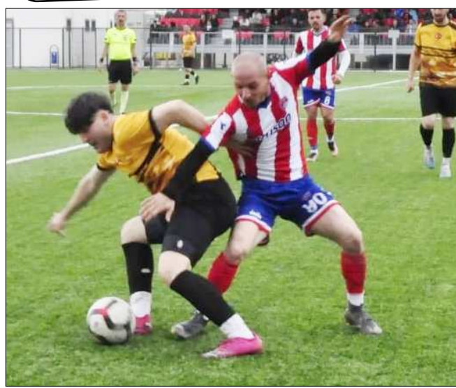
Gülabibey-Kargiseri maçından bir enstantane...