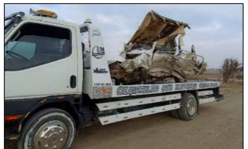
Çorumlu genç kızın hayatını kaybettiği kazada araç sürücüsü de hastanede tedavi altına alındı.