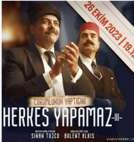
"Herkes Yapamaz - 3" filmi Ankara'da Birinci Meclis'te çekildi.

Filmin bütçesine dair detayları açıklayan Arslan, "Derneğimizin