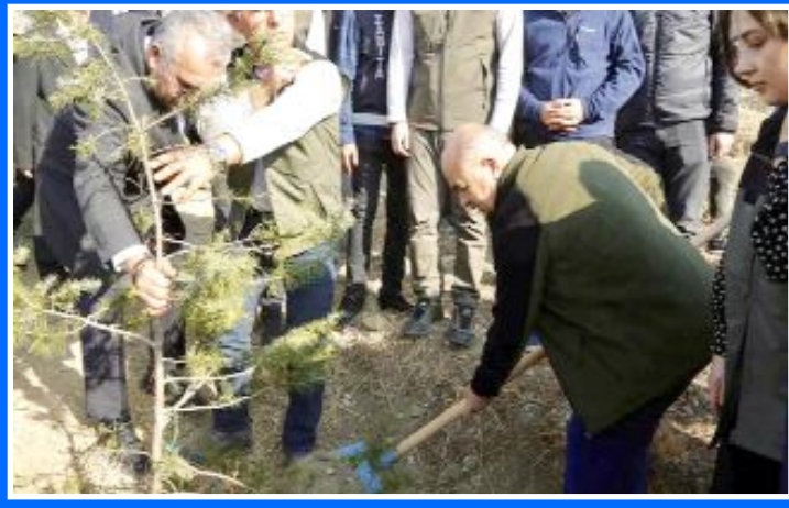
Çorum Valisi Zülkif Dağlı, Bayat'ta kendi adını taşıyan hatıra ormanında fidan dikimine katıldı.