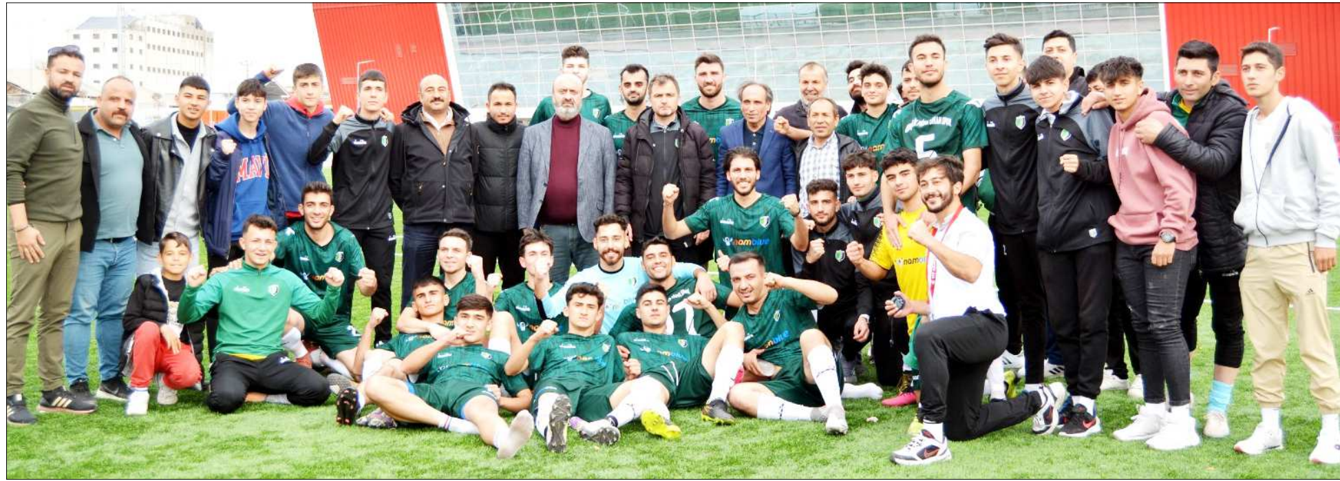
Maç sonunda Mimar Sinan Gençlikspor'lu futbolcular, teknik heyet ve yönetim galibiyeti bu fotoğraf ile kutladı.