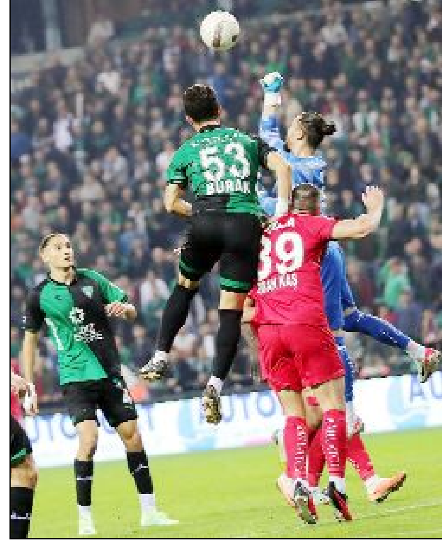
Trendyol Türkiye 1.Futbol Ligi'nde 12.haftanın kapanış maçı Kocaelispor'la Ahlatcı Çorum FK arasında oynandı.