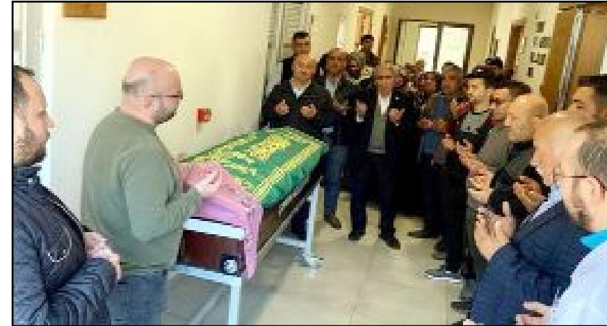
Evinde kalp krizi geçirerek vefat eden merhumenin cenazesi Akşemseddin Camisi'nde kılınan cenaze namazının ardından Hıdırlık Mezarlığı'nda ailesi ve sevenleri tarafından toprağa verildi.