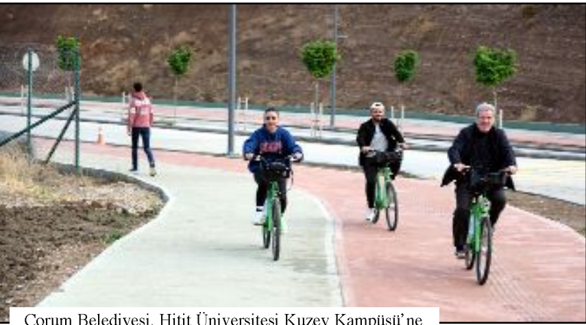
Çorum Belediyesi, Hitit Üniversitesi Kuzey Kampüsü'ne açtığı ÇORBİS İstasyonu ile istasyon sayısını 13'e çıkardı.