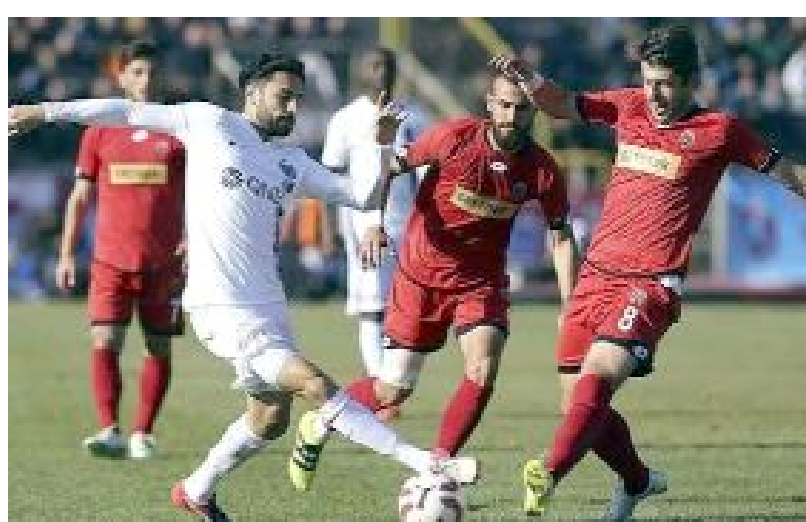
Ahlataci Çorum FK, Trabzonspor'la daha önce Türkiye Kupası'nda iki kez karşılaştı.