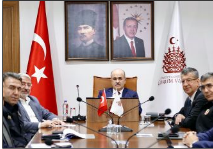
Vali Dağlı 3 aylık asayiş çalışmalarını değerlendirdi.

belirten Vali Dağlı, çocukların, gençlerin ve vatandaşların aileleri ile birlikte huzur ve güven içerisinde gelebilecekleri, yaşayabilecekleri bir Çorum oluşturma hedefinde olduklarını ifade etti. (Haber Merkezi)