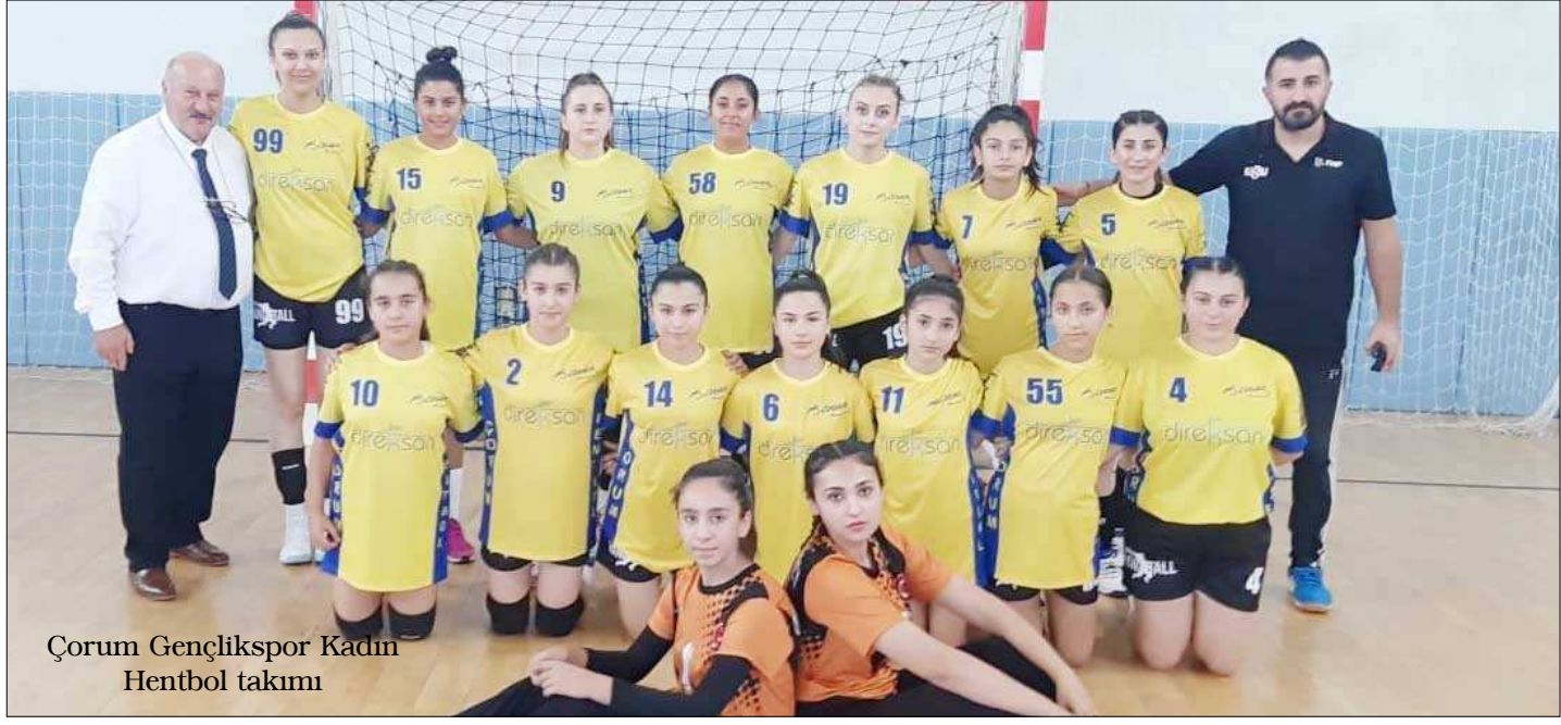
Çorum Gençlikspor Kadın Hentbol takımı