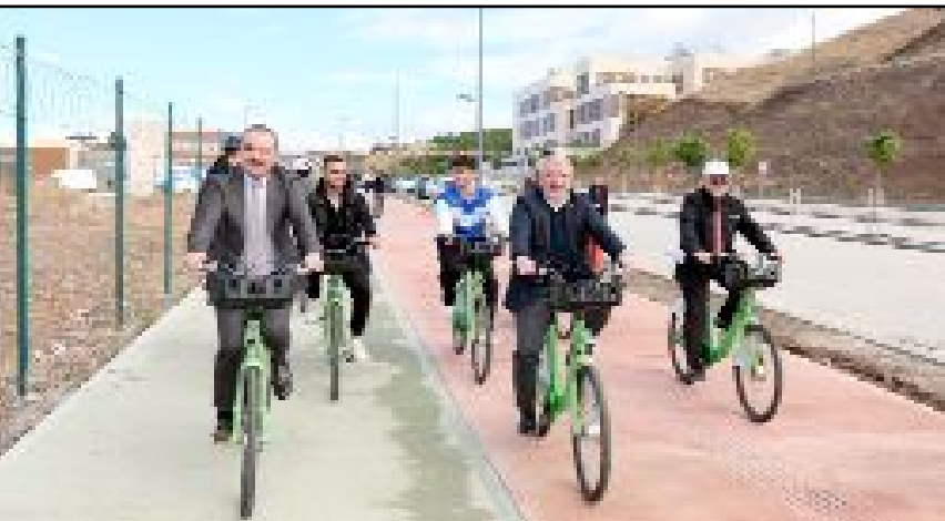
Çorum Belediyesi, Hitit Üniversitesi Kuzey Kampüsü'ne açtığı ÇORBİS istasyonu ile istasyon sayısını 13'e çıkardı.