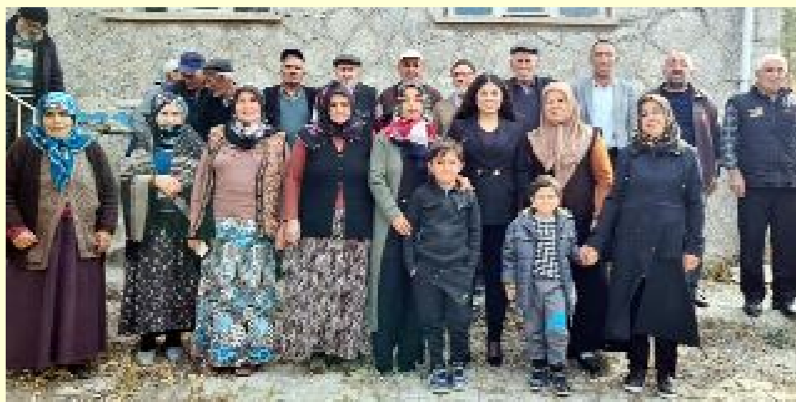
Boğazkale Kaymakamı Emine Karataş Yıldız, ilçeye bağlı köylerde incelemelerde bulundu.

Yıldız, ziyaretlerde bir araya geldiği vatandaşlarla sohbet etti. (AA)