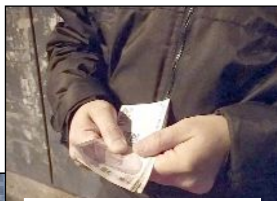
Çarşı mahalle bekçileri devriye attıkları sırada buldukları paranın sahibini arıyor.

Mahalle bekçileri Milönü Kavşağı yakınlarında buldukları paranın sahibini bulup teslim etmek için çalışmalarını sürdürüyor.