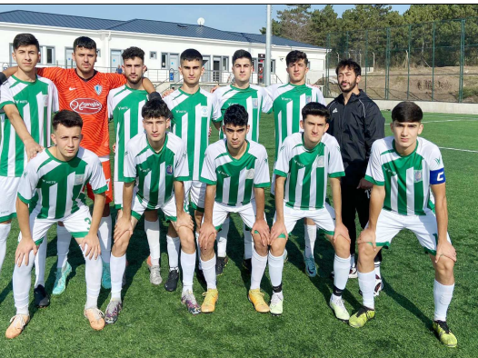
İkide iki yapan Mimar Sinan liderlik koltuğuna oturdu.