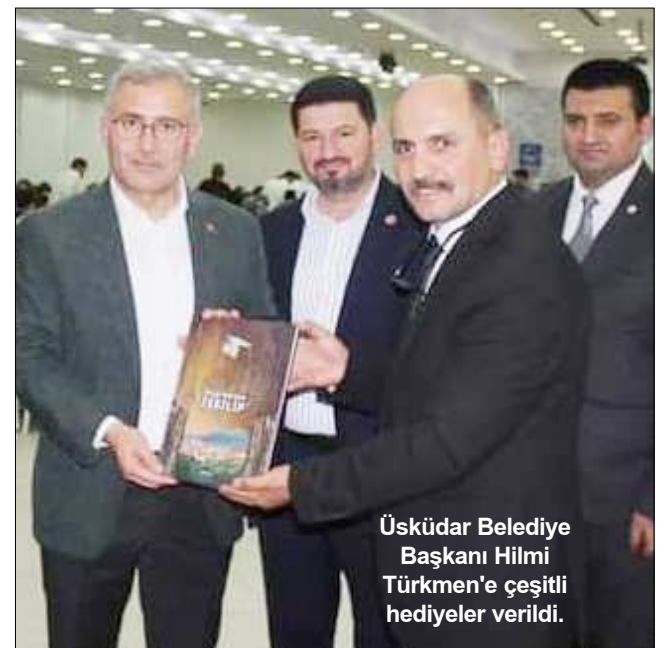
Üsküdar Belediye Başkanı Hilmi Türkmen'e çeşitli hediyeler verildi.