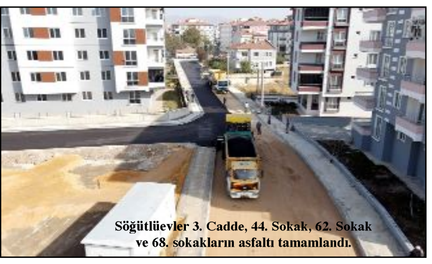
Söğütlüevler 3. Cadde, 44. Sokak, 62. Sokak ve 68. sokakların asfaltı tamamlandı.

artırmak amacıyla yeni yol açma, yol genişletme çalışmalarına devam edeceklerini ifade etti. (Haber Merkezi)