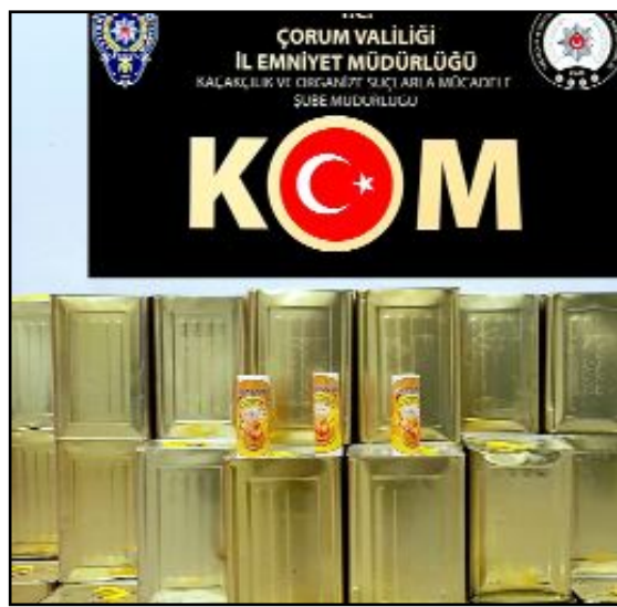
Operasyonda 1.716 kg kaçak/sahte bal ele geçirildi.

Bu arada; bir şahsın kaçak/sahte bal satışı yaptığı tespit edilmesi üzerine bahse konu şahsın iş yeri ve aracı arandı.