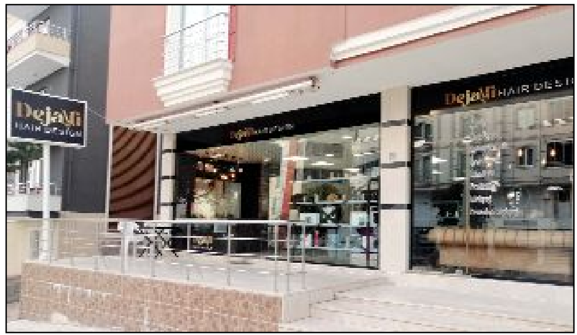
Kuaför ve güzellik salonu Dejavu Hair Design'in dıştan görüntüsü...