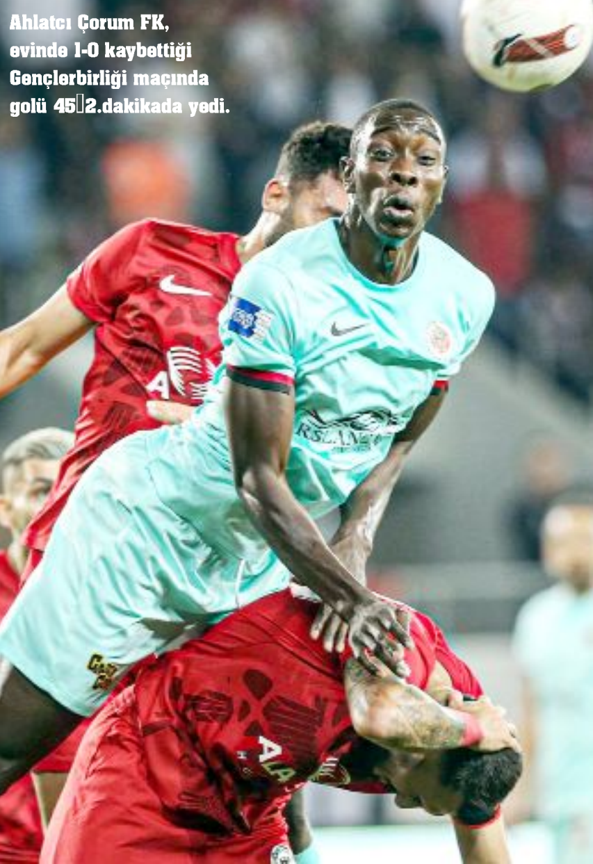
Ahlataci Çorum FK, evinde 1-0 kaybettiği Gençlerbirliği maçında golü 45'2.dakikada yedi.

Trendyol Türkiye 1.Futbol Ligi'nde mücadele eden Ahlataci Çorum FK, geçtiğimiz hafta Kocaelispor'la deplasmanda oynadığı 12.hafta maçını 90+5.dakikada yediği golle 2-1 kaybetti. Kırmızı-siyahlı ekibin, Manisa FK'dan sonra Kocaelispor maçında da son dakikada gol yemesi, uzatmalarda kaybedilen puanların sorgulanmasını gündeme getirdi. 17 GOLÜN 10'U İLK YARIDA Ahlataci Çorum FK, geride kalan 12 haftalık periyotta, 4 galibiyet, 2 beraberlik, 6 yenilgi alırken, topladığı 14 puanla 10.sırada yer alıyor. Kırmızı-siyahlı ekip, bu maçlarda attığı 17 gole karşılık 16 gol yedi. Çorum temsilcisi, attığı 17 golün 10'unu ilk yarılarda, 7'isini ise ikinci yarılarda buldu. UZATMADA 2 GOL ATTIK Ahlataci Çorum FK, 12 hafta sonunda, 90 dakikanın sonuna eklenen sürede 2 gol atabildi. Kırmızı-siyahlı ekip,