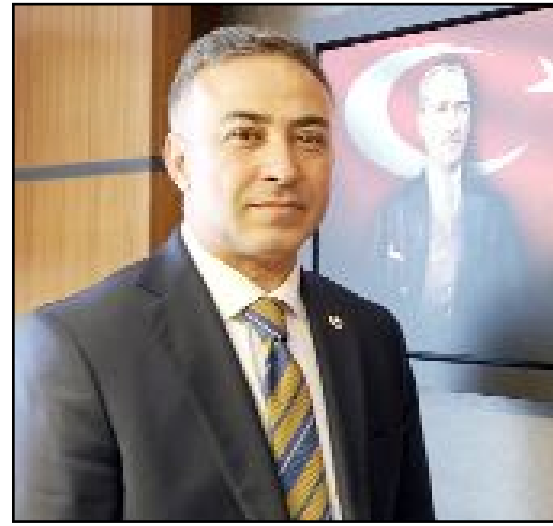
Mehmet Tahtasız, il başkanlığı döneminden beri hastane ihalesini takip ediyor.

Çorum'da bir kaç seçim öncesinde siyasiler tarafından sık sık gündeme getirilmesi nedeni ile son bir yıl içinde 4 kez ihaleye çıkarılan ancak bir türlü yapımına başlanamayan hastanenin son ihalesi bugün Ankara'da gerçekleştirildi. CHP Çorum Milletvekili Mehmet