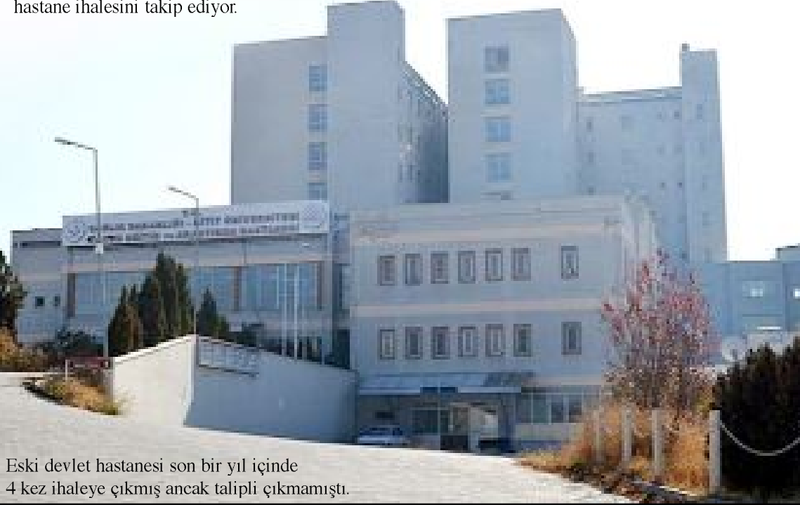
Eski devlet hastanesi son bir yıl içinde 4 kez ihaleye çıkmış ancak talipli çıkmamıştı.

Devlet hastanemiz üç yıl sonra faaliyete geçecek. Hemşehrımız Atilla Dikçi'ye ve hastanenin açılması için yürüttüğümüz mücadeleye destek veren herkese teşekkür ederim. İlimiz için hayırlı olsun. Sağlıklı günler dilerim." (Volkan SINAYUÇ)