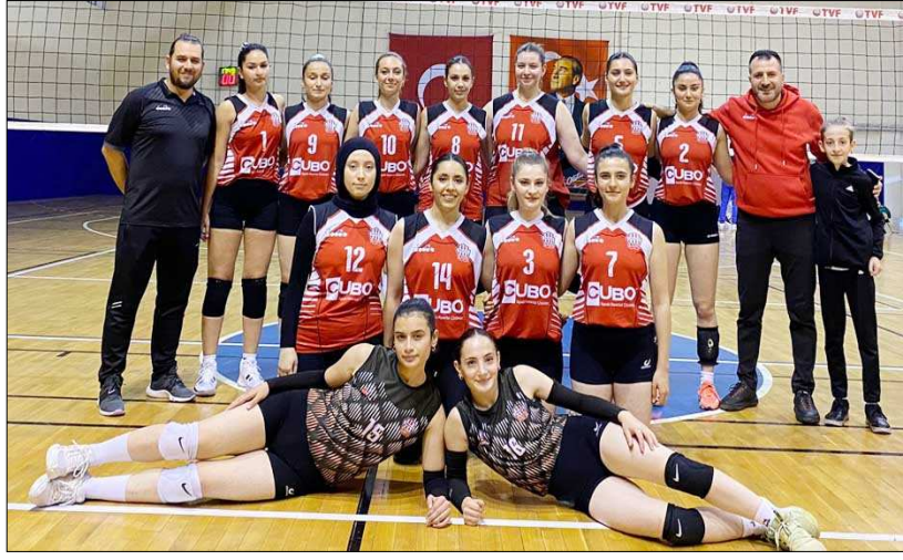
Sultanlar 6.hafta maçında Artvinspor'u 3-1'le geçmeyi başardı.

Bu sonuçların ardından 2'de 2 yapan Mimar Sinan Gençlikspor 6 puanla liderlik koltuğuna oturdu. (Rifat KARA)