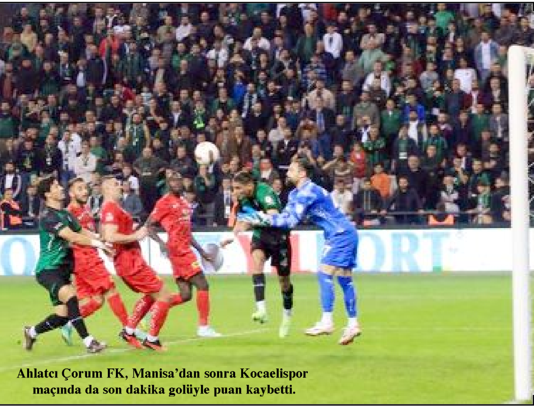
Ahlataci Çorum FK, Manisa'dan sonra Kocaelispor maçında da son dakika golüyle puan kaybetti.

● En son Kocaelispor maçını son dakika golüyle kaybeden Ahlataci Çorum FK, deplasmanda Manisa FK ile 2-2 berabere kaldığı maçta da 90+1 ve 90+8.dakikalarda kalesinde goller gördü. 90 dakikanın sonuna eklenen sürede 3 gol yiyen ve 5 puan kaybeden Ahlataci Çorum FK, evinde 1-0 kaybettiği Gençlerbirliği maçında da ilk yarının sonuna eklenen sürede yediği golle yenildi.