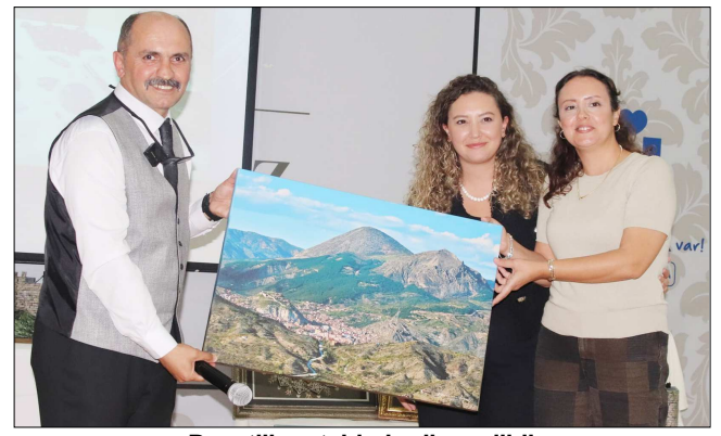
Davetlilere tablo hediye edildi.