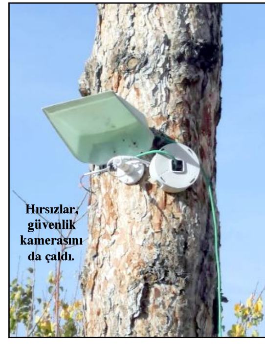
Hırsızlar, güvenlik kamerasını da çaldı.

Hasan B. olayların arttığı Nadık semtinde gereken güvenlik önlemlerinin alınmasını istedi. (Haber Merkezi)