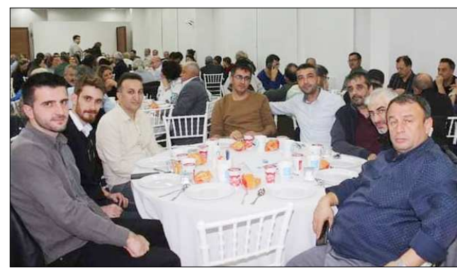
İstanbul'da yaşayan İskilipliler geceye yoğun ilgi gösterdi.