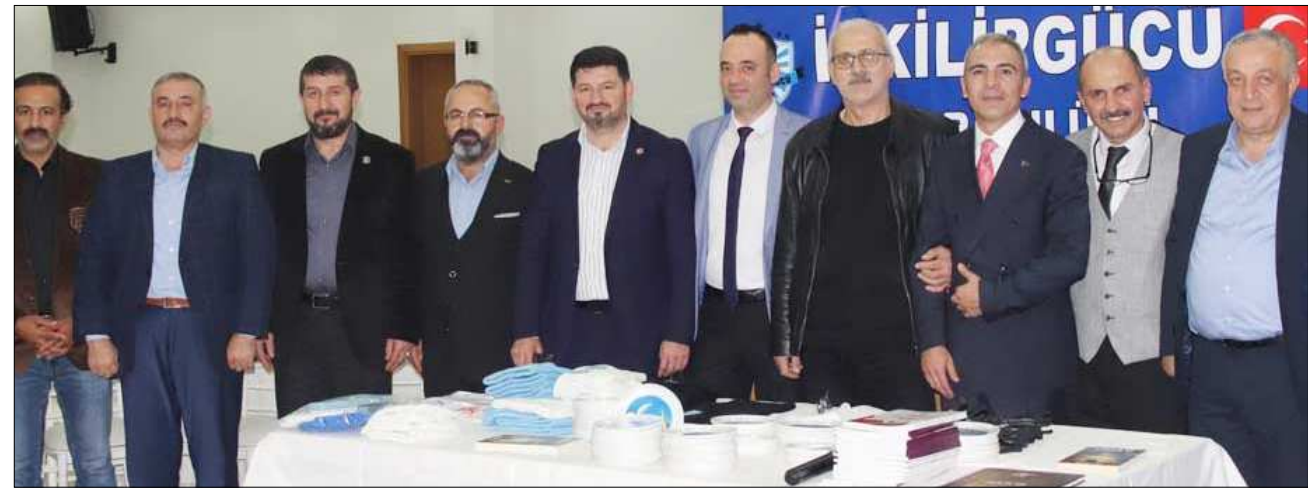
İstanbul'da yaşayan İskilipli iş insanları geceye katılarak İskilipgücü'ne destek verdiler.

üz. Gerçekten hiçbir karşılık beklemeden, İskilip için çalıştığımız, tüm çabamızı çocuklarımız için verdiğimiz ve sizlerin desteğini hissettiğimiz için İskilipgüclüyüz" ifadelerini kullandı. (Hüseyin AŞKIN)