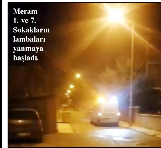
Meram 1. ve 7. Sokakların lambaları yanmaya başladı.

ÇORUM HABER WhatsApp ihbar hattına ulaşan Rıza Aydın isimli vatandaş, yaklaşık 2 haftadır Kale Mahallesi Meram 1. ve 7. sokakta lambaların yanmadığını, zifiri karanlıkta kaldıklarını dile getirmişti. Ayrıca karanlıkta kalan mahallelere hırsızların dadandığından şikayet etmiş, yetkililerden çözüm istemişti. (Haber Merkezi)