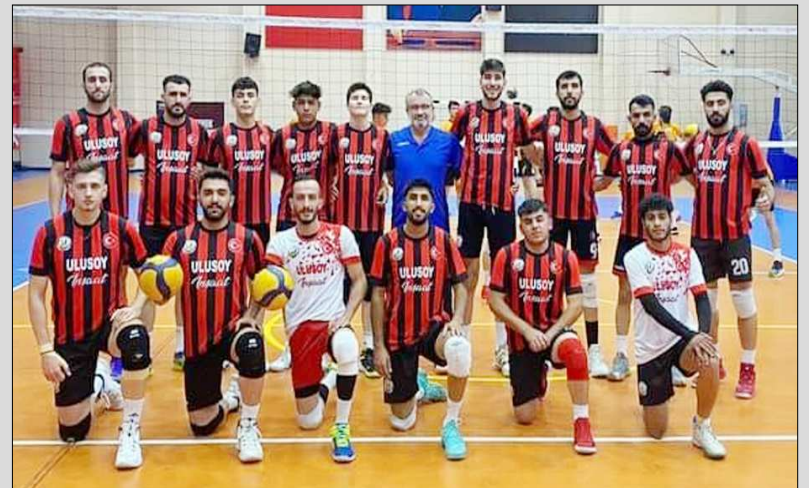
Efeler sahasında oynadığı 4.hafta maçında TUSAŞ'ı 3-1 mağlup etti.

4 haftalık periyotta 386 sayı alırken, rakibine ise 358 sayı verdi. 1.078 averaj ortalaması ile 4.haftayı geride bıraktı. (Rifat KARA)