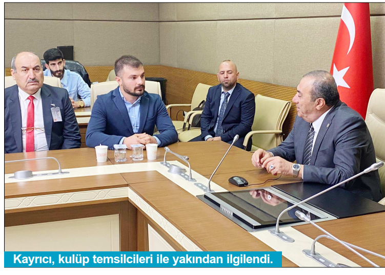
Kayrıcı, kulüp temsilcileri ile yakından ilgilendi.