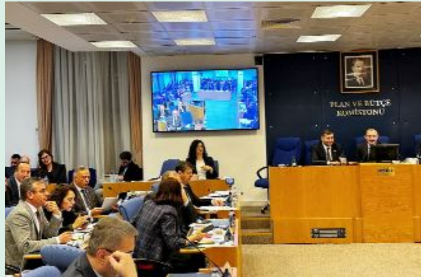
Cumhuriyet Halk Partisi Çorum Milletvekili Mehmet Tahtasız, Kültür ve Turizm Bakanı Mehmet Nuri Ersoy'u Çorum'a davet etti.

● Kültür ve Turizm Bakanlığı'nın 2024 yılı bütçesinin görüşüldüğü TBMM Plan Bütçe Komisyonu'nda söz alan CHP Çorum Milletvekili Mehmet Tahtasız, arkeolojik anlamda çok sayıda zenginliği barındıran Çorum'un hizmet alma konusunda fakir olduğunu belirterek, "Çorum'da tarihi, kültürel mirasımız yatıyor, Kültür ve Turizm Bakanlığı bakıyor" dedi. •7'de