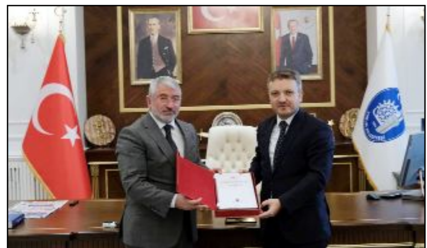
Ziyarette Çorum Belediyesi'nin çalışmalarını ile ilgili Coştu'ya bilgi verildi.

gayret içine girmiş. Bu birlikteliği görmek bizim için ayrı bir motivasyon kaynağı. Bizler de hep birlikte Çorum'a değer katmak için çaba göstereceğiz" diye konuştu. (Taner ŞİMŞEK)