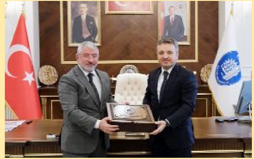
Sanayi ve Teknoloji Bakan Yardımcısı Zekeriya Coştu, Çorum Belediyesi'ni ziyaret etti.

● Sanayi ve Teknoloji Bakan Yardımcısı hemşehrimiz Zekeriya Coştu, Çorum'un yönetici ve idarecilerinin kentin gelişmesi için güzel bir ortam oluşturduğunu belirterek, "Bizler de hep birlikte Çorum'a değer katmak için çaba göstereceğiz" dedi. •5'de