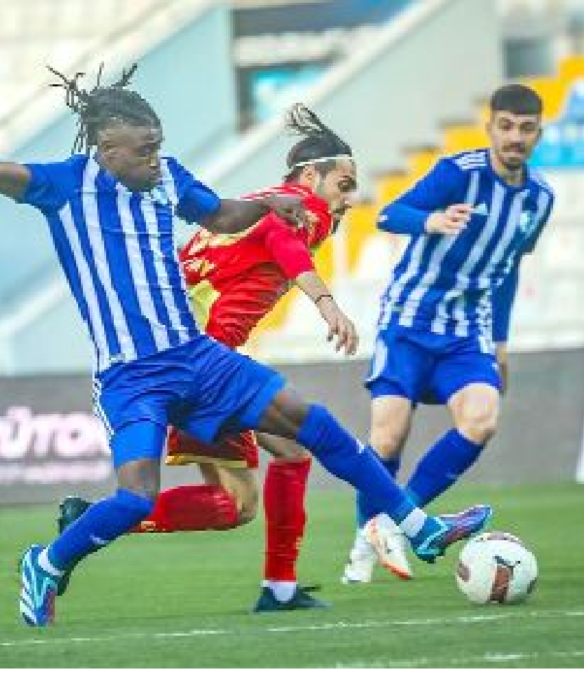
Erzurumspor, milli ara öncesinde, son haftaların formda takımı Göztepe karşısında aldığı 3-2'lik galibiyetle dikkatçektir.