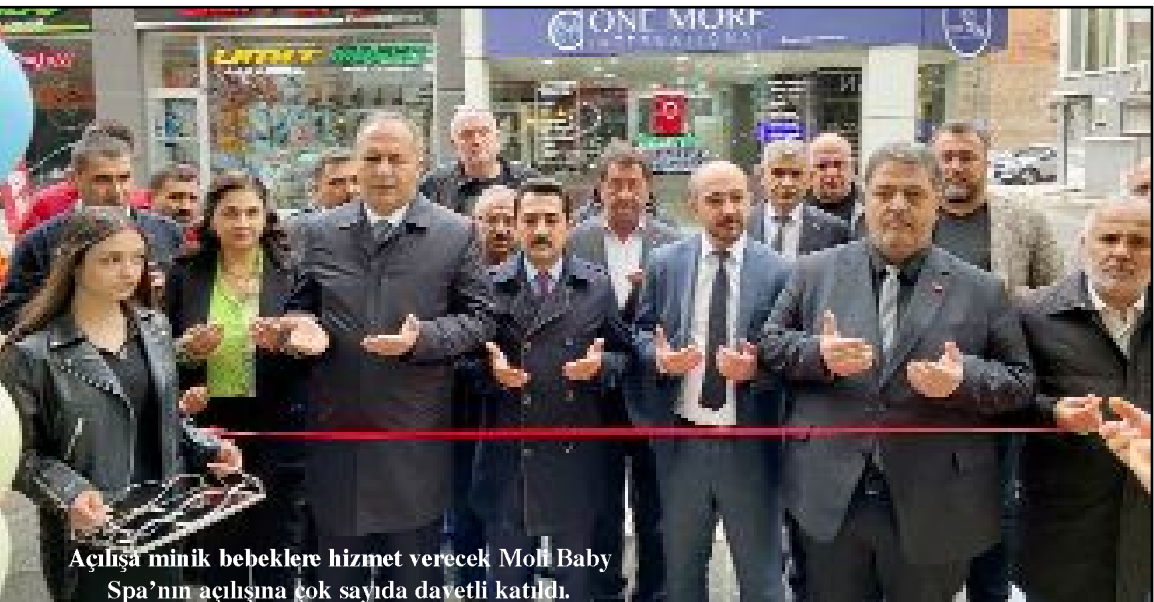
Açılışa minik bebeklere hizmet verecek Moli Baby Spa'nın açılışına çok sayıda davetli katıldı.

Moli Baby Spa'nın bebek masajları, floating hidroterapi, konsept fotoğraf çekimi ve daha birçok özel etkinliklerle minik ziyaretçilerine unutulmaz anılar yaşatmayı hedeflediğini anlatan Bostancı, uzman personeli ile güvenli ve hijyenik bir ortam sunarak ailelerin güvenini de kazanmayı hedeflediklerini ve tüm Çorumlu aileleri merkezlerine davet ettiklerini dile getirdi. (Uğur GÖRKEM)