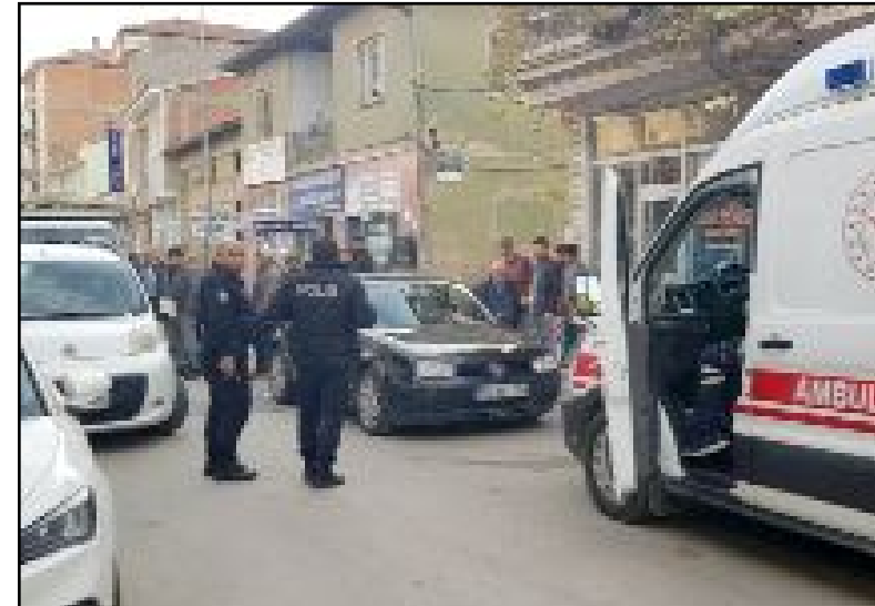
Kaza, Alaca'nın Denizhan Mahallesi Cumhuriyet Caddesi'nde meydana geldi.

Çorum'un Alaca ilçesinde bisikleti ile yolda seyir halindeyken otomobilin çarptığı çocuk yaralandı.