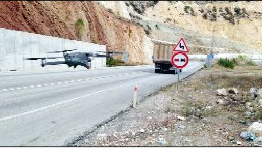
Çorum-Osmancık yolu üzerindeki Kırkdilim virajlarında dron ve kamera destekli denetimler gerçekleştirildi.

Çorum İl Jandarma Komutanlığı tarafından yayılan açıklamada, sürücülere hem kendilerinin hem de diğer yol kullanıcılarının can güvenliklerini sağlamak için trafik kurallarına uymaları belirtilirken, "Trafikte 1 Can Kaybı Bile Fazladır" anlayışı ile denetimlerin devam edeceği bildirildi. (İHA)