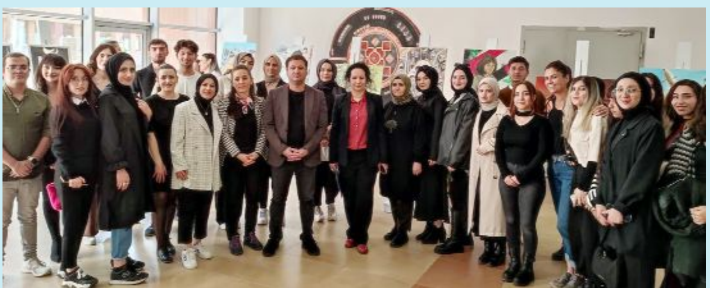
Bayramiç Mehmet Akif Ersoy Kitap Günleri'nin açılış töreni...