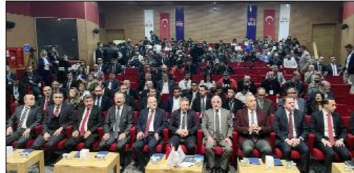
Anadolu Bilişim Buluşmaları kapsamında "Dijital Dünyaya Çorum'dan Bakış" konulu program, Hitit Üniversitesi'nin ev sahipliğinde düzenlendi.