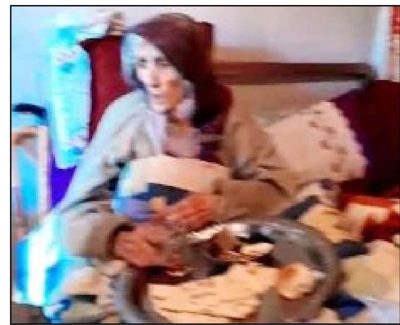
İhtiyaçlarını gidere-meyecek duruma gelen yaşlı kadına sadece komşuları destek vermeye çalışıyor.

duyurmaya çalışan komşular, "Biz elimizden geldiğince yardımcı olmaya çalışıyoruz ama artık bu teyzemizin bir bakıma ihtiyacı var. Kendi ihtiyaçlarını gidere-miyor, bizler köyden git-tiğimizde kendisine yemek verecek kişi dahi olmuyor. Bu teyzemiz için Çorum Valiliğinden destek bekliyoruz" dediler. (Haber Merkezi)