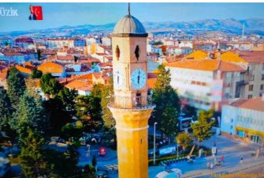
Saat Kulesi ve Çorum görüntüsü...