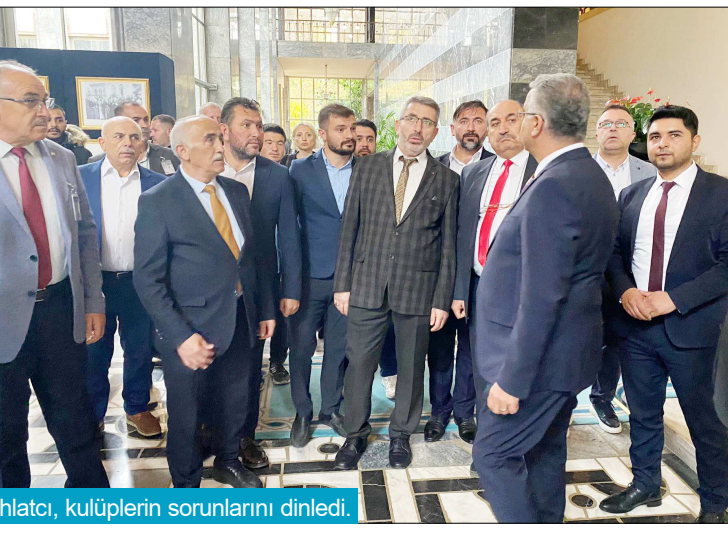
Ahlatcı, kulüplerin sorunlarını dinledi.