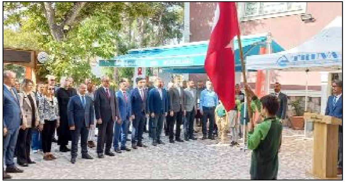
Bayramiç Mehmet Akif Ersoy Kitap Günleri'nin açılış töreni...