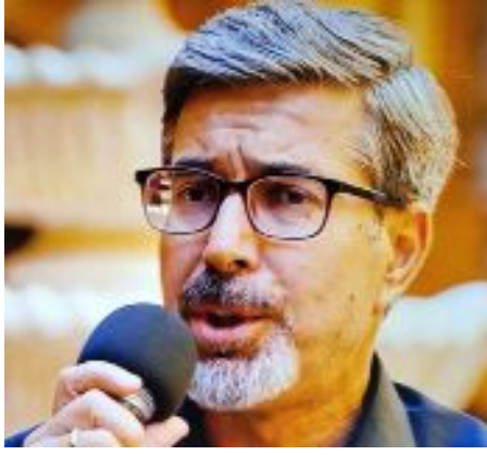
Av. Hüseyin Erdost

Program sırasında Çorum'dan görüntülere de yer verildi. (Haber Merkezi)