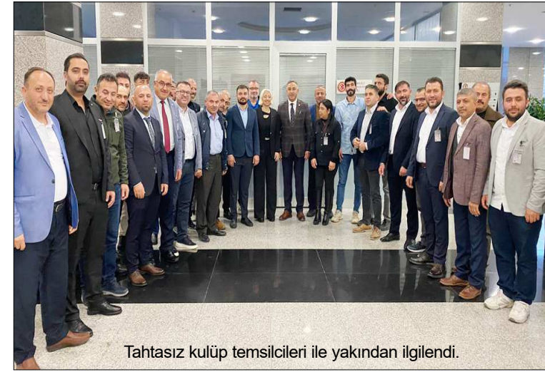
Tahtasız kulüp temsilcileri ile yakından ilgilendi.