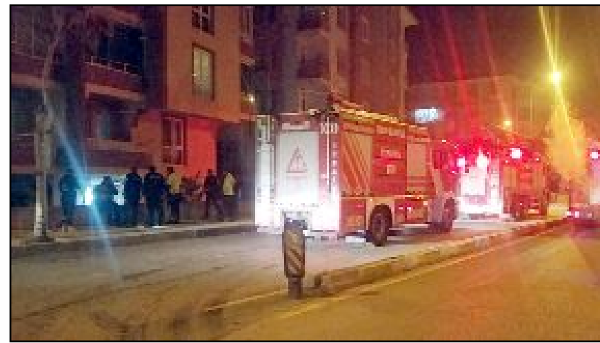
Ocakta unutulmuş yemeğin neden olduğu yangın Çorum Belediyesi İtfaiye ekiplerinin müdahalesiyle söndürüldü.

Yangında dumanlı etkilenen A.D.(52)'ye sağlık ekiplerince ambulans içerisinde müdahale edildi. (Tuğay GÖKTÜRK)