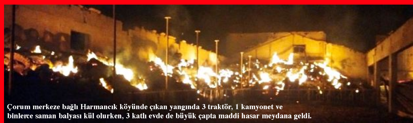
Çorum merkeze bağlı Harmançık köyünde çıkan yangında 3 traktör, 1 kamyonet ve binlerce saman balyası kül olurken, 3 katlı evde de büyük çapta maddi hasar meydana geldi.

● Kültür ve Turizm Bakanlığı'nın 2024 yılı bütçesinin görüşüldüğü TBMM Plan Bütçe Komisyonu'nda söz alan CHP Çorum Milletvekili Mehmet Tahtasız, arkeolojik anlamda çok sayıda zenginliği barındıran Çorum'un hizmet alma konusunda fakir olduğunu belirterek, "Çorum'da tarihi, kültürel mirasımız yatıyor, Kültür ve Turizm Bakanlığı bakıyor" dedi. •7'de