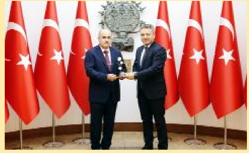
Sanayi ve Teknoloji Bakan Yardımcısı hemşehrimiz Zekeriya Coştu, Çorum Valiliği ziyaretinde hem Vali Dağlı'yı yeni görevinden dolayı kutladı hem de ülkemizin ilk yerli ve milli haberleşme uydusu olarak üretilen TÜRKSAT 6A Haberleşme uydusunun maketini hediye etti.

● Sanayi ve Teknoloji Bakan Yardımcısı Zekeriya Coştu, Türkiye'nin katma değer artışı sağlamak için sanayinin dijital dönüşümü konusunda hızlanması gerektiğini belirterek, bu kapsamda Bakanlık olarak yeni ve çok etkin bir teşvik modelini hayata geçireceklerini söyledi. •5'de