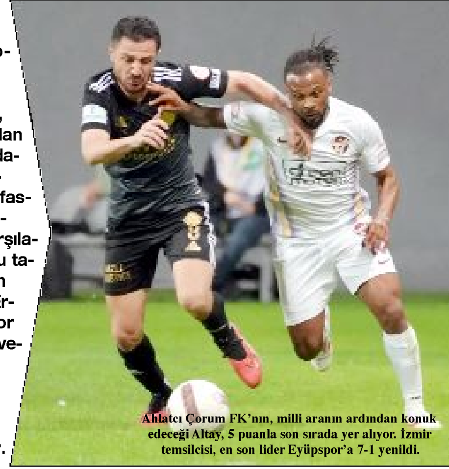
Ahlatcı Çorum FK'nın, milli aranın ardından konuk edeceği Altay, 5 puanla son sırada yer alıyor. İzmir temsilcisi, en son lider Eyüpspor'a 7-1 yenildi.