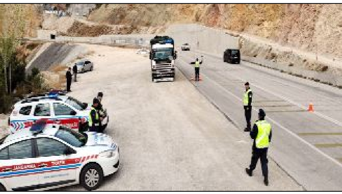
Denetimlerde kural ihlalinde bulunan sürücülere idari yaptırım uygulandı.