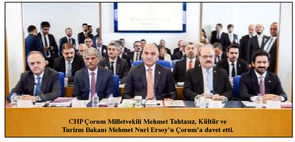
CHP Çorum Milletvekili Mehmet Tahtasız, Kültür ve Turizm Bakanı Mehmet Nuri Ersoy'u Çorum'a davet etti.