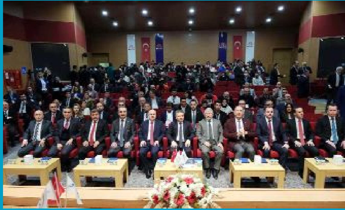
Hittit Üniversitesi Çorum Meslek Yüksekokulu Ethem Erkoç Konferans Salonu'nda "Dijital Dünyaya Çorum'dan Bakış" konulu bir program düzenlendi.

● Sanayi ve Teknoloji Bakan Yardımcısı Zekeriya Coştu, Türkiye'nin katma değer artışı sağlamak için sanayinin dijital dönüşümü konusunda hızlanması gerektiğini belirterek, bu kapsamda Bakanlık olarak yeni ve çok etkin bir teşvik modelini hayata geçireceklerini söyledi. •5'de