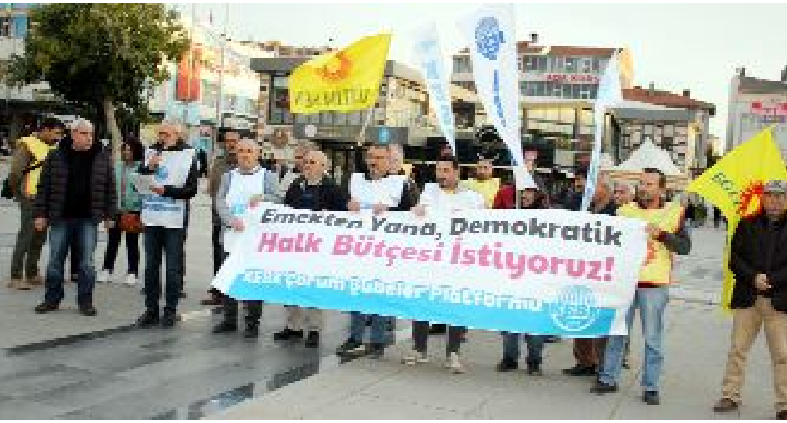
KESK Çorum Şubeler Platformu tarafından Kadeş Barış Meydanı'nda düzenlenen basın açıklamasında "Emekten ve halktan yana bir bütçe" talebi dile getirildi.