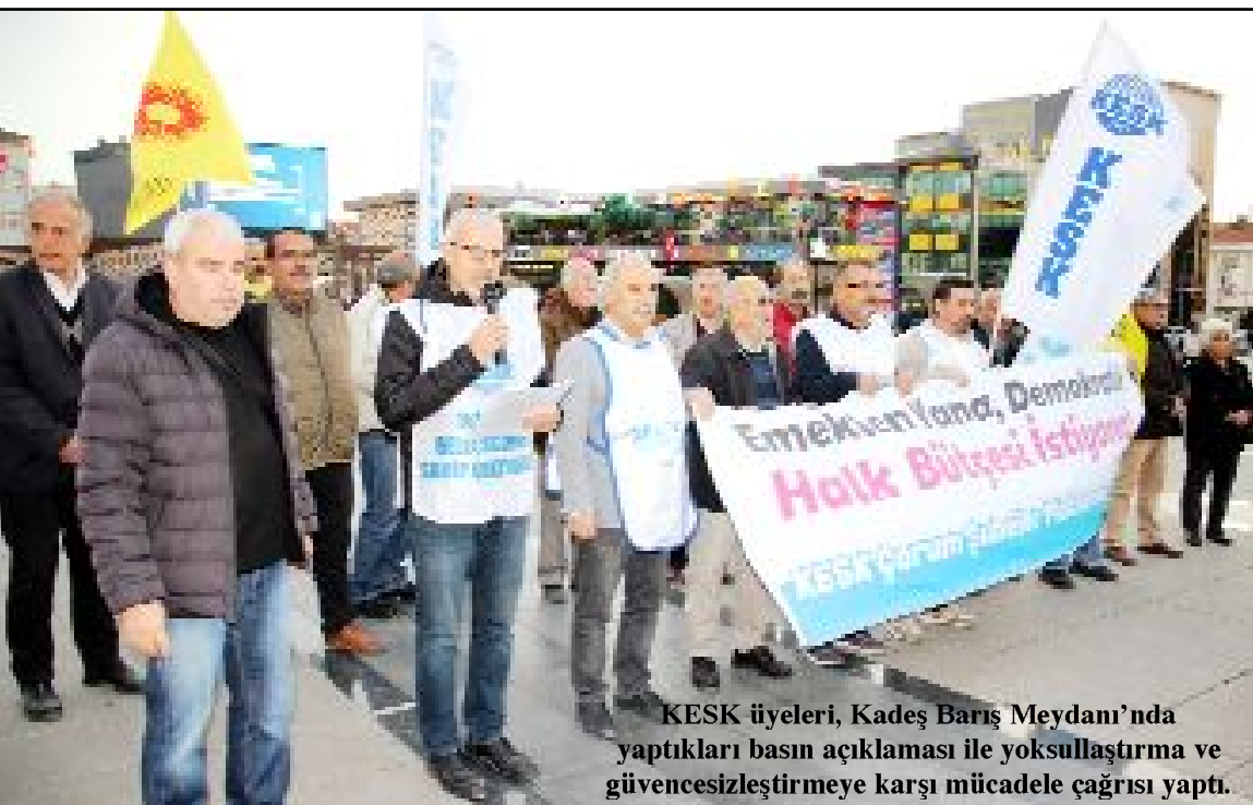
KESK üyeleri, Kadeş Barış Meydanı'nda yaptıkları basın açıklaması ile yoksullaştırmaya ve güvencesizleştirilmeye karşı mücadele çağrısı yaptı.

Dersler çıkıyoruz deneyimlerimizden ancak çoğu kez geç kaldığımızı da görüyoruz.