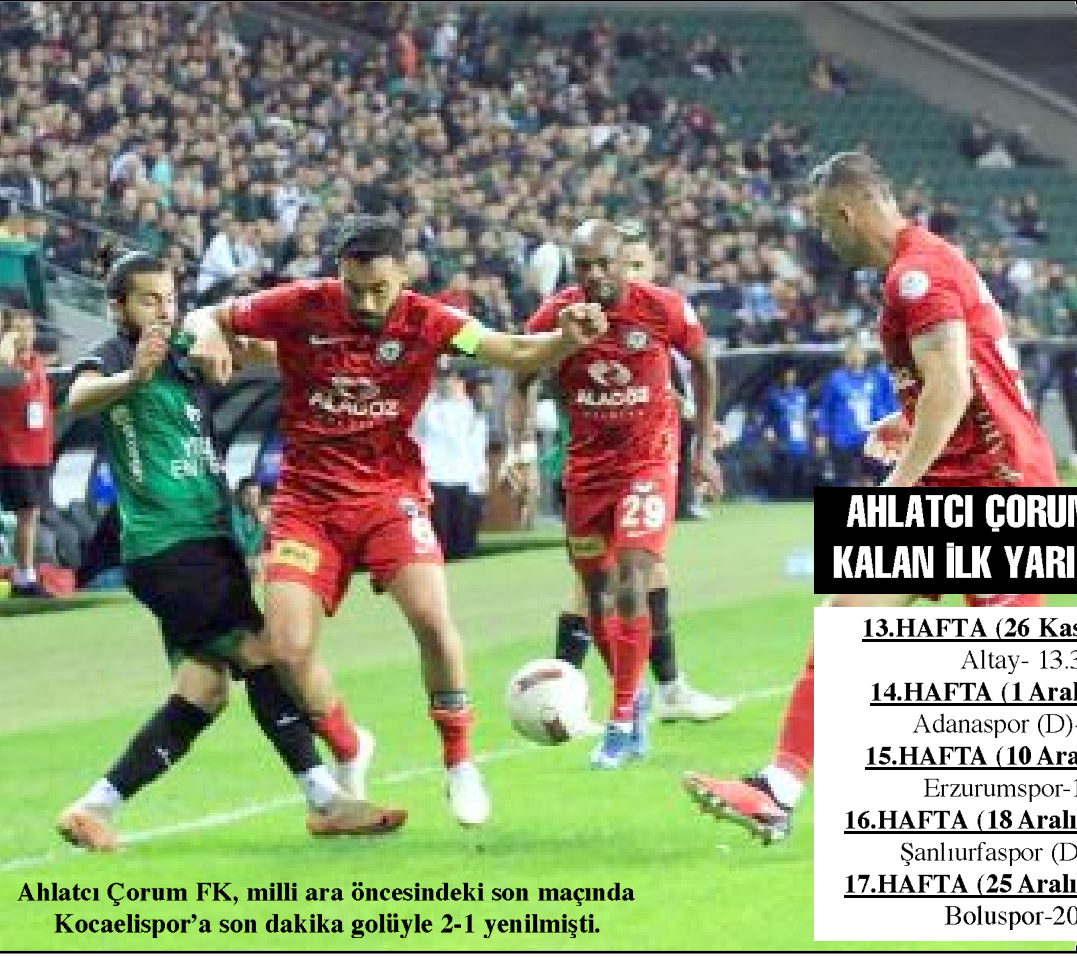
Ahlatcı Çorum FK, milli ara öncesindeki son maçında Kocaelispor'a son dakika golüyle 2-1 yenilmiştir.

Trendyol Türkiye 1.Futbol Ligi'nde 12.hafta maçları sonunda 14 puanla 10.sırada yer alan Ahlatcı Çorum FK, milli aranın ardından sırasıyla Altay, Adanaspor (D), Erzurumspor, Şanlıurfaspor (D) ve Boluspor'la karşılaşacak. Bu takımlardan sadece Erzurumspor puan cetvelinde Çorum temsilcisinin üzerinde yer alıyor.