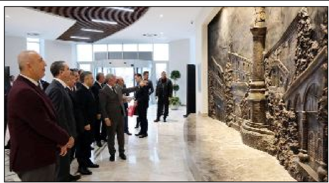
Sanayi ve Teknoloji Bakan Yardımcısı Zekeriya Coştu, Çorum Belediyesi'ni ziyaret etti.