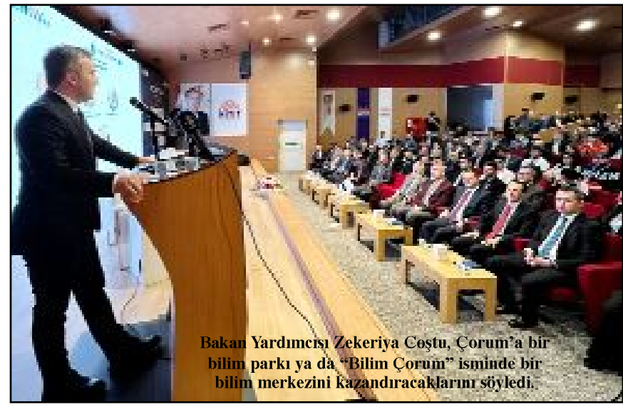
Bakan Yardımcısı Zekeriya Coştu, Çorum'a bir bilim parkı ya da "Bilim Çorum" isminde bir bilim merkezini kazandıracaklarını söyledi.

önemli adımlar atıyoruz. Dijital dönüşüm teknoloji geliştirme kaynağı noktasında da insan kaynağı yetiştirme öncelikli hedeflerimiz arasında. Teknofestler, Dene Yap Atölyeleri bu ülkenin teknoloji kapasitesini ve potansiyelini ortaya koyan önemli çalışmalar. Türkiye genelinde tüm illerimizde Dene Yap Atölyeleri projesini hayata geçirdik. Benzer şekilde yeni bir proje için kolları sıvadık. 81 ilde 100 Teknofest atölyesini Çorum'da hayata geçireceğiz. Çorum'a bir Bilim Parkı ya da Bilim Çorum isminde bir bilim merkezini kazandıracakız." (İHA)