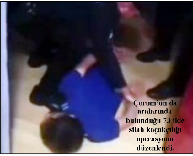
Çorum'un da aralarında bulunduğu 73 ilde silah kaçakçılığı operasyonu düzenlendi.

Operasyonları gerçekleştiren Kahraman Jandarmamız ve Kahraman Emniyetimizi tebrik ediyorum. Aziz milletimizi müsterih olsun, ruhsatsız silah temin edenlerle ve silah kaçakçılarıyla da mücadelede kararlılıkla sürecek." (Haber Merkezi)