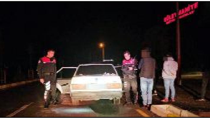
Gece saatlerinde Ulukavak Mahallesi İskilip 1. Caddesinde şüpheli bir otomobil yunus ekiplerince durduruldu.

Çorum'da polis ekiplerince durdurulan bir araçta uyuşturucu madde ele geçirildi.