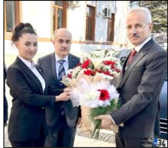
Bakan Uraloğlu, çiçeklerle karşılandı.