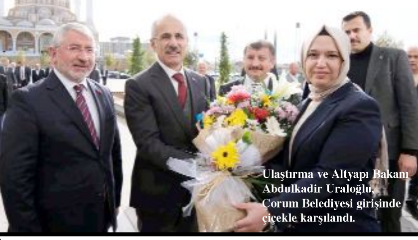
Ulaştırma ve Altyapı Bakanı Abdulkadir Uraloğlu, Çorum Belediyesi girişinde çiçekle karşılandı.

Çorum Belediye Başkanı Dr.Halil İbrahim Aşgın, Ulaştırma ve Altyapı Bakanı Uraloğlu’ndan Çorum’a yeni çevreyolu yapılması için çalışmaların başlanmasını talep etti. Çorum çevreyolunun artık kent içinde kaldığını ve yeni bir çevreyoluna ihtiyaç olduğunu söyleyen Aşgın: “Yeni çevreyolu projenin en kısa zamanda yapılmasını talep ediyoruz” dedi. •3’de