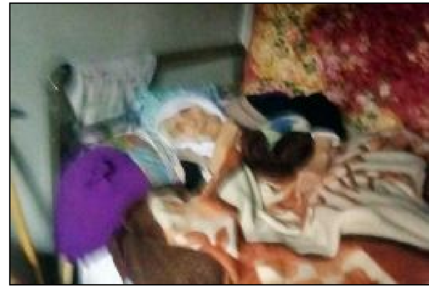
Tek başına yaşam mücadelesi veren 90 yaşındaki yaşlı kadına Çorum Valiliği sahip çıktı.