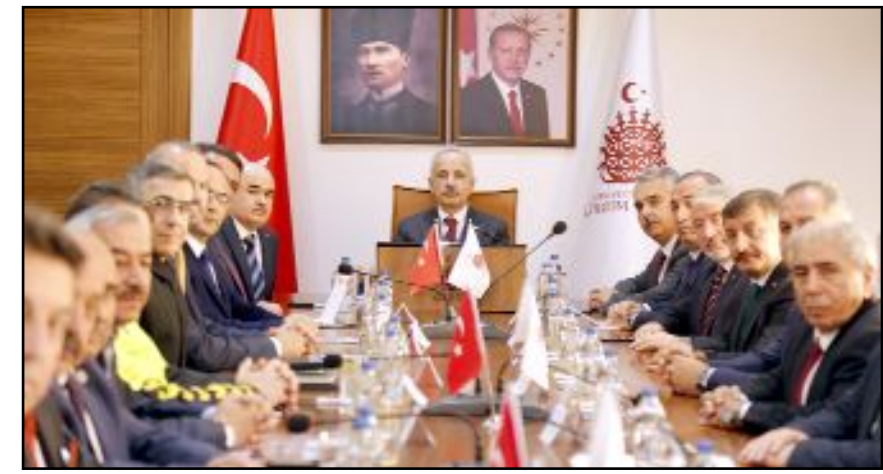
Vali Dağlı'dan Çorum'un temel sorunları, yapılan çalışmalar ve beklentiler hakkında brifing alan Bakan Uraloğlu, ayrıca koordinasyon toplantısı yaptı.