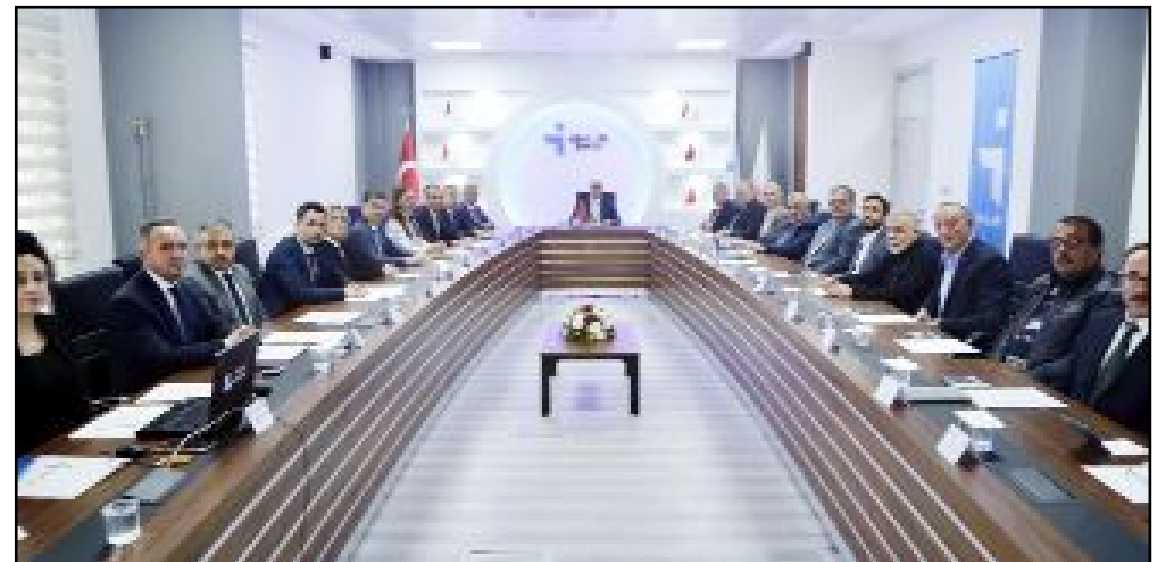
Çorum İl İstihdam ve Mesleki Eğitim Kurulu'nun 2023 yılı 4. Olağan Toplantısı yapıldı.

Kurul üyelerinin görüş ve önerilerinin alınmasının ardından toplantı sona erdi. (Haber Merkezi)