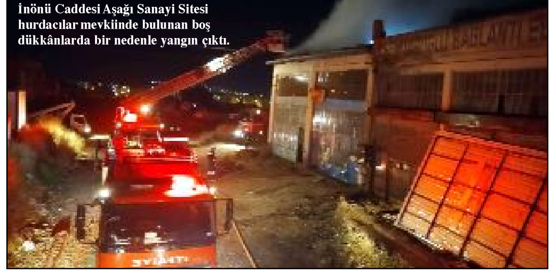
İnönü Caddesi Aşağı Sanayi Sitesi hurdaacılar mevkiinde bulunan boş dükkanlarda bir nedenle yangın çıktı.