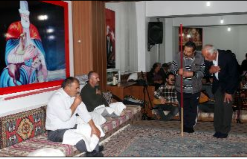
Abdal Musa Cemii'nde canlar gönül birlikteliği sağladı.

Lokma paylaşımının ardından vakıf binasında bulunan cemevinde "Abdal Musa Birlik Cemii" düzen-