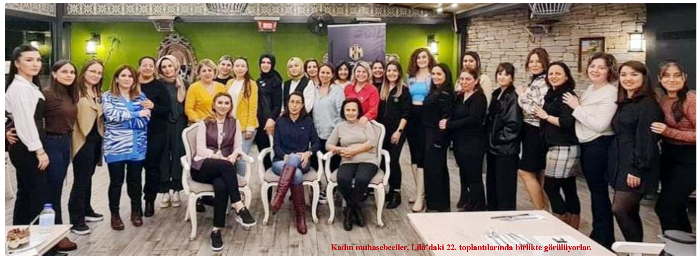
Kadın muhasebeciler, Lila'daki 22. toplantılarında birlikte görülüyorlar.