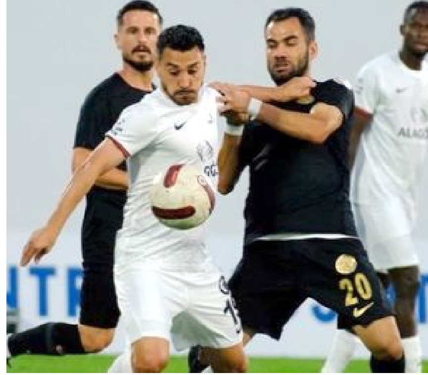
Kırmızı-siyahlılar, sıralamada altında yer alan takımlardan Tuzlaspor ve Ümraniyespor'u deplasmanda 3-0'lık skorlarla yenerken, yine deplasmanda Manisa FK ile 2-2 berabere kaldı.

Ahlatcı Çorum FK, puan cetvelinin ilk 7 sırasında yer alan takımların tamamıyla maç yaparken, 2 galibiyet, 1 beraberlik, 4 yenilgi aldı. Bu maçlarda evinde Sakaryaspor'u 1-0 yenen Çorum temsilcisi, deplasmanda Göztepe'yi 2-1 mağlup eder-