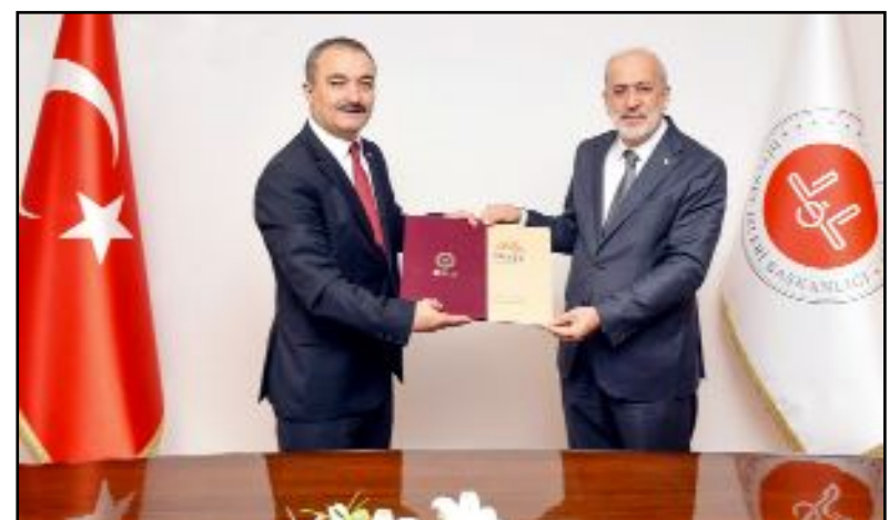
Ziyarete Müftülük ve HİTÜ arasında protokol imzalandı.