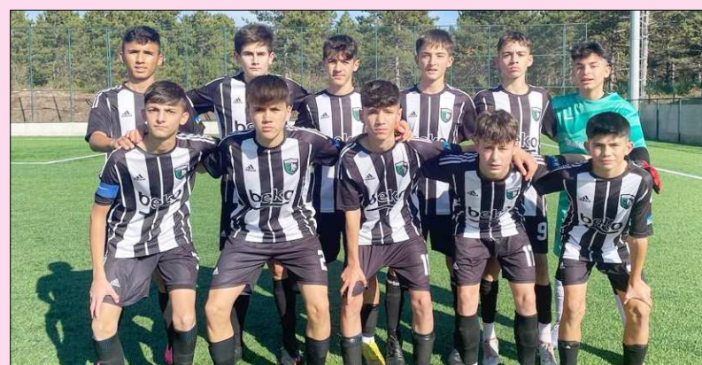
Çorum Anadolu FK geçtiğimiz hafta şampiyonluğunu ilan etmişti...

U15 Ligi Play-Off Grubu'nda yarın oynanacak son hafta maçlarının ardından heyecan sona erecek. 4 takımın çift devreli lig statüsüne göre mücadele ettiği Berke-Burak Refraktör U15 Ligi Play-Off Grubu'nda yarın altıncı ve son hafta maçları oynanacak. İtfaiye Sahası'nda saat 11.00'de oynanacak maçta Mimar Sinan Gençlikspor ile Maviay Gençlikspor