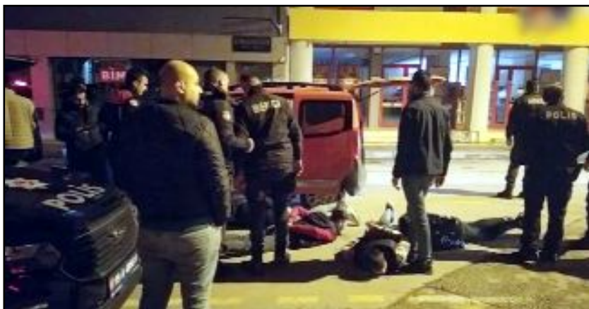
Polis ekiplerinin "dur" ihtarına uymayan sürücü kovalamaca sonucu yakalanırken, araçta yapılan aramada pompalı tüfek ele geçirildi.

Öte yandan, araca 17 bin TL idari para cezası uygulanıp çekici yardımıyla otoparka çekildi. (İHA)