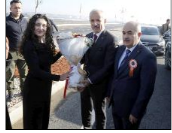
Bakan Uraloğlu, açılış ve ziyaretler için Çorum'a geldi.