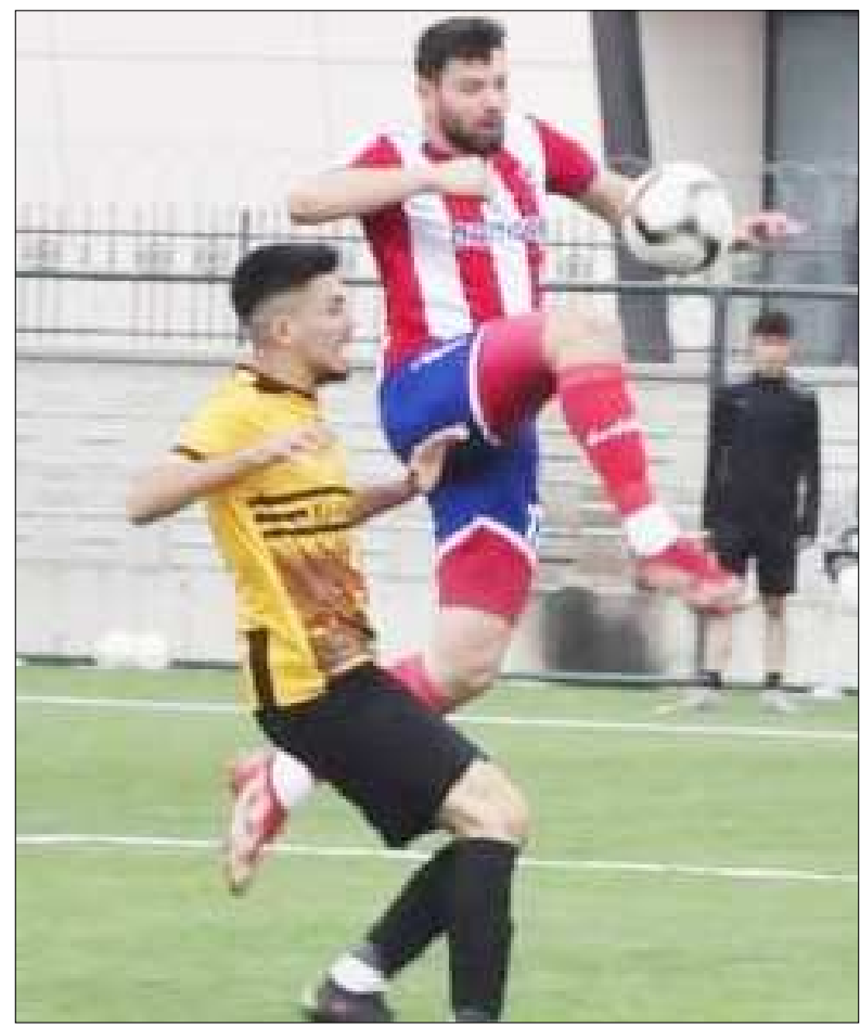
Gülabiye Spor ilk hafta maçında Kargıspor'u 2-0 mağlup etmişti...

BELTAŞ 1.Amatör Küme Büyükler Futbol Ligi'nde yarın şampiyonluğun iki güçlü adayı karşı karşıya gelecek.