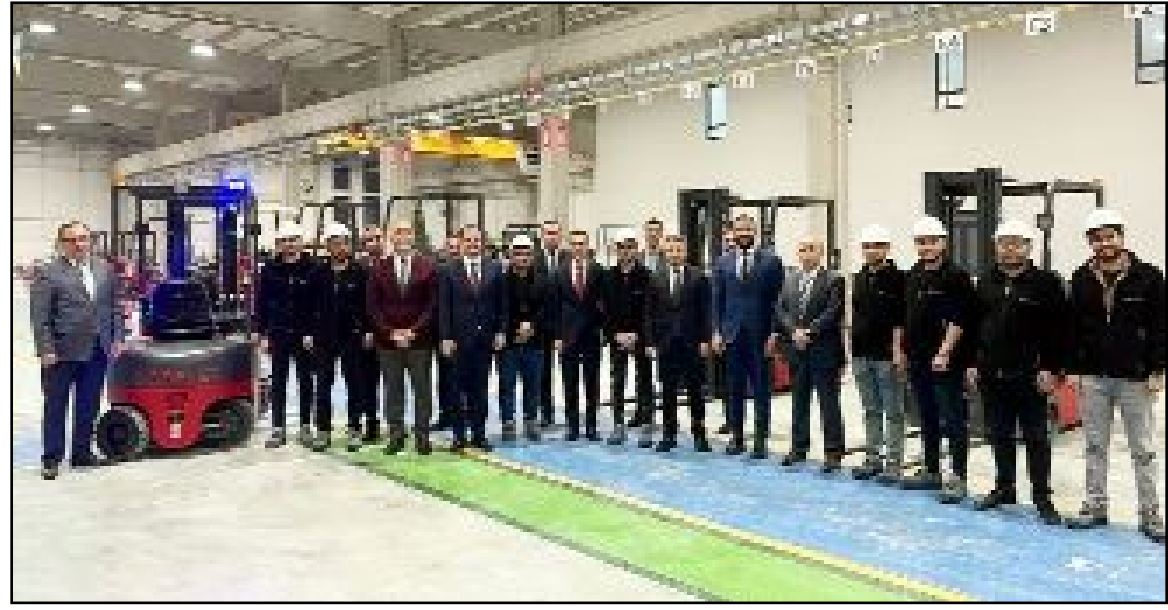
Bakan Yardımcısı Coştu, AK Parti'de basın açıklaması da yaptı.