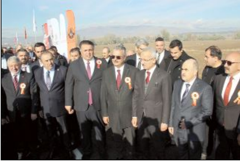
Ulaştırma ve Altyapı Bakanı Abdulkadir Uraloğlu, Delice-Çorum Yüksek Hızlı Tren Projesi'nin (YHT) 2024 yılında ihale edileceğini söyledi.

kara-Kırıkkale-Çorum arasında yaklaşık 3,5-4 saat süren ulaşım süresi, 1,5 saatten daha kısa sürecektir" diye konuştu. (Nurdan AKBAŞ)