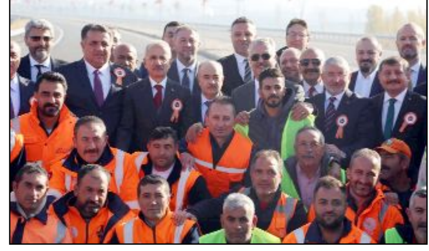
Ulaştırma ve Altyapı Bakanı Abdulkadir Uraloğlu, AK Parti İl Başkanlığı'nı ziyaret etti.