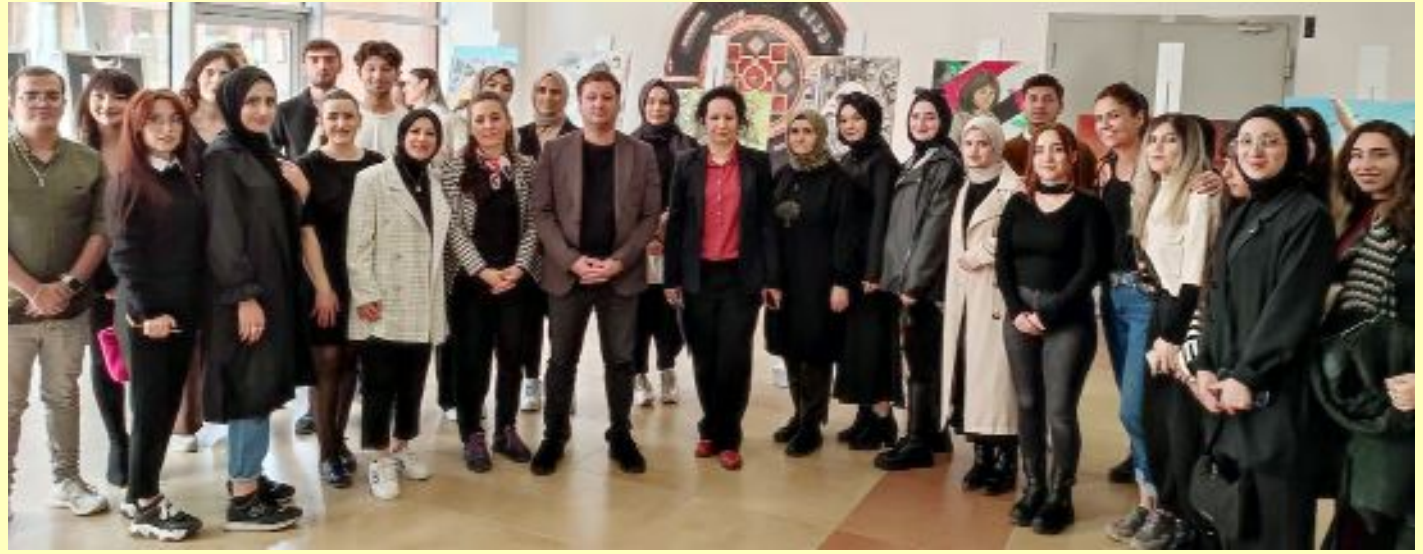
Karma sergiye emeği geçen öğretim üyeleri ve öğrenciler toplu halde...