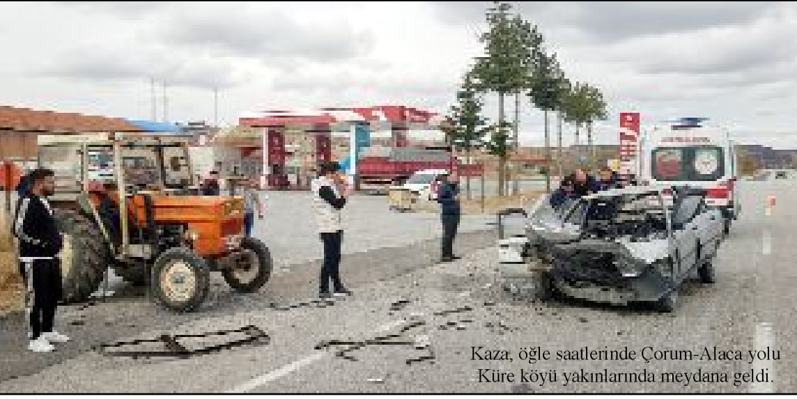
Kaza, öğle saatlerinde Çorum-Alaca yolu Küre köyü yakınlarında meydana geldi.