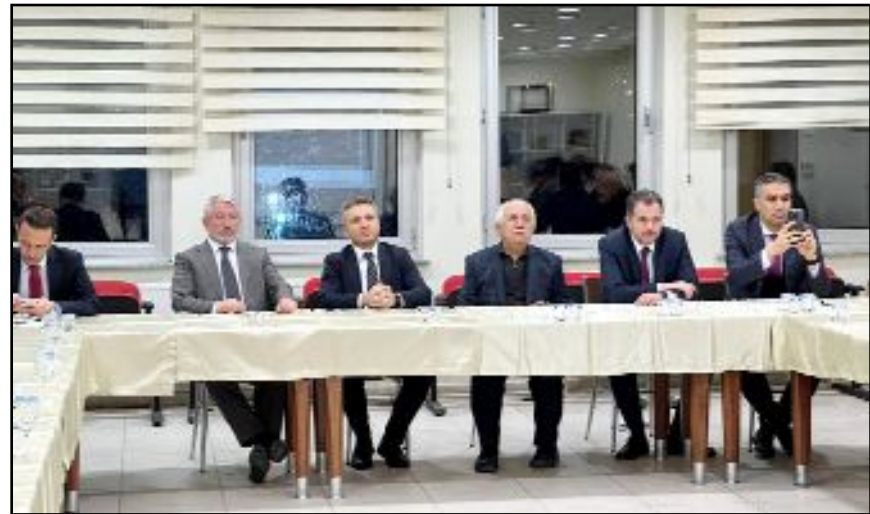
Bakan Yardımcısı Coştu OSB'de sanayicilerle buluşarak taleplerini dinledi.