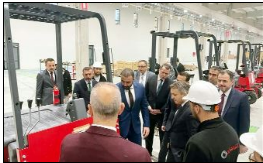
Bakan Yardımcısı Coştu fabrikaların çalışanları ile ilgili bilgi aldı.

Yağmaksan ve Göbblers Elektrikli Araçlar A.Ş.'yi ziyaret ettikten sonra Duduoğlu Çelik Döküm A.Ş'de sanayicilerle biraraya geldi.