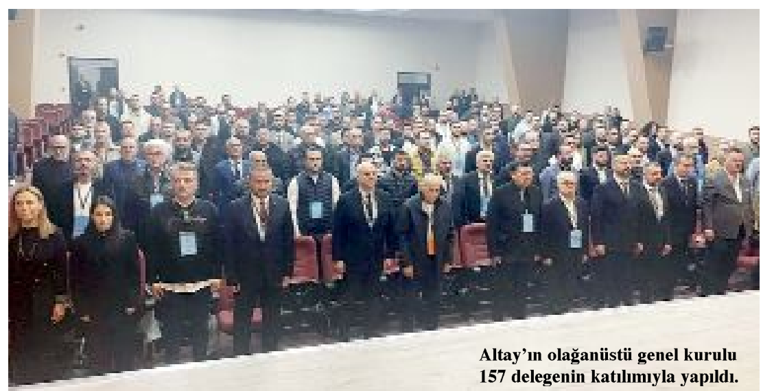
Altay'm olağanüstü genel kurulu 157 delegenin katılımıyla yapıldı.