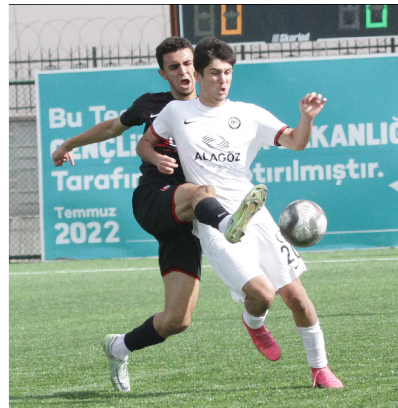
Çorum FK U19 takımının Uşakspor ile oynadığı maçın bir enstantane...

karşı karşıya gelirken, saat 12.45'de ise şampiyonluğunu geçtiğimiz hafta ilan eden Çorum Anadolu FK ile Hattuşaspor kozlarını paylaşacak. Şampiyonluğunu 1 hafta önce ilan eden Çorum Anadolu FK takımı, ASKF tarafından U18 Ligi'nin sona ermesi ile birlikte düzenlenecek törenle kupasını alacak. (Rifat KARA)