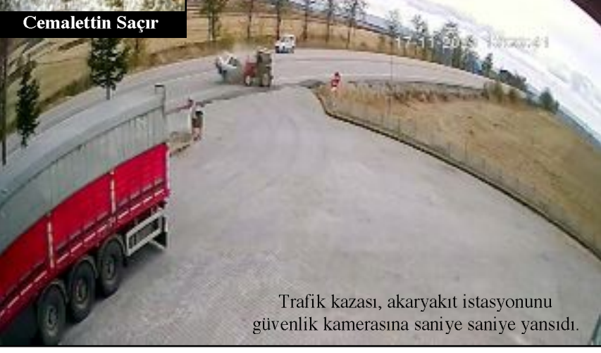
Trafik kazası, akaryakıt istasyonunu güvenlik kamerasına saniye saniye yansıdı.