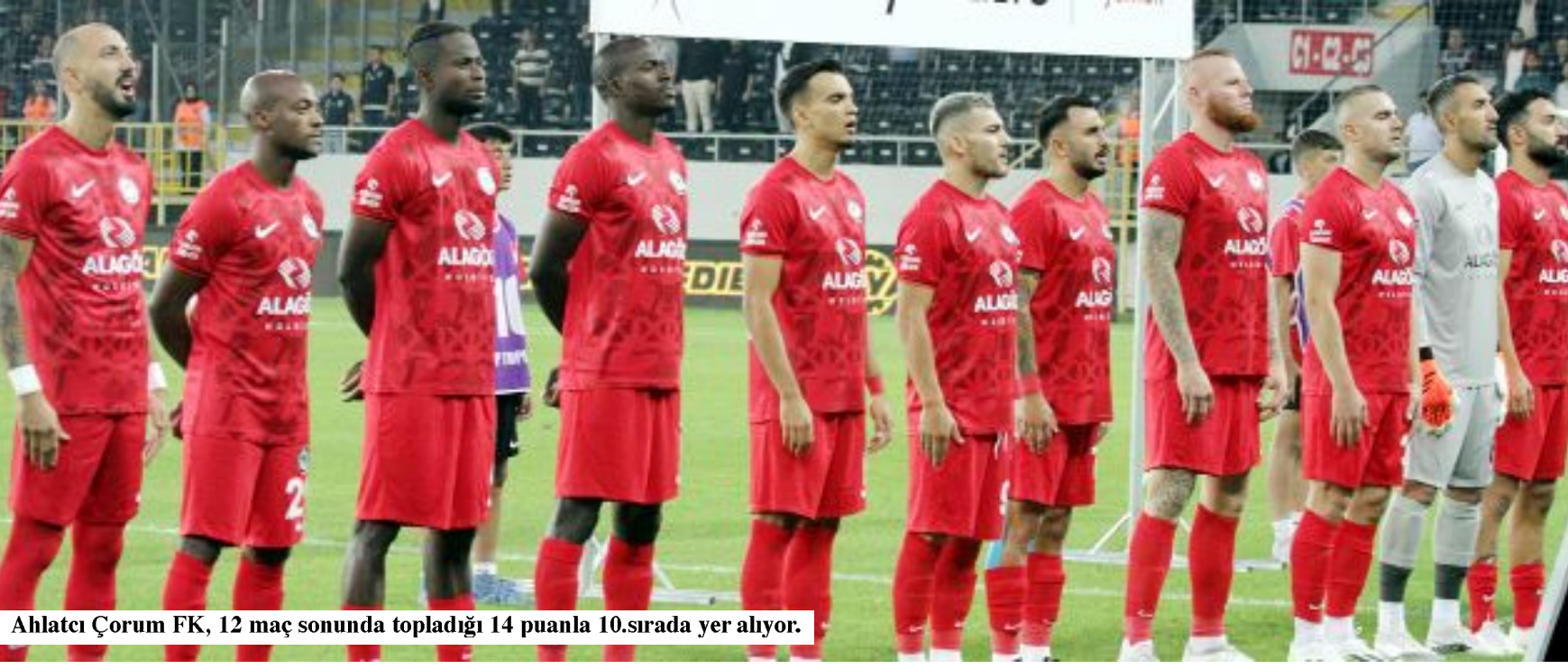
Ahlatcı Çorum FK, 12 maç sonunda topladığı 14 puanla 10.sırada yer alıyor.