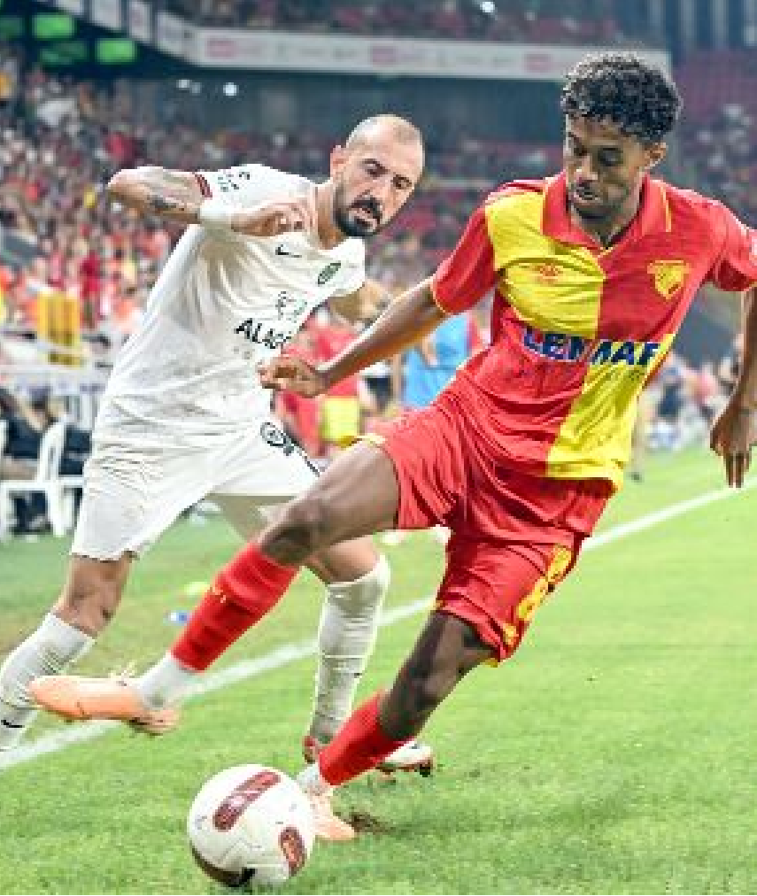
Ahlatcı Çorum FK, puan sıralamasında, üzerinde yer alan takımlardan Göztepe'yi deplasmanda 2-1, Sakaryaspor'u evinde 1-0 yenerken, Bandırmaspor'la deplasmanda 0-0 berabere kalarak 7 puan aldı.

Ahlatcı Çorum FK, düşme hattında bulunan Giresunspor'a evinde 2-0 yenilirken, deplasmanda Tuzlaspor'u 3-0 mağlup etti. Kırmızı-siyahlı takım, sıralamada altında yer alan takımlardan Ümraniyespor'u deplasmanda 3-0 yenerken, deplasmanda Manisa FK ile 2-2 berabere kaldı. (Hüseyin AŞKIN)