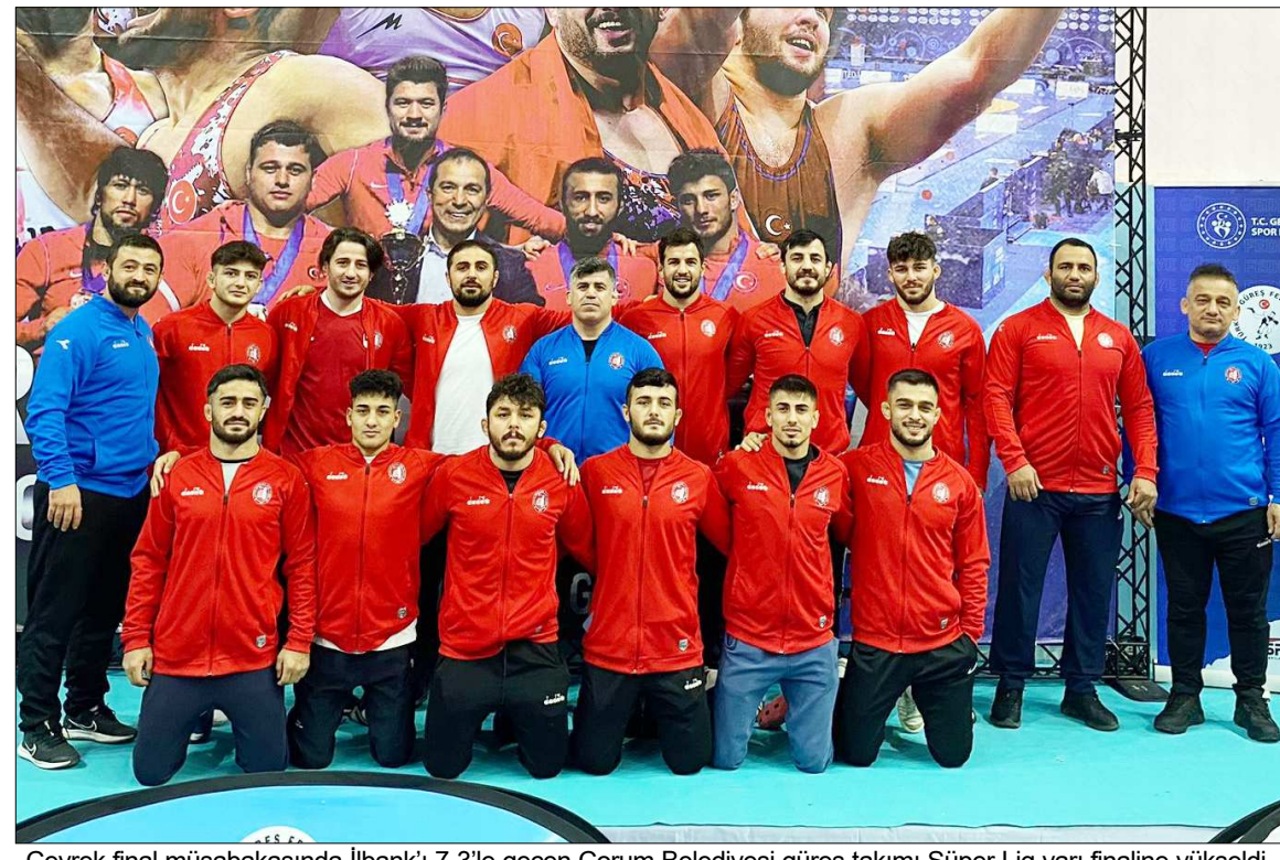
Çeyrek final müsabakasında İlbank'ı 7-3'le geçen Çorum Belediyesi güreş takımı Süper Lig yarı finaline yükseldi.

Çorum Belediyesi'nin güreşçileri Süper Lig mücadelesinde Yozgat'ı salladı. Çorum temsilcisi çeyrek final maçında İlbank'ı yenerek yarı finallere adını yazdırdı.