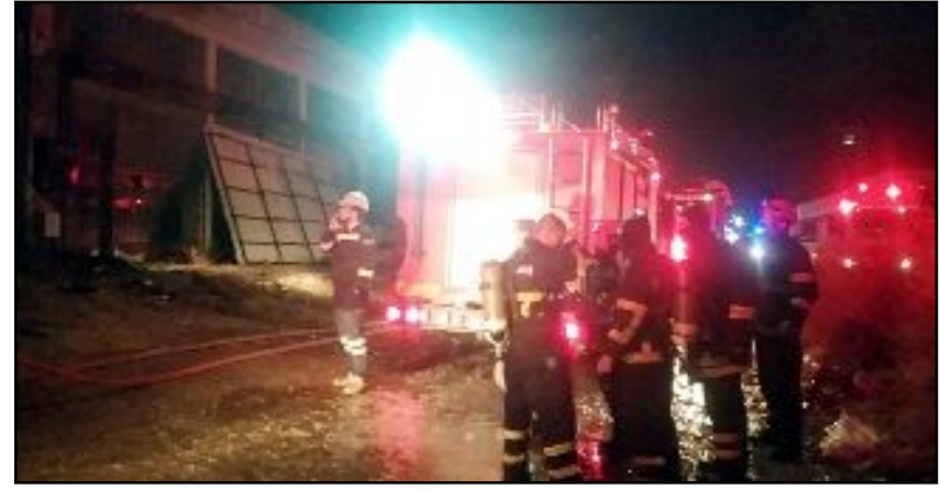
Yanan dükkanlar Çorum Belediyesi İtfaiye ekiplerinin müdahalesiyle söndürüldü.

Çorum'da kullanılmayan iki ayrı işyerinde çıkan yangın itfaiyesinin müdahalesiyle söndürüldü.