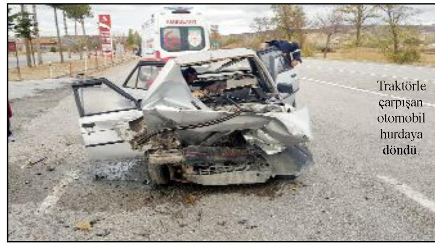
Traktörle çarpışan otomobil hurdaya döndü.

● Çorum'un Alaca ilçesi yakınlarında meydana gelen trafik kazasında, 1 kişi hayatını kaybederken 1 kişi de yaralandı.