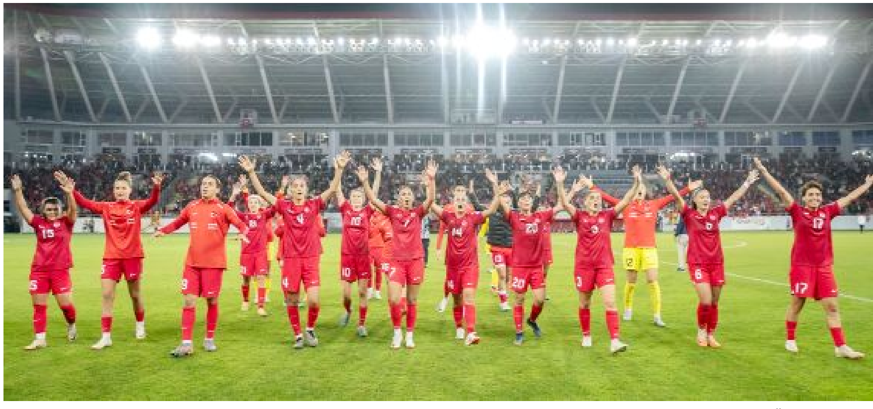
Milli takımımız, maçtan sonra sevinçlerini taraftarlarla paylaşırken, rekor kırarak kendilerine destek olan Çorumlulara teşekkür ettiler.