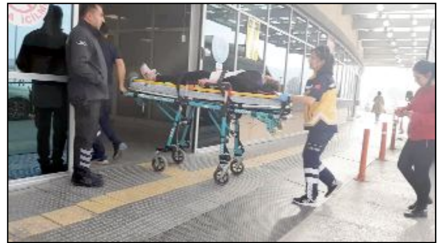
Yaralılar sağlık ekiplerince yapılan müdahalenin ardından Hitit Üniversitesi Erol Olçok Eğitim ve Araştırma Hastanesi'ne kaldırıldı.

Kazada 19 TP877 plakalı araç sürücüsü ile araçta yolcu olarak bulunan S.T. ve F.T. yaralandı. Yaralılar sağlık ekiplerince yapılan müdahalenin ardından Hitit Üniversitesi Erol Olçok Eğitim ve Araştırma Hastanesi'ne kaldırıldı. (Tugay GÖKTÜRK)