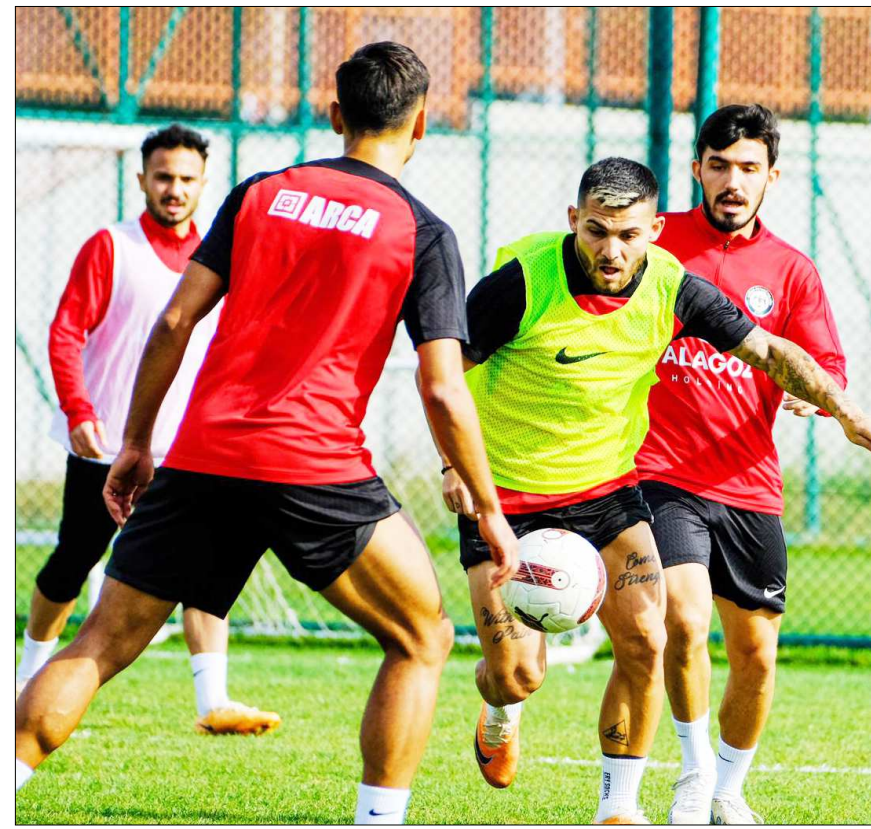
Dün tesislerde gerçekleşen antrenmandan bir fotoğraf...

Hafta sonu sahasında Keçiöregücü'nü ağırlayacak olan Ahlatcı Çorum FK'da hazırlıklar dün yapılan antrenman ile devam etti.