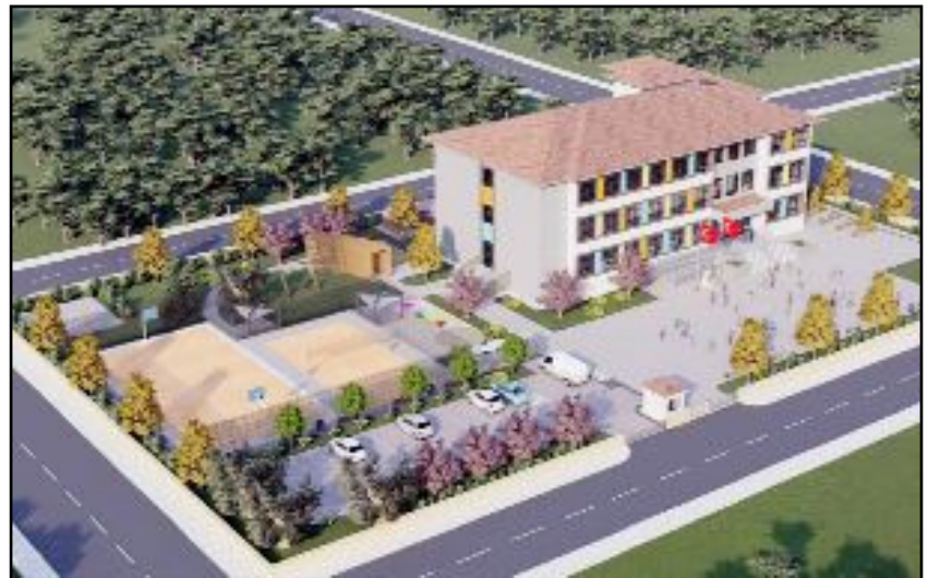
Kargı'da yapılacak olan okulun projesi de hazırlandı.