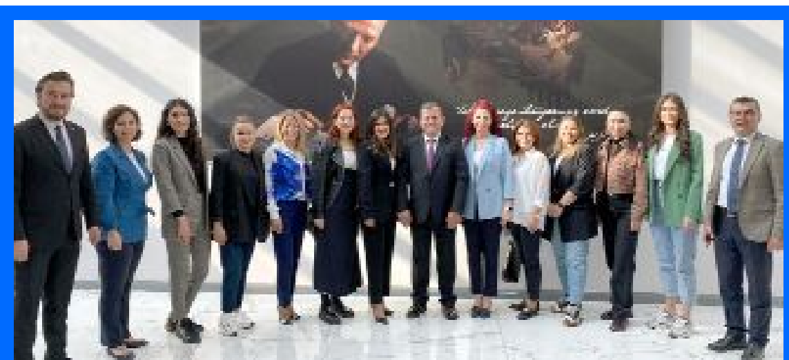
Çorum TSO'da TOBB İl Kadın Girişimciler Kurulu ile TOBB İl Genç Girişimciler Kurulları İcra Komitesi seçimleri gerçekleştirildi.

Kadın ve Genç Girişimci Kurulları seçimi yapıldı