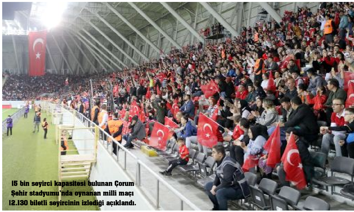
15 bin seyirci kapasitesi bulunan Çorum Şehir stadyumu'nda oynanan milli maçı 12.130 biletli seyircinin izlediği açıklandı.

doldurdu. Toplam 12.130 biletli seyirci maça gelerek rekorun yeni sahibi oldu. ÇORUMLULARA TEŞEKKÜR Türkiye Futbol Federasyonu olarak rekor kıran Çorum halkını kutlar; verdikleri büyük destekler için teşekkür ederiz" ifadeleri kullandı. Önceki seyirci rekoru, Kadın A Milli Futbol Takımımızın UEFA Uluslar C Ligi 2.Grup'ta Elazığ'da Litvanya ile oynadığı ve 2-0 kazandığı 2.hafta maçında Elazığ'a aitti. O karşılaşmayı 6.500 biletli seyirci izlemişti. (Hüseyin AŞKIN)