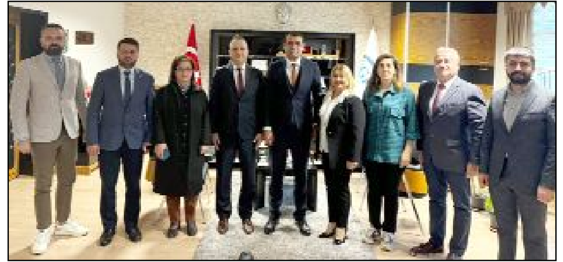
Eczacı Odası heyeti, SGK İl Müdürlüğü'nü ziyaret etti.

ÇORUM HABER, merhuma Allah'tan rahmet, ailesine ve yakınlarına başsağlığı diler. (Haber Merkezi)