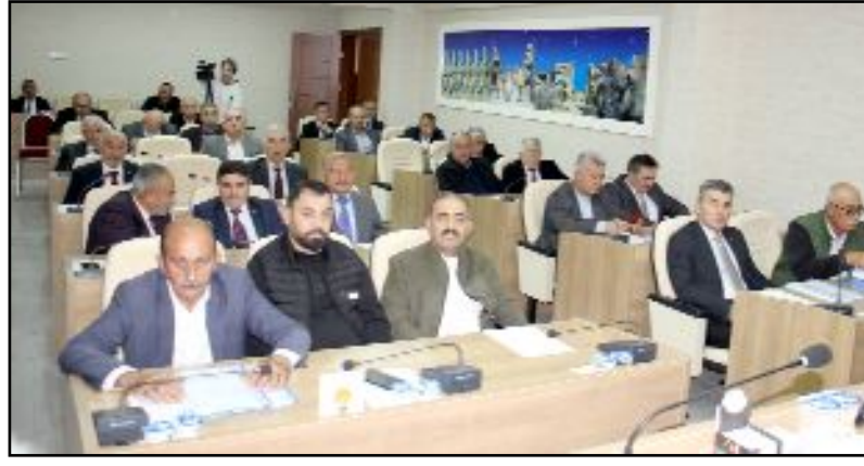
İl Genel Meclisi üyeleri 2024 yılı bütçe görüşmelerine dün düzenlenen toplantı ile başladı.