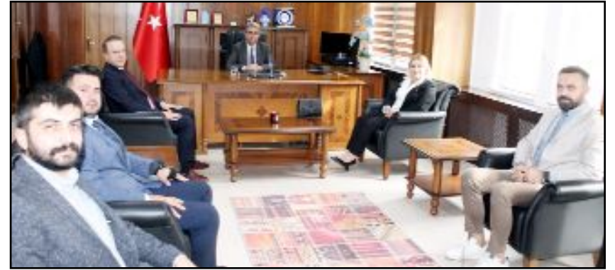
Eczacılar, Defterdarlık ve Sağlık Müdürlüğü'nü ziyaret etti.