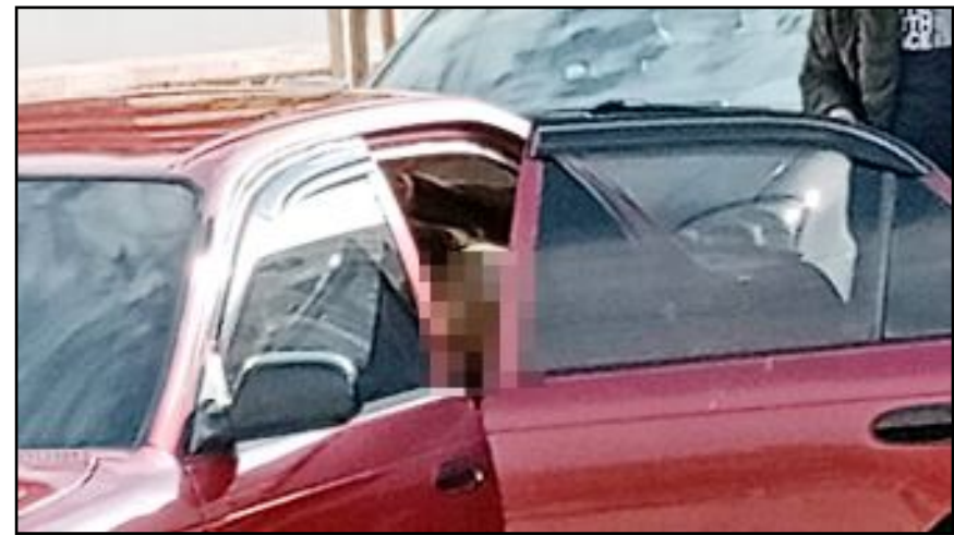
Olay Kale Mahallesi Lozan Evler Parkı yakınındaki bir araçta yaşandı.

Olayın iddialara göre araç satışıyla ilgili bir anlaşmazlıktan kaynaklandığı öğrenildi. (Tuğay GÖKTÜRK)