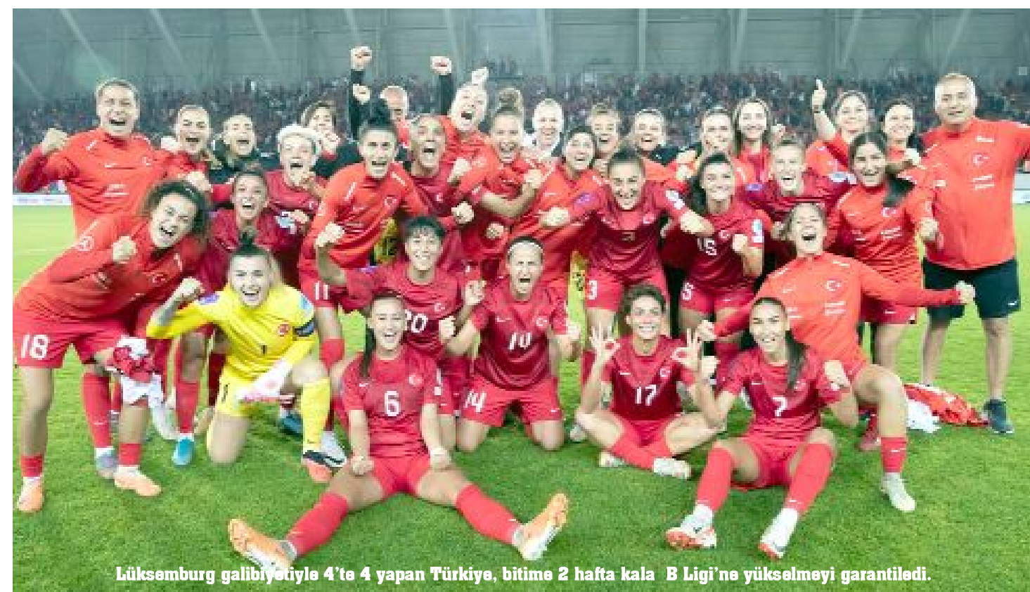
Lüksemburg galibiyetiyle 4'te 4 yapan Türkiye, bitime 2 hafta kala B Ligi'ne yükselmeyi garantiledi.

UEFA Uluslar C Ligi 2.Grup'ta mücadele eden Türkiye Kadın A Milli Futbol Takımı, 4.hafta maçında, Çorum'da karşılaştığı Lüksemburg'u 1-0 yenerek 4'te 4 yaptı. Türkiye'ye galibiyeti getiren golü 14.dakikada Birgül Sadıkoğlu atarken, millilerimiz bitime 2 hafta kala B Ligi'ne yükselmeyi garantiledi.