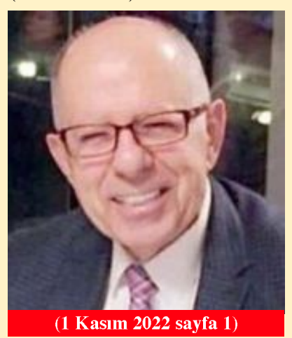
(1 Kasım 2022 sayfa 1)

seçilen Ateş Amiklioğlu, siyasete atılmadan önce Çalışma ve Sosyal Güvenlik Bakanlığı Müsteşarı idi. (Haber Merkezi)