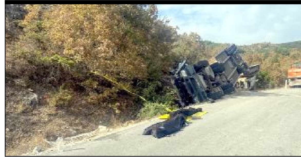
Kargı'da iş makinesi taşıyan TIR'ın devrilmesi sonucu İl Özel İdaresi'nde görevli 2 işçi hayatını kaybetti.