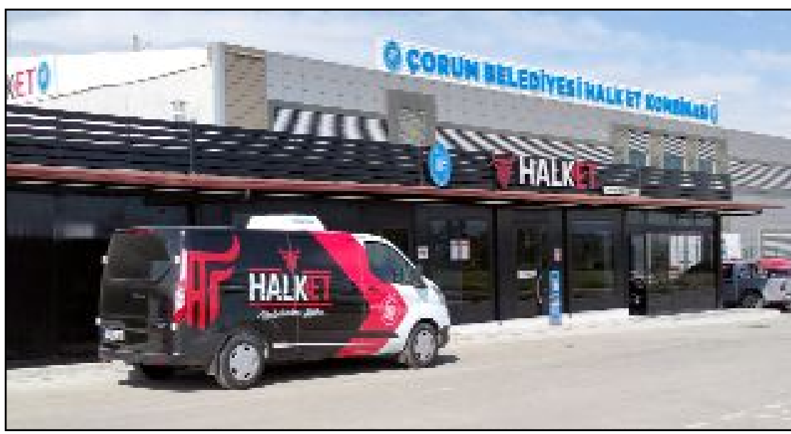
Halk Et, Helal Kesim, Helal Gıda ve İSO Gıda Güvenliği sertifikalarıyla kalitesini tescilledi.