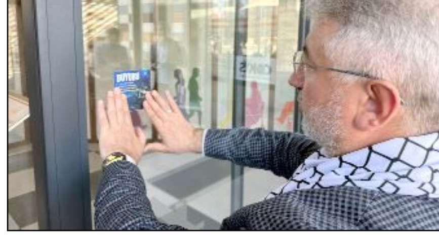
Çorum Belediyesi, sosyal tesislerinde artık İsrail menşeli ürünlere yer vermeyecek.

Çorum Belediyesi'nin şehrin 8 farklı bölgeğinde bulunan sosyal tesislerde artık İsrail menşeli hiçbir ürüne yer vermeyeceklerini açıklayan Aşgın, "Sosyal tesislerimizin tamamında yerli ve milli ürünler kullanılacak. Hiçbir şekilde İsrail menşeli ürün kullanılmayacak, servis edilmeyecek. Eli çocuk