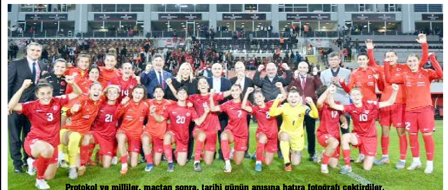
Protokol ve milliler, maçtan sonra, tarihi günün anısına hatıra fotoğrafı çektirdiler.