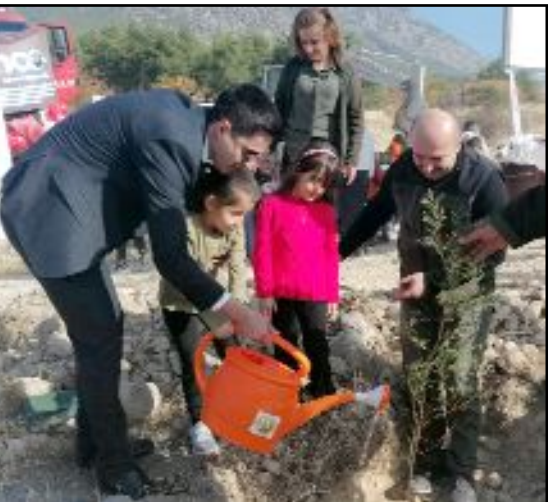
Kargı'da minikler, fidanları toprakla buluşturdu.

Kargı, fidan diktikleri için okul yönetimi ve öğrencilere teşekkür etti. (AA)