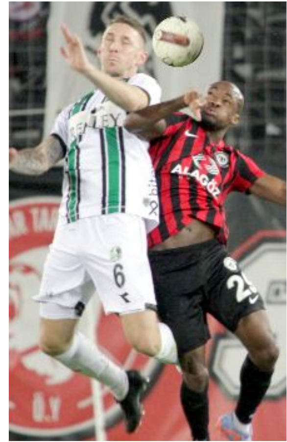
Ahlatcı Çorum FK, bu sezon sahasındaki tek galibiyetini Sakaryaspor'u 1-0 yenerek aldı.

Türkiye Futbol Federasyonu Hukuk Müşavirliği, Boluspor'u, Bodrumspor maçında taraftarların neden olduğu "çirkin ve kötü tezahürat", Altay'ı, Sakaryaspor maçındaki "saha olayları"nın yanı sıra "çirkin ve kötü tezahürat", Tuzlaspor'u, Erzurumspor maçında "talimatlara aykırı hareket", Eyüpspor'u da Bandırmaspor maçında "çirkin ve kötü tezahürat" ile "talimatlara aykırı hareket" nedeniyle PFDK'ya sevk etti. Eyüpspor Teknik Direktörü Arda Turan "talimatlara aykırı hareket", antrenör Atilla Gergin "sportmenliğe aykırı hareketi", Sakaryaspor Teknik Direktörü Tuncay Şanlı da "sportmenliğe aykırı hareketi" nedeniyle PFDK'ya sevk edildi. (Hüseyin AŞKIN)