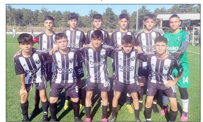
Çorum Anadolu FK 6 puanla liderlik koltuğuna oturdu.

GOLLER: Dk.12 Uygur, Dk.23 Mustafa (Mimar Sinan), Dk.30 M.Buğra (Hattuşa).