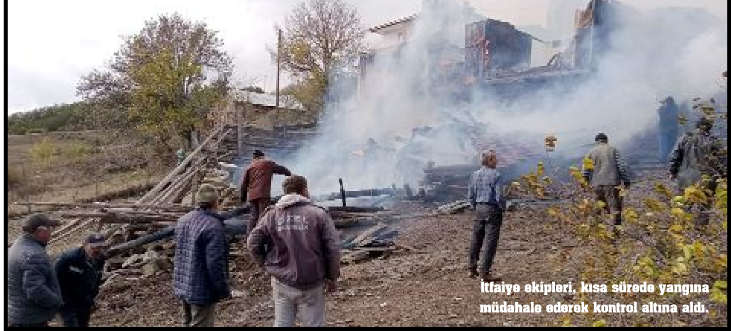
İtfaiye ekipleri, kısa sürede yangına müdahale ederek kontrol altına aldı.

Çorum'un İskilip ilçesine bağlı Aşağı Şeyhler Köyünde çıkan yangında ev ve samanlık yandı.