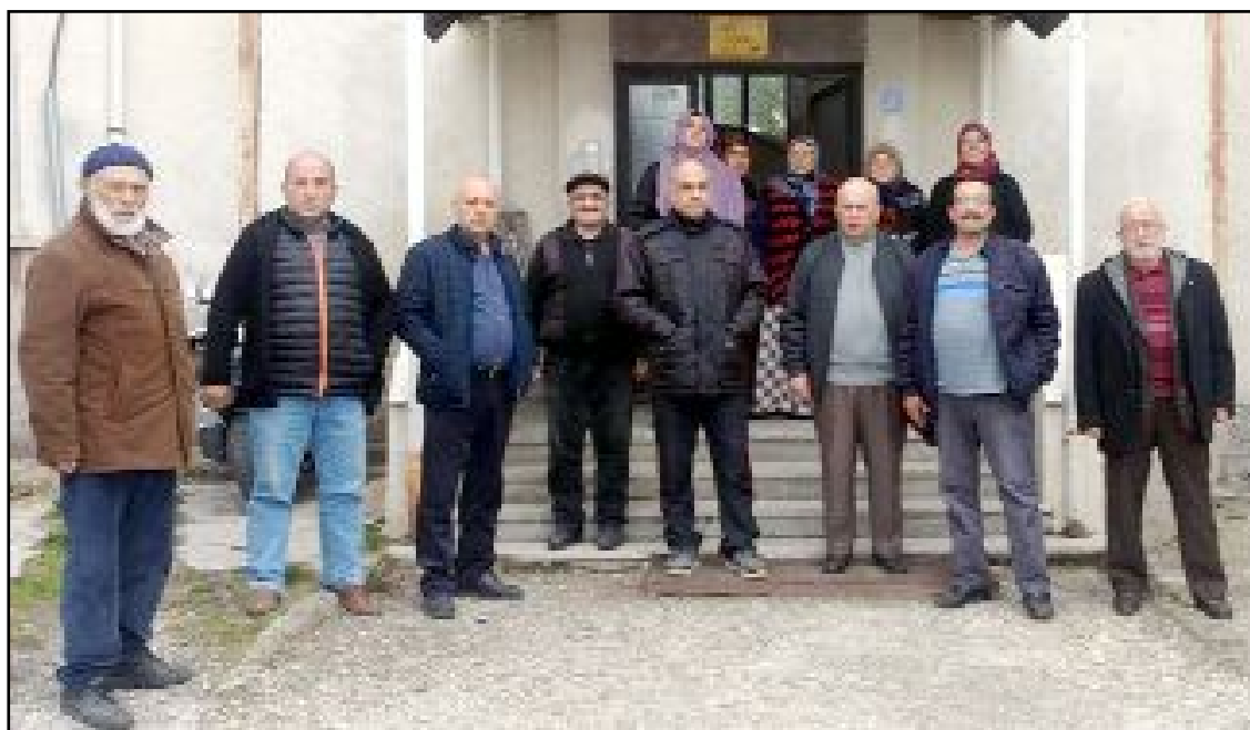
Binevler 130. Sokak'ta yer alan Şahin Apartmanı sakinleri, 40 yıllık binalarını yenileyebilmek için Çorum Belediyesi'nden imar değişikliği talep ediyor.