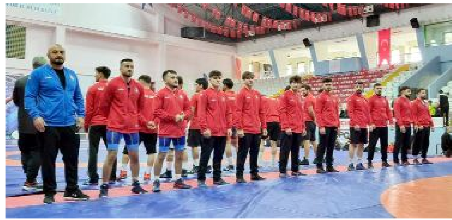
Bir galibiyet, iki yenilgi alan Çorum Belediyesi Grekoromen Güreş Takımı, yeni sezonda da Süper Lig'de yolna devam edecek.