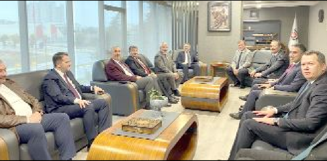
TSO Başkanı Çetin Başaranhıncal, Sanayi ve Teknoloji Bakan Yardımcısı hemşehrımız Zekeriya Coştu’yu ağırladı.

Çorum’da sanayici ve işadamlarının temsilcisi olan TSO Başkanı Başaranhıncal ile biraraya gelmekten duyduğu memnuniyeti dile getirerek evsahipliği için teşekkür eden Sanayi ve Teknoloji Bakan Yardımcısı Coştu ise ilimizin gönlünde kapanmayan bir sevdâ olduğunu vurguladı.