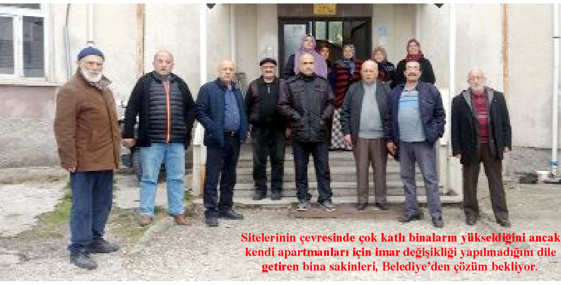
Sitelerinin çevresinde çok katlı binaların yükseldiğini ancak kendi apartmanları için imar değişikliği yapılmadığını dile getiren bina sakinleri, Belediye'den çözüm bekliyor.

● Binevler 130. Sokak'ta yer alan Şahin Apartmanı sakinleri, 40 yıllık binalarını yenileyebilmek için Çorum Belediyesi'nden imar değişikliği talep ediyor. •5'de