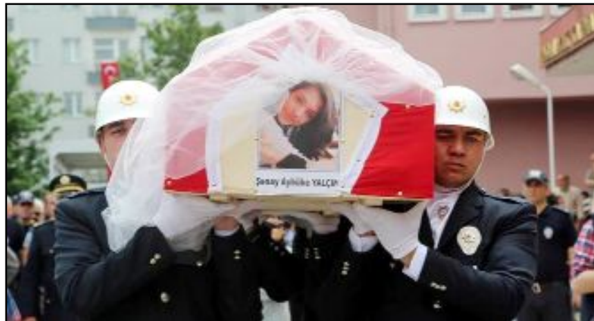
Şenay öğretmenin hayatını anlatan film bu hafta vizyona giriyor.