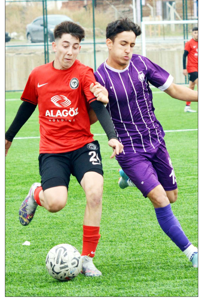
Çorum FK-Afyonspor maçından bir enstantane...

mil Çağlar'ın yanı sıra şube müdürleri katıldı. Yaklaşık 2 saat süren toplantıda faaliyetler ele alınırken, uygulanacak kurallar da şube müdürlerine aktarıldı. (Rifat KARA)