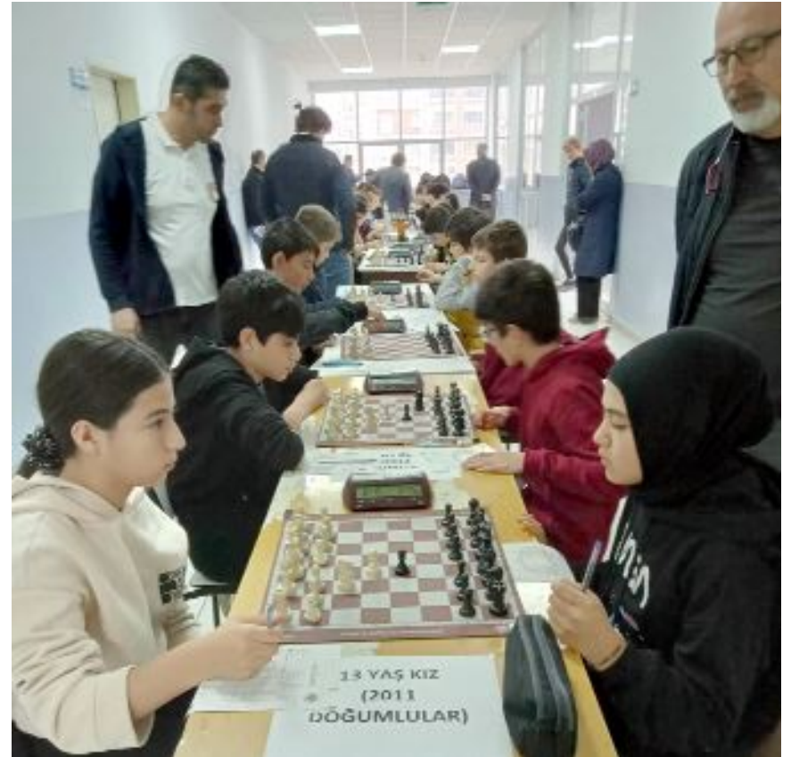
Necip Fazıl Kısakürek Ortaokulu'nda düzenlenen il birinciliğinde, 7 kategoride 46 sporcu mücadele etti.

İl temsilcisi Ertan Çotur, derece yapan sporcuları tebrik etti. (Hüseyin AŞKIN)