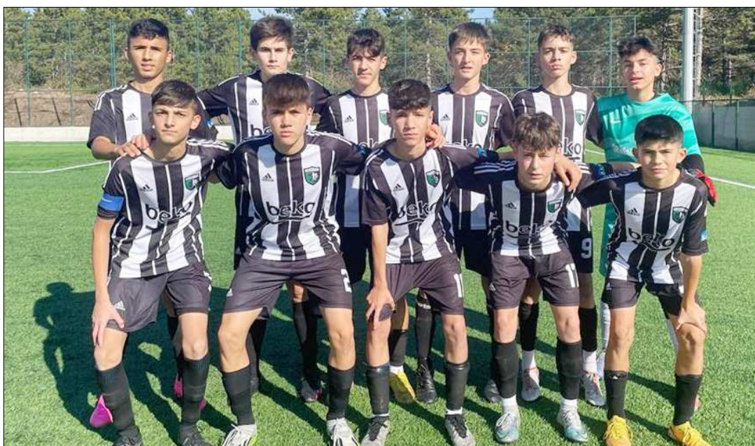
Şampiyon Çorum Anadolu FK kupasını 1 Aralık Cumartesi günü düzenlenecek törenle alacak.

Bu sonuçların ardından Play-Off grubunda oynadığı 6 karşılaşmanın tümünü kazanan Çorum Anadolu FK yenilgisiz şampiyonluğa uzanırken, Hattuşa Gençlikspor 9 puanla ikinci, Mimar Sinan ise 7 puanla üçüncü olmayı başardı. Maviay Gençlikspor ise 1 puanla dördüncülüğü elde etti. (Rifat KARA)