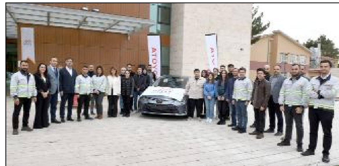
Mesleki eğitim uygulamalarına ve gelişen teknolojiyi yakından takip etmelerine olanak sağlayacak araç, düzenlenen törenle teslim edildi.