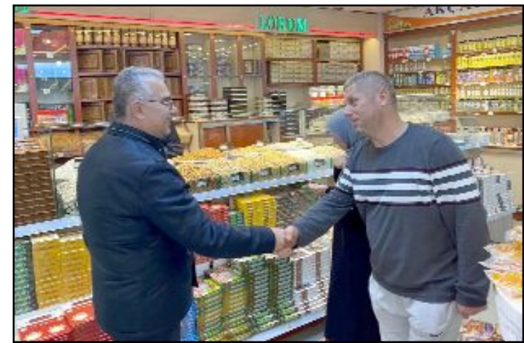
AK Parti Çorum Milletvekili Yusuf Ahlatcı, esnaf ziyaretlerini sürdürüyor.