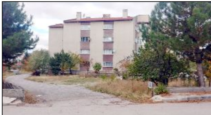
Sitelerinin çevresinde çok katlı binaların yükseldiğini ancak kendi apartmanları için imar değişikliği yapılmadığını dile getiren bina sakinleri, Belediye'den çözüm bekliyor.

takip etmesini talep ediyoruz." diye konuştu. ((Nurdan AKBAŞ))