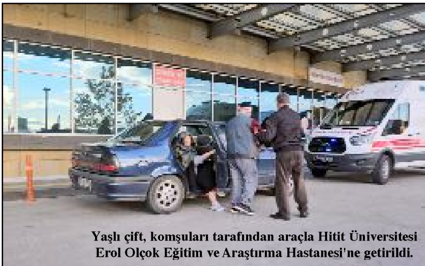
Yaşlı çift, komşuları tarafından araçla Hitit Üniversitesi Erol Olçok Eğitim ve Araştırma Hastanesi'ne getirildi.

Vücutlarının çeşitli yerlerinden yaralanan karı-koca, tedavi altına alındı. (AA)