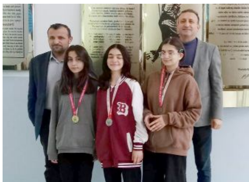
Kategorilerinde dereceye giren sporcular madalya ile ödüllendirildi.