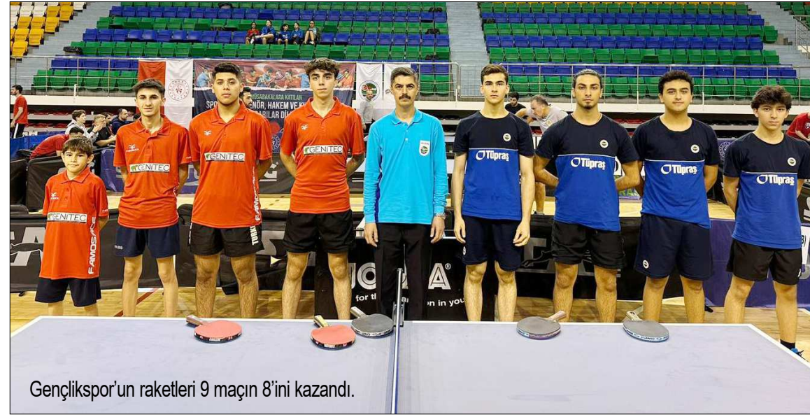
Gençlikspor'un raketleri 9 maçın 8'ini kazandı.