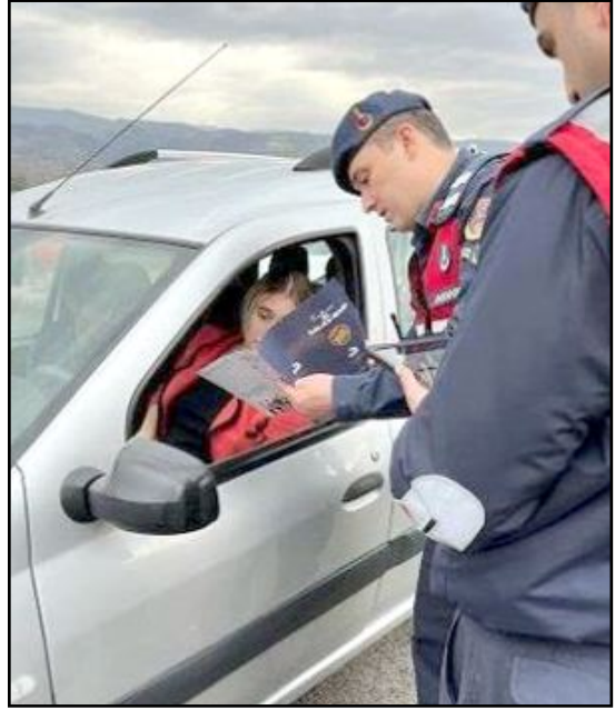
Jandarma ekipleri, KADES uygulaması hakkında bilgilendirme yaptı.

kurum ve kuruluşlarla birlikte Velipaşa Hanı'nda stant açan Jandarma, il genelinde kadına yönelik şiddetle mücadele kapsamında da KADES (Kadın Destek Sistemi) uygulaması hakkında bilgilendirme yaptı. (Haber Merkezi)