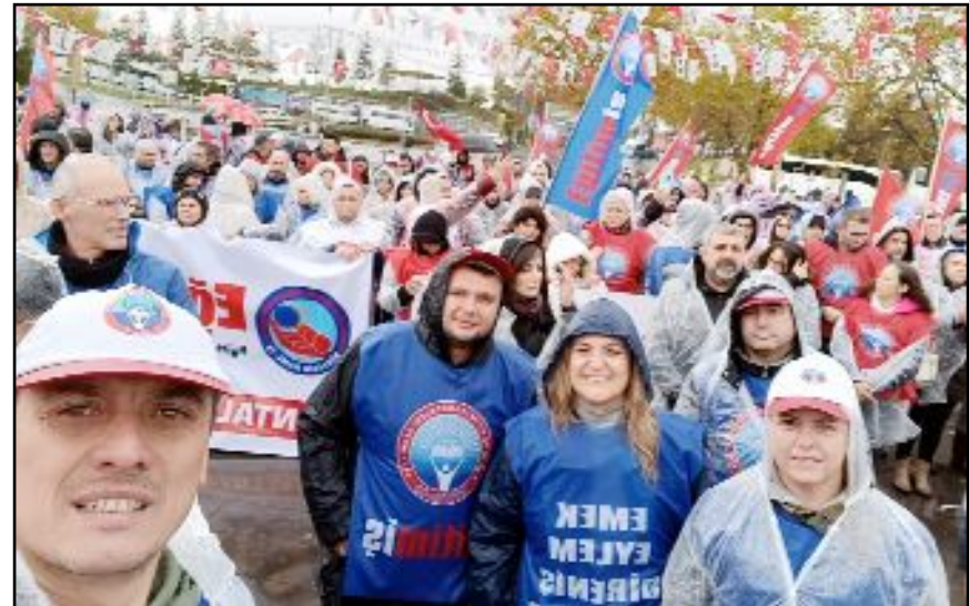
Eğitim-İş üyeleri ayrıca Ankara'da Anıtkabir'i de ziyaret etti.

istiyoruz! Öğretmenlere ve eğitim çalışanlarına yönelik şiddetin önüne geçecek önlemler alınmasını talep ediyoruz! Her şeyden önemlisi meslek onurumuzu geri istiyoruz!" (Haber Merkezi)