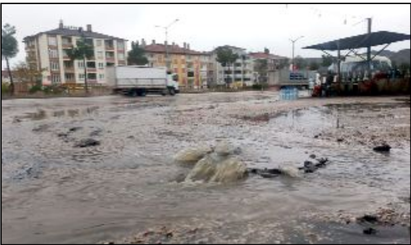
Yağışlar sonucunda taşan rögar nedeniyle karayolu su altında kaldı.

Osmancık'ta önceki gün yaşanan şiddetli fırtına ve aşırı yağışlar dere yatağında heyelana yol açtı.