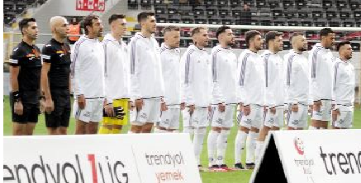
Lig sonuncusu Altay, genel tabloda olduğu gibi iç saha puan cetvelinde de son sıraya geriledi.

Ahlatacı Çorum FK, 13 maçta 5 galibiyet, 2 beraberlik, 6 yenilgi alırken, topladığı 17 puanın 6'sını evinde, 11'ini ise deplasmanda aldı. Kırmızı-siyahlı takım 13 maçta attığı 20 gole karşılık kalesinde 16 gol gördü. (Hüseyin AŞKIN)