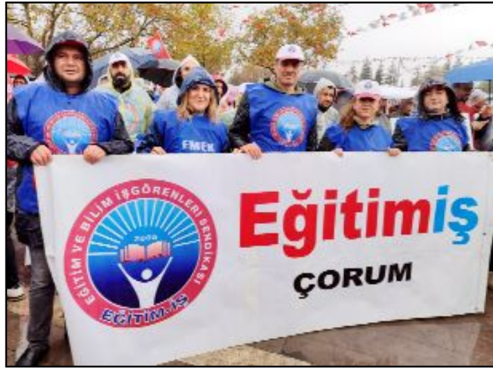
Eğitim-İş Çorum Şubesi yönetici ve üyeleri Çorum'daki eylemlerinin ardından Ankara'da düzenlenen kitlesel eyleme de geniş şekilde katıldı.