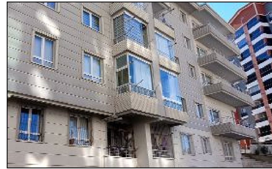
Olay, Mamak'ın Fahri Korutürk Mahallesi 921. Sokak'ta meydana geldi.

komşumuzdu. Aralarında ilişki olduğuna dair söylentiler duymuştuk. İkisi de evliydi. Öldürülenin üç, saldırganın da iki çocuğu vardı" ifadelerini kullandı (İHA)