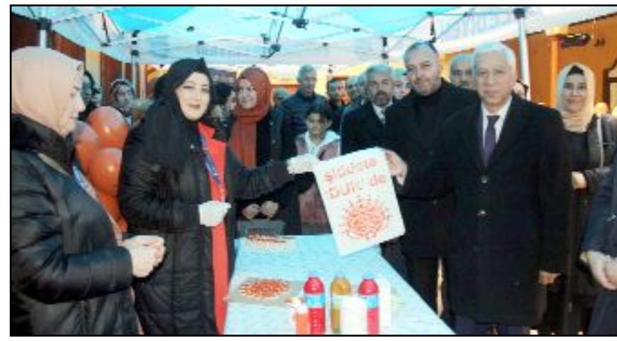
25 Kasım Kadına Yönelik Şiddetle Mücadele kapsamında Çorum'da farkındalık etkinliği gerçekleştirildi.

İlçe ziyaretlerinde yaptığı incelemeler ve tespitler hakkında da açıklamalarda bulunan Vali Dağlı, "Sanayi sektöründe yeni yatırımların teşvik edilmesi, kamu-üniversite-sanayi iş birliğinin artırılması, mevcut sanayi tesislerinin modernizasyonu ve teknolojiye uyum sağlanması, Ar-Ge projeleri ile katma değeri yüksek ileri teknoloji ürünlerin üretilmesi, sanayi üretiminin çeşitlendirilmesi, istihdam fırsatlarının artırılması, ilçelerimiz arasındaki iş birliği ve entegrasyonun artırılması gerekiyor. İlimiz için büyük bir öneme sahip tarım sektöründe, tarımın daha verimli hale getirilmesi için çiftçilerimizin desteklenmesi, sürdürülebilir tarım uygulamaları, tarım altyapısının güçlendirilmesi, tarımsal üretimin çeşitlendirilmesi ve sulanabilir tarım alanlarının artırılması, tarım ürünlerinin pazarlanması konusunda destekler sağlanmalı. 7 bin yıllık tarihi, doğal güzelliklerle kaplı coğrafyası, çok kültürlü yapısı, "Dünya Kültür Mirası Listesi'nde yer alan "Hattuşa Ören Yeri", Alacahöyük ve Şapınova gibi tarihi zenginlikleri ile bir turizm şehri olan Çorum'unuzu, tarih, doğa ve yayla turizmi gibi destinasyonlarla ulusal ve uluslararası arenada ön plana çıkararak daha geniş kitlelere tanıtmak üzere gerekli çalışmaların yapılmalı" ifadelerini kullandı. (İHA)