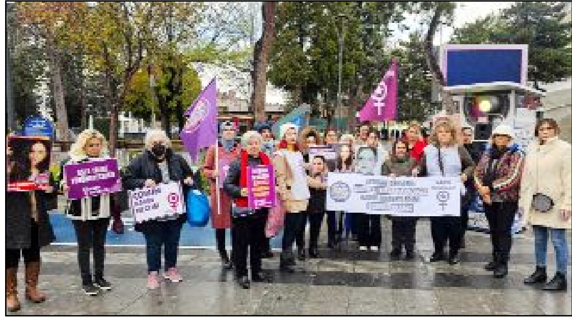
Kadın Meclisi üyeleri Saat Kulesi'nde kadına yönelik şiddete tepki gösterdi.