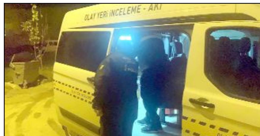
İhbar üzerine olay yerine ve hastane civarına çok sayıda polis ekibi sevk edildi.

Çorum'da kimliği belirsiz 5 kişi, husumetli oldukları şahsı bıçaklayarak otomobil ile hastaneye bıraktı.