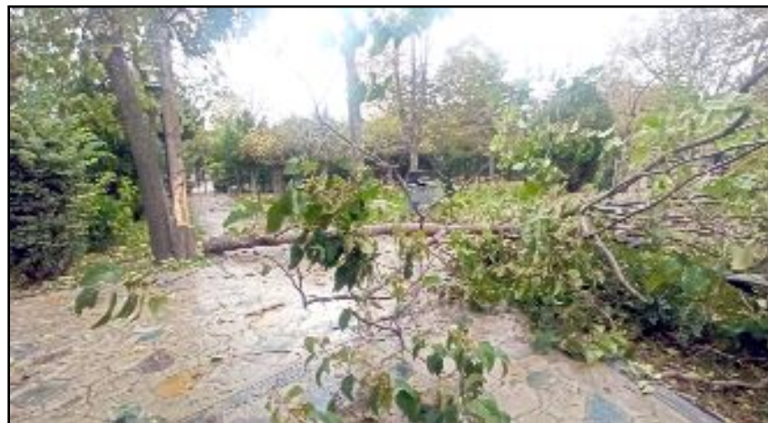
Sungurlu'da şiddetli rüzgar nedeniyle ağaçlar devrilirken, çöp konteynırları yerlerinden savruldu.

Sungurlu Belediyesi tarafından gün boyunca devam edecek kuvvetli rüzgar muhalefetine karşı dikkatli olunması gerektiği, yaşanacak herhangi olumsuzlukta Belediye Başkanlığı'na ulaşılması gerektiği hatırlatıldı. (İHA)