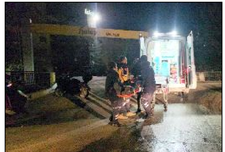
Yaralı sürücüsü sağlık ekiplerince yapılan müdahalenin ardından Hitit Üniversitesi Erol Olçok Eğitim ve Araştırma Hastanesi'ne kaldırıldı.

Buzlanma nedeni ile kayganlaşan yolda ölüm alındı. (Tuğay GÖKTÜRK)