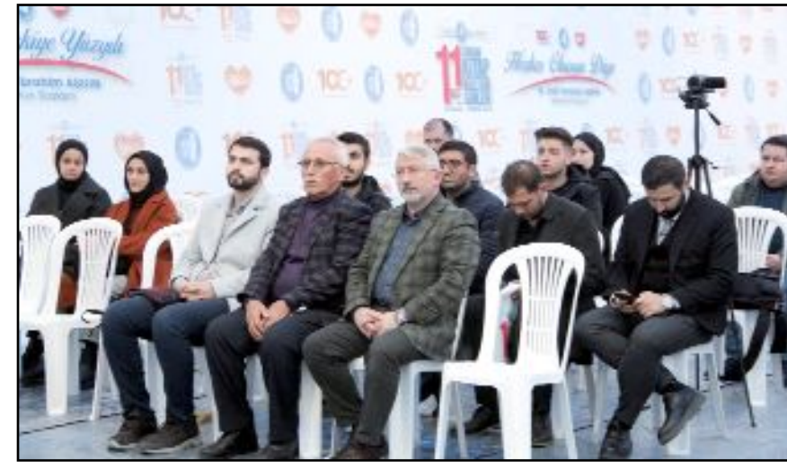
Çorum Belediyesi'nin düzenlediği Kitap Fuarı'na katılan müstafi Amiral Cihat Yaycı, İsrail'in Filistin'e yönelik saldırıları hakkında konuştu.

• Eğitimin maliyetini yüksek bulanlar, cehaletin faturasını ödeyemezler. ATATÜRK