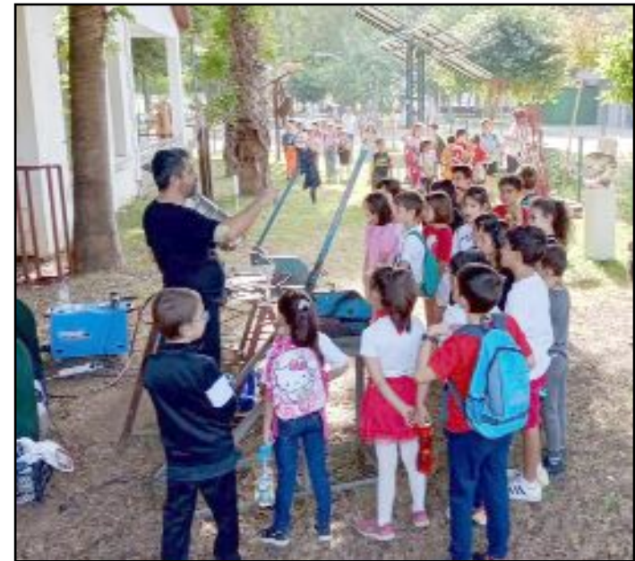
Metal heykel yapımına öğrencilerin büyük ilgisi...