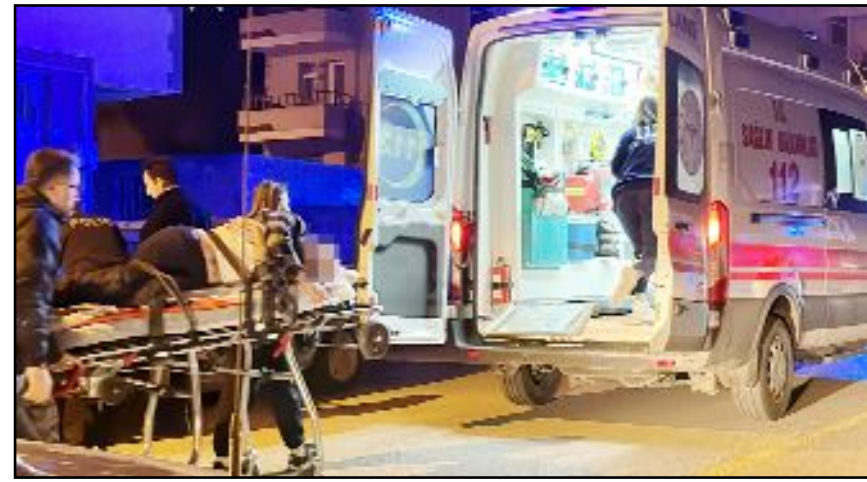
Kavgada yaralanan 4 kişi hastaneye kaldırıldı.

Öte yandan ağızlık olamadan sokağa çıkartılan ve 3 kişiyi yaralayan köpeğin sahibi tarafından olay yerinde kaçırıldığı, yaralı kadınların şikâyetçi oldukları öğrenildi. (Tuğay GÖKTÜRK)