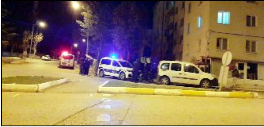
Olay Mimarsinan Mahallesi Mimarsinan 5. Caddede meydana geldi.