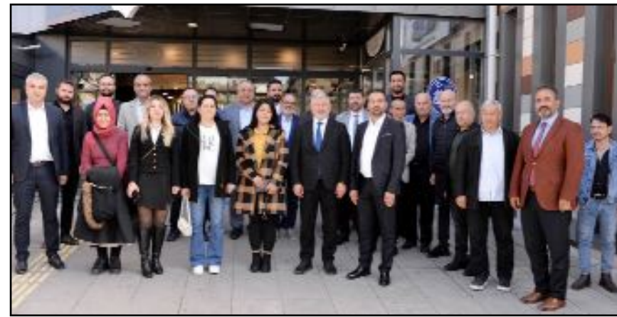
Dernek üyeleri, Atatürk Anıtı'ndaki törenin ardından Kadeş Barış Meydanı'nda bulunan Belediye Sosyal Tesisleri'nde hep birlikte kahvaltılı yaparak, hem sohbet ettiler, hem de dernek faaliyetlerinin planlamasını yaptılar.