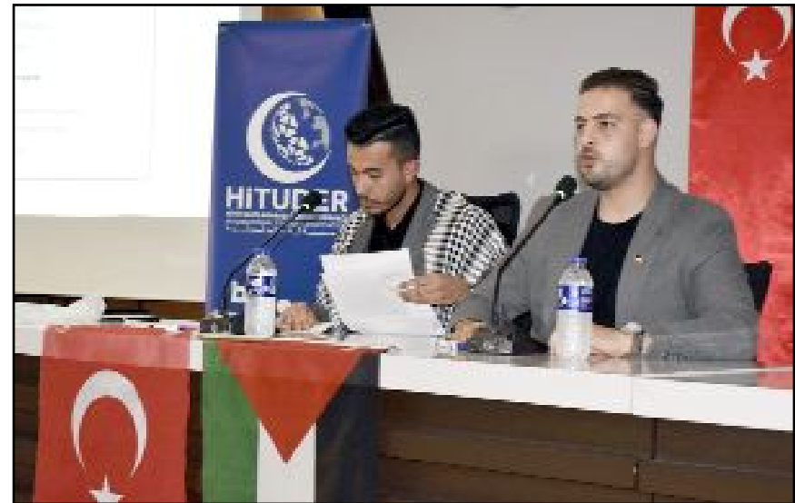
Turgut Özal Konferans Salonu'nda yapılan programda Hitit Üniversitesi'nde okuyan Filistinli öğrenciler, Gazze'de yaşananları ve Filistin sorununu anlattı.