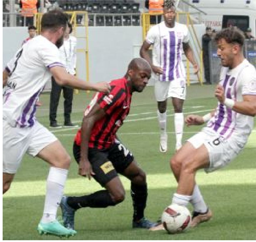
Ahlatcı Çorum FK, sahasında en son Ankara Keçiöregücü'ne 3-2 yenildi.

Ligin en başarılı iç saha takımı ise 6 maçta 5 galibiyet alan 15 puanlı Eyüpspor. Eyüpspor'u 13 puanla Bodrum FK izliyor. (Hüseyin AŞKIN)