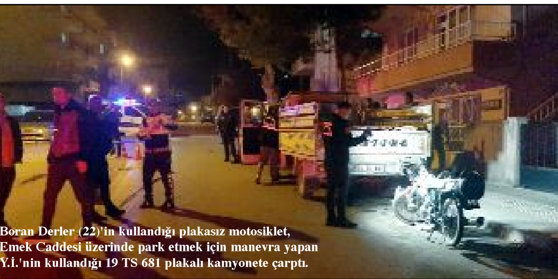
Boran Derler (22)'in kullandığı plakasız motosiklet, Emek Caddesi üzerinde park etmek için manevra yapan Y.İ.'nin kullandığı 19 TS 681 plakalı kamyonete çarptı.