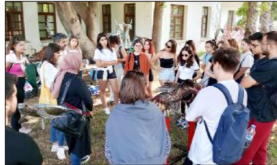
Antalyalıların ilgisi büyük...