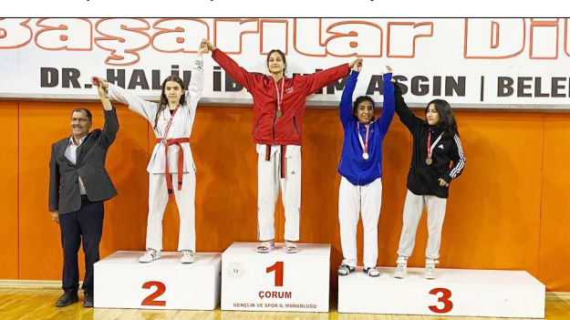
Dereceye giren sporcular madalya ile ödüllendirildi.

Gençlik ve Spor İl Müdürlüğü ile Tekvando İl Temsilciliği tarafından ortaklaşa düzenlenen Cumhuriyet Kupası Tekvando Turnuvası'nda heyecan sona erdi. Atatürk Spor Salonu'nda gerçekleştirilen müsabakalar minik ve yıldız olmak üzere 2 kategoride yapıldı. Miniklerde 130, yıldızlarda ise 45 sporcu mücadele etti.