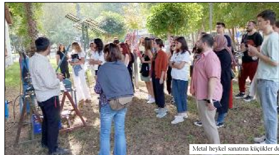
Metal heykel sanatına küçükler de büyükler de büyük ilgi gösteriyor...