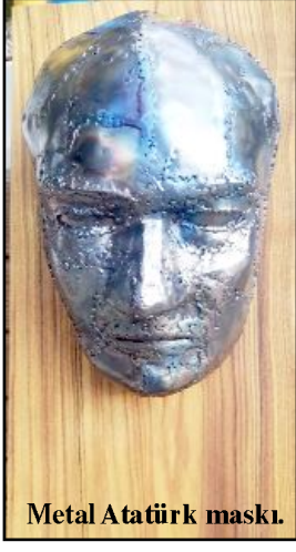
Metal Atatürk maski.

İzleyicilerin gözü önünde yapılan iki yeni çalışma, 29 Ekim günü