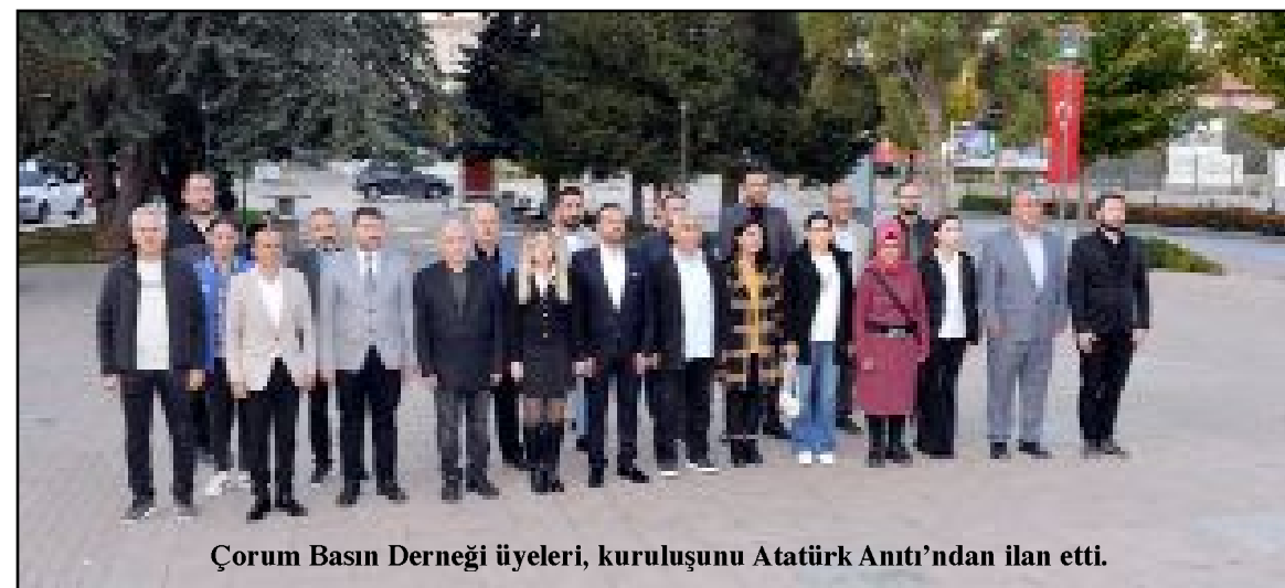
Çorum Basın Derneği üyeleri, kuruluşunu Atatürk Anıtı'ndan ilan etti.