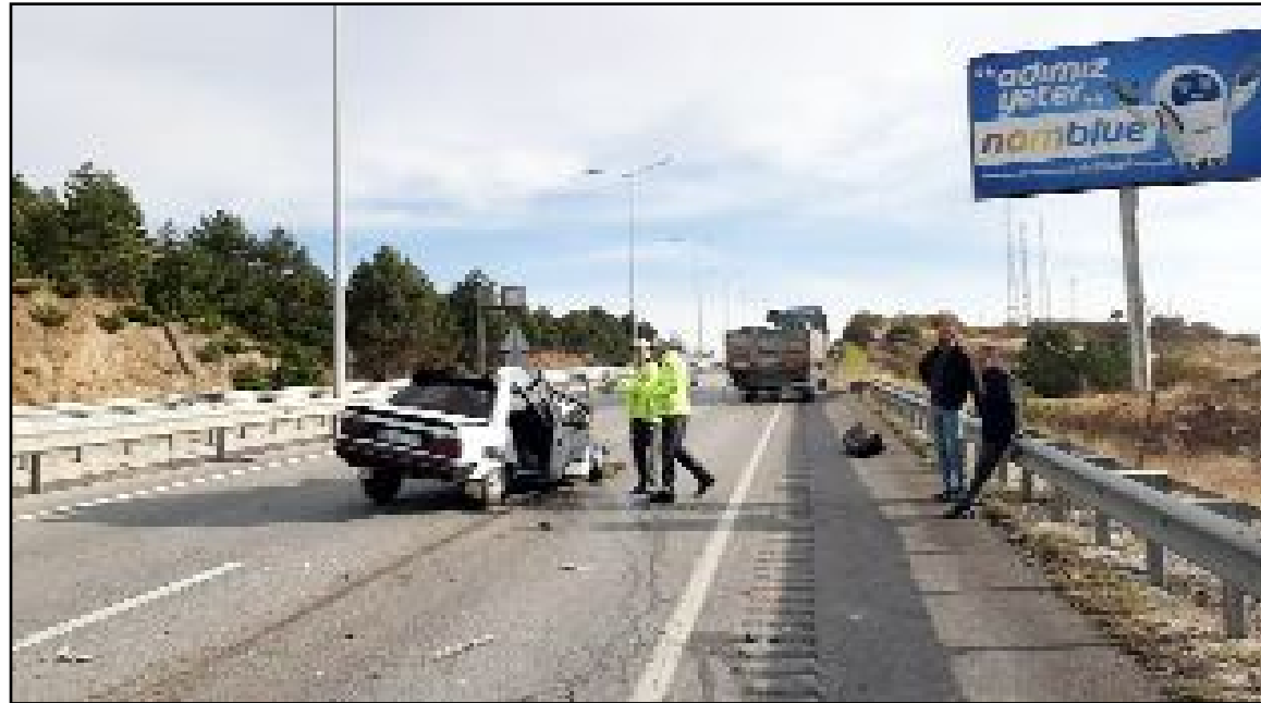
Kaza geçtiğimiz Cumartesi günü Samsun yolunda meydana gelmişti.

edildi. Sağlık ekiplerince yapılan kontrolde Durakoğlu'nun hayatını kaybettiği belirlendi. Jandarma ekiplerince yapılan olay yeri incelemesinin ardından Durakoğlu'nun cenazesi otopsi yapılmak üzere Hitit Üniversitesi Erol Olçok Eğitim ve Araştırma Hastanesi Morgu'na kaldırıldı. (Tugay GÖKTÜRK)