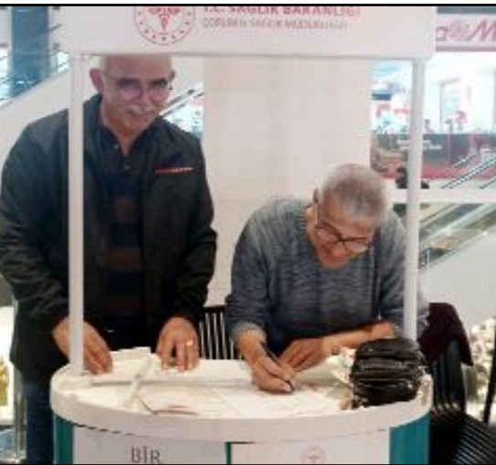
"Organ Bağış Haftası" kapsamında İl Sağlık Müdürlüğü tarafından AHL Park'ta stant açıldı.

Çorum İl Sağlık Müdürlüğü, Organ Bağış Haftası kapsamında bir dizi etkinlik gerçekleştirdi.