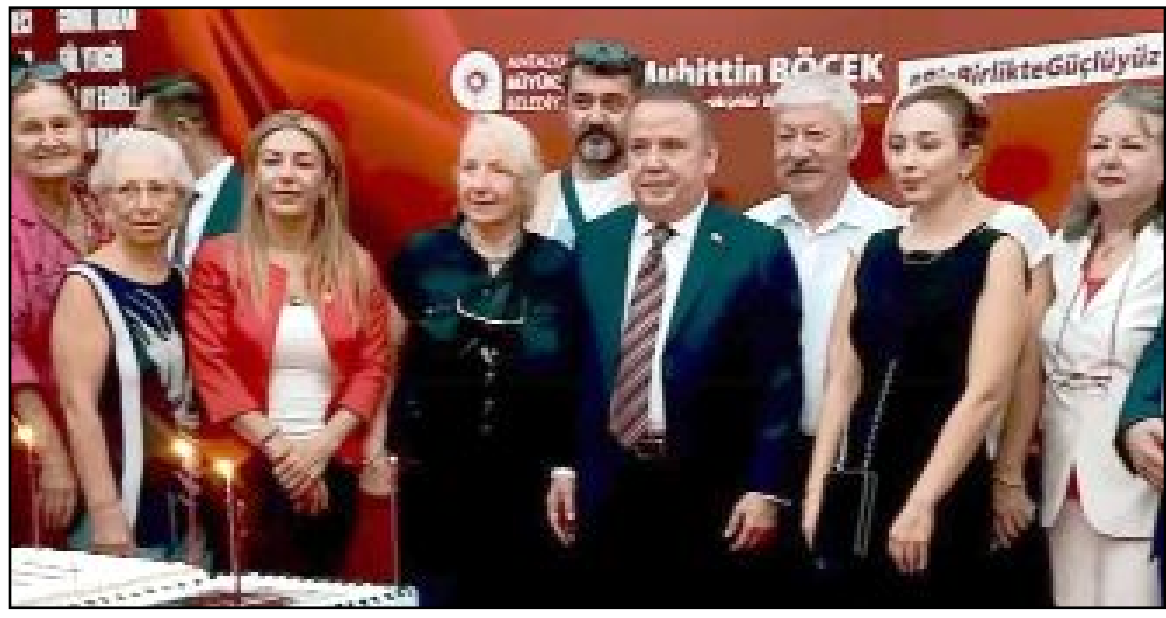
Mustafa Oktay, Antalya Büyükşehir Belediye Başkanı Muhittin Böcek ve önceki Büyükşehir Belediye Başkanı ve CHP Antalya eski Milletvekili, hemşerimiz Prof.Dr. Mustafa Akaydin'la...

tamamlanarak sürekli sergilenacağı Karaioğlu (Karaoğlu) parkındaki Antalya Büyükşehir Belediyesi Çevre Eğitimi ve İnovasyon Merkezi bahçesinde yerini aldı.