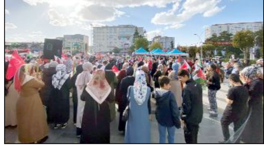
Çorum'da kadınlar, İsrail'in Gazze'ye yaptığı saldırılara tepki gösterdi.

ve Filistin'in özgürlüğüne kavuşması için dua da edildi.(AA)