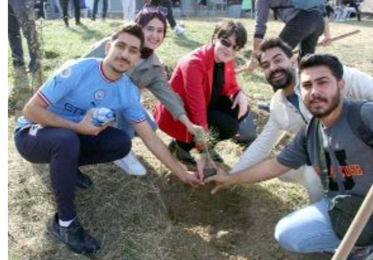
Öğrenciler, Cumhuriyet'in 100. yıl kutlamaları kapsamında "100. Yıla 100 Fidan" etkinliğinde 100 fidanı toprakla buluşturdu.