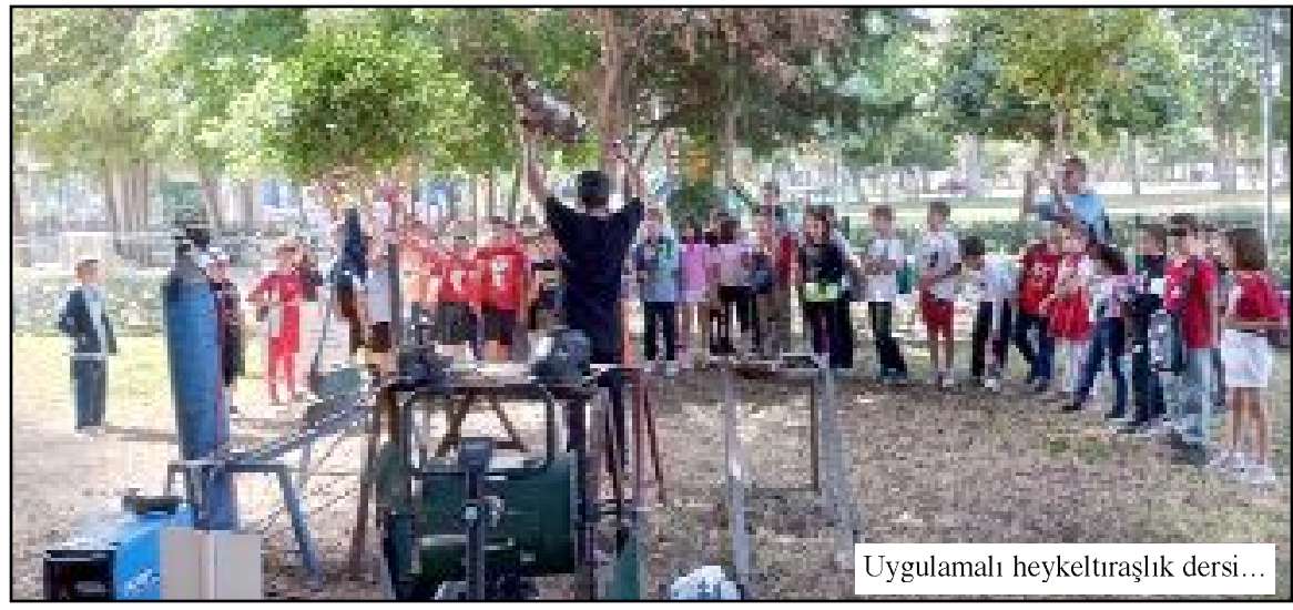
Uygulamalı heykeltıraşlık dersi...