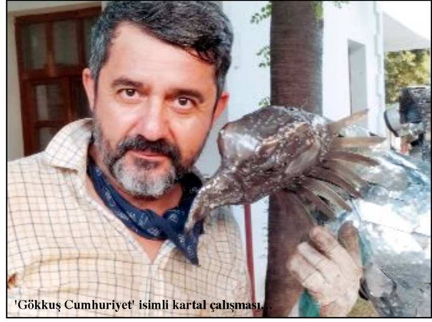
'Gökkuş Cumhuriyet' isimli kartal çalışması...

Metal heykellerin, bu büyüklükte, kalıpsız, spontane oluşturulması, önemli bir "sanat olayı" olarak da kayıtlara geçti. (Haber Merkezi)