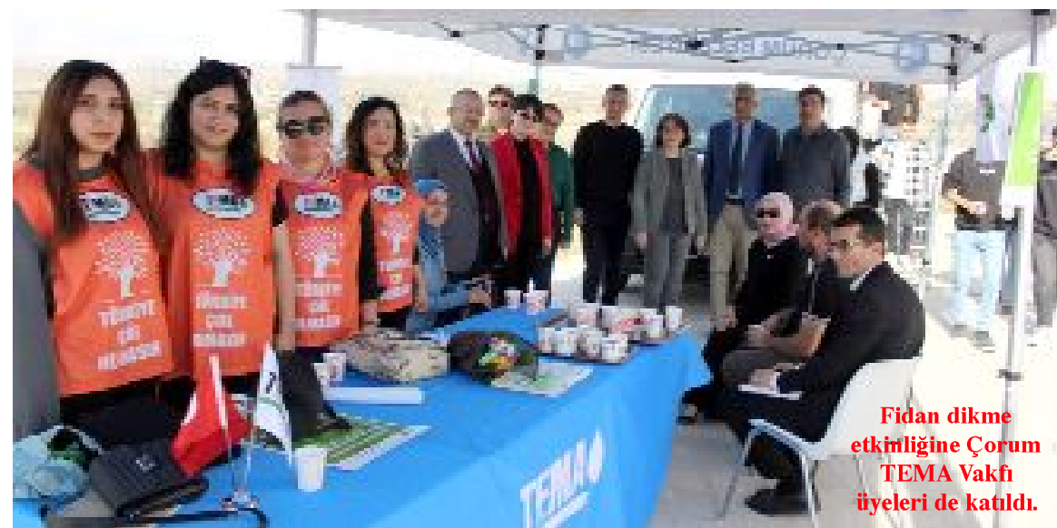
Fidan dikme etkinliğine Çorum TEMA Vakfı üyeleri de katıldı.