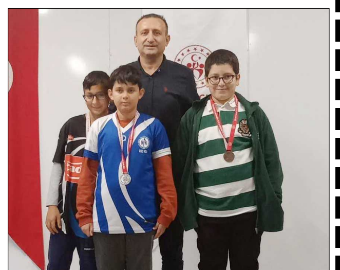
Kategorilerinde dereceye giren sporcular ödüllendirildi.

Müsabakalar sonunda düzenlenen törenle dereceye giren sporculara madalyaları takdim edildi. (Rifat KARA)