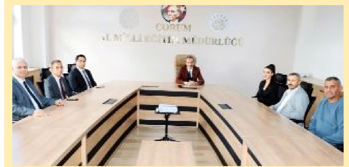
Kodek, Türk Sağlık-İş yöneticilerini konuk etti.

Türk Sağlık-İş yöneticileri, Milli Eğitim Müdürü Kodek'e, kendilerine verdiği destek ve gösterdiği konukseverlik nedeniyle teşekkürlerini ifade ettiler. (Aliye ÖNCEL)