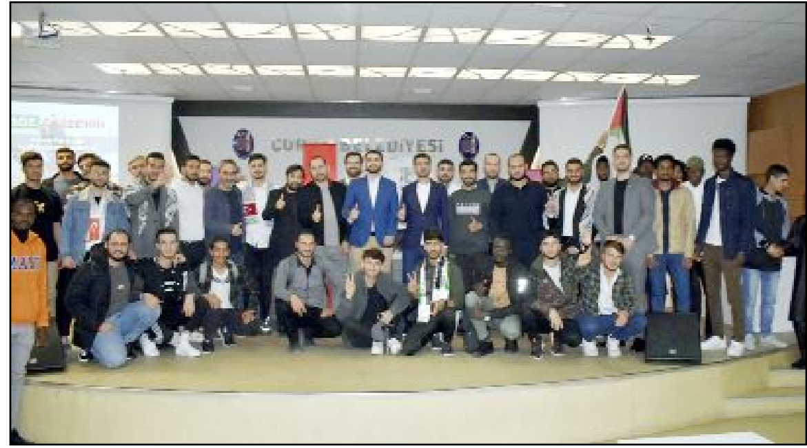
Hitit Uluslararası Öğrenci Derneği tarafından "Söz Gazze'nin" programı düzenlendi.