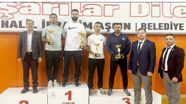
Atılım Spor Kulübü toplamda 37 madalya alarak birinci oldu.

Türkiye Cumhuriyeti'nin 100.yılına özel düzenlenen Cumhuriyet Kupası Tekvando Turnuvası'nda Atılım Spor Kulübü toplamda 37 madalya alarak zirvede yer aldı.