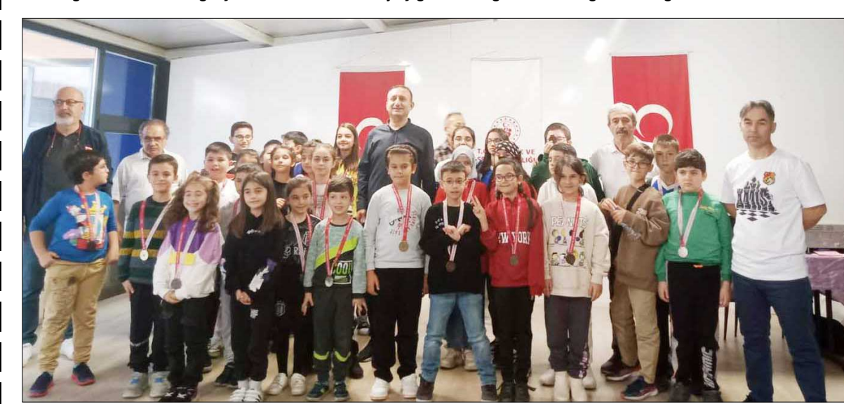
Kerebi Gazi Yurdu'nda gerçekleşen turnuvaya 50 sporcu katılım sağladı.