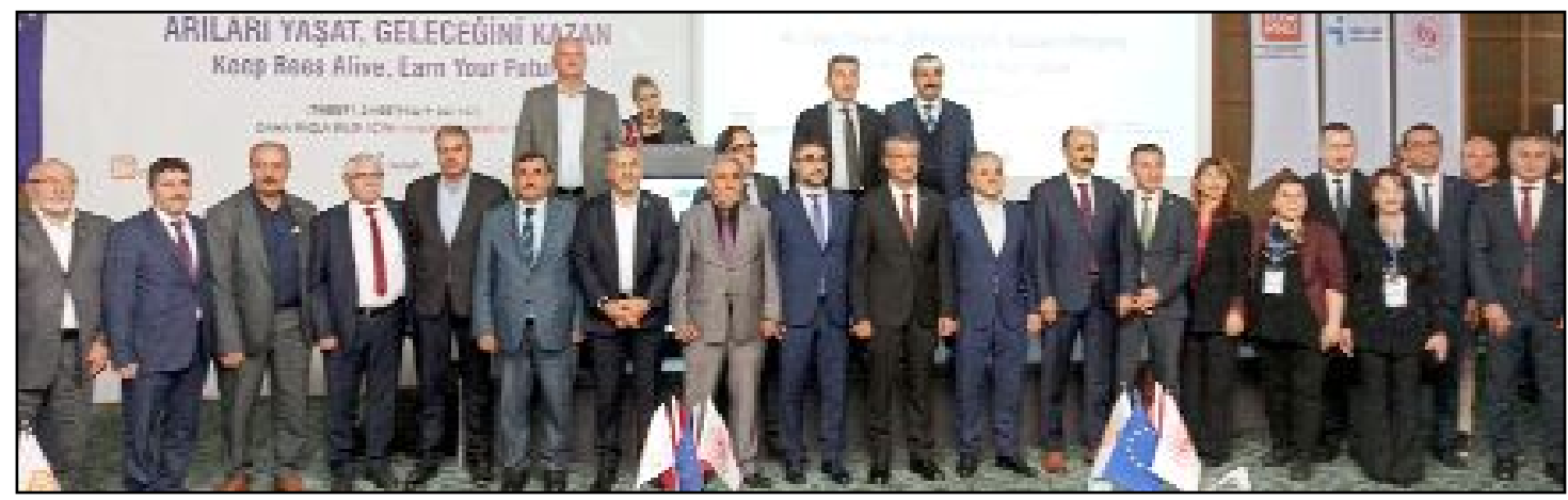
AB hibe desteği ile Merkez Köylere Hizmet Götürme Birliği ile S.S. Hitit Güneşi Kadın Girişimi Üretim ve Kalkınma Kooperatifi, Hitit Üniversitesi ve İŞKUR işbirliğinde düzenlenen projenin açılışı Anitta Otel'de büyük bir katılımıyla yapıldı.