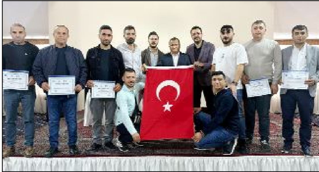
Yüzde 60'ı KOSGEB tarafından desteklenen gezeide Özbekistan'ın başkenti Taşkent ve Semerkand gezildi.

Daha sonra Taşkent'ten Semerkand şehrine geçildi. Sahih-i Buhari adıyla meşhur hadis kitabını yazan büyük hadis alimi İmam Buhari'nin şehir merkezine 50 km uzaklıkta bulunan türbesini ziyaret eden Çorumlu esnaf, Cuma namazını da burada kalarak, dua etti. (Haber Merkezi)