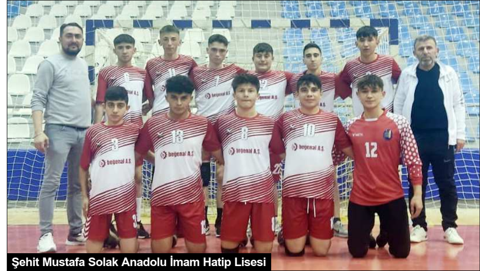
Şehit Mustafa Solak Anadolu İmam Hatip Lisesi

Biz de özellikle ilk yarıda son 2 müsabakayı kazanarak geçmek istiyoruz ki, devre arası daha üretken bir futbol takımını ortaya çıkarıp ikinci yarıya başlayalım" dedi. (Hüseyin AŞKIN)