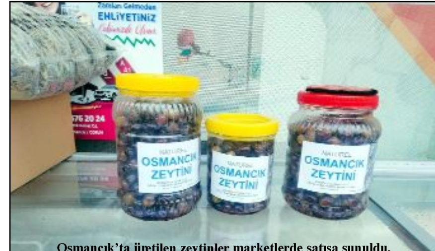
Osmancık'ta üretilen zeytinler marketlerde satışa sunuldu.