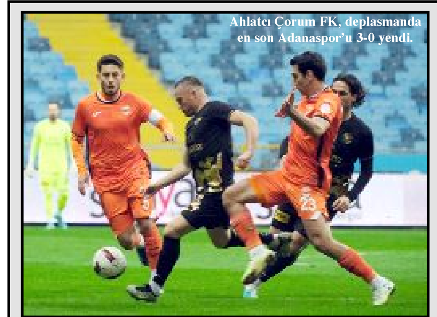
Ahlatcı Çorum FK, deplasmanda en son Adanaspor'u 3-0 yendi.