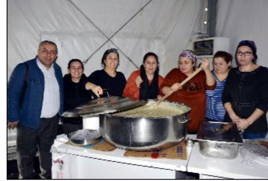
Keşkeğin, 2011 yılında UNESCO İnsanlığın Somut Olmayan Kültürel Mirasının Temsili Listesi'ne alındığı bildirildi.