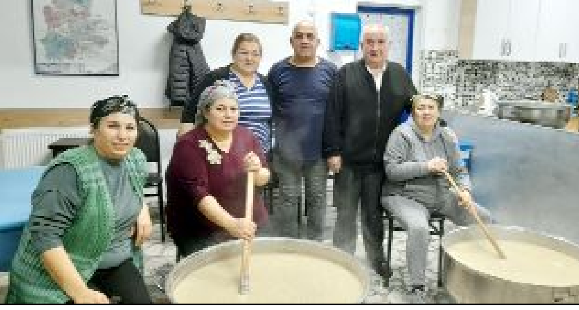
İstanbul'da yaşayan Üçköylü kadınlar, keşkek için kolları sıvadı.