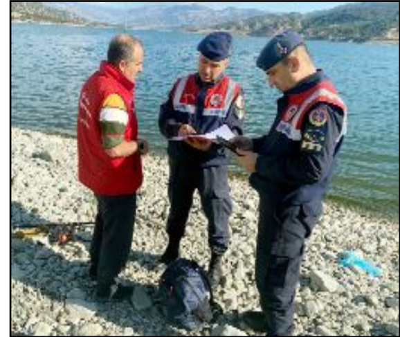
Jandarma ekipleri 15 kişi hakkında kaçak balık avcılığı nedeni ile yasal işlem uyguladı.

İl Jandarma Komutanlığı'ndan yapılan açıklamada; "Çevre, Doğa ve Hayvanları Koruma Timi ve Jandarma devriyeleri tarafından amatör balıkçılık faaliyetlerinin 1380 sayılı Kanun, ilgili Yönetmelik ve Tebliğlere uygun olarak vatandaşın sağlanması, doğal hayatın ve hayvanların korunması, çevre bilincinin geliştirilmesi ve Hayvan Durum İzleme (HAYDİ) uygulaması hakkında vatandaşları bilgilendirerek farkındalığın artırılmasına yönelik çalışmalar hassasiyetle yürütülmektedir. Çevre, doğa ve hayvanların korunmasına yönelik faaliyetlere kararlılıkla devam edilecek olup, bu konuda vatandaşlarımızın ihbarlarını 112 Acil Çağrı Merkezi ve Hayvan Durum İzleme (HAYDİ) uygulaması üzerinden Jandarma'ya bildirilmesi olayların önlenmesi ve aydınlatılmasına büyük katkı sağlayacaktır" görüşüne de yer verildi. (Haber Merkezi)