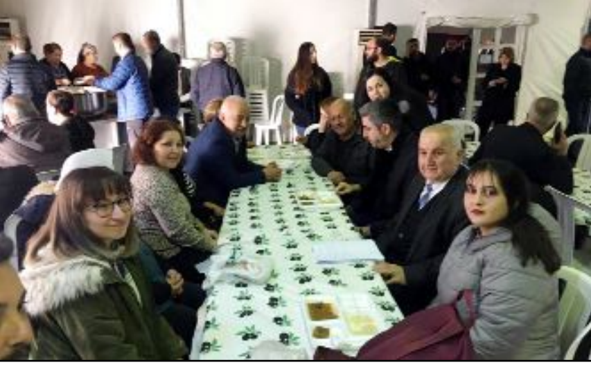
Etkinliğe katılanlardan bir grup...

kitabını imzaladı ve tüm gelirini Üçköylüler Derneği'ne bağışladı. (Aliye ÖNCEL)