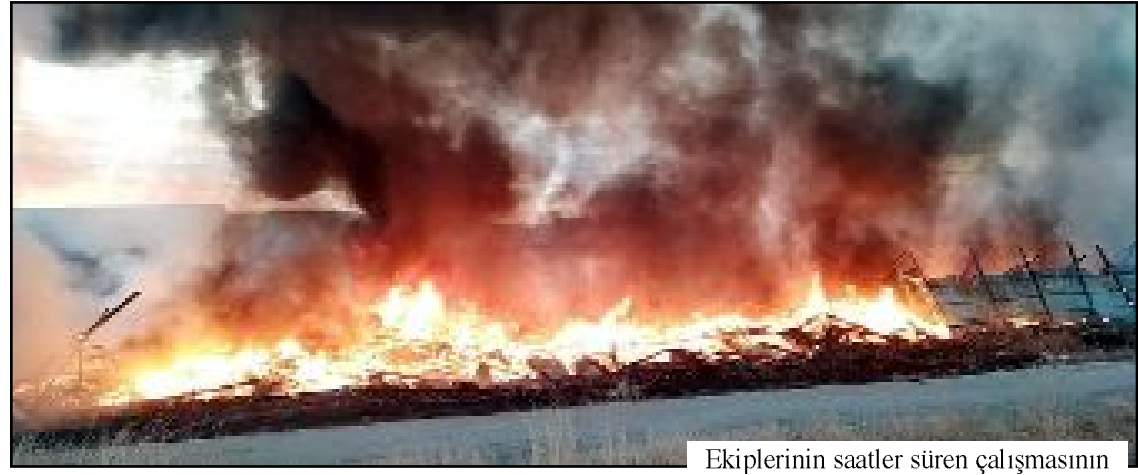
Ekiplerinin saatler süren çalışmasının ardından yangın kontrol altına alındı.

Yangın Çorum - Ankara yolu üzerinde meydana geldi. Edinilen bilgiye göre, bir atık toplama merkezinin trafosunda çıkan yangın bir tuğla fabrikasına da sıçradı. İşyerini bir anda alevler sararken, işyeri sahipleri itfaiye ekiplerine haber verdi. Yapılan ihbar üzerine olay yerine çok sayıda itfaiye, polis ve sağlık ekibi sevk edilirken, yangın yerine iş makineleri ve Toplumsal Olaylara Müdahale Aracı da (TOMA) getirildi. Ekiplerinin saatler süren çalışmasının ardından yangın kontrol altına alındı. Çıkan yangında yaralanan olmazken, iş yerlerinde büyük çaplı maddi hasar meydana geldi. Olayla ilgili soruşturma başlatıldı. (İHA)