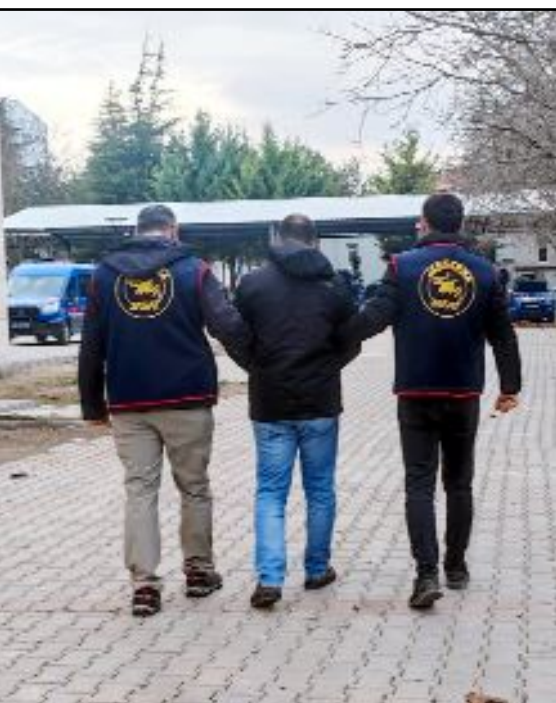
Adliye'ye sevk edilen şahıslardan 12 kişi tutuklanarak cezaevine teslim edildi.

Söz konusu operasyonlarla ilgili yapılan açıklamada, "Çorum İl Jandarma Komutanlığı sorumluluk bölgesinde, vatandaşlarımızın can ve mal güvenliğinin sağlanması, özellikle hırsızlık olaylarının önlenmesine yönelik önleyici tedbirler ve şüphelilerin yakalanması çalışmalarına 24 saat esnasına göre kararlılıkla devam edilmektedir. Vatandaşlarımızın şüpheli durumları 112 Acil Çağrı Merkezi üzerinden Jandarma'ya bildirmesi, olayların önlenmesi ve aydınlatılmasına büyük katkı sağlayacaktır" denildi. (Haber Merkezi)