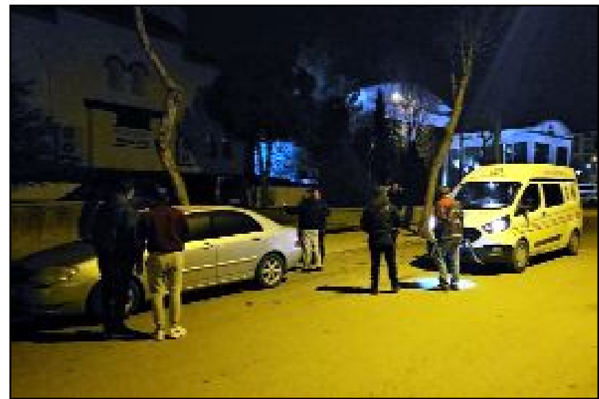
Olay sonrası kaçan zanlılardan N.E. polis ekiplerince üzerindeki 2 pompalı tüfekle yakalandı.

Olay sonrası kaçan zanlılardan N.E. polis ekiplerince üzerindeki 2 pompalı tüfekle yakalandı. Diğer zanlının yakalanması için çalışmalar sürüyor. (AA)