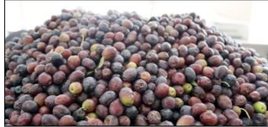
Osmancık ilçe merkezi ve Aşağızeytin Köyü'nde yetiştirilen zeytinlerin yağ olma hikâyesi başladı.

olarak yetiştirilen zeytin Osmancık topraklarında da yetişip satışa sunuldu. 'Osmancık zeytini' adıyla küçük ve büyük boy olarak ilçedeki marketlerin raflarında yerini alan zeytinin ilçe halkının yoğun ilgisiyle karşılaştığı öğrenildi. Raflarda yerini alan küçük boy zeytinin 800 gramının 80 TL'den büyük boy zeytinin 1.5 kilosunun ise 150 TL'den satışa sunulduğu bildirildi. (İHA)