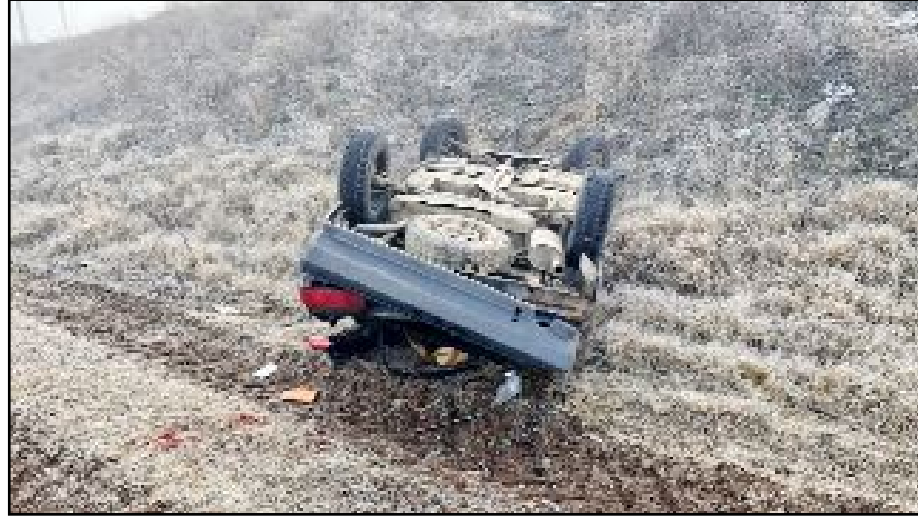
Kaza yoğun sis nedeniyle görüş mesafesinin yaklaşık 10-15 metreye düştüğü sabah saatlerinde meydana geldi.

Çorum'un Alaca ilçesi yakınlarında meydana gelen trafik kazasında, aynı aileden birisi çocuk 3 kişi yaralandı.