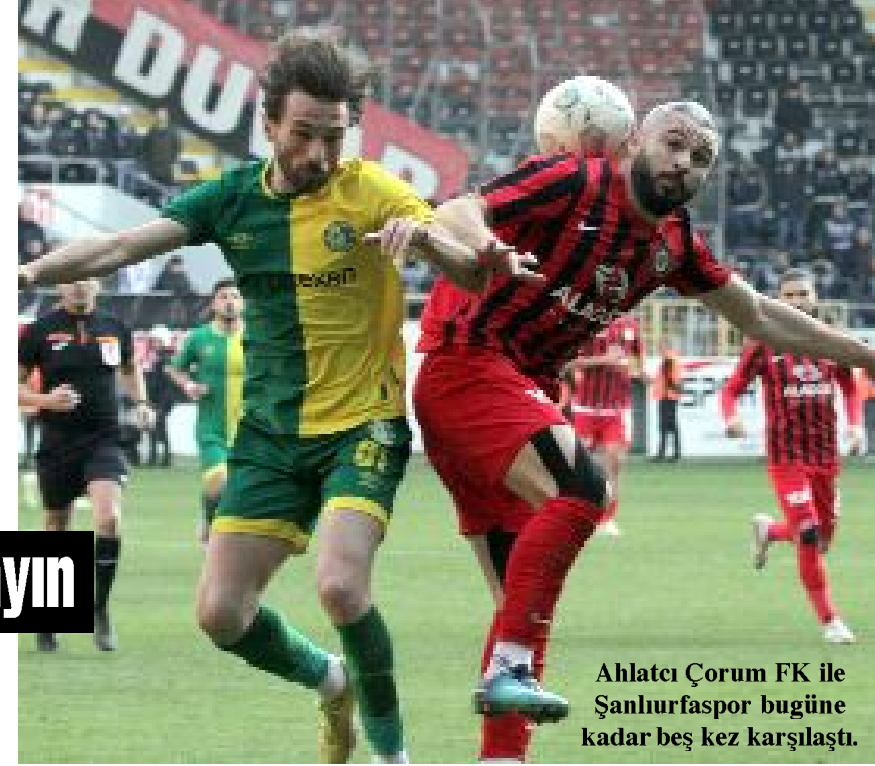
Ahlatcı Çorum FK ile Şanlıurfaspor bugüne kadar beş kez karşılaştı.

Ankara bölgesinde Demokrat Özgür Güneş ise maça dördüncü hakem olarak görev alacak. (Hüseyin AŞKIN)