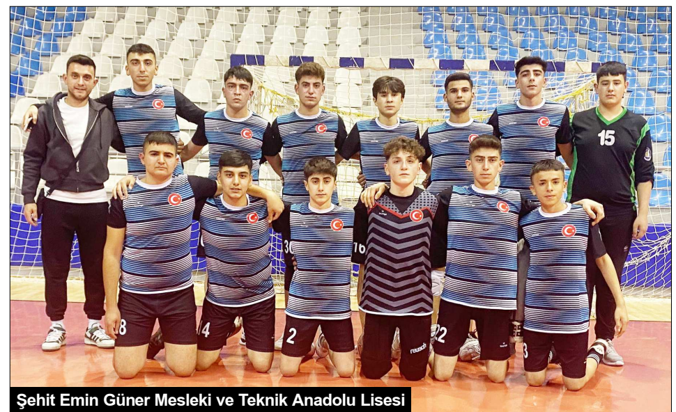
Şehit Emin Güner Mesleki ve Teknik Anadolu Lisesi

Çorum temsilcileri gruptaki ikinci maçlarını dün gazetemizin basımına girdiği saatlerde oynadılar. Şehit Mustafa Solak Anadolu İmam Hatip Lisesi Kastamonu ile karşı karşıya gelirken, Şehit Emin Güner MTAL ise Amasya temsilcisi ile kozlarını paylaştı. (Spor Servisi)