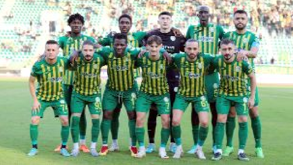
Şanlıurfaspor, 15 haftada topladığı 14 puanın sadece 5'ini evindeki maçlarda aldı.

Geçen sezon oynanan iki maç da 0-0 bitti. (Hüseyin AŞKIN)