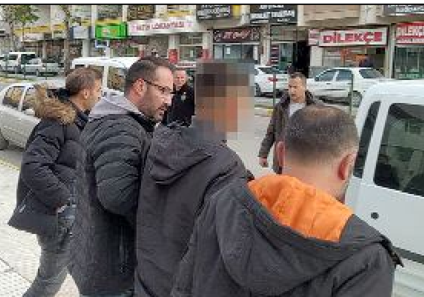
F.Ş., çıkarıldığı mahkemeye tutuklanarak cezaevine gönderildi.

Olayın diğer şüphelisi S.B.'nin yakalanması için başlatılan çalışmaların devam ettiği öğrenildi. (İHA)