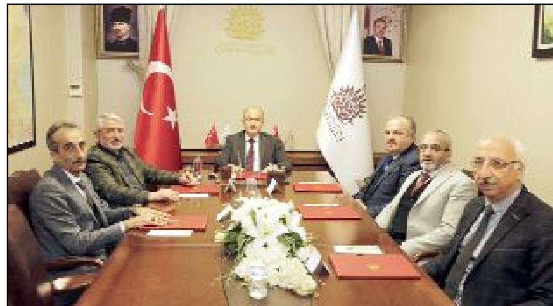
"Bağımlı Olma, Özgür Ol" projesi için kurumlararası işbirliği yapılacak.