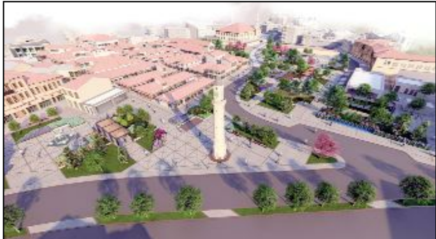
İlk etabı ay sonu bitecek olan çalışmalar sonunda meydan bu şekilde olacak.

Çorum'u daha güzel ve daha yaşanabilir bir kent haline getirmek için önemli çalışmalar yaptıklarının altını çizen Başkan Aşgın, "Şehrimizin tarihi dokusunu, kültürel değerleriyle beraber yeniden ayağa kaldırmak bizim en önemli hayalimiz. Bu anlamda da gece-gündüz aştıkla çalışıyoruz" dedi. (Haber Merkezi)