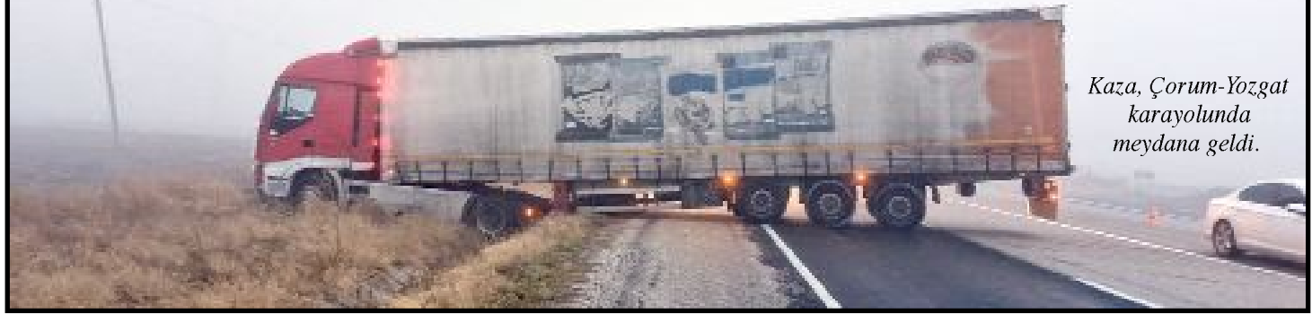
Kaza, Çorum-Yozgat karayolunda meydana geldi.