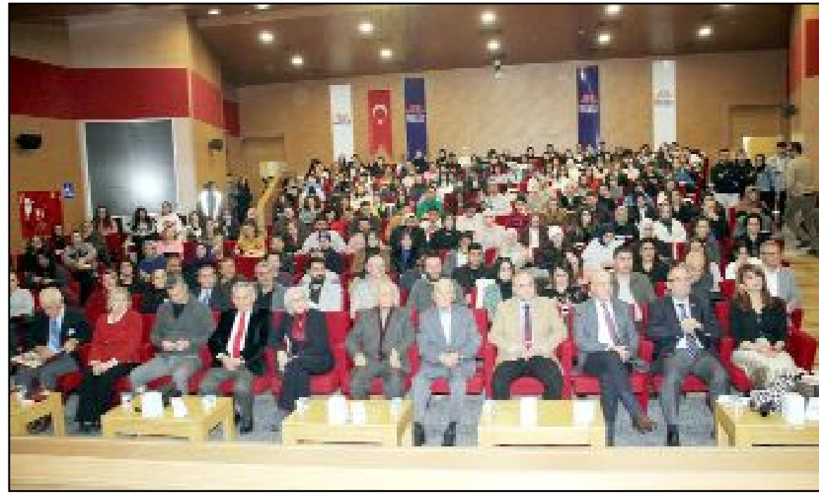
İş Kadınları Derneği'nin düzenlediği panel ve ödül törenine katılanlar...