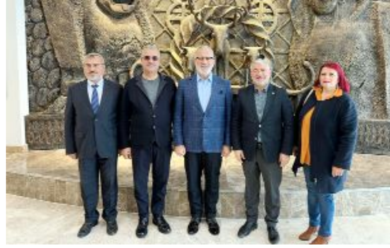
Hukukçu, yazar, oyuncu ve milletvekili Bahadır Yenişehirlioğlu, Çorum Belediyesi'ni ziyaret etti. Ziyarete AK Parti Çorum Milletvekili Yusuf Ahlatcı da hazır bulundu.

tarafından ağırlanan ünlü oyuncu ve milletvekiline yapılan çalışmalar anlatılarak yeni hizmet binası da gezdirildi. (Volkan SINAYUÇ)