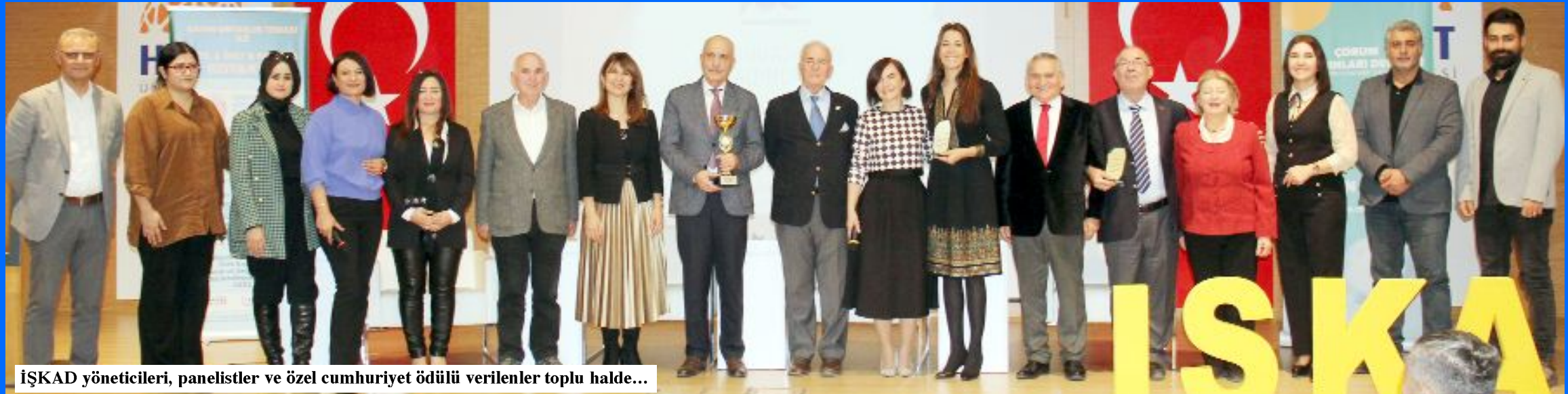
İSKAD yöneticileri, panelistler ve özel cumhuriyet ödülü verilenler toplu halde...