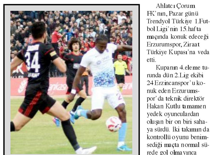
Ahlatcı Çorum FK ile Trabzonspor daha önce iki kez karşılaştı.