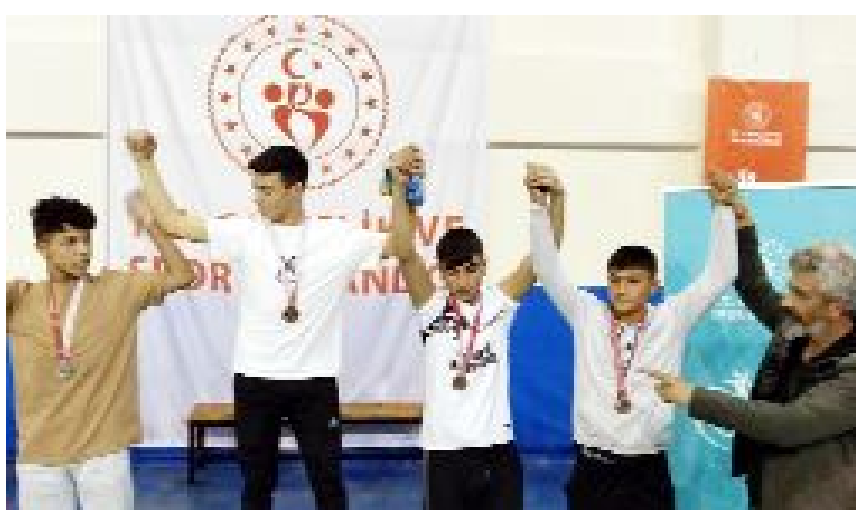
Kilolarında dereceye giren sporcu öğrencilere madalya verildi.

Maç öncesinde, Gümüştü Gümüşhanespor 2 puanla 8.sırada, Gaziantep Gençlikspor ise 17 puanla lider durumda. (Hüseyin AŞKIN)