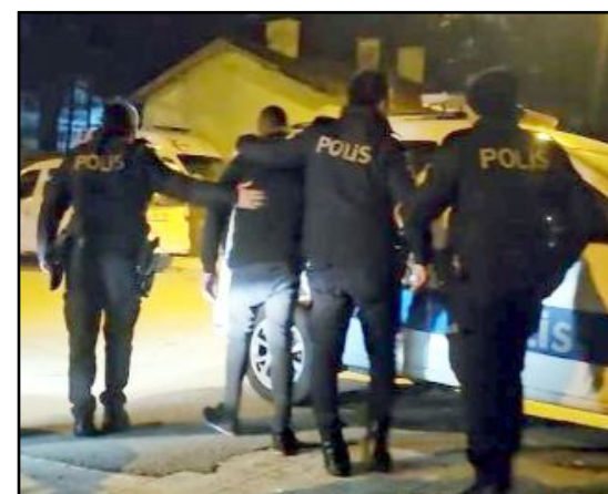
Kaza yerinden kaçan alkolü şahıs, bekçiler tarafından yakalandı.