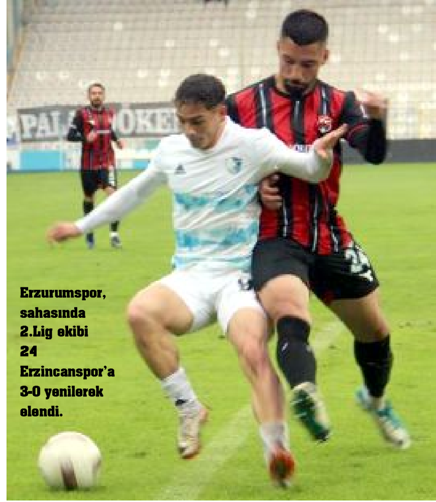
Erzurumspor, sahasında 2.Lig ekibi 24 Erzincanspor'a 3-0 yenilerek elendi.

Dün oynanan maçlarda ise, Bodrum FK, İzmir'in 2.Lig temsilcisi Menemen FK'yı 2-1, Göztepe, 2.Lig ekibi 1461 Trabzon'u 3-0, Adanaspor, İstanbul'un 2.Lig'deki temsilcilerinden Esenler Erokspor'u 2-0, Boluspor, Diyarbakır'ın 2.Lig ekibi Amed Sportif Faaliyetler'i 1-0, Gençlerbirliği, İzmir'in 3.Lig takımlarından Bornova 1877 Sportif Yatırımlar A.Ş.'yi 4-1, Ümraniyespor, Başkent'in 3.Lig takımlarından Güneş Holding Çankayaşpor'u 2-1, Eyüpspor, 2.Lig ekibi Ankara Demirspor'u 3-1, Sakaryaspor da 2.Lig temsilcisi Ankaraspor'u 1-0 yenerek beşinci tura yükseldiler. Evinde 24Erzincanspor'a 3-0 yenilen Erzurumspor ile sahasında Kırklarelispor'a 3-2 yenilen Altay ise kupaya veda etti.