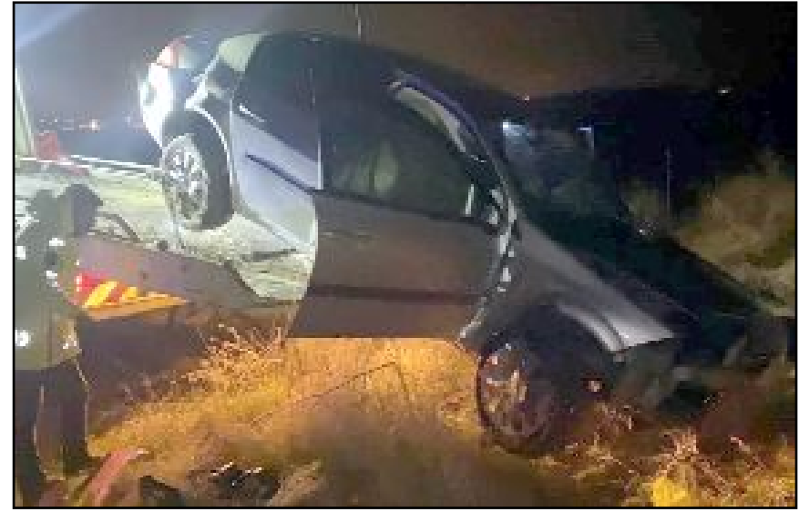
Hurdaya dönen araç çekici vasıtasıyla otoparka çekildi.