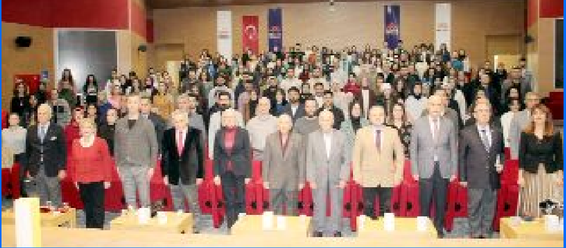
Hitit Üniversitesi Ethem Erkoç Konferans Salonu'nda, Ulu Önder Atatürk'ün anısına saygı duruşu...