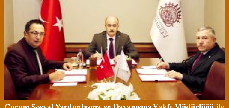
Çorum Sosyal Yardımlaşma ve Dayanışma Vakfı Müdürlüğü ile Çalışma ve İş Kurumu İl Müdürlüğü arasında "İŞKUR Hizmetlerinin Sunumuna İlişkin İşbirliği" protokolü imzalandı.