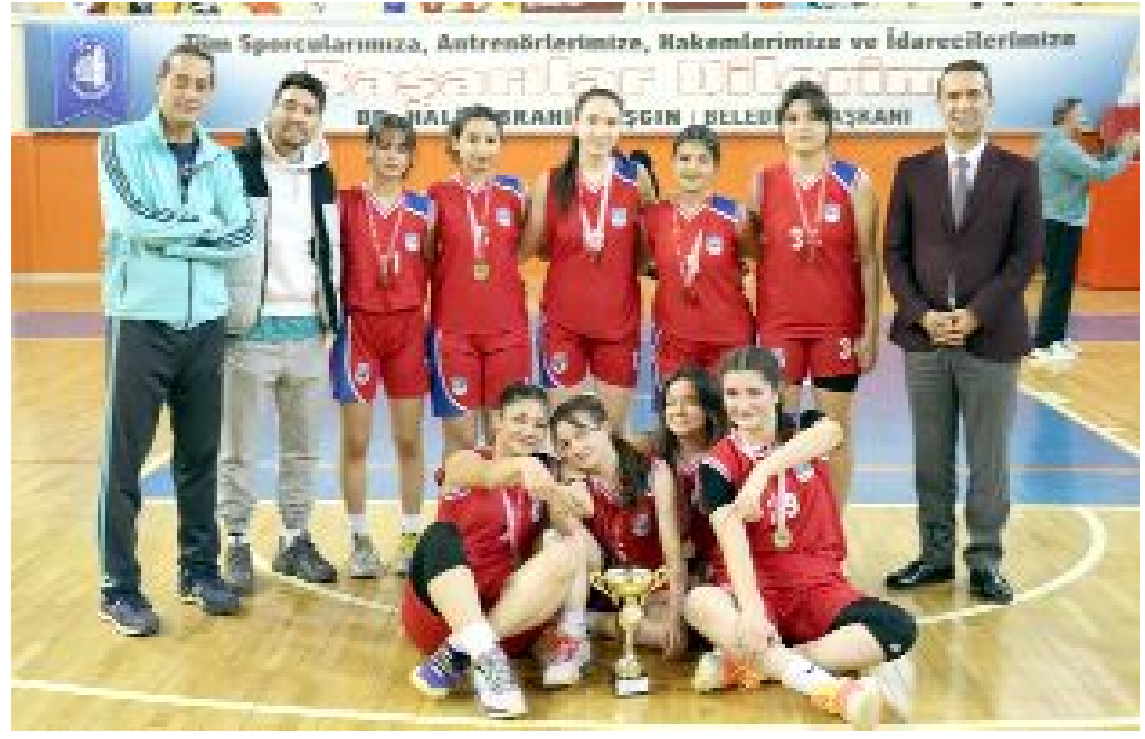
Özel Ada Anadolu Lisesi oynadığı iki maçı da kazanarak şampiyon oldu.