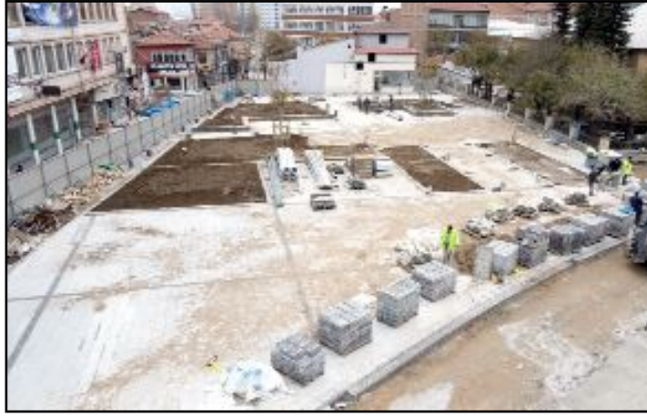
Çorum Belediyesi tarafından başlatılan tarihi kent meydanı projesinde çalışmalar sürüyor.