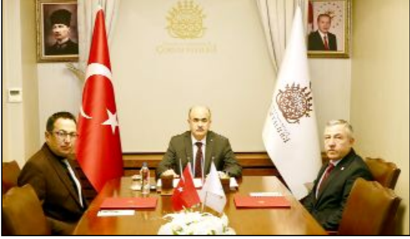
Sosyal Yardımlaşma ve Dayanışma Vakfı Müdürlüğü ile Çalışma ve İş Kurumu İl Müdürlüğü arasında "İŞKUR Hizmetlerinin Sunumuna İlişkin İşbirliği" protokolü imzalandı.

lün hayırlı olmasını dileyerek, İŞKUR Hizmet Noktasının sosyal yardım alan vatandaşlarımızın istihdam edilebilirliğini artırmak, işgücü piyasasına katılımlarını sağlamak ve refah düzeylerini yükseltmek için önemli bir adım olduğunu sözlerine ekledi. (Haber Merkezi)