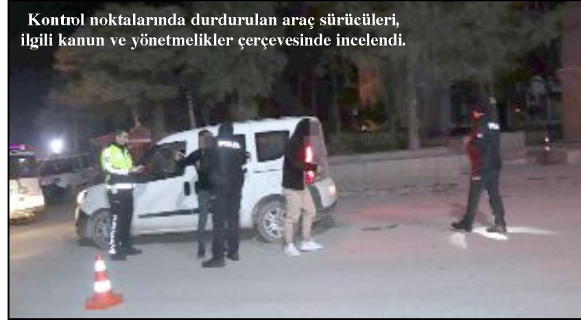
Kontrol noktalarında durdurulan araç sürücülerini, ilgili kanun ve yönetmelikler çerçevesinde incelendi.

Denetimlerin devam edeceği bildirildi.(AA)