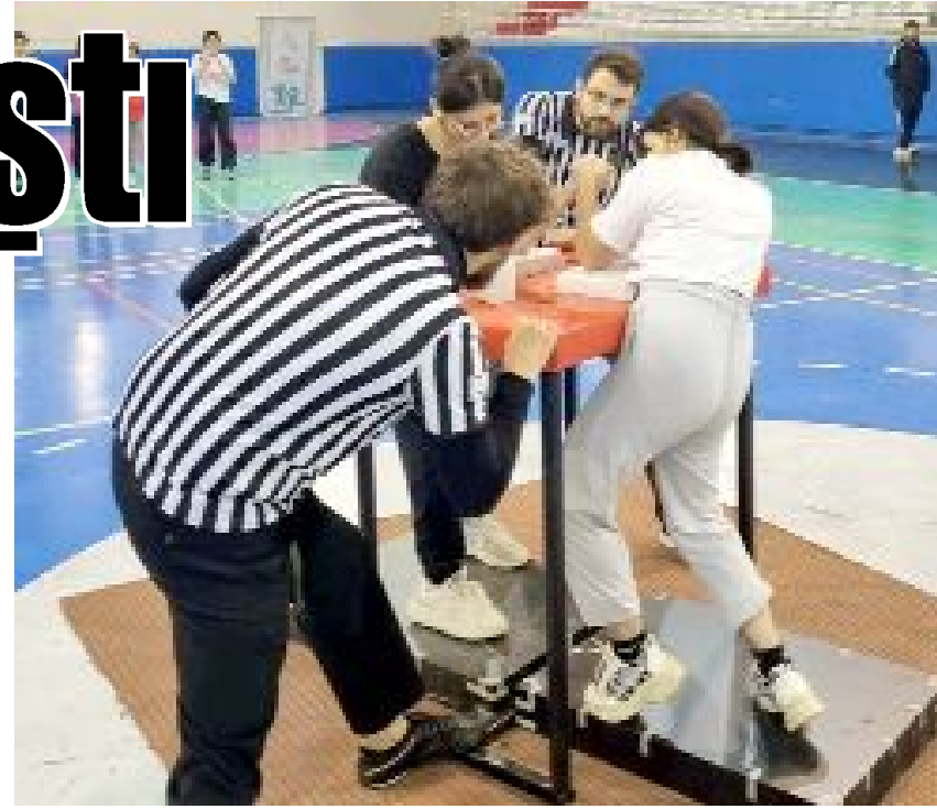
Tevfik Kış Spor Salonu'nda düzenlenen il birinciliğine 130 sporcu öğrenci katıldı.

Dereceye giren sporcu öğrenciler madalya ile ödüllendirildi. (Hüseyin AŞKIN)