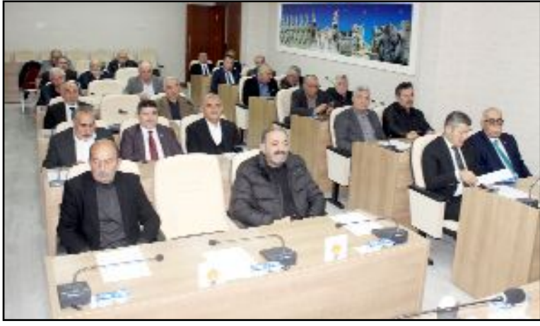
İl Genel Meclisi'nde Aralık ayı toplantılarına dün yapılan oturum ile devam edildi.