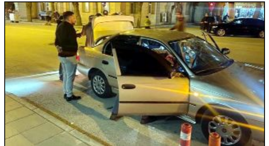
Çorum İl Emniyet Müdürlüğü asayiş ve güvenliğin sağlanmasına yönelik çalışmalara devam ediyor.

zur ve güvenliğine yönelik çalışmalarımız aralıksız olarak devam etmektedir" denildi. (Haber Merkezi)