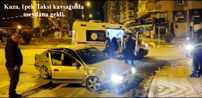
Kaza, İpek Taksi kavşağında meydana geldi.