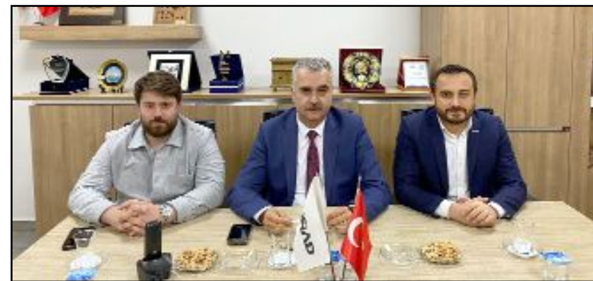
AK Parti Çorum Milletvekili Yusuf Ahlatcı, Müstakil Sanayici ve İş Adamları Derneği (MÜSİAD) Çorum Şubesi'ni ziyaret etti.

MÜSİAD'ın milli ve manevi duygularla yol açılan bir STK olduğunu belirten Ahlatcı, MÜSİAD'ın faaliyetlerinin sadece ticari alanda değil, aynı zamanda milli ve manevi değerlerin yüceltilmesi ve korunması konusunda da önemli bir rol oynadığına dikkat çekti. İş dünyasının ara eleman ihtiyaçları noktasında kendisine iletilen taleplerini dinleyen Milletvekili Ahlatcı, "Bölgemizde sanayici ve esnaflarımızla bir araya gelip ve taleplerini dinliyoruz. Taleplerini en pratik şekilde çözüyoruz için de çalışmalar yapıyoruz" dedi. Üretim ve istihdamın artırılması noktasında iş dünyasının taleplerinin çözümünü için gerekli çalışmalarını kaydeden Ahlatcı, Cumhurbaşkanı Recep Tayyip Erdoğan liderliğinde AK Parti olarak iş dünyasının, yerli ve milli kalkınmanın, girişimcinin önünü açmak için 2002'den bugüne durmadan yorulmadan çalışmalarını ifade etti. (Haber Merkezi)