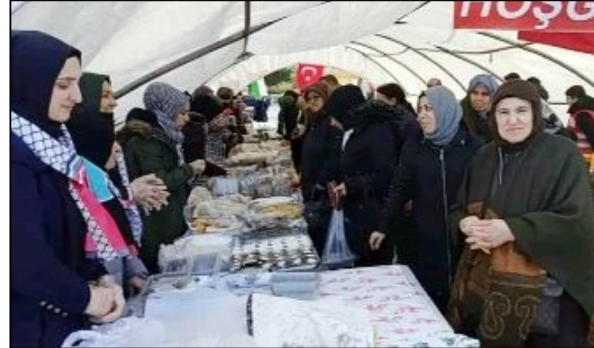
Türkiye Kızılay Derneği Sungurlu Şubesi öncülüğünde düzenlenen Filistin-Gazze hayır çarşısında 3 günde 295 bin TL toplandı.

sın. Zalimleri de hüsrana uğratsın inşallah. Teşekkürler vefalı milletimiz. Teşekkürler Sungurlu" ifadelerini kullandı. (İHA)