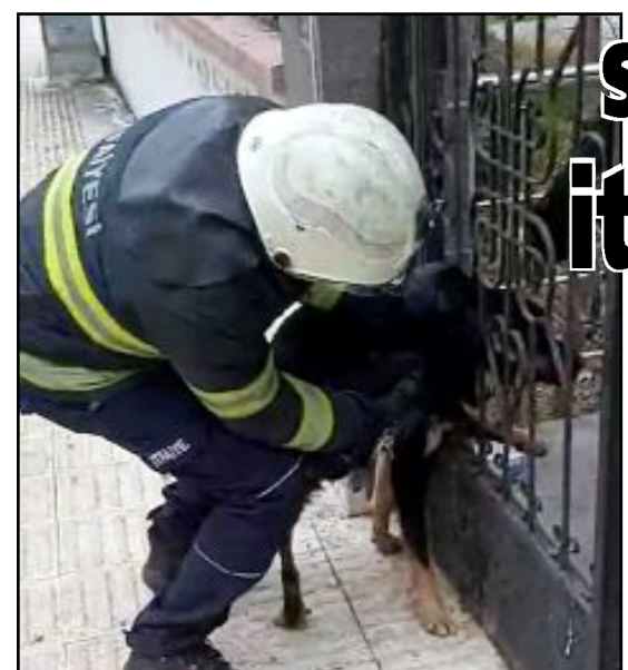
İtfaiye eri, demir makas ile parmaklıkları esneterek köpeğin kurtarılmasını sağladı.

Çorum'da demir parmaklıklara başı sıkışan sahipsiz köpek, itfaiye ekiplerince kurtarıldı.