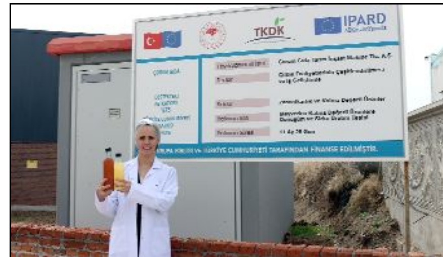
Tarım ve Kırsal Kalkınmayı Destekleme Kurumu Çorum İl Koordinatörlüğünce, 2023 yılında onaylanan 197 milyon lira yatırım tutarlı 128 projeye 68 milyon lira hibe desteği sağlandığı bildirildi.