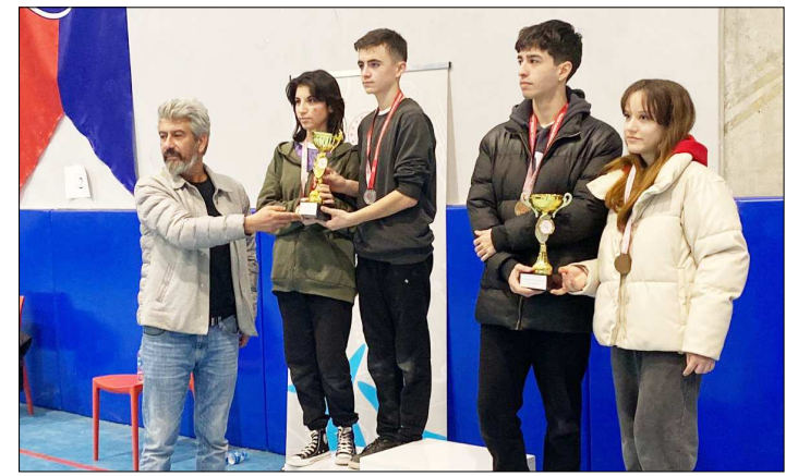
Dereceye giren takımlara kupaları takdim edildi.

Müsabakalar sonunda düzenlenen törenle dereceye giren okullara kupa, sporculara ise madalya verildi. (Rifat KARA)