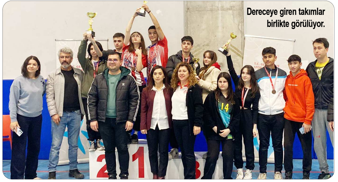
Dereceye giren takımlar birlikte görülmüyor.