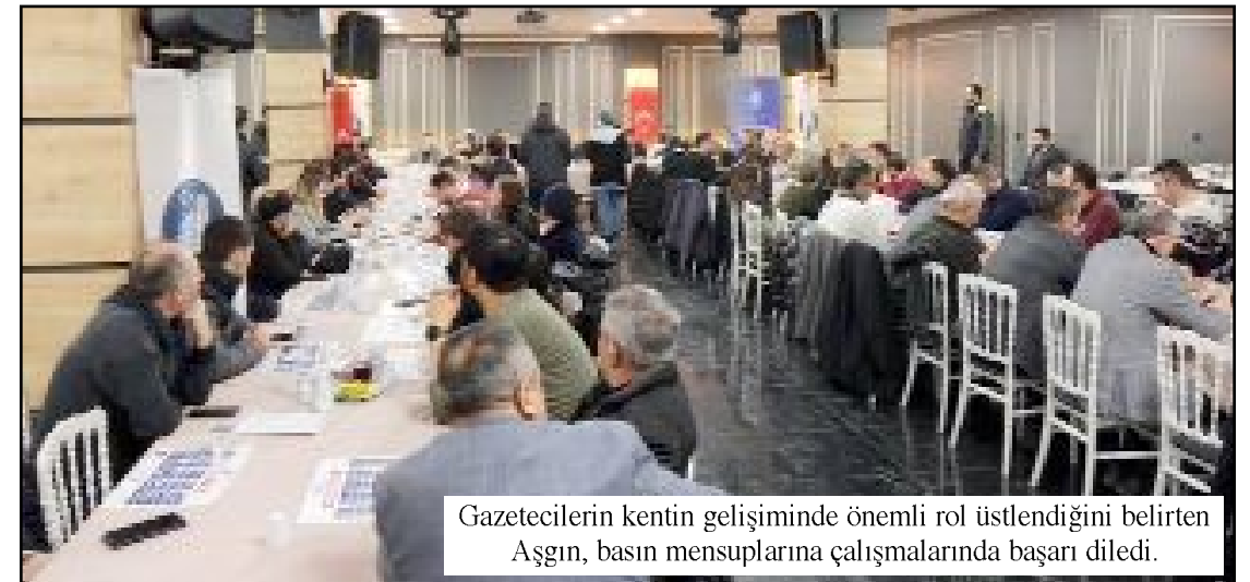
Gazetecilerin kentin gelişiminde önemli rol üstlendiğini belirten Aşgın, basın mensuplarına çalışmalarında başarı diledi.