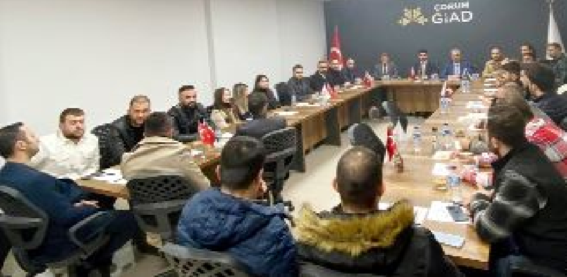
Geniş katılımlı toplantıdan bir görünüm...