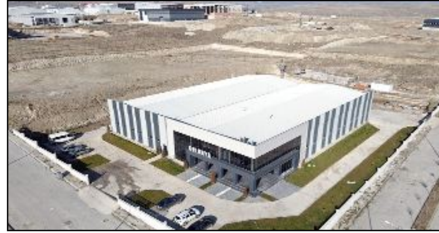
Koordinatörlükten yapılan açıklamada, 2023'ün en yüksek hibe ödemesi yapılan yıl olduğu vurgulandı.

da da yatırımları devam eden projelerle birlikte, İPARD III dönemi için çıkılacak yeni proje başvuru çağrısıyla tarımı ve kırsal kalkınmayı destekleme ve devam edeceklerini sözleriyle ekledi. (İHA)