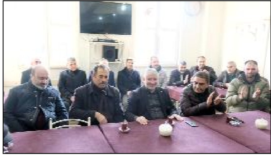
Çorum Belediyesi, Nakliyeciler Sitesi ve Kamyon Garajı'nın işletmesini devraldı.

ŞEHİR İÇİN KAMYON VE TIR PARKI YASAK Öte yandan Çorum Belediyesi'nden yapılan açıklamada şehir içinde mahalle aralarına kamyon ve TIR parkının yasak olduğu bir kez daha hatırlatıldı. Açıklamada "Şehir içerisine kamyon, çekici, otobüs veya bunların römorkları, lastik tekerlekli traktörler ile her türlü iş makinelerinin bulundurulması ve park edilmesi yasaktır." denilerek, şehir trafiğinin olumsuz etkilenmemesi için ağır vasıta şoförlerinin araçlarını Çorum Nakliyeciler Sitesi ve Kamyon Garajı'na park etmesi istendi. (Haber Merkezi)