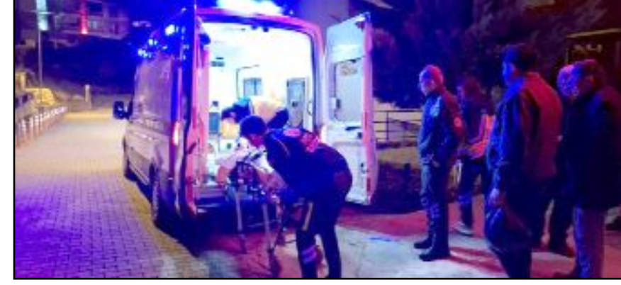
Olay yerinde ilk müdahalesi yapılan talihsiz adam İskilip'teki tedavisinin ardından Erol Olçok Eğitim ve Araştırma Hastanesine sevk edildi.