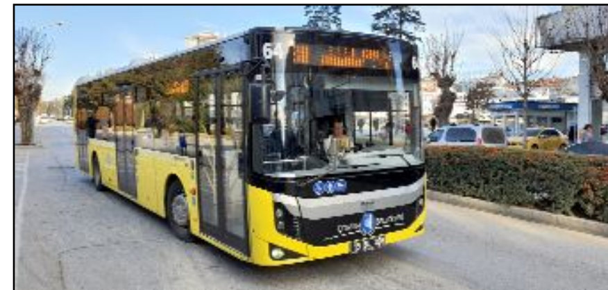
Çorum Belediyesi, 72 olan otobüs sayısını 74'e çıkardı.

Çorum Belediyesi klimalı durak sayısını da artırmaya devam ediyor. Klimalı otobüs duraklarını artık kendi atölyesinde üreten Çorum Belediyesi, yokuşluğunun bulunduğu bölgelerden başlayarak durakları yeniliyor. Oturma alanı, sensörlü kapısı, kliması ve otobüs bilgi ekranlarının yer aldığı otobüs durakları Makine İkmal Bakım ve Onarım Müdürlüğü'nde imal ediliyor. (Haber Merkezi)