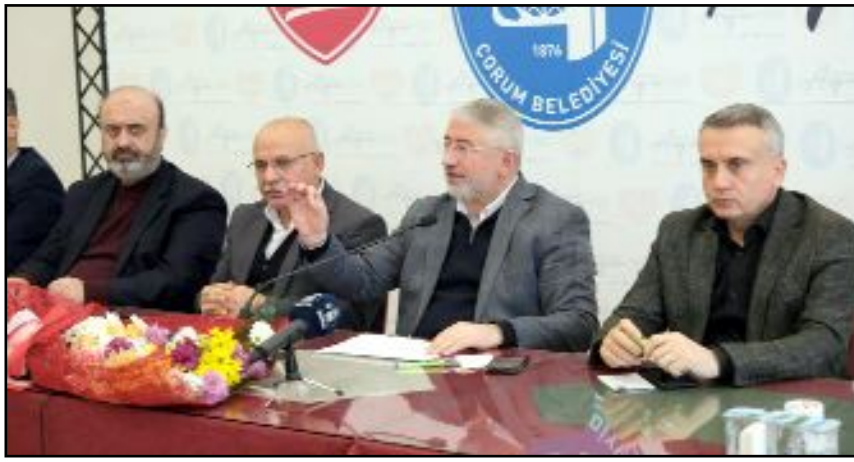
Çorum Belediyesi'ndeki daimi işçiler için 2024 toplu sözleşme görüşmeleri rekor bir zamlarla tamamlandı.

Köröğlü, "Belediye başkanımız bizleri kırmadı. 1 yıllık çok güzel bir sözleşme oldu. İşçi kardeşlerimize yüzde 150'ye yakın bir artış yaptık. Yevmiye ücretleri, aile ve çocuk yardımı, yemek yardımı ve diğer sosyal