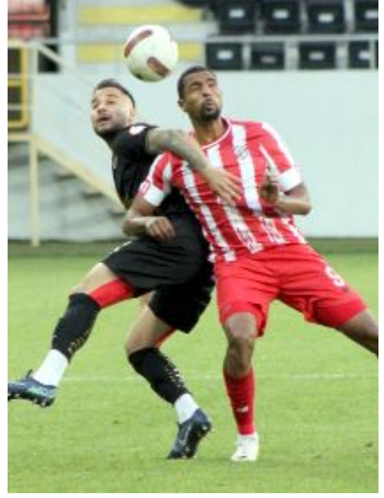
Ahlatçı Çorum FK, 397. maçında Boluspor'u 2-0'lık skorla devirmişti.

2012-2013 Sezonundan beri profesyonel liglerde mücadele eden Ahlatçı Çorum FK, bugüne kadar 397 kez puanmaçına çıktı. Kırmızı-siyahlı takım bu maçlarda 173 galibiyet, 106 beraberlik, 118 yenilgi alırken, 625 puan topladı. Çorum temsilcisi, attığı 572 gole karşılık 417 gol yedi. Ahlatçı Çorum FK, sahasında ise 197 maç oynadı. Bu maçlarda 104 galibiyet, 50 beraberlik, 43 yenilgi alan kırmızı-siyahlı ekip, 362 puan toplarken, 330 gol atıp, kalesinde 187 gol gördü. (Hüseyin AŞKIN)