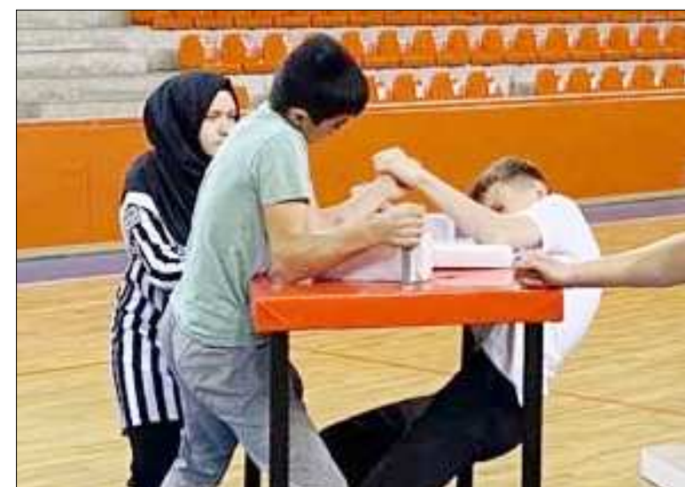
Atatürk Spor Salonu'nda yapılan müsabakalardan temsili fotoğraf...