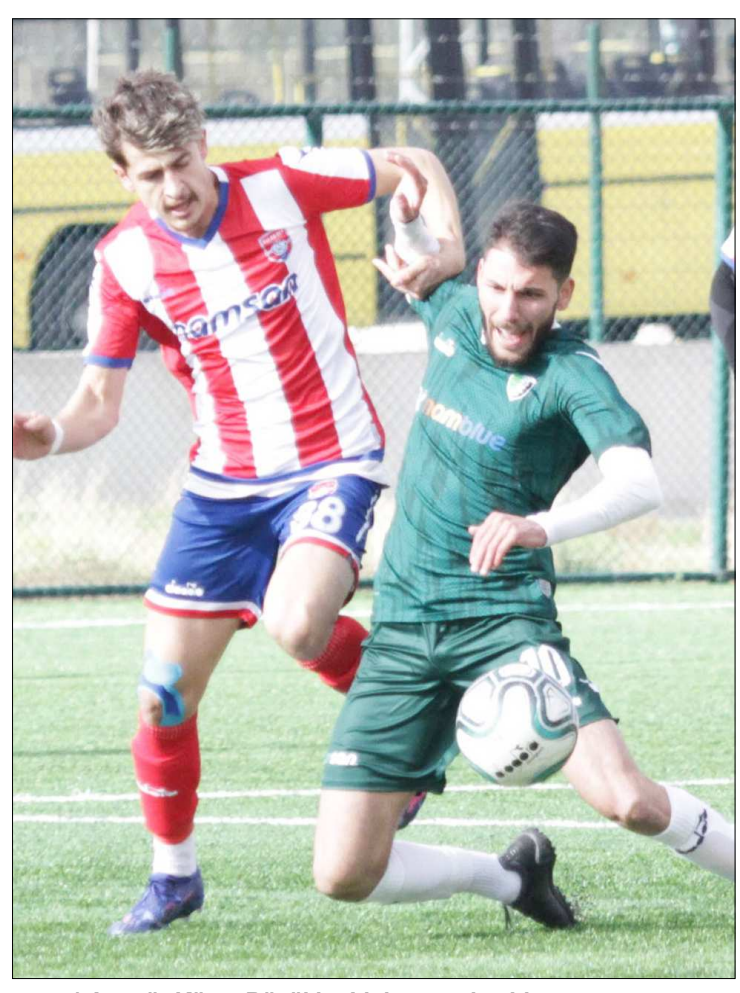
1.Amatör Küme Büyükler Ligi maçından bir enstantane...

Kaya Stadı'nda İskilipspor ile İskilipgücü karşı karşıya gelirken, Devane Sahası'nda saat 11.30'da başlayacak maçta ise H.E.Kültürspor ile Alaca Belediyespor karşılaşacak. (Rifat KARA)