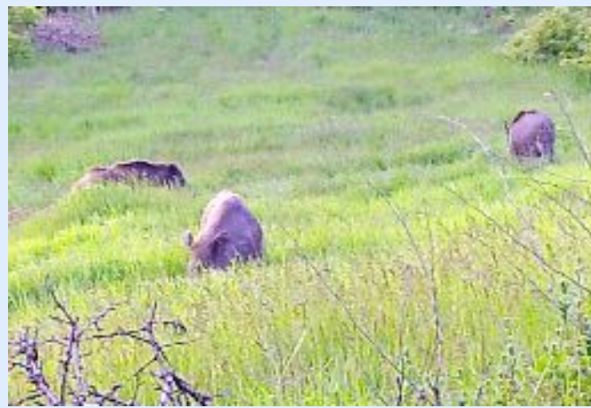
2023 yılında Çorum’da fotokapanla vaşak, çakal, kızıl geyik, kara tavuk ve yaban domuzu görüntülendiği bildirildi.