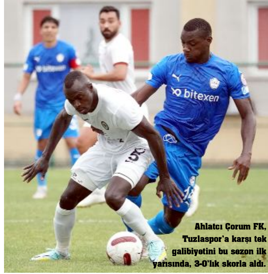
Ahlatçı Çorum FK, Tuzlaspor'a karşı tek galibiyetini bu sezon ilk yarısında, 3-0'lık skorla aldı.

27 puanla 7.sıra da yer alan Ahlatçı Çorum FK ile 16 puanlı 16.sıradaki Tuzlaspor arasında, yarın Çorum Şehir Stadyumu'nda oynanacak maç saat 16.00'da başlayacak. İki takım arasında, sezonun ilk yarısında, İstanbul'da oynanan maçı Ahlatçı Çorum FK 3-0 kazanmıştı. (Hüseyin AŞKIN)