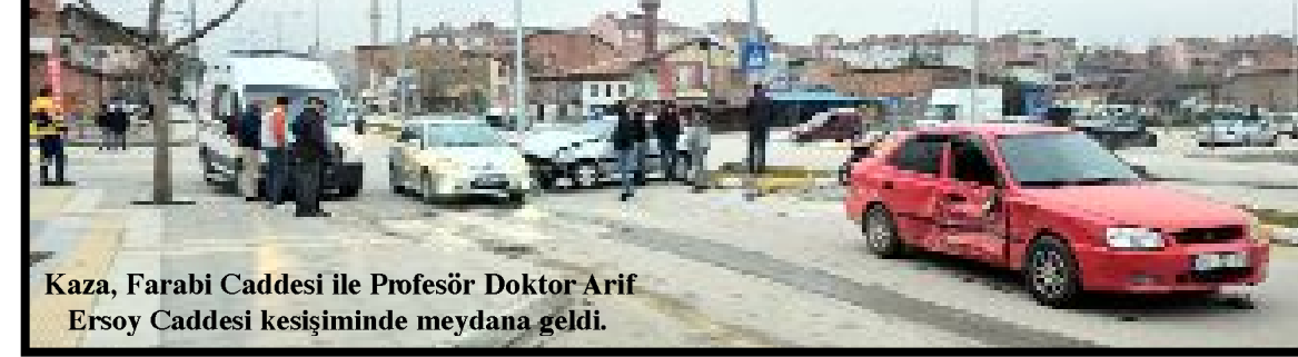
Kaza, Farabi Caddesi ile Profesör Doktor Arif Ersoy Caddesi kesişiminde meydana geldi.