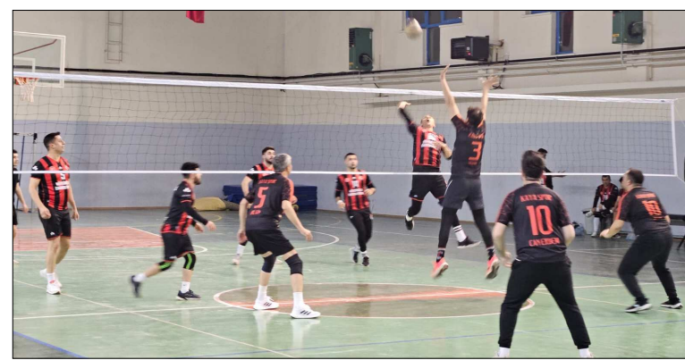
Final maçından bir fotoğraf...