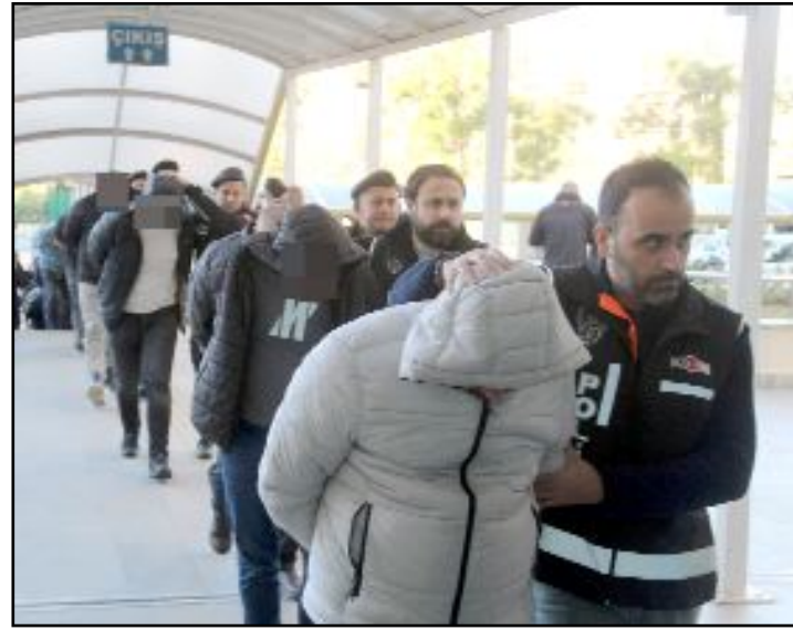
Vurgun operasyonunda 29 kişi yakalandı.

Antalya merkezli olmak üzere; Ankara, İstanbul, Kocaeli, Kayseri, Denizli, Diyarbakır, Isparta, Çorum ve Afyonkarahisar illerinde 34 şüpheliye yönelik gerçekleştirilen eş zamanlı operasyonda 29 kişi yakalandı. Yapılan aramalarda, şüphelilere ait 3 adet depo içerisinde piyasa değeri yaklaşık 10 milyon lira olan müşterilere ait mallara el konuldu. İkamet ve iş yerlerinde yapılan aramalarda, satılacaklar ve çek asılları ile çok sayıda dijital materyal ele geçirildi. (İHA)