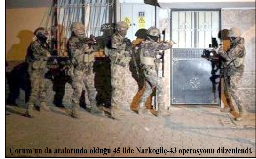
Çorum'un da aralarında olduğu 45 ilde Narkogüç-43 operasyonu düzenlendi.

hapın ele geçirildiğini açıkladı. İçişleri Bakanı Yerlikaya, sosyal medya hesabından yaptığı açıklamada, uyuşturucu madde imalatçılarına ve bunların satışı yapanlar ile sokak satıcılarına yönelik 45 ilde düzenlenen "Narkogüç-43" operasyonlarında 1 ton 661 kilogram uyuşturucu madde ve 417 bin adet uyuşturucu hap ele geçirildiğini belirterek, operasyonlarda 305 zehir taciri ve sokak satıcısının yakalandığını kaydetti. (İHA)