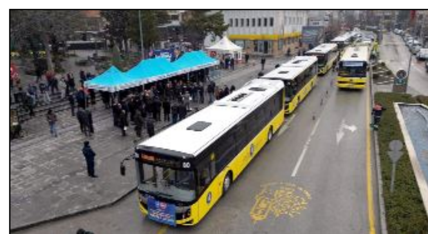
Çorum Belediyesi toplu ulaşımında kullanılmak üzere iki otobüsü daha araç filosuna kattı.