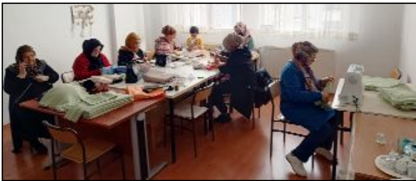
Alaca Halk Eğitim Merkezi kursiyerleri İsrail'in zulmü altında olan Gazze'deki masum çocuklara giysi ve battaniye dikiyorlar.

nebze bile ısıtmak istiyoruz" dedi. (İHA)