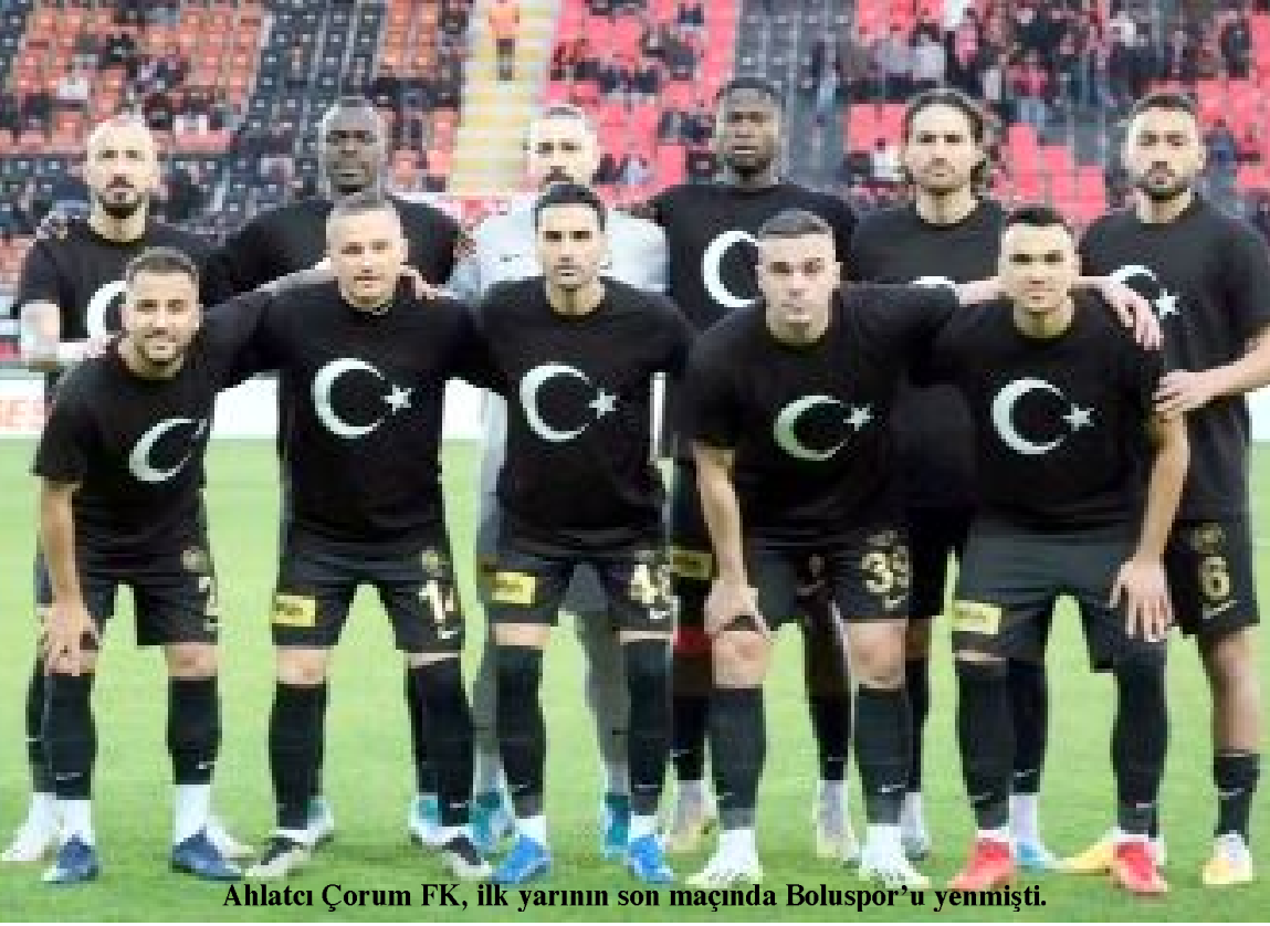
Ahlatçı Çorum FK, ilk yarının son maçında Boluspor'u yenmişti.