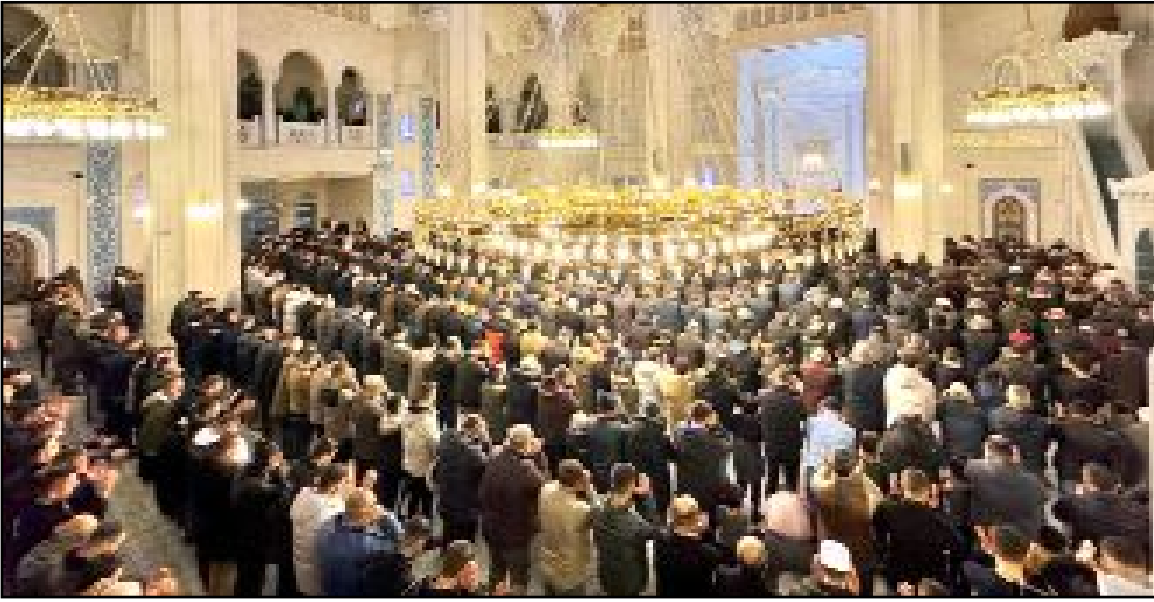
Çorum'da rahmeti ve bereketi bol olarak bilinen Hicri "üç ayların" başlangıcını simgeleyen Regaip Kandili'ni idrak etmek için vatandaşlar camileri doldurdu.