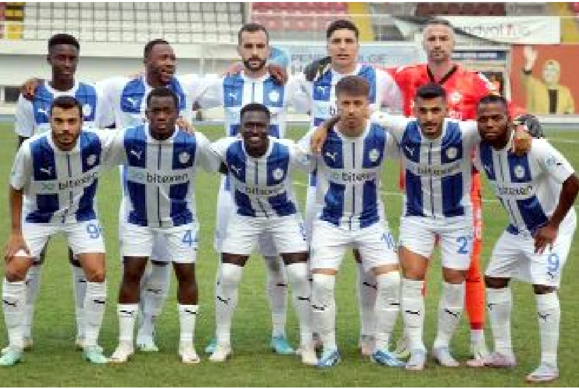
16 puanla düşme hattında bulunan Tuzlaspor, puanların yarısını deplasmanda aldı.