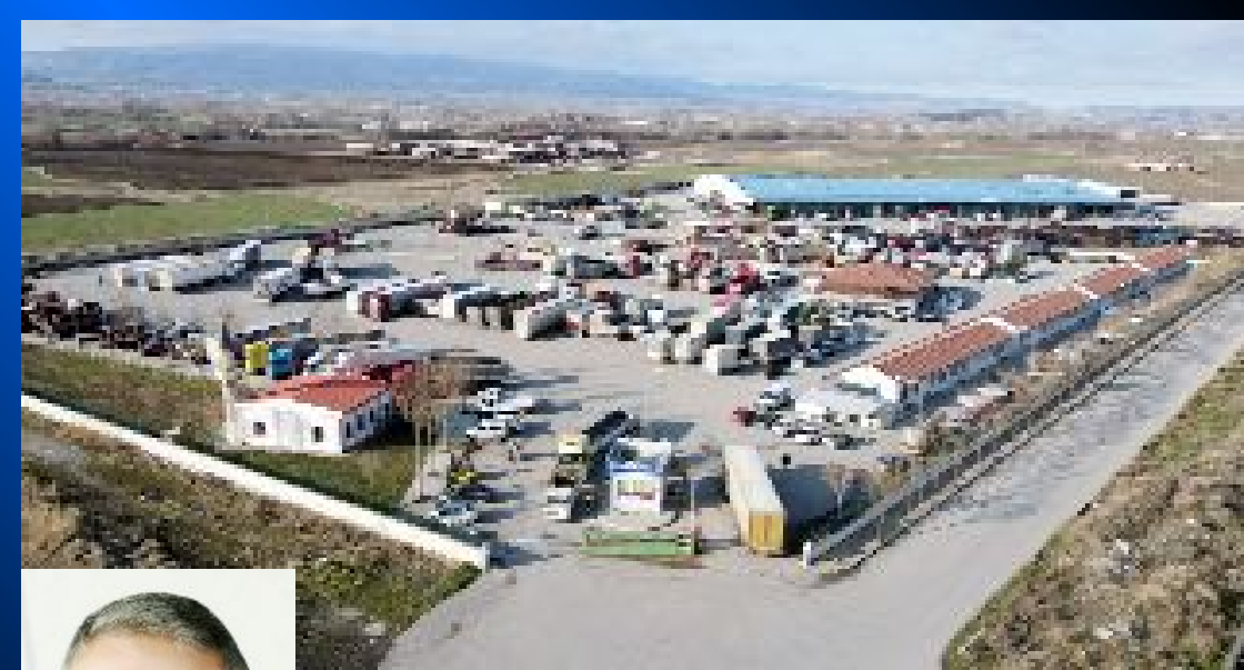
Çorum Nakliyeciler Sitesi ve Kamyon Garajı'nın işletmesini artık Çorum Belediyesi yapacak.