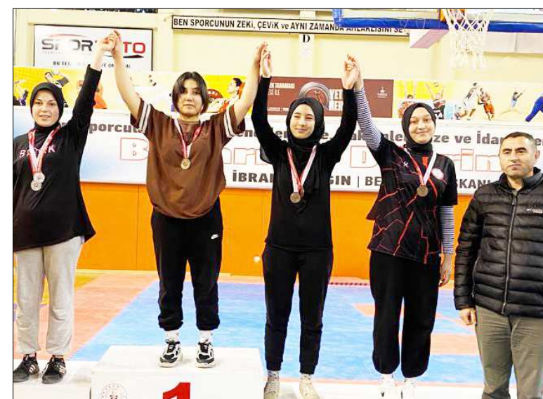
Dereceye giren sporcular madalya ile ödüllendirildi.