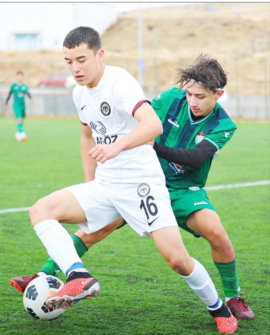
U17 Gelişim Ligi maçından bir enstantane...

Çorum FK altyapı takımlarından U17'ler bugün Uşakspor ile karşılaşırken, U14, U15 ve U16'lar ise yarın Kastamonuspor ile kozlarını paylaşacak.