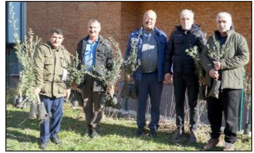
Osmancık Kaymakamlığı, ilçedeki atıl arazilerinin değerlendirilmesi ve tarımsal girdi elde edilmesi için "Zeytin Fidanı Dağıtım Projesi"ni hayata geçirdi.