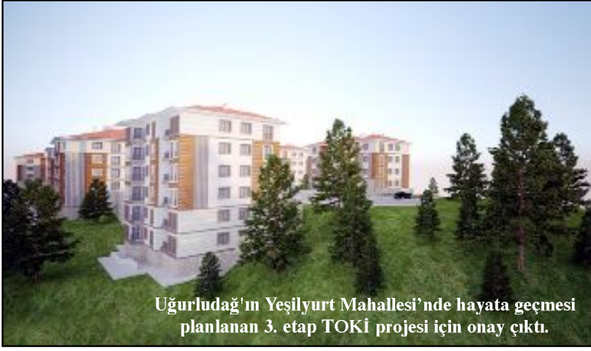
Uğurludağ'ın Yeşilyurt Mahallesi'nde hayata geçmesi planlanan 3. etap TOKİ projesi için onay çıktı.