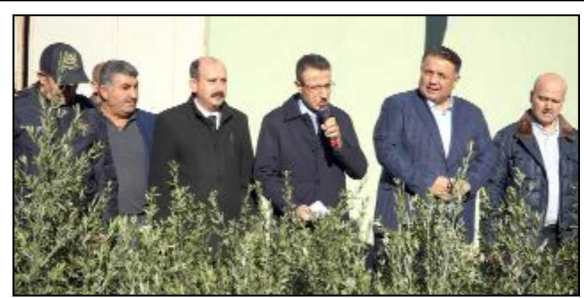
Çorum İl Özel İdaresi'nce desteklenen proje kapsamında ilçeye getirilen 3 bin Gemlik cinsi zeytin fidanı dağıtılmaya başlandı.