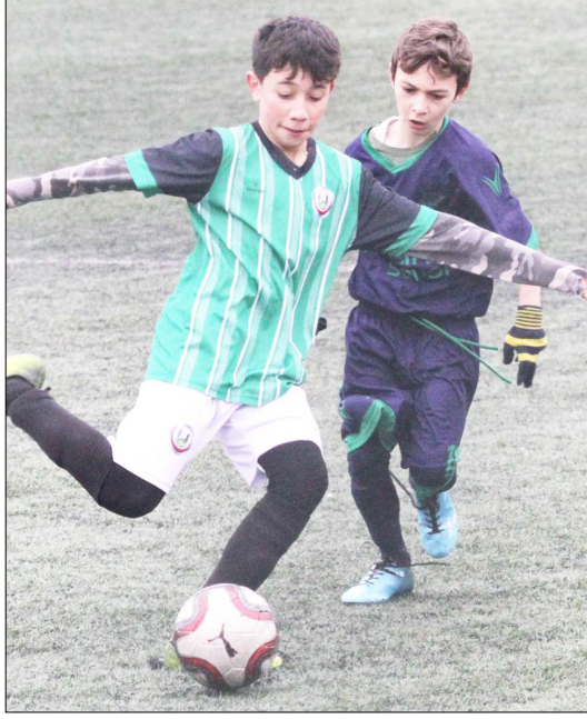
U14 Ligi maçından bir enstantane...

11.00'de Mimar Sinanspor ile Hattuşa Gençlikspor, saat 12.30'da Çorum Anadolu FK ile Osmancık Kandiberspor, saat 14.00'de Çorumspor ile H.E.Kültürspor karşılaşırken, Kargı İlçe Sahası'nda saat 12.00'de başlayacak maçta ise Kargıgücü ile 1907 Gençlikspor karşı karşıya gelecek. (Rifat KARA)