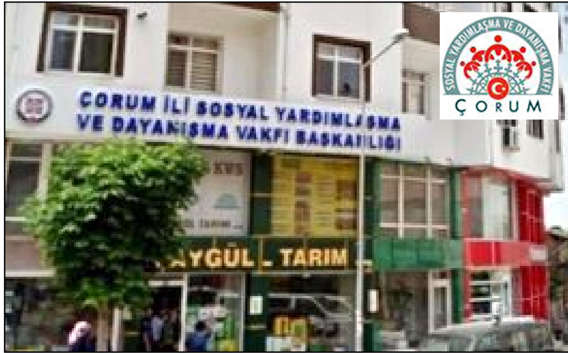
2023 yılında SYDV bünyesinde ihtiyaç sahiplerine 786 milyon lirayı aşan yardımda bulunuldu.