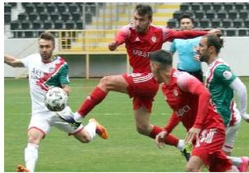
Ahlatçı Çorum FK, 14 Ocak 2021'de, sahasında Amed Sportif Faaliyetler'le 2-2 berabere kalmıştı.

Öte yandan, Tuzlaspor da tarihinde ikinci kez 14 Ocak günü resmi maç oynayacak. İstanbul temsilcisi, 14 Ocak 2016'da, sahasında Süper Lig ekibi Antalyaspor'la Ziraat Türkiye Kupası H Grubu maçında karşılaştığı ve mücadele 1-1 bitmişti. (Hüseyin AŞKIN)