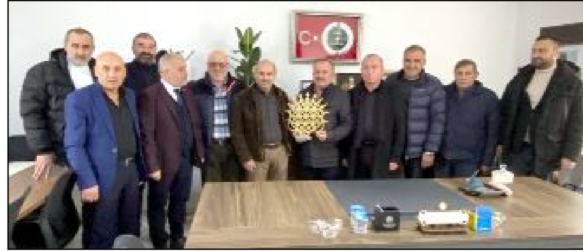
Esnaf ve sanatkar odası başkanları, S.S Zanaatkarlar Küçük Sanayi Sitesi Yapı Kooperatifi'ne genişleme alanı nedeniyle hayırlı olsun ziyaretinde bulundular.