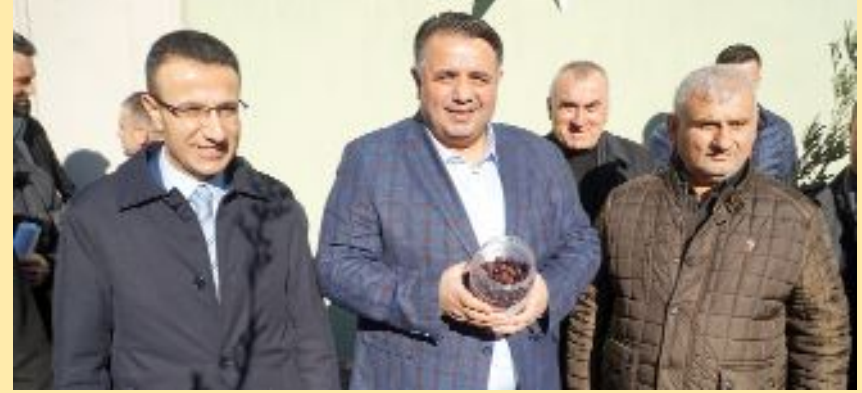
Çorum İl Özel İdaresi'nce desteklenen proje kapsamında ilçeye getirilen 3 bin Gemlik cinsi zeytin fidanı dağıtılmaya başlandı.

● Osmancık Kaymakamı, ilçedeki atıl arazilerin değerlendirilmesi ve tarımsal girdi elde edilmesi için "Zeytin Fidanı Dağıtım Projesi"ni hayata geçirdi. •5'de