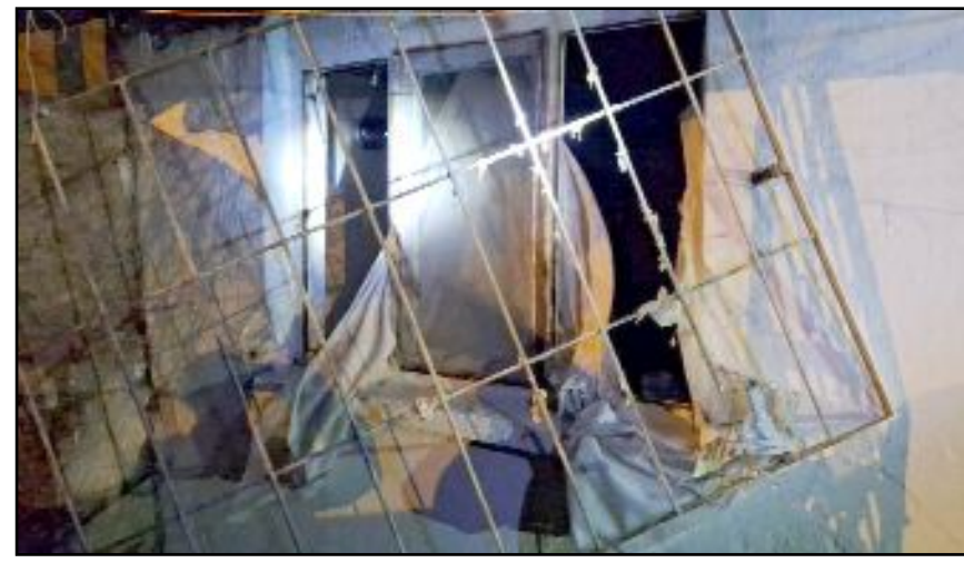
Evin penceresi patlamanın etkisiyle yerinden söküldü.

Olçok Eğitim ve Araştırma Hastanesine sevk edildi. Olayla ilgili başlatılan soruşturma sürüyor.(İHA)