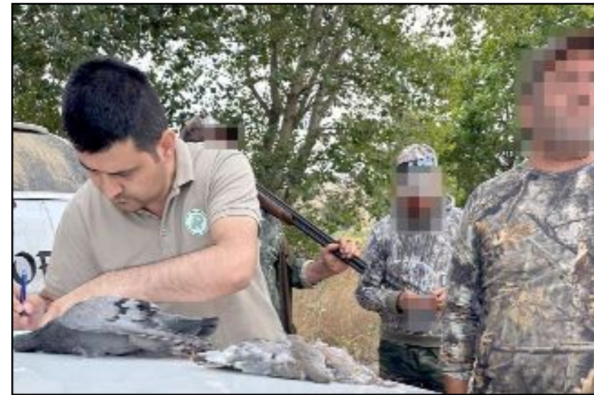
Çorum'da 2023 yılı içerisinde 94 kaçak avcıya 547 bin 435 lira para cezası kesildi.

Yapılan açıklamada, "Kaçak avcılıkla mücadelede yoğun bir şekilde ve kararlılıkla devam etmektedir" denildi. (Haber Merkezi)