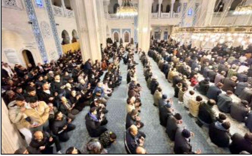
Regaip gecesi vesilesiyle İl Müftülüğü tarafından Akşemseddin Cami'nde kandil programı gerçekleştirildi.