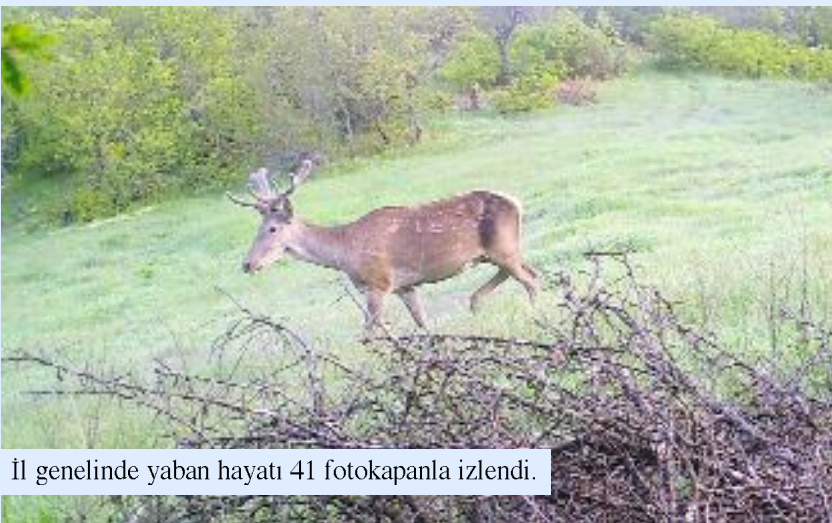
İl genelinde yaban hayatı 41 fotokapanla izlendi.