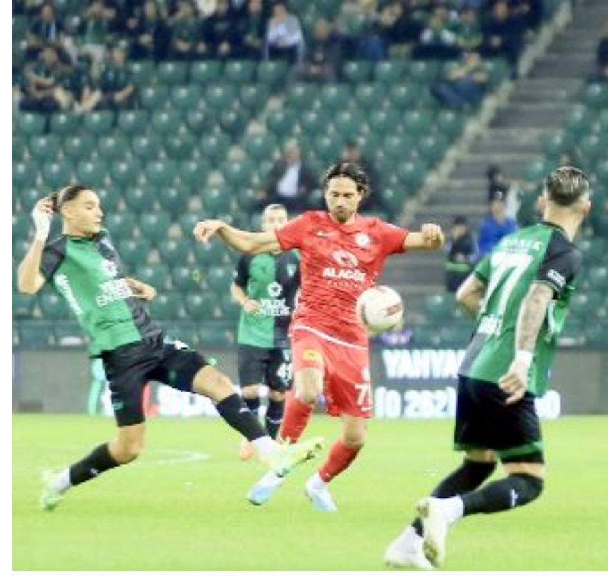
Ahlatçı Çorum FK, son yenilgisini 12 Kasım 2023'te, Kocaeli deplasmanında aldı. Kırmızı-siyahlı takım son dakika golüyle 2-1 yenilmişti.

Bu akşam Giresunspor'la karşılaşacak olan Ahlatçı Çorum FK son 6 maçında 5 galibiyet, 1 beraberlik aldı ve tam 16 puan topladı.