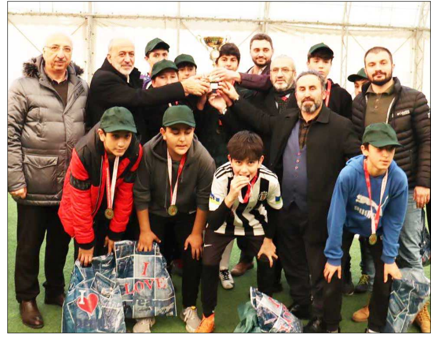
Şampiyon Selimiye Cami'ye kupasını Çağlar ile Biçer birlikte verdiler...

silcileri ve sporcular katıldı. Dereceye giren takımlar protokol üyeleri tarafından kupa ve madalya ile ödüllendirildi. (Rifat KARA)