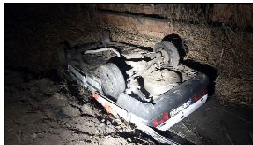
Kaza, Çorum-Osmancık karayolu, Çengele mevkiinde meydana geldi.