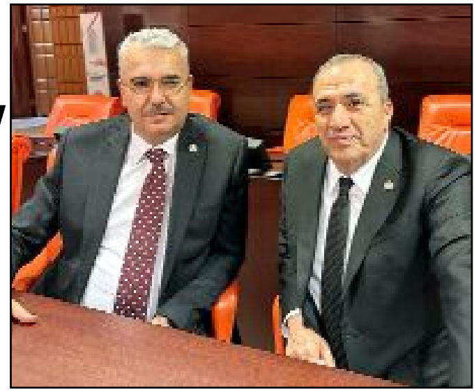
AK Parti Çorum Milletvekili Yusuf Ahlatcı ile MHP Çorum Milletvekili Vahit Kayırcı TBMM Genel Kurulu'nda birlik-beraberlik mesajı verdi.

Ahlatcı, "Çorum'un birlik ve beraberliği için Cumhur İttifakı'nın gücünü ortaya koymaya kararlıyız. Hedefimiz 16'da 16, bu yolda ilçelerimizi kucaklamak adına yoğun çaba sarf edeceğiz" dedi. (Haber Merkezi)