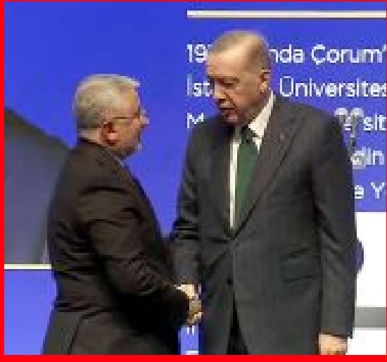
Cumhurbaşkanı Erdoğan, Başkan Aşgın ile bir süre sohbet etti.