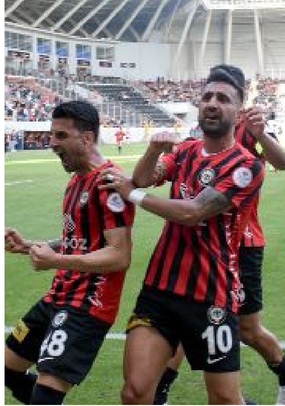
Ahlatçı Çorum FK, 398 maçta 174 galibiyet, 106 beraberlik alarak 628 puan topladı.

12 Kasım'daki Kocaelispor yenilgisinden sonra bileği bükülmeyen Ahlatçı Çorum FK, bu akşam Giresunspor'u da devirerek yenilmezlik serisini 7 maça çıkartmayı hedefliyor. (Hüseyin AŞKIN)