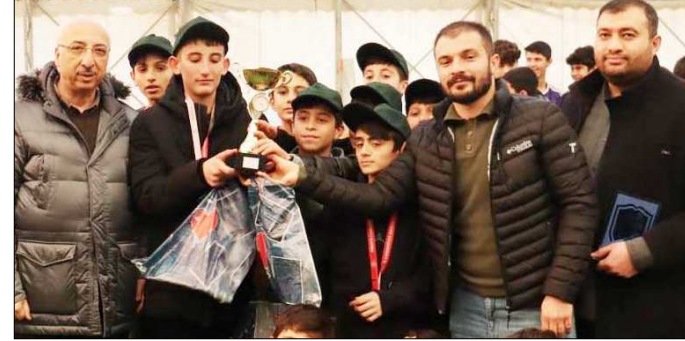
İkinci olan Orhan Gazi Cami kupası ile görülüyor...