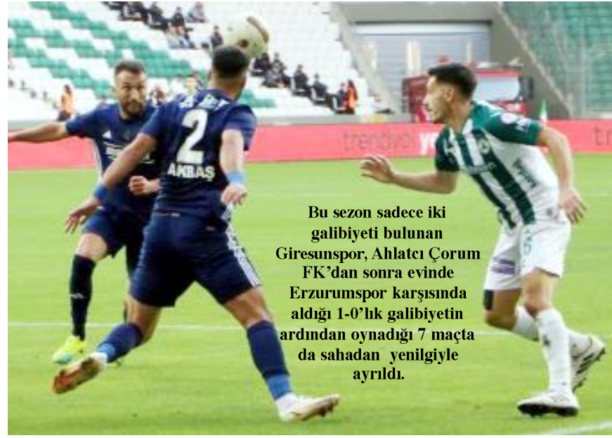
Bu sezon sadece iki galibiyeti bulunan Giresunspor, Ahlatçı Çorum FK'dan sonra evinde Erzurumspor karşısında aldığı 1-0'lık galibiyetin ardından oynadığı 7 maçta da sahadan yenilgiyle ayrıldı.

Giresunspor, topladığı 9 puanın 5'ini evinde alırken, 1-0 kazandığı Erzurumspor maçında 3, 0-0 biten Manisa FK ve Altay maçlarında ise hanesine 1'er puan yazdı. 18 maç sonunda sadece 11 gol atabilen Giresunspor, evinde oynadığı 8 maçta 2 gol bulabildi. Yeşil-beyazlı takım bu golleri Erzurumspor ve Kocaelispor'a attı. (Hüseyin AŞKIN)