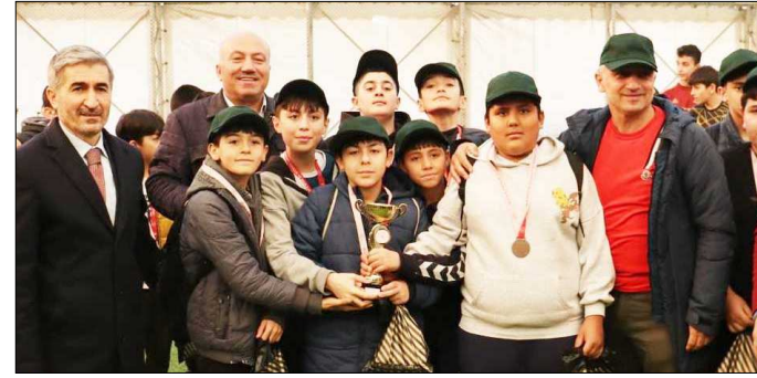
Üçüncü olan F.Sultan Mehmet Cami kupası ile görülüyor...