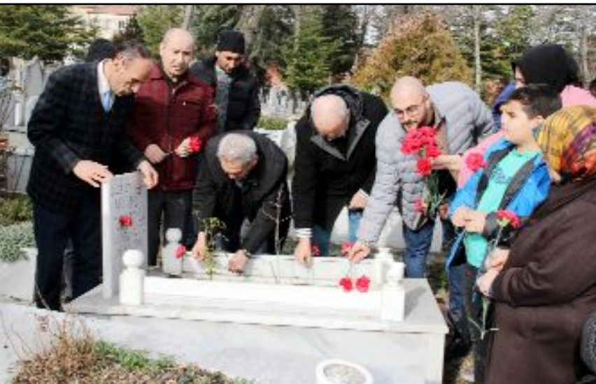
Çorum Gazeteciler Cemiyeti, Gazeteci-Yazar merhum Mahmut Tunaboğlu'nun doğumunun 70. yılı nedeniyle kabri başında bir anma programı düzenledi.