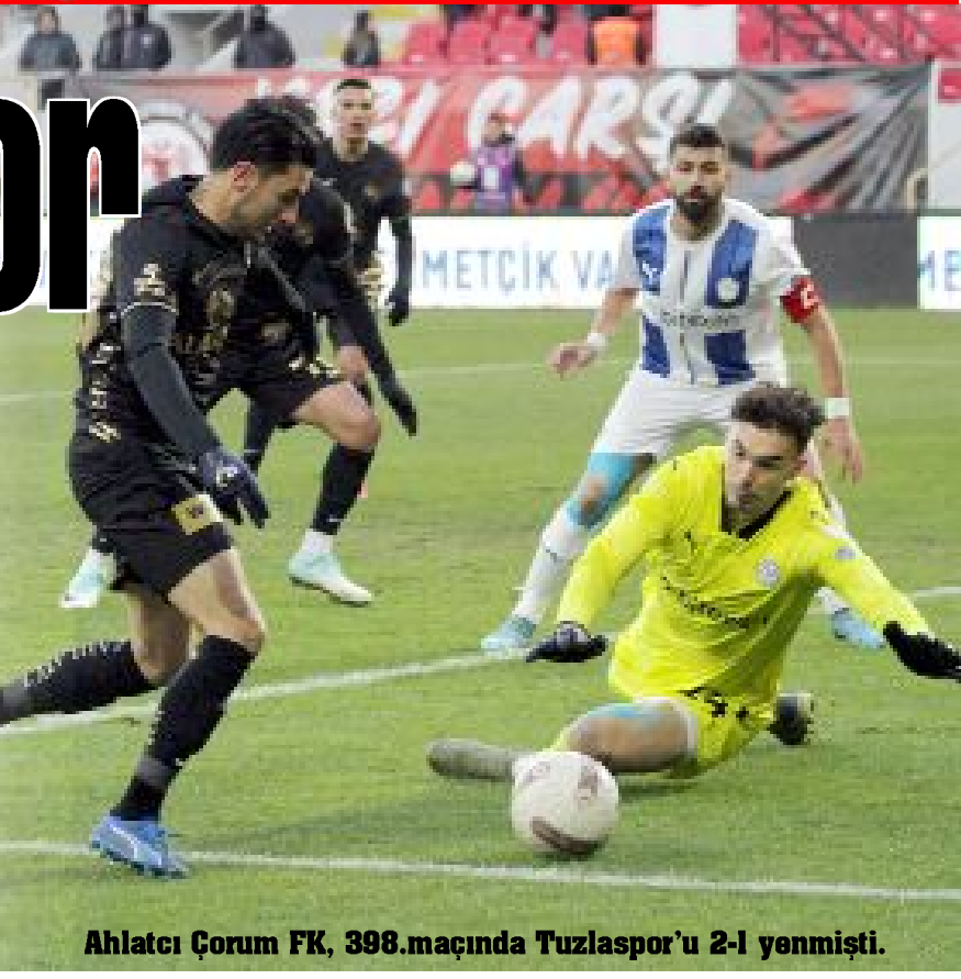
Ahlatçı Çorum FK, 398.maçında Tuzlaspor'u 2-1 yenmişti.