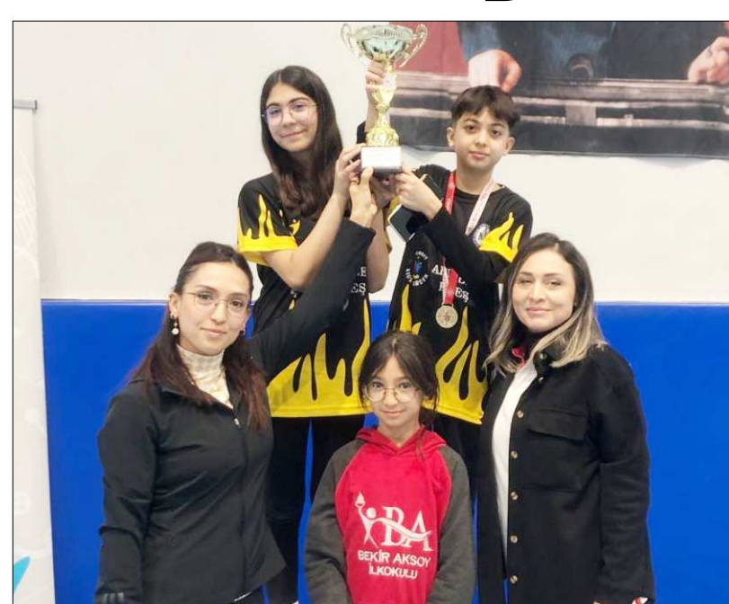
Şampiyon olan Necip Fazıl Kısakürek Ortaokulu karma takımı...