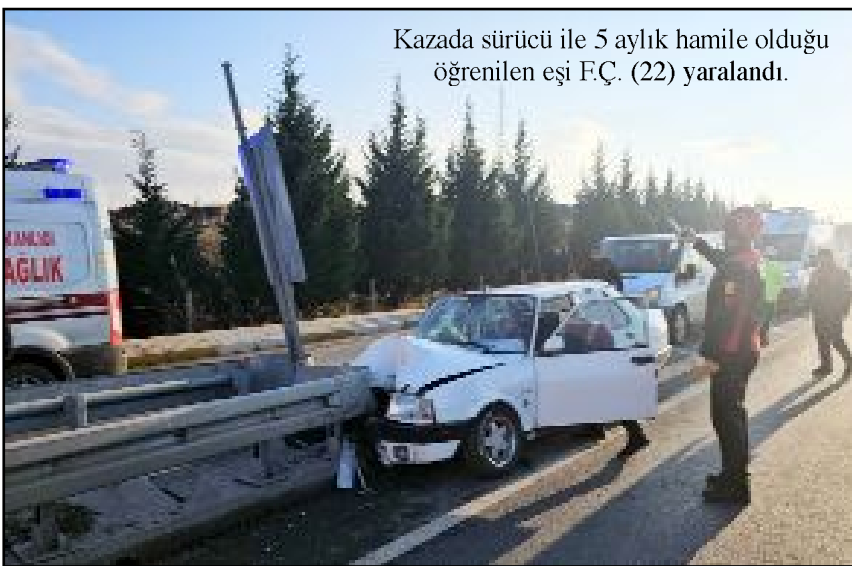
Kazada sürücü ile 5 aylık hamile olduğu öğrenilen eşi F.Ç. (22) yaralandı.

Olçok Eğitim ve Araştırma Hastanesine kaldırıldı.