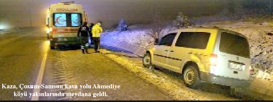
Kaza, Çorum-Samsun kara yolu Ahmediye köyü yakınlarında meydana geldi.