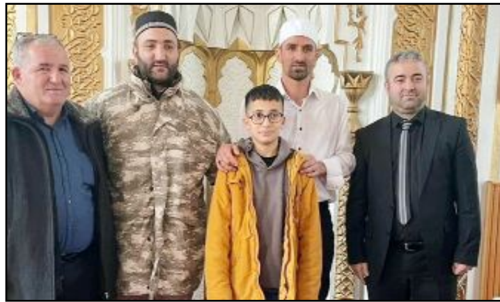
Boğazkale'nin Yekbas köyünde umre ödüllü Kur'an-ı Kerim'i güzel okuma yarışması düzenlendi.

Çorum'un Boğazkale ilçesine bağlı Yekbas köyünde, umre ödüllü Kur'an-ı Kerim'i güzel okuma yarışması düzenlendi.