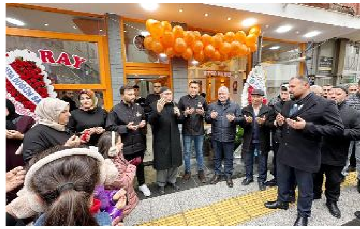
Karakeçili Mahallesi Azap Ahmet Sokak üzerinde faaliyet gösteren Saray Söğüş, dualar eşliğinde açıldı.