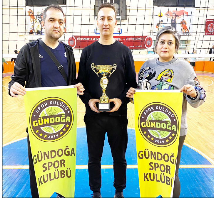
Gündoğa Spor Kulübü yetkilileri kupaları ile görülüyor...