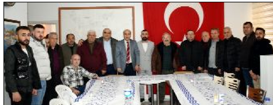
Düzenlenen toplantıda Ulukavak Mahallesi'nin sorunları da ele alındı.

Toplantıda Sanayi Sitesi'nin asayışı ele alınarak gerek yapılan çalışmalar değerlendirildi gerekse yapılması gereken çalışmalarla ilgili de fikir alışverişinde bulunuldu. (Haber Merkezi)