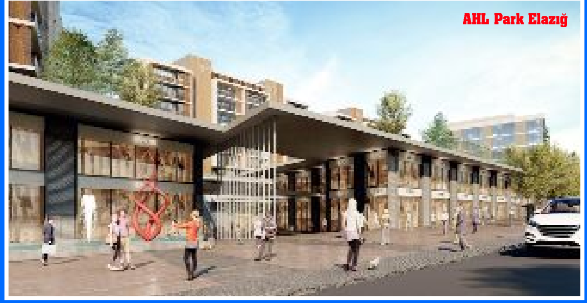
AHL Park Elazığ

● Ahlatcı Holding bünyesinde bulunan Ahlatcı Gayrimenkul Geliştirme A.Ş. 145.000 m2 alana sahip Çorum AHL Park Alışveriş ve Eğlence Merkezi'nden sonra, Konya ve Elazığ'da yaklaşık 350 milyon dolar maliyetle, şehrin ihtiyaçlarına göre belirlenen AVM, ofis ve konuttan oluşan 2 dev karma projeyi hayata geçirecek. İnşaatlara 2024 yılı ilk çeyreğinde başlanması planlanıyor. •3'de