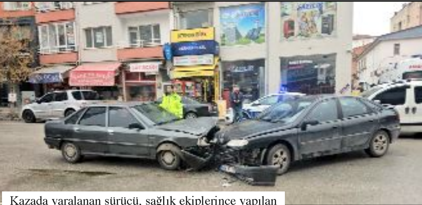
Kazada yaralanan sürücü, sağlık ekiplerince yapılan müdahalenin ardından hastaneye kaldırıldı.