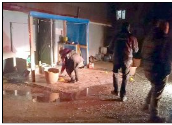
Olay Üçtutlar Mahallesi Osmancık Caddesi'nde meydana geldi.