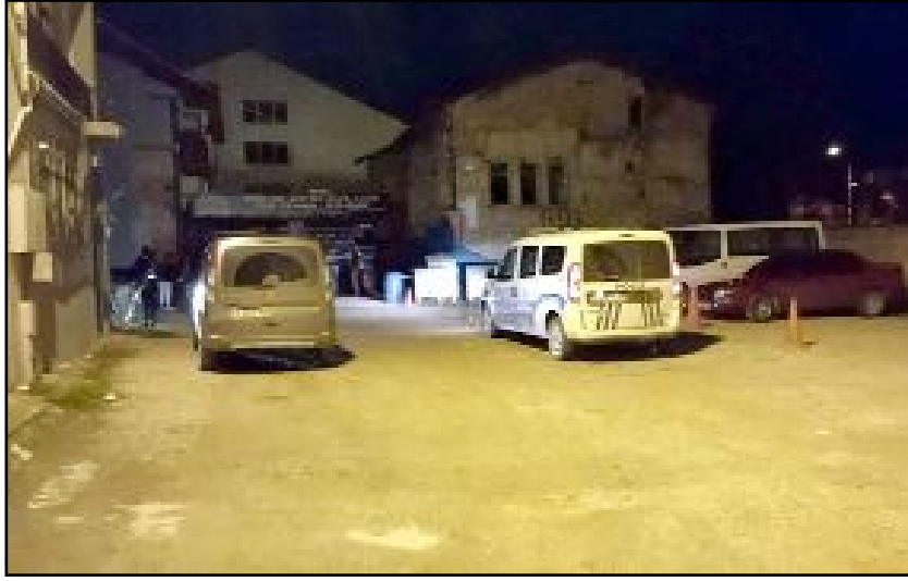
Olay yerinde inceleme yapan polis ekipleri çok sayıda boş kovan ele geçirdi.