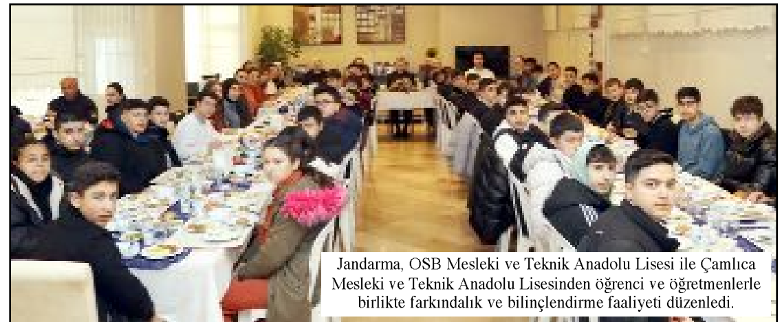
Jandarma, OSB Mesleki ve Teknik Anadolu Lisesi ile Çamlıca Mesleki ve Teknik Anadolu Lisesinden öğrenci ve öğretmenlerle birlikte farkındalık ve bilinçlendirme faaliyeti düzenledi.