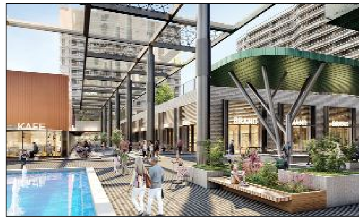
Konya projesinin tasarımı...