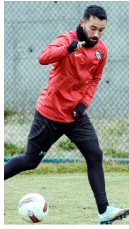
Ahlatcı Çorum FK dün yaptığı antrenmanla Göztepe mesaisine başladı.

lig satış noktasından veya maç günü stadyum girişlerinden verileceği açıklandı. (Hüseyin AŞKIN)