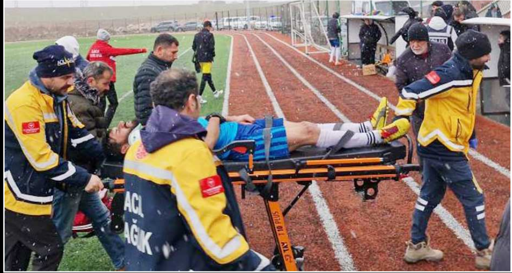
Genç futbolcu sahayı sedye ile terketti.

cu boynunun üzerine düşerek yaralandı. Saha içerisinde ilk müdahalesi yapılan futbolcu, ambulansla Alaca Devlet Hastanesi'ne kaldırılarak tedavi altına alındı. Karşılaşma Alaca Belediye Gençlikspor'un, Kargı Serispor'u 5-1 mağlup etmesiyle sonuçlandı. (İHA)