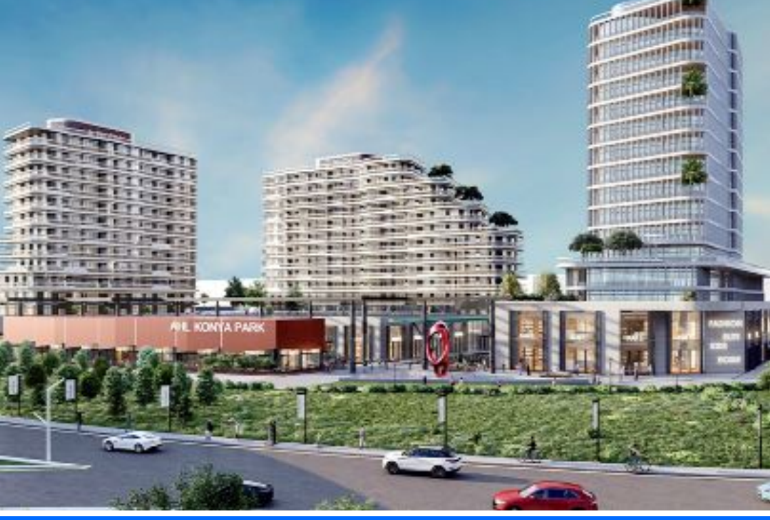
AHL Park Konya...

● Ahlatcı Holding bünyesinde bulunan Ahlatcı Gayrimenkul Geliştirme A.Ş. 145.000 m2 alana sahip Çorum AHL Park Alışveriş ve Eğlence Merkezi'nden sonra, Konya ve Elazığ'da yaklaşık 350 milyon dolar maliyetle, şehrin ihtiyaçlarına göre belirlenen AVM, ofis ve konuttan oluşan 2 dev karma projeyi hayata geçirecek. İnşaatlara 2024 yılı ilk çeyreğinde başlanması planlanıyor. •3'de