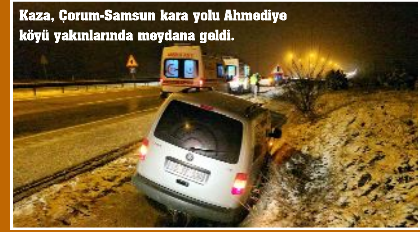
Kaza, Çorum-Samsun kara yolu Ahmediye köyü yakınlarında meydana geldi.