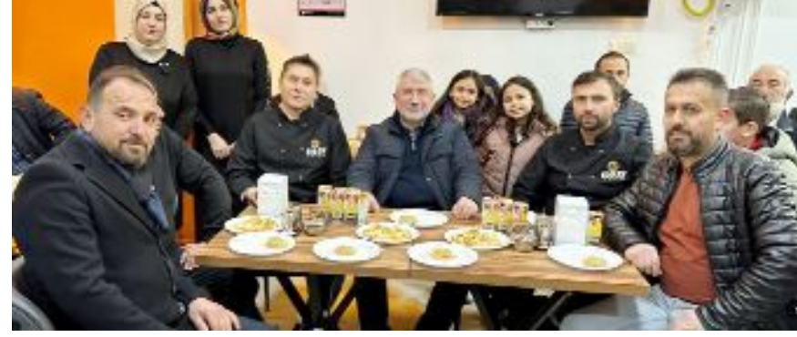
Açılışa katılanlara çeşitli ikramlarda bulunuldu.

Karakeçili Mahallesi Azap Ahmet Sokak 20/C (Saray Kiraathanesi yanı) adresinde faaliyet gösteren Saray Söğüş'te tüm ürünlerin köy ortamında organik yetiştirilerek müşterilere sunulduğu belirtildi. (Haber Merkezi)