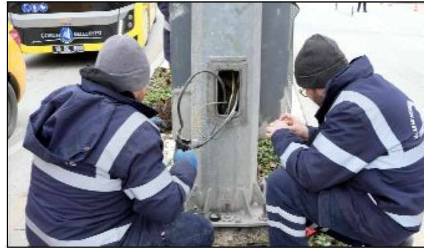
Belediye ekipleri deneme uygulamasının ardından lambayı devredışı bıraktı.

Çorum Belediyesi Basın Yayın ve Halkla İlişkiler Müdürlüğü'nden yapılan açıklamada Gazi Caddesi'nde PTT önünde yer alan yaya geçidine araç ve yaya trafiğinin düzenlenmesi için geçici olarak sinyalizasyon ışıkları yerleştirdiklerini, istedikleri verileri elde ettiklerini, trafik lambalarını devre dışı bıraktıklarını, elde ettikleri bu