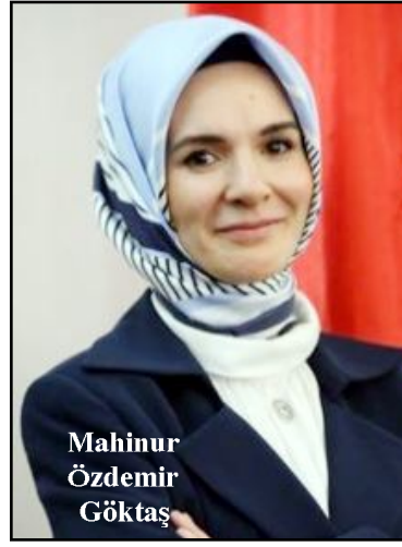
Mahinur Özdemir Göktaş

lerinden kopmamasını amaçlıyoruz. Çocukların aile ortamında büyümelerinin toplumsal değerlerin korunmasında vazgeçilmez bir rolü olduğuna inanıyoruz. Aile odaklı sosyal hizmet modellerimiz ile çocukların öncelikli olarak aile şefkati ve sıcaklığı ile yetişmelerini için gayret gösteriyoruz." (AA)