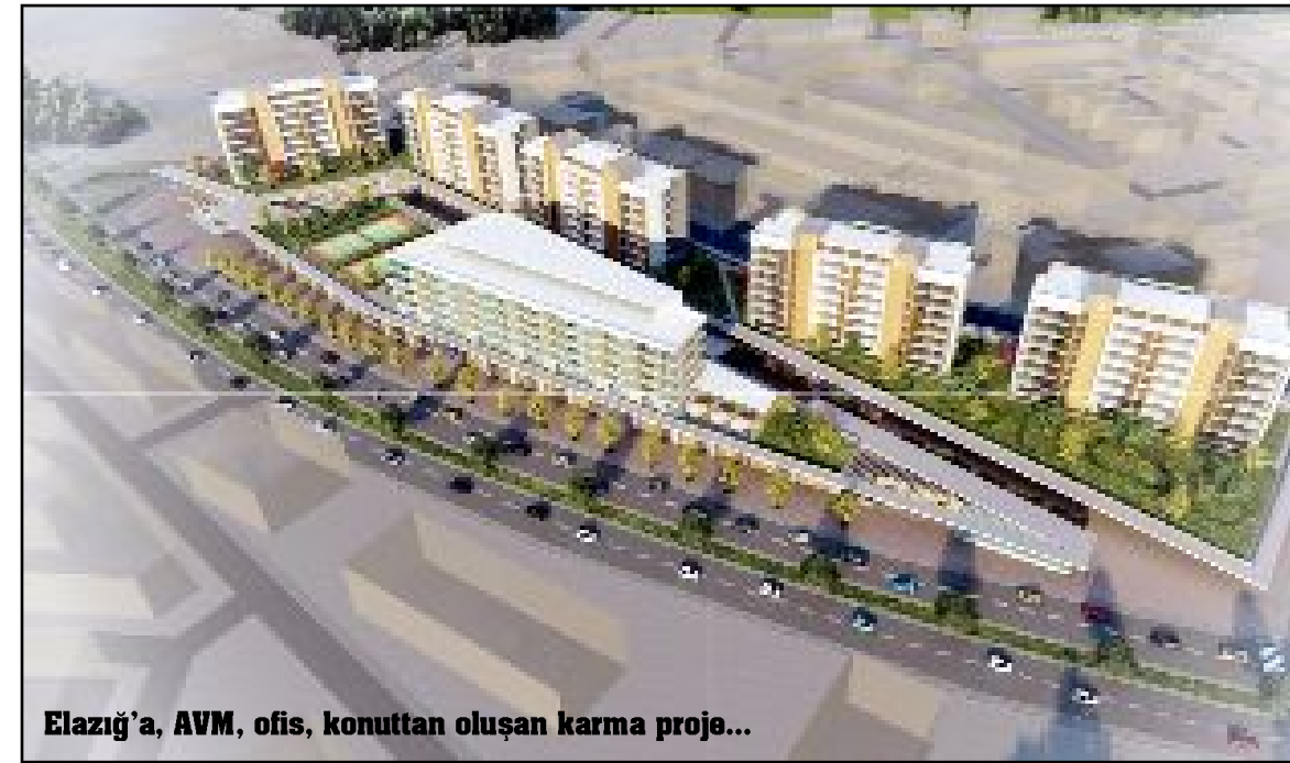
Elazığ'a, AVM, ofis, konuttan oluşan karma proje...

Proje ile ilgili gerekli çalışmalar tamamlanmış, inşaat ruhsatları alınmış ve 2024 yılı 1. çeyreğinde inşaat başlanması planlanmaktadır. (Haber Merkezi)