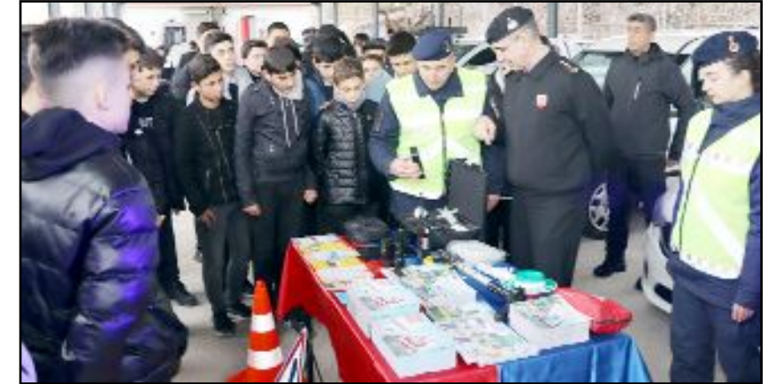
Jandarma Komutanlığı'nda Çevre Doğa ve Hayvanları Koruma Timleri, Aile Çocuk Kadın Kısım Amirliği, Olay Yeri İnceleme Timleri, Trafik Timleri, Asayiş Komando Timleri ziyaret edildi.

Öğrencilerimizin izin kapsamında Jandarmayı tanıması, milli birlik ve beraberlik duygularının pekişmesi ve sosyal farkındalıklarının artış göstermesine büyük katkı sağlayacaktır." (Haber Merkezi)