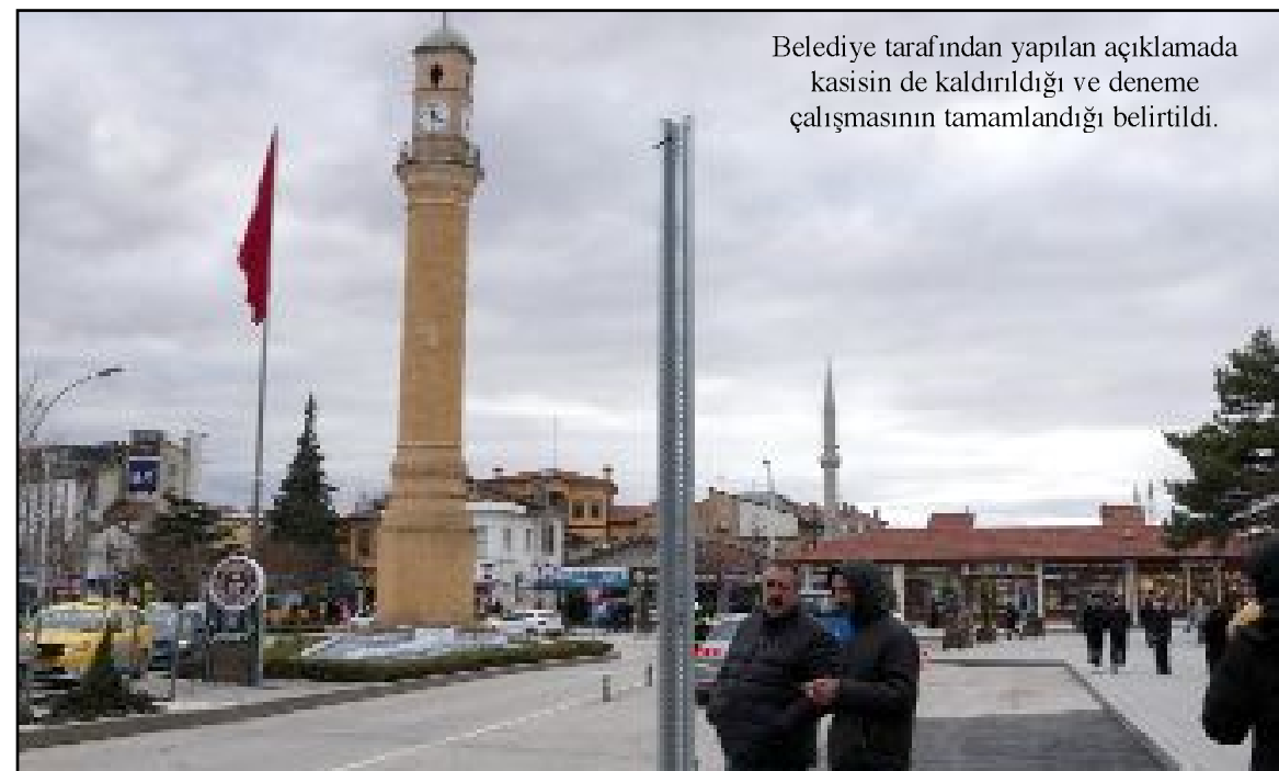
Belediye tarafından yapılan açıklamada kasisin de kaldırıldığı ve deneme çalışmasının tamamlandığı belirtildi.

Bu arada trafik ışıklarının kablolarını için geçici olarak konulan kasisler de Belediye ekipleri tarafından kaldırıldı. (Haber Merkezi)