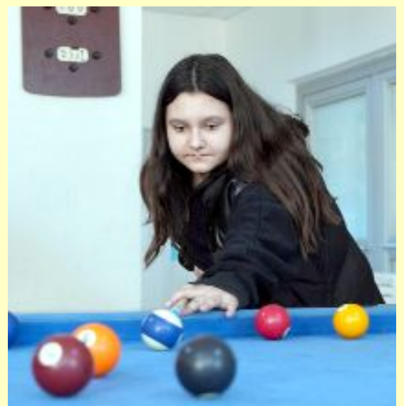
Yüz boyama, palyaço ve spor parkuru gibi etkinliklerin ikinci etabı AHL Park AVM'de olacak.