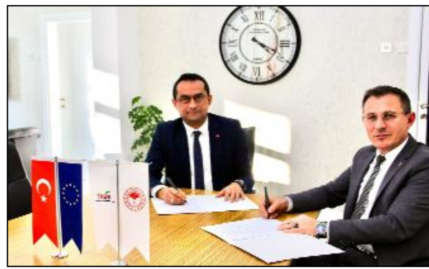
Tarım ve Kırsal Kalkınmayı Destekleme Kurumu tarafından Çorum İli Damızlık Sığır Yetiştiricileri Birliği'ne 8,2 milyon liralık hibe verilecek.

vuru Çağrısına verdiğimiz ve sözleşmesini imzaladığımız projemizle; 5 adet süt taşıma aracı, 5 adet araç üstü süt taşıma tankı ve 1 adet süt analiz cihazı alıyoruz. Böylece yeni taşıma araçları ve tanklarla süt toplama ağımlarını güçlendirirken, analiz cihazıyla da topladığımız sütün kalitesinden ödün veremeyeceğiz. Toplam yatırım tutarı 13,8 milyon lira bulan bu yeni projemizi tamamladığımızda, TKDK