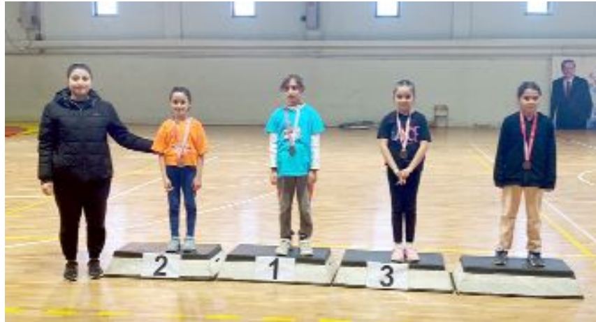
Kategorilerinde dereceye giren sporcular madalya ile ödüllendirildi.

Müsabakalar sonunda düzenlenen törenle dereceye giren sporculara madalyaları verildi. (Rıfat KARA)