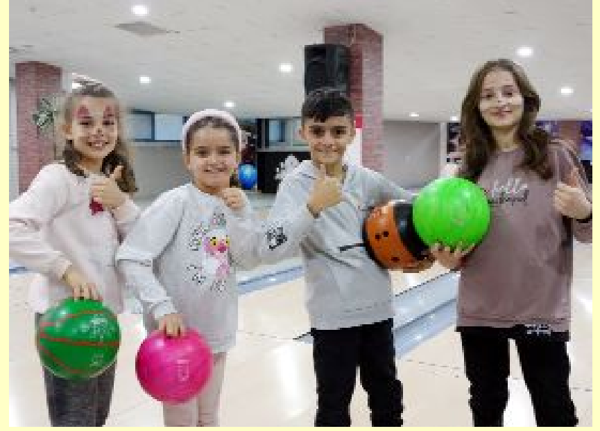
Belediye tarafından öğrenciler için hazırlanan etkinlikler Buhara Kültür Merkezi'nde başladı.

Yarıyıl eğlencelerinin ikinci etabı ise AHL Park AVM'de olacak. Sahne gösterisi, spor etkinlikleri, yüz boyama ve palyaço gösterilerinin sunulacağı etkinlikler AHL Park AVM'de 3 ve 4 Şubat'ta 13.00 - 16.00 saatlerinde yapılacak. (Haber Merkezi)