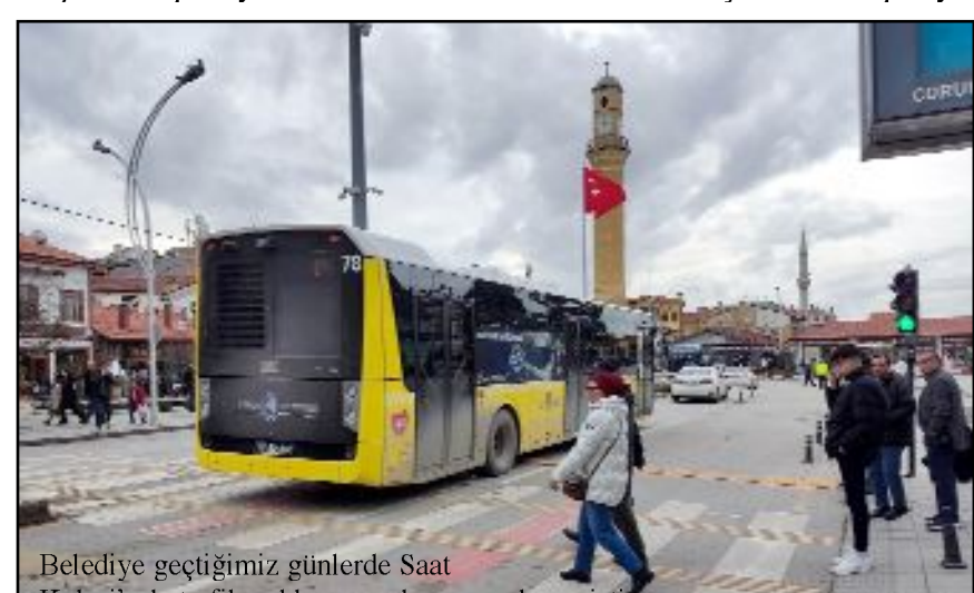
Belediye geçtiğimiz günlerde Saat Kulesi'nde trafik ışıkları uygulamasını denemişti.

İhbar üzerine olay yerine polis ve sağlık ekipleri sevk edildi. Her iki sürücüde yaralanmadıkları belirtilerek tedaviye reddederken, kaza nedeni ile tek şerite düşen yol araçların çekilmesinin ardından normal seyrine döndü. (Tugay GÖKTÜRK)