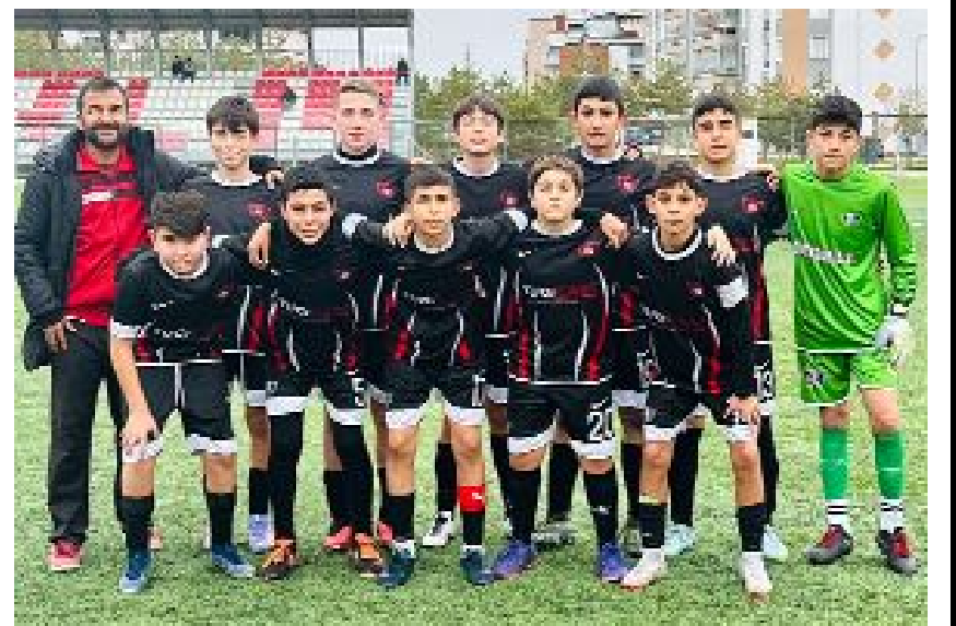
Hattuşa Gençlikspor lider durumda bulunuyor.

Play-Off grubunun ilk haftasında oynanan maçlarda, Hattuşa Gençlik deplasmanda Osmancık Kandiberspor'u 2-0 yenerken, Vefaspor'la Kültürspor 0-0 berabere kalmıştı. (Rıfat KARA)