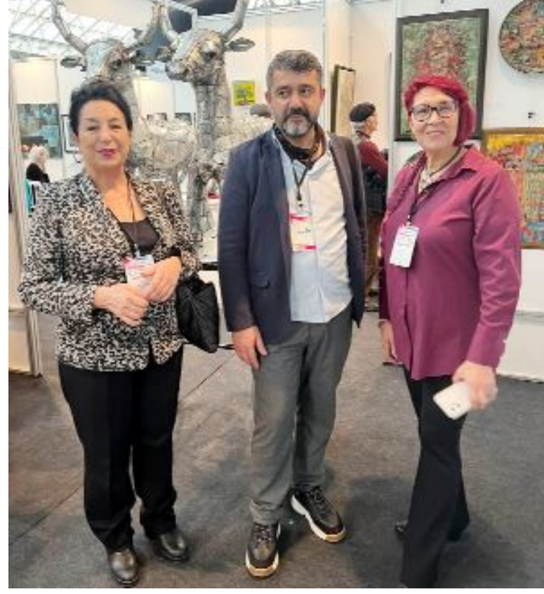
Mustafa Oktay'ın metal heykelleri ilgiyle karşılandı.