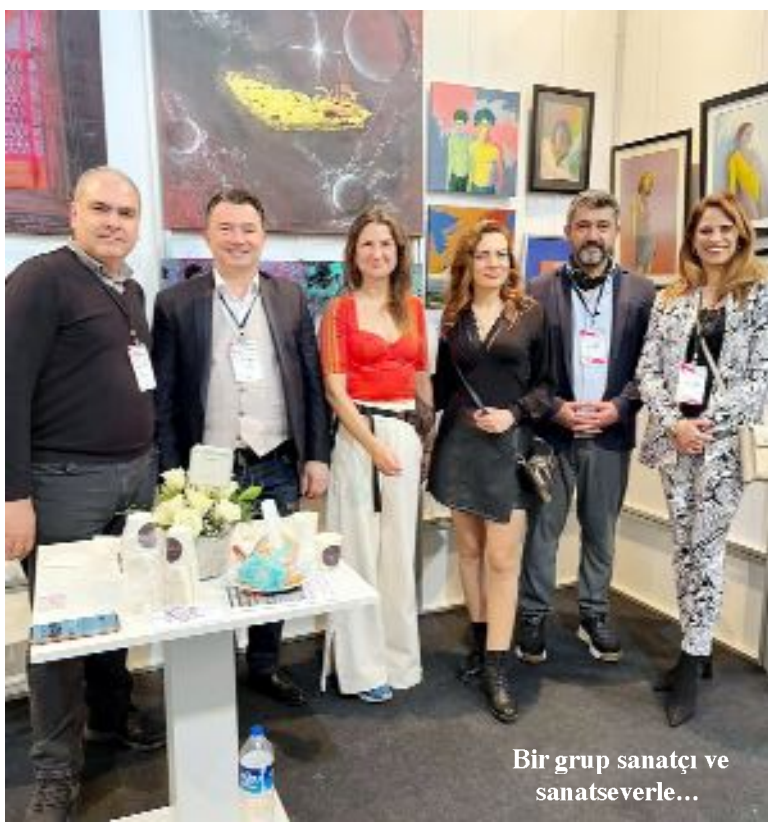
Bir grup sanatçı ve sanatseverle...