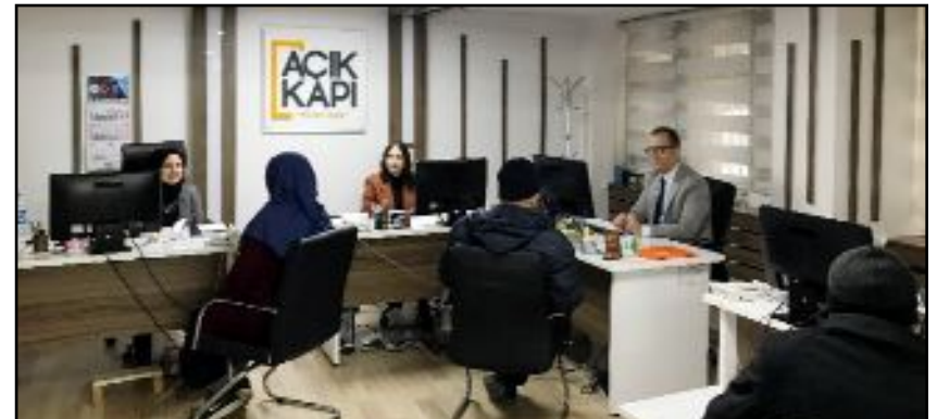
Açık Kapı Şube Müdürlüğü, Valilik Ek Bina-1 giriş katında hizmet veriyor.