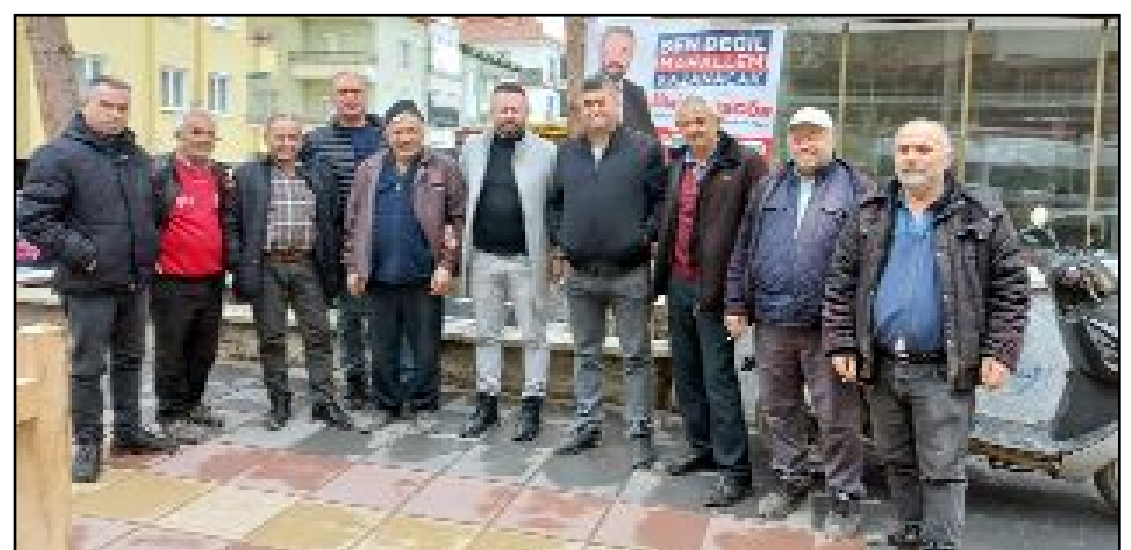
Bahçelievler Mahallesi sakinlerinden bir grupla...