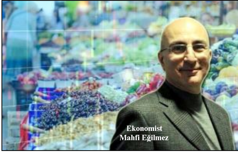
Ekonomist Mahfi Eğilmez

● "Enflasyon, günümüzde bütün dünyada tehdit oluşturuyor. Gelişmiş ülkelerde enflasyon daha düşük olsa da (ortalama yüzde 4 dolayında) onların alıştığı yüzde 2 dolayındaki enflasyona göre yüksek olarak kabul ediliyor." diyen Mahfi Eğilmez, şu değerlendirmeyi yaptı: