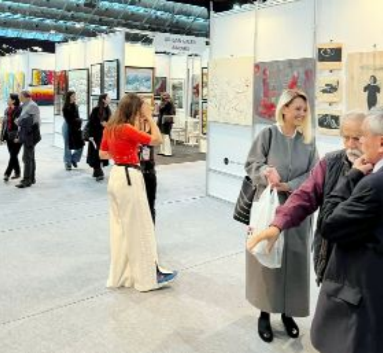
1. Antalya Çağdaş Sanat Fuarı'na yoğun sanatsever ilgisi...