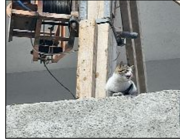
Bir inşaatın tepesinde mahsur kalan kediyi itfaiye ekipleri kurtardı.

Binanın giriş kapısının kapalı olması nedeniyle merdiven kullanan itfaiye ekipleri, bina katlarında yaptıkları aramalara rağmen mahsur kaldığı düşünülen kediyi bulamadılar. (Tugay GÖKTÜRK)