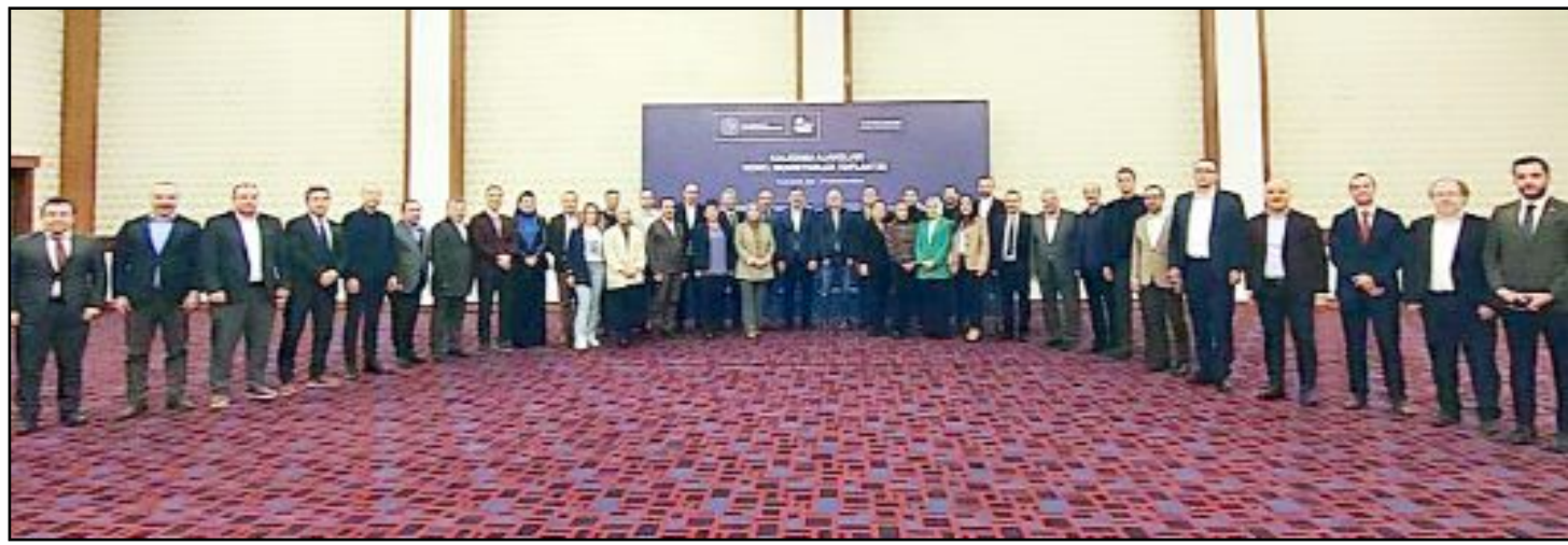
Sanayi ve Teknoloji Bakanlığı'nda Kalkınma Ajansları Genel Sekreterler Toplantısı düzenlendi.