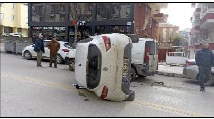
Ata Caddesi üzerinde iki aracın çarpıştığı kazada otomobil yan yattı. Kazada iki sürücü de yara almadı.