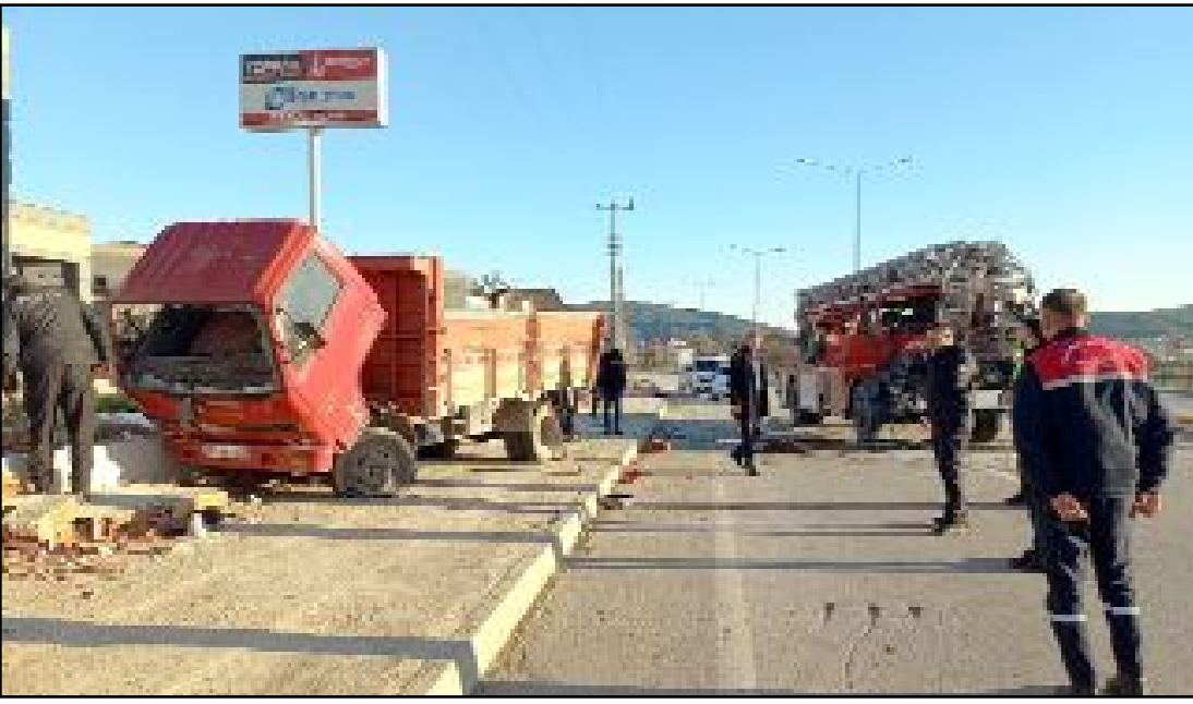
Kaza, Koyunbaba Mahallesi, Rifat Göbel Caddesi (Kamil yolu) üzerinde meydana geldi.