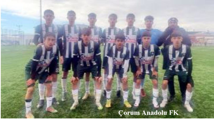
Çorum Anadolu FK

GOLLER: Emirhan (2), H.Ege (2), Yiğit (2), Yusuf