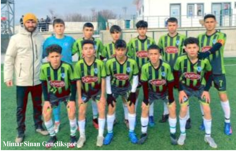
Mimar Sinan Gençlikspor

Bu sonuçların ardından A grubunda Mimar Sinanspor 8'de 8 yaparak 24 puana ulaşırken, B grubunda 7'de 7 yapan Çorum Anadolu FK ise puanını 21 yaptı. (Rıfat KARA)