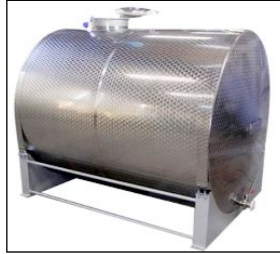
TKDK desteği ile 5 adet süt taşıma aracı, 5 adet araç üstü süt taşıma tankı ve 1 adet süt analiz cihazı satın alınacak.