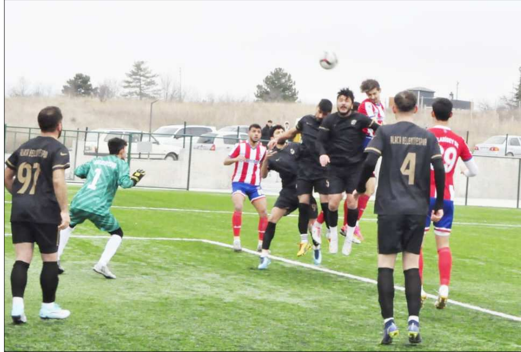
Gülábibeyspor-Alaca Belediyespor maçından bir enstantane...