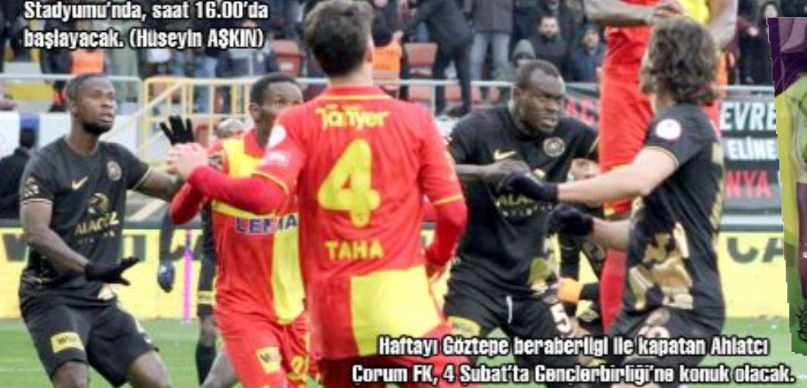
Haftayı Göztepe beraberliği ile kapatan Ahlatcı Çorum FK, 4 Şubat'ta Gençlerbirliği'ne konuk olacak.

Ligin 20.hafta maçında, sahasında İzmir temsilcisi Göztepe ile 1-1 berabere kalan Ahlatcı Çorum FK dün izinli olarak geçirdi. Kırmızı-siyahlı takım 1 günlük izin ardından Gençlerbirliği ile oynayacağı 21.hafta maçının hazırlıklarına bugün başlayacak. Sportif Direktör Muhammed Fettahoglu'nun verdiği bilgilere göre, bugün 17.00'de toplanacak olan kırmızı-siyahlılar, 18.00'de yapacakları antrenmanla Gençlerbirliği maçının hazırlıklarına başlayacaklar. Ahlatcı Çorum FK ile Gençlerbirliği arasındaki 21.hafta maçı, 4 Şubat Pazar günü, Ankara-Ermeyan Stadyumu'nda, saat 16.00'da başlayacak. (Hüseyin AŞKIN)