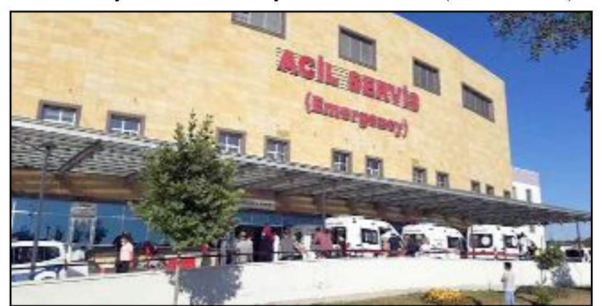
Hitit Üniversitesi Erol Olçok Eğitim ve Araştırma Hastanesi acil servis başvuru rakamları açıklandı.

yatırılarak tedavi edildi. (Haber Merkezi)