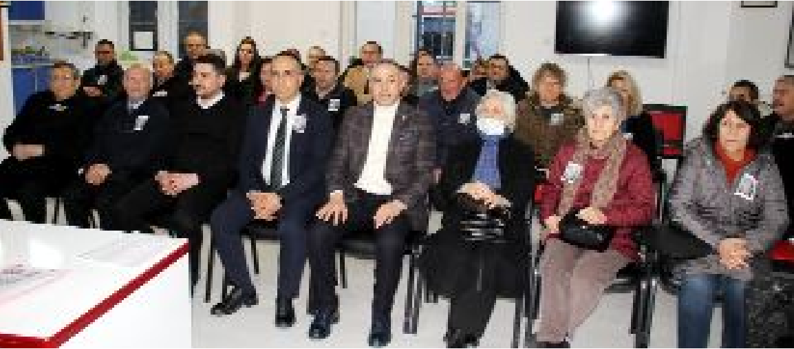
Atatürkçü Düşünce Derneği Çorum Şubesi'nde Uğur Mumcu için anma programı düzenlendi.