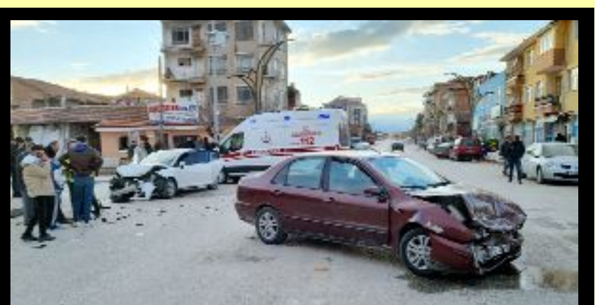
Çorum'un Alaca ilçesinde iki otomobilin çarpışması sonucu meydana gelen trafik kazasında 3 kişi yaralandı.