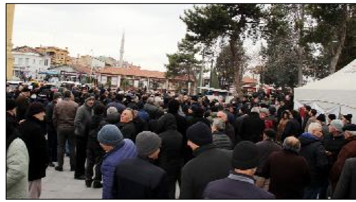
Emekliler, Postane önünde düzenledikleri basın açıklaması ile yapılan zamları protesto ettiler.