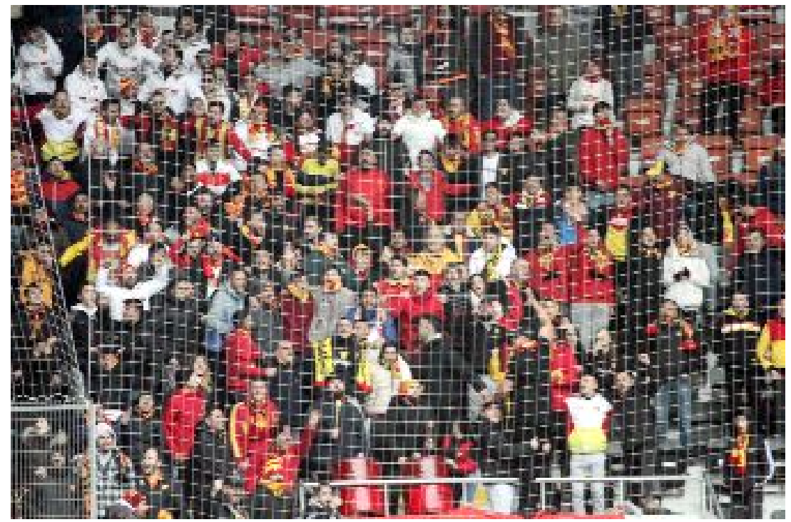
İzmir'den gelen 100'e yakın Göztepe taraftarı takımını yalnız bırakmadı.