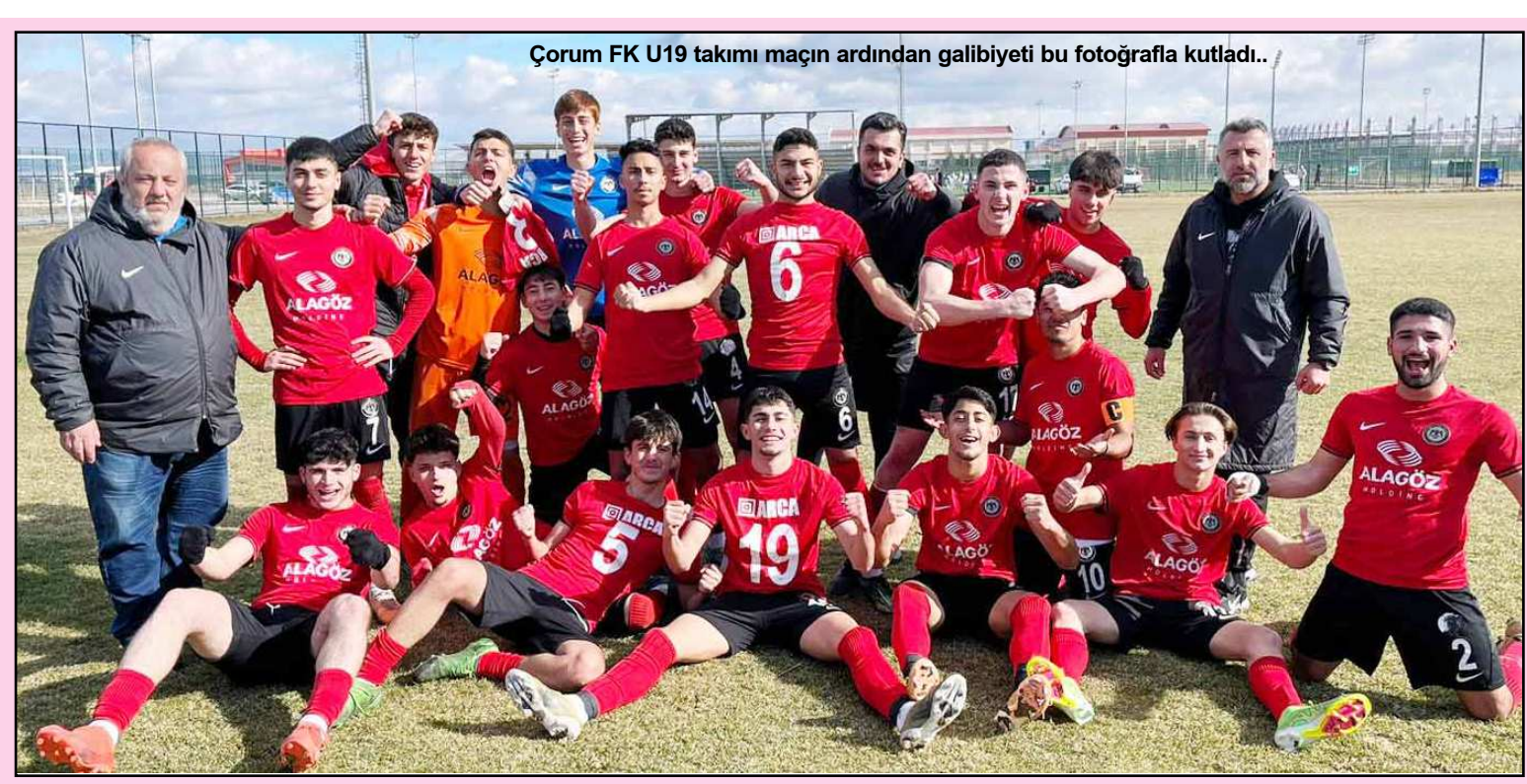
Çorum FK U19 takımı maçın ardından galibiyeti bu fotoğrafla kutladı..