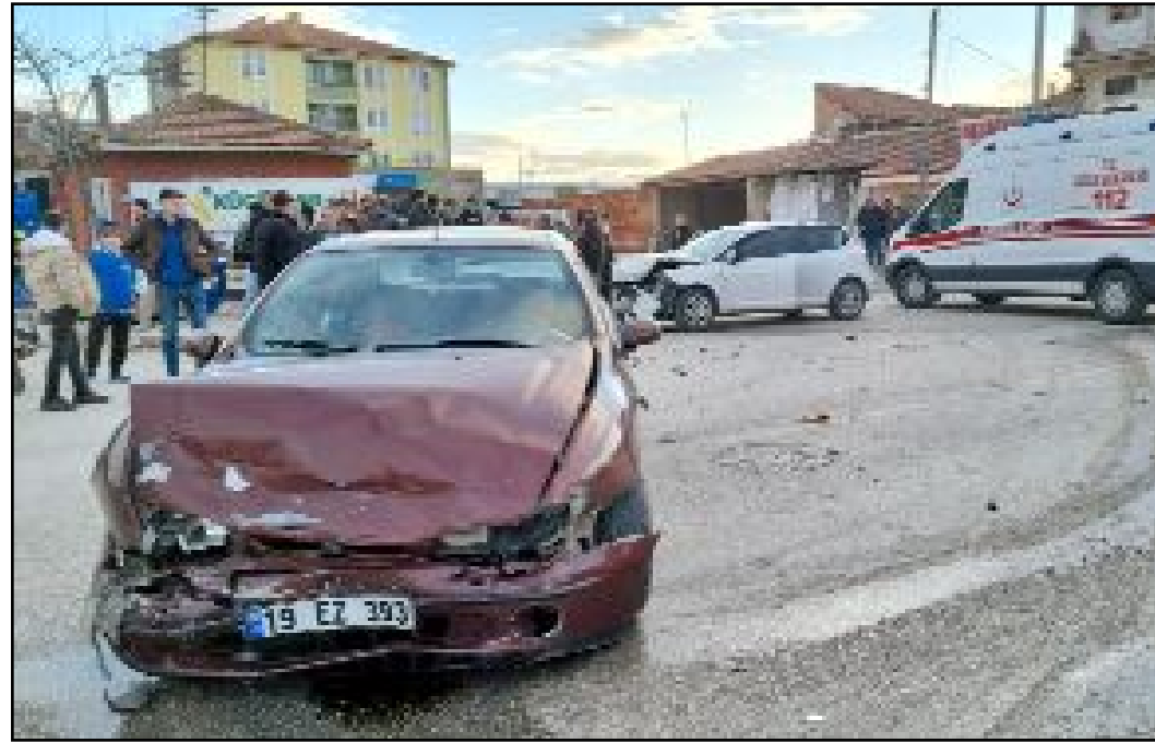
Kaza, Ankara Caddesi'nde meydana geldi.

Kaza ile ilgili başlatılan soruşturma sürüyor.