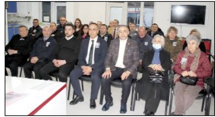
Atatürkçü Düşünce Derneği Çorum Şubesi, Araştırmacı Gazeteci-Yazar Uğur Mumcu'yu unutmadı.