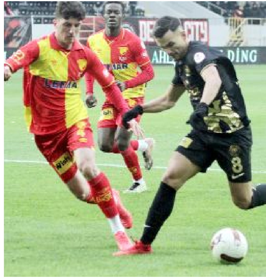
Ahlatçı Çorum FK ile Göztepe arasında oynanan maçtan bir anstantane...

DAKİKA 90+4: Çorum FK gole yaklaştı. Soldan yeni transfer Hakan'ın ortasında Gökhan'dan seken topu penaltı noktası civarında kontrol eden Thomas'ın şutu üstten auta gitti. (Hüseyin AŞKIN)