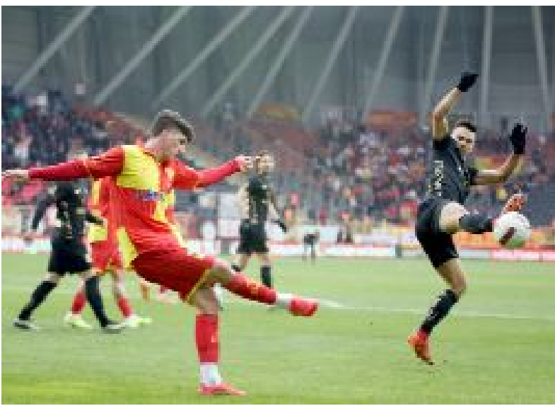
Ahlatçı Çorum FK, bu sezon sahasındaki ilk beraberliğini Cumartesi günü Göztepe'ye karşı 1-1'lik skorla aldı.

Daha önce Ümraniyespor'la 0-0 berabere kalan Göztepe ise, deplasmandaki ikinci beraberliğini Çorum'da aldı. (Hüseyin AŞKIN)