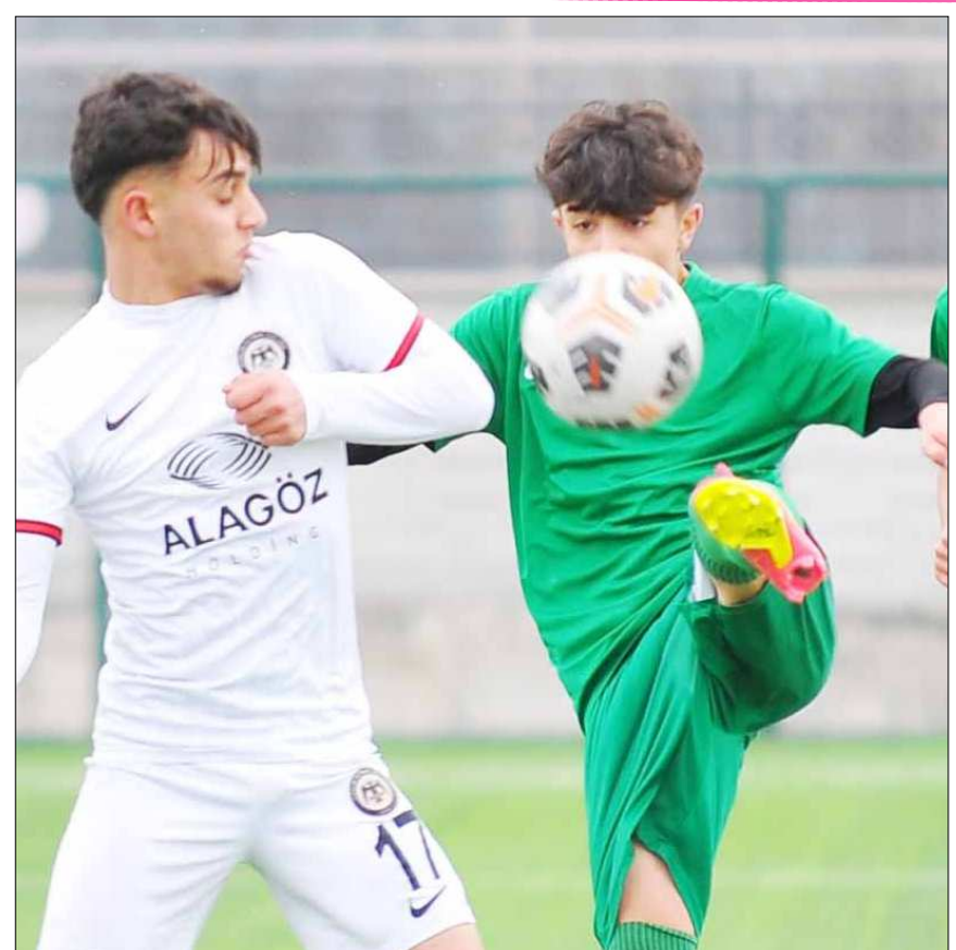
Çorum FK ile Kırşehir FK arasında oynanan maçtan bir enstantane...