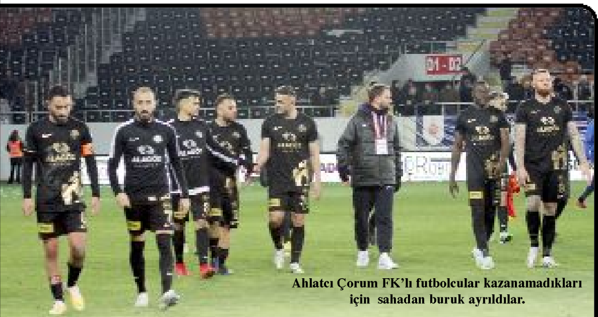
Ahlatçı Çorum FK'lı futbolcular kazanamadıkları için sahadan buruk ayrıldılar.

Cumartesi günkü maçta Ahlatçı Çorum FK'da sarı kart gören oyuncu olmadı. (Hüseyin AŞKIN)