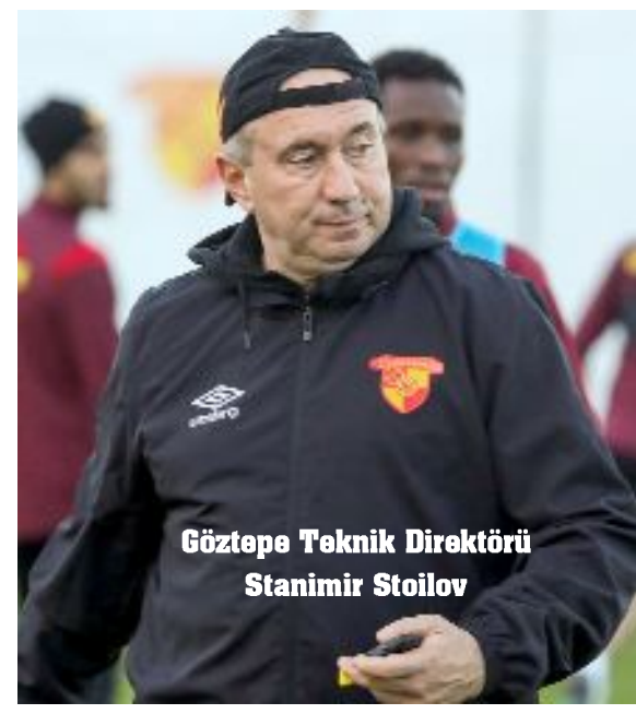
Göztepe Teknik Direktörü Stanimir Stoilov

birçok problem yaşadık. Çok fazla hasta oyuncumuz vardı. Bugün forvet pozisyonunda iki tane orta saha oyuncumuzu oynattık. Çünkü forvet oyuncularımızdan biri hasta diğeri ise sakat durumda. Aslında bugün gerçekçi bir sonuçla karşılaşma bitti. İyi bir maç oldu" ifadelerini kullandı.