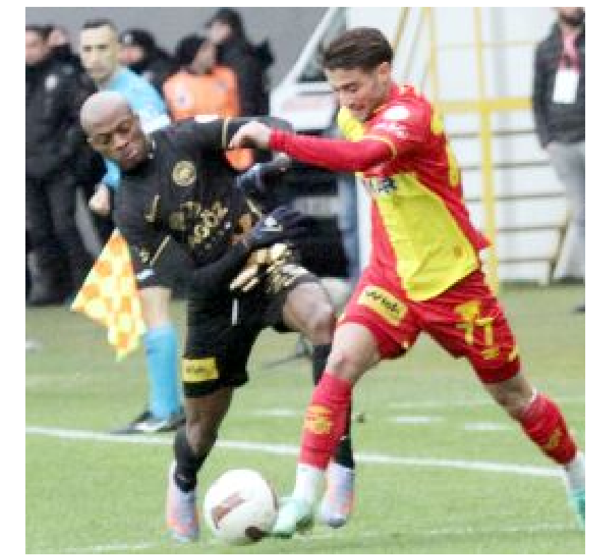
Ahlatçı Çorum FK, 20.hafta maçında konuk ettiği Göztepe ile 1-1 berabere kalırken, yenilmezlik serisi 8 maça çıktı.

Kırmızı-siyahlı takım bu maçlarda sırasıyla Altay ve Adanaspor'u 3-0, Erzurumspor FK'yı 4-1, Boluspor'u 2-0, Tuzlaspor'u 2-1, Giresunspor'u ise 3-0 yenerken, Şanlıurfaspor ve Göztepe ile de 1-1 berabere kaldı. (Hüseyin AŞKIN)