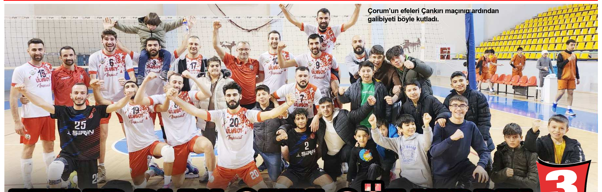
Çorum'un efeleri Çankırı maçını ardından galibiyeti böyle kutladı.