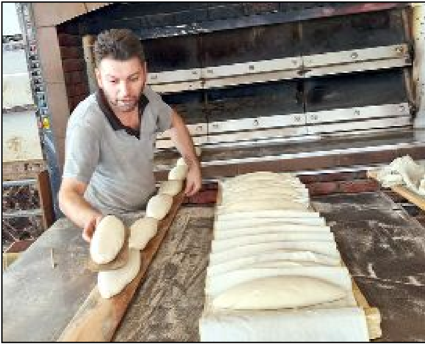
Alaca'da 7 liraya satılan 200 gram ekmeğin fiyatı 8 liraya yükseldi.

Y.V'nin bulduğu kredi kartıyla market ve kırtasyeden yaptığı alışverişler güvenlik kameralarınca kaydedildi. (AA)