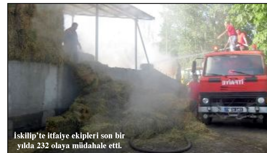
İskilip'te itfaiye ekipleri son bir yılda 232 olaya müdahale etti.

kuruluşunda tatbikat yapıldı” denildi. (İHA)