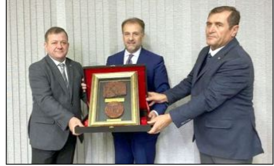
Ziyaret sonunda Bakan Yardımcısı Şamloğlu'na TSO Başkanı Başaranhıncal ve Borsa Başkanı Özkubat tarafından hediye takdim edildi.

“Çorum'da katıldığı toplantıda bakanlık olarak mesleki eğitim alanında önemli adımlar atıldığını vurgulayan Bakan Yardımcısı Şamloğlu; Mesleki ve Teknik Eğitim Genel Müdürlüğü tarafından meslek liselerinin müfredatı ve eğitim içerikleri güncellenerek, iş dünyasının taleplerine ve sektörün ihtiyaçlarına uygun hale getirilmektedir. Bu sayede, öğrencilerimiz iş dünyasına daha uyumlu ve nitelikli bir şekilde katılabilmektedir” dedi.