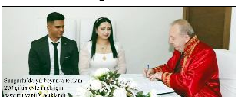
Sungurlu'da yıl boyunca toplam 270 çiftin evlenmek için başvuru yaptığını açıkladı.