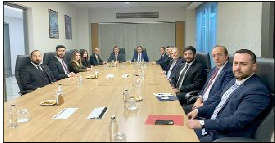
Milli Eğitim Bakan Yardımcısı Kemal Şamloğlu, bakanlığın mesleki eğitim alanındaki çalışmaları hakkında sanayici ve iş insanlarına bilgi verdi.

•1 su bardağı su ile sevdirtip içerisine toz zerdeçal ve karabiberi ekleyip karıştırın. Ara ara yarım çay bardağı ölçüsünde tüketebilirsiniz.