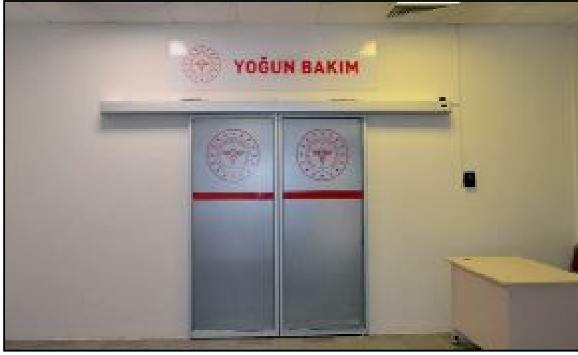
Erol Olçok Eğitim ve Araştırma Hastanesi'ne yeni yoğun bakım ünitesi kuruldu.