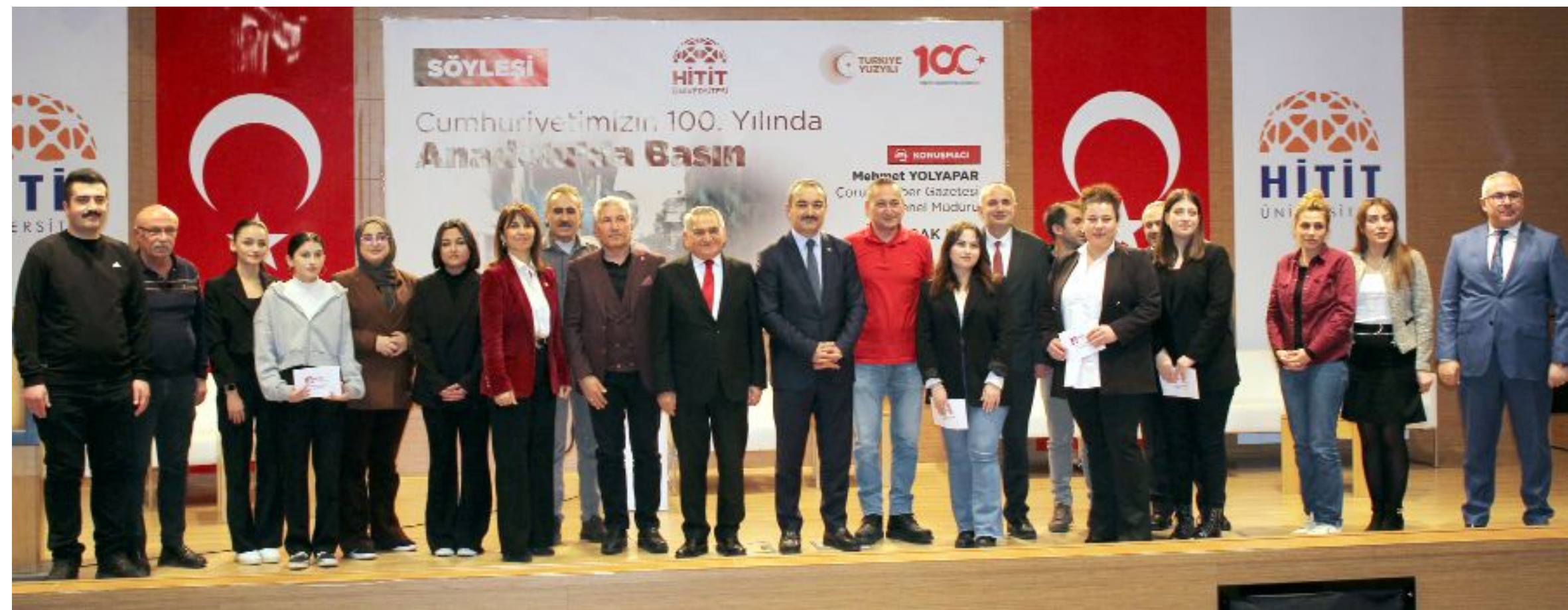
Programdan sonra, Rektör Öztürk, Rektör Yardımcıları, akademisyenler, söyleşide görev alan öğrenciler ve Yolyapar'ın meslektaşları topluca anı fotoğrafı çektiler.