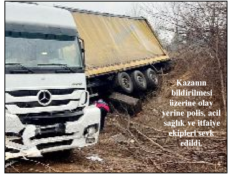
Kazanın bildirilmesi üzerine olay yerine polis, acil sağlık ve itfaiye ekipleri sevk edildi.

Kazayla ilgili inceleme başlatıldı. (İHA)