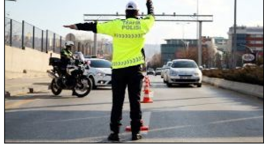
Çorum'da Aralık ayı içerisinde 176 araç trafikten men edildi.

Emniyet Müdürlüğü'nden yapılan açıklamada, "İlimiz genelinde park etmenin yasak olduğu yerler ve yukarıda belirtilen konular başta olmak üzere trafik denetimleri yoğunlaştırılarak devam edecektir." (Haber Merkezi)