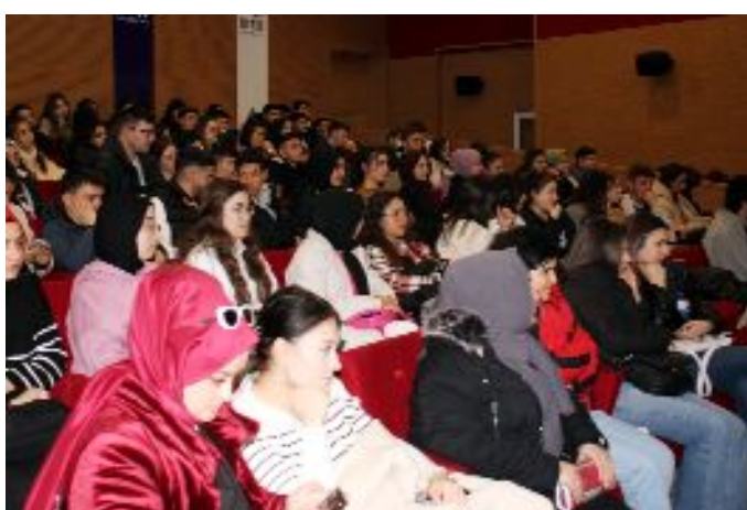
Sosyal Bilimler Meslek Yüksekokulu Medya ve İletişim Bölümü öğrencileri, yer yer gülümseten anılarla devam eden söyleşiyi sonuna kadar ilgiyle izlediler.