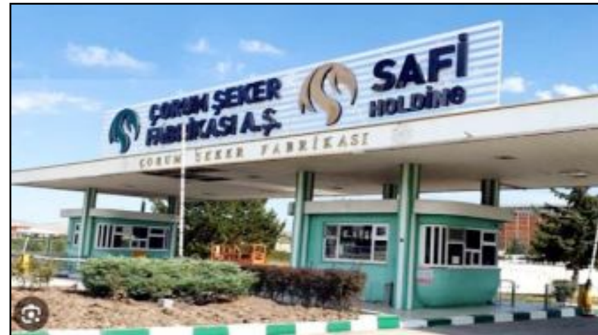
Safi Holding bünyesinde faaliyet gösteren Çorum Şeker Fabrikası

Kurumsal yönetim ve şeffaflık ilkesini siar eden fabrikamızdan, iyi niyet çerçevesinde tüm kurumlar ve basınımız istediği bilgi ve belgelere ulaşabilirler." (Haber Merkezi)