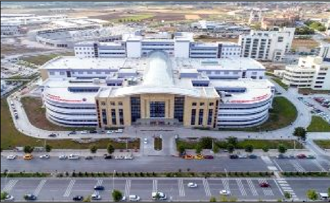
Sağlık Müdürlüğü ilimizin tek 3. basamak ve il merkezimizin tek genel kamu hastanesi olan Erol Olçok Hastanesi'ndeki yoğunluğun düzenlenmesi adına çalışmaların sürdürdüğünü duyurdu.