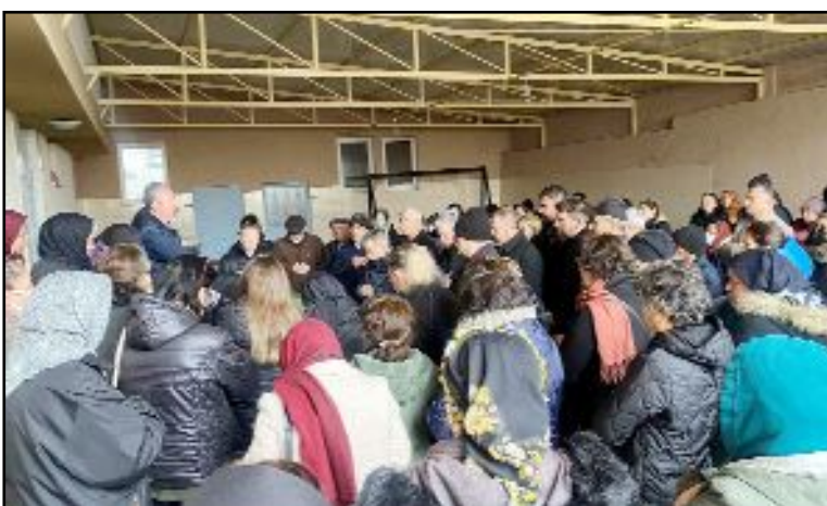
Merhumenin cenazesi Hacı Bektaş Veli Vakfı'ndaki törenin ardından Yoğunpelit'te toprağa verildi.