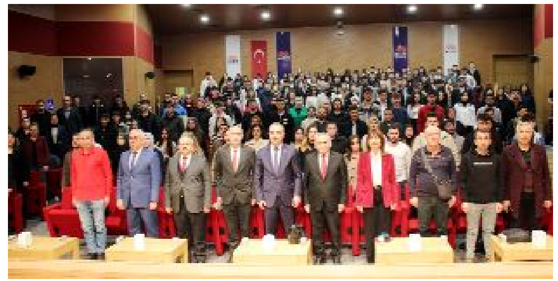
Meslek Yüksekokulu Kampüsü'ndeki program saygı duruşu ve İstiklal Marşı ile başladı.

● AKP'nin 21 yıldır iktidarda olduğunu, Çorum Havaalanı'nın temelini 25 yıl önce atıldığını belirten Tahtasız, “Yine seçim yaklaşıyor AKP'nin vaatleri yine havada uçuşuyor” dedi.