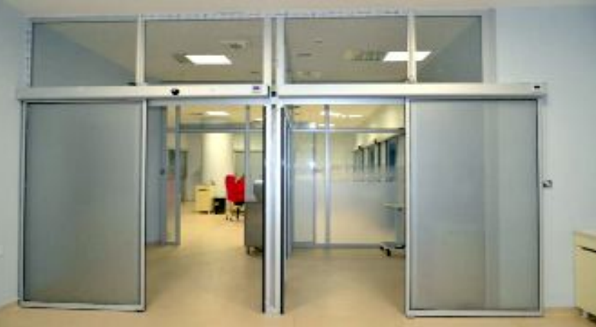
Hitit Üniversitesi Erol Olçok Eğitim ve Araştırma Hastanesi içinde yeni ikinci seviye yoğun bakım ünitesi kuruldu.

● İl Sağlık Müdürlüğü kent merkezindeki tek 3. basamak ve genel kamu hastanesi olan Erol Olçok Eğitim ve Araştırma Hastanesi'nin yoğunluğunu düzenlemek amacıyla çalışmalar yürütüldüğünü açıklarken, bu kapsamda 16 yatak kapasiteli 2'nci seviye yoğun bakım ünitesinin hizmete girdiğini duyurdu. ●6'da