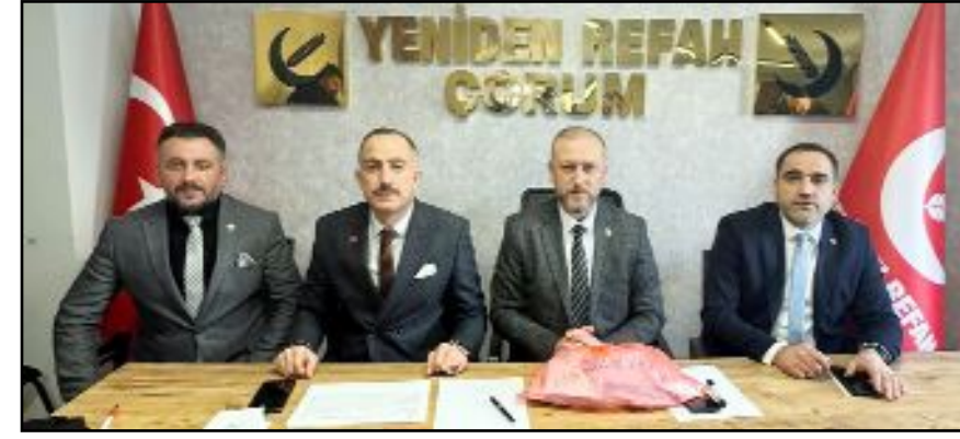
Yeniden Refah Partisi tarafından adayların belirlenmesine yönelik temayül yoklaması yapıldı.