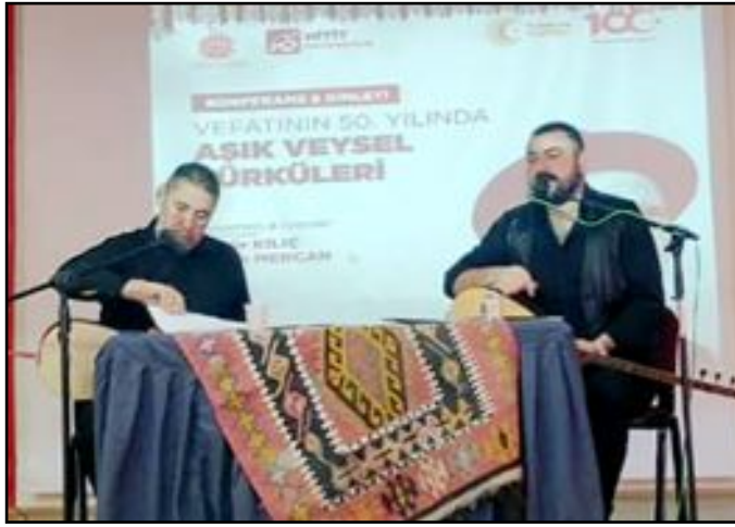
Halk ozanı Âşık Veysel Şatıroğlu, vefatının 50. yılı dolayısıyla düzenlenen programda eserleriyle anıldı.