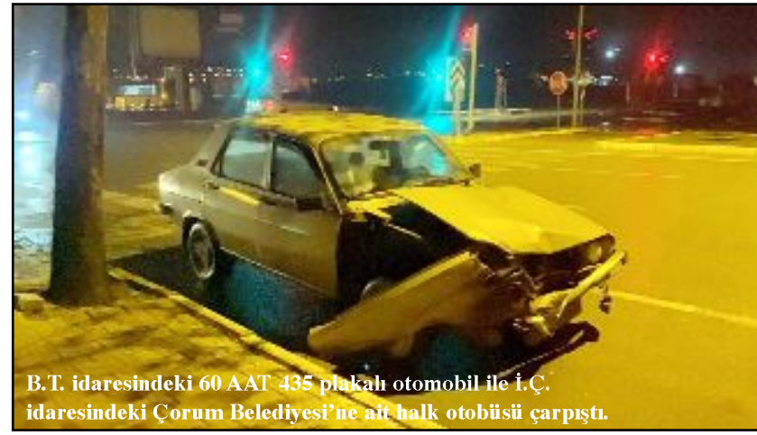
B.T. idaresindeki 60 AAT 435 plakalı otomobil ile İ.Ç. idaresindeki Çorum Belediyesi'ne ait halk otobüsü çarpıştı.

Çorum'da otomobil ile halk otobüsünün çarpışması sonucu meydana gelen trafik kazasında otomobil sürücüsü yaralanarak hastaneye kaldırıldı.