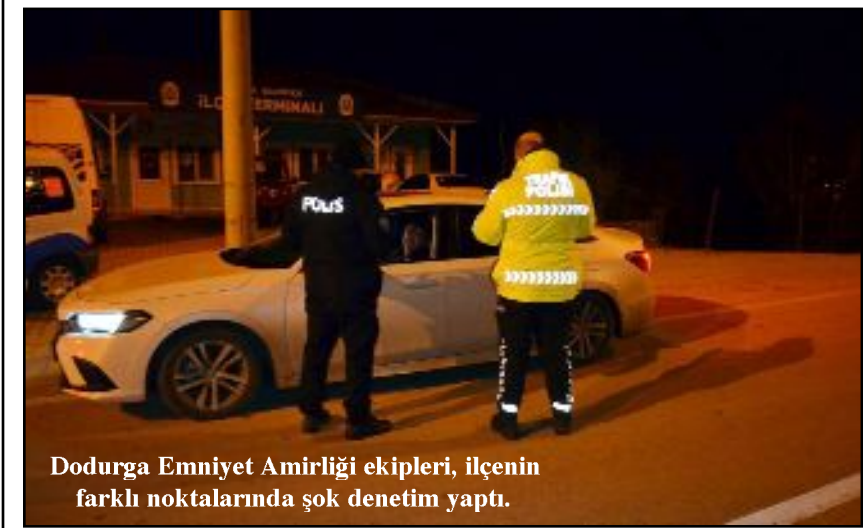
Dodurga Emniyet Amirliği ekipleri, ilçenin farklı noktalarında şok denetim yaptı.

Çorum'un Dodurga ilçesinde polis ekipleri sürücülerin alkolü araç kullanmasını engellemek amacıyla denetim yaptı. Dodurga Emniyet Amirliği ekipleri, ilçenin farklı noktalarında şok denetim yaptı. Dodurga Caddesi'nde yapılan denetimlerde durdurdukları araçların sürücülerine alkol muayenesi yaptı.