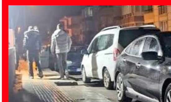
Çorum'da Kale Mahallesi'nde bir evin pompalı tüfekte kurşunlanması olayına karışan 3 kişi polis ekiplerince yakalandı.