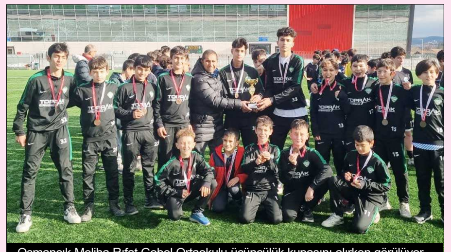
Osmancık Meliha Rifat Gobel Ortaokulu üçüncülük kupasını alırken görülüyor...