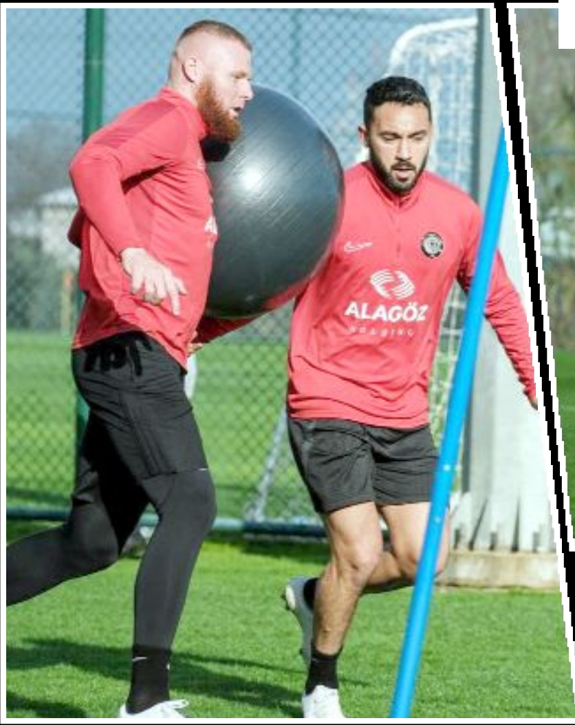
İkinci yarı hazırlıklarını Antalya-Lara'da sürdüren Ahlatçı Çorum FK dünü çift antrenmanla geçirdi.