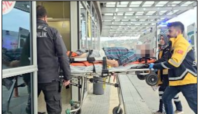
İş arkadaşları tarafından sıkıştığı yerden çıkarılan kişi, sağlık ekiplerince Hitit Üniversitesi Erol Olçok Eğitim ve Araştırma Hastanesi'ne kaldırıldı.

caklarında kırıklar olduğu öğrenildi. (AA)