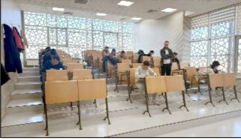
Genel kültür ve genel yetenek alanlarını kapsayan deneme sınavına 365 öğrenci ve mezun katıldı.

Doç. Dr. Demirel, adayların hazırlık eğitim videolarına Kariyer ve Mezunlar Ofisi web sayfası üzerinden erişebileceklerini aktardı. (Haber Merkezi)