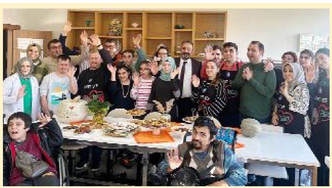
Beslenme ve Diyetetik Kulübü öğrencileri, rafine şekerless ve yulafli kurabiyeleri en özel kardeşleriyle birlikte hazırladılar.