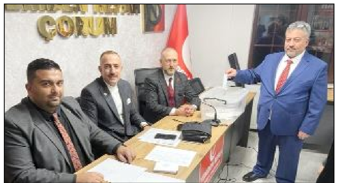
Yeniden Refah Partisi Osmaniye adayını belirlemek üzere üyeleriyle temayül yoklaması yaptı.