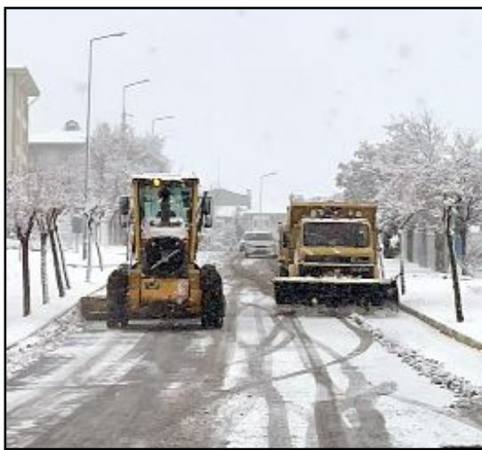
Çorum'da önümüzdeki hafta içinde kar yağışı başlayacak.

dun büyük bir bölümünü etkisi altına alacak. Meteoroloji'nin haftalık tahminlerine göre önümüzdeki hafta yurt genelinde kar yağışı etkili olacak. (Haber Merkezi)