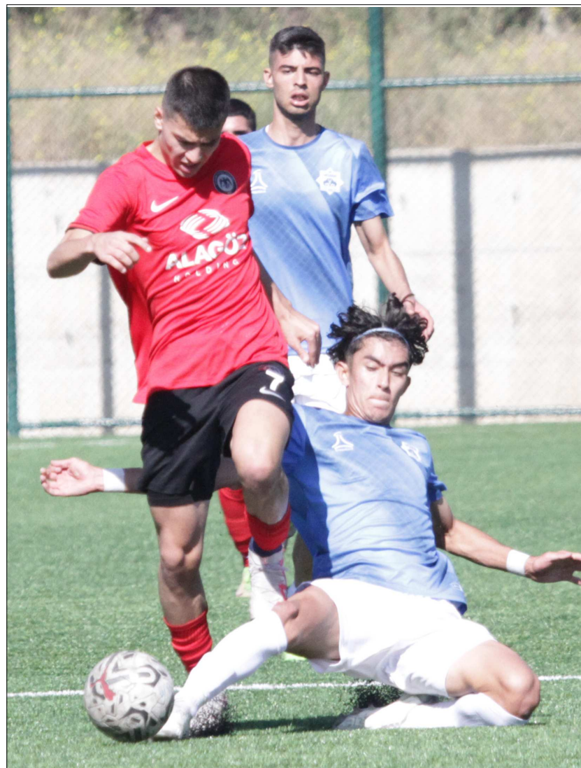
Gelişim Ligi maçından bir enstantane...