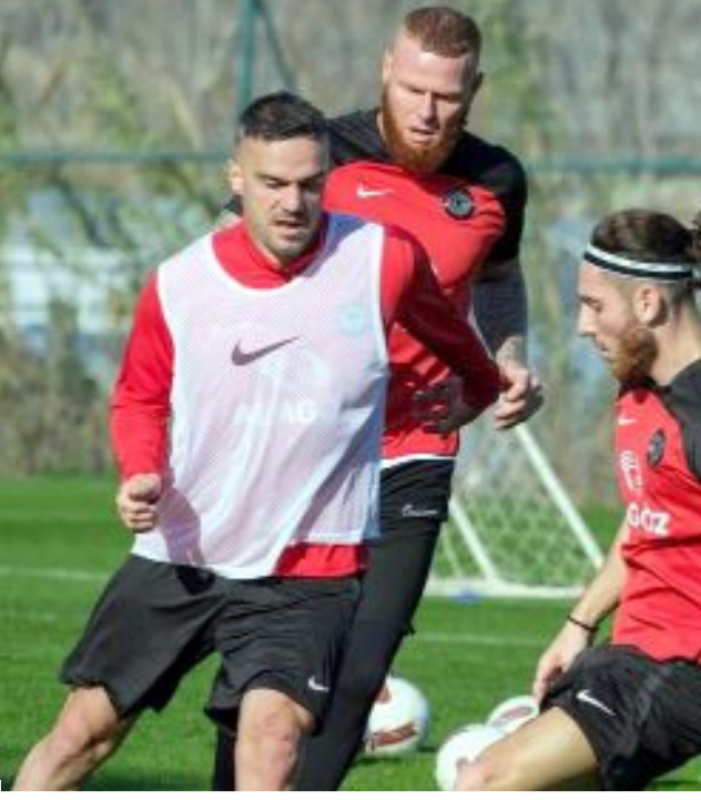
Ahlatçı Çorum FK, Antalya'da devam eden devre arası kampında dünü sabah 10.30, akşam 17.30'da olmak üzere yaptığı çift antrenmanla geçirdi.