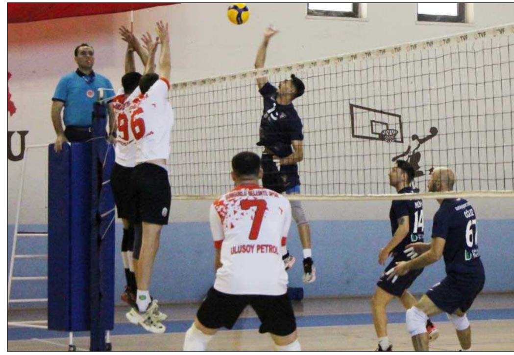
Efelerin ligde oynadığı Düzce Belediye Akademispor maçından bir enstantane...