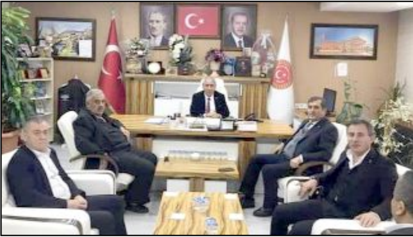
Çorum'daki mesleki kuruluşların başkanları, İl Genel Meclisi Başkanı Mehmet Bektaş'ı ziyaret ederek bir süre görüştü.

mızdan böylesi güzel övgüler duymak beni onurlandırdı. Nazik ziyaretlerin izden dolayı sizlere teşekkür ederim" dedi. (Haber Merkezi)