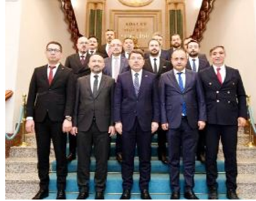
Kalıpcı ve Baro Başkanları Adalet Bakanı Tunç ile de görüştü.