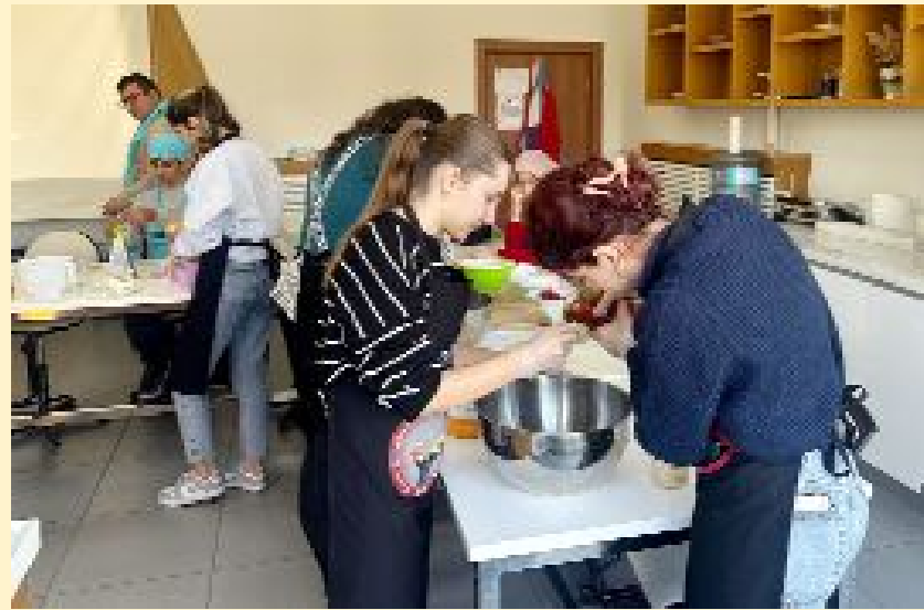
Çeşitli malzemelerle farklı şekillerde kurabiyeler hazırlayan özel bireyler, eğlenceli vakit geçirdi.

Program sonunda ise fırından çıkan sıcak kurabiyeler, öğrencilere ikram edildi. (Haber Merkezi)