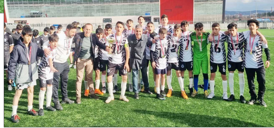
Şampiyon olan Yavruturna Ortaokulu öğrencileri maç sonunda büyük sevinç yaşadı.

Okullararası düzenlenen Yıldız Erkekler Futbol İl Birinciliği'nde şampiyonluk kupası, final maçında Yıldırım Beyazıt İmam Hatip Ortaokulu'nu penaltı atışları sonunda mağlup eden Yavruturna Ortaokulu'nun oldu.