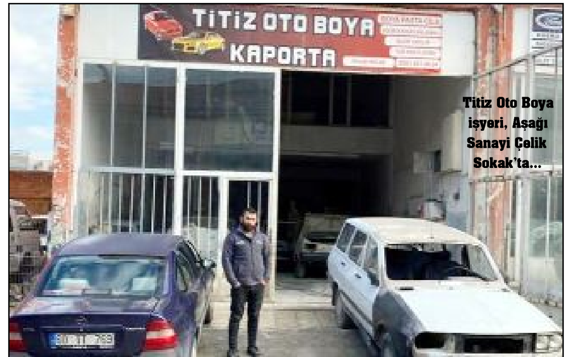
Titiz Oto Boya işyeri, Aşağı Sanayi Çelik Sokak'ta...