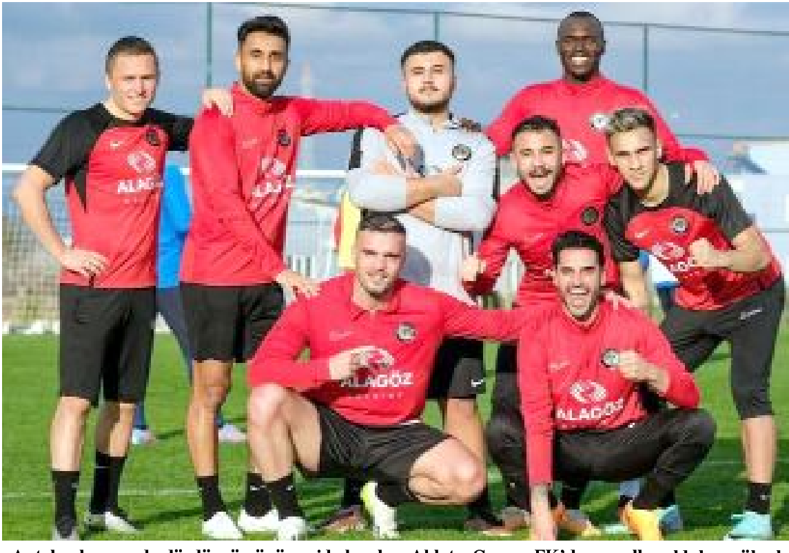
Antalya kampında dördüncü günü geride bırakan Ahlatçı Çorum FK'da moraller oldukça yüksek.