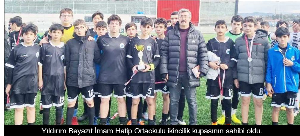
Yıldırım Beyazıt İmam Hatip Ortaokulu ikincilik kupasının sahibi oldu.

Okullararası düzenlenen Yıldız Erkekler Futbol İl Birinciliği'nde şampiyonluk kupası, final maçında Yıldırım Beyazıt İmam Hatip Ortaokulu'nu penaltı atışları sonunda mağlup eden Yavruturna Ortaokulu'nun oldu.