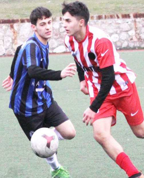
U16 Ligi maçından temsili fotoğraf...

Çınarlar Boya İnşaat U16 Futbol Ligi'nde bugün 2.hafta erteleme maçları oynanacak. 11 takımın 2 grupta mücadele ettiği U16 Futbol Ligi'nde 2.hafta erteleme heyecanı yaşanacak. İtfaiye Sahası'nda oynanacak maçlarda saat 12.00'de Maviay Gençlikspor ile H.E.Kültürspor, saat 14.00'de Çorum Anadolu FK ile Hattuşa Gençlikspor karşılaşacak. Devane Sahası'nda saat 14.00'de başlayacak maçta Mimar Sinan ile Sungurluspor kozlarını paylaşırken, Nazmi Avluca Sahası'nda oynanacak maçlarda ise saat 12.00'de Gençlerbirliği ile İskilipgücü, saat 14.00'de Çorumspor ile Alaca Belediyesi karşı karşıya gelecek. (Rifat KARA)