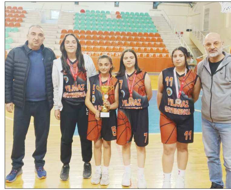
Kızlarda ikincilik kupası Sultan Abdulhamit Han Ortaokulu'nun oldu.

Müsabakalar sonunda düzenlenen törenle dereceye giren sporculara madalya, okullara ise kupaları takdim edildi. (Rifat KARA)