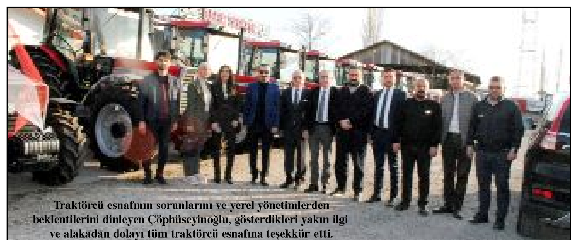
Traktörü esnafının sorunlarını ve yerel yönetimlerden beklentilerini dinleyen Çöphüseyinoğlu, gösterdikleri yakın ilgi ve alakadan dolayı tüm traktörcü esnafa teşekkür etti.