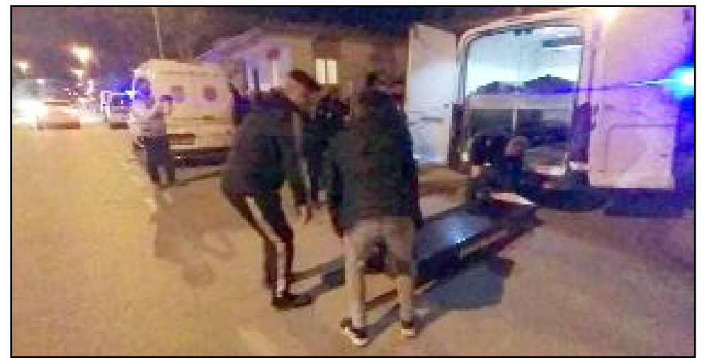
Olay, Kale Mahallesi Eti 10. Sokak'ta meydana geldi.

Kaçan diğer şüphelinin yakalanması için çalışmalar sürüyor. (AA)