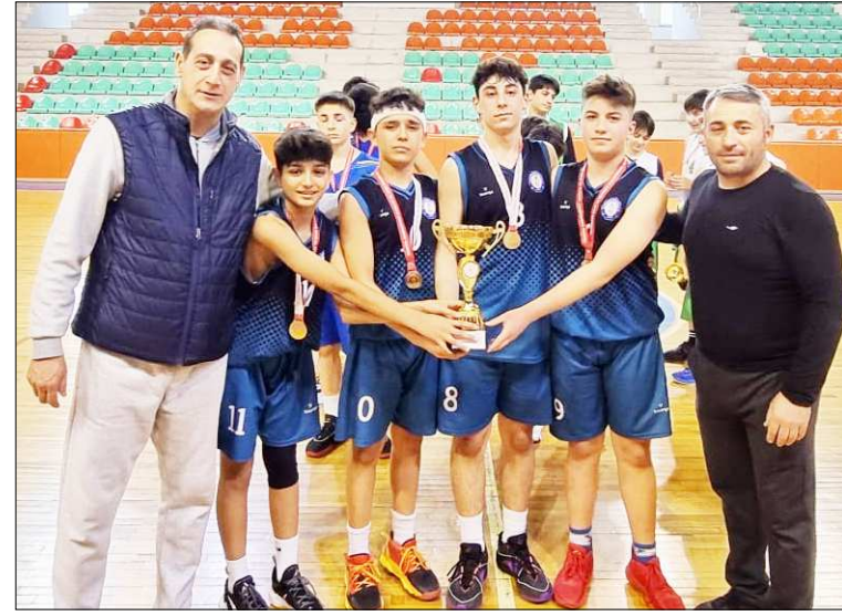
Erkeklerde şampiyon 23 Nisan Ortaokulu oldu.