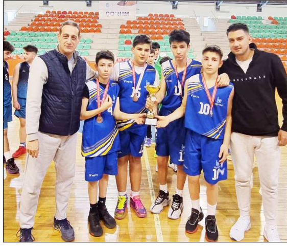
Erkeklerde ikinci Özel Bilgi Koleji oldu.