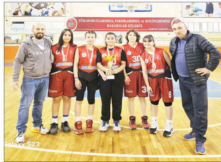
Kızlarda şampiyon Mustafa Kemal Ortaokulu oldu.