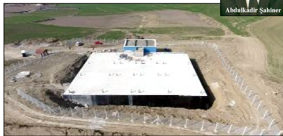
Sungurlu Belediyesi, ilçesinde debimetre odası ve bakiye klor odası da bulunan 5 bin metreküp kapasiteli su deposunu ilçeye kazandırdı.