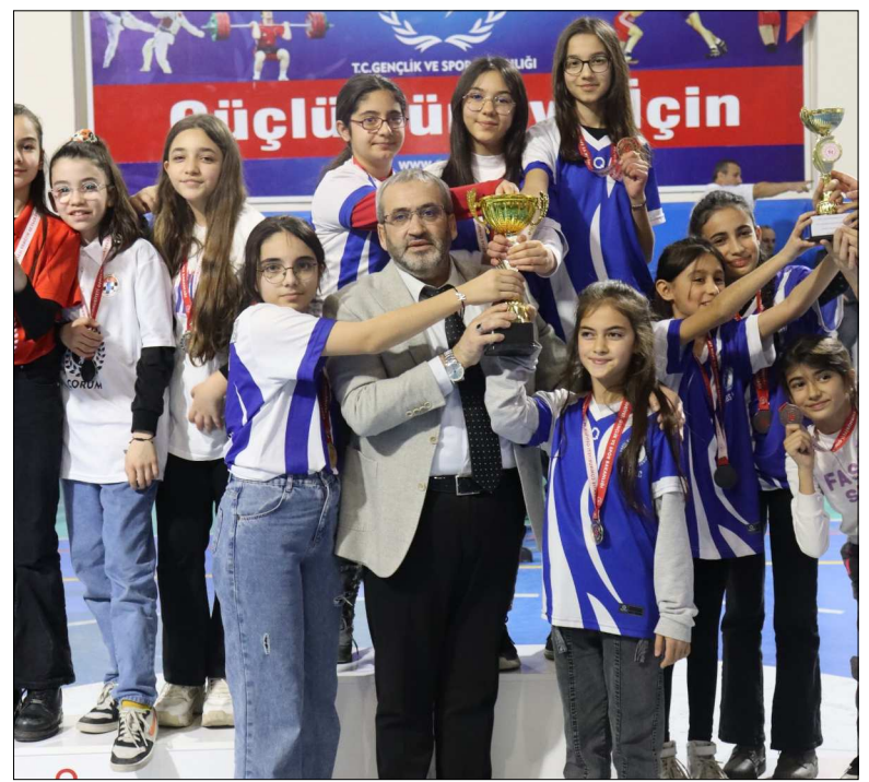
Satranç İl Birinciliği'nde dereceye giren okullara kupaları verildi.

Müsabakalar sonunda düzenlenen törenle dereceye giren okullara kupaları takdim edildi. (Rifat KARA)