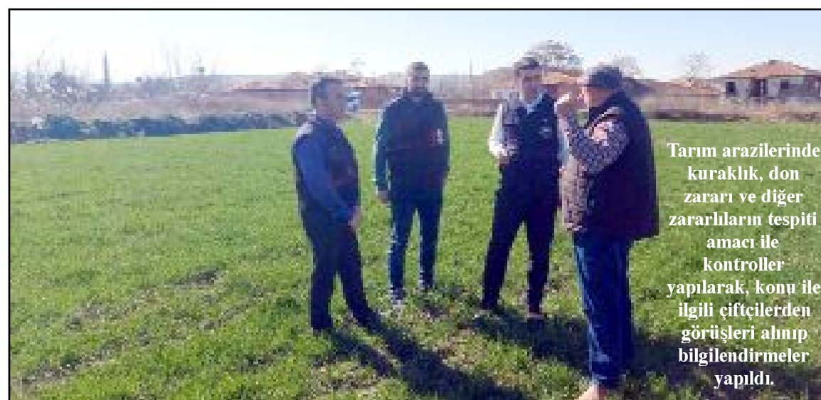
Tarım arazilerinde kuraklık, don zararı ve diğer zararlıların tespiti amacıyla kontroller yapılarak, konu ile ilgili çiftçilerden görüşleri alınıp bilgilendirmeler yapıldı.