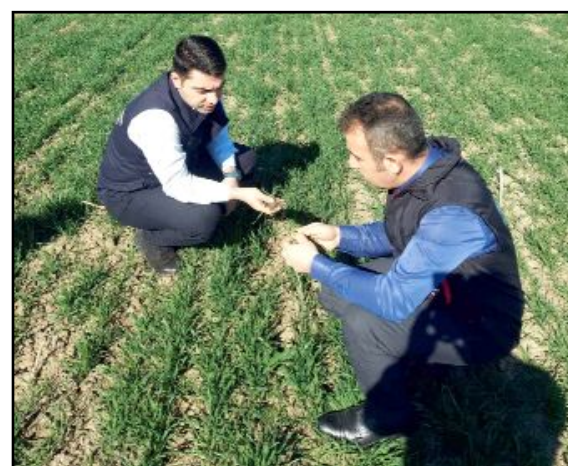
Hububat alanlarında iklim şartlarına bağlı olarak bitkilerin gelişimleri takip ediliyor.