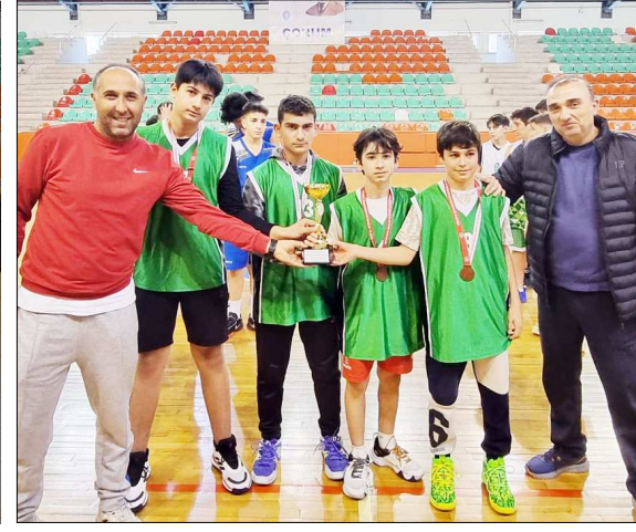
Erkeklerde üçüncü Mustafa Kemal Ortaokulu oldu.

Özel Çorum Doğa Koleji ise dördüncü oldu.