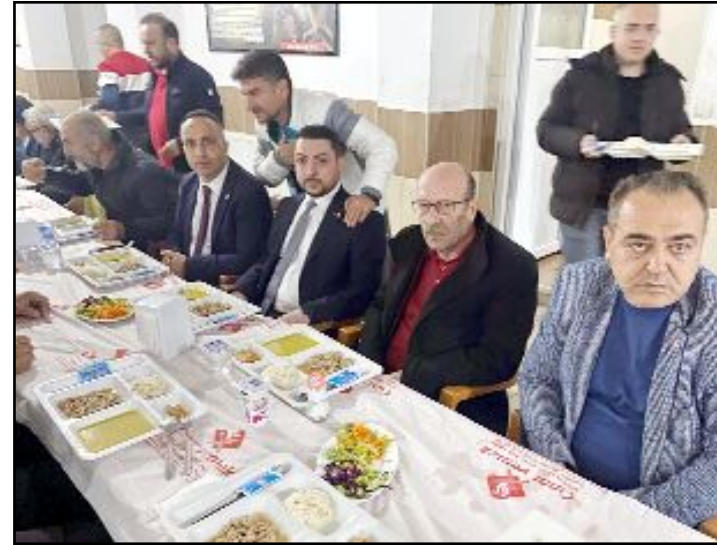
Geçtiğimiz günlerde vefat eden Gazi Yıldırım için düzenlenen yemeğe ailesi ve sevenleri katıldı.