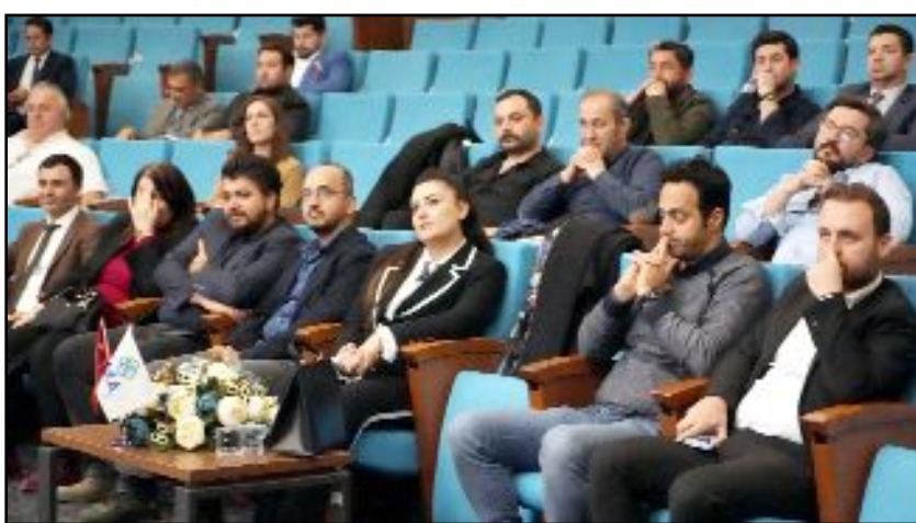
Panelde "Melek Yatırımcılık" konusunda ufuk açan bilgiler ile tecrübe paylaşımının yanında, kitle fonlama gibi yeni nesil fon araçları tanıtıldı.

Açılış konuşmasının ardından panele geçildi. Panelde "Melek Yatırımcılık" konusunda ufuk açan bilgiler ile tecrübe paylaşımının yanında, kitle fonlama gibi yeni nesil fon araçları tanıtıldı ve katılımcıların soruları yanıtladı. (İHA)