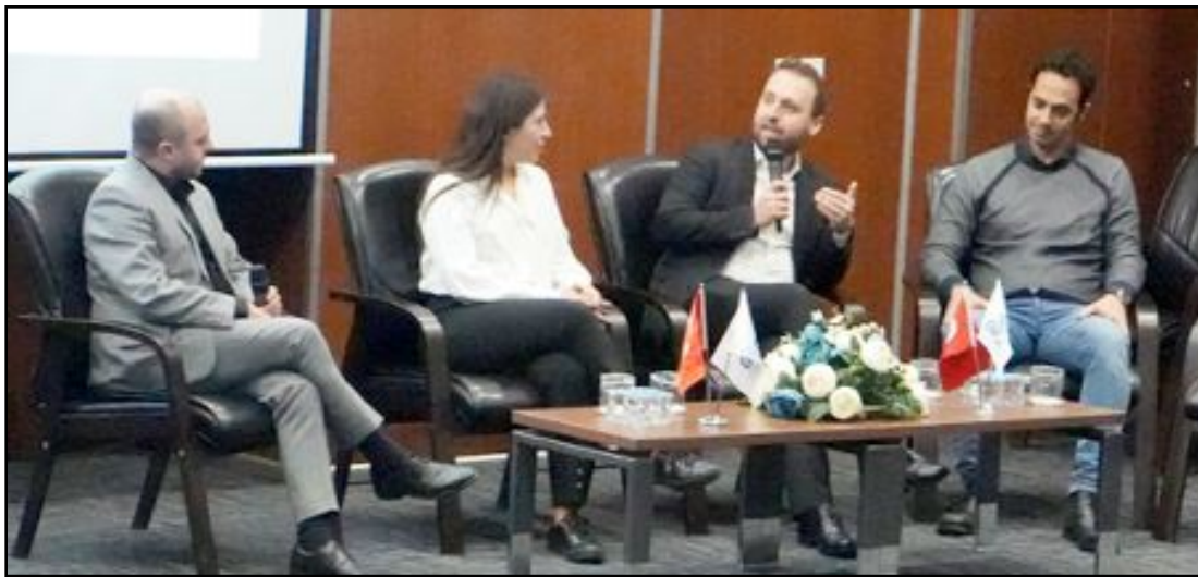
Amasya, Çorum, Samsun ve Tokat illerinden oluşan TR83 Bölgesi'nde çalışmalar yürüten OKA, Samsun'da "Melek Yatırımcı Nasıl Olunur?" başlıklı bir panel düzenledi.