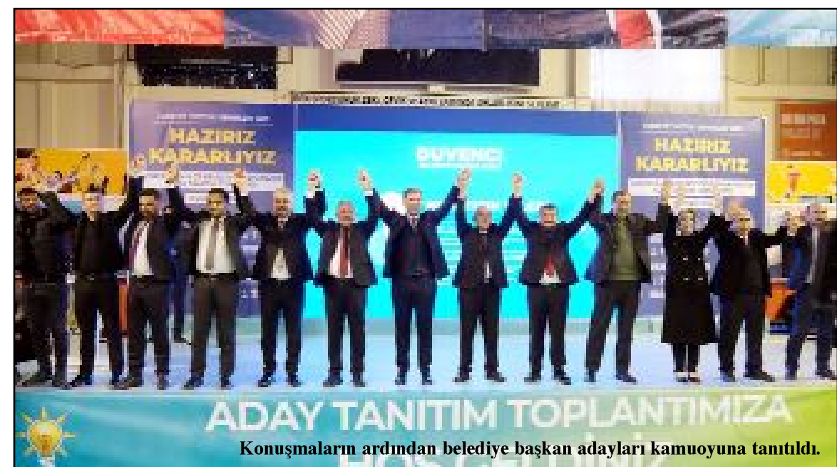
Konuşmaların ardından belediye başkan adayları kamuoyuna tanıtıldı.