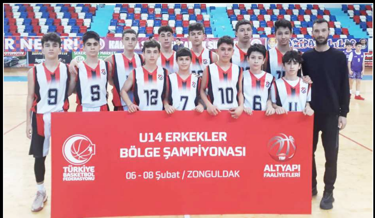
Çorum Gençlikspor grupta oynadığı 3 maçtan 2'sini kazandı.

karya, Sinop ve Zonguldak ile aynı grupta mücadele eden Çorum Gençlikspor ilk maçında Zonguldak'ı 64-26 yenerken, ikinci maçında Sakarya'ya 52-49 yenildi. Üçüncü maçında Sinop temsilcisini 77-33 farklı mağlup eden Çorum Gençlikspor grubunu ikinci sırada tamamlamayı başardı. (Rifat KARA)