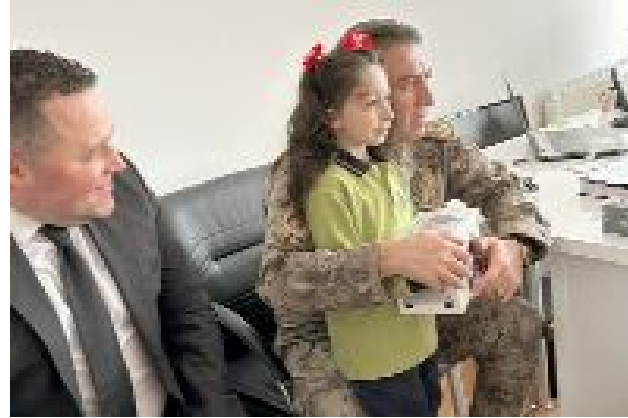
Pehlivan, 1/A sınıfının minik öğrencilerini verdiği çeşitli hediyelerle sevindirirken, öğrenci ve öğretmenlerle bir süre sohbet etti.