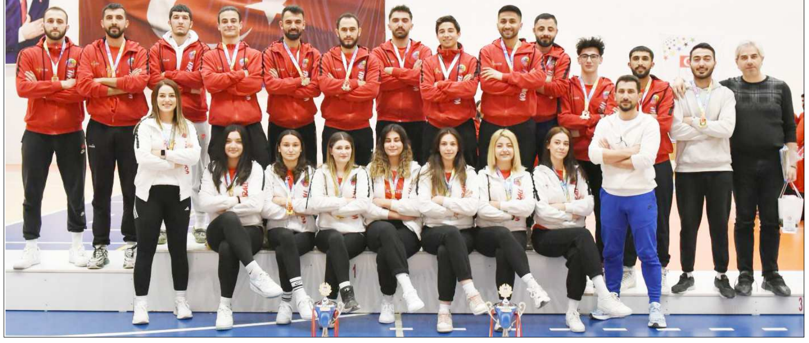
Çorum temsilcisi Hitit Üniversitesi kadın ve erkek takımı birlikte görülüyor...

Dün 15 Temmuz Spor Kompleksi'nde Hitit Üniversitesi ile Yalova Üniversitesi arasında oynanan ve 3-0 Hitit Üniversitesi'nin üstünlüğü ile tamamlanan karşılaşma sonunda düzenlenen törenle Hitit Üniversitesi kadın ve erkek takımı kupalarını aldı. (Rifat KARA)