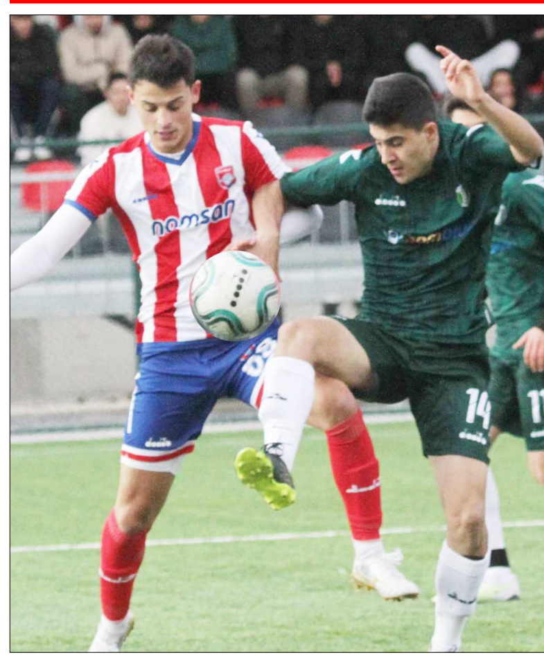
1. Amatör Küme maçından bir enstantane...