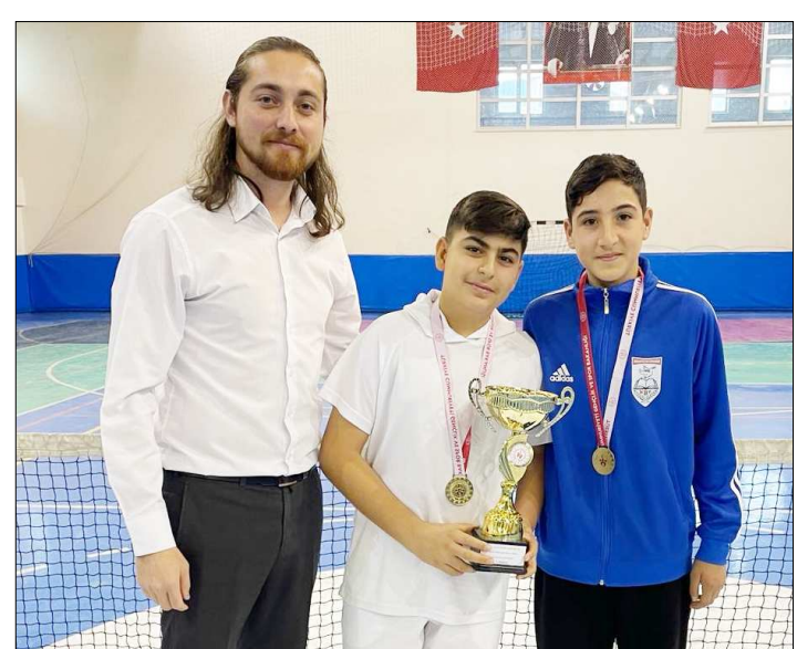
Erkeklerde şampiyon olan Hacı Bektaş Veli Ortaokulu kupasıyla...