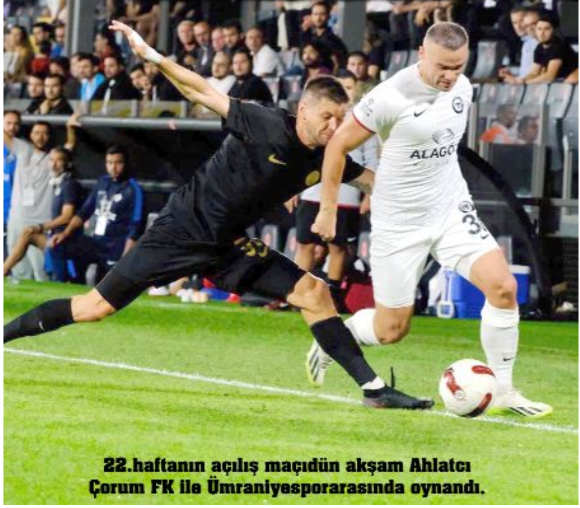
22.haftanın açılış maçıdün akşam Ahlatcı Çorum FK ile Ümraniyesporarasında oynandı.

Trendyol Türkiye 1.Futbol Ligi'nde heyecan 22.hafta maçları ile devam ediyor. Haftanın perdesi dün Ahlatcı Çorum FK-Ümraniyespor maçıyla açılırken, bugün Bodrum FK ile Sakaryaspor, Şanlıurfaspor'la Ankara Keçiöregücü, Altay'la da Erzurumspor karşılaşacak. Yarın ise Adanaspor-Tuzlaspor, Bandırmaspor-Göztepe, Boluspor-Kocaelispor ve Manisa FK-Giresunspor maçları oynanacak.