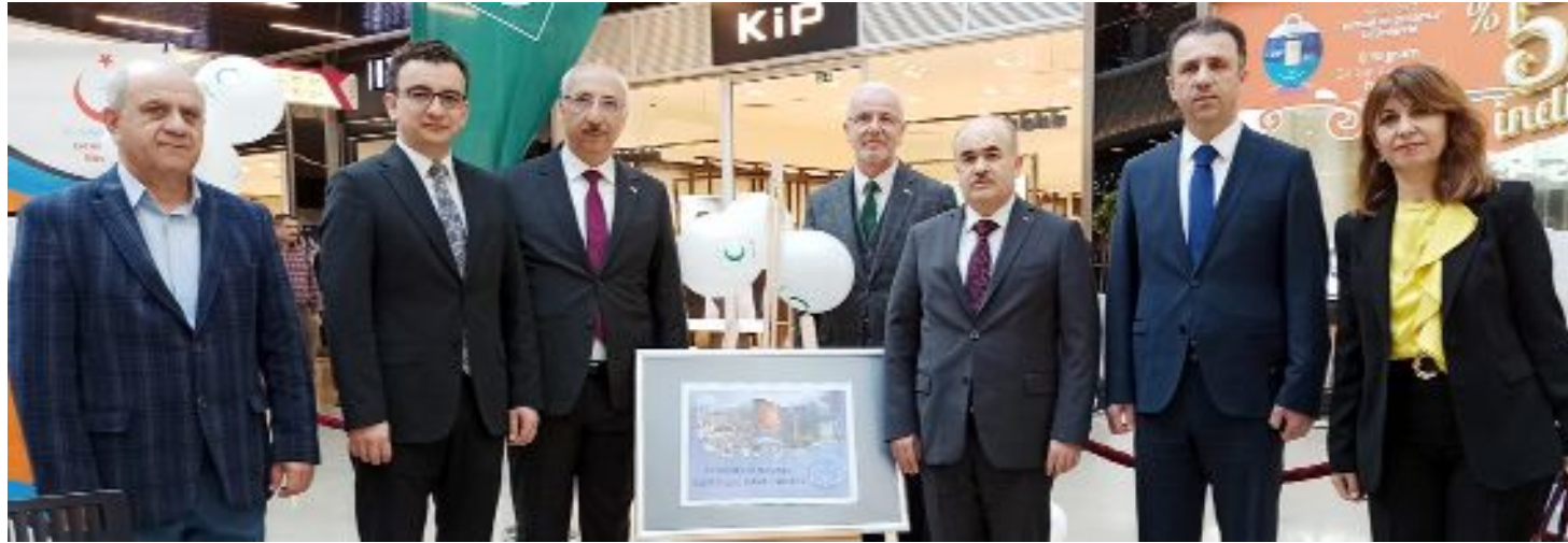
Sağlık Müdürlüğü ve Yeşilay işbirliğinde düzenlenen etkinliğe Vali Dağlı ile çok sayıda protokol üyesi de katıldı.

dır devam eden kurslarda diyafram nefesi, artikülasyon uygulamaları, Türkçeyi doğru, düzgün ve etkili konuşma, Topluluk karşısında hitabet ve beden dili eğitimleri uygulamalı olarak veriliyor. Her hafta Salı ve Perşembe günleri 18.30 - 21.30 saatleri arasında devam eden 5 hafta 30 saatlik kurs sonunda kursiyerlere katılım belgesi veriliyor. (Haber Merkezi)