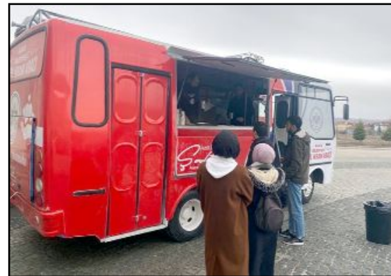
Alaca Belediyesi gezici ikram aracı üniversite öğrencilerine çorba dağıttı.

Şaltu'ya teşekkür eden öğrenciler, sınavlar öncesi çorba ikramının güzel bir düşünce olduğunu ifade etti. (Mehmet DALAR)