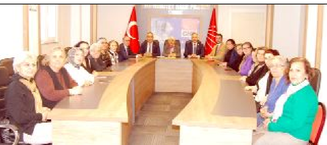
CHP Kadın Kolları tarafından Medeni Kanun'la ilgili basın toplantısı düzenlendi.

"Ailede eşitlikten, toplumda eşitlikten vazgeçmiyoruz. Medeni Kanun'u değil sil baştan yazmak, üzerinde virgül oynatmalarına dahi izin veremeyeceğiz. Medeni Kanun'u yok sayan, Cumhuriyet değerlerine düşman olup şeriat çağrıştıran yapıtlara asla geçit vermeyeceğiz. Hem Meclis'te hem de sahada direneceğiz. Örgütlü gücümüzle ve kadın hareketiyle kenetlenerek mücadeleyi büyüteceğiz. Medeni Kanun için sil baştan diyenleri siyasetten sileceğiz." (Taner ŞİMŞEK)