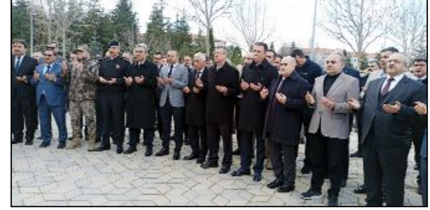
Müftülük tarafından 15 caminin altında kurulan gençlik merkezi için toplu açılış töreni düzenlendi.