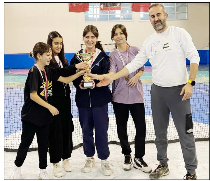
Kızlarda şampiyon olan Özel Bilgi Koleji takımı kupasıyla...

Müsabakalar sonunda düzenlenen törenle dereceye giren okullara kupa, sporcularına ise madalyaları takdim edildi. (Rifat KARA)