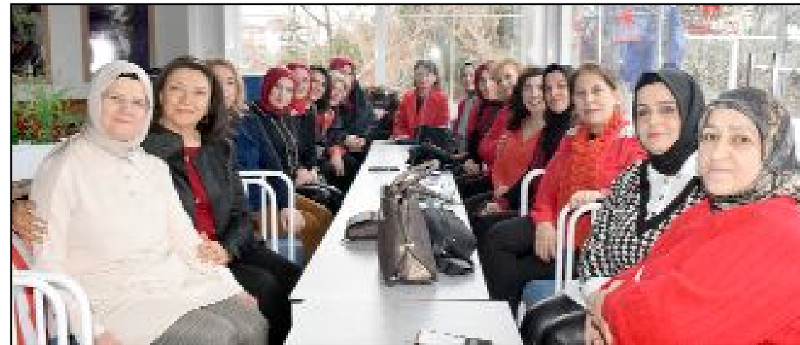
1984-1987 yılları arasında Kız Meslek Lisesi'nde beraber eğitim gören lise arkadaşları 37 yıl sonra bir araya gelerek hasret giderdiler.