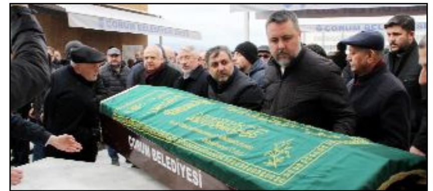
Cenaze musalladan alınırken...