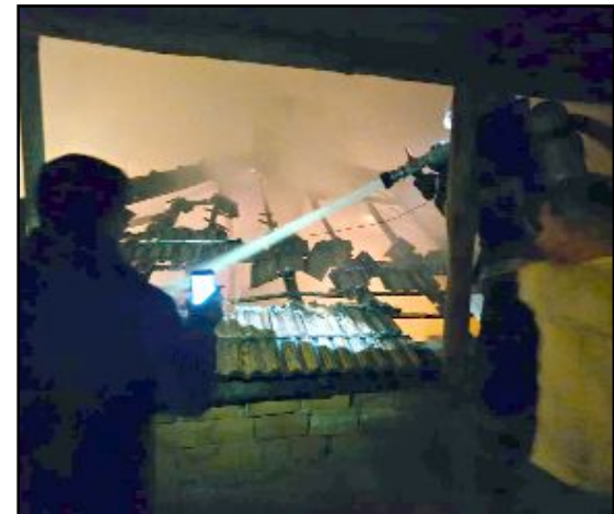
Uzun uğraşlar sonunda yangın kontrol altına alınırken evde maddi hasar meydana geldi.

dolayı yangın çıktı. Kısa sürede büyüyen alevler çatıyı kapladı. Evden dumanlar yükseldiğini gören vatandaşlar 112 Acil Çağrı Merkezi'ni arayarak yardım istedi. İhbar üzerine kısa sürede belirtilen adrese gelen Bayat Belediyesi itfaiye ekipleri alevlere müdahale etti. Uzun uğraşlar sonunda yangın kontrol altına alınırken evde maddi hasar meydana geldi.