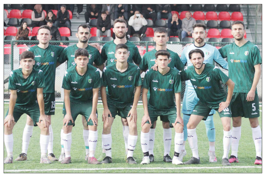
Bu karar sonrası Mimar Sinanspor son haftaya lider giriyor...

BELTAŞ 1.Amatör Küme Büyükler Futbol Ligi'nde, 4 Şubat Pazar günü, Alaca İlçe Sahası'nda oynanan ve 1-1 biten maçla ilgili olarak Gençlik Mimar Sinan Spor Kulübü'nün itirazı haklı bulundu.