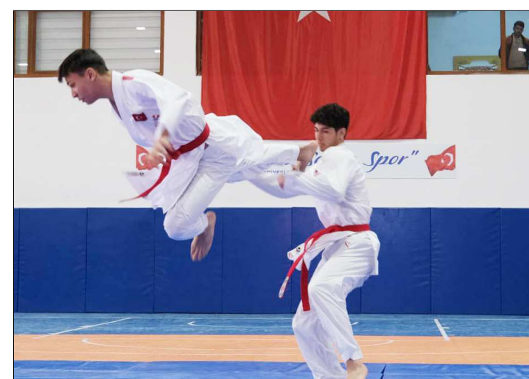
Kuşak sınavından bir fotoğraf...