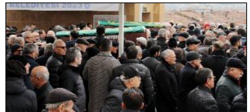
Cenaze namazına kalabalık bir cemaat katıldı.