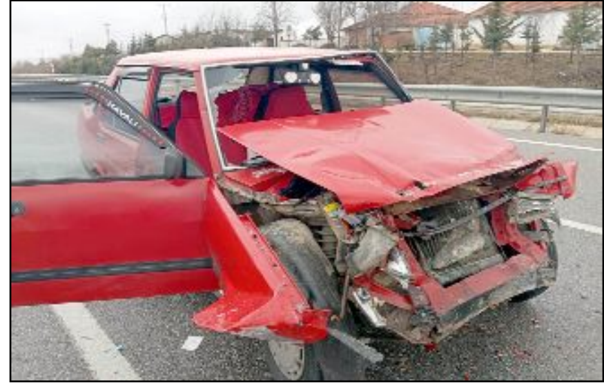
Kazada yaralanan Seyhan Sönmez, yaşam savaşını kaybetti.

Durumu ağır olan ve hayatı tehlikesi devam ettiği için yoğun bakımda tedavi altına alınan Sönmez, tüm müdahalelere rağmen hayatını kaybetti. (Haber Merkezi)