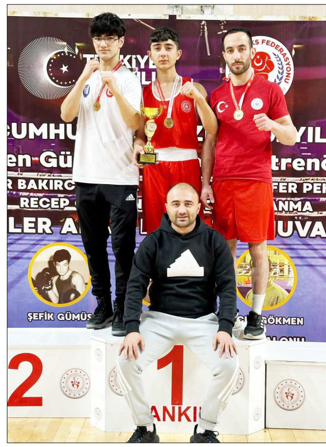
Birinci olarak altın madalya kazanan Çorumlu boksörler...