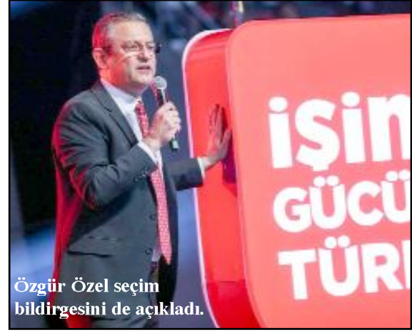
Özgür Özel seçim bildirgesini de açıkladı.

Bizim işimiz genel siyasette iktidara muhalefet etmek. Muhalefete muhalefetin, iktidara ya-