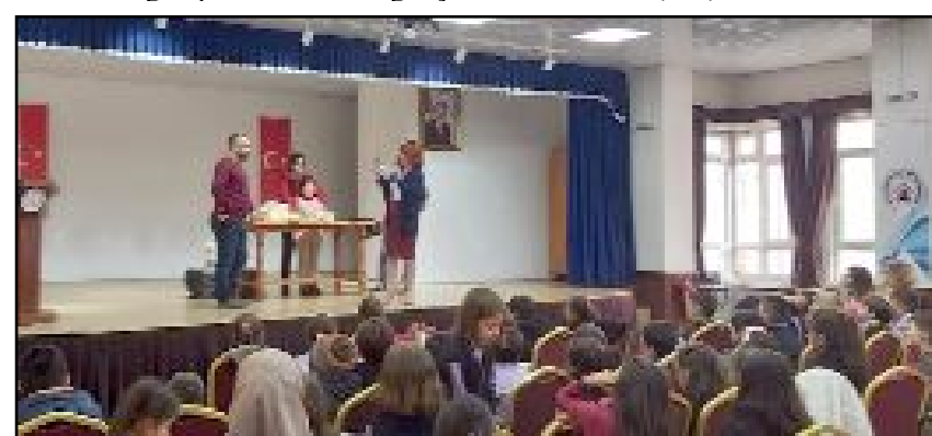
İskilip'te ilkököl 3 ve 4. sınıf öğrencilerine yönelik bilim şenliği düzenlendi.

sağlamak amacıyla yapıldığı belirtildi. (AA)