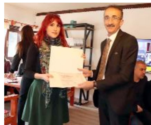
Buluşmada Kodek tarafından öğretmenlere katılım belgesi verildi.