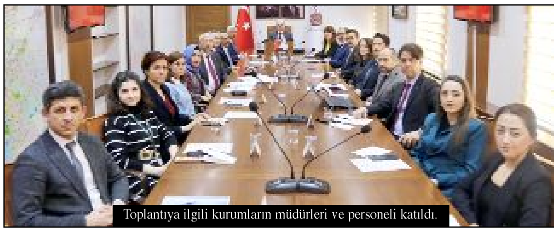
Toplantıya ilgili kurumların müdürleri ve personeli katıldı.

ceklerini belirten Demir, "Yıllar sonra bir araya geldik. Çok duygusal anlar yaşadık. O zamanlar genç kızıydık. Şimdi ise hepimiz birer yetişkiniz. Okul yıllarında yaşadığımız anılarımızı paylaşarak eskileri hatırladık. Bir daha hiç ayrılmayı düşünmüyoruz" diyerek etkinliğe katılan arkadaşlarına teşekkür etti. (Haber Merkezi)