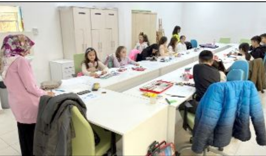
Osmancık Gençlik Merkezi devam eden kursların yanı sıra matrak, akıl ve zeka oyunları, masa tenisi, bilardo, satranç ve daha bir çok aktivitelerle hizmet veriyor.