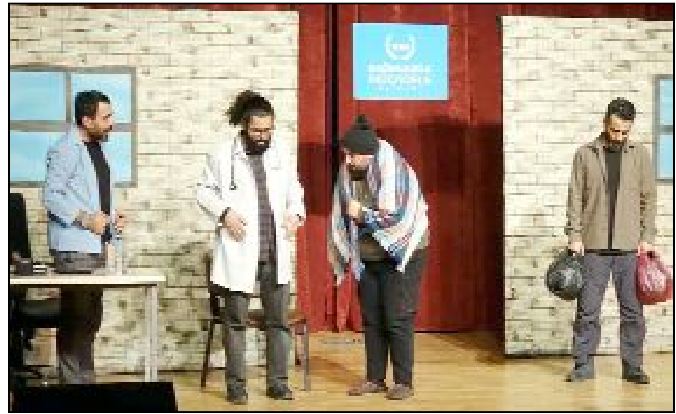
Oyun, 22 Şubat Perşembe günü saat 13.30'da Devlet Tiyatro Salonu'nda sahnelenecek.