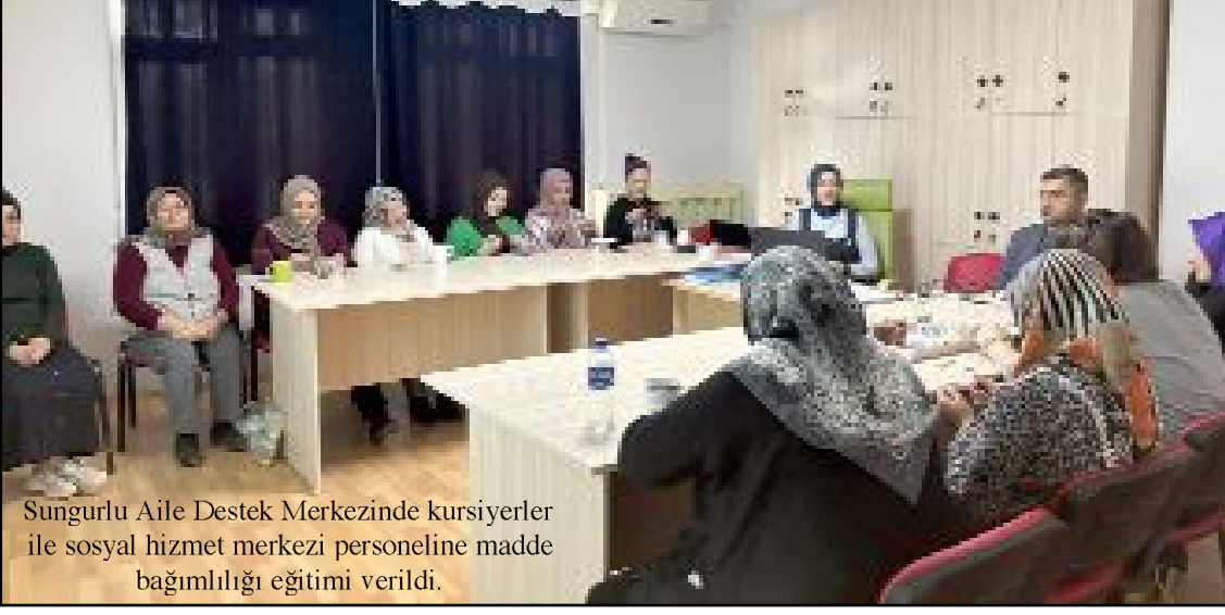
Sungurlu Aile Destek Merkezinde kursiyerler ile sosyal hizmet merkezi personeline madde bağımlılığı eğitimi verildi.

dikkat edeceği belirtiler anlatıldı" ifadeleri kullanıldı. (İHA)