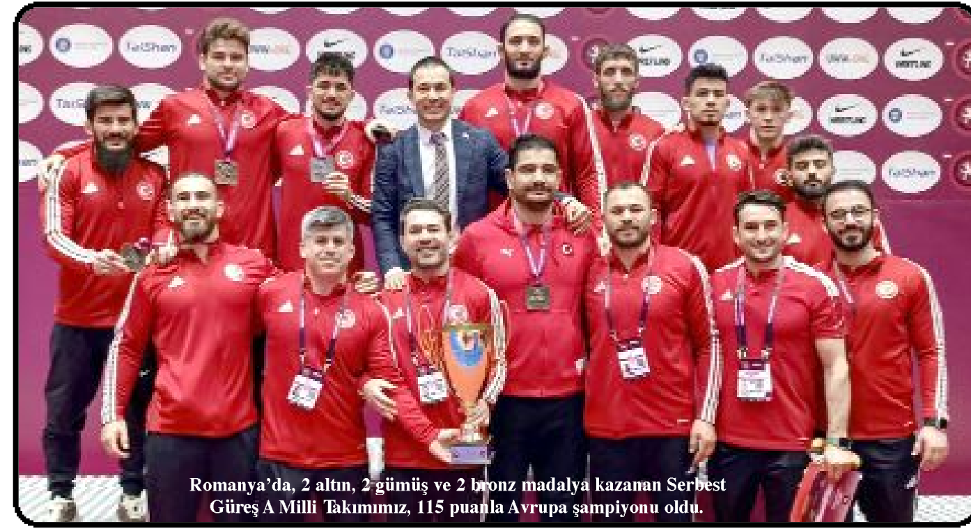
Romanya'da, 2 altın, 2 gümüş ve 2 bronz madalya kazanan Serbest Güreş A Milli Takımımız, 115 puanla Avrupa şampiyonu oldu.