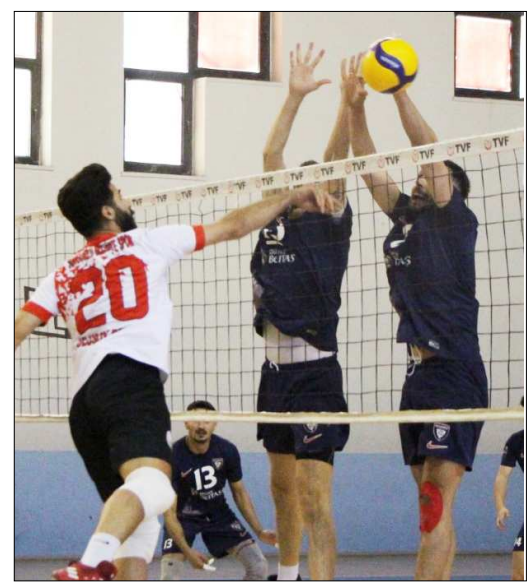
Efeler normal sezonu ikinci sırada tamamladı.

Erkekler 2.Voleybol Ligi 3.Grup'ta normal sezonu ikinci sırada tamamlayarak Play-Off oynamaya hak kazanan Çorum temsilcisi Sungurlu Belediyespor, Play-Off yarı final ilk maçında bugün Kastamonu temsilcisi Yıldızlar Topluluğu All Star takımı ile oynayacak.