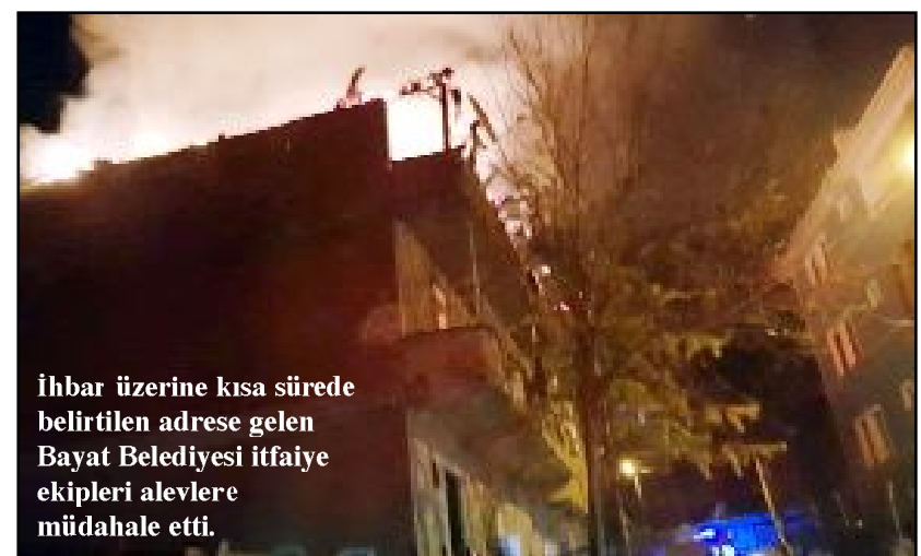
İhbar üzerine kısa sürede belirtilen adrese gelen Bayat Belediyesi itfaiye ekipleri alevlere müdahale etti.