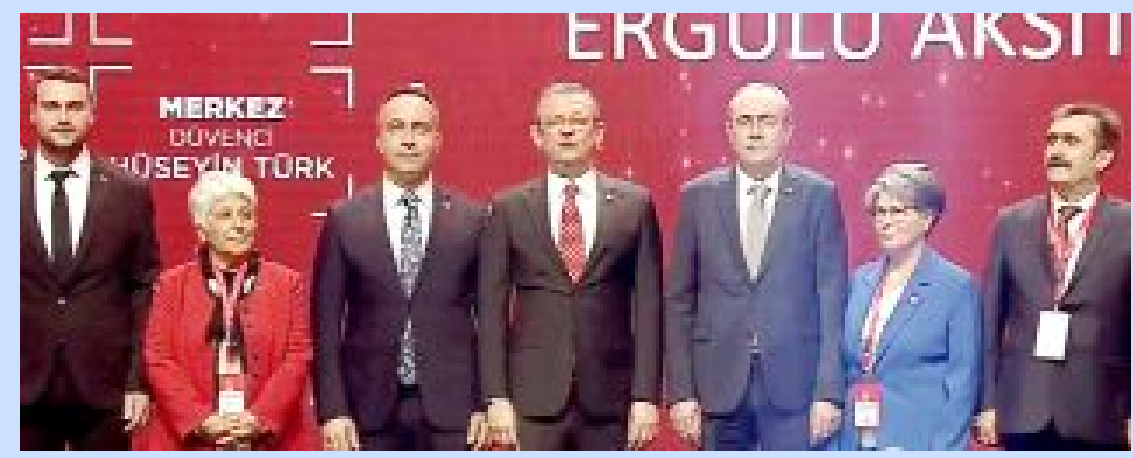
Cumhuriyet Halk Partisi (CHP) 15 alt başlıktan ve 105 sayfadan oluşan Seçim Bildirgesi açıklandı. Ankara'da düzenlenen törende Çorum ile birlikte 81 ilin Belediye Başkan adayları da tanıtıldı.