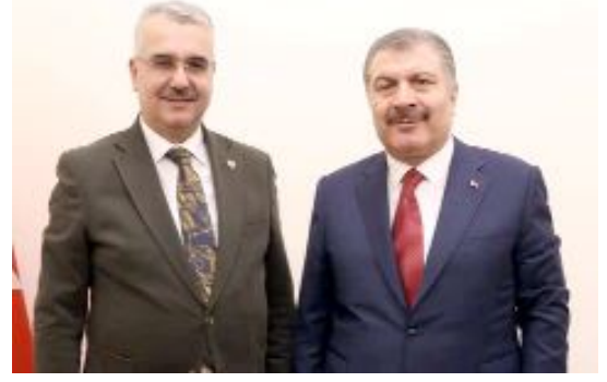
AK Parti Çorum Milletvekili Yusuf Ahlatcı, Sağlık Bakanı Fahrettin Koca'yı ziyaret ederek bir süre görüşti.