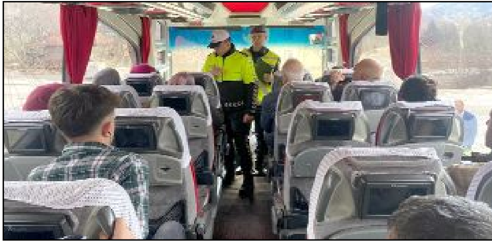
İskilip İlçe Emniyet Müdürlüğü ekipleri, şehirlerarası yolcu otobüslerine yönelik denetim çalışması başlattı.

Denetimlerin devam edeceği bildirildi. (AA)