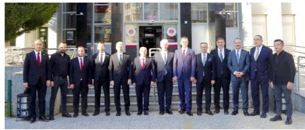
Bir dizi ziyaret için Çorum'a gelen Anayasa Mahkemesi Başkanvekili hemşehrilerimiz Hasan Tahsin Gökcan, Kenan Yaşar ve beraberindekiler, Çorum Barosu'nu ziyaret etti.