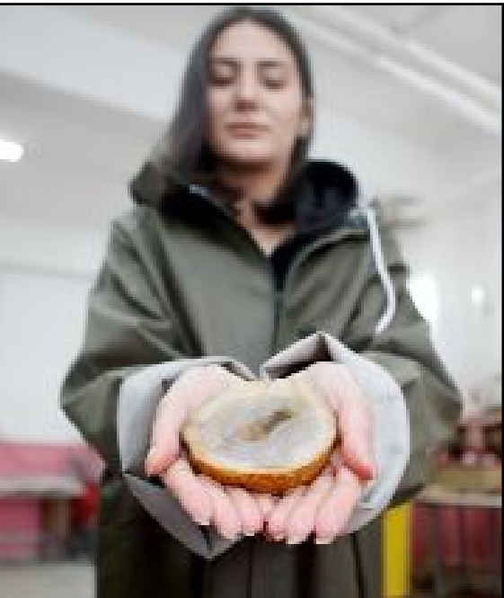
Mecitözü kadınlar, 81 ile takı ve süs eşyası gönderiyor.