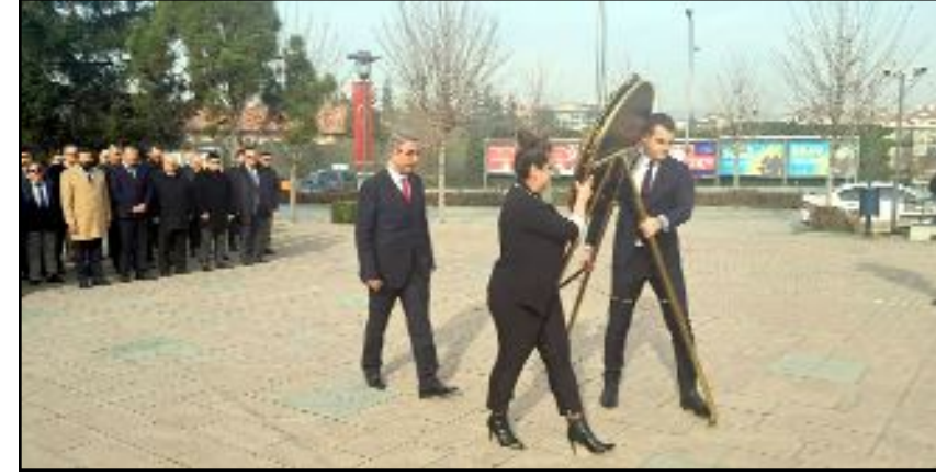
35. Vergi Haftası, Atatürk Anıtı'nda düzenlenen törenle başladı.

Saygı duruşunda bulunulması ve İstiklal Marşı'nın okunması ile başlayan programda İl Defterdarlığı'nın çelengi Atatürk Anıtı'na sunuldu. Çelenk sunumunun ardından program sona ererken, Vergi Haftası etkinliğinin startı da verilmiş oldu. (Taner ŞİMŞEK)