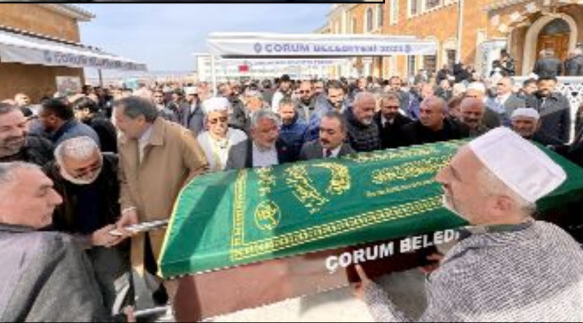
Şahin cenaze namazının ardından Ulumezar'da toprağa verildi.

ÇORUM HABER merhumeye Allah'tan rahmet, ailesi ve yakınlarına başsağlığı diler. (Sefer ATAY)