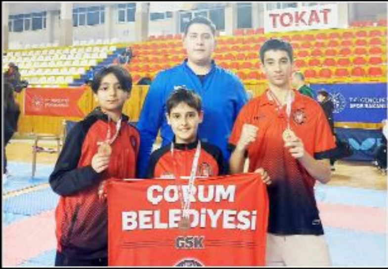
Final biletini alan Çorumlu 3 karateci birlikte görülüyor...