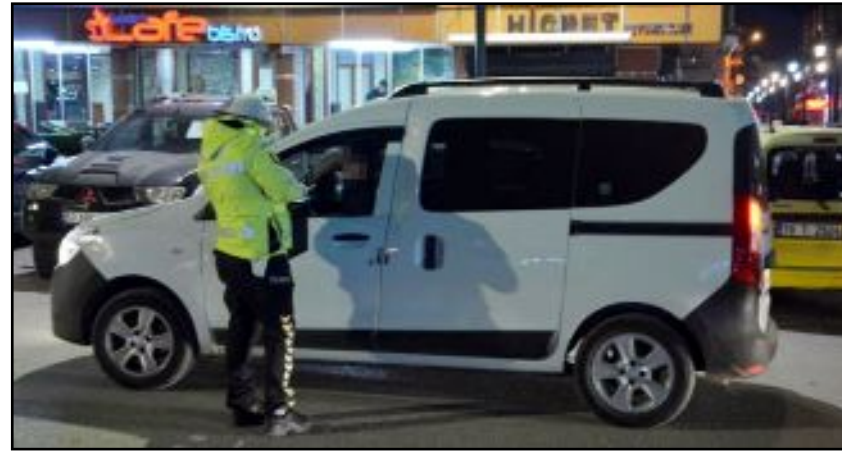
Alaca İlçe Emniyet Müdürlüğü'ne bağlı Asayiş ve Trafik Şube Müdürlüğü ile mahalle bekçilerinin katılımı ile Ankara Caddesi üzerinde uygulama yapıldı.

Çorum'un Alaca ilçesinde polis ekipleri tarafından halkın güven ve huzurunu sağlamaya yönelik çok uygulamalar devam ediyor.