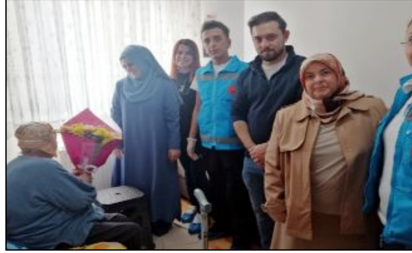
İl Sağlık Müdürlüğü tarafından yapılan açıklamada 2023 yılında gerçekleştirilen çalışmalar hakkında bilgiler verildi.