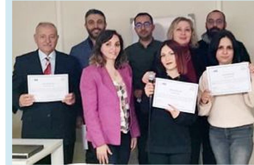
Bahabey Caddesi Dış Hastanesi karşısında bulunan Hititsem'de yeni sınıflar için başvuruların kabul edildiği açıklandı.

Hitit Üniversitesi Sürekli Eğitim Uygulama ve Araştırma Merkezinde geçtiğimiz ay başlayan yeni dönem "diksiyon" kurslarında ilk sınıf öğrencileri başarıyla dönemini tamamladı ve belgelerini aldı.