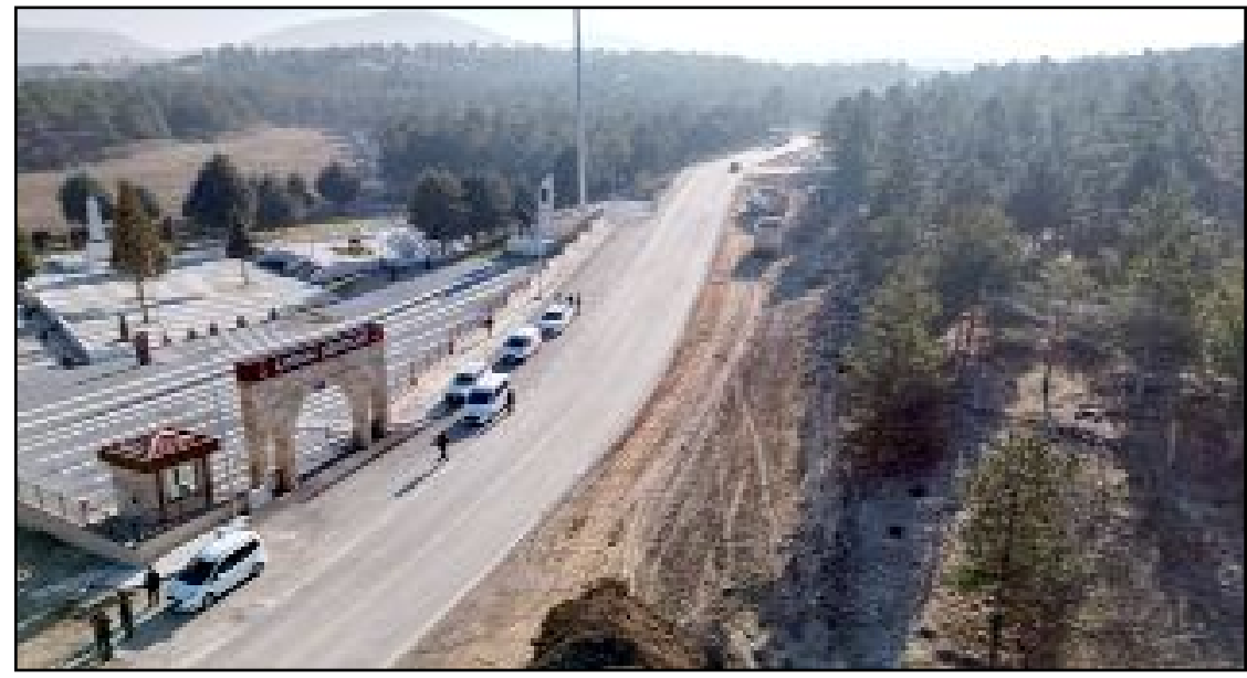
Çorum Belediyesi Şehitlik Caddesi'nde yol genişletme çalışmalarına başladı.