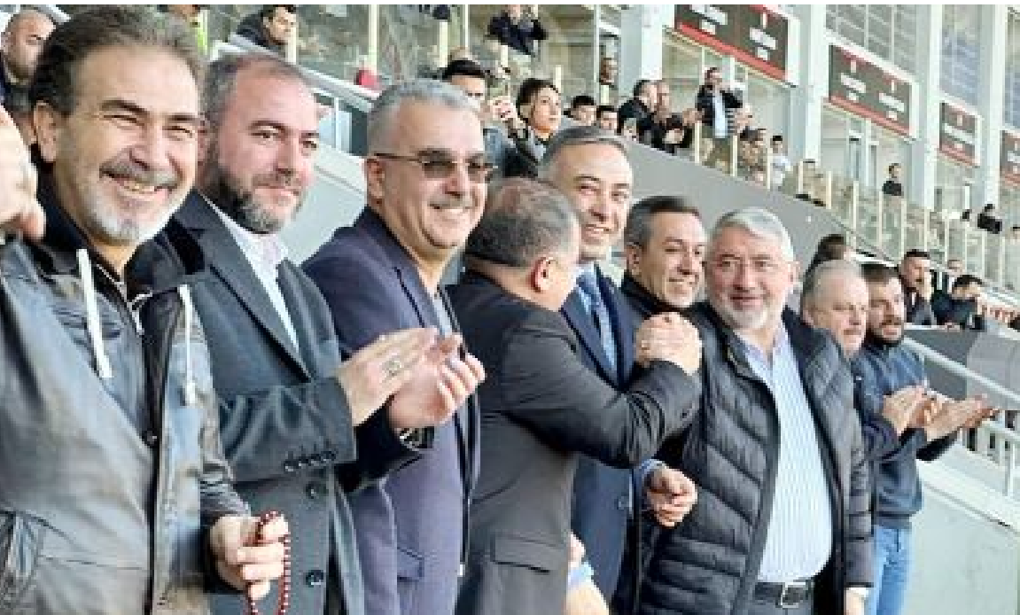
Ahlatcı Çorum FK'nın Bodrum FK'yı 2-1 yendiği maçı izleyen protokol üyelerinin galibiyet sevinci.

Ahlatcı Çorum FK ile play-off yarışındaki en önemli rakiple rinden Bandırmaspor arasında 3 Mart Pazar günü Çorum Şehir Stadyumu'nda oynanacak maç saat 19.00'da başlayacak. (Hüseyin AŞKIN)