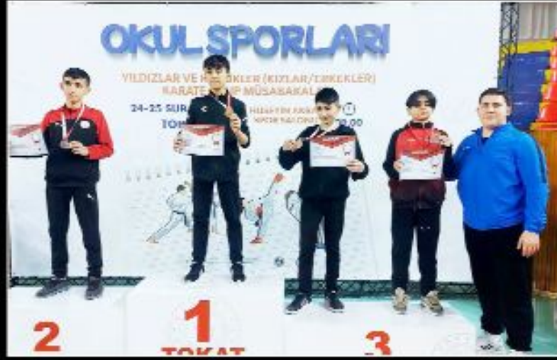
Çorumlu karateci ödül kürsüsünde görülüyor...