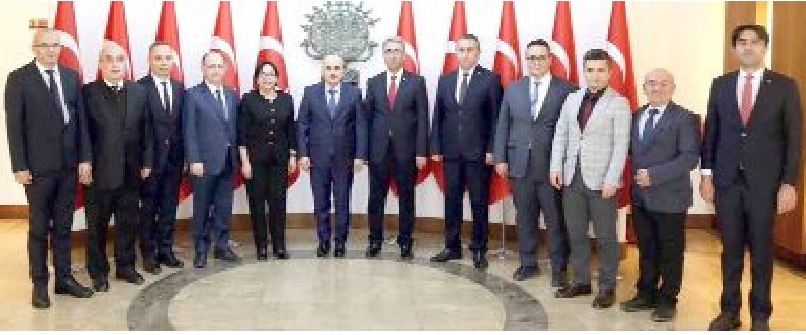
26 Şubat-3 Mart tarihleri arasında kutlanan Vergi Haftası "Geleceğimiz vergilerimizle güvende" sloganıyla başladı.