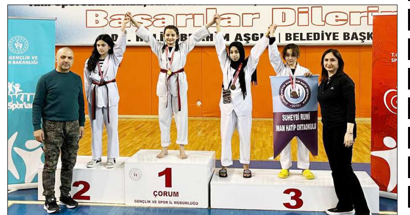
Müsabakalar Atatürk Spor Salonu'nda yapıldı.