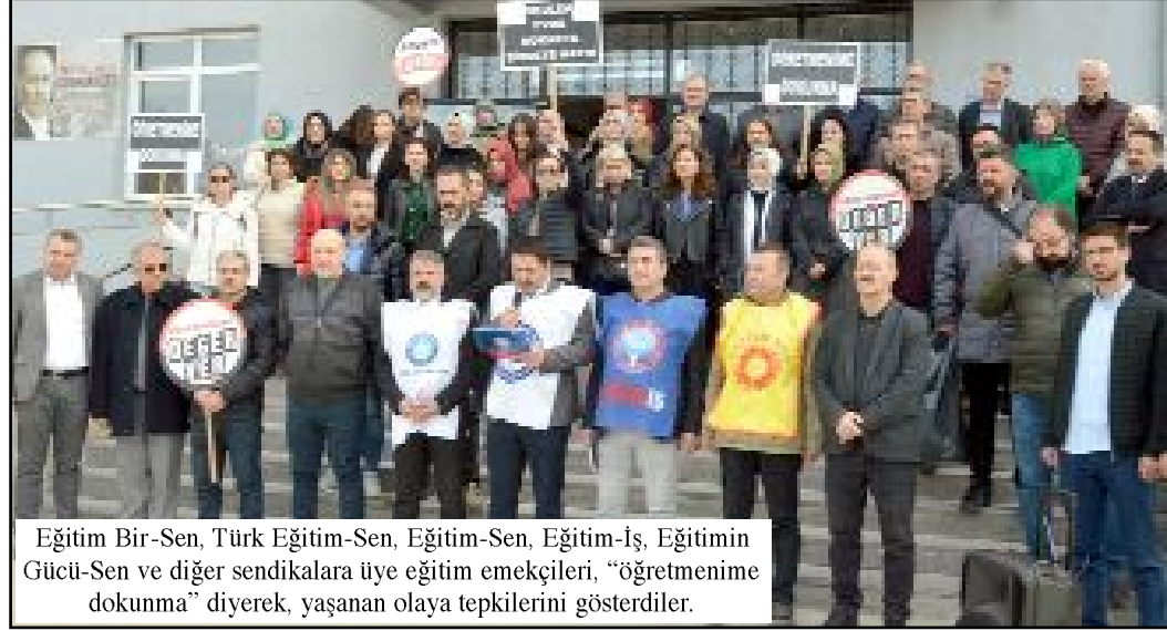
Eğitim Bir-Sen, Türk Eğitim-Sen, Eğitim-Sen, Eğitim-İş, Eğitimcinin Gücü-Sen ve diğer sendikalara üye eğitim emekçileri, "öğretmene dokunma" diyerek, yaşanan olaya tepkilerini gösterdiler.