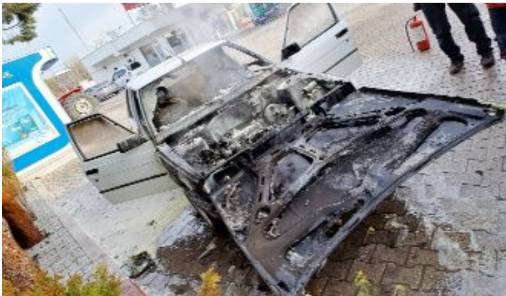
Olayda can kaybı ya da yaralanan olmazken otomobilde maddi hasar meydana geldi.

Çorum'un Sungurlu ilçesinde bir akaryakıt istasyonunda alev alan otomobildeki yangın, itfaiye ekipleri tarafından söndürüldü.