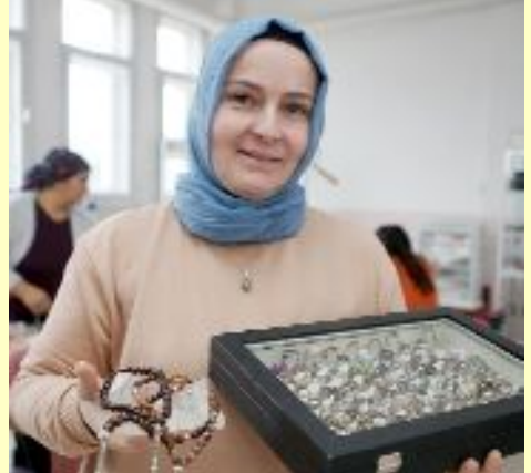
Kadınlar, Türkiye'nin 81 iline satış yapıyor.

● Çorum'un Mecitözü ilçesinde araziden topladıkları yarı değerli taşları işleyerek takıya dönüştüren kadın kooperatifinin ürünleri, yurdun dört bir yanından talep görüyor. •3'de