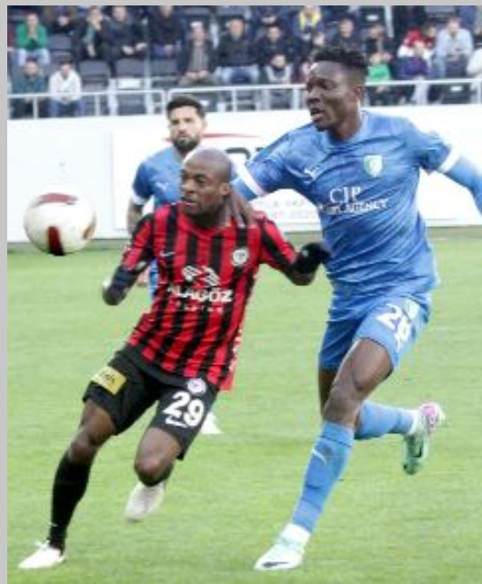
Ahlatcı Çorum FK, 24 Şubat'ta oynadığı maçta Bodrum FK'yı 2-1 yendi.

Daha önce 24 Şubat gününde 4 maç oynayan Ahlatcı Çorum FK, 2013'te Yozgatspor'a deplasmanda 3-1, 2016'da evinde Batman Petrolspor'a 1-0 yenilirken, 2019'da, sahasında Beyoğlu Yeniçarşı ile, 2021'de de deplasmanda Niğde Anadolu FK ile 0-0 berabere kalmıştı. (Hüseyin AŞKIN)