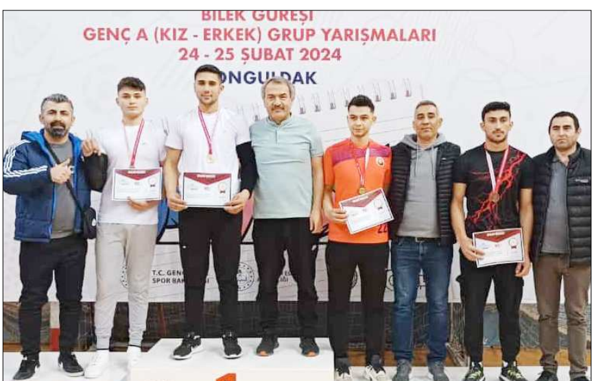
Dereceye giren Çorumlu sporcular kürsüde görülüyor...

Zonguldak'ta düzenlenen Okullararası Gençler (A) Bilek Güreşi Grup Birinciliği'nde Çorumlu öğrenciler 18 madalya ile Çorum'a döndüler.