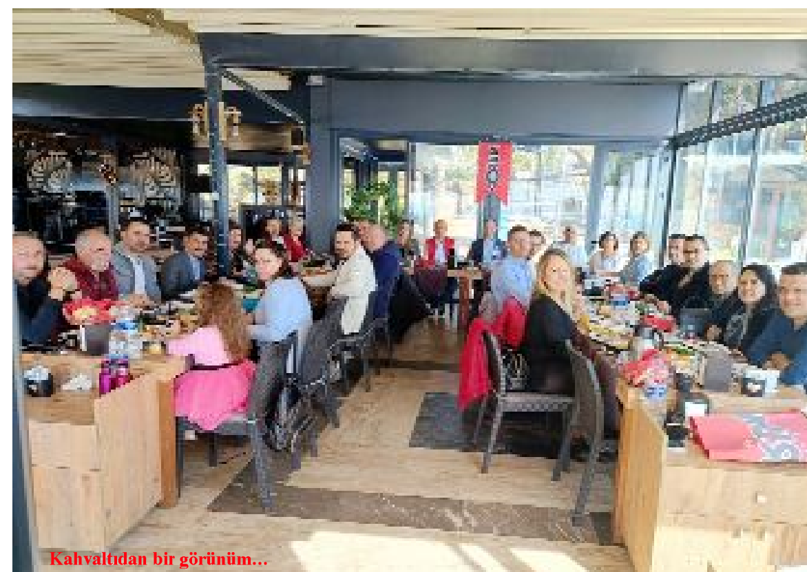
Kahvaltudan bir görünüm...