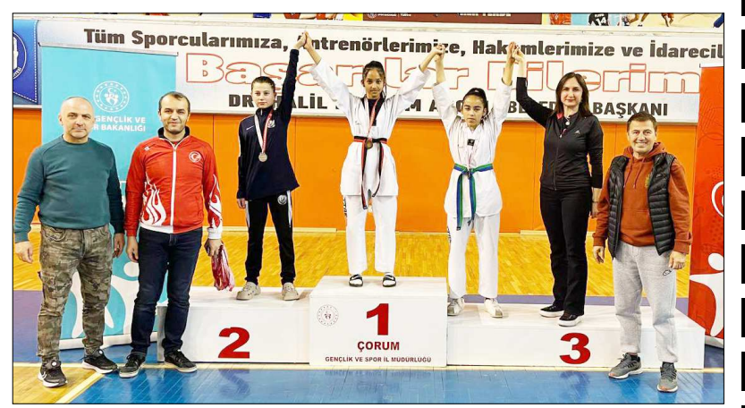
Müsabakalar Atatürk Spor Salonu'nda yapıldı.