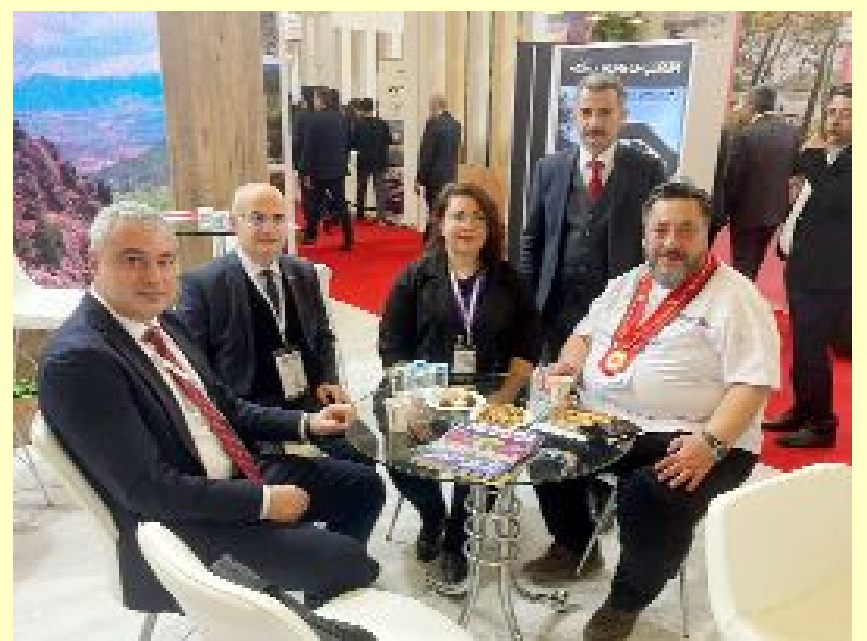
Fuara Çorum’dan İl Kültür ve Turizm Müdürlüğü ve Çorum Belediyesi katıldı.