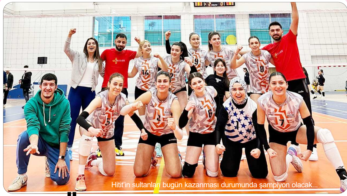
Hitit'in sultanları bugün kazanması durumunda şampiyon olacak...