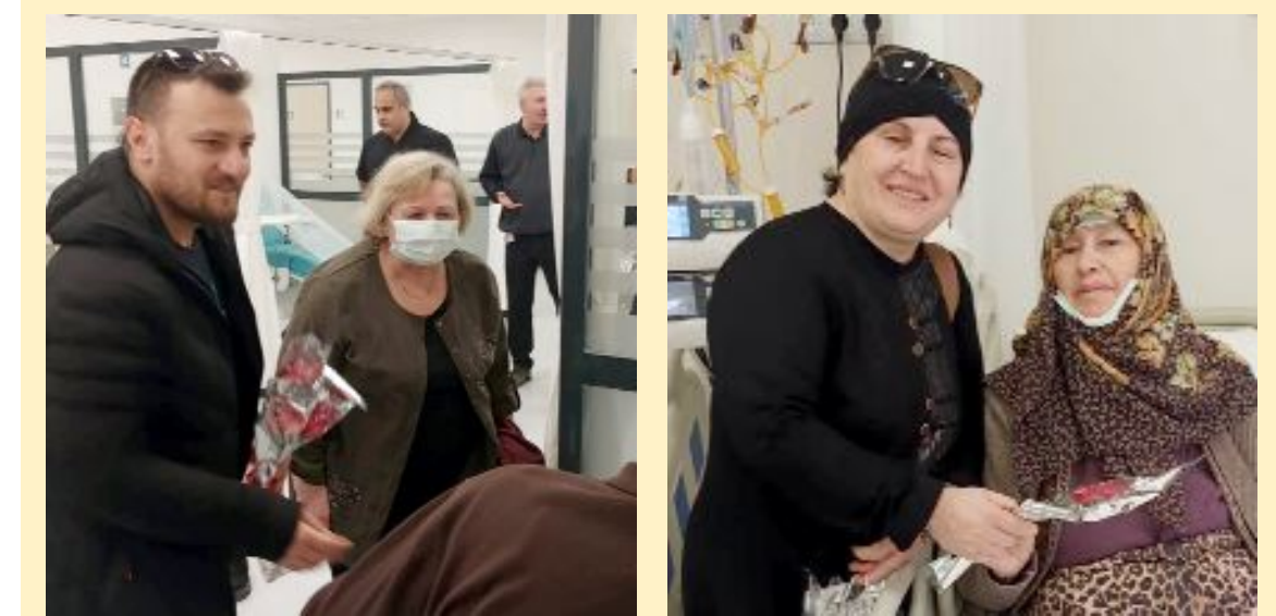
Farkındalık yararak amacıyla hastalara ve sağlıklılara çiçek dağıtan heyet, yakın ilgi ve destekleri nedeniyle de teşekkürlerini ilettiler.