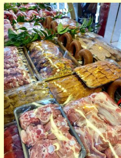
Ekol Et, en kaliteli et ürünleri ile hizmette...