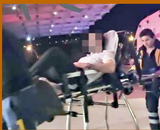
Bıçaklanan şahıslar, ambulansla hastaneye kaldırılarak tedavi altına alındı.