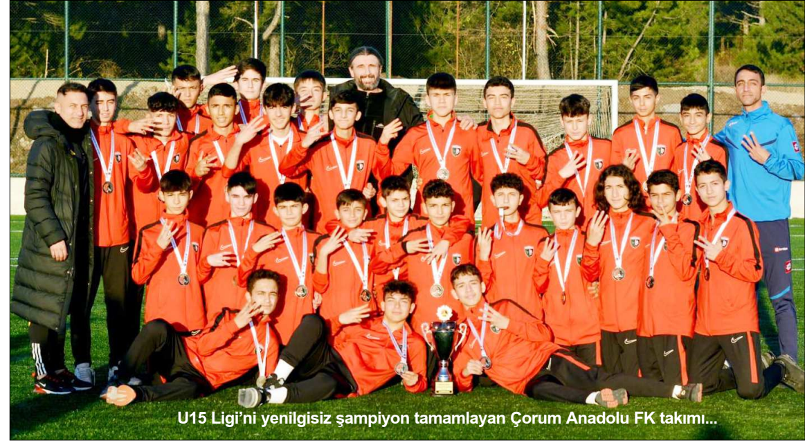
U15 Ligi'ni yenilgisiz şampiyon tamamlayan Çorum Anadolu FK takımı...