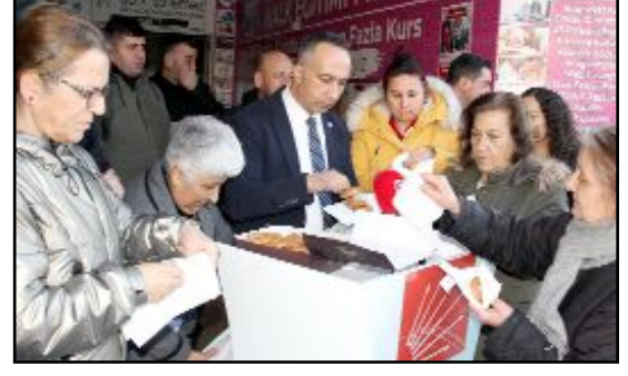
CHP Çorum İl Kadın Kolları, Miraç Kandili nedeniyle parti binası önünde kandil simidi dağıttı.

Konuşmaların ardından vatandaşlara kandil simidi dağıtıldı. (Taner ŞİMŞEK)