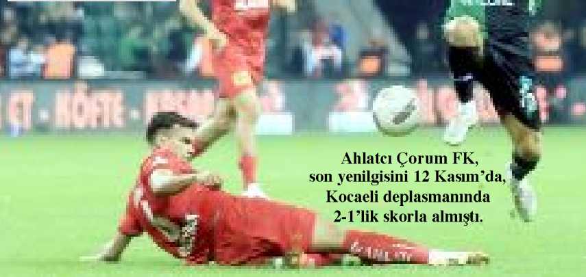
Ahlatçı Çorum FK, son yenilgisini 12 Kasım'da, Kocaeli deplasmanında 2-1'lik skorla almıştı.

Trendyol Türkiye 1.Futbol Ligi'nde Play-Off'a kalma mücadelesi veren ve bunun yanında ikincilik şansı güçlü şekilde devam eden Ahlatçı Çorum FK, son haftalarındaki formuyla dikkat çekiyor. Oynanan futbol ve alınan sonuçlar camianın umutlarını artırırken, taraftarın yüzünü güldürüyor.