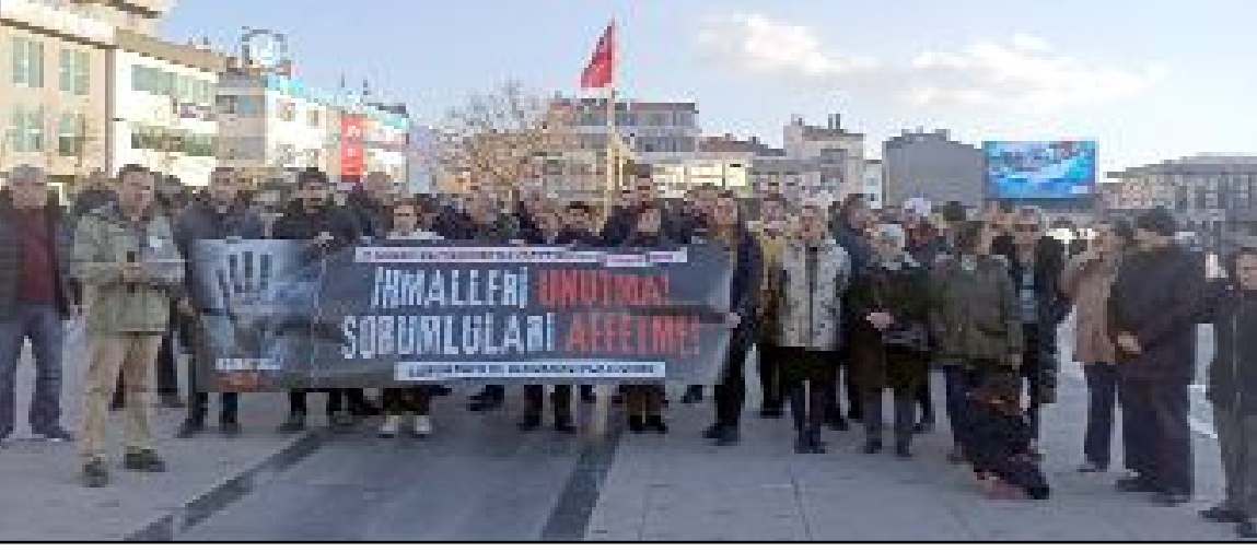
Çorum Emek ve Demokrasi Platformu, Kahramanmaraş merkezli 6 Şubat depremlerinin 1. yıldönümünde Kadeş Barış Meydanı'nda basın açıklaması yaparak hayatını kaybedenleri andı.