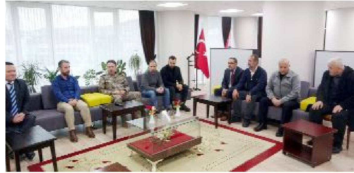
Pehlivan, 11 ili etkileyen depremi yaşadıktan sonra Çorum'da görev yapmaya başlayan polisleri makamında kabul etti.