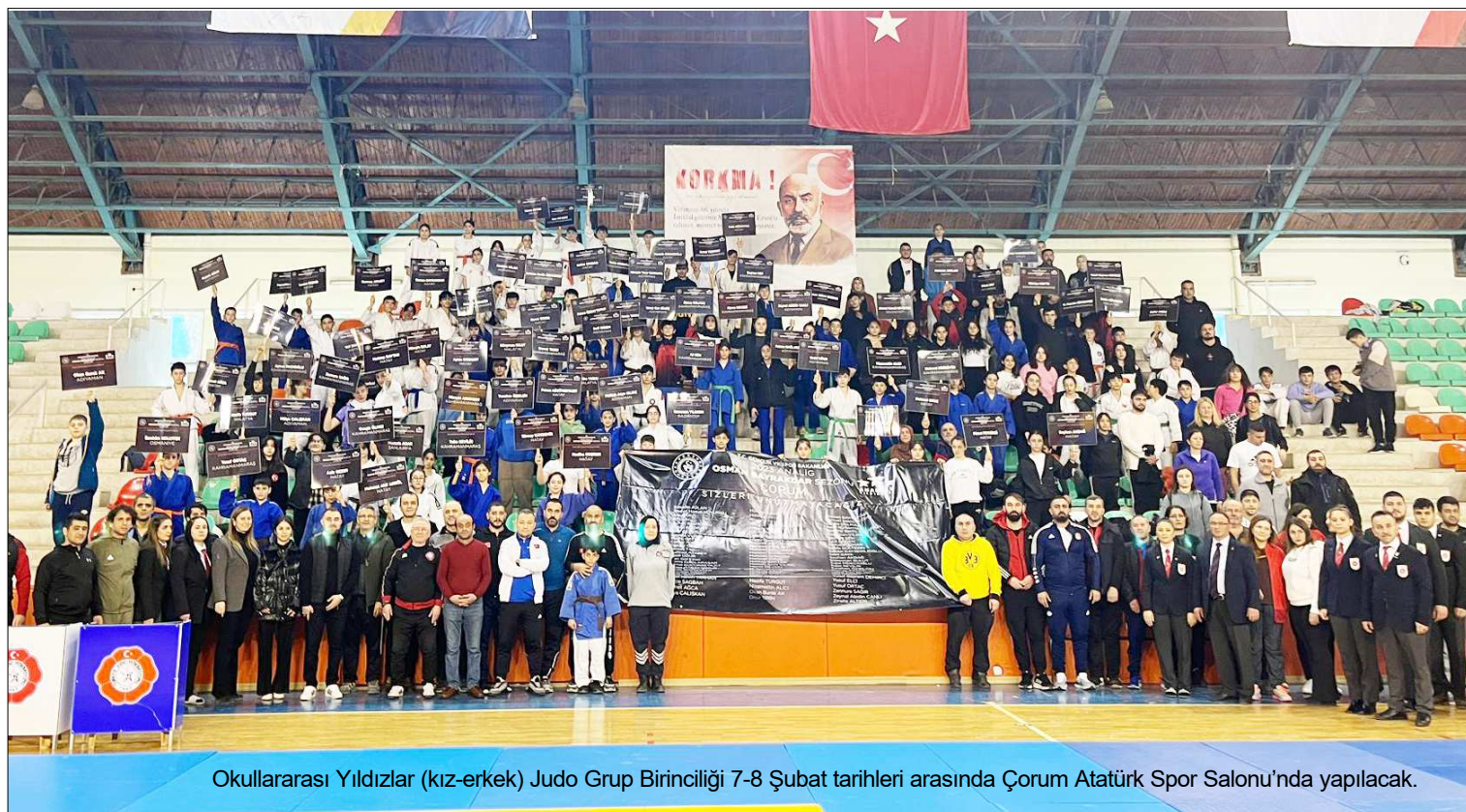
Okullararası Yıldızlar (kız-erkek) Judo Grup Birinciliği 7-8 Şubat tarihleri arasında Çorum Atatürk Spor Salonu'nda yapılacak.

Kitapçıkta belirtilen '21 kişilik müsabaka isim listesinde 6 futbolcudan az yaşı küçük futbolcu yazılırsa takım halinde hükmen mağlubiyet kararı verilir. Müsabaka isim listesine yaşı küçük 6 futbolcudan 1 yaşı küçük futbolcu yazılması halinde