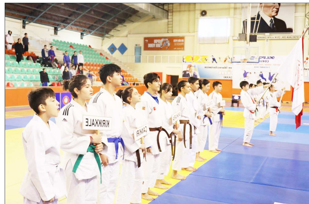
11 il den 157 sporcu Çorum'da mücadele edecek.