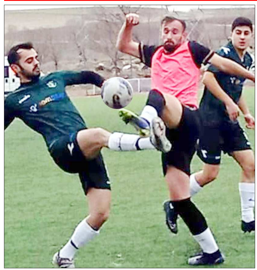
Alaca Belediye ile Mimar Sinan arasında oynanan maçtan enstantane...

Alaca Belediyespor'un listede yanlışlık yaptığı tespit edildi