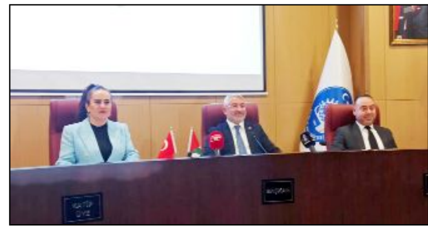
Sokak hayvanları meselesi Belediye Meclisi gündemine taşındı.