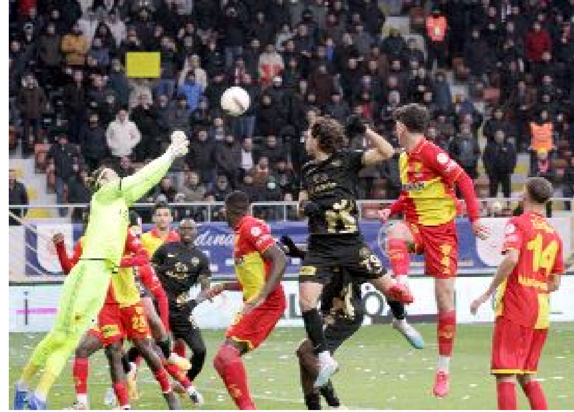
Ahlatcı Çorum FK, sahasında oynadığı son maçta Göztepe ile 1-1 berabere kalmıştı.