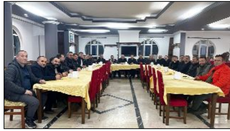
Toplantıda oda üyesi esnafın sorun ve talepleri görüldü.