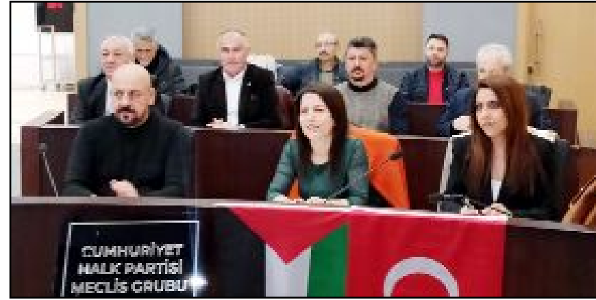
Belediye Meclis Salonu'nda gerçekleştirilen toplantıda 4 gündem maddesi görüşülerek karara bağlandı.

yaşam alanı oluşturmak için çalışmalarımıza başladık. Çatak yolu üzerinde 75 bin metrekaresel bir arazi tahsis ediyoruz. Bürokratik işlemler henüz tamamlandı. Hayvanların tüm ihtiyaçlarını doğal yaşam alanlarında gideceğiz. Süreci sıkı bir şekilde takip ediyoruz" dedi. (Haber Merkezi)