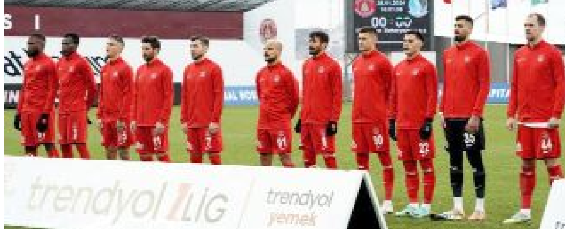
Ümraniyespor, 24 puanın 11'ini deplasmanda topladı.

Kırmızı-siyahlı ekip, 9 Şubat gününde oynadığı tek maçta, 2013-2014 Sezonunda, İzmir temsilcisi Balçova Yaşamspor'la deplasmanda karşılaştı. 9 Şubat 2014'te, Yeni Buca Stadi'nda oynanan maç, 88.dakikada Okan Aslan'ın attığı golle İzmir temsilcisi 1-0 kazandı. Öte yandan, Ümraniyespor ise daha önce 9 Şubat gününde 4 maç oynadı. İstanbul ekibi bu maçlarda 1 galibiyet, 3 yenilgi aldı ve attığı 2 gole karşılık 8 gol yedi. (Hüseyin AŞKIN)