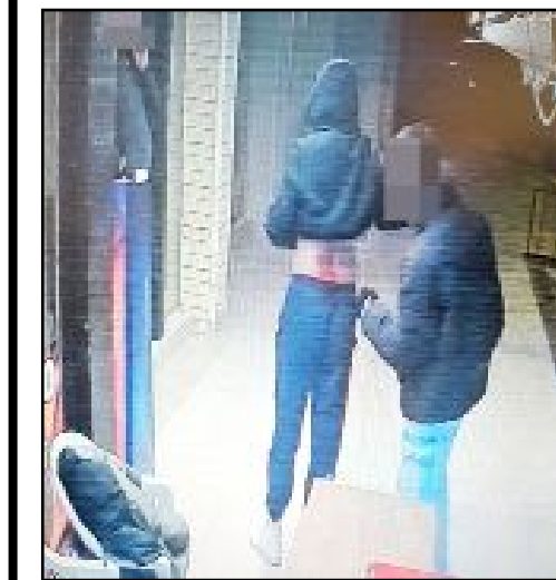
Yaralı gencin bir iş yerine sığındığı anlar güvenlik kamerasına yansdı.

Öte yandan yaralı gencin bir iş yerine sığındığı anlar güvenlik kamerasına yansdı. (AA)