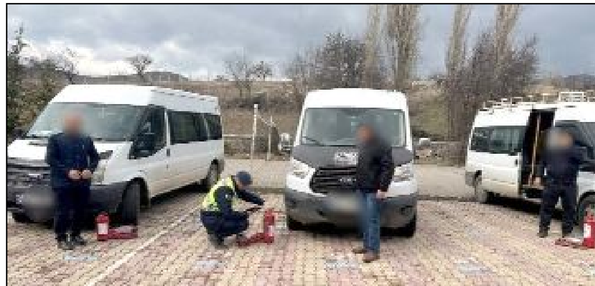
Ekipler denetimde 29 umuma açık işyeri, 26 metruk bina, 3 bin 183 şahıs, Bin 241 araç ve 93 okul servis aracını kontrol etti.

Komutanlığı tarafından alınmasına devam edilecektir."(Volkan SINAYUÇ)