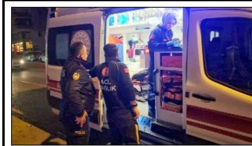
Olay Bahçelievler Mahallesi Bahar Caddesi'nde meydana geldi.

üzerine olay yerine itfaiye ekipleri sevk edildi. Kısa sürede olay yerine gelen itfaiye ekipleri, yangını söndürdü. Yangında can kaybı ya da yaralanan olmazken, bir otomobil kullanılmaz hale geldi, evin çatısı da zarar gördü. (İHA)