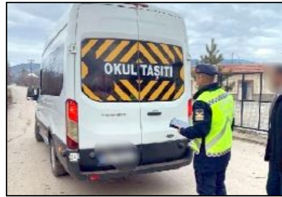
İl Jandarma Komutanlığı'na bağlı ekipler kapsamlı bir denetim yaptı.

günü yapılan denetimlerde; (29) umuma açık işyeri, (26) metruk bina, (3.183) şahıs, (1.241) araç, (93) okul servis aracı kontrol edildi. Kontroller sonucunda (5) aranan şahıs yakalanarak, (42) araç ve sürücüsüne trafik idari para cezası düzenlendi. Çocukların eğitim süreçlerinin güvenliğine ilişkin koruyucu ve önleyici hizmetlerin İl Jandarma Komutanlığı tarafından alınmasına devam edilecektir."(Volkan SINAYUÇ)