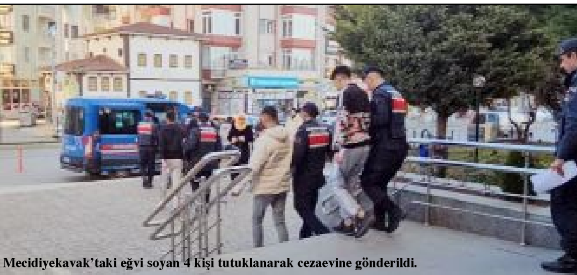
Mecidiyekavak'taki eği soyan 4 kişi tutuklanarak cezaevine gönderildi.

Zanlılar İl Jandarma Komutanlığı'ndaki ifade işlemlerinin ardından adliye sevk edilen şüpheliler çıkarıldıkları hakimlikçe tutuklanarak cezaevine gönderildi. (Haber Merkezi)