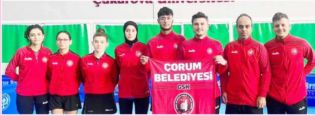
Çorum Belediyesi Spor Kulübü kız ve erkek takımı birlikte görülüyor...

Çorum Belediyesi kadınlar da ilk maçını Antakya Belediyesi'ne karşı oynarken, Spor İhtisas ise Mert Grup Real Mardin takımı ile karşılaşacak. Erkeklerde ise Çorum Belediyesi ilk maçını Adana temsilcisi Çiftar MTI ile oynayacak. (Rifat KARA)