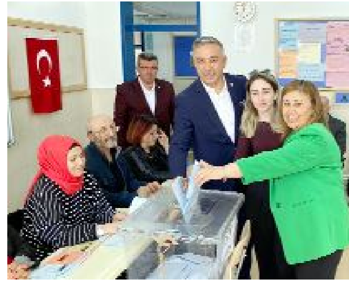
CHP Çorum Milletvekili Mehmet Tahtasız ve eşi Perinay Tahtasız...