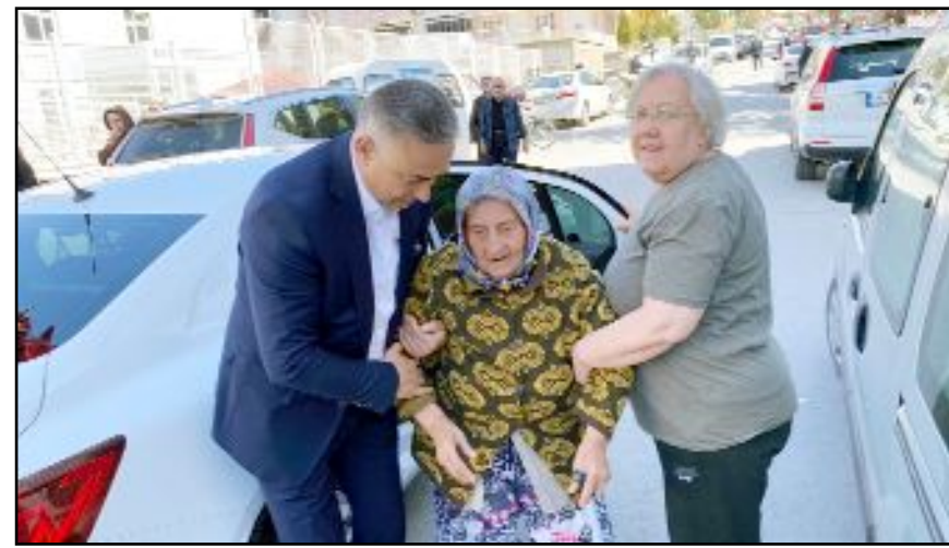
CHP Çorum Milletvekili Tahtasız okullarda karşılaştığı yaşlılarla yakından ilgilendi.