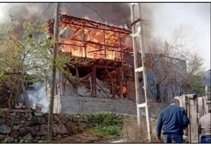
Kargı'nın Sinanozü Köyü'nde bir evde başlayan yangın çevredeki 5 eve de sıçradı. Yangın güçlükle kontrol altına alındı.