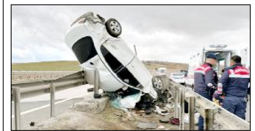
Kırıkkale'nin Delice İlçesi'nde yaşanan kazara yaralıları hastaneye kaldırdı.

Yapılan uygulamalar son bir hafta içerisinde 6 ruhsatsız