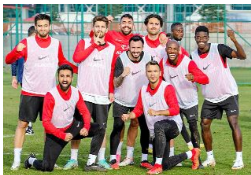
Ahlatcı Çorum FK'da kritik maç öncesi moralli oldukça yüksek