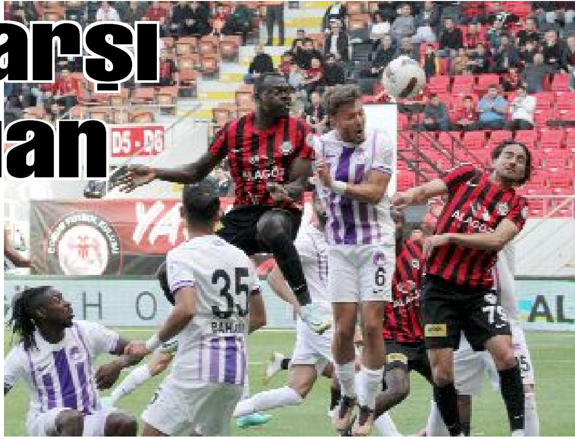
Ahlatcı Çorum FK, Başkent ekibini Çorum'da hiç yenemedi. 2012'de, Dr. Turhan Kılıçcıoğlu Stadı'nda oynanan maç 1-1 biterken, bu sezonun ilk yarısında, Çorum Şehir Stadyumu'ndaki karşılaşmada ise gülen taraf 2-0 geriden gelen Ankara Keçiöregücü oldu. Başkent ekibi 3-2 kazandı.