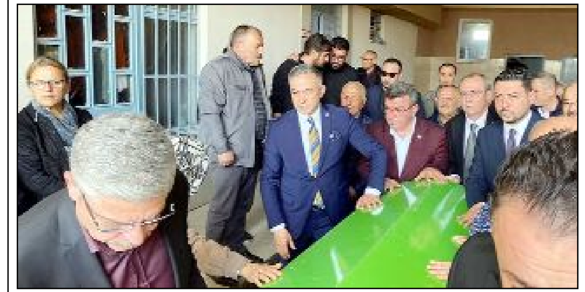
Cenaze, köye götürülmek üzere cenaze arabasına taşınırken...

ÇORUM HABER merhametle Allah'tan rahmet, ailesine ve yakınlarına başsağlığı diler. (Haber Merkezi)