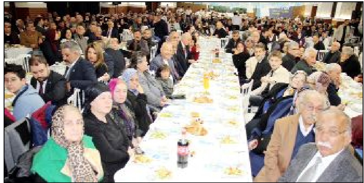
Anitta Otel'de düzenlenen iftar yemeğine partililer ile birlikte sivil toplum kuruluşu temsilcileri ile davetliler de katıldı.