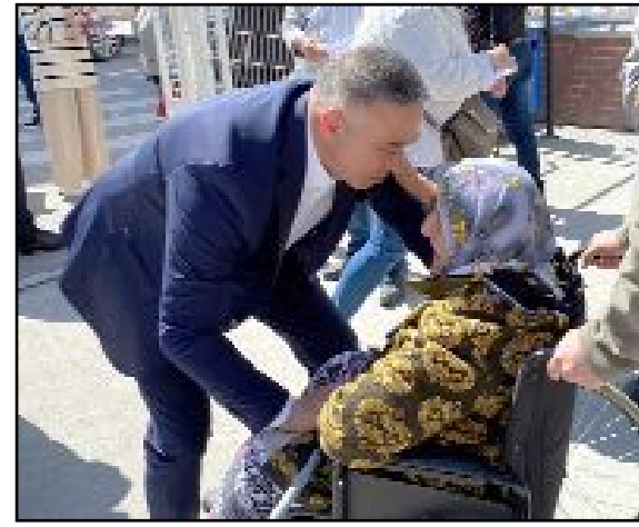
Milletvekili Tahtasız, yaşlı ve engellilere oy kullanmaları için yardımda da bulundu.