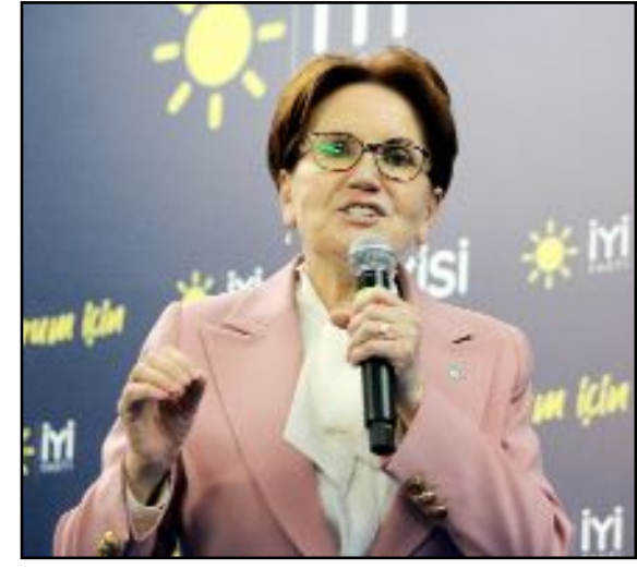
İYİ Parti Genel Başkanı Meral Akşener

Konuşmasında İYİ Parti üyelerine "sandıkları sahip çıkın" çağrısında da bulunan Akşener'in konuşmasının ardından Kur'an-ı Kerim Tilaveti okundu. Program iftar yemeği ile son buldu.