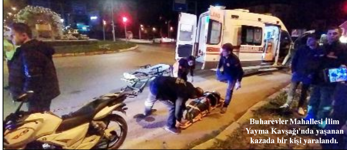
Buharevler Mahallesi İlim Yayma Kavşağı'nda yaşanan kazada bir kişi yaralandı.

Kaza nedeni ile motosikletten düşerek yaralanan sürücü sağlık ekipleri tarafından yapılan müdahalenin ardından Hitit Üniversitesi Erol Olçok Eğitim ve Araştırma Hastanesi'ne kaldırıldı. (Haber Merkezi)