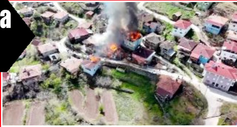
Kargı'ya bağlı Sinönözü Köyü'nde bir evde başlayan yangında 6 ev hasar aldı.