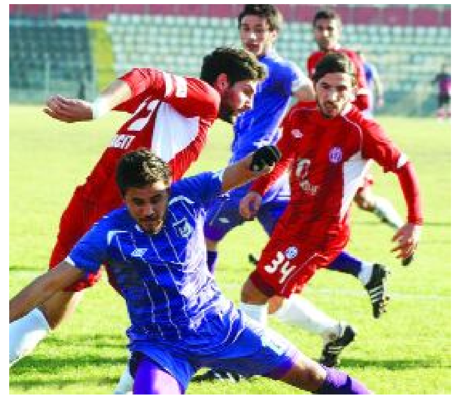
İki takım ilk kez 2012-2013 Sezonunun 15.haftasında karşılaştı. 9 Aralık 2012'de, Dr. Turhan Kılıçcıoğlu Stadı'nda oynanan maç 1-1 bitti.