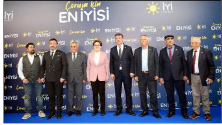
Meral Akşener, İYİ Parti Belediye Başkan Adayı Ahmet Ertekin'e destek istedi.

● Çorum'da iftara katılarak demokrasilerde hür irade ile sandığa atılan oyların sonucunun tartışılmayacağını söyleyen İYİ Parti Genel Başkanı Meral Akşener, Cumhurbaşkanı Erdoğan'a emeklilerin maaşı ve ikramiyelerinin iyileştirilmesi, 100 bin öğretmen atanması ve kamuda personel alımında mülakatın kaldırılması çağrısında bulundu. Akşener: "Milletin baş tacı edilebilmesi için, seçmenin velinimet olması için bize güç verirsiniz ben de üzerime düşen millet avukatı olma görevini yerine getiririm" diye konuştu.