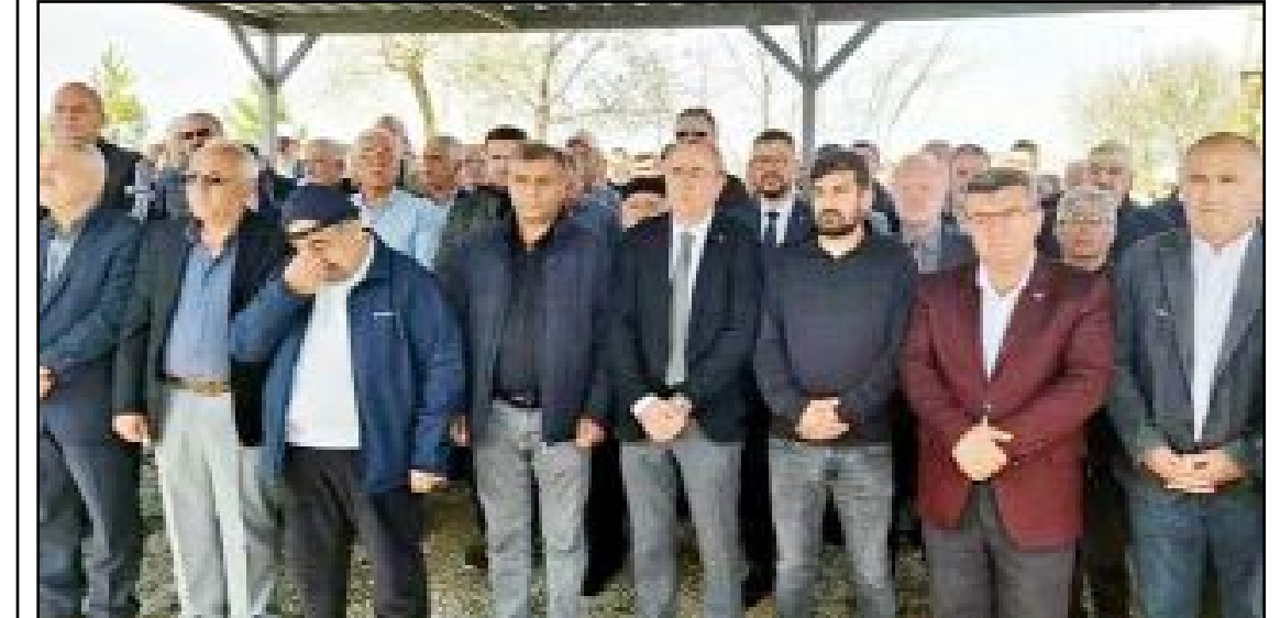
Yakınları ve sevenleri gözyaşlarını tutamadı...