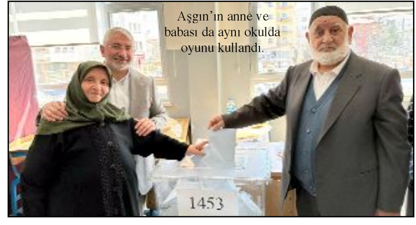
Aşgın'ın anne ve babası da aynı okulda oyunu kullandı.

Başkan Aşgın ayrıca okulları tek tek gezerek sandık görevlileri ve vatandaşlarla sohbet etti. (Volkan SINAYUÇ)