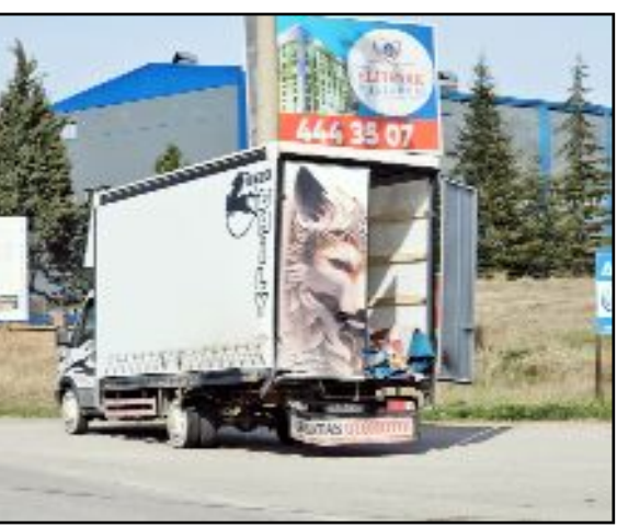
Çorum - Ankara Karayolu Yaydığı Kavşağı'nda yaşanan kazada bir kişi yaralanarak hastaneye kaldırıldı.