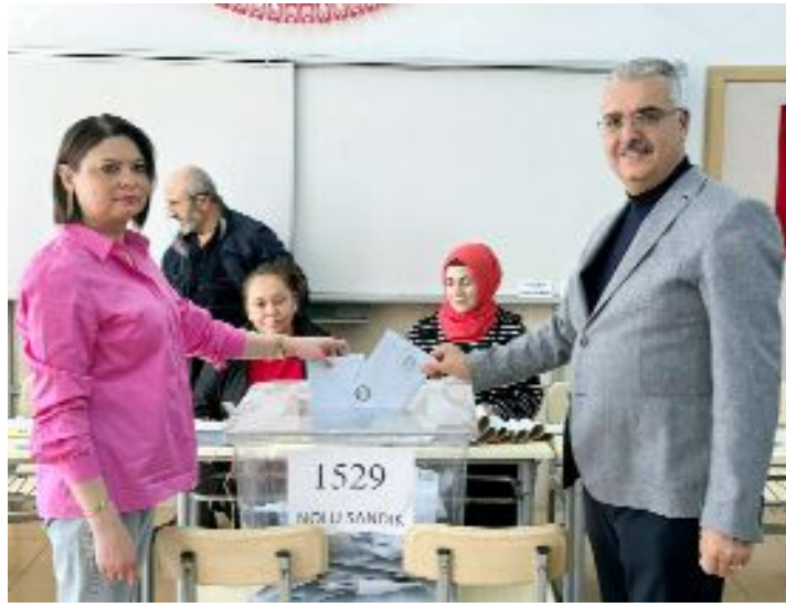
AK Parti Çorum Milletvekili Yusuf Ahlatcı ve eşi Meral Ahlatcı...