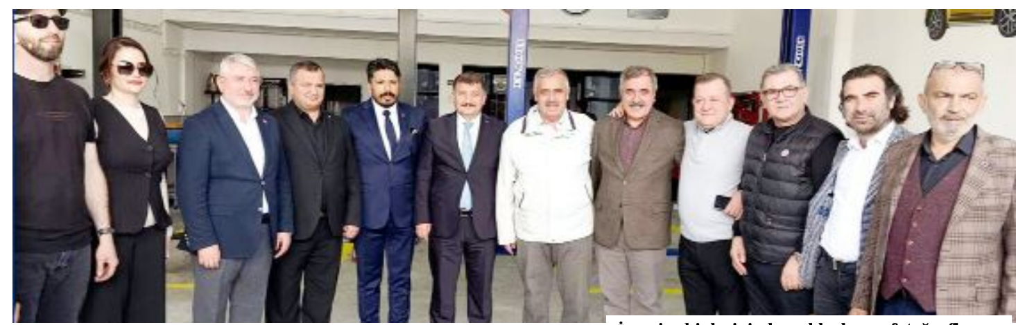
İşyeri sahiplerinin konuklarla anı fotoğrafları...

Çorum Sanayi Sitesi'nde açılan işyerinde, geniş kapsamlı otomotiv yedek parçaları, lastik satışı yanında servis hizmeti verilecek. (Haber Merkezi)