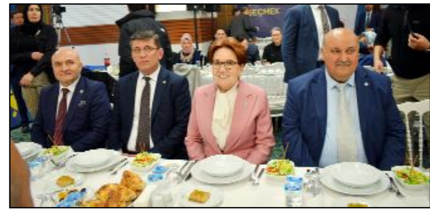
Meral Akşener partisinin düzenlediği iftar yemeğinde Çorumlular ile buluştu.