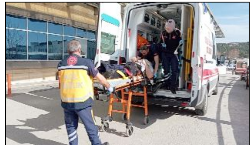
Yürüyüş yaparken yere düşen şahıs hastanede tedavi altına alındı.