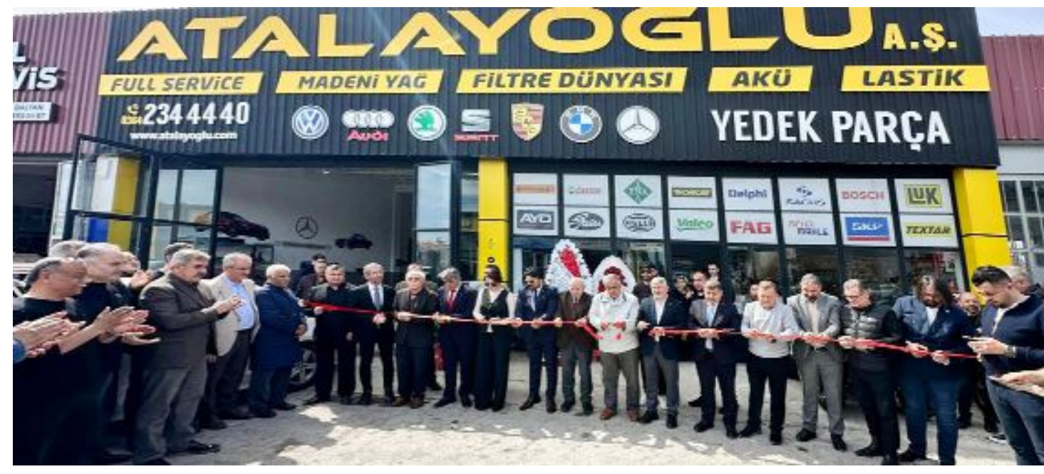
Atalayoğlu Otomotiv Sanayi ve Dış Ticaret A.Ş. işyerinin açılışında kurdele kesimi...