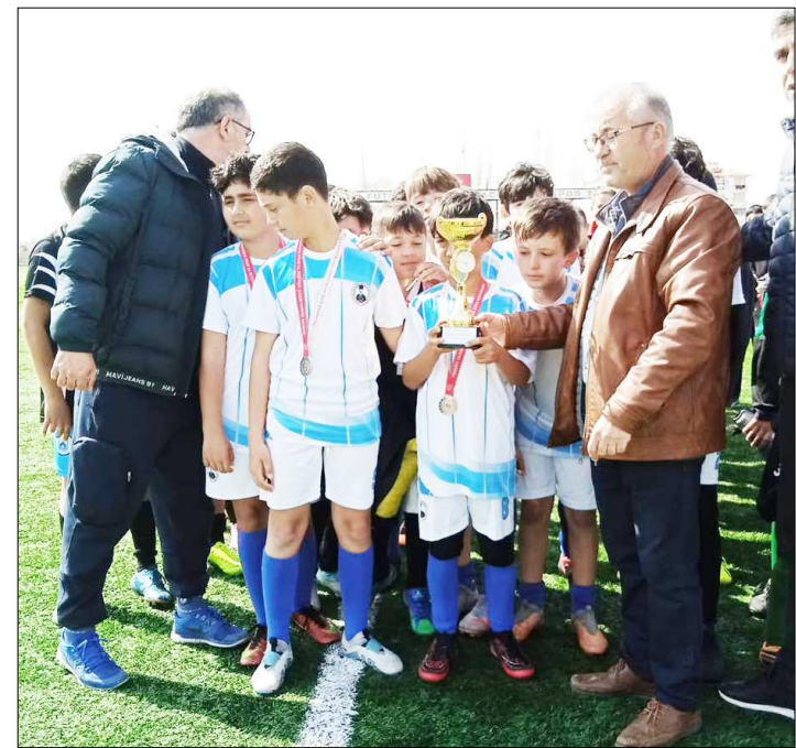
Osmancık Atatürk Ortaokulu ikincilik kupası ile görülüyor...

final maçında Merkez Yıldırım Beyazıt İmam Hatip Ortaokulu ile Osmancık Atatürk Ortaokulu karşı karşıya geldi. Baştan sona üstün bir oyun ortaya koyan Yıldırım Beyazıt İmam Hatip Ortaokulu maşı 8-0 kazanarak son yıllarda olduğu gibi bu yılda şampiyonluğa uzandı. Osmancık temsilcisi ise ikincilik kupasını aldı. (Rifat KARA)