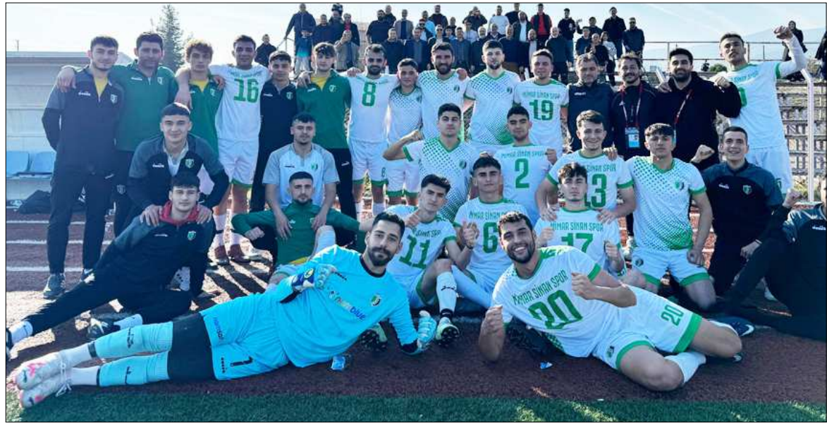
2023-2024 1.Amatör Küme Büyükler Futbol Ligi'nin şampiyonu Mimar Sinanspor oldu.