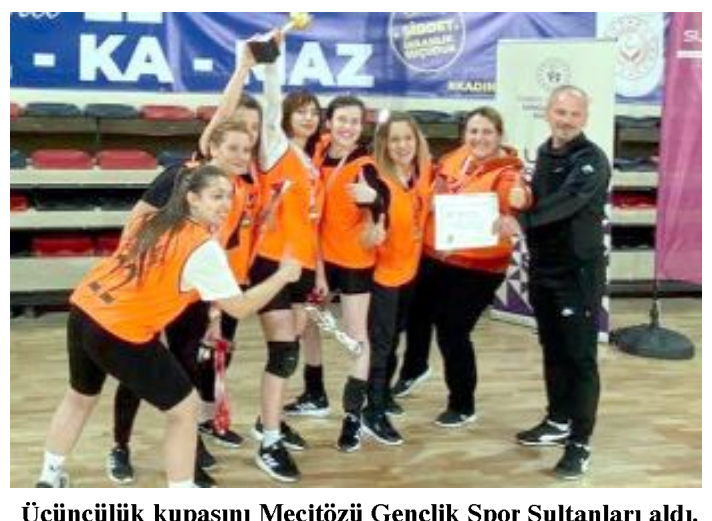
Üçüncülük kupasını Mecitözü Gençlik Spor Sultanları aldı.