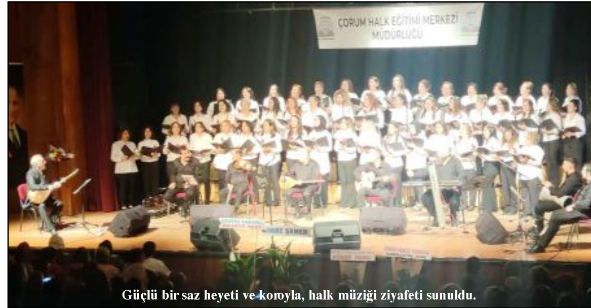
Güçlü bir saz heyeti ve koroyla, halk müziği ziyafeti sunuldu.