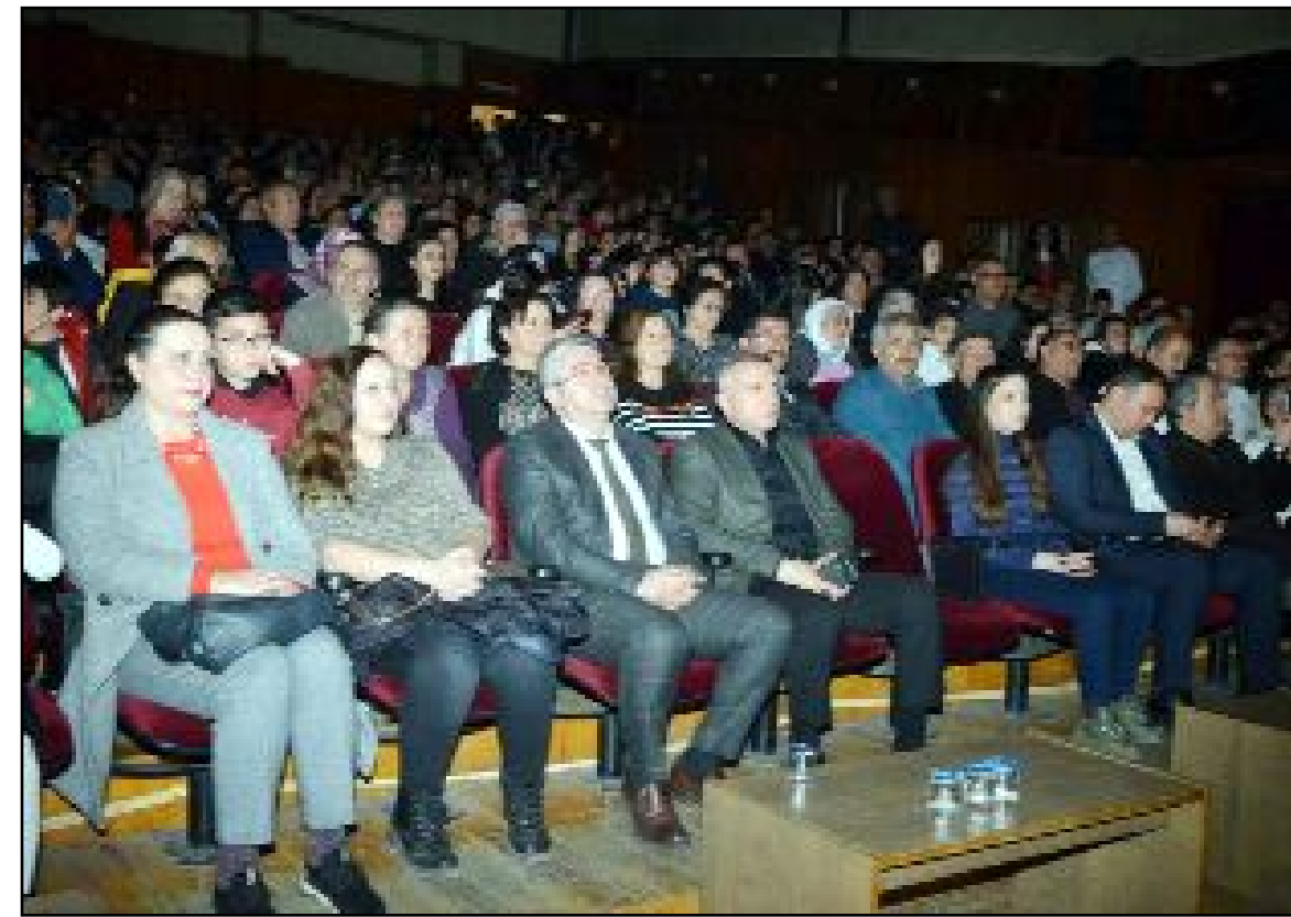
Çorum Devlet Tiyatrosu Salonu, iğne atılsa yere düşmeyecek derecede izleyici yoğunluğuna sahne oldu.