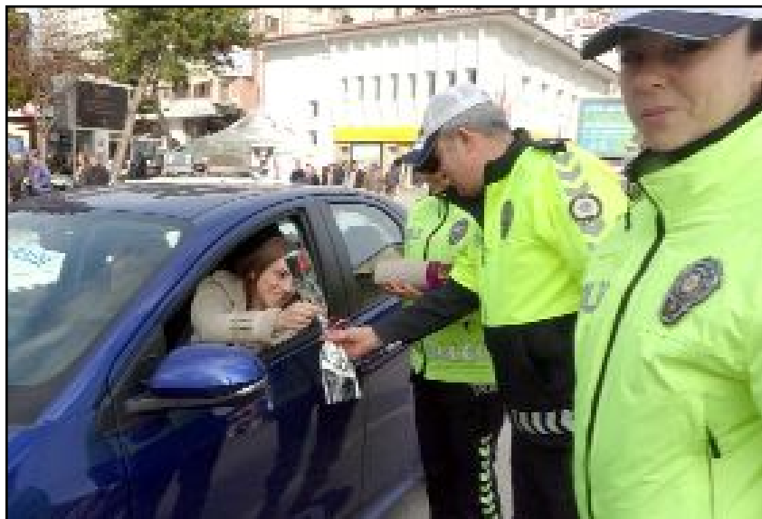
Trafik ekiplerince 8 Mart Dünya Kadınlar Günü dolayısıyla kadın sürücülere karanfil verildi.

Uygulama esnasında trafik ekiplerinin karanfil hediyesi ve çikolata ikramı ile karşılanan kadın sürücüler anlamlı jestten dolayı polis ekiplerine teşekkür ettiler. (Haber Merkezi)