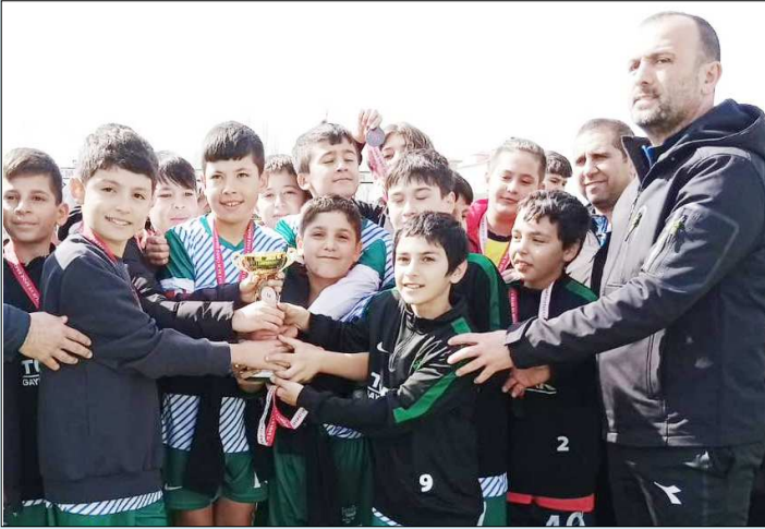
Meliha-Rifat Gobel Ortaokulu üçüncülük kupası ile görülüyor...