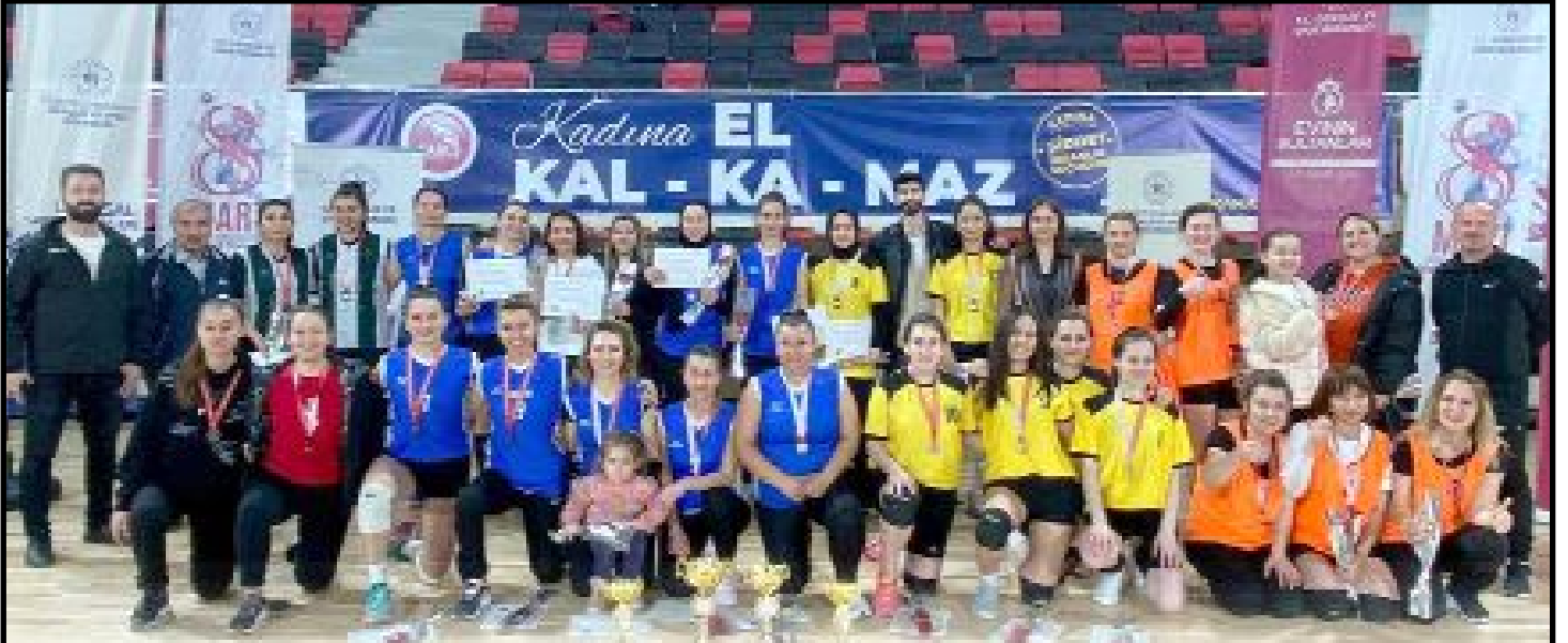
Turnuvada dereceye giren takımlar ödül töreninden sonra toplu fotoğrafta görülüyorlar.