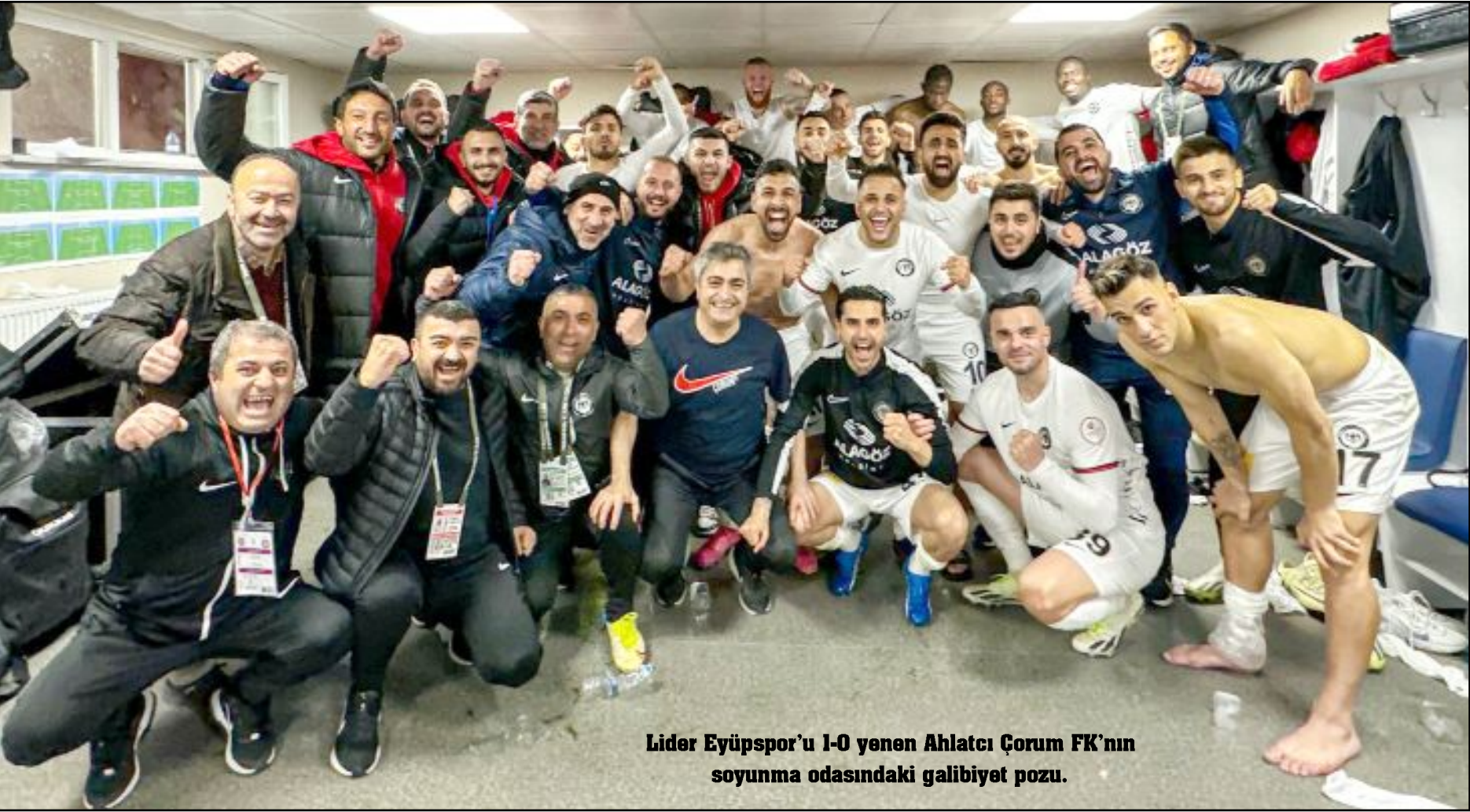
Lider Eyüpspor'u 1-0 yenen Ahlatcı Çorum FK'nın soyunma odasındaki galibiyet pozu.