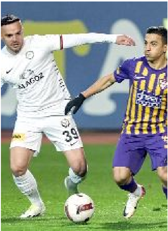
Maçın genelinde Eyüpspor topa daha çok sahip olup daha çok pozisyon bulmasına rağmen kazanan taraf Ahlatcı Futbol Kulübü oldu.

Ahlatcı Çorum FK'nın da yer aldığı Trendyol Türkiye 1.Futbol Ligi'nde 26.haftanın kapanış maçı bugün Manisa FK ile Ümraniyespor arasında oynanacak. Ligde, 16 Mart Cumartesi günü Ahlatcı Çorum FK'nın konduğu olacak olan Manisa FK ile İstanbul temsilcisi Ümraniyespor arasında bugün Manisa 19 Mayıs Stadı'nda oynanacak maç saat 20.30'da başlayacak. (Hüseyin AŞKIN)