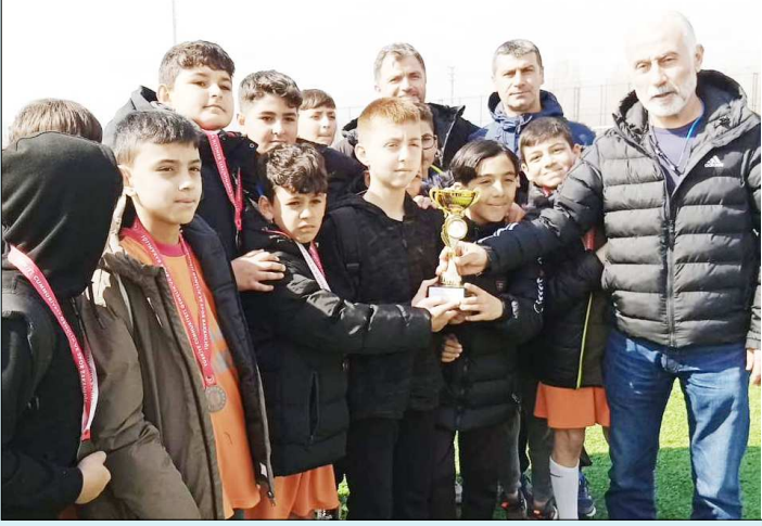
Mimar Sinan Ortaokulu dördüncülük kupası ile görülüyor...