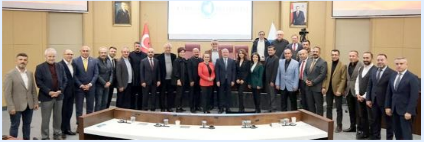
Belediye Meclis üyeleri, son toplantıda "veda konuşmaları" yaptı.

barek Kadir Gecesi idrak edilecek, Ramazan Bayramı ise 10 Nisan 2024 Çarşamba günü başlayacak. Kutsal Ramazan, Çorum'umuzu, ülkemize ve tüm İslâm âlemine barış, huzur, esenlik, mutluluk getirsin.