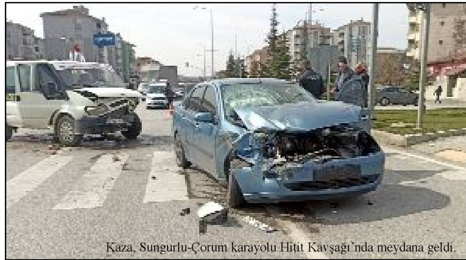
Kaza, Sungurlu-Çorum karayolu Hitit Kavşağı'nda meydana geldi.

Kazayla ilgili soruşturma başlatıldı. (İHA)