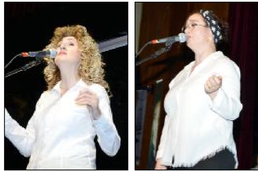
Kadınlar Konseri'nin solistlerinden...

● Çorum Halk Eğitimi Merkezi tarafından 8 Mart Dünya Kadınlar Günü etkinlikleri kapsamında düzenlenen Şef Arif Sadeçolak yönetimindeki Türk Halk Müziği Kadınlar Korusu'nun konseri olağanüstü ilgi gördü ve büyük beğeni kazandı.