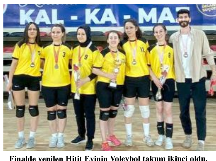
Finalde yenilen Hitit Evinin Voleybol takımı ikinci oldu.

ÜÇÜNCÜLÜK KUPASINI MECİTÖZÜ ALDI Turnuvanın üçüncülük maçında ise yarı finalin yenilen takımları Oğuzlar Altınkoz ile Mecitözü Gençlik Spor karşı karşıya geldi. Yine Yeni Spor Salonu’nda oynanan maçı 2-1 kazanan Mecitözü Gençlik Spor Sultanları üçüncülüğü elde ederken, Oğuzlar Altınkoz Sultanları dördüncü oldu. Mecitözü, ilk seti 25-16, ikinci seti 25-18 kazanırken, karşılaşmanın üçüncü setini 15-12’lik skorla Oğuzlar aldı. (Hüseyin AŞKIN)