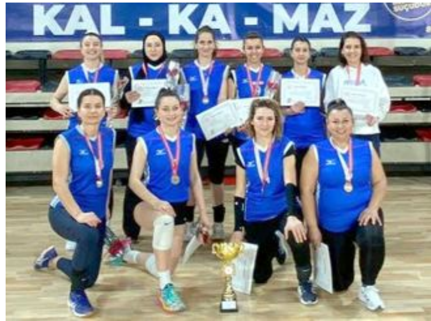
Şampiyonluk ipini göğüsleyen İl Milli Eğitim Müdürlüğü Sultanları...

8 Mart Dünya Kadınlar Günü’nde oynanan final maçında Hitit Evinin Voleybol Takımı’nı 25-16, 25-16 ve 15-4’lük setler sonucu 3-0 yenen İl Milli Eğitim Müdürlüğü Sultanları şampiyon oldu.