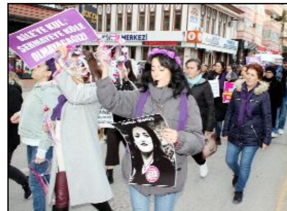
Yürüyüş ve basın açıklamasına bazı siyasi partilerin yöneticileri ve sivil toplum kuruluşlarının temsilcileri de destek verdi.