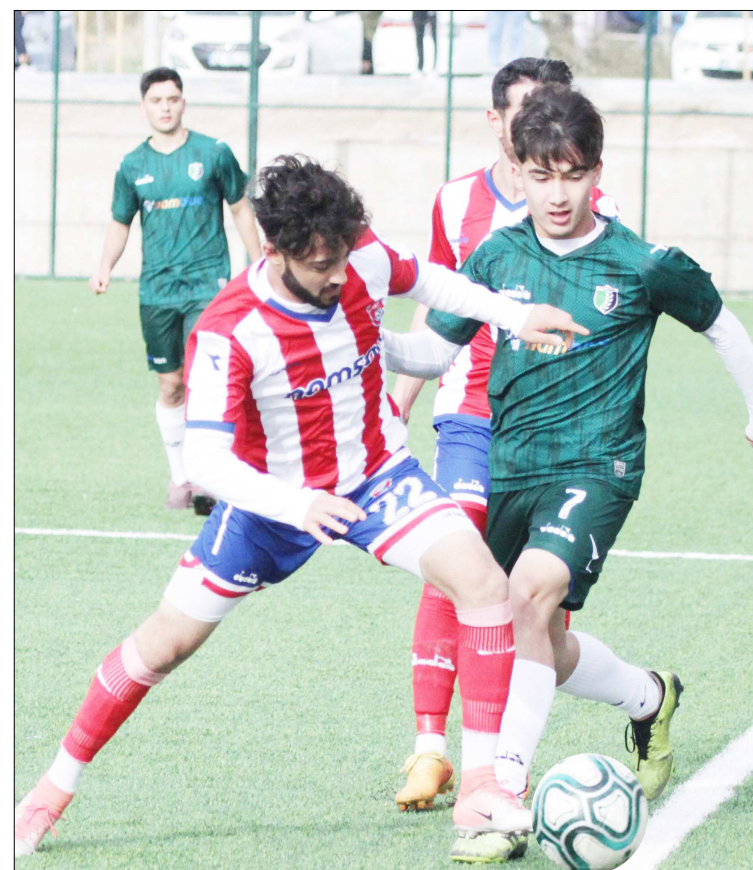
Mimar Sinanspor ile Güllübeyspor arasında oynanan maçtan enstantane.