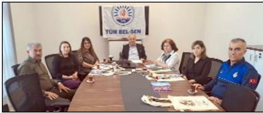
Tüm Bel Sen Çorum Şubesi, 8 Mart Dünya Emekçi Kadınlar Günü'nde anlamlı bir dayanışma örneğine imza attı.

Tüm dünya kadınlarının 8 Mart Dünya Emekçi Kadınlar Günü'nü kutluyoruz." (Haber Merkezi)