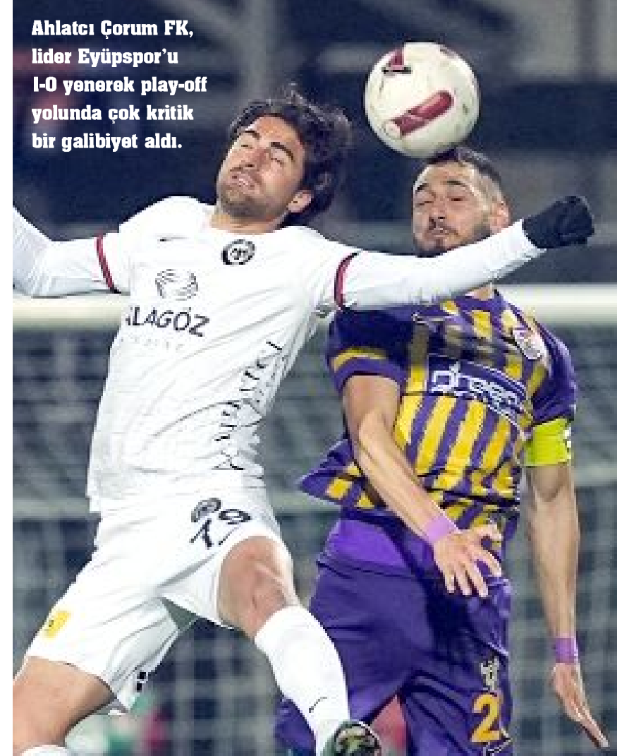
Ahlatcı Çorum FK, lider Eyüpspor'u 1-0 yenerek play-off yolunda çok kritik bir galibiyet aldı.