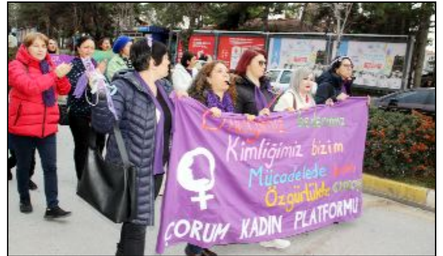
Hünkâr Hacı Bektaş Veli Parkından yürüyüş başlatan kadınlar, Kadeş Barış Meydanında kitlesel basın açıklaması düzenledi.

duğunun farkındayız. Tüm bu olumsuz tabloya, faşizmin ve kökten dinciliğin kendisini kurumsallaştırma girişimlerine rağmen, kadınların yaşamın her alanına eşit ve özgür katıldığı, gerçek anlamda demokrasinin ve barışın, laik bir yönetim biçiminin inşa edildiği bir ülke yaratmanın mümkün olduğunu biliyoruz." (Taner ŞİMŞEK)