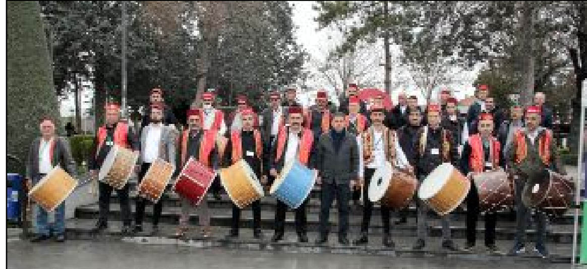
Be yaz gömlek, fes ve yelekten oluşan giysileri ile mahalleleri dolaşacak davulcular bahşiş toplayamayacak.