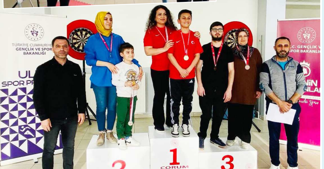
Kategorilerinde dereceye giren ailelere madalyaları verildi.