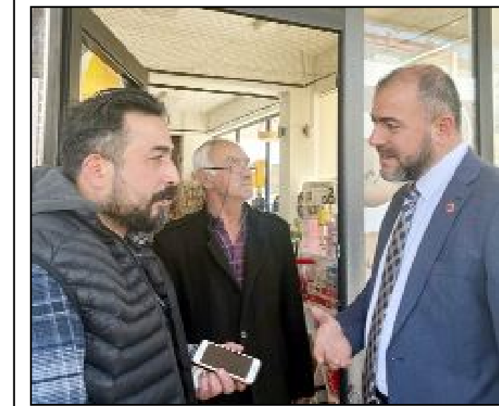
Bölge halkının taleplerini dinleyen ve Millî Görüş Belediyeciliği'nin ilkelerini anlatan Cıdık, yurttaşlardan destek istedi.