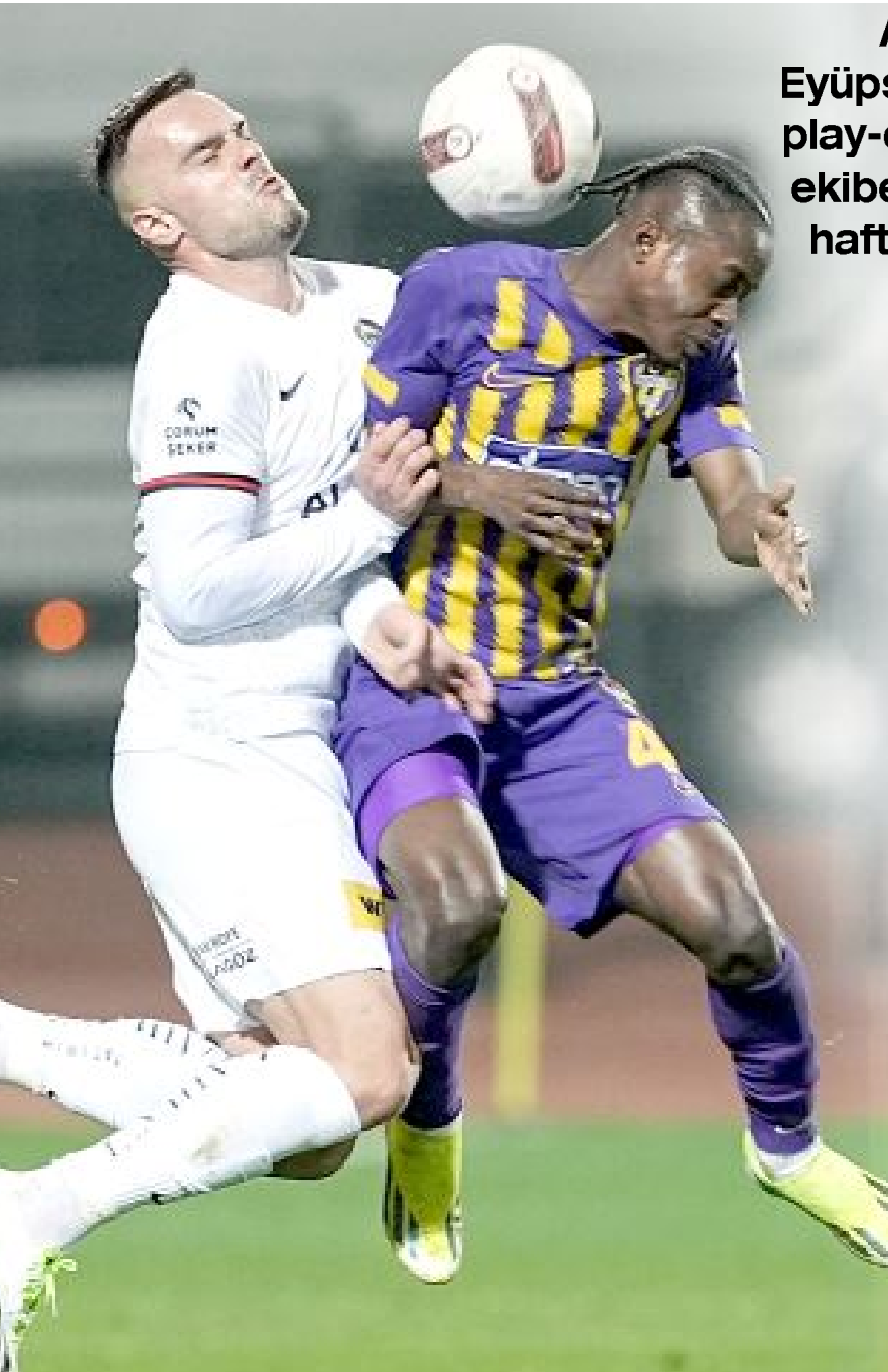
Ahlatcı Çorum FK, Eyüpspor karşısında da çok iyi savunma yaptı.

Ahlatcı Çorum FK, ligin açık ara lideri Eyüpspor'u, hem de deplasmanda 1-0 yenerek play-off umutlarını iyice yeşertti. Kırmızı-siyahlı ekibe galibiyeti getiren golü 49.dakikada, son haftaların en formda oyuncusu Geraldo attı.